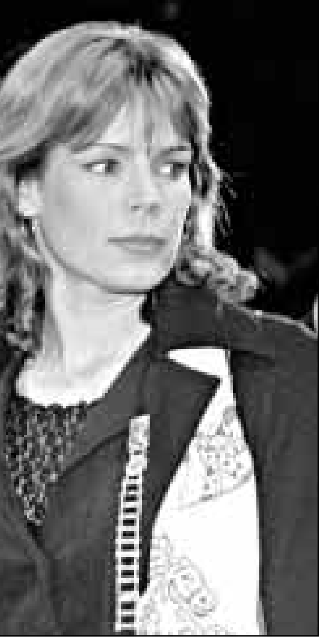
الاميرة ستيفانيا ابنة امير موناكو حضرت مهرجان السيرك في مونت كارلو

وقد استقبله الشيخ عيسى بن سلمان آل خليفة امير البحرين وعديد من المسؤولين هناك.