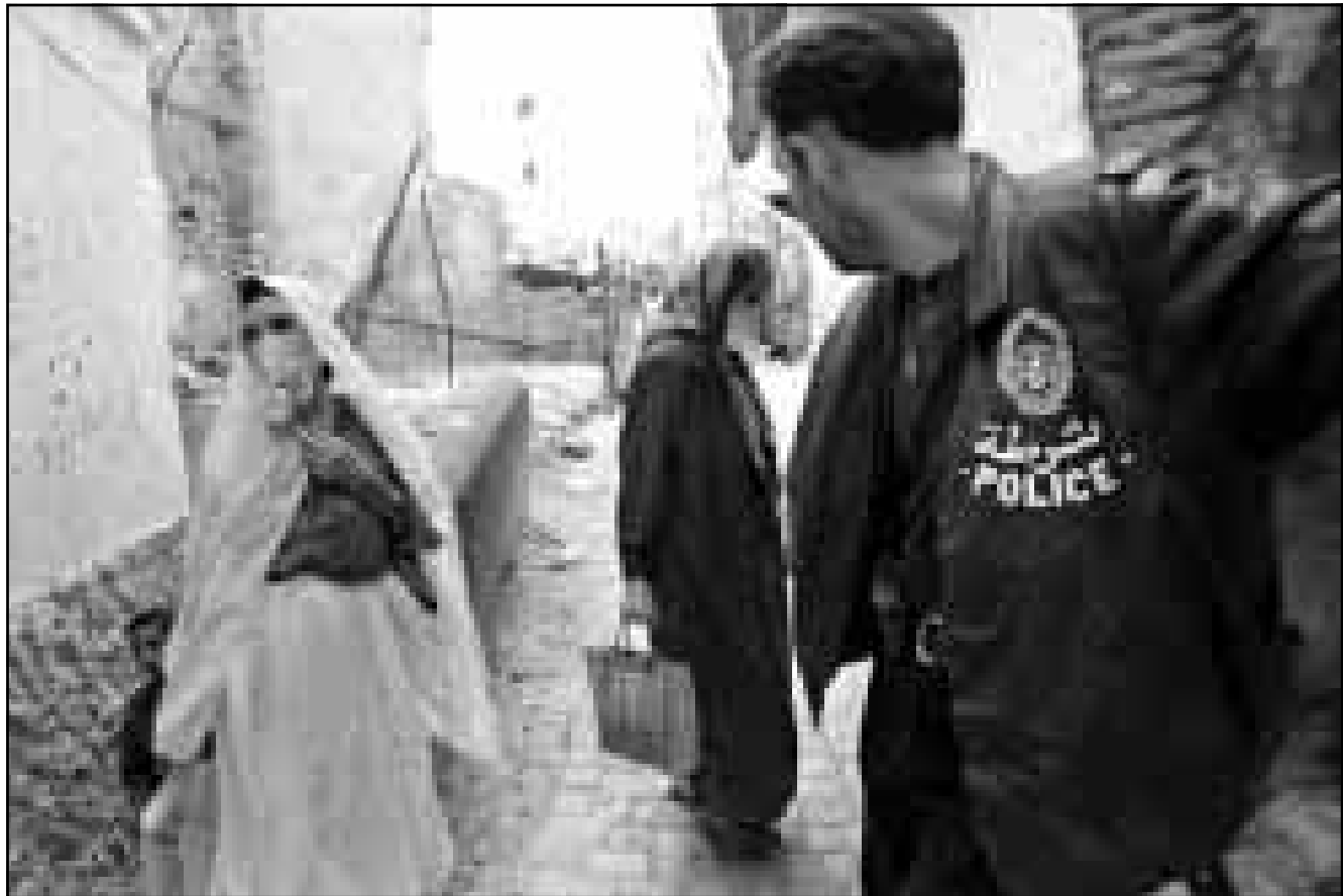
نساء جزائريات يعشن منذ شهر على وقع اخبار المذابح المنكوبة (صورة من الاريش)