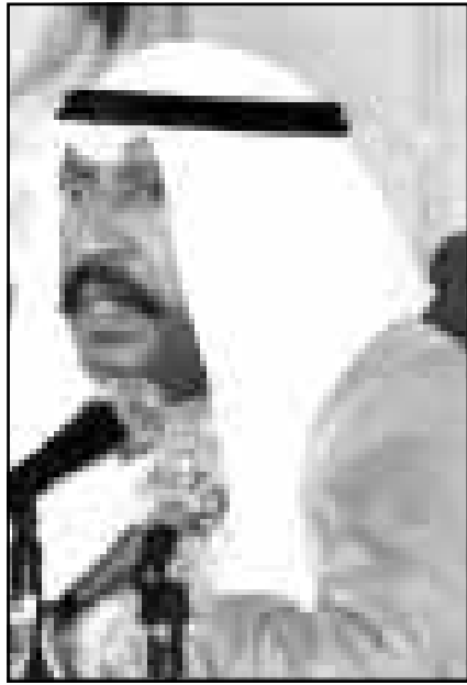
الشيخ سعد العبدالله الصباح

الكويت - القاهرة - لندن - خاص بـ «القدس العربي»: