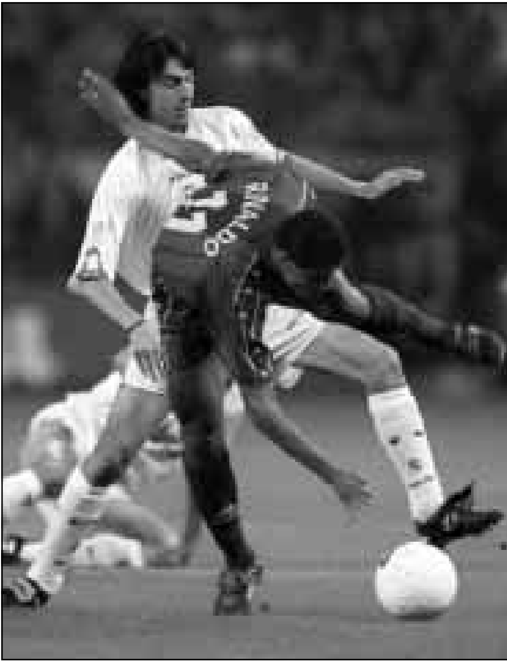
لقطة من احدى مباريات ريال مدريد مع برشلونة

■ مدريد - رويترز: تقام مطلع الاسبوع عشر مباريات ضمن دوري الدرجة الاولى الاسباني لكرة القدم منها لقاء التليتيكو بيلباو الذي يحتل المركز الخامس على قائمة الدوري السبت مع سالامانكا الذي يحتل المركز 15 على قائمة الدوري. ولم يحصل سالامانكا سوى على نقطة واحدة من اخر عشر مباريات لعبها ضمن بطولة الدوري على ارض التليتيكو. لكن يبدو ان التليتيكو سيربح عدة لاعين قبل مباراة يوم الثلاثاء القادم ضمن بطولة كأس اسبانيا مع مايوركا كما انه خسر الاسبوع الماضي 3/صفر امام التليتيكو مدريد. ويلعب السبت ايضا اوفيسو الذي يحتل المركز 12 على قائمة الدوري مع ريال بيتيس الذي يحتل المركز الثامن. ويلتقي الاحد كوموستيلا الذي يحتل المركز 19 على قائمة الدوري مع ريال سرقسطة الذي يحتل المركز العاشر - وميريدا الذي يحتل المركز 17 مع اسبانيول الذي يحتل المركز السابع. ويلعب بلد الوليد الذي يحتل المركز 18 على قائمة الدوري الاحد مع ريال سوسيداد الذي يحتل المركز الثالث. وقاز بلد الوليد في اربع مباريات متتالية على ارضه ويبدو انه سيواصل انتصاره امام فريق ريال سوسيداد الذي يتعاد ست مرات في اخر عشر مباريات لعبها خارج ارضه. وتعاقي هاتان ميلت ولورين جواريس من الاسبانية وسيلعبها على الارجح ضمن