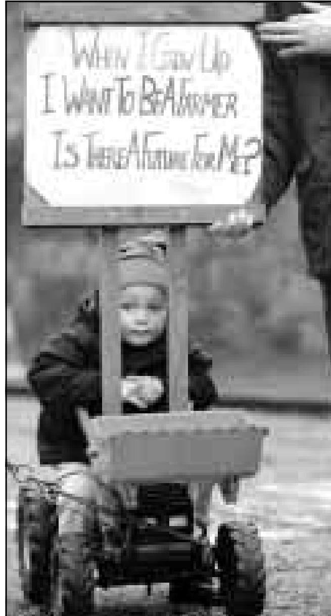
طل مزارع اسكتلندي من الذين شاركوا في مسيرة بمدينة اندرره الجمعة احتجاجا على تجاهل الحكومة البريطانية للمشاكل التي يواجهونها وخاصة آثار مرض جنون البقر