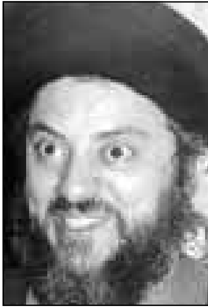
محمد باقر الحكيم