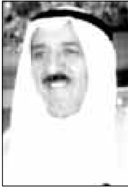
الشيخ صباح الاحمد الصباح