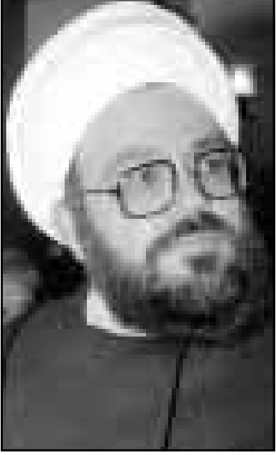
الشيخ صبحي الطفيلي

وبعدما يسوناق قائل بلز على الساحة كزعيم للحزب الله الذي يحارب جناحه العسكري قوات الاحتلال الاسرائيلية في جنوب لبنان، والسؤال الان اي اى مدى يمكن ان يذهب من اجل المنكس بالسلطة. وقال مصدر املح «الطفيلي قادر على حشد قاطعات مؤثرة في القضاء، وحزب الله الذي ير بشكل يوجي بثوته». وأضاف «هذا امر خطير للغاية، البعض يشكك في الوضع القائم داخل الطائفة الشيعية».