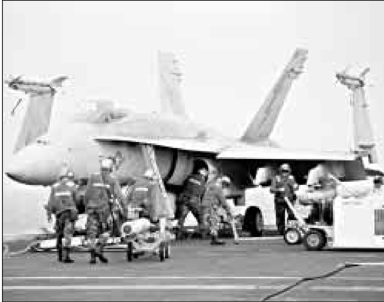
جنود امريكيون يجهزون طائرة حربية بصواريخ فوم حاملة الطائرات «جورج واشنطن»

وقالت وكالة الأنباء العراقية ان المبعوث الروسي سلم صدام رسالة من الرئيس الروسي بورييس يلتسين بشأن ما قالت الوكالة انه الازمة التي اختلقها الولايات المتحدة ولجنة الاسلحة التابعة للامم المتحدة.