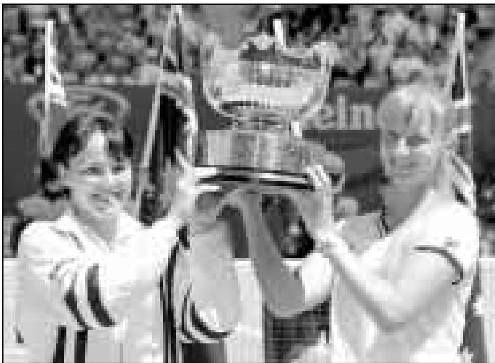
مارتين هينغيس ومرجانا لوسيك يحملان كأس الزوجي

■ مليون - رويترز: صعد التشيلي مارسيلو ريوس المصنف الثامن على العالم الى نهائي بطولة استراليا المفتوحة للتنس بعد تغلبه على الفرنسي نيكولاس بيغول. وهدد في مباراة استغرقت 83 دقيقة... والجائزة الكبرى. ويلتقي ريوس في الدور النهائي الاحد مع التشيكي بيتر كورا. وفي نهائي منافسات زوجي السيدات فاز الزوجي الذي يضم السويسرية مارتينا هينغيس والكرواتية مارتينا لونكيتش الجمعة على الزوجي الذي يضم الامريكانيه ليزا دافنبورت وابوع روسيا البيضاء ناتاشا زيريفا 6/ 6 و 2/ 6 و 3/ 6.