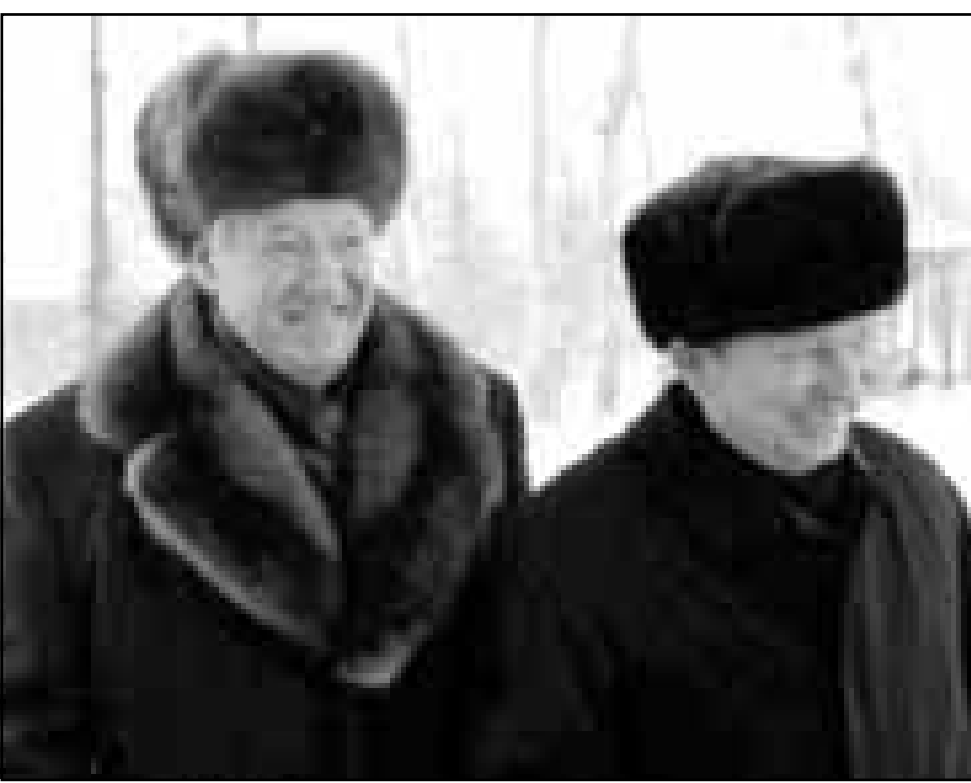
الرئيس الروسي بوريس يلتسين لدى استقباله امس نظيره الاوكراني ليونيد كوشنما قرب موسكو