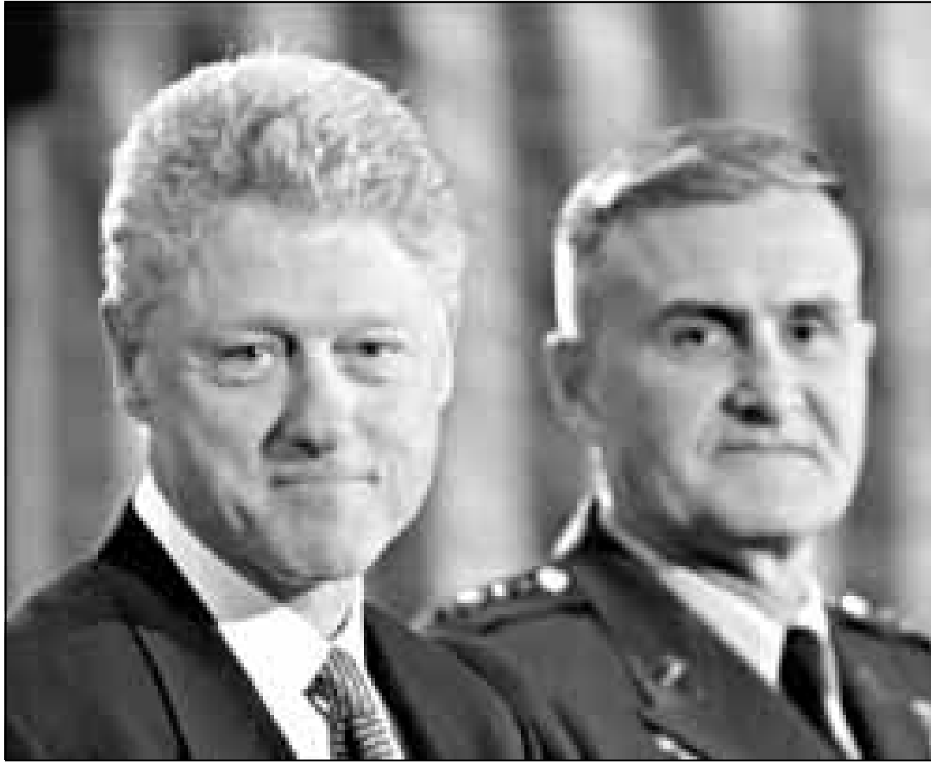
الرئيس الامريكي بيل كلينتون والى جانبه رئيس الاركنا هنري شيلتون اثناء حديث له امام قادة عسكريين

واومأ لئنا، بالواقعة. وقال محلل خليجي يتبعين للاستطلاع المحلي ان بنظر اليهم وكان الامريكيين فرضوا الامر عليهم». لكن المقر ان تزور الخليج العربي التي توقفت في باريس الخميس للاجتماع مع نظيرها الفرنسي وبيدات الجمعة اجتماعا مع نظيرها الروسي في مدريد. المملكة العربية السعودية والكويت ومقر قيادة الاسطول الخامس الامريكي في الخليج. وحشدت الولايات المتحدة ترسانة عسكرية كبيرة تشمل حاملتي طائرات وقوة جوية كبيرة لهزيمة العراق دون ان