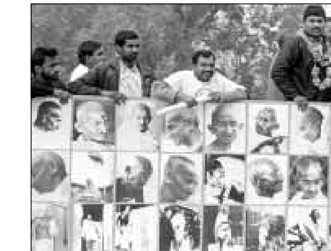
مواطنون هنود يشاركون في احياء الذكرى الخمسين لاقتبال المهاتما غاندي (رويترز)

بكين - ف ب - ذكرت وكالة الانباء الصينية الرسمية شينخوا الجمعة ان 77 شخصا قتلوا وجرح ثمانية آخرون في انفجار وقع داخل احد المناجم في شمال شرقي الصين. وقالت الوكالة نقلا عن وزارة المناجم ان الانفجار وقع في منجم وانجياجينغ الذي تملكه الدولة في مقاطعة لياونينغ في الرابع والعشرين من كانون الثاني (يناير) لكن لم يعلن عنه الا الجمعة، وأشارت الى ان احد الجرحى في حال ميؤوس منها. وقد وقع الانفجار في نفق جديد يبلغ طوله 300 متر لم يبدأ استنقاره بعد وذلك خلال اعمال التجهيز وفق ما اوضح مدير المنجم. وأشار المصدر نفسه الى ان 30 عمالا على الاكثر يشتغلون عادة داخل النفق في وقت واحد. وكان العمل في هذا المنجم بدأ عام 1987 وهو ينتج مليون طن من الفحم سنويا. واستنادا الى احصاءات وزارة العمل الصينية فان 6304 أشخاص قتلوا واصيب 4500 جروح خلال الاشهر الثمانية الاولى من عام 1997 في انفجارات مماثلة، في حين قتل 9974 عامنا منجم في العام 1996.