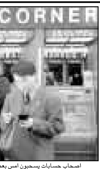
اصحاب حسابات يسبحون اسم بعض النقد من أجهزة الصرف الآلي في وسط العاصمة الكورية الجنوبية سيول