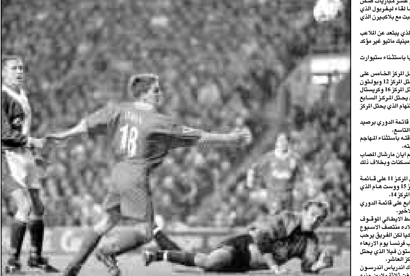
لقطة من احدى مباريات ليفربول