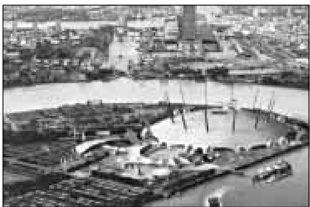
رسم على الكمبيوتر لمنظر القبة المزمع انشاؤها عام 2000

وقال ان محادثات السلام على المسار السوري الاسرائيلي توقفت منذ اوائل عام 1996 ولم تعد اية مفاوضات منذ تسلم رئيس الوزراء الاسرائيلي بنيامين نتنياهو السلطة في اسرائيل في شهر حزيران (يونيو) عام 1996 بسبب رفضه مبداء مقايضة الارض بالسلام وهو المبدأ الذي قامت على اساسه مفاوضات السلام.