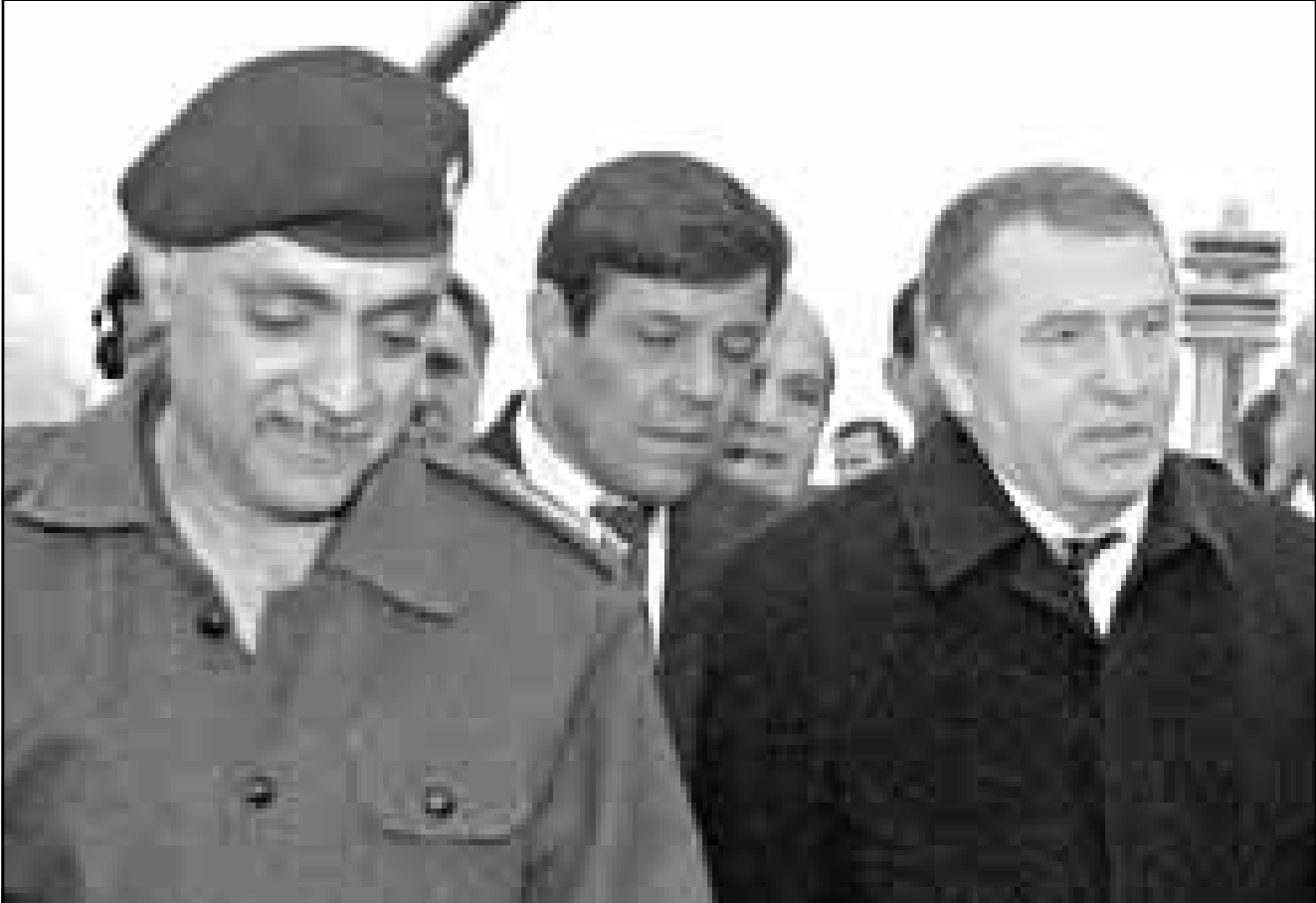
وزير النقل العراقي احمد مرتضى مستقبلا فلابيمير جبرينوفسكي في بغداد امس

انقرة - رويترز: قال وزير تركي في تصريحات نشرت امس الاربعاء بان تركيا اتخذت الاجراءات اللازمة لاستقبال 100 الف لاجيء عراقي تخشى تدفقهم صوب حدودها خلال الازمة القائمة بين بغداد وواشنطن. غير ان مسؤولا عسكريا كبيريا نفى وجود مثل هذه الخطه. وقال وزير الدولة صالح يلديم ان التعامل مع اللاجئين المتوقع تدفقهم سيتم في منطقة انبئية تعكف القوات التركية على انشائها داخل شمال العراق الذي يغلب الاكراد على سكانه. واضاف «تتخذ الترتيبات لاستقبال 100 الف شخص في الحزام الامني الذي يسقام على عمق 15 كيلومترا داخل العراق اعاد الخيام والبيداء والمواد الطبية». وقال المتحدث العسكري الكولونيل حسني داغ في تصريح صحافي ان تركيا لا تعتزم انشاء منطقة عازلة. واضاف «لا تعتزم تركيا انشاء منطقة عازلة في شمال العراق ضد اي عمليات نزوح متعلقة بالازمة بين الولايات المتحدة والعراق».