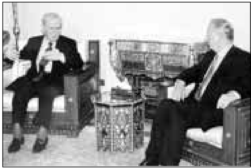
الرئيس السوري حافظ الاسد لدى استقباله لرئيس المفوضية الأوروبية امس في دمشق

وحفظ خاتمي عن التطرق الى الولايات المتحدة متكتفيا بادانة هجوم امريكي محتمل ضد العراق (1988-1988).