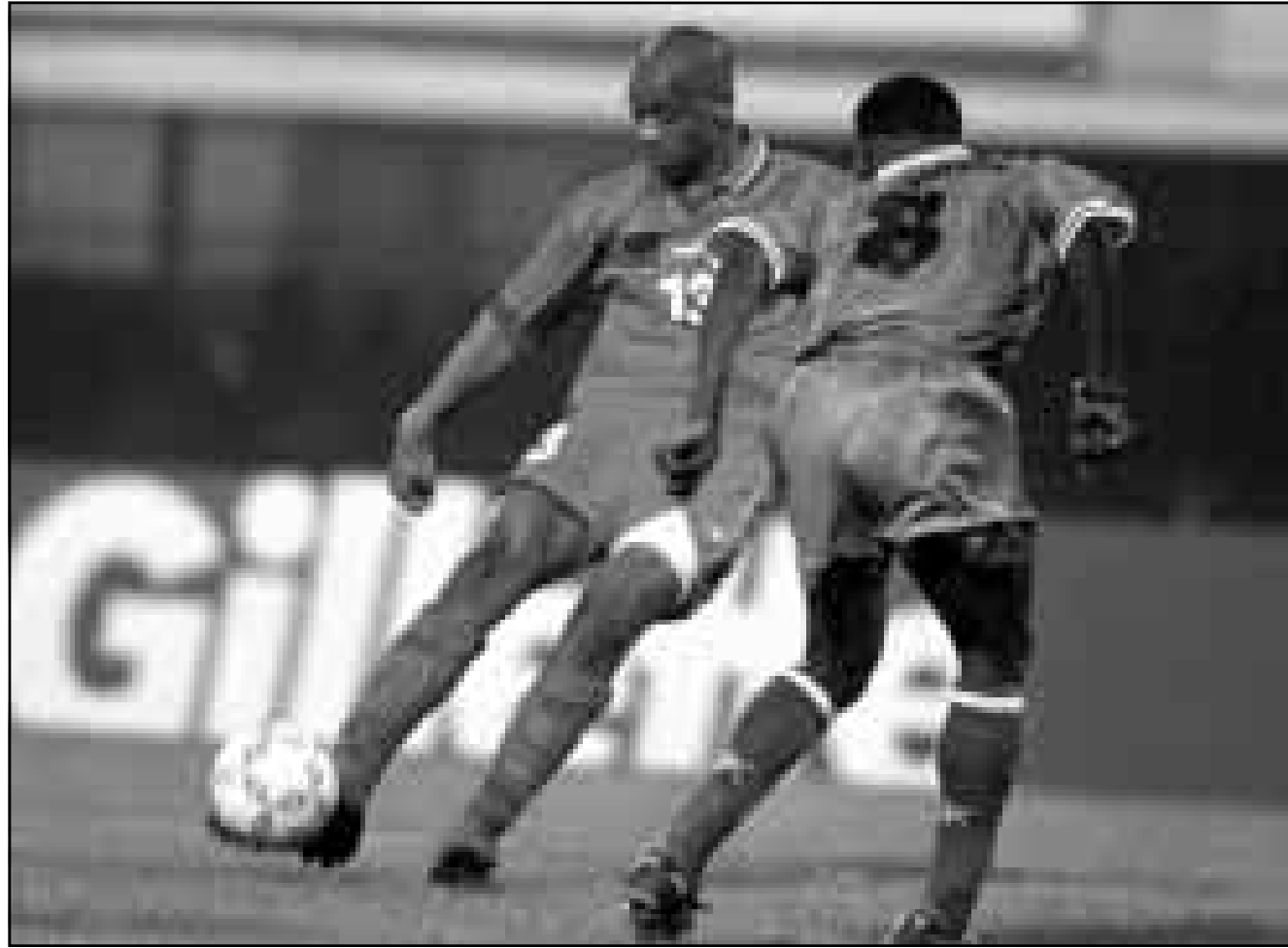
لقطة من مباراة المغرب وزامبيا