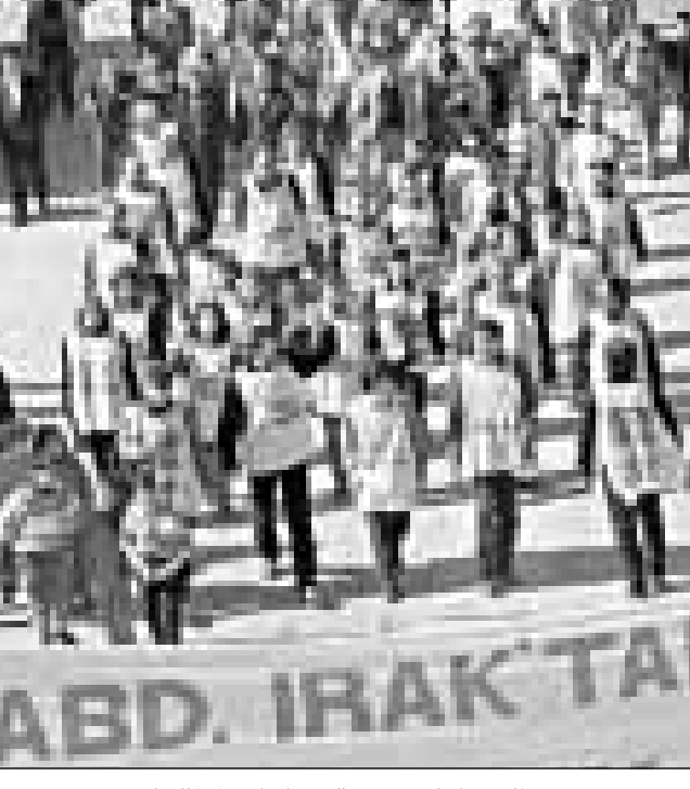
مظاهرات اترك يندون بالتهديدات الامريكية للعراق

دخل السباق بين الجهود الدبلوماسية لحل الازمة العراقية والتصعيد الامريكي باتجاه توجيه ضربة مرحلته الاخيرة امس باعلان واشنطن انها ستستكون مستعدة لنش الهجوم خلال اسبوع. وتزامن الانذار الذي اطلقه الجنرال انطوني زيني قائد القوات الامريكية في الخليج مع اعلان بغداد عن قبولها مبادرة روسية تقضي بفتح جميع المواقع الرئيسية «وعدها ثمانية» للتفتيش، على ان يقوم سكرتير عام الامم المتحدة كوفي امان بتشكيل لجنة خاصة تتمثل فيها الدول الخمس الدائمة مجلس الامن لزيارة تلك المواقع وتقديم تقرير عنها الى المجلس.