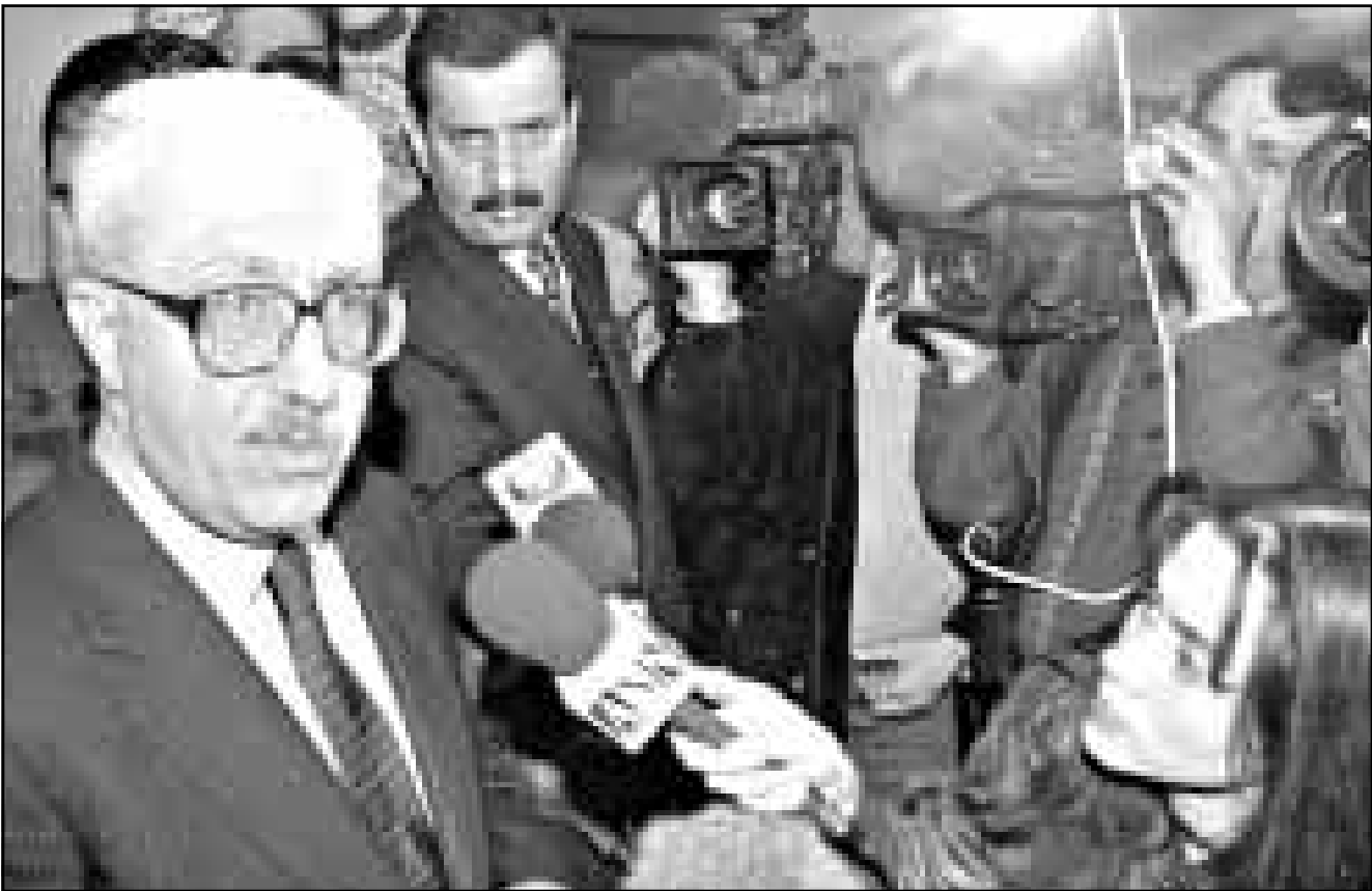
نائب رئيس الوزراء العراقي طارق عزيز يتحدث للصحافيين امس