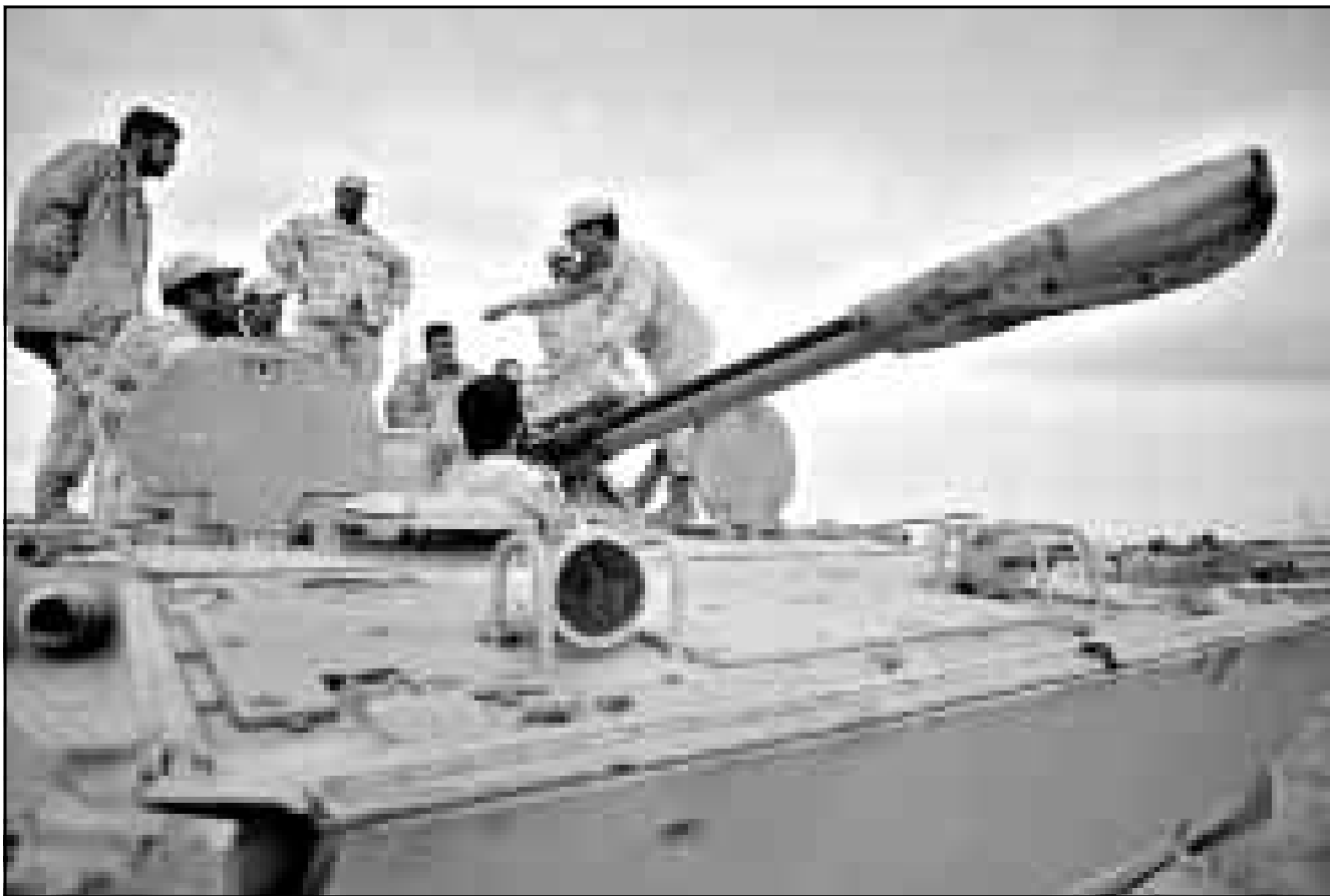
ضابط امريكي يدرب جنودا كويتيين فوق مدرعة قرب الحدود العراقية