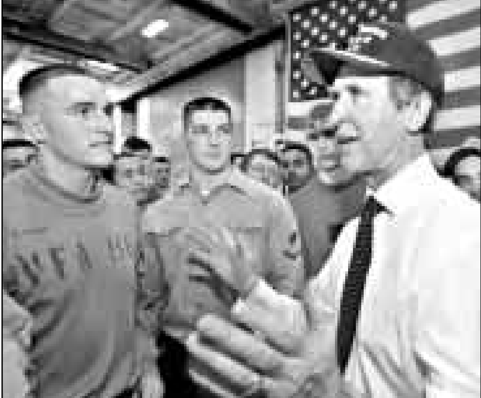
وليام كوهين فوق حاملة الطائرات جورج واشنطن

ديار بكر (تركيا) - رويترز: قال مسؤولون انيون ان طائرات هليكوبتر تركية قصفت مواقع للمتطرفين الاركار في شمال العراق اللغوم الثنائي على التوالي امس. ■ وقال مسؤول اممي لرويترز «الطائرات قصفت منطقة الخنثة فيما بين الساعة 0300 و500 بتوقيت غرينتش». ■ واصف ان طائرات من طراز اف 16 انطلقت من مدينة ديار بكر التركية وشننت هجمات على مواقع حزب العمال الكردستاني في المنطقة التي تستخدم في الحدود العراقية. ■ وعاترضت هذه التقارير مع نفى تركيا ان يكون جيشها نشطا في شمال العراق الذي يسيطر عليه الاركار منذ حرب الخليج عام 1991.