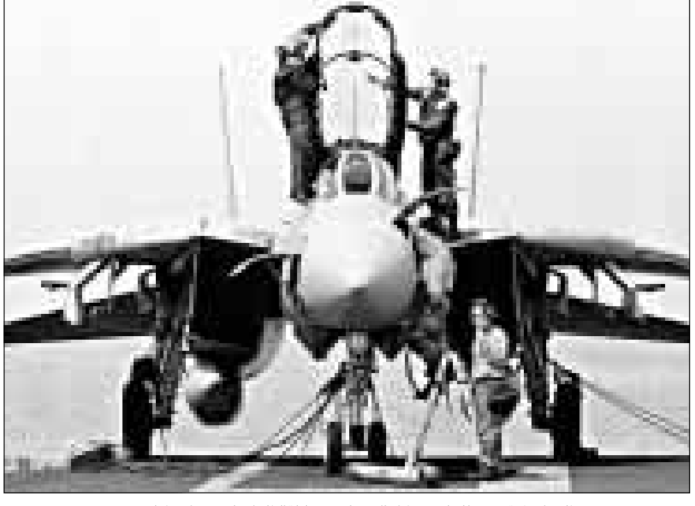
طائرة امريكية تستعد للاقلاع من طراز (ف 18) فوق حاملة الطائرات (جورج واشنطن) وريتزر

وقال عزيز ان تفتيش المواقع الرئيسية مهمة بالغة الاهمية، وانها تتطلب لجنة أعلى من مجرد خبراء لتفنيدها. وعزيز او العراق لا يعززم مهاجمة اسرائيل او الكويت في حال تعرضه لضربة عسكرية امريكية. وفي محاولة اجرتها معه شبكة التلفزيون الامريكية «سي.ان.ان» قال عزيز «ليست لدينا اي خطة ولا نعتزم قط مهاجمة أي بلد باستثناء المعتدي، والمعتدي وحده داخل ارضنا». وكان عزيز يريد على سؤال عن احتمال شن هجوم عسكري ايراني على الكويت او اسرائيل في حال وجهت الولايات المتحدة ضربات عسكرية الى العراق. وكان الجنرال انطوني زيني قد قال في ختام جولة قام بها وزير الدفاع الامريكي وليام كوهين على مدى ثلاثة ايام في الخليج «اقول اننا ستون جاهزين للهجوم في اسبوع او نحو ذلك». وكان زيني يتحدث في الصحافيين على متن الطائرة التي اقلته هو وكوهين من قطر الى البحرين حيث استقلا طائرة هليكوبتر التي حاملة الطائرات جورج واشنطن التي تعمل بالطاقة النووية. والبحرين مقر قيادة الاسطول الخامس الامريكي في الخليج هي المحطة الاخيرة لجولة كوهين في دول مجلس التعاون الخليجي الست التي تهدف للحصول على تأييد تلك الدول لهجوم عسكري امريكي مستحل على العراق. وفي القاهرة حذر الرئيس المصري حسني مبارك من وقوع «مجزرة» اذا لم ينفذ العراق قرارات مجلس الامن فيما يتعلق باعمال التفتيش عن اسلحة الدمار الشامل.