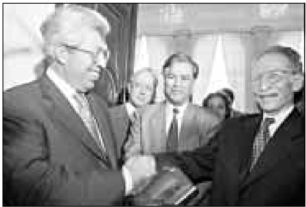
رئيس الوفد البرلماني الأوروبي أندريه سولبييه اثناء لقائه امس مع رئيس مجلس الامة الجزائري البشير بوعزة

وأشارت صحيفة «الخبر» ان اسلاميين مسلحين قتلوا الأحد قرب بن طلحة في الضاحية الجنوبية لشرق الجزائر، كما قتل احد مجاهدين حرب الاستقلال بالرصاص امس قرب منزله في شرق الجزائر بحسب الصحيفة ذاتها التي ذكرت ان احد الجرحى الذين سقطوا في الانفجارات الذي وقع الاثنين في باتنة (شرق) توفي متأثرا بجراحه، وقالت الاجهزة امنية ان الاعتداء اوقع 37 جرحا، وتكرت «التيوبون» ان قوات الامن عثرت الثلاثاء في تلمسان (غرب) على جثة رجل قتل بالاسلحة الابيض، وتكرت الاجهزة الامنية ان قتيلا انفجر السبت في مبنى في اليبودة (50 كلم جنوب الجزائر) واخرى في مظهر في المسالة (20 كلم غرب الجزائر) مما اوقع خمسة قتل و12 جرحا. من جهة اخرى وجهت الحكومة الجزائرية امس تحذيرا الى جبهة القوى الاشتراكية التي تنوي تنظيم تظاهرة