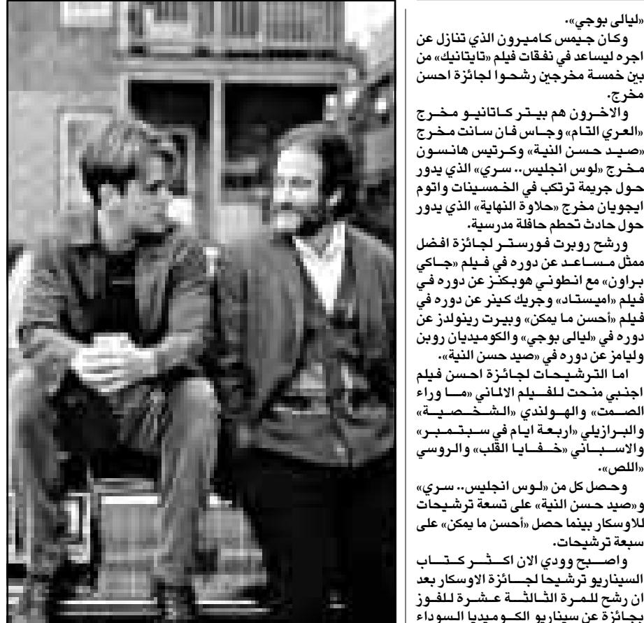
رون ويليامز ومات ديمون في لقطة من فيلم «صيد حسن النية»