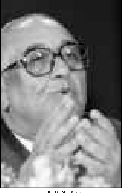
عبد السلام المجالي

يكون سريعاً خلافاً للتوقعات، فبعض الاجتهادات ترى ان القصر لن يجازف في ظل عدم وجود رؤية واضحة لما سيجري في العراق قريباً بتوتريت اى حكومة جديدة بالتعامل مع استحقاقات استيعاب الساحة المحلية لتنتج الحرب مع العراق، الامر الذي يعني ان التغيير الوزاري قد تأجل لاسباع قليلة تتضح فيها الامور على الوجه العراقي ويجري استيعابها محلياً. ويبدو ان الحكومة التي ستتصدى داخلها في عمان لوضع الحرب في العراق ستضطر لاستخدام اساليب القوة في قمع ومنع القوى السياسية المؤيدة للعراق من التضامن معه، وستحول دون حركة جماهيرية من اى الاون كس اى لا تعترف بالاعتناق من خلال الهياكل خارج الطوائف اليهودية مثل اليهود المحافظين او الاصلحيين، وقد ظل هذا الاعتراف الاصلحي داخل اسرائيل في صالحية الحاخامية العتقد للتناضية من صلاحية الحاخامية الأرثوذكسية وحكما عليها لا سيما في مسائل الهوية اليهودي، والاحوال الاجتماعية مثل الزواج والطلاق والدفن.