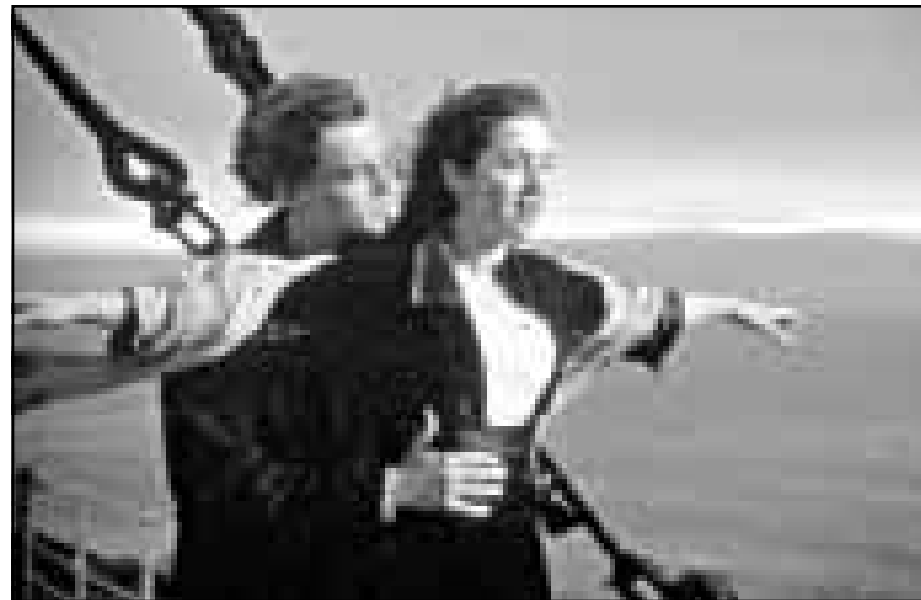
كيت وينسلت وليوناردو دي كاريو في لقطة من فيلم «تايتانيك»

ورشحت معها كيم باسنجر عن دورها في فيلم «لوس انجليس.. سري» وجوان كوساك عن دورها في «بالداخل والخارج» وميتي درايفر عن دورها في فيلم «صيد حسن النية» وجوليان مور عن دورها في