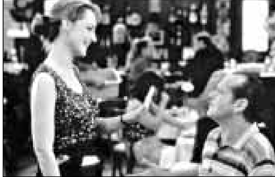
جاك نيكلسون وهيلين هنت في لقطة من فيلم «احسن ما يمكن»