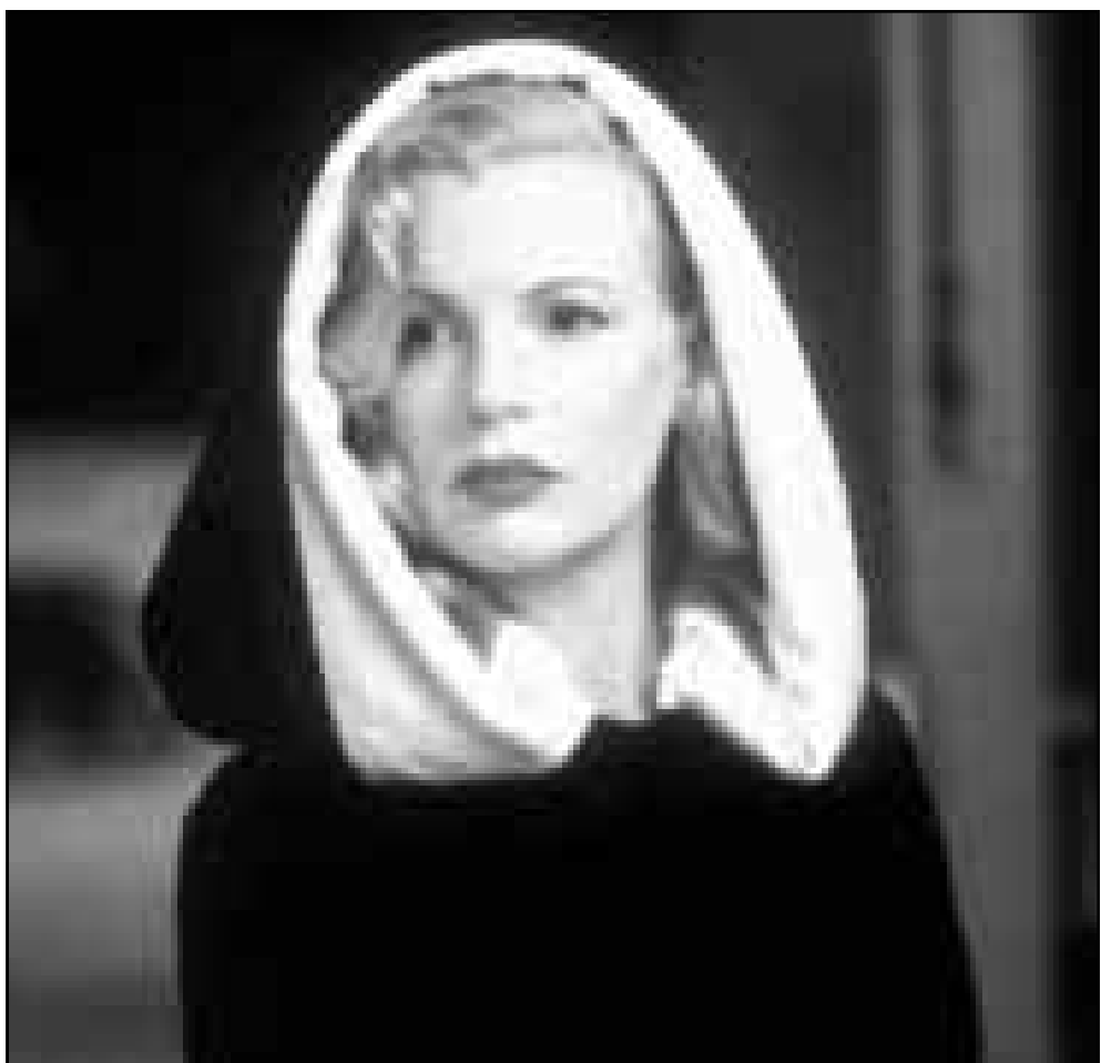
كيم كاسبجر مرشحة لاسكار احسن ممثلة مساعدة

وتقدر وكالات اغاثة اجمالي عدد القتلى بما يصل الى 4200 شخص وتقول ان الشرفيين بالالاف، ودفن الالاق في مقابر جماعية. وقال بعد المنطقة وسوء الاحوال الصحية عمليات الاغاثة كما عرفها الصراع الدائر بين ميليشيا طالبان الاسلامية والجماعات المعارضة التي تسيطر على منطقة رستق. وقال غارل ثورغرسن عضو الاتحاد الدولي للصليب الاحمر والهلال الاحمر «اذا كان الطقس هو واتيا استنفك اطنا من العونات جاهزة لدينا». والصحت الزلازل اضراا بالغة بما يصل الى 28 قرية بل وسوت بعضها بالارض.