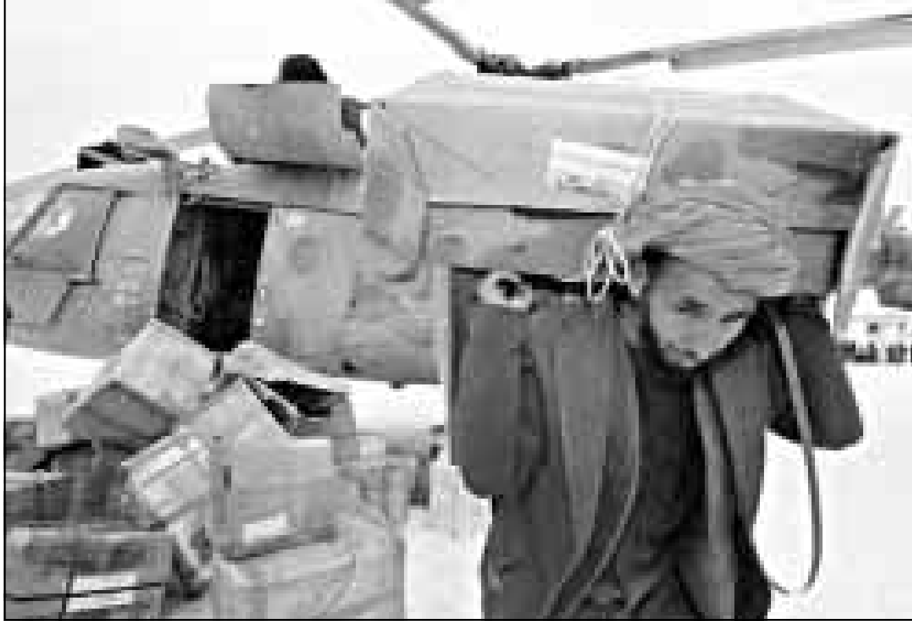
افغاني يفرغ شحنة مساعدات انسانية اسم في رسقع شمالي افغانستان

وتدفقت عائلات بعضها جاء سيرا على الاقدام وسط الثلوج من قراهم الجبلية حيث لقي الالاف من اقاربهم وجيرانهم حتفهم الى منطقة وسط رسقع حيث توزع المساعدات. وتقرر وكالات اغاثة عدد ضحايا زلازل يوم الاربعاء الماضي وزلزال صغير وقع في مستهل الاسبوع بما يصل الى 4200 شخص وقالت ان المتردين بالالاف. وقال يارل ثورجرسن عضو الاتحاد الدولي للصليب الاحمر في رسقع ان اكثر من 4000 ناج من الزلازل لجسوا الى