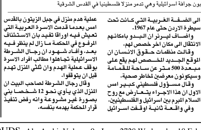
جنود اسرائيليون يراقبون قربان جرافة اسرائيلية وهي تدمر منزلا فلسطينيا في القدس الشرقية

واضاف شهود عيان ان الشرطة الاسرائيلية استخدمت امس الاول الجرافات في اخلاء منطقة خان الامير من الخيام واجلت 35 اسرة تمهيدا لتوسيع مستوطنة معاليه الوديع.