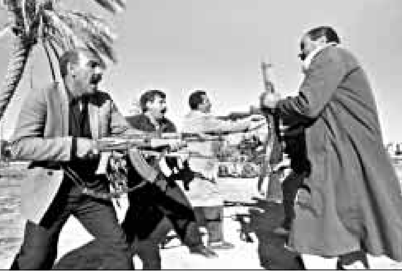
عراقيون يمدون على استخدام اسلحة في بغداد