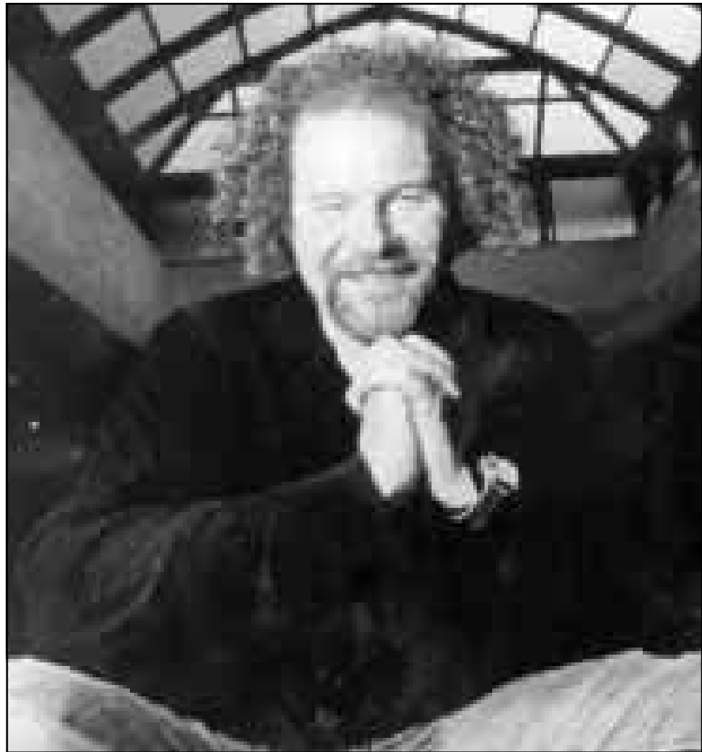
المخرج مايك فيغس