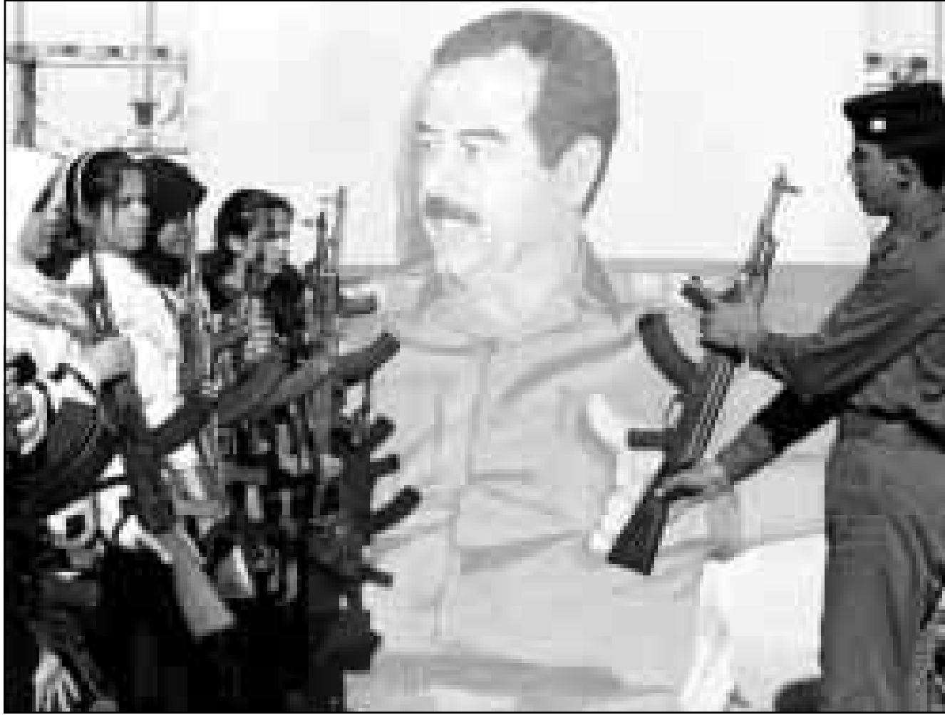
جندي عراقي يشوح لتطوع استخدام اسلحة في بغداد امس (رويترز)

■ واشنطن - اف ب: صرح وزير الدفاع الاميركي وليام كوهين ان الامين العام للامم المتحدة كوفي آنان يفترض ان اذا ما توجه الى بغداد ان ينقل رسالة حازمة تطلب القادة العراقيين بتمكين مفتضي الامم المتحدة من الوصول الى جميع المواقع المتنوعة عليهم. وفي مقابلة مع شبكة تلفزيون «سي ان ان» الامريكسية اوضح كوهين الذي قرر ارسال ثلاثة الاف جندي اضافي الى الكويت ان السبيل الدبلوماسية لحل الازمة سيرت وان الهلة قبل حصول تدخل عسكري ضد العراق باتت تنحصر في بضعة اسابيع. وواضح انه بالنسبة الى الولايات المتحدة فان كوفي آنان حصر في الذهاب الى بغداد، لكنني امل في ان يتوجه الى هناك باقتراح وحيد: امر صدام حسين باحترام قرارات الامم المتحدة كلياً. واعلن كوهين ايضا انه وقع امس «امرا بإرسال ما بين خمسة الاف وستة الاف جندي الى منطقة الكويت» مما يرفع عدد الجنود الاميركيين في هذا البلد الى حوالي عشرة الاف رجل. و اضاف ان «الامر يتعلق بوحدات