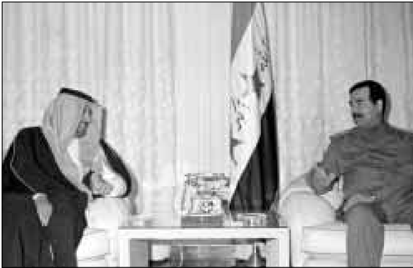
الرئيس العراقي صدام حسين مستقبلاً وزير الخارجية القطري في بغداد امس