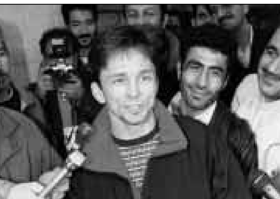
المصارعون الأمريكيون يتحدثون الى الصحفيين لدى وصولهم الى طهران أمس

وتوثر العلاقات بين السعودية وإيران منذ قيام الثورة الإسلامية في إيران عام 1979 التي اطاحت بحكم الشاه، وولم تفتح العلاقات الدبلوماسية بين البلدين من 1988 وحتى عام 1991 حين قتل أكثر من 400 حاج معظمهم إيرانيون خلال اضطرابات وقعت في مكة أثناء موسم حج عام 1988.