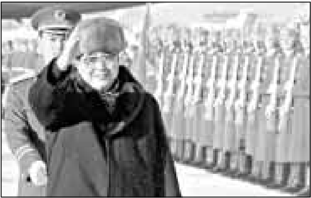
رئيس الوزراء الصيني لي بينغ يستعرض حرس الشرف الروسي لدى وصوله امس الى مطار موسكو

■ موسكو- اف ب: رأى الرئيس الروسي بوريس يلتسن في رسالته السنوية الى البرلمان التي نقلتها وكالة «ايتارا-تاس» امس الثلاثاء ان امام مجلس النواب الروسي مهمة عاجلة هي المصادقة على الاتفاقية الأمريكية الروسية لخفض ترسانة الاسلحة النووية «ستارت-2». وقال يلتسن في رسالته ان «المهمة العاجلة هي المصادقة على اتفاقية ستارت-2». وأضاف ان الاتفاق الذي تم التوصل اليه مؤخرا مع الولايات المتحدة حول ملامعة اتفاقية الحد من الانظمة المضادة للصواريخ «سحمت بالاتفاق مباشرة الى المفاوضات العملية حول المعطيات الاساسية لاتفاقية (ستارت-2)». ويهدف مثل هذا الاتفاق الى توسيع خفض الاسلحة النووية الذي بدأ بافاقتي «ستارت-1» و«ستارت-2». يذكر ان مجلس النواب الروسي لم يصادق حتى الان على اتفاقية «ستارت-2» التي وافق عليها مجلس الشيوخ الامريكى في 26 كانون الثاني (يناير) 1996، وهذا ما يمنع البلدين من مواصلة خفض ترسانتهما.