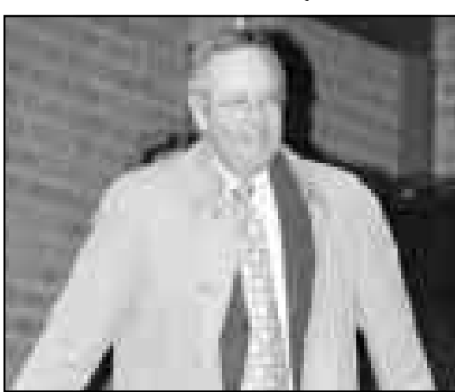
الحق المستقل في قضية وايتوتو كينيث ستار

■ شيكاغو- رويترز: نسب الى المتحدث باسم البيت الابيض مايك مكوري قوله في مقابلة نشرت امس الثلاثاء ان لويسكي قد تكون «قصة معقدة للغاية». وقال مكوري الذي يترأس مكتب مكوري في واشنطن «ربما يكون هناك قصة معقدة للغاية». وقال مكوري الذي يترأس مكتب مكوري في واشنطن «ربما يكون هناك قصة معقدة للغاية». وقال مكوري الذي يترأس مكتب مكوري في واشنطن «ربما يكون هناك قصة معقدة للغاية».