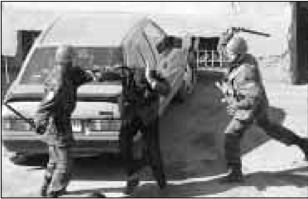
شريطان صربيان ينهالان بالضرب على متظاهر الباني امس باقليم كوسوفو