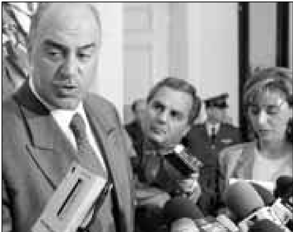
وزير الخارجية اللبناني يتحدث للصحافيين عن موقف بلاده من العرض الاسرائيلي

وتكرت القناة الثانية بالتلفزيون الاسرائيلي امس الاول ان عوزي اراد مستشار رئيس الوزراء الاسرائيلي بنيامين نتياهو لشؤون السياسة الخارجية وداني نافييه امين سر مجلس الوزراء زارا باريس لبحث استئناف محادثات السلام مع سورية. وامتنع نافييه امس الاثنين عن التعليق على الزيارة. ولم يرد على الفور اي تعقيب من لبنان.