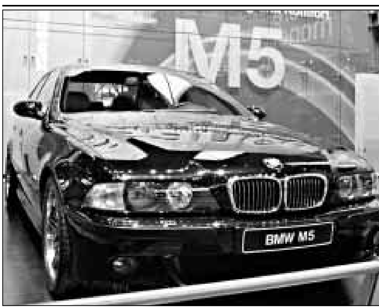
بي ام دبليو الجديدة التي ستعرض رسميا في معرض جنيف الدولي للسيارات الذي يفتتح رسميا في الخامس من الشهر الحالي. وتقول الشركة المنتجة ان هذه السيارة هي الاقوى من نوعها في العالم حيث تبلغ قوة محركها 500 حصان (رويترز)