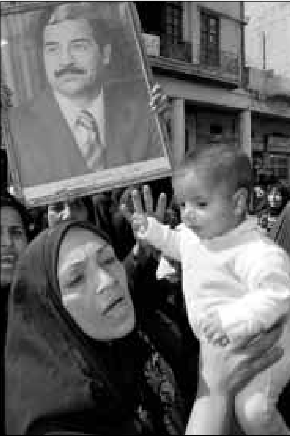
سيدة عراقية تحمل طفلها وتهتف ضد الولايات المتحدة