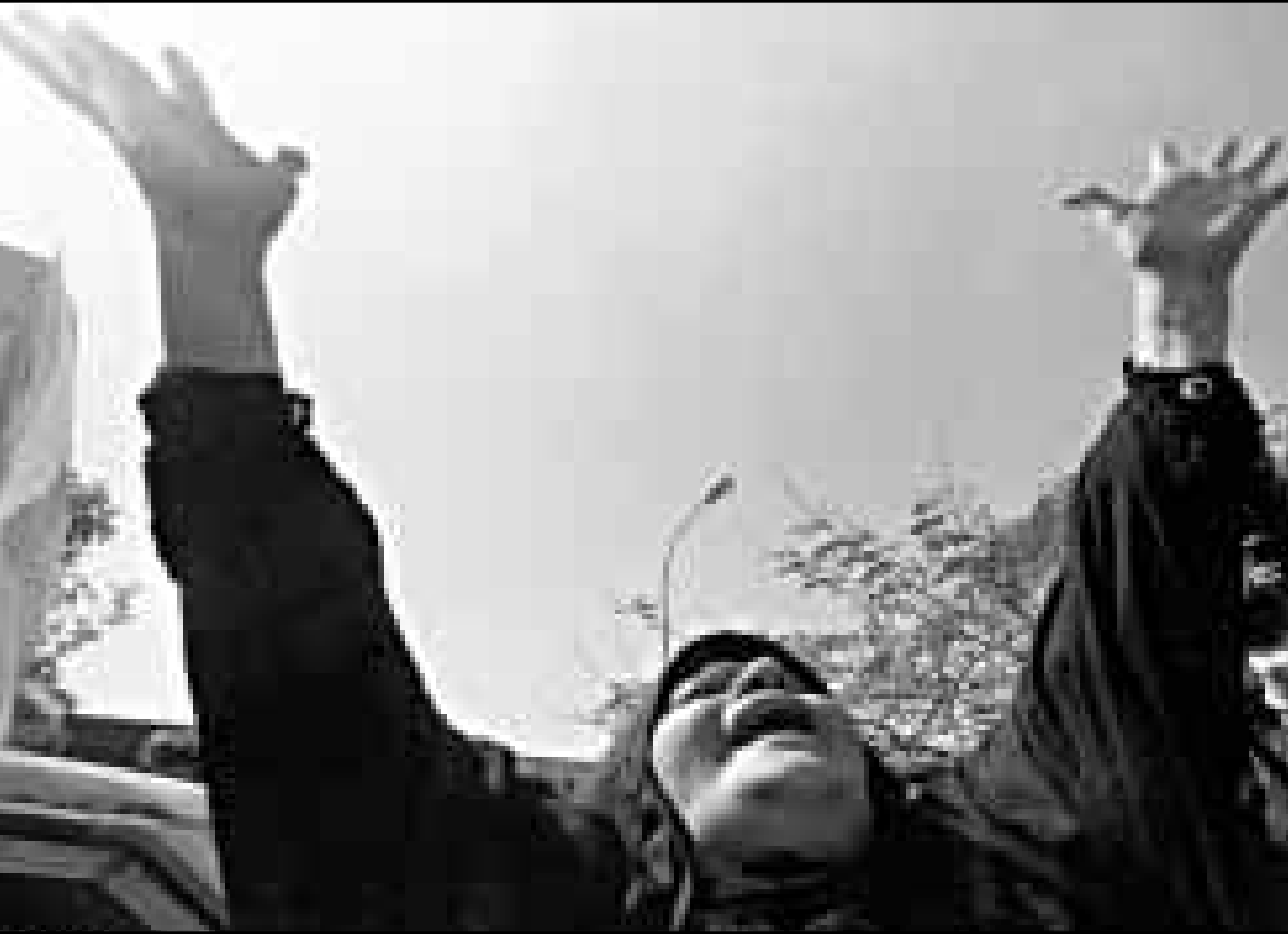
سيدة عراقية تصرخ اثناء تشييع جماعي لاطفال ماتوا بسبب نقص الادوية في بغداد امس