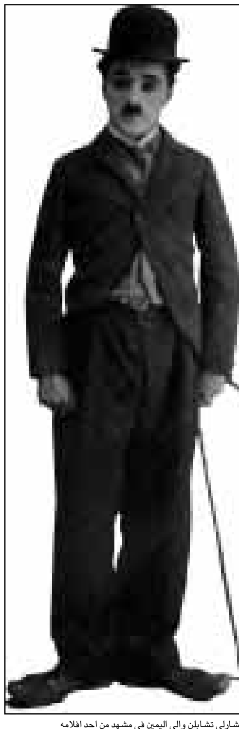
تشارلي تشابلن والى اليمين في مشهد من احد افلامه

ريتشموث - فيرجينيا من جان تشينيسكي: دوتي تأخذ المصعد الى الطابق الرابع لتبشرف عملها في تنظيف المكاتب، وتشغل جهاز الفاكوم وتضفي خمس ساعات في امتصاص الغبار والاسواخ من الغرف والاروقة. دوتي لا تتقاضى فلسا واحدا مقابل العمل الذي تقوم به، ذلك لان دوتي هي روبوت، اي انسان الي. باك وورد، الذي شارك في صنع دوتي، كان يفكر في صنع آلة تنظيف روبوتية منذ اكثر من عشر سنوات، فهو احد مالكي cyberclean systems التي تتسولى تنظيف المكاتب في ريتشموث. يقول وورد: «في العام 1983 حصلنا على عقد تنظيف احد محلات Sears في ريتشموث. ووجدت نفسي في ذلك الملح في الساعة الخامسة صباحا ولم يكن اي الاشخاص العشرة الغروض ان يكونوا هناك قد وصلوا بعد. وبعد الصباح والوعود البعد المكتسة وبدات انظف الاروقة بخدي. ولفت لنفسي «انه لا بد من العثور على طريقة لصنع روبوت يقوم بهذا العمل. انه عمل ورتيني رتيب وعادي، ويذلك فهو عمل مثالي لآلة». والحقيقة ان فكرة وجود خادمة روبوتية تتولى تنظيف المنزل نيابة عن ربة البيت كانت يداعب مخيلات مؤلفي قصص الخيال العلمي والستقيلي منذ مطلع القرن الحالي. الان تصميم وصنع الروبوت الذي يقوم باعمال التنظيف كان اصعب بكثير مما بدا في الوهلة الاولى - فالروبوت يحتاج الي تكنولوجيا العثور على الاتجاهات التي يمكن من الدوران حول المعطشات والزوايا والدوران حول المولات والكراسي. كما ويتوقع منه ان يكون قادرا على مواجهة العقابيل غير المتوقعة، مثل وجود موظف متأخر في مكتبه.