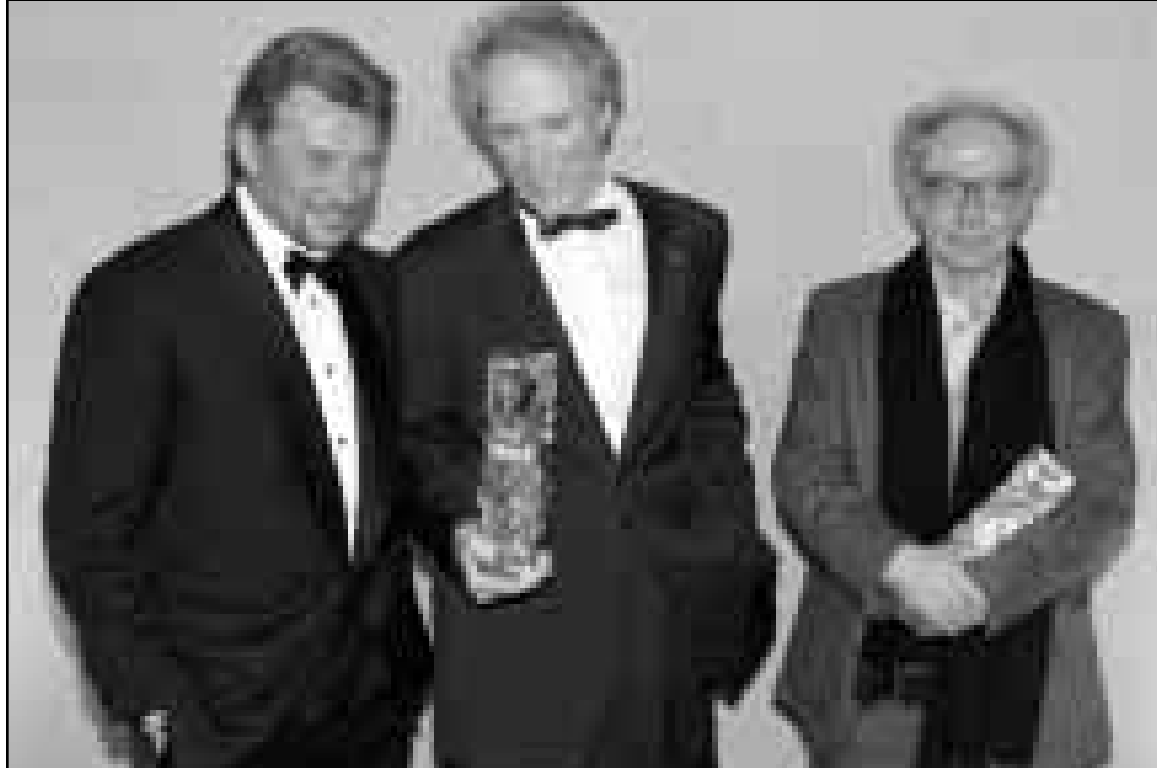
كلينت ايستود يتوسط جان لوك غودار (يمين) والغني الفرنسي جوني هالداي

هي عالم ساحر، وتكلمت أيضاً بآثارة عاطفية كبيرة حين بيركن زوجة الغني الشهير الراحل آلن غينيسرغ وقدمت شكرها إلى الفرنسيين الذين استقبلوها منذ ثلاثين عاماً وقالت «إن عواطفنا والتعبير عنها متقاربة فينتهي إلى أنني أولئك المهاجرين الذين هم نحن والذين دافعوا عنكم، وحبوبكم أكثر مما تحبون أنفسكم».