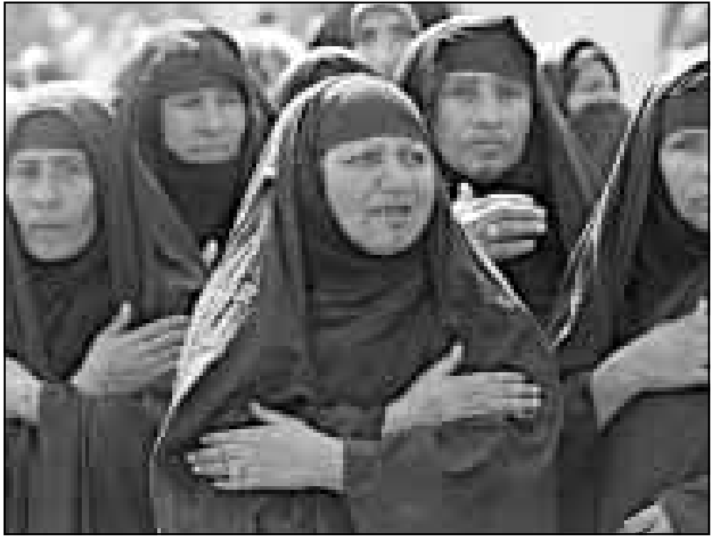
عراقيات اثناء تشييع الاطفال في بغداد امس

وتحتاج أي عملية سرية في العراق إلى مليارات الدولارات، ويشير بيردن إلى أن برنامج السي آي إيه في أفغانستان قد تكلف أكثر من عشرة مليارات دولار خلال