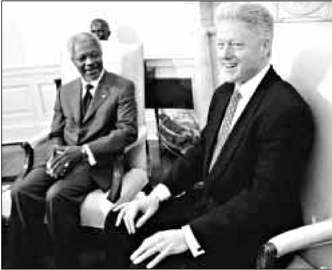
كلينتون مستقبلا انان في المكتب البيضاوي امس

جاء قراره بعد ان رفض كلينتون الموافقة على تعديل قانوني يلغي شرعية الدعم المالي للاجهاض. واعدت وكيل الامين العام كورن ان الامم المتحدة لا تستطيع استعادة صحتها المالية دون تسديد الديون الامريكية وقال ان المبلغ ضخم جدا، وتستثمر الامم المتحدة الاموال من عمليات حفظ السلام، واذا انتهت هذه العمليات فان صندوق الامم المتحدة مرشح للتبؤ. ورغم اشداء انان بموقف حكومة كلينتون تجاه الساعي الدبلوماسية لحل الازمة مع العراق فان واشنطن قد اعترت عدم رضاه عن موقف انان الذي اعتبرته انه اقرب الى الموقف الذي اتخذته فرنسا وروسيا والصين وبعض الدول العربية، واشنطن التي تخشى من ان انان سوف يدعم وفقا لمكبر العقوبات الاقتصادية اصيحت منذ مؤتمر مدريد عام 1991 قضية الامم المتحدة.