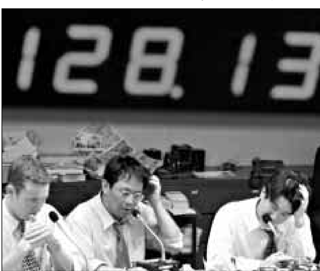
معاملون في سوق العملات في طوكيو حيث ارتفع الدولار أمس إلى فوق مستوى 128 ينا (رويتزر)

18 عاما 256,25 دولارا لواقية بسبب مخاوف بشأن المعروض الروسي من هذا المعدن. وتراجع الذهب إلى 294,45 دولار. واستمرت اسواق الاسهم الأوروبية تهدتي ببورصة وول ستريت حيث سجل مؤشر داو جونز الصناعي مستويات قياسية جديدة لليوم الثاني وول ستريت ساعدت سماسرة لندن على التغلب على ترددهم والاقبال على شراء الاسهم.