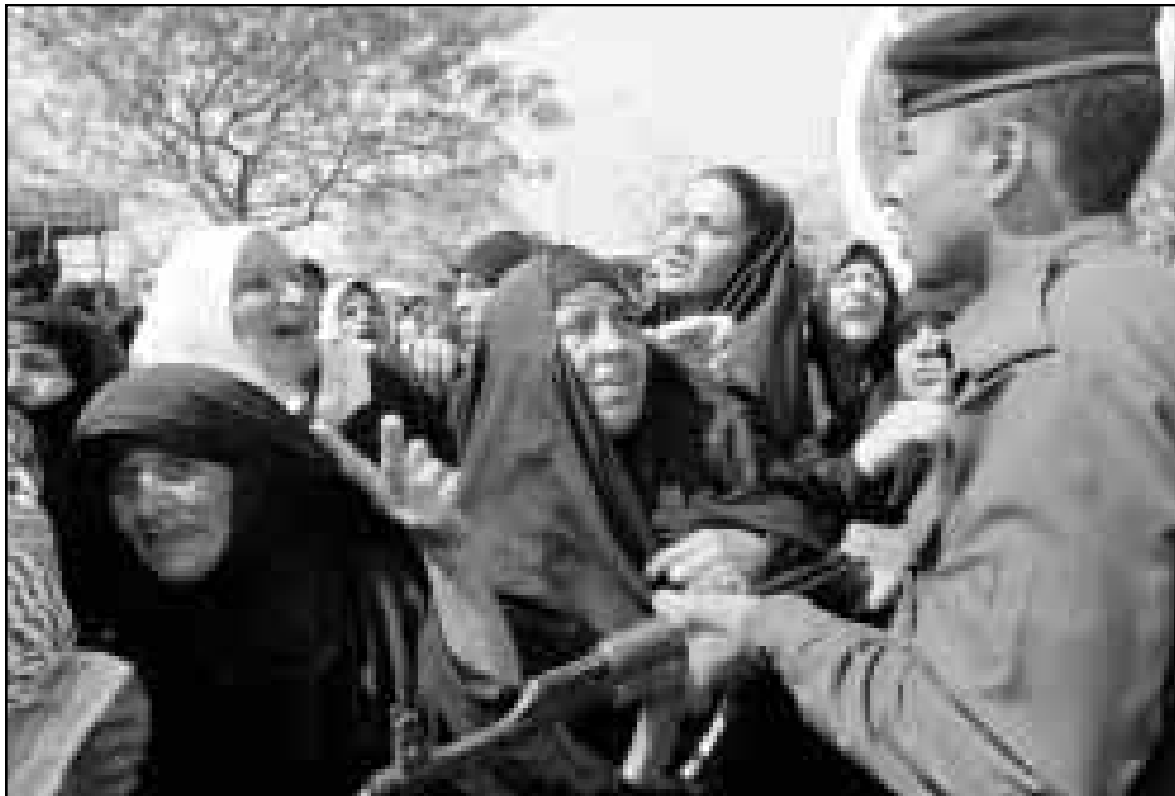
سيدات عراقيات في الجائزة الجماعية في بغداد أمس

وقال ان القانون الجديد معقول جدا وليس من المنطقي الا تقرر مثل هذه المبالغ الصغيرة للصحف والمرسلين والهدف هو مجرد تنظيم نشر الصحف والمجلات.