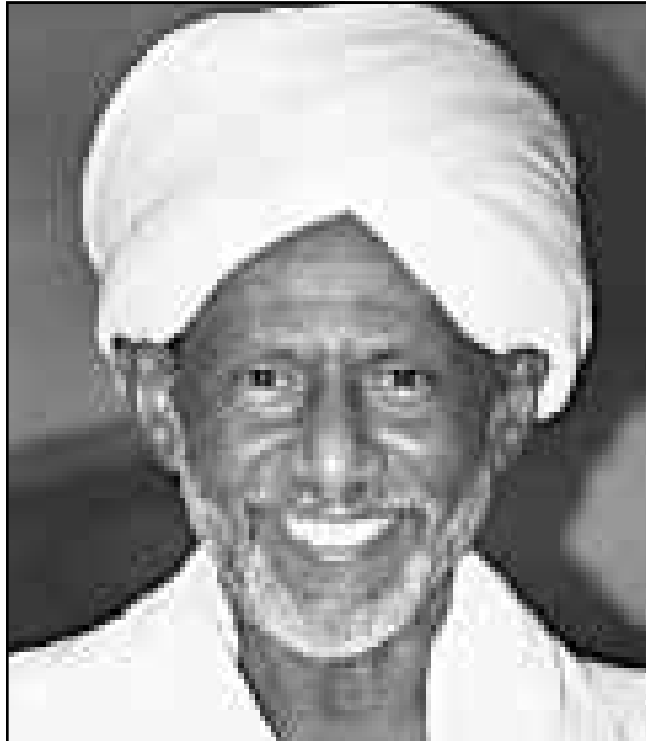
الدكتور حسن الترابي

واعلن الاستاذ احمد ابراهيم الطاهر، وزير العلاقات الاتحادية في تصريحات لصحيفة «الوان»، ان لفظ التوالي الذي ورد في مسودة الدستور يدل على الصيغة الاولى التي اشارت صراحة الى حرية التظيمات السياسية بان الكلمة تصليبية مستوحاة من القرآن، وتحمل معنى التوالي بالقبول والتظيم معا، واكثر شمولية من لفظ التعددية، وأوضح ان قيام التظيمات السياسية مشروط بقانون سيصدر لاحقا، وبند دستوري يشترط ان يقدم التنظيم على الديمقراطية والشورى في انتخاب قيادته وكل اجنذته، وعن قانون الاحزاب، قال الطاهر يحق لأي عضو في المجلس الوطني او اي مواطن له علاقة بعضو في المجلس، ان يقترح غيره قانونا لتنظيم الاحزاب، وان الجهاز التنفيذي شريك في اقتراح القانون، الا ان الوقت لا يزال مبكرا حول