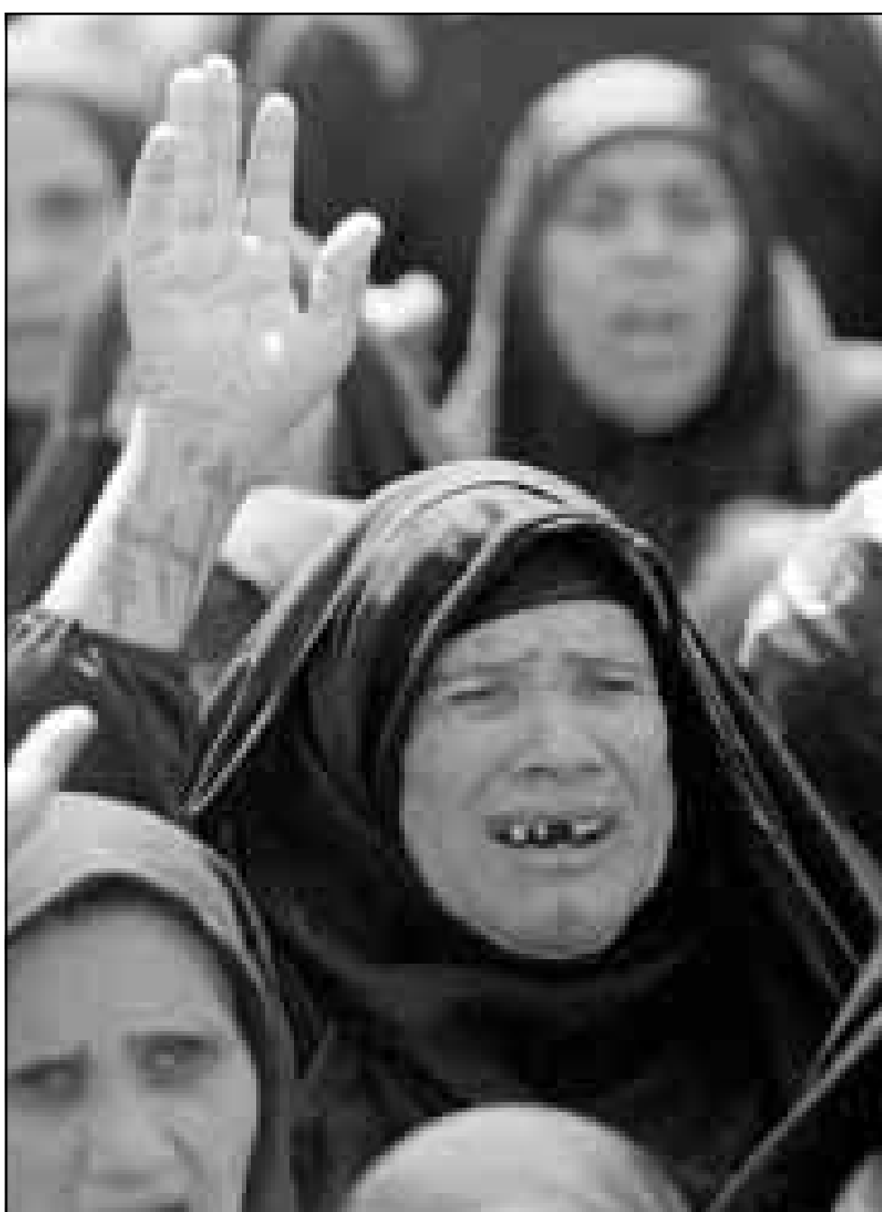
سيدة عراقية في مسيرة ببغداد نددت بالعقوبات