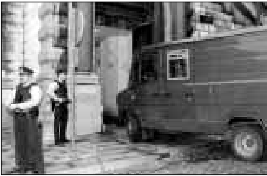
الغربة التي نقلت اسم الى قصر العدالة بيوكسل اشخاصا يشتبه في انتمائهم الى الجماعة الاسلامية المسلحة

وبالسجن 12 عاما على ثلاثة من الحاضرين وخمس سنوات على اثنين وبرأت ساحة اربعة، ووافقت المحكمة ان التهم التي وجهت اليهم تضمنت تأسيس جماعة مسلحة والانتماء اليها والتخطيط لعمليات اغتيال شخصيات سياسية وفكرية وتنفيذها. وفي باريس قالت مصادر قضائية يوم الثلاثاء ان فرنسا تخطط لمحاكمة 140 اسلاميا متشددا باتهامات تشميل تهريب اسلحة في محاكمة جماعية من المقرر ان تجري في آب (أغسطس) المقبل بقاعة العباب مخفاة بالقرب من السجن المحجزين فيه جنوب باريس. ويواجه المتهمون، وجميعهم ينتمى اليهم اعضاء في الجماعة الاسلامية المسلحة التي يقودها اليها معظم اعضاء القتل السياسي المستمرة في الجزائر، عقوبة السجن لمدة عشر سنوات لصلتهم بانشطة ارهابية»، ووافقت المصادر ان تم الافراج عن نحو 30 شخصا آخرين من المشتبه بهم بعد اسقاط التهم المنسوبة اليهم. وقالت ان معظم المتهمين الذين ستوجه اليهم ايضا اتهامات باستمراء اوراق هوية مزيفة اُعتقلوا في منقطة جازيران بين تشرين الثاني (نوفمبر) عام 1994 و حزيران (يونيو) عام 1995. ولم يقل ان لهم علاقات بانشطة اخرى في ايطاليا وبلجيكا وبريطانيا.