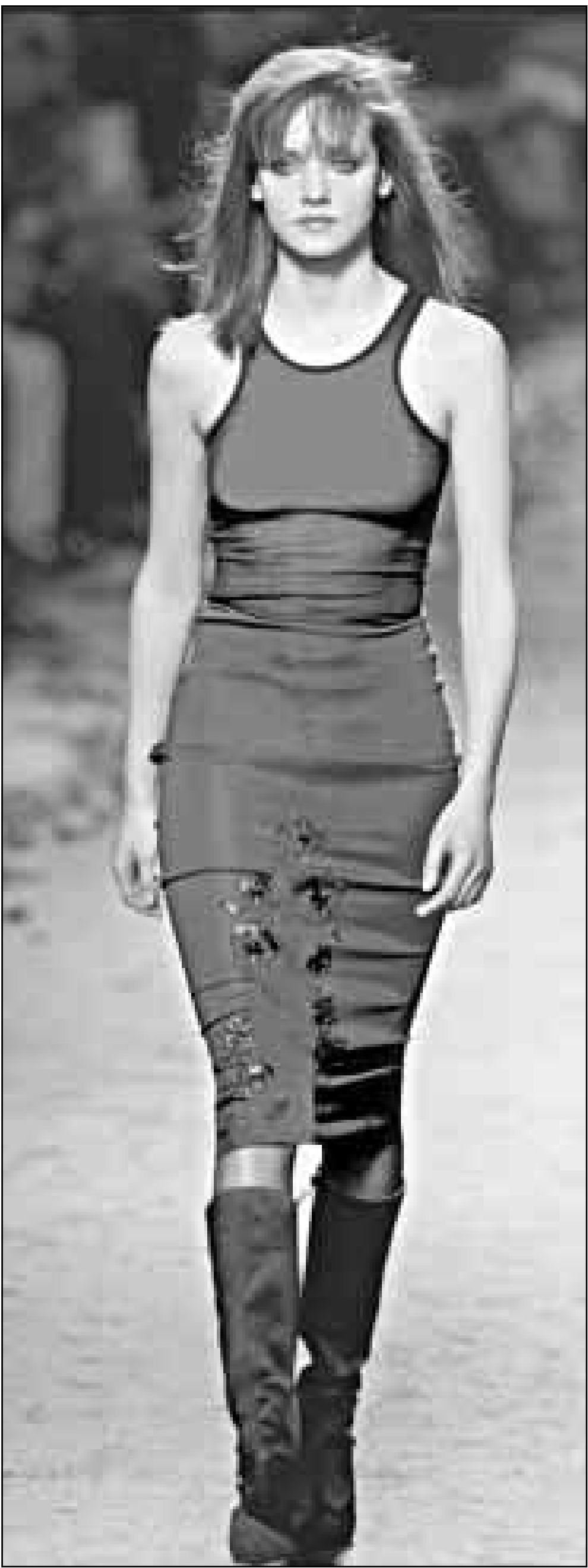
ضمن مجموعة «كلوي» للملابس الجاهزة لفصلي الخريف والشتاء القادمين قدم هذا التصميم في عرض اقيم في باريس امس