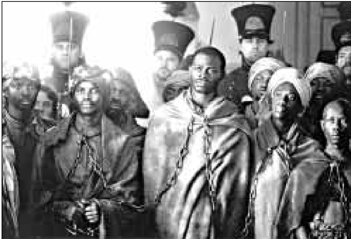
لقتان من فيلم «اميستاد»