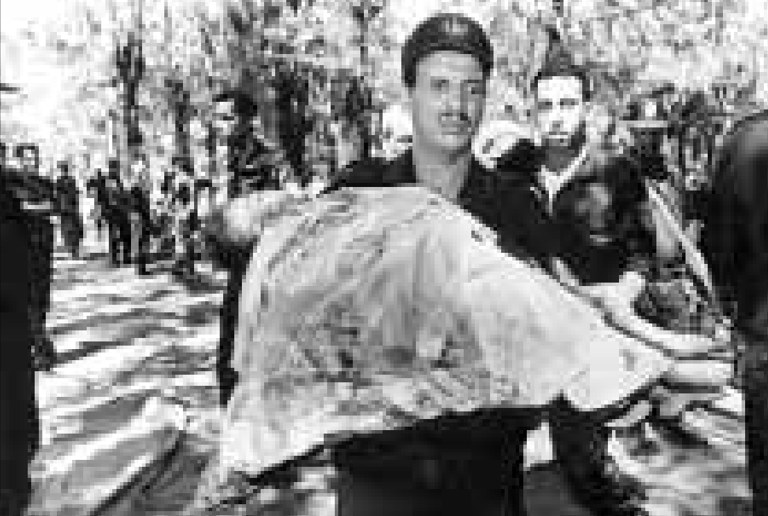
الاطفال والابرياء يدفعون الثمن في حرب قذرة طال امدعا (صورة من الارشيف)