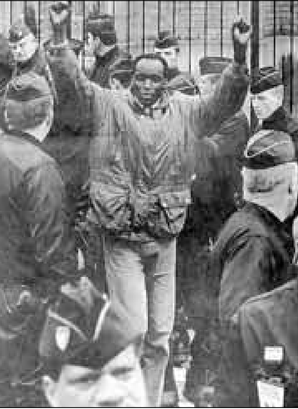
مهاجر افريقي من الذين تظاهروا بالعاصمة الفرنسية

الوقت الذي تعززت فيه الدول الأوروبية توحيد عملتها، وهي خطوة ستضع حدا للهيمنة التي فرضها الدولار الأمريكي على المبادلات التجارية الدولية. ومن المنتظر ان يصوت الكونغرس الأمريكي هذا الاسبوع على قانون يعطي للولايات المتحدة وجودا اقتصاديا اقوى في افريقيا. ويتجسد ذلك في تعبئة 650 مليون دولار لتغطية «الخطار» السياسية التي قد تصاحب المواقف الامريكية. ويعتمد الامريكيون في بسط نفوذهم على هذه العملة الجديدة في الصورة السلبية التي تركتها السياسات الاستعمارية الامريكية في معظم شعراء القارة السمراء، ويعتمدون ايضا على التجانس الثقافي والجغرافي في منطقة شمال افريقيا، انطلاقا من قواعدهم التقليدية في مصر.