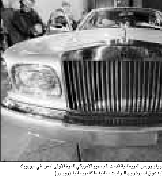
سيارة سيلفر سيراف جديدة من انتاج رولز رويس البريطانية قدمت للجمهور الأمريكي للمرة الاولى امس في نيويورك في احتفال شارك فيه قود اندوية نوجرة اليزابيث الثانية ملكة بريطانيا

■ طرابلس-ا ف ب: منح الصندوق العربي للانماء ليبيا قرضا بقيمة 40 مليون دولار لتمويل مشروع دم كابل بحري من الاليف الزاجاجية لربط دول المغرب العربي بالدول العربية في الشرق الاوسط عبر الساحل الليبي. واوضح مصدر رسمي ليبي امس الخميس لوكالة فرانس برس ان الاتفاق بين طرابلس والصندوق العربي للانماء الاقتصادي والاجتماعي (مقره الكويت) لتمويل المشروع الذي سيتم انجازه في نهاية العام 1999 وقع بالاحرف الاولى في العاصمة الليبية الاربعة. واوضح المصدر ان الكابل البحري سيربط في ما بينها 12 مدينة ساحلية ليبية قبل ان تتصل بمحطة نقل تونسسية واخرى في الاسكندرية»، واذف المصدر «الكابل سيسمح لاقامة 30 الف قناة هاتلية ومعلوماتية وسيفر امكان ربط المحطات الرضية للاعمار الصناعية العربية التي فتحت في مدينة سرت الليبية اخيرا بالمشقة الوطنية والدولية للاتصالات عبر الالقمار الاصطناعية».