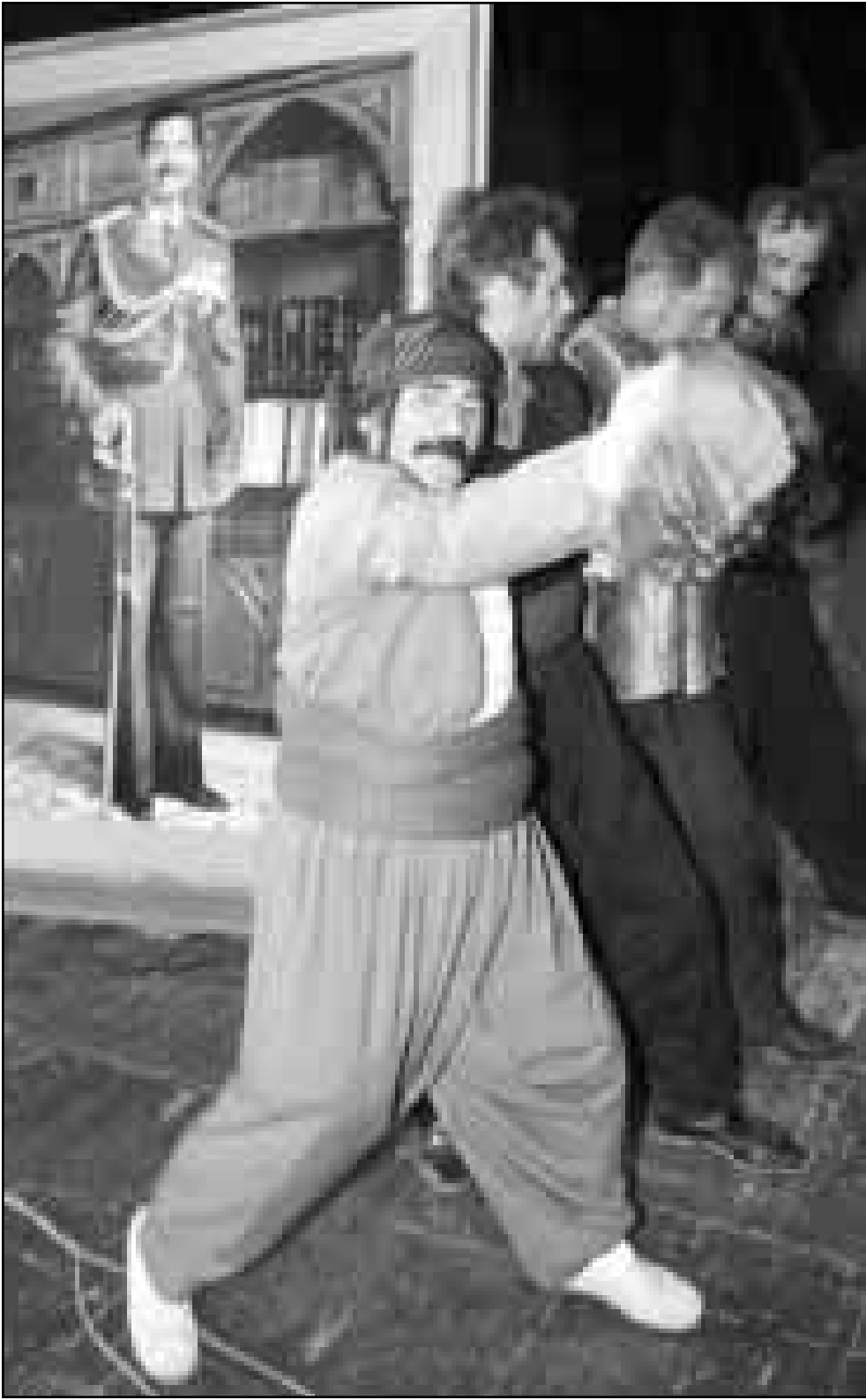
كرد عراقي يرفض ان جانب صورة الرئيس العراقي صدام حسين

■ هل لديك اي تصور عن المدة التي تستغرقها عملية تفتيش المواقع الرئاسية؟ ■ اعتقد من ناحية المبدأ ان العملية قد تستغرق اسبوعين لتفتيش المواقع واحدا بعد الآخر.