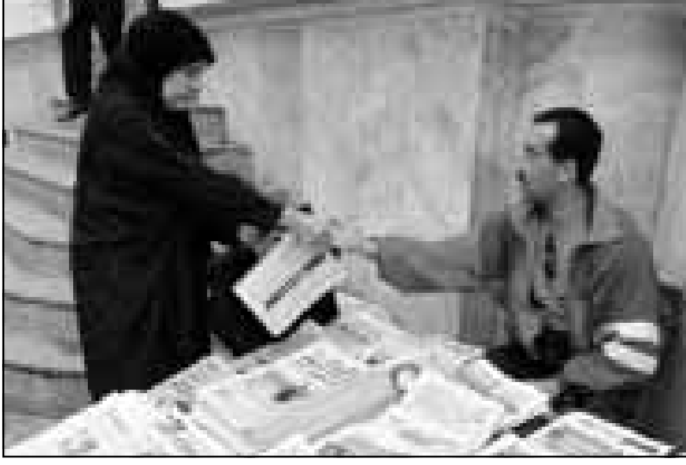
الحكومة الجزائرية تستعد لسن قانون اعلم جديد ضمن ما ستمت به عهد صحافي جديد.

طلب الجزائر خبراء في مجال اصابات الاطفال لكنه لم يستطع ذكر تفاصيل اخرى.