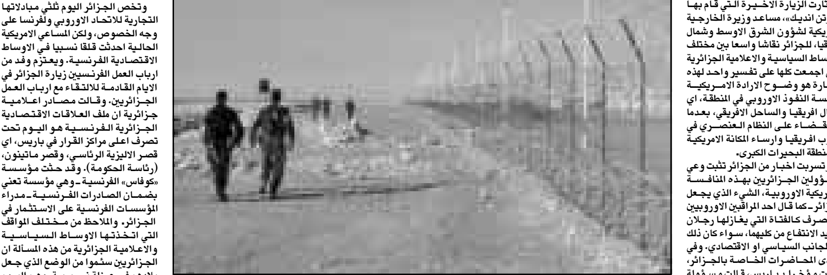
حقل النفط الجزائري محل رقابة عسكرية محلية ومناقشة اقتصادية دولية

الوقت الذي تعززت فيه الدول الأوروبية توحيد عملتها، وهي خطوة ستضع حدا للهيمنة التي فرضها الدولار الأمريكي على المبادلات التجارية الدولية. ومن المنتظر ان يصوت الكونغرس الأمريكي هذا الاسبوع على قانون يعطي للولايات المتحدة وجودا اقتصاديا اقوى في افريقيا. ويتجسد ذلك في تعبئة 650 مليون دولار لتغطية «الخطار» السياسية التي قد تصاحب المواقف الامريكية. ويعتمد الامريكيون في بسط نفوذهم على هذه العملة الجديدة في الصورة السلبية التي تركتها السياسات الاستعمارية الامريكية في معظم شعراء القارة السمراء، ويعتمدون ايضا على التجانس الثقافي والجغرافي في منطقة شمال افريقيا، انطلاقا من قواعدهم التقليدية في مصر.