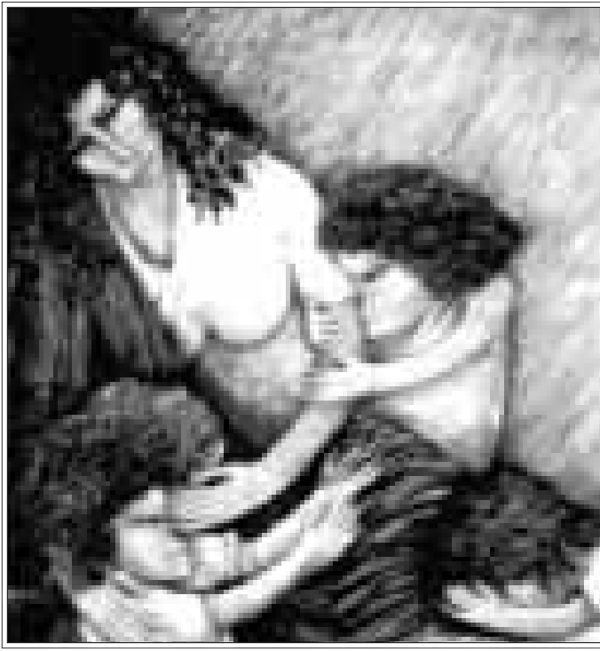
من أعمال الفنانة زينب السجيني