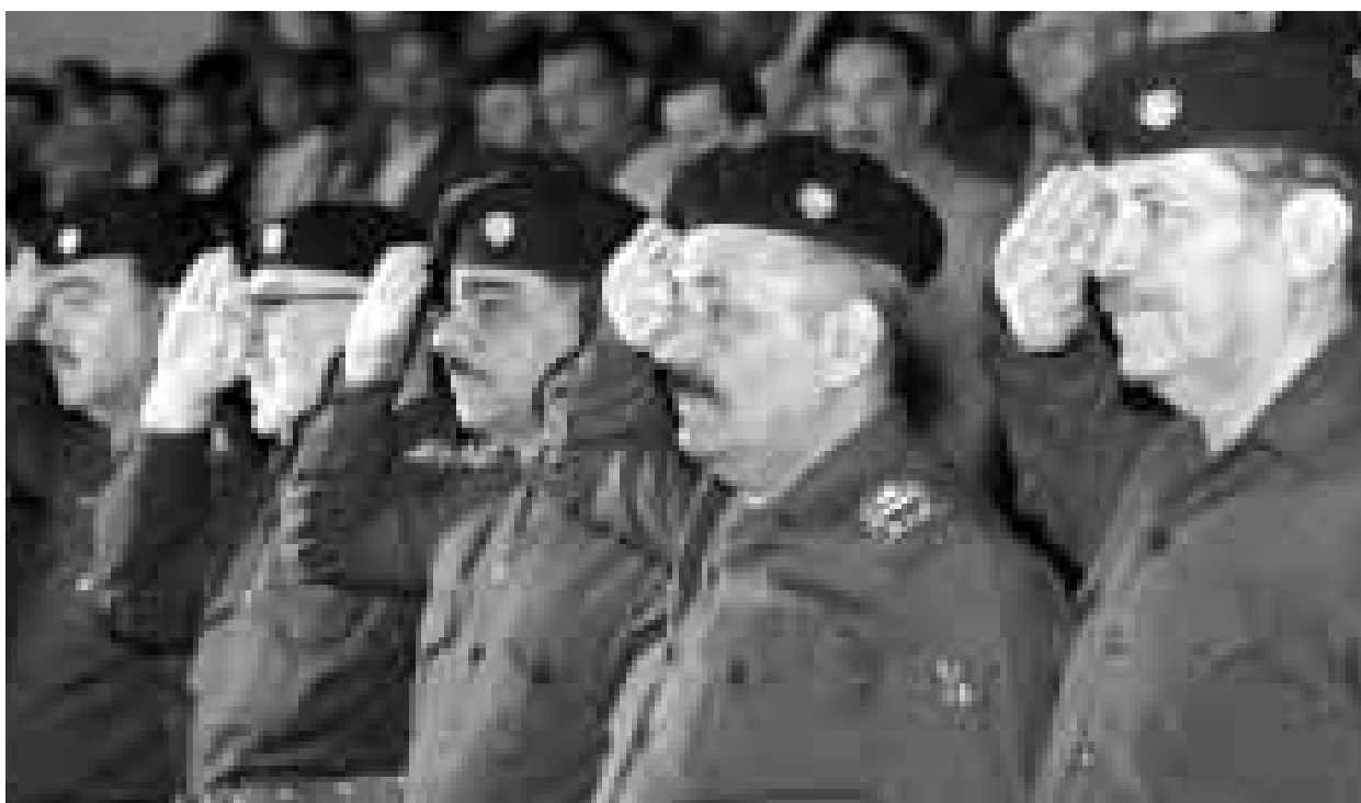
نائب الرئيس العراقي اثناء احتفال بالسة الكردية الجديدة في بغداد