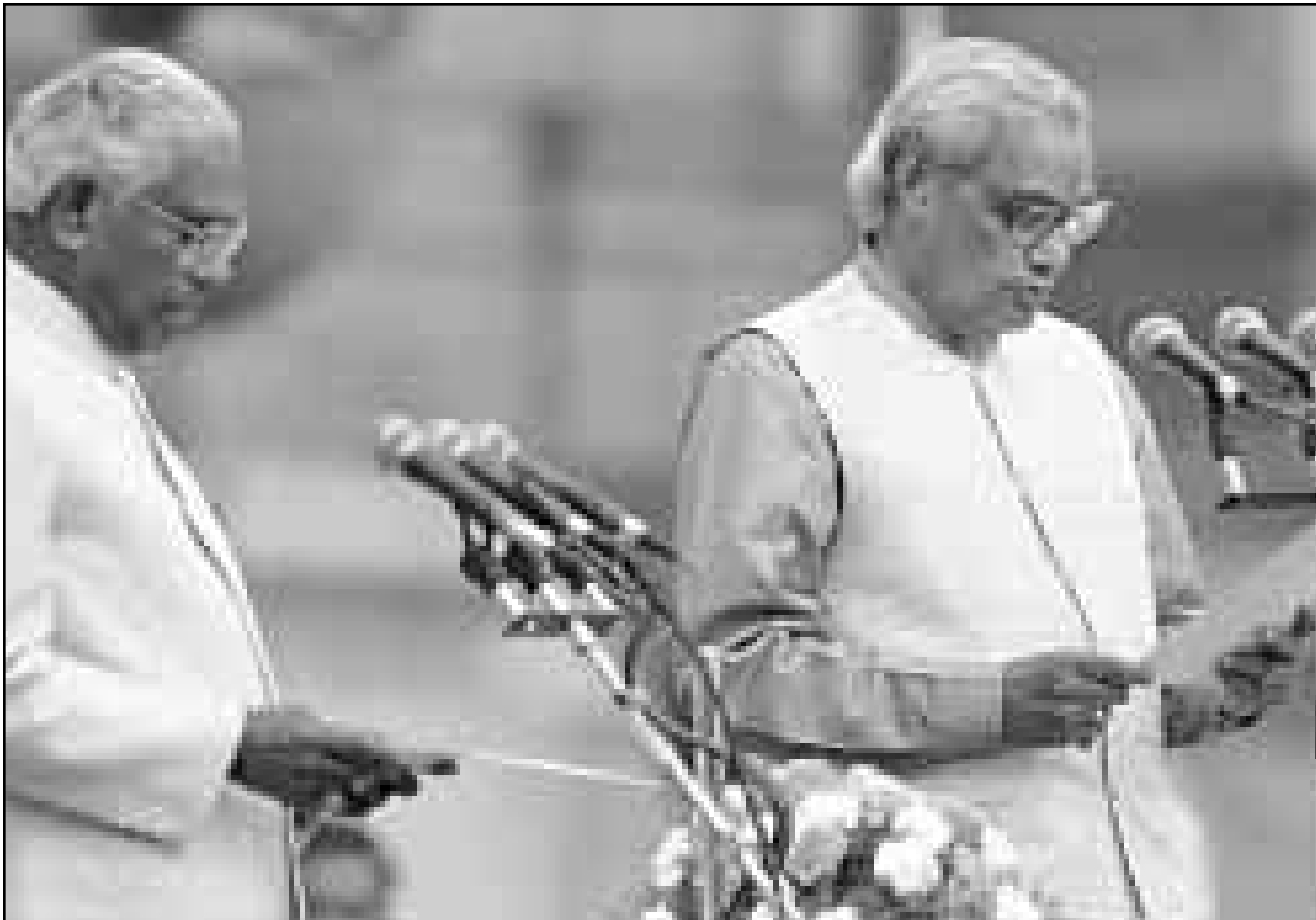
رئيس الوزراء الهندي اتال بهاري فاجايبي يؤدي اليمين الدستورية امس

■ نيودلهي - جنيف - وكالات: اقم الزعيم القومي الهندوسي اتال بهاري فاجايبي (71 عاما) اليمين الدستورية امس الخميس في نيودلهي بصفته رئيسا للحكومة الهندية. واقسم فاجايبي اليمين صباح امس باللغة الهندية امام رئيس الجمهورية لكاراخستان. وتاريخا أثناء مراسم اقيمت في الهواء الطلق في وسط العاصمة الهندية امام القصر الرئاسي الذي كان في السابق مقرا لانتاب ملك الهند البريطاني. واقسم فاجايبي الذي ارتدى اللباس الهندي التقليدي، على احترام الدستور وحماية وحدة وسلامة اراضي الهند والعمل «من دون خوف او محسوبية». وبذلك اصبح فاجايبي وهو احد زعميي حزب الشعب الهندي اليميني القومي، رئيس الوزراء الثالث عشر في الهند منذ استقلالها في 1947. وكان قد شغل هذا المنصب لفترة قصيرة في 1996 وسقطت حكومته بعد 13 يوما من تشكيلها لعدم تمتعها بالدمع اللازم. وتوالى الوزراء بعد ذلك على المنصة ليقسموا اليمين، بعضهم باللغة الهندية والبعض الاخر باللغة الانكليزية، ومن بينهم آل.كس. ادانثاني رئيس حزب الشعب الهندي الذي يتعبر قويا متشددا والوجه المتطرف لحزب يتهم بالفاشية.