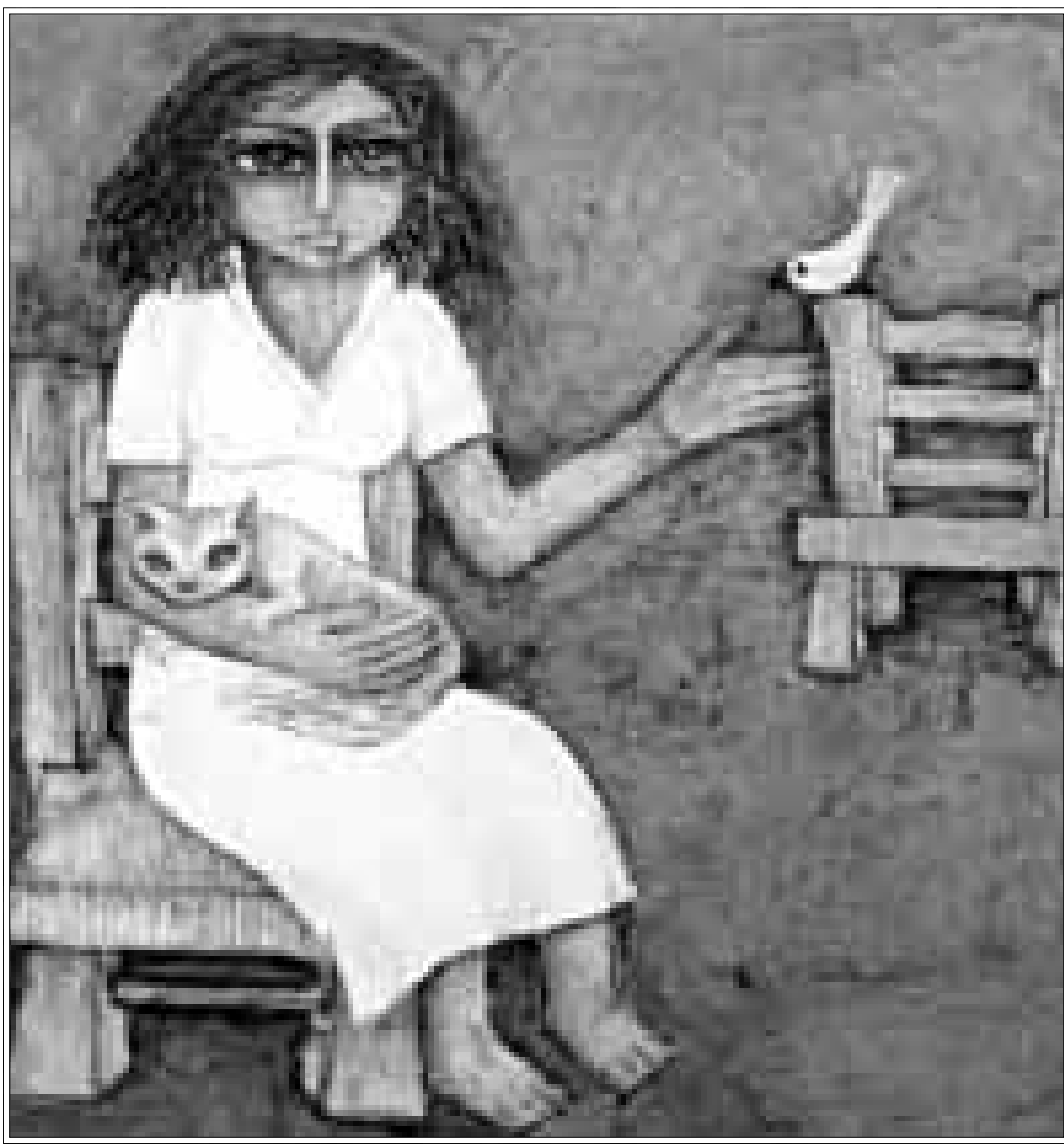
من أعمال الفنانة زينب السجيني