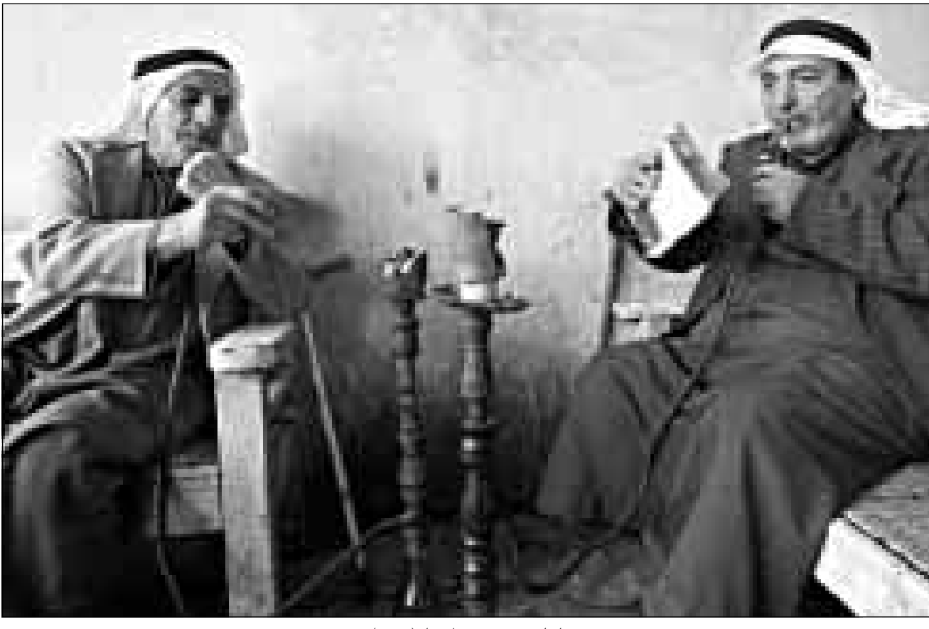
عراقين في مقهى بوسط بغداد

الشان».. ويتعين على الحجاج العراقيين الذين يرغبون في الذهاب الى مكة برا ان يصلوا الى السعودية في السابع والعشرين من آذار (مارس) الجاري اما الذين يريدون السفر جوا فيتمتعن وصولهم في الاول من نيسان (ابريل) المقبل. وتوقع المراقبون ان يتحدي العراقيون الحظر الجوي مجددا هذا العام بإرسال طائرات حجاج مباشرة الى السعودية دون ان تلتحج العقوبات، وكانت لجنة العقوبات اقترحت ان تقطع تكاليف الرحلة المحددة بـ44 مليون دولار من حساب مجمد تديره الامم المتحدة ويغذي من مبيعات النفط العراقي. ويتعين ان يتم تحويل المبلغ بواسطة مصارف اردنية. لكن بغداد طالبت لاسباب تتعلق بالسيادة، ان تدفع الاموال المصرف المركزي العراقي الامر الذي لا ينص عليه قرار الامم المتحدة الرقم 986 حول «المنظف مقابل الغداء».