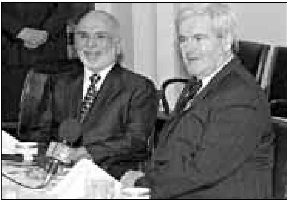
الملك حسين والمتحدث باسم الكونغرس نيت غين غينريش يجيبان على أسئلة الصحافيين

تعمزته واشنطن للمضي من اجل بلوغ شهره وهو اول اعتراف ان «تتحقق القرارات الصعبة» من اجل السلام. وتفادت اولويات اردل على سؤال هل للمجلس ان تقتضي نزعاً من الشرق الاوسط اثناء رحلته الى اورشالا الاسبوع المقبل لباحثات في بون بوريا ازمة كوسوفو. غير ان مسؤولين امريكيين قالوا