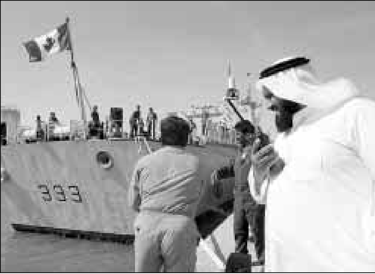
كويتي يرشد فرقة حربية كندية للرسو في ميناء الشويخ الكويتي

وكانت تشيلر أول امرأة تصل إلى رئاسة الوزراء في