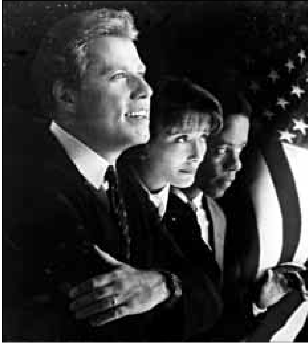
جون ترافولتا وايماء طومسون في دور الرئيس ستانتون في فيلم «ألوان أساسية».

تقمص الشخصيات الحقيقية دون ان يضعوها فيها، وهناك ايضا ممثل رائع اضافي، من لاري وانغان كمرشح للرئاسة مصاب بالاكنتاب الى روبرا وايفر تقدم لبرنامج اذاعي. انما الاءاء الذي يقدمه ترافولتا فهو الاضعف. انه يشبه كلينتون كثيرا - وربما اكثر من اللزوم - وقد نجح في تقليد لهجة كلينتون تماما، وهو عندما تتجرع اعصابه ويتذمر من وسائل الاعلام يخال المخرج انه يشاهد كلينتون نفسه ويسمع صوته. وقد تصرف المنظر عن هذا القول كمجرد