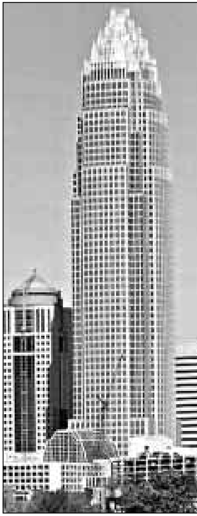
مقر ادارة مصرف نيشنز بانك في مدينة تشارلوت في ولاية كارولينا الشمالية

مقابل كل سهم قديم. وقال بيان مشترك ان القيمة السوقية للبنك الجديد ستبلغ 133 مليار دولار.