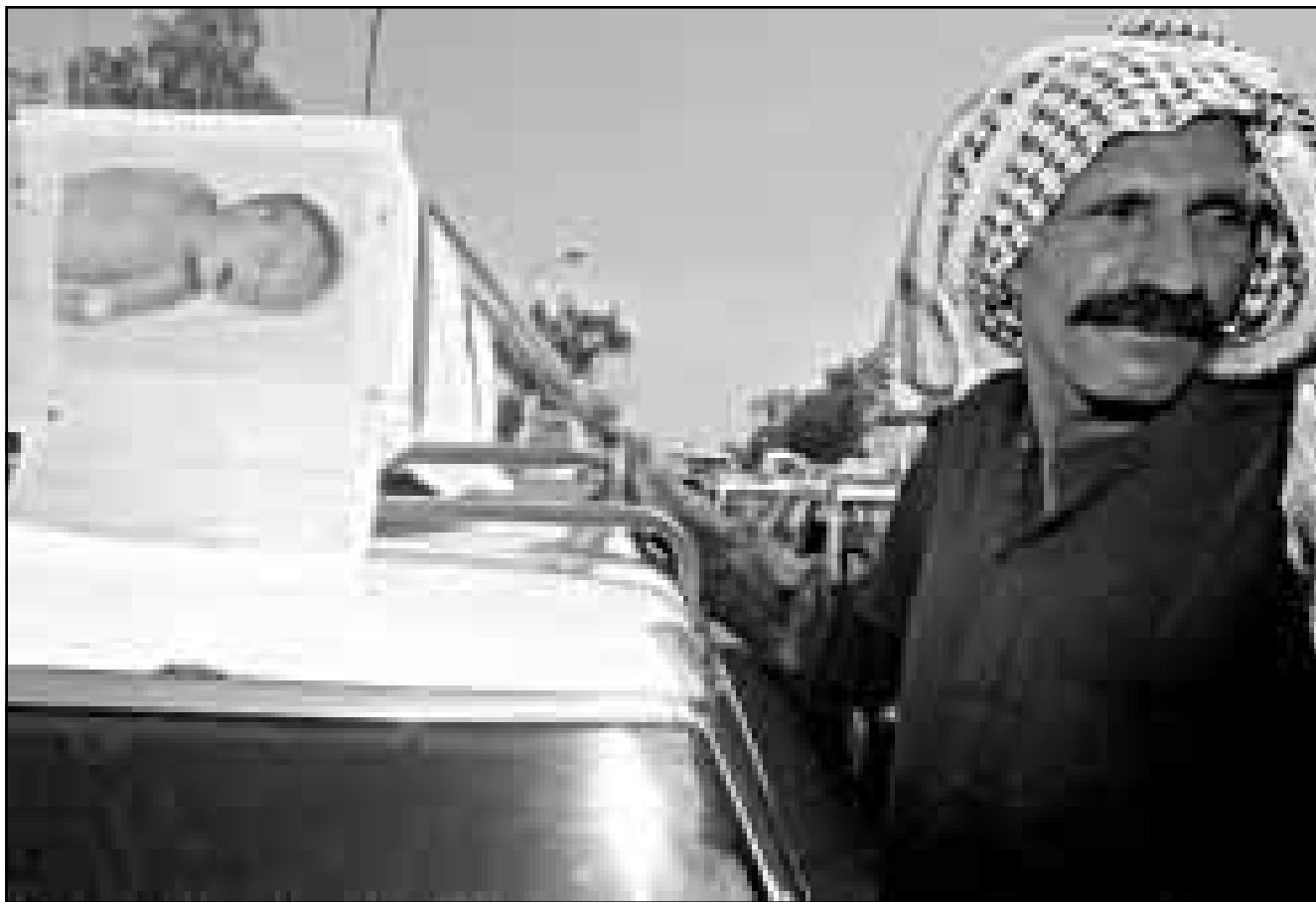
عراقي اثناء تشييع الاطفال ببغداد

انقرة - اف ب: اعلنت وكالة انباء الاناضول ان القوات التركية الخاصة اعتقلت امس الاثنين في عملية قامت بها في شمال العراق القائد السابق في حزب العمال الكردستاني سمدين سايك واقادته في تركيا.