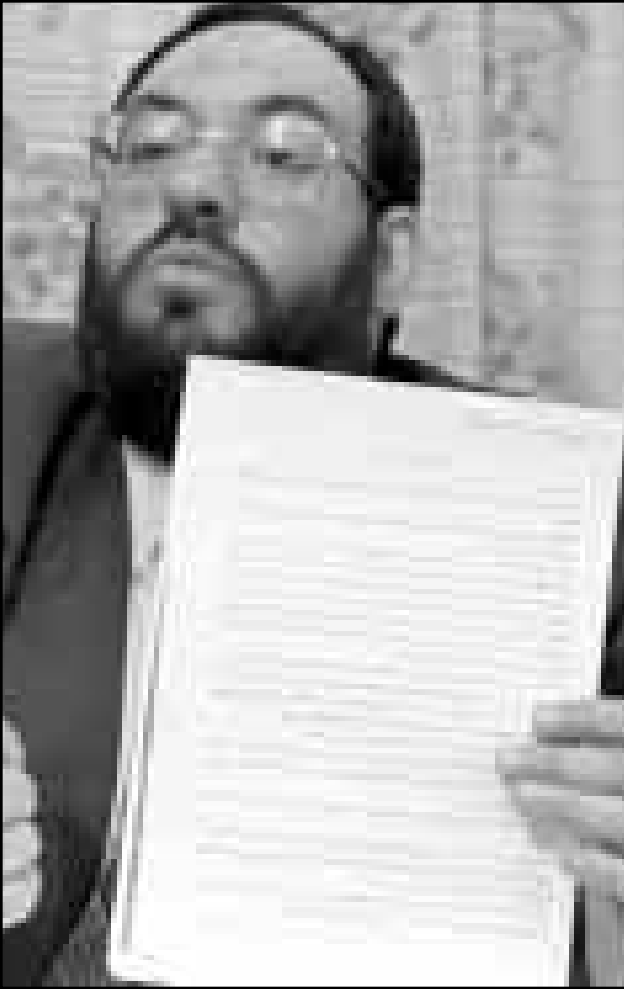
حماس «مرة اتفاق أوسلو لان اتفاق الفلسطينية عملية للاحتمال أوسلو يهدف الى جعل السلطة الاسرائيلي، وهذا هو ما يحدث فعلا».