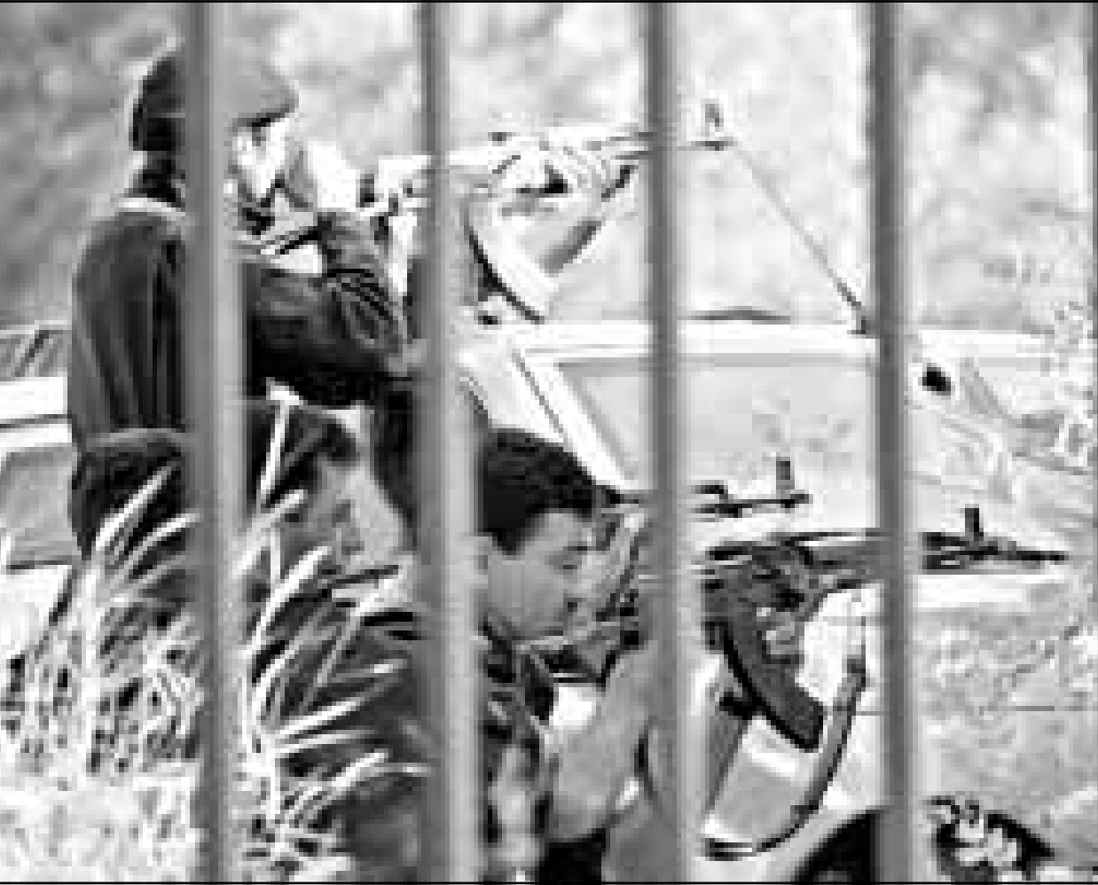
جنود الجيش الجزائري يطلقون الرصاص صوب المبنى الذي اختبأ فيه مجموعة مسلحة امس بحي باب الزوار