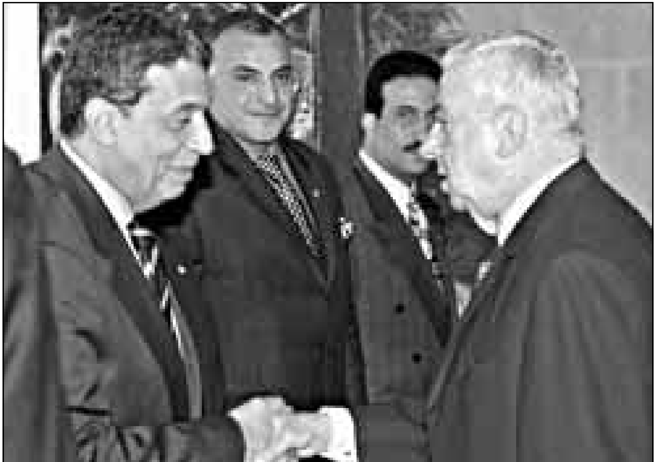
الرئيس اللبناني الياس الهراوي يصافح عمرو موسى وزير خارجية مصر ويبدو في الوسط وزير خارجية الجزائر احمد عطاف وناصر الوزي وزير الاثغال العمومية اليراني

كما كلف الامم المتحدة في بيروت لبنان برئاسة المجموعة العربية المتوسطية لمدة عام «حتى انعقاد مؤتمره المقبل في