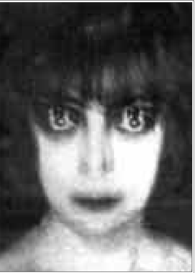
صورتان من اعمال مان ري