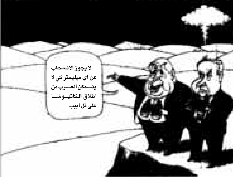
لا يجوز الانسحاب عن اي مليمتر لا يمتك العرب من اطلاق الكاتيوشا على تل ابيب

العديد من القتلى ومزقت الشعا اربا. حرب لبنان كانت بالنسبة لنا أكثر من حرب يوم الغفران خط الشرح الكبير». وارب ملاحظات شخصية. الاولى: لتسيبوري شجاعة مثبته في ميدان القتال وفي بداية طريقه في السياسة. وقد كتب كتابه بعد 16 سنة. اين كان حتى اليوم؟ هل كان سيكتب لو لم يلقى به حربه في المنح الف السياسي؟ واذا كان هذا رايه ماذا رفض الادلاء