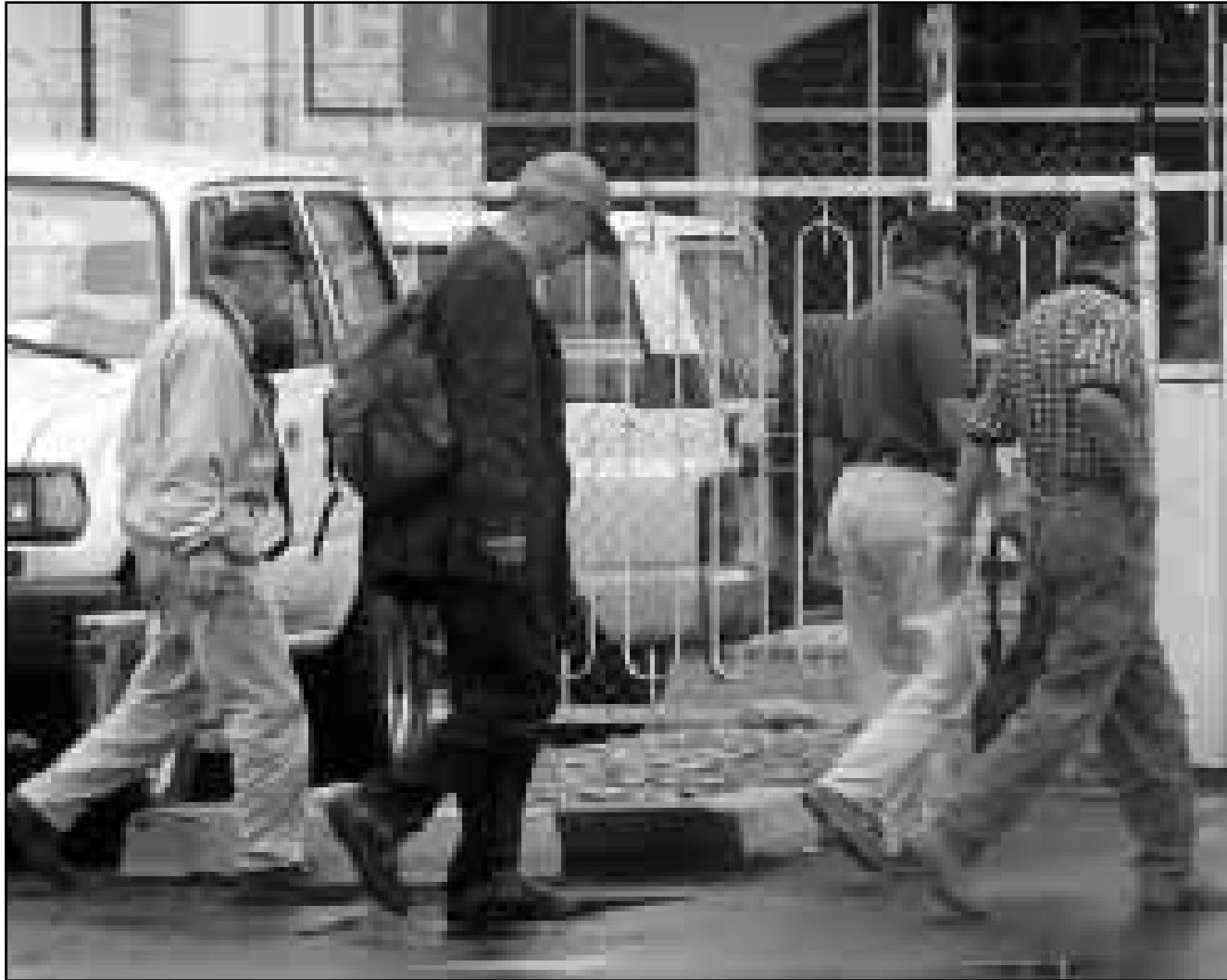
مفتشون دوليون في بغداد

بغداد - رويترز: ما زال فريق الأمم المتحدة المكلف بنزع أسلحة الدمار الشامل العراقية يفحص عن بقايا رؤوس حربية للصواريخ تبين أنها يمكن أن تساعد في تسوية بعض قضايا نزاع السلاح المهمة. وقالت اللجنة الخاصة التابعة للأمم المتحدة في بيان أمس الثلاثاء إن الفريق وصل إلى العراق في 18 أيار (مايو) الماضي لمدة شهر لاستئناف التفتيش عن مواد متعلقة بالصواريخ قام العراق بتدميرها من جانبه ودفعها قبل سنوات في منطقة على بعد 30 كيلومترا شمالي بغداد.