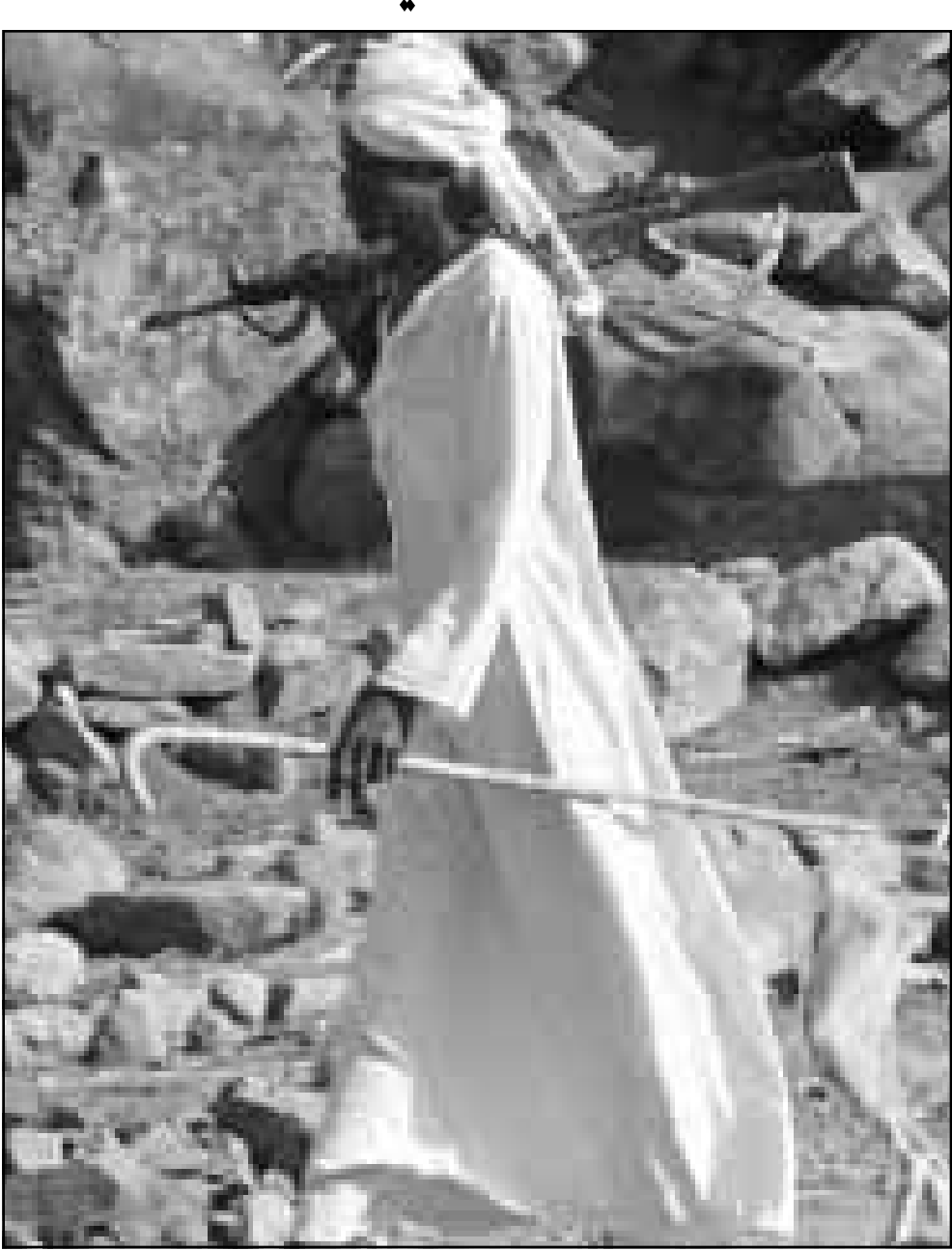
مواطن سوداني في الجنوب