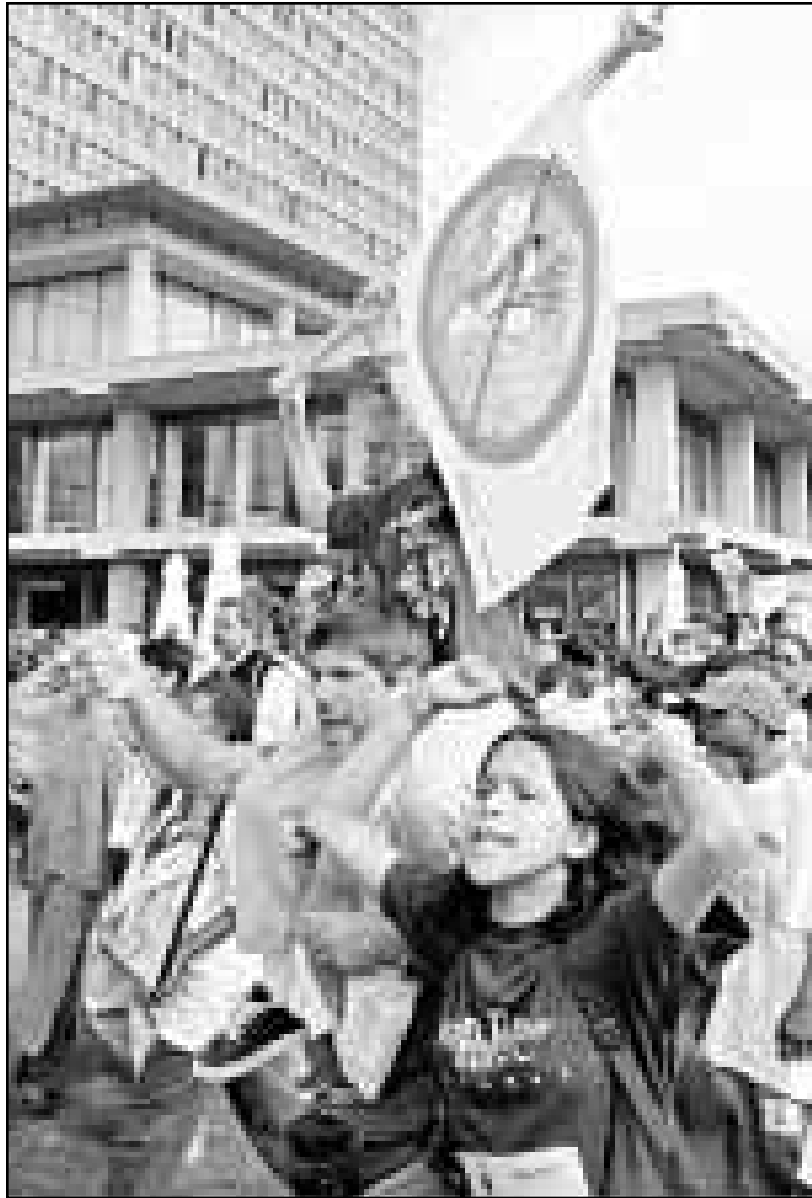
عدد من الاطفال المشاركين في المسيرة العالمية لمنع تشغيل الاطفال امام مقر منظمة العمل الدولية في جنيف امس