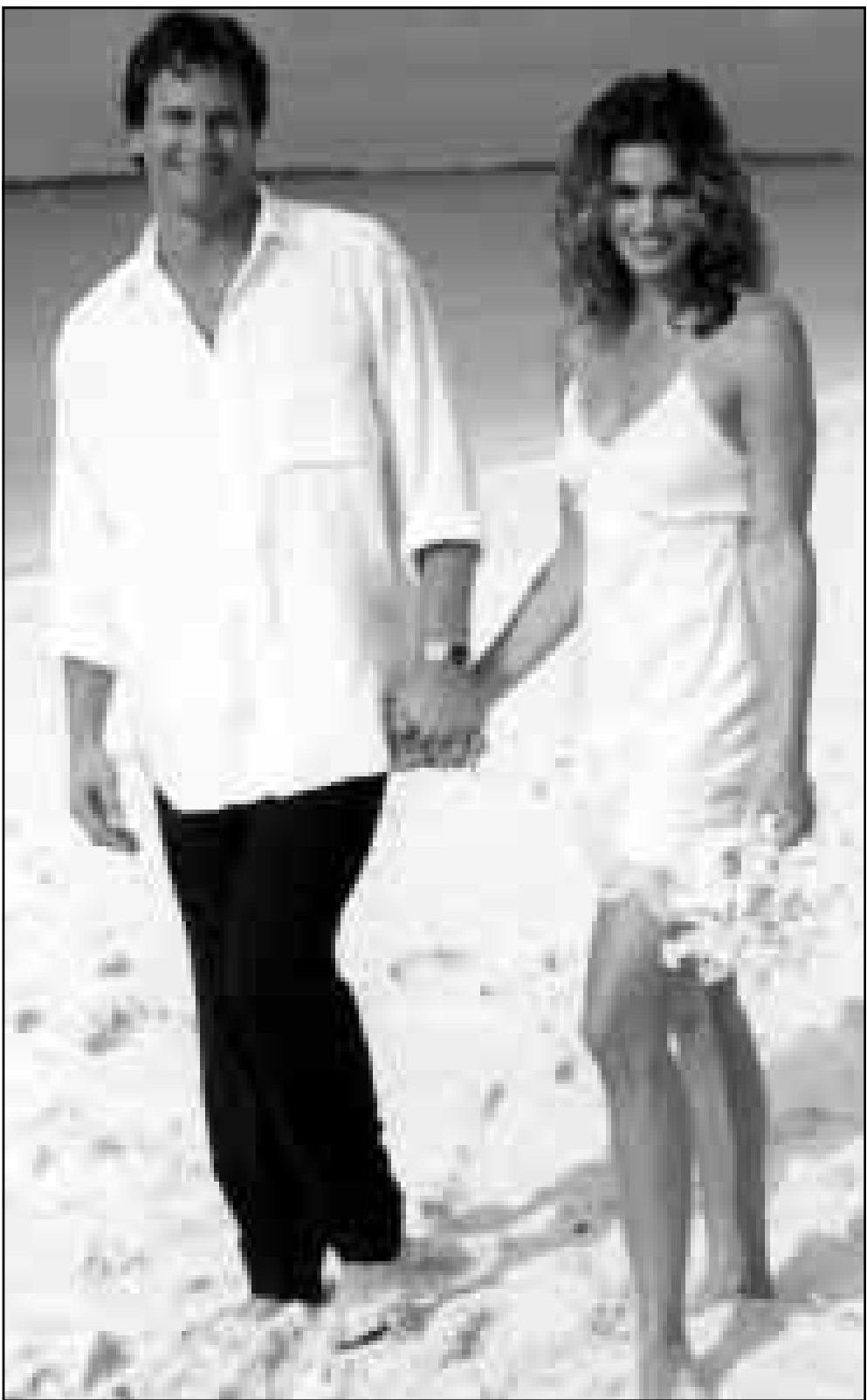
تزوجت عارضة الازياء الامريكية الشهيرة سيندي كرا فورود من صديقها راند غيربر على احد شواطئ جزر البهاما. واقيم حفل الزواج الجمعة الماضي في منتجج اوشن كلوب بجزيرة باراماديس.

■ لندن- اف ب: ذكرت صحيفة «دي صن» امس الثلاثاء ان فرقة سياسيين غيرلن لجأت بعيدا عن وسائل الاعلام الى منزل التون جون الفخفي في فرنسا لتفكر في مستقبل فرقة موسيقى الجوب البريطانية بعد رحيل احدى مغنياتها جيري هاليويل. فقد وقع التون جون اس الثلاثاء منزله الفخم على الكوت دازور قرب نيس مع تسعة من الخدم بتصرف مغنيات الفرقة الاربعة اللواتي يردن الاستراحة ليضعة ايام. وكان التون جون ارتبط بعلاقة صداقة مع الفرقة العام الماضي اثناء برنامج مطلق. وتتمتع المغنيات الاربعة مواصلة رحلتهم الغنائية التي درت على كل واحدة منهم حتى اليوم ثروة تقدر بنحو 21 مليون دولار قبل حسم الضرائب، لكنهن يتساعن في مستقبل الفرقة بعد ترك زميلتهن المغنية «بيجينجر سايبس». ومن المفترض ان تبدأ سياسيين غيرلن بعد اسبوعين جولة في الولايات المتحدة.