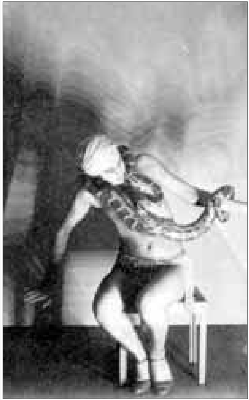
صورتان من اعمال مان ري

القاهرة - «القدس العربي»: انتهى الكاتب والمخرج السينمائي د. منكور ثابت من احدث فيلم كبير من ابحاثه بعد عشرين سنة كاملة عن الاخراج الخمس سنوات كاملة عن الاخراج السينمائي بسبب انشغاله برئاسة المركز القومي للسينما، والفيلم الجديد يحمل اسم «سحر الوثائق» عن تاريخ مصر من نهاية القرن التاسع عشر وحتى نهاية القرن العشرين، ومدته 135 دقيقة، واستغرق اخراج الفيلم ونتاجه اعداد مادته السينمائية عامين كاملين، حيث يتضمن الفيلم وثائق سينمائية نادرة يتم الكشف عنها لأول مرة، وبها مفاجات تاريخية تحتوي اللقطات الحية لحكام مصر وزعمائها ابتداء من الخديوي عباس حلمي الثاني في نهاية القرن الماضي، مروراً بسعد زغلول ومصطفى النحاس والملك احمد فؤاد ثم الملك فاروق وقيام ثورة تموز (يوليو) 1952 والرؤساء عبد الناصر والسادات ومبارك كما يتضمن الفيلم لقطات حية نادرة ايضا لحروب مصر في القرن العشرين بدءاً من حرب 1948 و1956 و1967 والاستنزاف من حرب 1973 مروراً بوقائع التاريخ الاقتصادي