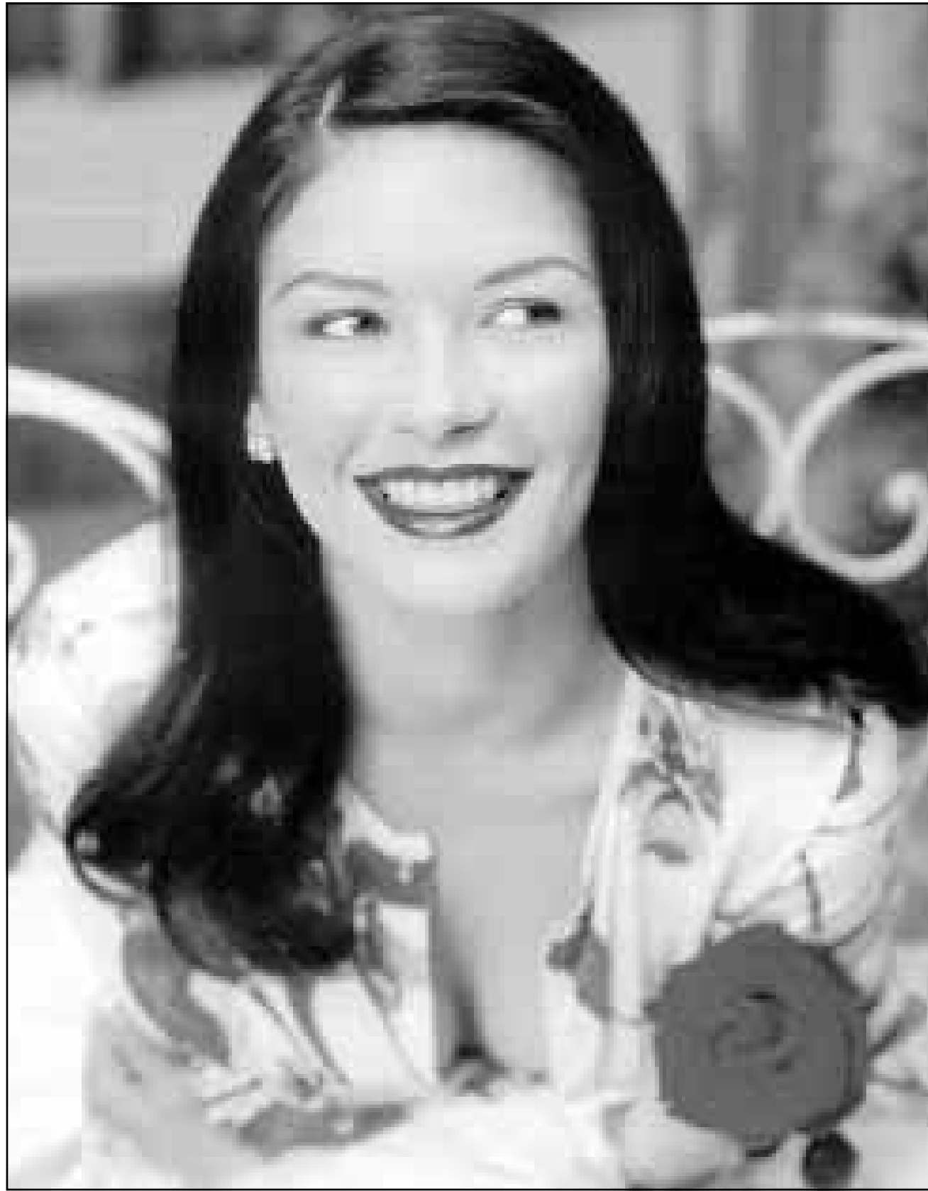
كاترين زيتا جونز

والآن زيتا - جونز قد حصلت على دور سارقة لوحات فنية عالمية مقابل شين كونري في فيلم «المصيدة»، لكنها تستطيع دائما ان تعود الى الغناء والرقص، فقد قامت مرة بأخذ دور النجومية في العرض المسرحي الراقص «شارع الـ 42»، تقول زيتا جونز: «أنا راقصة محترفة».