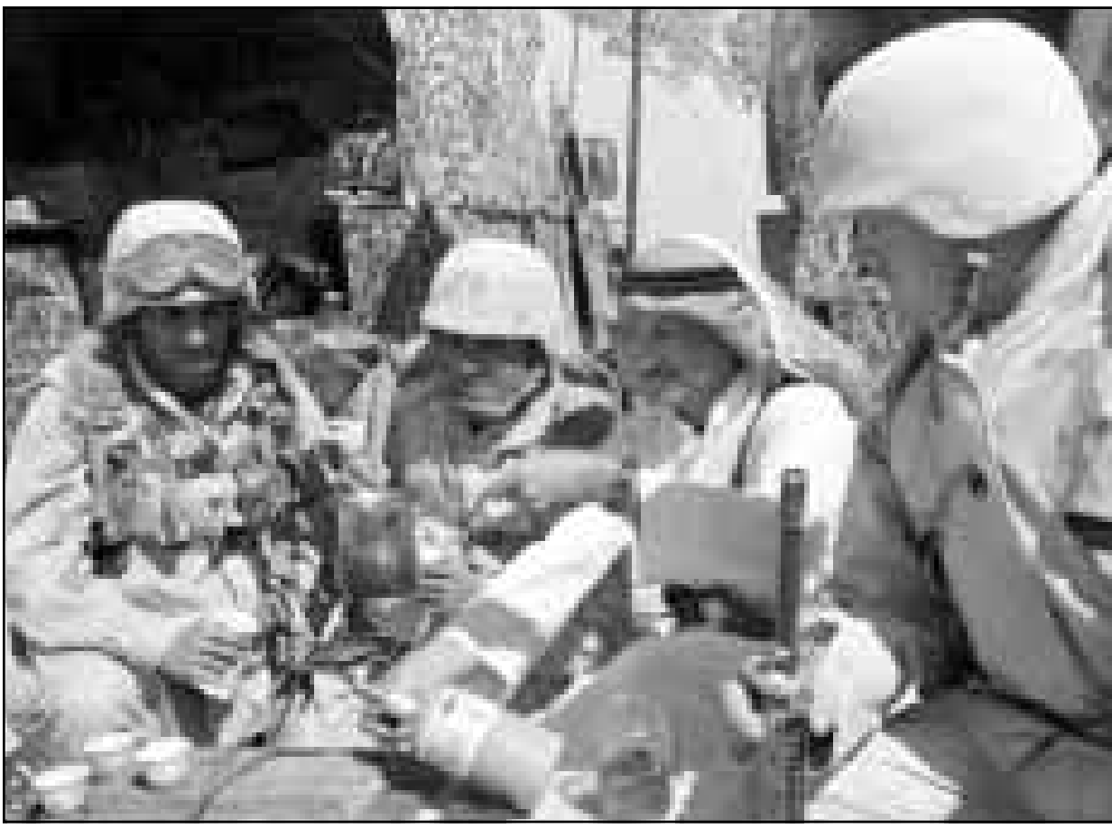
بدوي يقدم القهوة العربية لجنود امريكيين يشاركون في تدريبات عسكرية بصحراء الاردن امس

وقلت مصادر اردنية موثوقة عن عبدالرحيم قوله ان هذه التطورات ادت لتراجع دمشق عن دعم فكرة القبة العربية في الوقت الراهن. يشار الى ان الحكومتين الاردنية والاسرائيلية عقدتا اتفاقا توامنه بين عمان وتل ابيب، وقالت صحيفة «ديلي تلغراف» البريطانية ان رئيس بلدية تل ابيب روني ميلو وولي العهد الاردني الامير حسن اتفقا على توأمة عمان وتل ابيب. ويعتبر هذا الاتفاق الأول من نوعه بين اسرائيل والحكومتان الاردنية والصربية تحديدا بتقليص جميع اشكال الاتصالات الحكومية مع اسرائيل الى اضعف حدود ممكنة، ثم تعلنان التخلي رسميا عن بدء المرحلة الثانية. وفي غضون ذلك تقضي الوثيقة بممارسة حملة للضغط على اسرائيل، وقال عبدالرحيم ان الخطة ستطرح كوثيقة سرية خلال القمة العربية الاربعة عقدها قريبا، بعد اعلان المبادرة الأمريكية بخصوص عملية السلام.