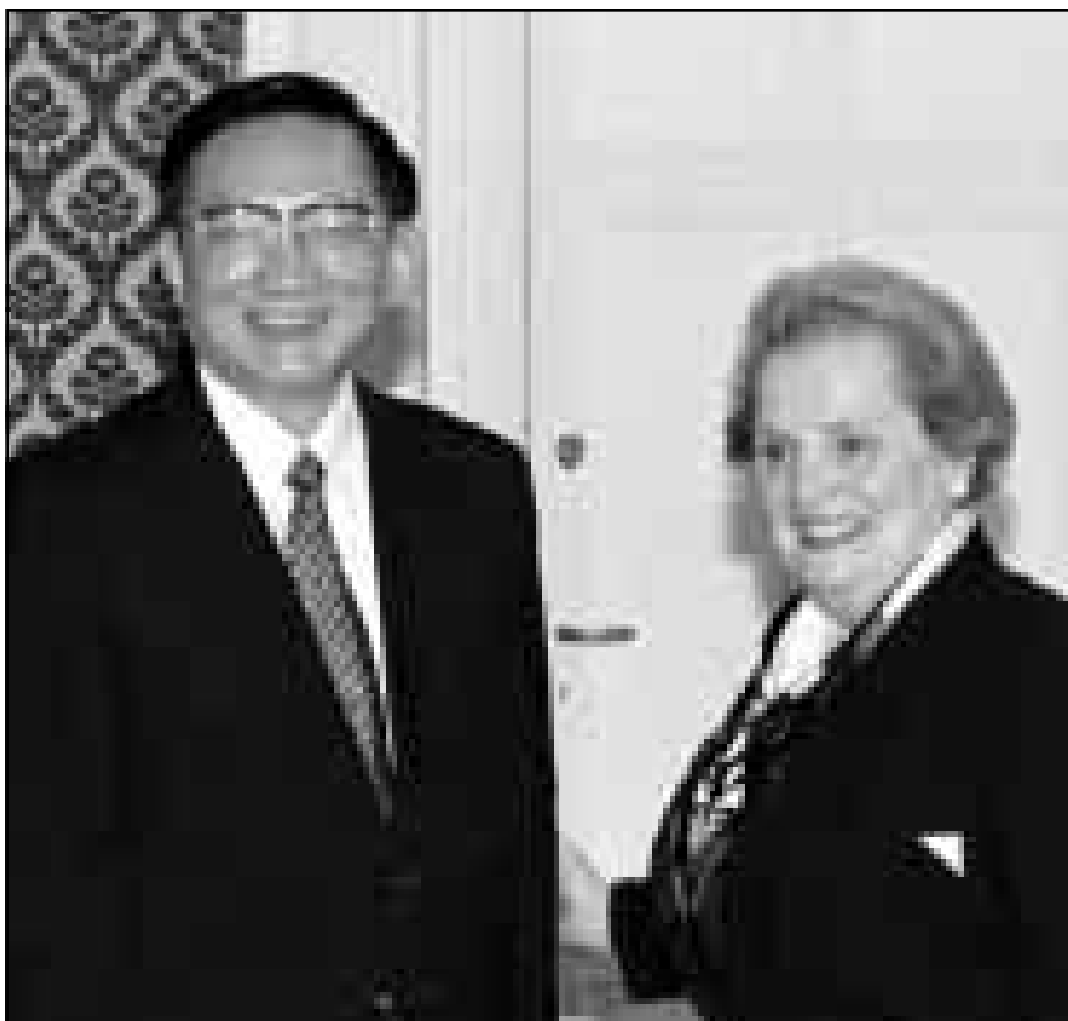
وزيرة الخارجية الأمريكية مادلين اولبرايت تلقي نظيره الصيني تان جيانغ قبل بدء أعمال مؤتمر القوى النووية الخمس في جنيف (اس (رويترز)