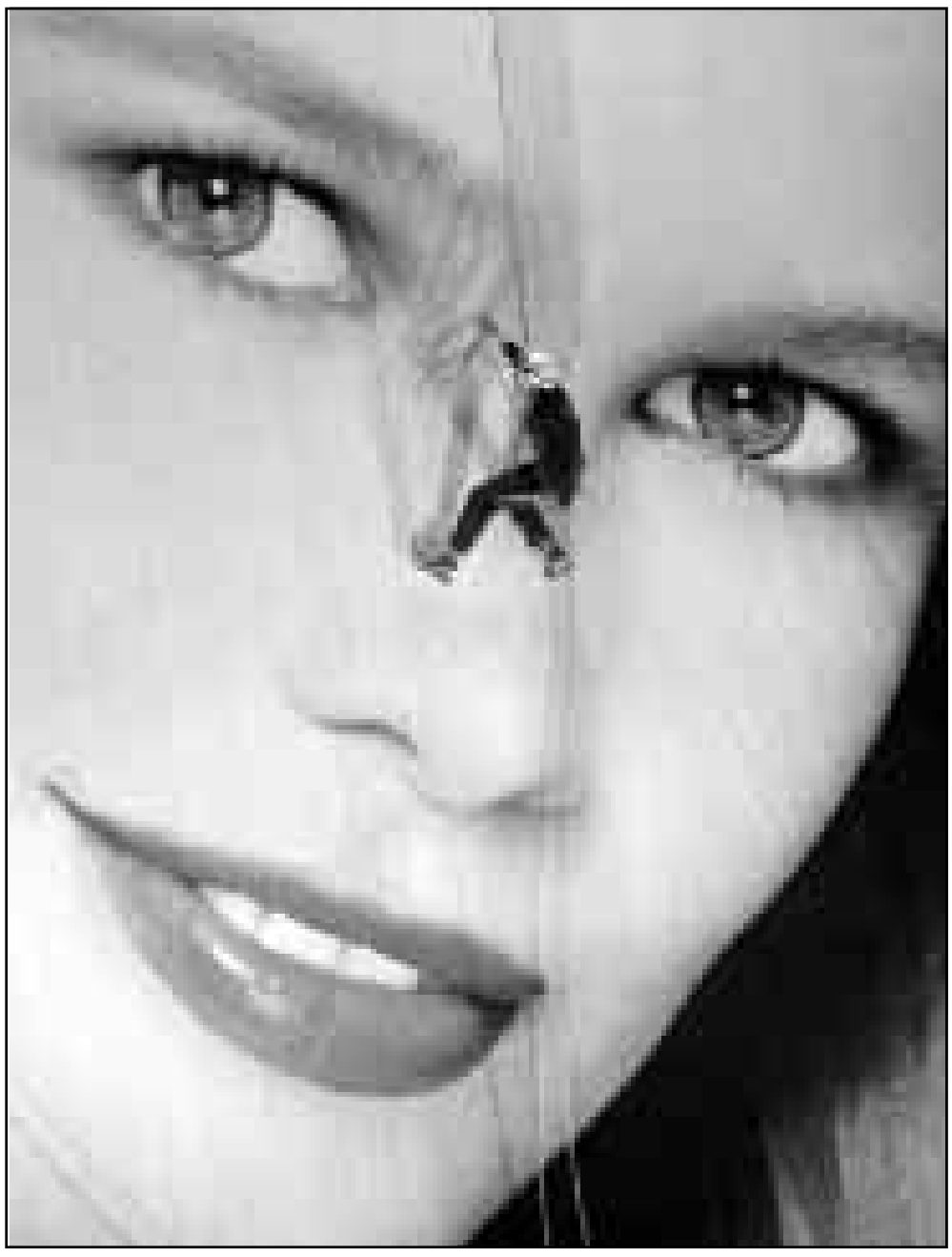
صورة ضخمة جدا لنجمة عرض الازياء العالمية كورديا شيفر معلقة على جدار في اوكلاند (نيوزلندا) للعلامة لمستحضرات التجميل.

في قاعة المحاضرات في «امبريال كوليدج» بلندن.