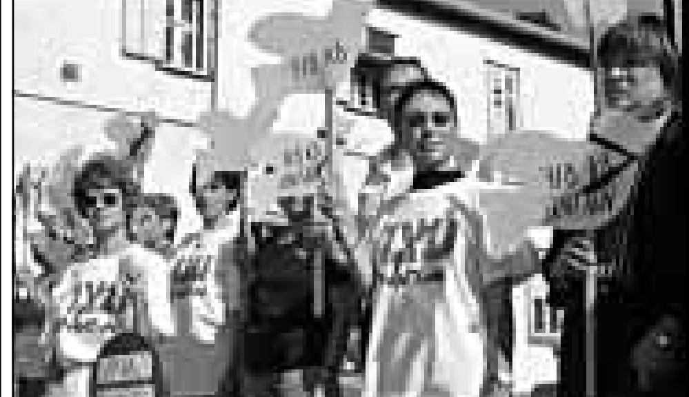
أهبات جنود إسرائيليين يهدمون في جنوب لبنان بطالين بالانسحاب

السبل على مجموعة صغيرة من الأشخاص أن يشنوا الهجمات، وأضاف «يستطيعون إيقاف الحرب وليس العمليات الأمنية، أي مجموعة تستطيع كل شهر أو ثلاثة أو ثلاثة أي تقوم بعملية أمنية واحدة، كل 15 شايأ ذي كفاءة وذخيرة وتضليلية نووية وأتاريفها ونيرانها، كان له دور في عمليات خلف اجانب غربيين في شوارع بيروت وفي أعمال «ارهابية» ابان الحرب الأهلية التي عادت ببلتان.