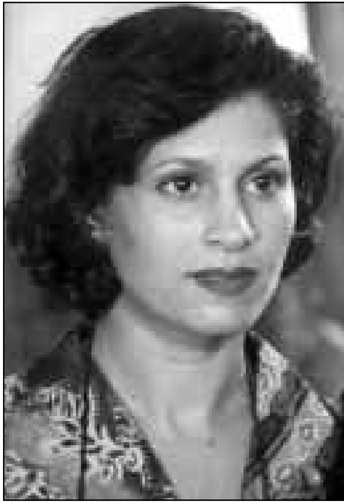
لقطة من فيلم «بنت فاميليا».