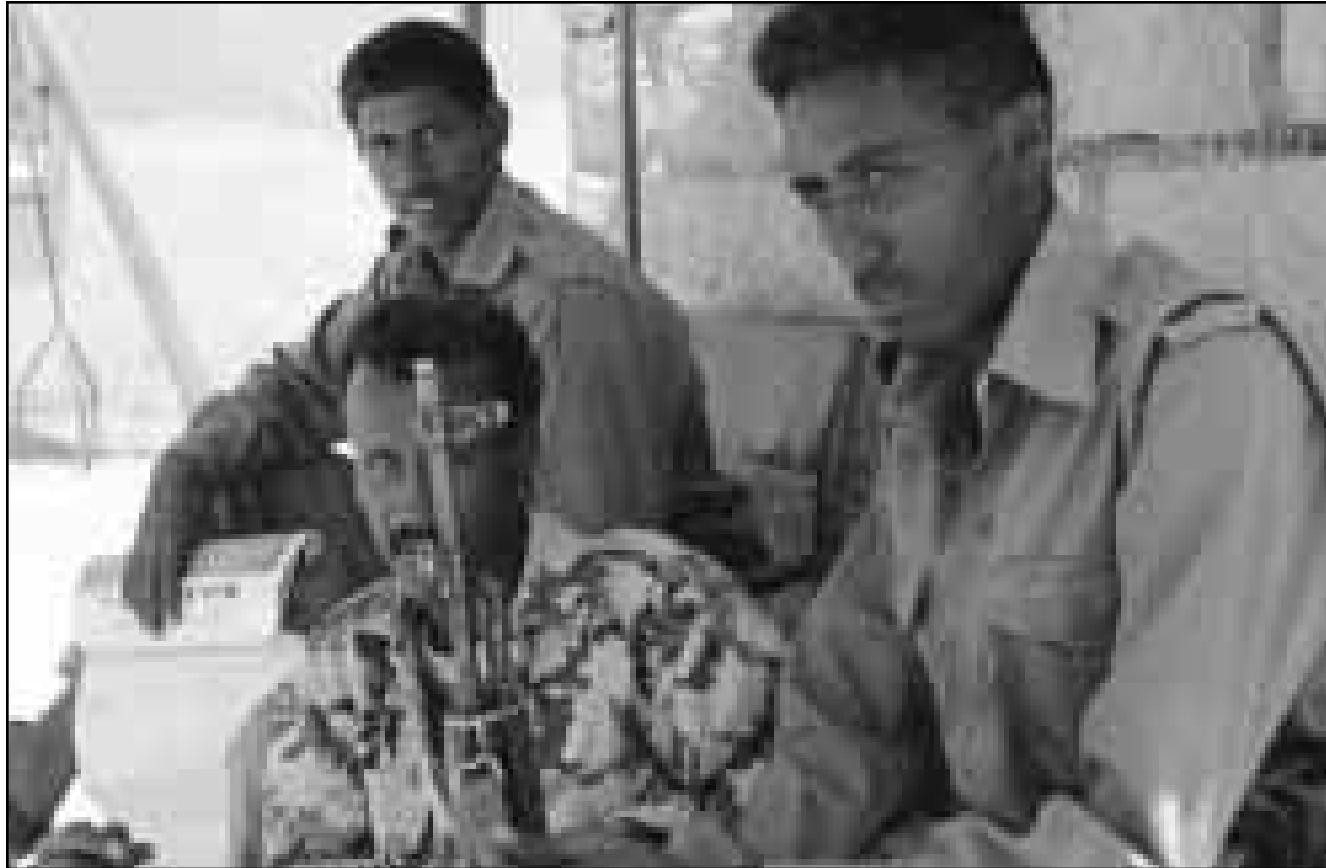
جنود اريتريون في منطقة حدودية مع اثيوبيا