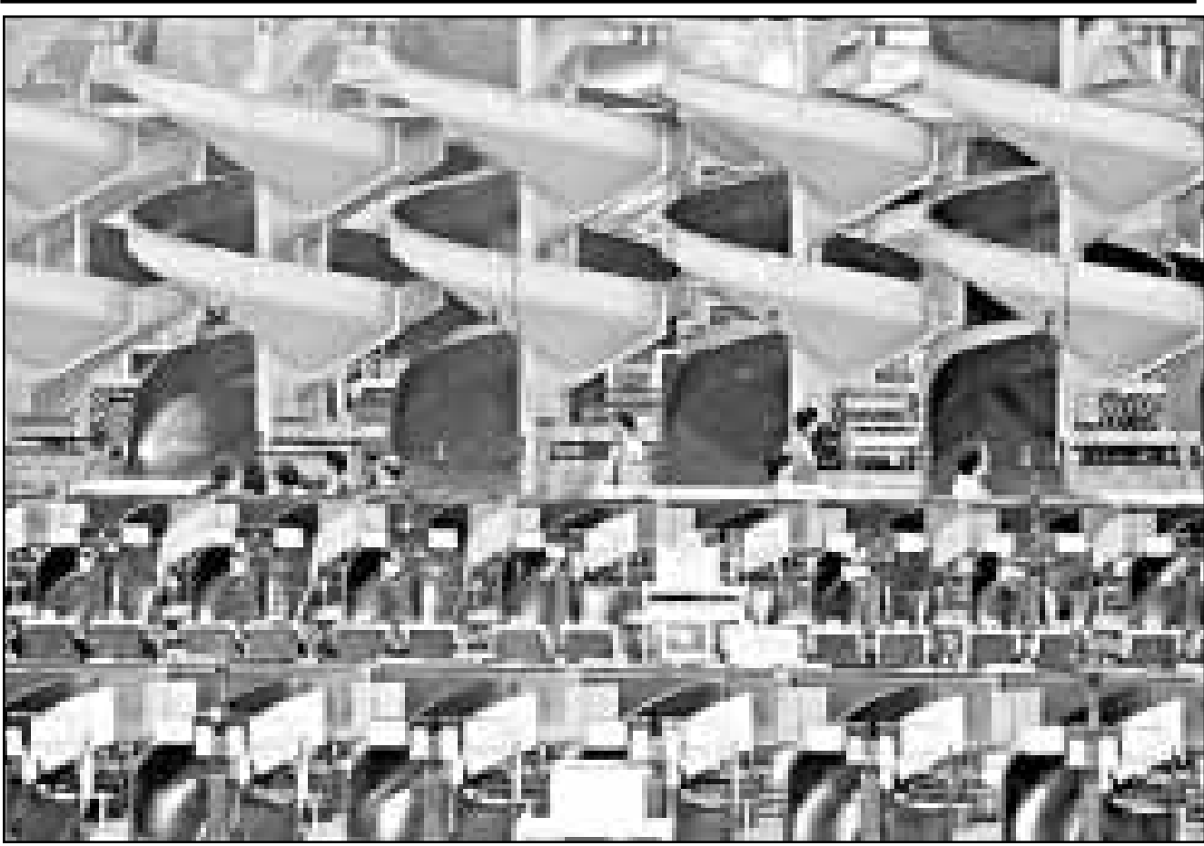
مركز تصنيف البريد في مطار تشك لاب كوك في هونغ كونغ والذي افتتح امس وبلغت تكلفته انفاشه قرابة 72 مليون دولار امريكي. ويستعمل هذا المركز التعامل مع 548 الف رسالة وطرد يوميا

واضافت «الجميع متفقون على انه اذا ضعف اللين كثيرا فان الخطر المقبل سيكون الصين»، وتقول «السؤال هو معرفة كيف سصرف اللين مقابل الدولار الذي يدفع اليابان وسائر اسيا الى الارتفاع ويجبر الصين على تخفيض عملتها».