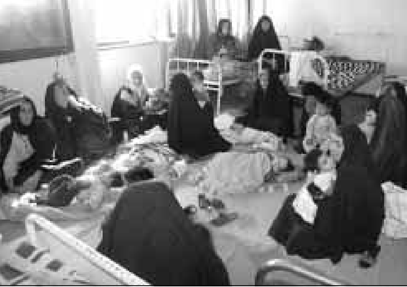
امهات عراقيات مع أطفالهن في مستشفى صدام ببغداد

التغذية اصاب ال 37 في المئة من معاقين بدنيا ونهني. يتعلم الاطفال توجيه اللوم الى الولايات المتحدة. قال ايمن وهو في العاشرة «لا أحب امريكا. يقولون لنا في المدرسة انها تحارب شعب العراق». وفي 1998 التحق بالتعليم الابتدائي 87 في المئة ولكن الغالبية لم تذهب الى المدارس. فالتت فرنانديز «الوضع في قطاع التعليم يثير القلق بدرجة كبيرة. بين 1998 و1999 جيل بأكمله من تلاميذ المدارس الابتدائية تعرض للضياع. وهذا يعني ضياع الجيل القادم في العراق». ويقول مسؤولو اغائة ان سوء