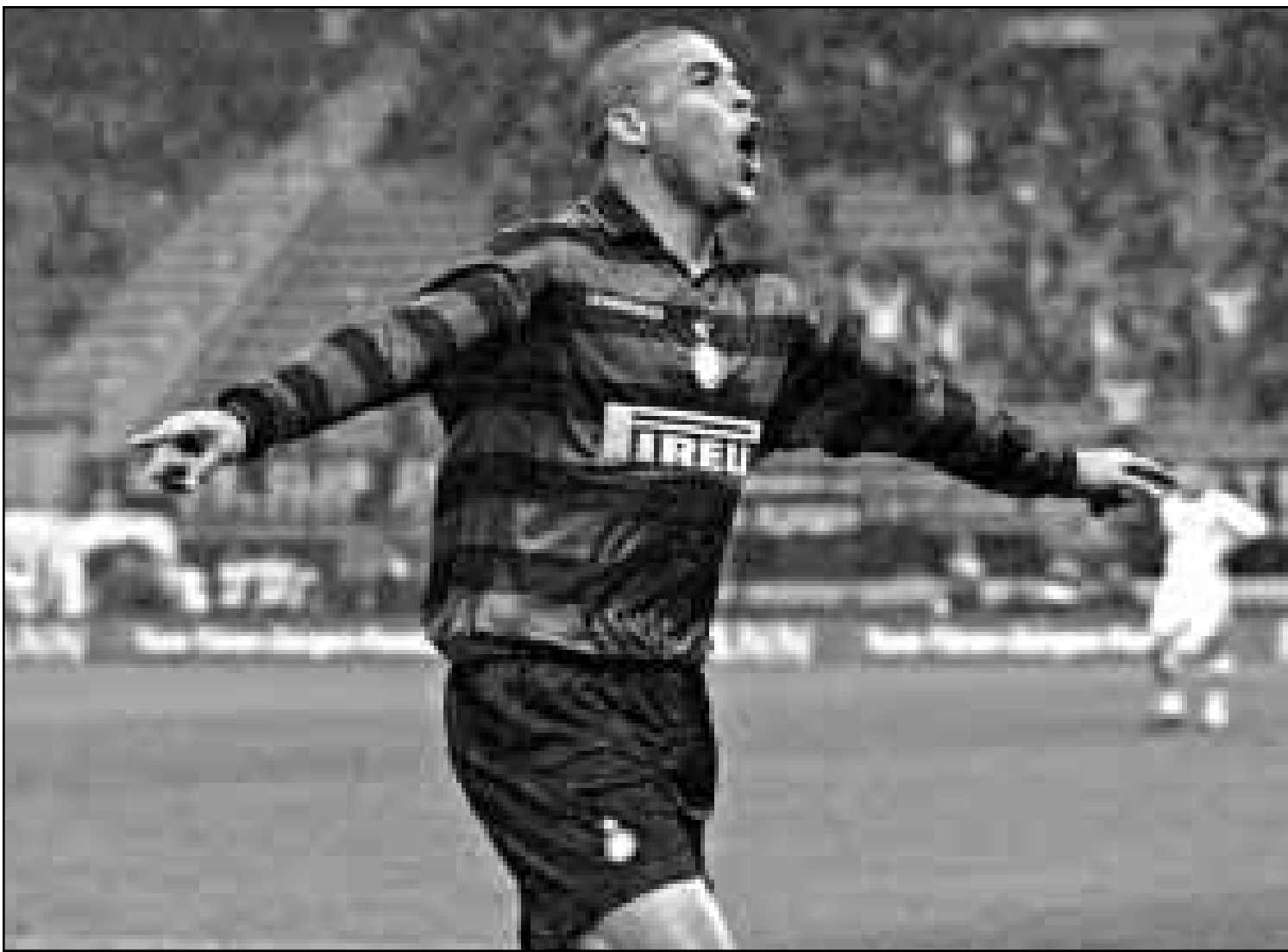
رونالدو في لقطة من إحدى مبارياته

الذي صرح لجنة برازيلية في شباط (فبراير) 1996، في 1997 احرز على كأس العالم وابقى في صفوف النادي الايطالي كرويا الجنوبية-اسبانيا هذه الفترة على البطولة الايطالية وكأس القارات وغيرها... وقال في موقع آخر: «ريد ان اترك بصمتي على تاريخ الكرة وكوني لاعب كرة قدم فقط لا يرصيني». المرافق الذي كان لا يملك ثمن تذكرة قطار للسفر في مدينة ريو اصبح اليوم يتجول بين «هايندوفن» الهولندية و«برشلونة» الاسبانية و«ميلانو» الايطالية وانفقت حساباته البنكية بما يشبه الحلم ويكاد يذوق نكريات «داداو» الى الابد ويما يتحقق له ذلك عندما يحصل على كأس العالم في 12 تموز (يوليو) المقبل وعندما يتزوج بحبيبته «سوزانا» في آب (أغسطس).