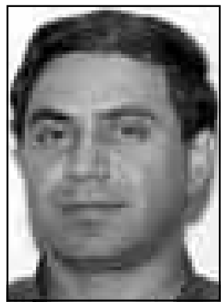
احمد الشهاوي (القدس العربي)