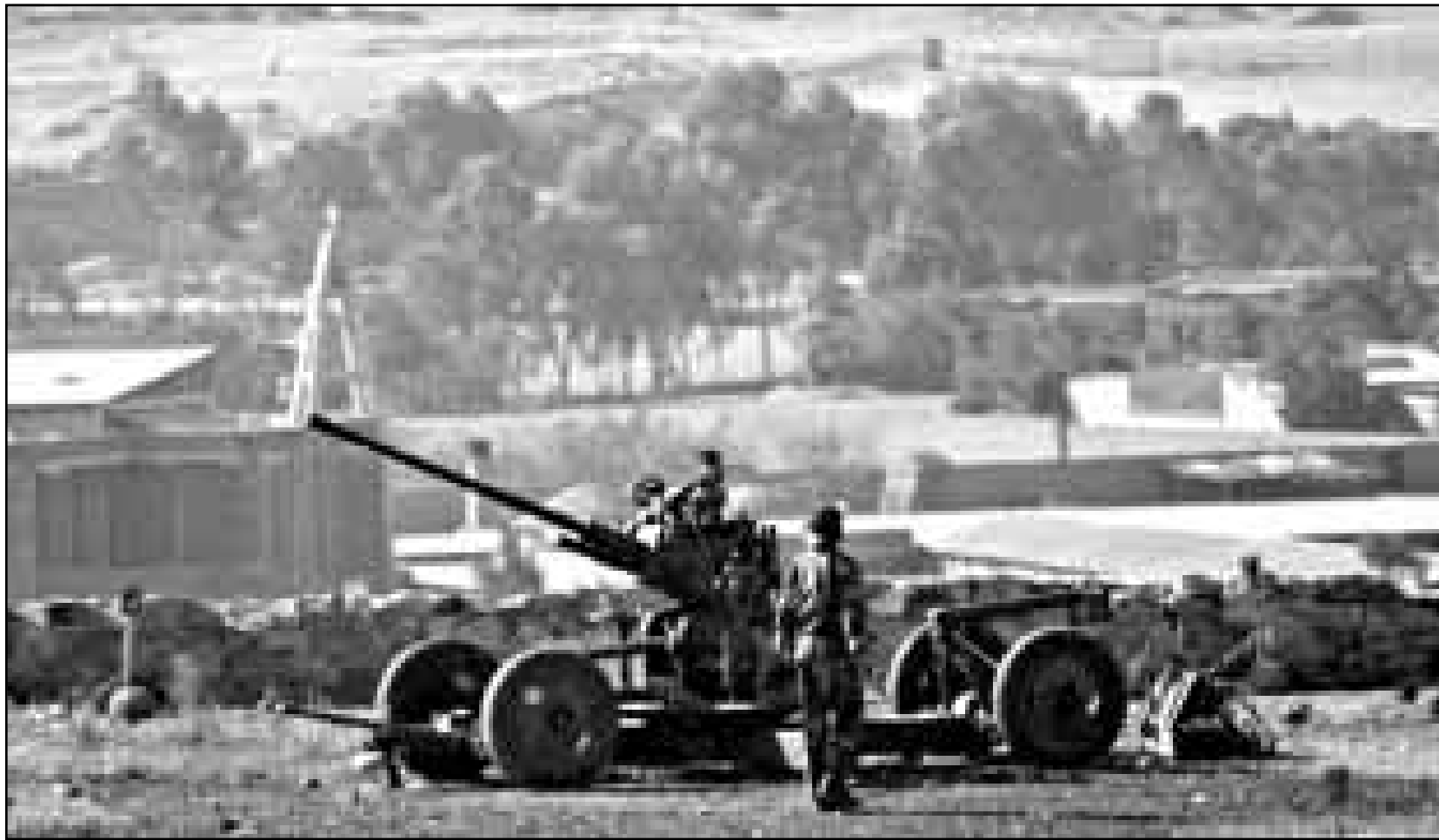
جنود اريتريون في موقع حدودي

■ اسمره - رويترز: وقفت اثيوبيا واريتريا الثلاثاء عند مفترق طريقي السلم والحرب فاصا تصعيد الحرب الحدودية الدامية بينهما واما الاستجابة الى نداءات السلام. ودعت اريتريا الاثنين الى اجراء حوار مباشر مع جارتها اثيوبيا في محاولة لحل النزاع الحدودي المتكثف في القرن الافريقي. وهذه هي اول مرة يدعو فيها أي من الطرفين لاجراء حوار مباشر لكن مراسلي رويترز على جانبي الحدود المتنازع عليها اكدوا استمرار حالة التأهب بين قوات الجانبين منذ اندلاع القتال بين الجانبين في السادس من ايار (مايو) على منطقة صحراوية تقع بين البلدين. وفي اشارة جديدة الى تدهور الموقف بين البلدين قالت محطة اذاعة خاصة في اثيوبيا الليلة قبل الماضية ان اريتريا طردت اكثر من 3000 اثيوبي وصادرت ممتلكاتهم. وتذكرت المحطة الاناعية نقلًا عن السلطات الاثيوبية ان نحو 2000 اثيوبي طردوا من العاصمة الاثيوبية اسمره بينما طرد الف اخرون من ميناء عصب الاثيوبي المطل على البحر الاحمر.