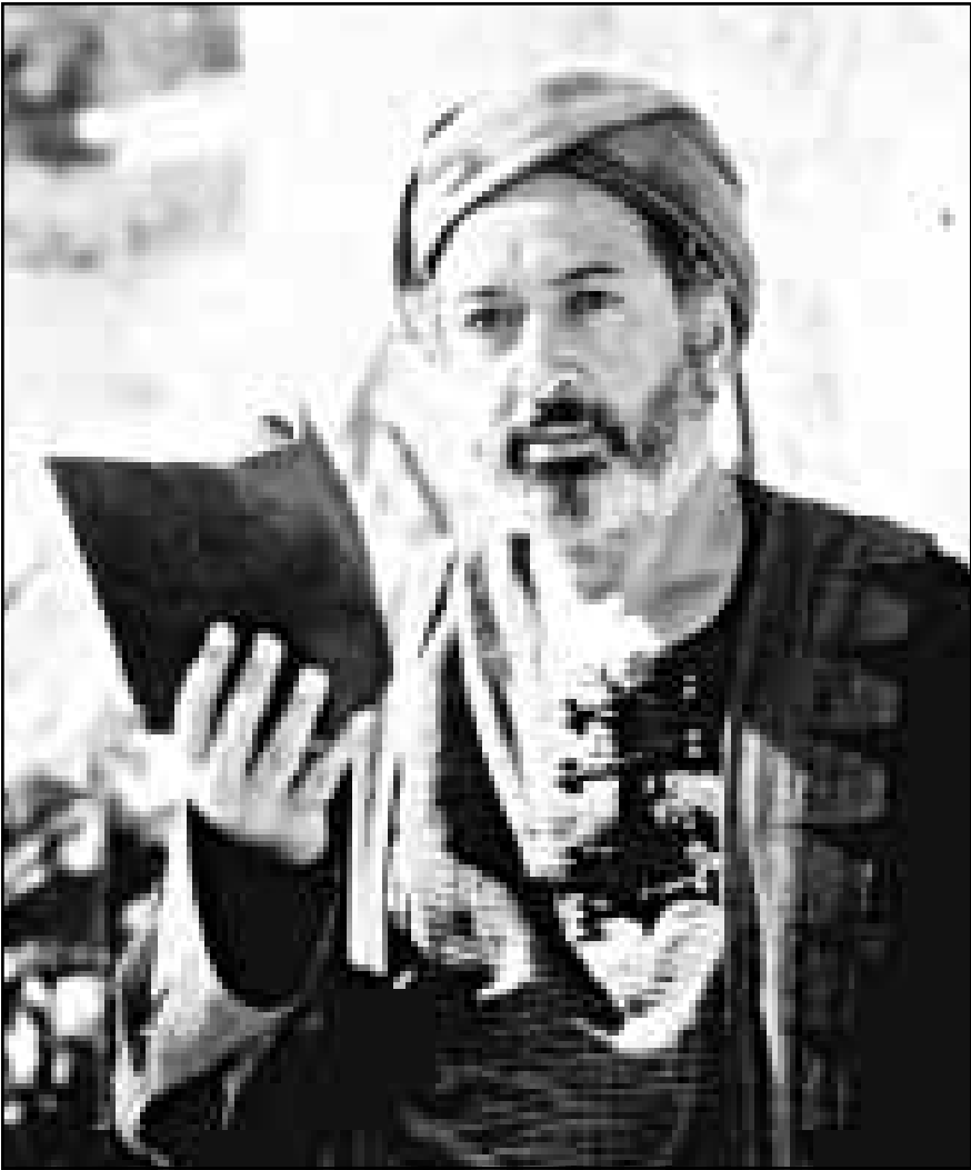
نور الشريف في «المصري» ليوسف شاهين

واين هو الانتاج المشترك بين الدول العربية؟