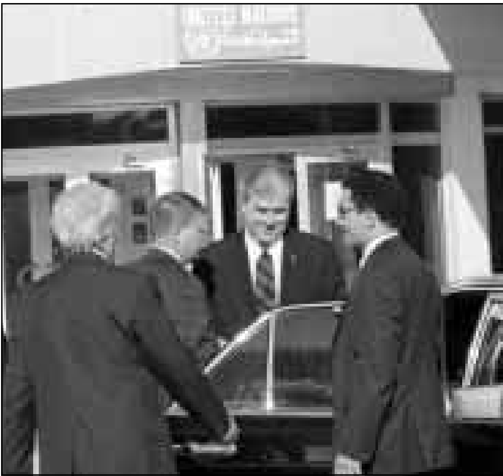
بتلر بين مساعديه في زيارة سابقة لبغداد

وفي مقابلة نشرتها الاثنين صحيفة «ليبيريان» الفرنسية، وصف بتلر