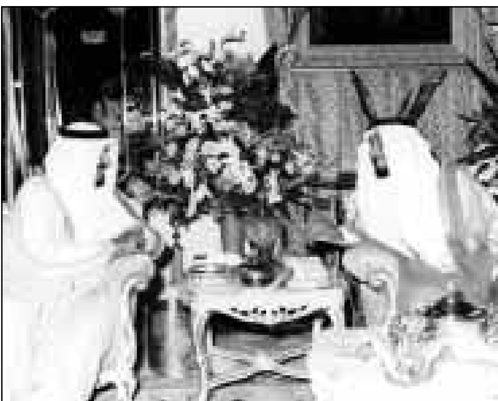
الشيخ زايد مستقبلا الامير سلطان في ابو ظبي امس

■ صنعاء - أف ب: دعت المعارضة اليمنية الاثني عشر حزبا لالتظاهر احتجاجا على «سياسة القمع» التي تعتمدها السلطات العسكرية في جنوب اليمن حيث اندلعت اضطرابات يوم الجمعة الفائت. وجاء في بيان مشترك لاحزاب المعارضة الخمسة في اليمن «اننا ندعو كل فروع الاحزاب في عدن والفعلليات الاجتماعية والشخصيات التي تدعمها لاجتماع لندراس الأوضاع المتردية في محافظة عدن والارتفاع بمسؤولية الدفاع عن حقوق مواطنيها ومصالحهم بشئى الوسائل». وأضاف البيان «اننا ندعو المعارضة الى الاحتجاج القانوني ومن ضمنها المسيرات الشعبية المضطربن الاجتماعية الاحتجاجية السلمية على سياسات القمع المرتفع، وبلغ معدل التضخم السنوي حاليا 90 في المئة».