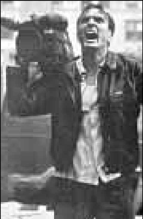
لقطة من فيلم غودزيلا