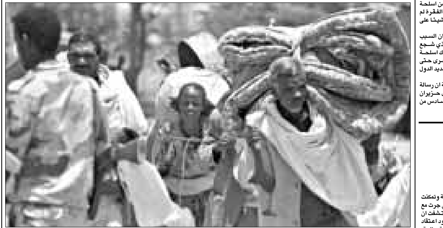
اريتريون يهجون مدينتهم الحدودية زالايسا هربا من المعارك التي تجددت أمس

الموقف التي كانت عليها في 12 ايار (مايو) الماضي. وأضاف ان الاريتريين «كانوا مهندسي الأزمة» وعليهم الان ان يكونوا «مهندسي الحل». ومن جهته اعتبر الرئيس اريتريي سياسيا افورقي أمس الثلاثاء ان اريتريا «لها الحق المشروع في الدفاع» عن اراضيها، نافية بذلك في تصريح الى هيئة الاذاعة البريطانية «بي.بي.سي» المعلومات التي اشارت الى مهاجمة قواته مدينتي زالا انبيسا الاثيوبية الحدودية. وقال افورقي لاذاعة «بي.بي.سي» التي نقلت بثها في نيروبي «لا نعتمد مهاجمة أي مكان في اثيوبيا، ولكن لنا الحق المشروع بالدفاع عن اراضينا وعن أنفسنا». وأضاف «لنوي قط ان نتقدم أكثر من ذلك في اثيوبيا. عهدنا اللبنة تدخل في موقع المفاوضات الاعتراف لوضعنا في موقع المعتدي».