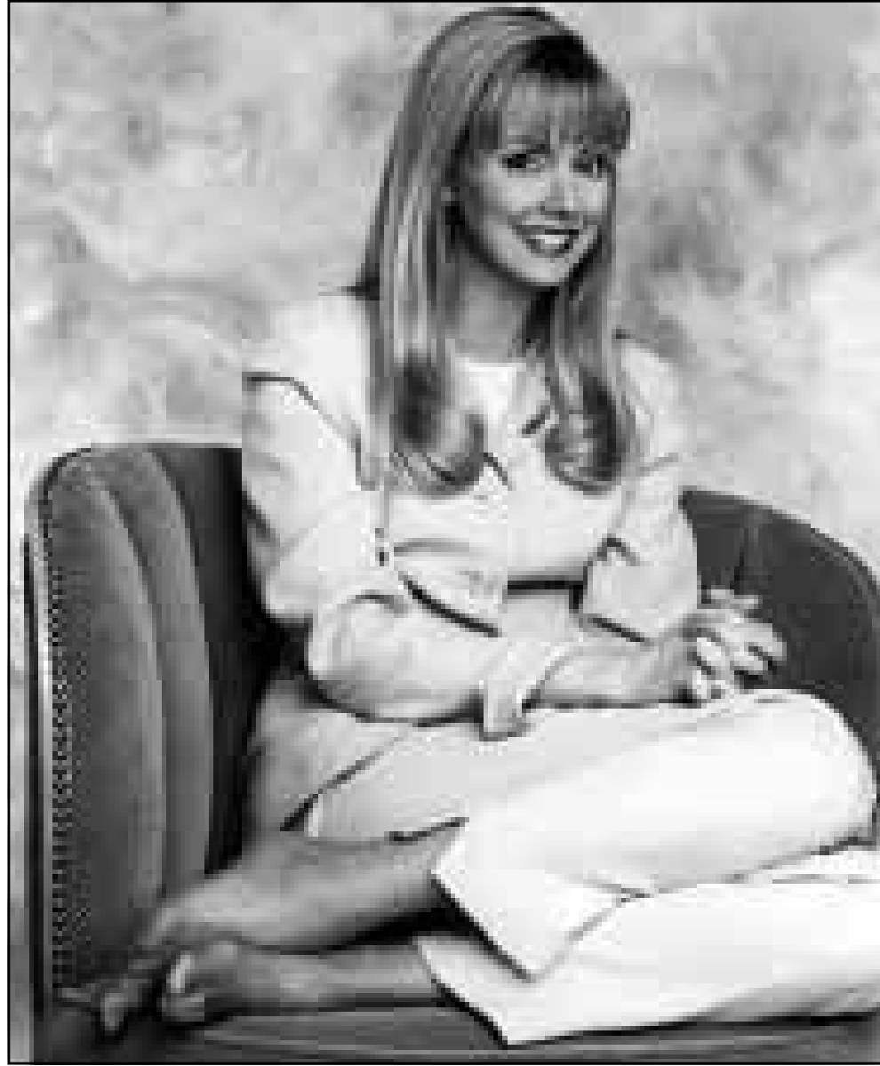
الممثلة شيلبي لونغ بطع مسلسل «كيلي كيلبي» الجديد.

تايسون لهما ابنة تدعى جوليانا تبلغ الثالثة عشرة من عمرها. حتى اليوم اقتصر خبره شيلبي المهني على الاطفال على الافلام وليس في المسلسلات التلفزيونية التي تصور امام الحضور في الاستوديو. وثمة أنظمة تحدد الساعات التي يسمح للاطفال العمل فيها على البلاطو، وتقول شيلبي، المنتجة التنفيذية للمسلسل الاضافة الى كونها نجمته، ان صنع برنامج خلال ثلاث ساعات من الامور المستحيلة، ويتوجب عليك ان تصور مسبقا مشهدا او مشهدين وتعرضهما على الاخرين لكي يتمكنوا من استشفاف ما يجري. كما ان الممثلة لا تكن مستعدة للناحية البدنية لدورها، فكيلي توفاك تجد نفسها في اسرة مؤلفة من شبان اشداء واخت مسترجلة، وكلهم رياضيون، وقد كسرت شيلبي اصبعها في موقع المسلسل وهي تحاول ان تمسك بالكرة. شيلبي، وهي من فورست واين بانديانا درست التمثيل المسرحي في جامعة نورثوسترن وتعلمت التوقيت الكوميدي في فرقة سيكوند سيتي في شيكاغو. وقد ساعدها ذلك على بداية سنواتها الخمس في العام 1982 لتسجل مع مديري شركة المخرجين في إحدى حانات بوسطن تدعى «تشيرز». وتذكر شيلبي انه «في بداية الموسم السؤال الذي طرح علي تكراره، كان: ما هو شعورك كونك في ادنى درجات سلم التصفيات. «وكنت اقول لهم الحقيقة: شعورنا ممتاز تجاه العمل الذي نقوم به، هذا هو سبب وجودي هنا، ولعل جوانبي هذا كان سانجا ولم يخطر ببالي قط انني لن اكون هنا لو ان تلك التصفيات استمرت ولو لم يزل المسلسل التاييد الكافي». رئيس شركة البرامج NBC براندون تارتكوف لم يبيأس، وتغيرت حظوظ المسلسل بعد فوزه بخمسة من جوائز «إيمي» التلفزيونية، بينها جائزة افضل