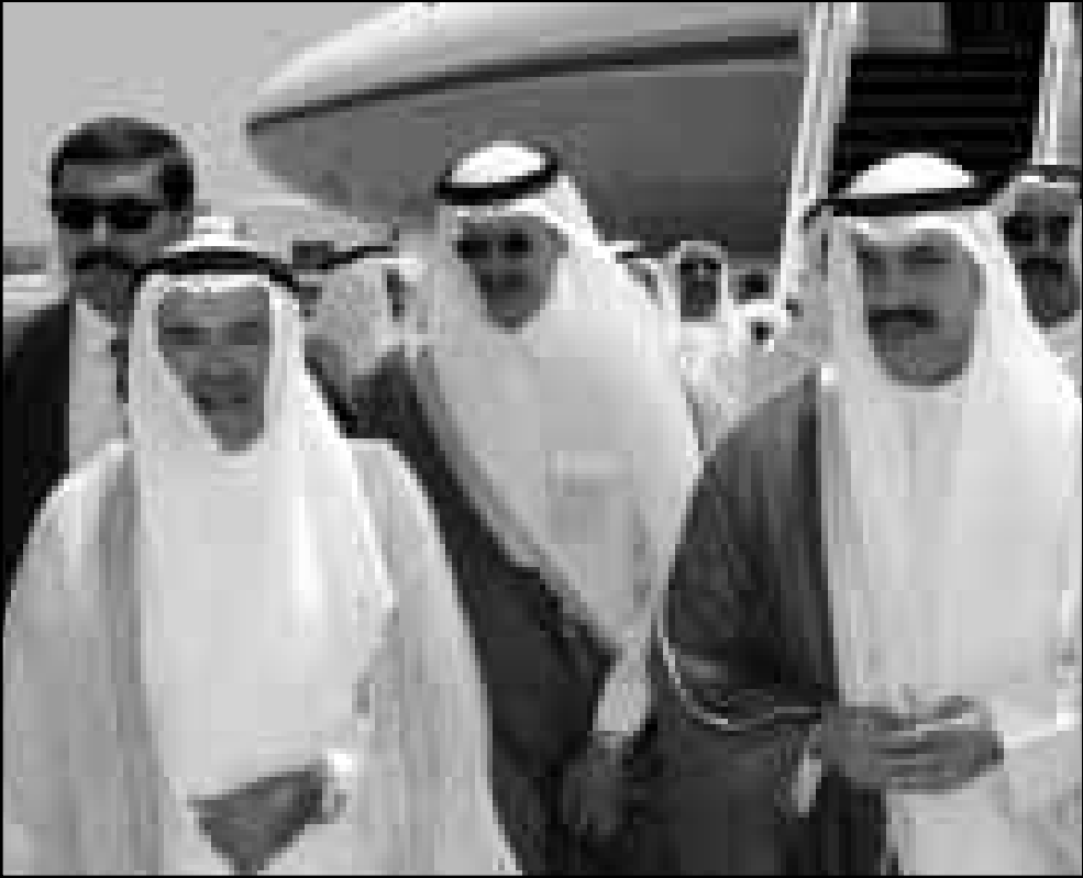
وزير النفط السعودي علي بن ابراهيم العييمي (يسار) بعيد وصوله لعمان في الكويت على رأس وفد كبير يضم نائبه الامير عبد العزيز بن سلمان (وسط) لاجراء محادثات مع وزير نفط الشيخ سعود ناصر الصباح (يمين)

عقودها وتقليص حجم المشروعات الجديدة وتأخير النظام الصرفي. ورغم التخفيضات يتوقع الاقتصاديون ان يحقق الاقتصاد نموًا طفيفا.