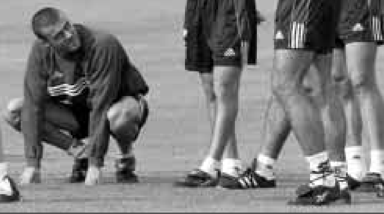
لويس ازيكوب قلب هجوم منتخب اسبانيا خلال التدريب

يأتي من كل مكان... وسئل قائد المنتخب الاسكتلندي كون هينري عما اذا كان يرى كوايس قبل مواجهة ورنالدو فاجاب «لا احلم بكرة القدم فانا متزوج ولدي ثلاثة اولاد، وقد لعبت امام افضل المهاجمين في العالم وكان اخرهم الكولومبي فاستينيو اسبريرا.. والمباراة هي الاربعة بين البرازيل واسكتلندا في نهائيات كأس العالم، وسبق لهما ان تعادلا صفر-صفر في افتتاح مؤنديل 1974 في المنيا، وقازت البرازيل 1-4 في اسبانيا 82، و-1 صفر في ايطاليا 90.