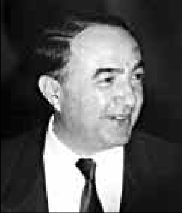
الحبيب بن يحيى

يبدأ وزير الدفاع التونسي الحبيب بن يحيى يوم الخميس عشر من الشهر الجاري زيارة للولايات المتحدة تستغرق اسيوعا يجري خلالها مباحثات مع وزير الدفاع الامريكي وليام كوهين بعد اربعة ايام من وصوله.