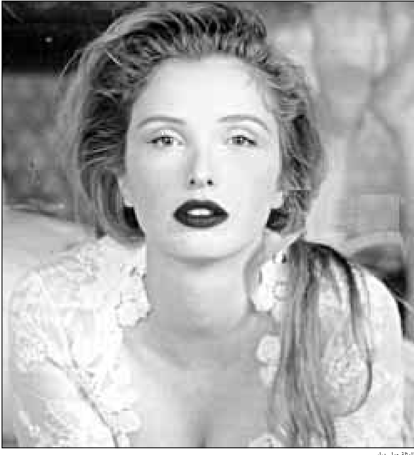
الممثلة جولي ديلبي

جذبتني رجال شقيون وغامضون، في الوقت الذي لست فيه غامضة. ■ الذئب يأكل قلب الاخر من اجل ان يتخذ حياته. روحية التضحية هي احدى مفاتيح الزوجين. ■ ولكن التخلي عن ذاتي، في مجتمع مائل، وفي مهنة مثل مهنتي، شيء مستحيل. واتساءل لو كان الزوجان يعبران عن عناء معاش والسؤال الجوهري هو: هل نخاف من علاقة دون ان نلتهم بها الاخر؟ انني اطرح هذا السؤال كثيرا. ■ هل تعلمين لكونك محبوبة؟ ■ الممثل حالة مرضية. كل الناس يريدون بشكل الجيران او صاحب المحالوت في الحارة او بقية البشر في الكوكب. ■ هل ان زي العرس في الفيلم يجعلك تحلمين؟ ■ لا اري نفسي امرأة متزوجة ولا ينبغي ان اجد رجلا صلبا بالنسبة لـ«هاوين» تنكرت بزى العروس، ولكن العروس المغتصبة والمقتولة. ■ ألم تضجري من التعري؟ ■ لا يظهر من جسدي سوى ثديي واعتقد بانهما شهيين؛ لدي من العمر عواما اخرى بامكاني ان اظهر فيها جسدي عاريا. ■ ولكن ما كان يزعجني هو مشهد ممارسة الحب الذي يشبه رياضة «الجملاستيك». ■ يبدو ان افلامك القادمة ستكون ذات اثارة كبيرة. ■ يمكن القول ستظهر فيها العضلات. اظهر في هيئة فتاة خفيفة في فيلم «لوس انجليس دون خريطة» مع الممثل جوني ديب. وكذلك كفتاة محرومة جنسيا في فيلم «العاطفة» الي جانب الممثل بيتر فوندا. واظهر كذلك كعاهرة في اول فيلم لكاتب سيناريو فيل (Mars attacks). ■ انت امرأة مغرية. ■ لقد عانيت في حياتي لكثي تعلمت ان احب. انني اكثر انفتاحا، ويهتم بي الاخرون، وهذا يعني انني اكثر سعادة، ولست معنية بالامجاد والسلطة والعاطفة المطرقة وهي غير مفيدة.