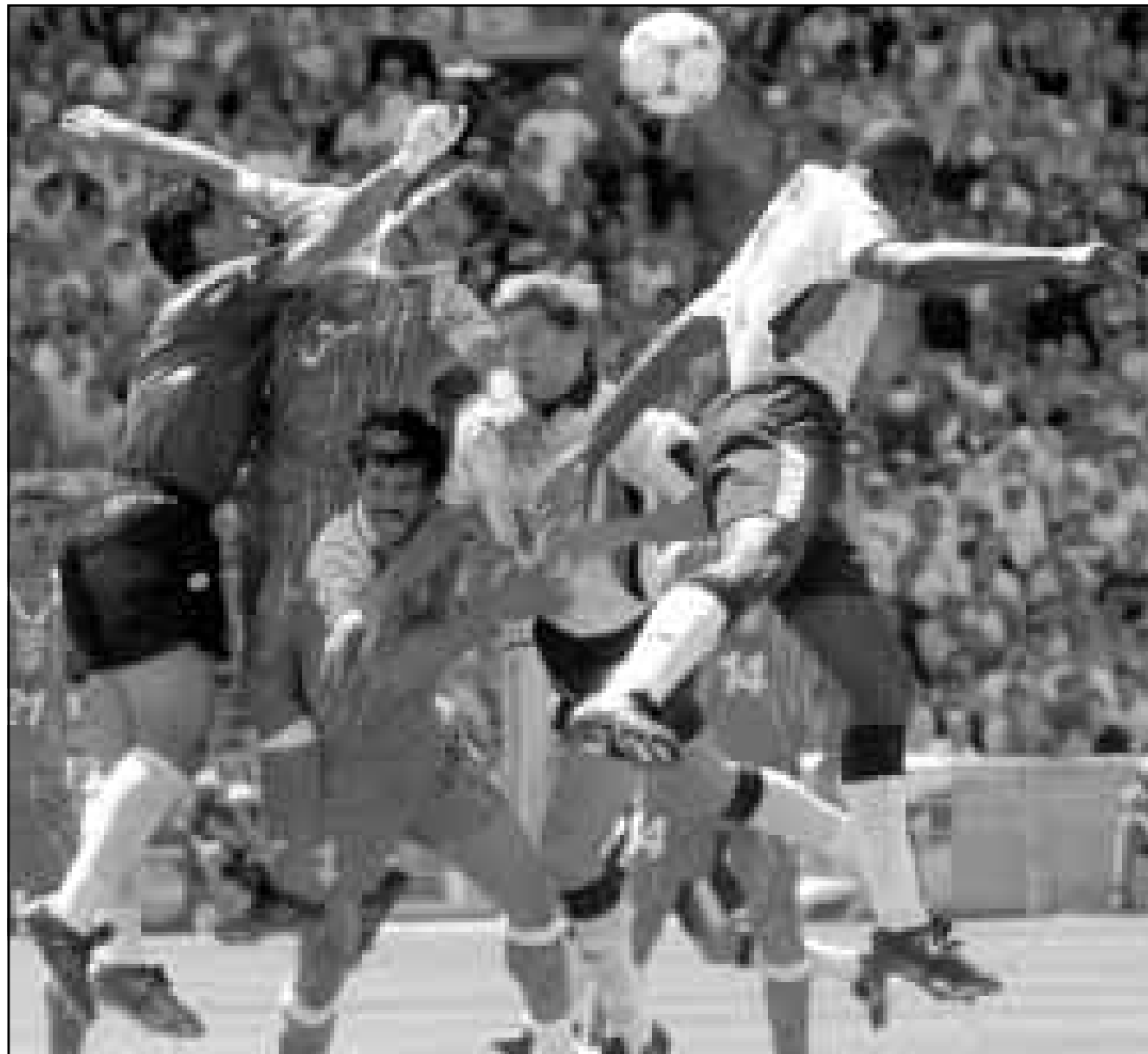
بول سكويز يسدد الهدف الثاني في مرمى تونس (الى اليمين) .. وفي الصورة الثانية سول كامل (الاول الى اليمين) وتوني آدمز (رقم 5) الثاني من اليمين يشارك أعضاء المنتخب التونسي شكري العوير وسامي طرابلسي ومينير بوكريدة حالة (لخبطه) حول الكرة