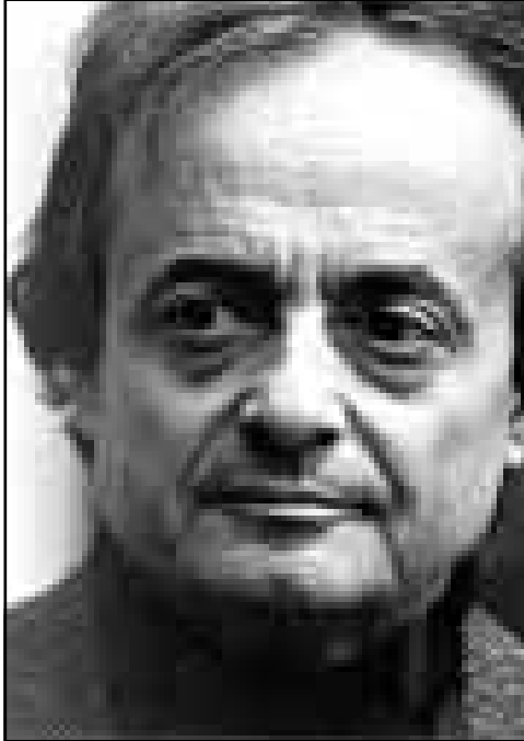
أدونيس (القدس العربي)

توقفي عن الحياة، انا امارس كتابة الشعر لكي احسن ممارسة الحياة، لكي استطيع ان احلم، لكن ممكن ان اعطي ذات يوم الحرية لاصابعي بان تقوم بأعمال يدوية واتوقف عن الكتابة بقرار معين.