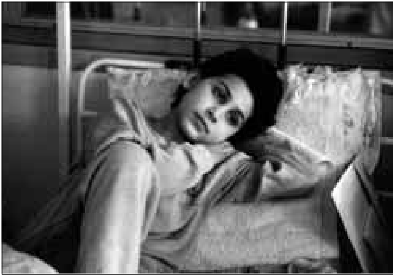
فتاة عراقية مريضة في مستشفى بغداد

■ بغداد - من فاروق شكري: أعطى رئيس اللجنة الدولية المكلفة نزع السلاح العراقي ريتشارد بتلر أمس الاثنين إشارة الانطلاق لما يمكن أن يكون المرحلة الاخيرة من عملية نزع السلاح العراقي، معربا عن ثقته في امكان رفع الحظر النفطي المفروض على العراق في تشرين الاول (أكتوبر) المقبل.