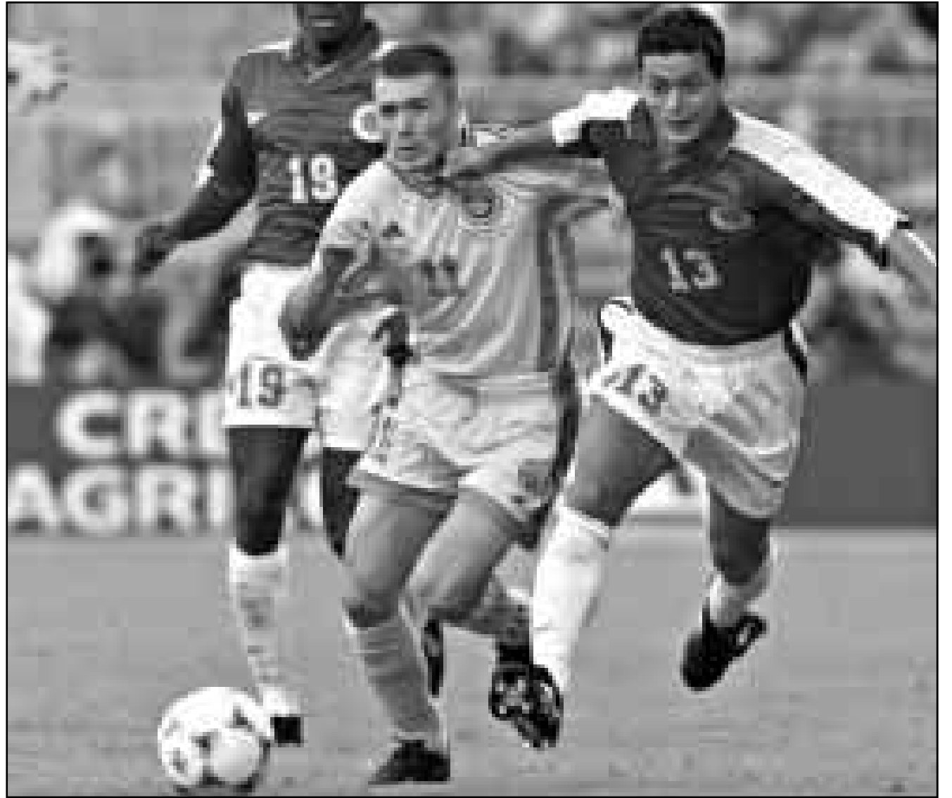
لقطعتان من مباراة رومانيا وكولومبيا أمس والتي فازت فيها رومانيا 1/صفر ضمن مباريات المجموعة السابعة وسجل الهدف ايربان ايلي في الدقيقة 45