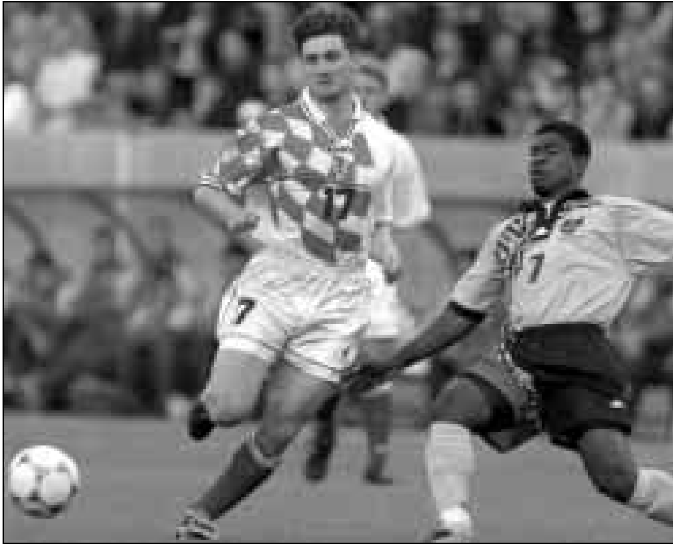
فدم منتخب كرواتيا الذي يشارك لأول مرة في نهائيات كأس العالم عرضاً ممتازاً خلال مباراته مع منتخب جمياكا (الذي يشارك لأول مرة أيضاً) - والصورتان تملان مراحل من المباراة التي أسفرت عن فوز كرواتيا 3/1