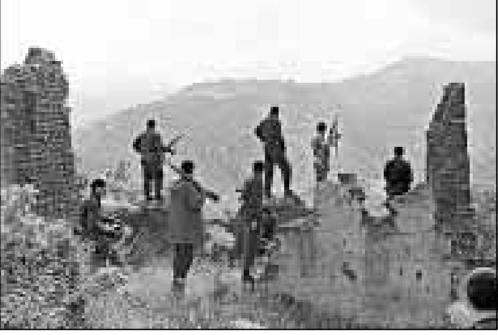
عناصر من «الوطنيين» الذين جندتهم الحكومة الجزائرية عسكريا في السنوات الاخيرة. قريبا ستلتحق بهم شركات خاصة (ارشفيف القدس العربي)

ويحظر إنشاء هذه الشركات والعمل فيها بحسب مشروع القانون - على «الحزب» (الجزائريون الذين كانوا عملاء للجيش الفرنسي اثناء حرب التحرير بين 1954 و1962) ومن صدر في حقهم حكم قضائي او اضطروا للعلاج في مصحات لامراض العقلية.