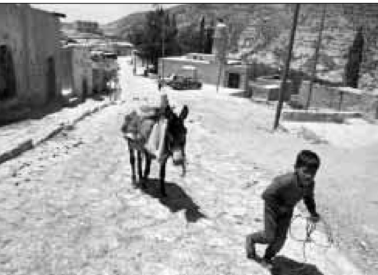
طلل اردني ياحد اترقة قرية دانا الاردنية حيث اقيمت اول محمية طبيعية

ومن جهته اعرب اليوسفي عن الامل في ان يتسجع نطاق التعاون الثنائي