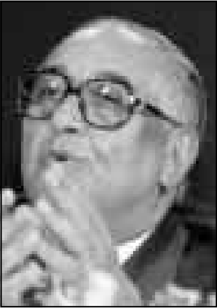
عبد السلام المجالي

انضمت شخصيات سياسية متنفذة في الدولة الأردنية بشكل رسمي أمس الأول إلى صفوف اللجان التحضيرية لمؤتمر وطني عام يستعده أطراف المعارضة في الشهر القادم، وشهدت اجتماعات اللجان أمس الأول قراراً جريئاً بانضمام كل من طاهر المصري وأحمد عبيدات رئيسي اللجان الأسياسية إلى اللجنة التنفيذية لجهة سياسية عريضة تمثل أطراف وأحزاب المعارضة. وقررت اللجنة التحضيرية للمعارضة عقد مؤتمرها الوطني العام في يوم 25 من شهر تموز (يوليو) في محافظة العقبة، وكان أهم تطور حصل أمس الأول إعلان انضمام المصري وعبيدات رسمياً للجان المعارضة، وكان الأخوان قد اتخذوا مواقف متشددة من عملية السلام، لكنها المرة الأولى التي ينضمان فيها رسمياً إلى أجناب تحضيرية تخطط لعقد مؤتمر وطني عام للمعارضة. ويؤشر هذا الاستجد على تطور واضح في استقطاب المفكرين مع المعارضة بعد أن ابتعدا مؤخراً من تشكيلة المجلس، وخلال أيام قليلة سيترافقان مع الكتل البرلمانية بهدف خلق حالة استقطاب ثنائية سياسية لتفادي الطغيان الجديد التي تصر الحكومة على إصداره في الوقت الذي ترفضه فيه الأسبسية قوى المعارضة، والقوى السياسية وقطاع الصحافي، ويغرض هذا القانون شروطاً متشددة على ترخيص الصحف، وتوسع في قاعدة العقوبات على الصحافة والصحافيين. وحتى الآن تتبع الحكومة سياسة «المشاورات الجارية على (الموائد)» لإقناع النواب بقانونها للصحافة، وذلك جنباً لتخوض نقاشات ساخنة داخل قبضة البرلمان، ورفعية في تحقيق أكبر قدر ممكن من التأييد البرلماني قبل عرض القانون رسمياً لمناقشته تحت قبة البرلمان، وعقدت حتى الآن عدة اجتماعات بين الكتل البرلمانية