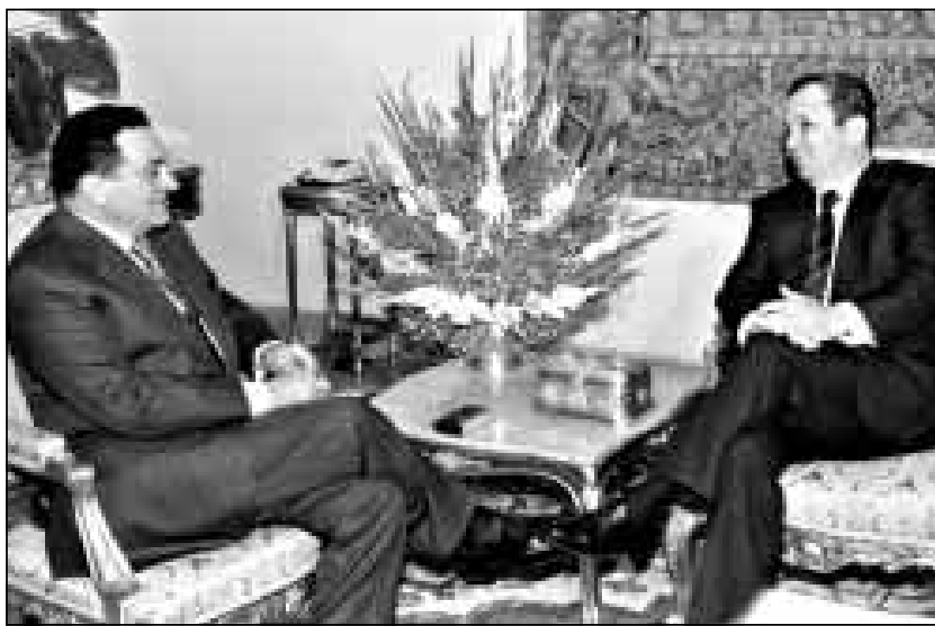
الرئيس المصري حسني مبارك لدى لقائه زعيم حزب العمل الإسرائيلي إيهود باراك أمس في القاهرة

مليشيات داخل المستوطنات يشكل «تحريضا على العنف ولعبا بالتر». وكان الجشيع الإسرائيلي أعلن الخميني الماضي موافقته على تشكيل وحدات من «الحرس المدني» داخل المستوطنات الكبيرة في الضفة الغربية. وتتألف هذه الوحدات من مستوطنين يتلقون تدريباً لدى حرس الحدود للقيام بدوريات ليلية ويسمح لبعضهم ببعض السلاح والقيام بعمليات توقيف. ويأتي القرار ردا على مطالبات المستوطنين منذ سنوات بتشكيل وحدات لضمان أمن المستوطنات ومد عمليات تسلل أو هجمات فلسطينية عليها. وكان يوسي بيلين المسؤول في حزب العمل سبق باراك إلى التظاهر المصرية حيث التقى مساء الأحد مع الرئيس المصري سامة الياز.