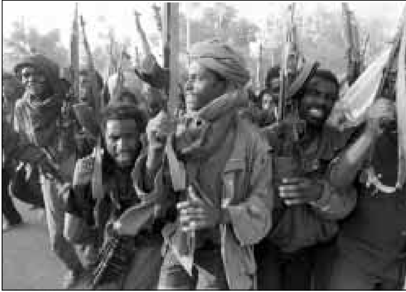
مقاتلون اريتريون على جبهة القتال (ارشيف)

■ اديس ابايا - اف ب: أكد وزير الخارجية الاثيوبي سيوم ميسفين امس ان اثيوبيا تؤكد ثقتها في خطة السلام الامريكية الرواندية وترفض تكاثر المبادرات السلمية. وقال الوزير الاثيوبي في مؤتمر صحافي ان «قمة منظمة الوحدة الافريقية التي عقدت في واغادغو اقرت خطة السلام الامريكية الرواندية مما يدل على ان افريقيا والمجتمع الدولي يعتبران ان على البلدين قبول الاقتراح وتسوية النزاع سلمياً، منذراً بانه لا توجد مبادرة اخرى منفصلة. وقال ميسفين ان «تعدد المبادرات سيعرض عملية السلام الجارية للخطر، موضحاً ان الحكومة الاثيوبية ترحب بما عرضته مصر من القيام بمساع حميدة لحل الازمة سلمياً. واضاف الوزير ان «الحكومة الاثيوبية لا تريد إعادة التفاوض بشأن خطة السلام ولا تفكر في الجلوس الى طاولة مفاوضات مع اريتريا الا بعد انسحاب الجيش اريتري من الاراضي الاثيوبية التي يحتلها حالياً. وتنص خطة السلام الامريكية الرواندية على انسحاب القوات اريتيرية من المواقع التي تحتلها في الاراضي الاثيوبية وتشكيل لجنة فنية لترسيم الحدود بين البلدين.