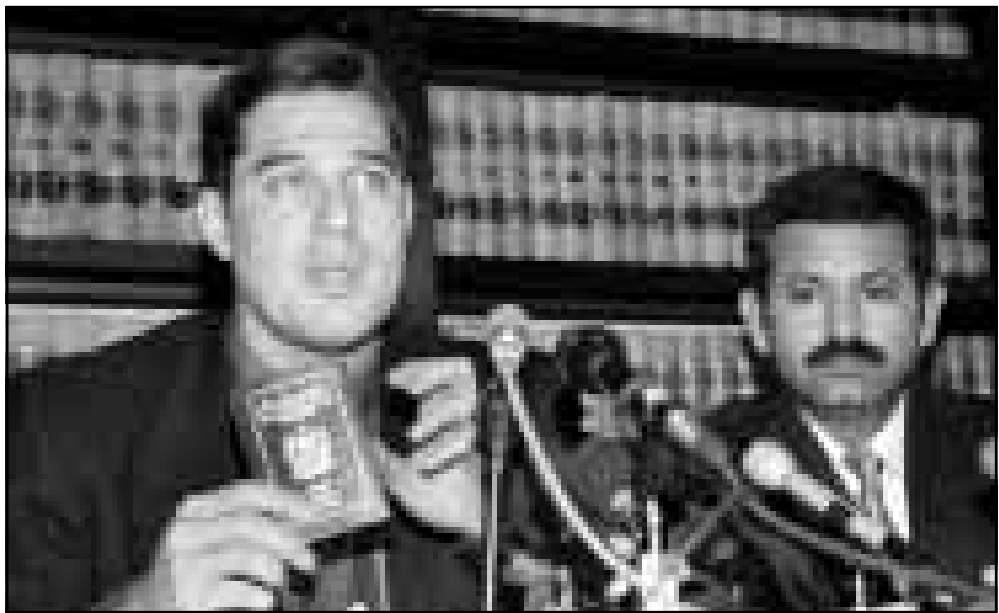
العالم النووي الباكستاني افتخر خان والي يمينه صحابه الامريكي مايكل ويلدز اثناء مؤتمر صحافي عقد مساء امس الاول في نيويورك

قطر حيث يقوم بزيارة رسمية، شدد شريف على ضرورة تطبيق خطة تقشف اقتصادي. ودعا مواطنيه القيمين في قطر إلى تحويل الف دولار إلى حساباتهم