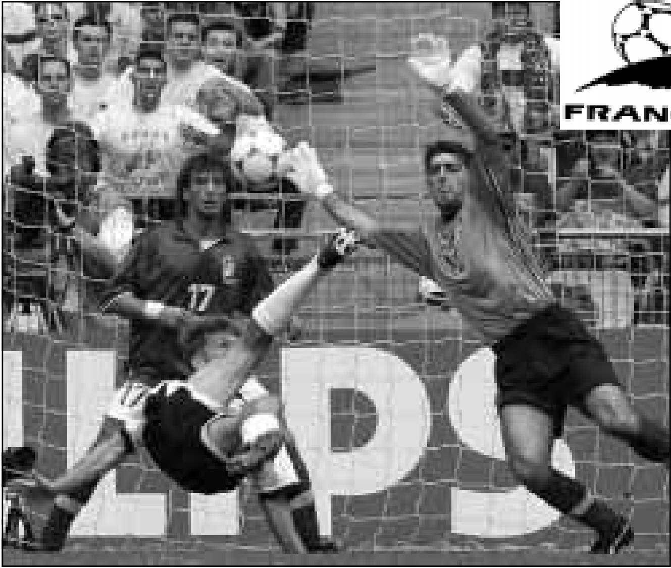
لقطة من مباراة إيطاليا ضد النمسا