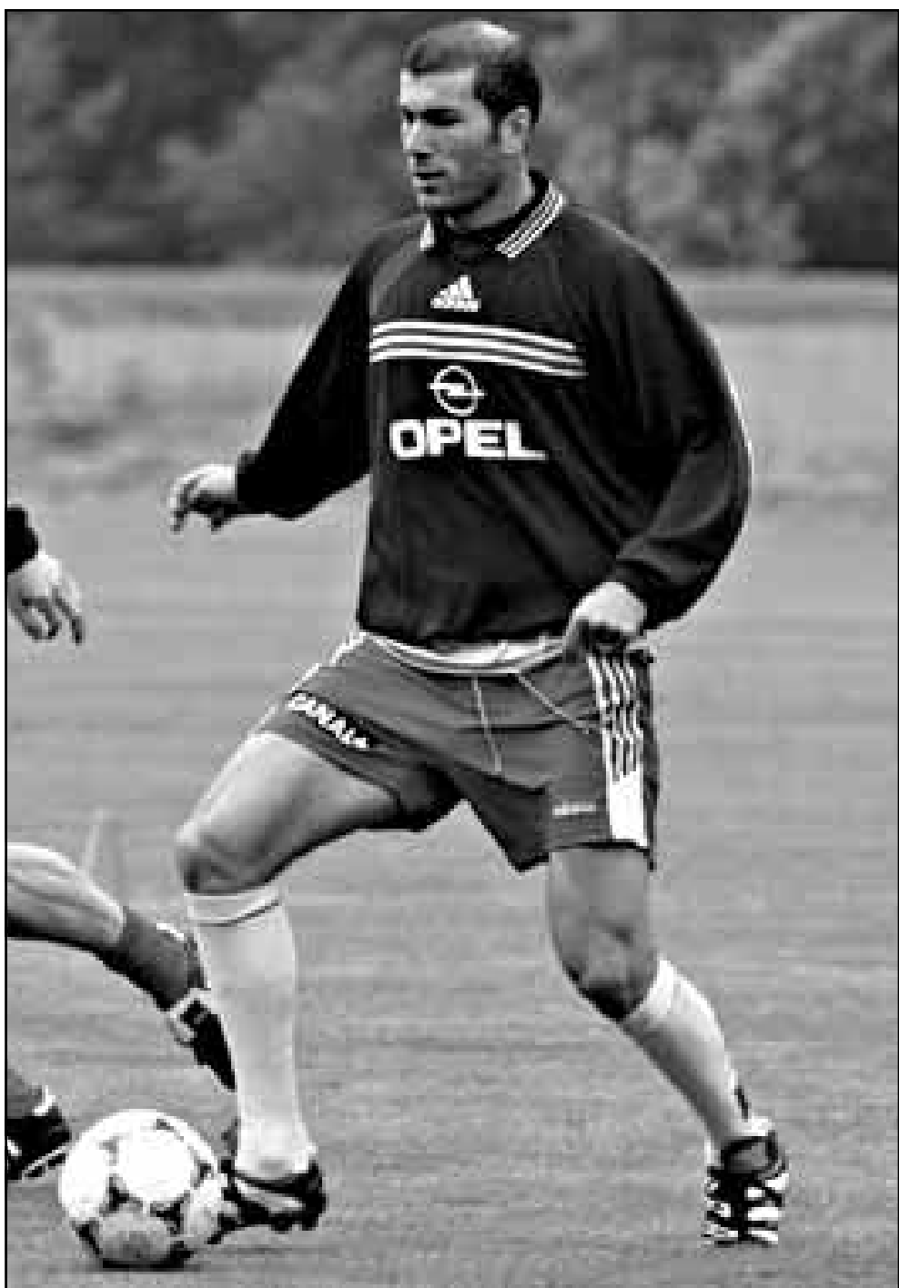
زين الدين زيدان

الاحتراف، ويبي عليه ان يلعب وياتي بالنتيجة الحاسمة، الساحرتين، ويبي عليه ان يلعب وياتي بالنتيجة الحاسمة.