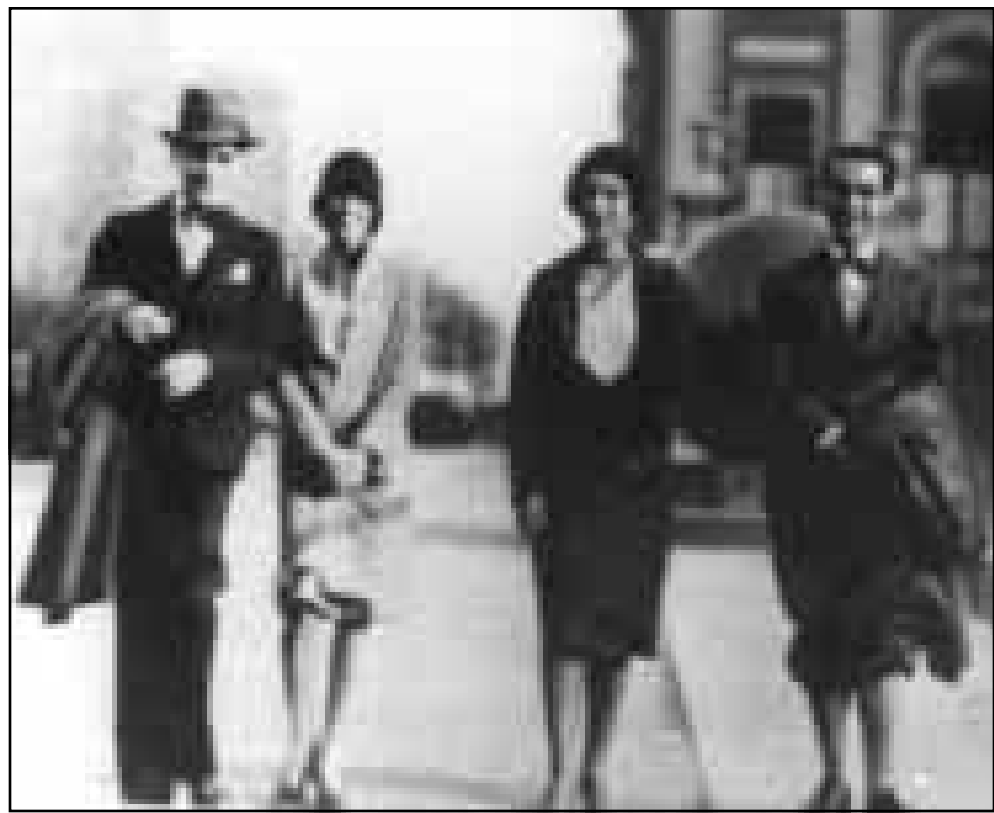
فدريكو غارسيا لوركا (اليمين) يتجول في احد شوارع نيويورك الغربية من جامعة كولومبيا مع عدد من الأصدقاء

3) اعتقد ان الشعر هو قسطنا من الانسانية، هذه الانسانية تتبدد الان بفعل الانظمة الكبرى للينيات الاجتماعية والاقتصادية الخ. وبفعل الكليات الغاهرة للذات والوجهة للفردي وبالنسبة فالرأسمال الذي يواجه به الانسان الوهن السكان فيه يظل هو القصيدة بالمحياض النشوي العام في صالة الجليل الكبرى التي تسمى الكونية لابد ان يستخرج الانسان رغبة بركي في خياله ولشغته يستنبت بكاره الارض، الشاعر الان