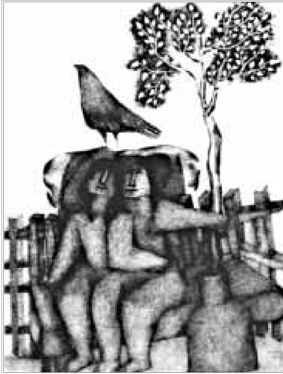
من اعمال الفنانة رباب نمر

في هذه اللوحة اصصرفت الفنانة عن الالتزام الرتيب بنقل أو محاكاة الواق، وسمنت لنفسها بتجميع العلاقات التشريحية المستقرة للبيئة الانساني، فشدتها بميلاتها في الوجه والاطراف، لا تتنمي الى مدارس التاركيادتيه، بل تتجسس نحو الامساحات المنحتمتي من التشكيل، صير العمل رصينة ومستقرة، خالية من الشواثب، بالضبط كما كان