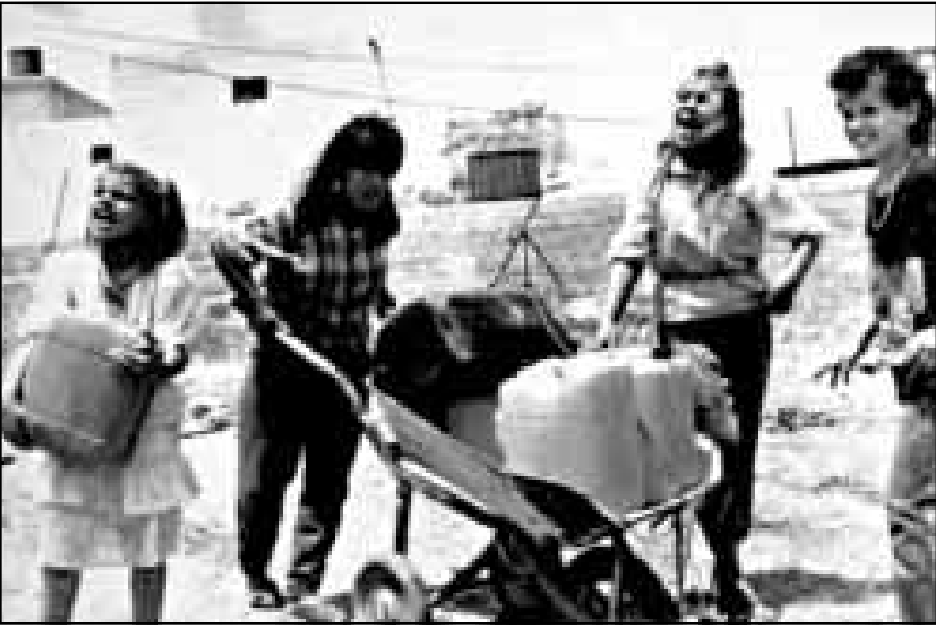
فتيات من مخيم شعفاط ينقلن الماء (صورة من الارشيف)

■ القدس - اف ب: ذكرت صحيفة (هآرتس) الاسرائيلية أمس الخميس ان مهاجرين اتوا الى اسرائيل من الاتحاد السوفيتي السابق اجبروا على الخضوع لفحص وراثي عندما كانت ثمة شكوك حول نسبهم.