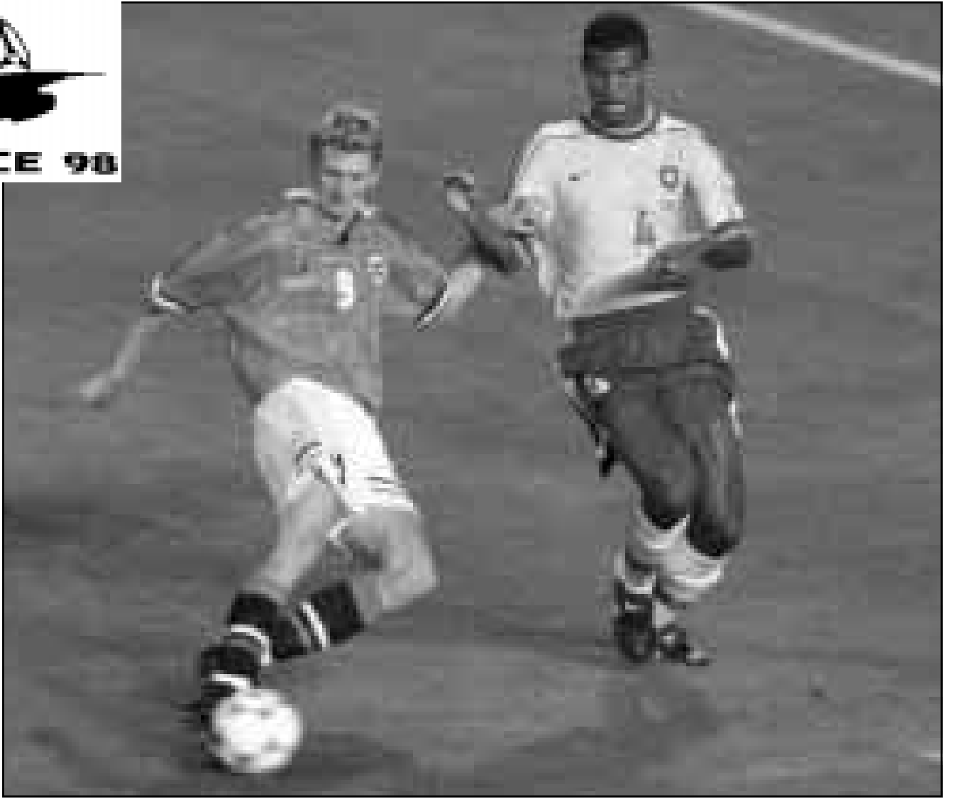
لقطة من مباراة البرازيل والنرويج