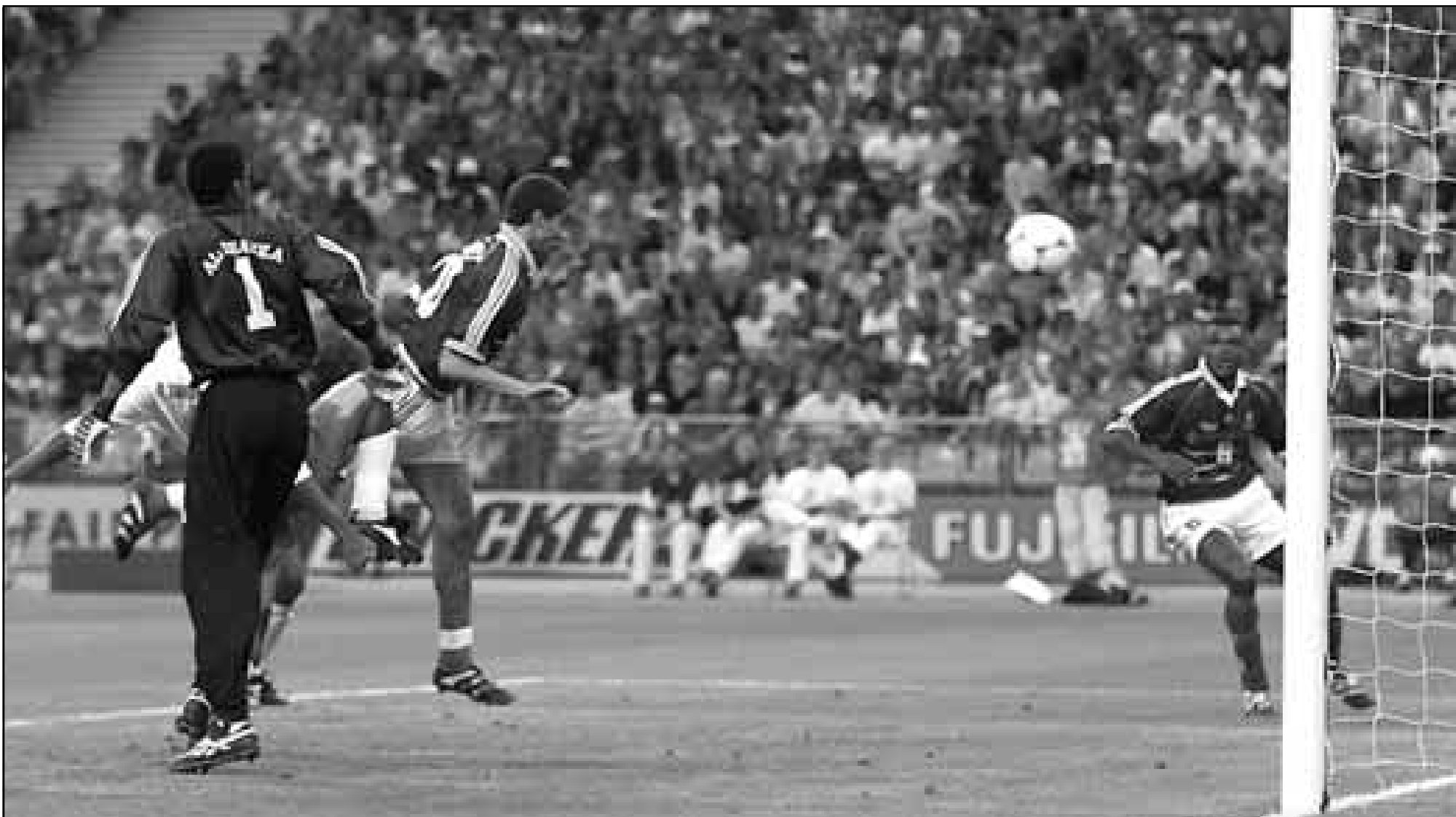
ديفيد تريزكيوت لاعب فرنسا (في الوسط) سدد كرة بواسطة في مرمى السعودية خلال مباراة المنتخبين