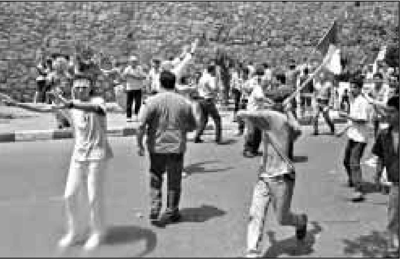
مظاهرات جزائريون يرمون رجال الشرطة بالحجارة في المسيرة التي مُنعت أمس (دويتز)