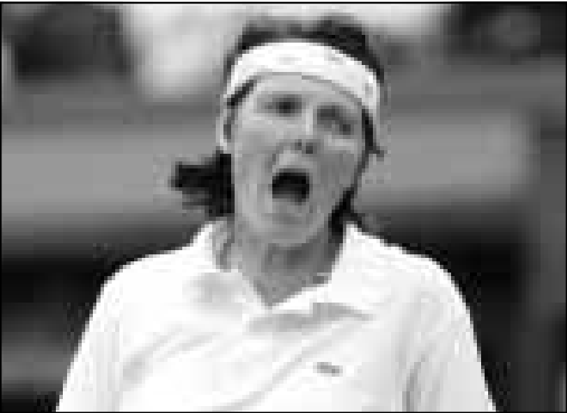
الفرنسية نانالي تورتيا

وقبل بطولة العالم سيتلقى منتخب السلة الأمريكي تدريبات في مونت كارلو كما يخوض لقاءات استعراضية امام منتخبات فرنسا واسبانيا وإيطاليا.