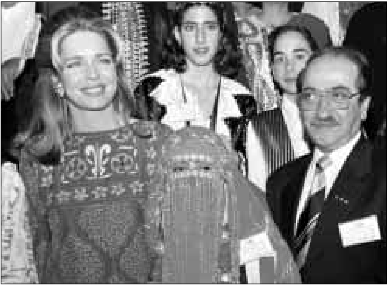
الملكة نور الحسين وسفير اليونسكو للاطفال الممثل السوري رويد لحام وتدو امامهما طلة منية، منية، وذلك اثناء افتتاح مؤتمر الاطفال العرب في عمان امس

■ قرسي (فرنسا) - أ.ب. ف: ذكر مصدر قضائي اسم أن الممثل الفرنسي جيسرار دوبارديو استدعى في قتل محكمة قرسي قرب باريس لقيادته، في «حال السكر» خلال حادثات دراجة نارية في أيار (مايو) الماضي. وكان الممثل قد أصيب بجروح لدى سقوطه عند مدخل إحدى القرى في 18 شباط (مايو) الماضي بينما كان متوجها لتصوير فيلم «استريكس» من أخرج كلود زيدي. وسيتمثل أمام محكمة الجنج في قرسي في 23 تموز (يوليو) الجاري. وكشف تحقيق بعد الحادث عن ثمن 2.55 غرام من الكحول في كل ليتر من الدم، وبحسب القانون الفرنسي فإن الحد الأقصى المسموح به للقيادته هو 0.50.