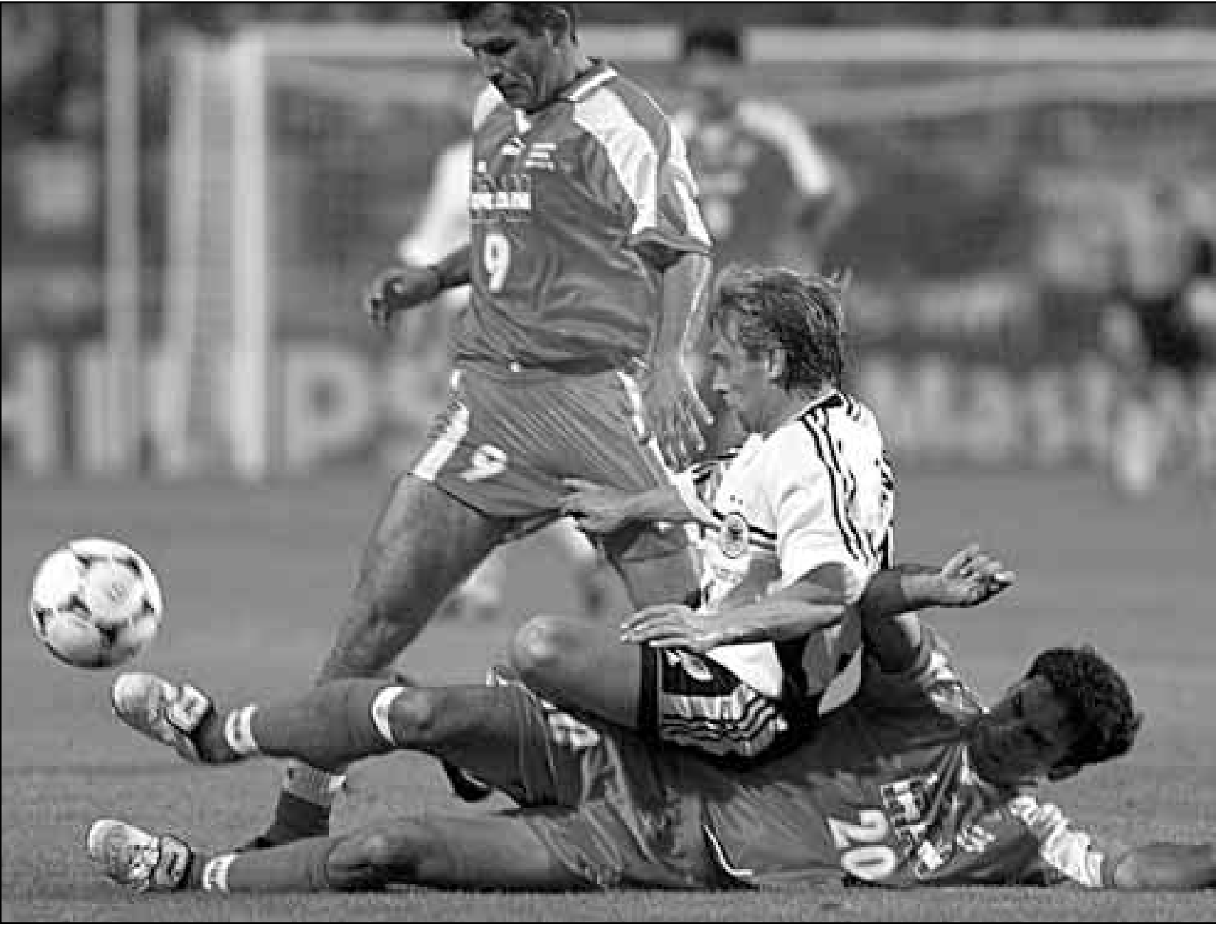
توماس هيلر لاعب ألمانيا (في الوسط) خلال مباراة منتخب بلاده مع إيران

الشيء من السكان يعرفون ان المباراة ستقام في هذا التاريخ في حين لا يعرف 68 في المئة منهم موعد انتخابات الرئاسة.