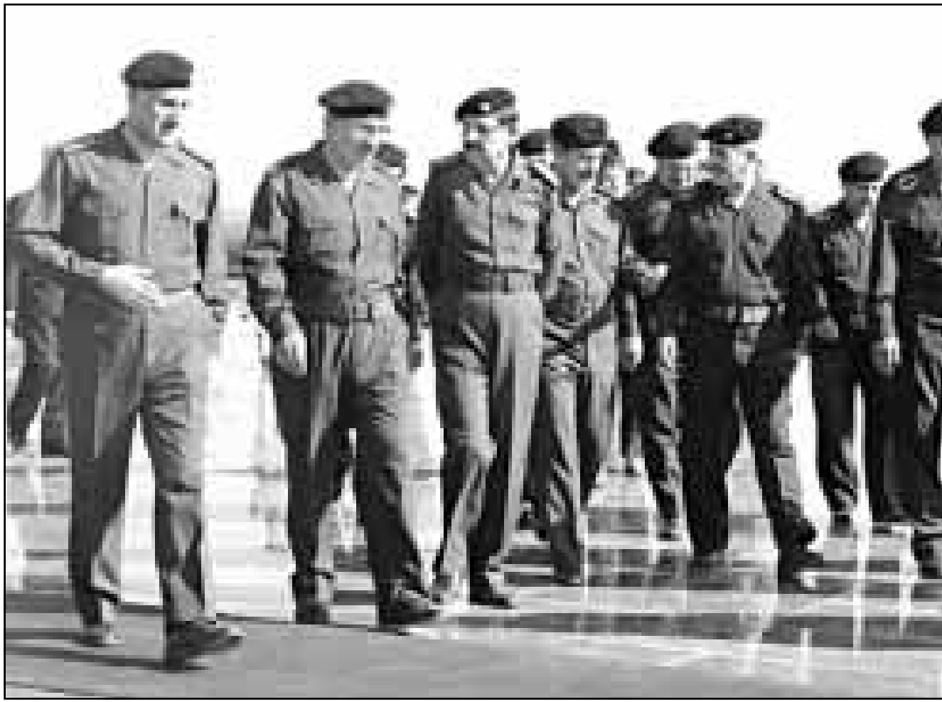
أعضاء عراقيون في مجلس قيادة حزب البعث يزورون نصب الجندي المجهول في بغداد بمناسبة الذكرى الاربعم لتسلمه السلطة

حث 34 عضواً في مجلس النواب الأمريكي الرئيس بيل كلينتون على رفع العقوبات الاقتصادية المفروضة على العراق منذ ثماني سنوات. وقالت الباحثة والخبيرة في شؤون المنطقة العربية والأمم المتحدة في مركز الدراسات السياسية بواشنطن، فيليب بيبس إن هذا هو بداية حملة تساؤل موسعة حول قابلية نظام العقوبات على الاستمرار.