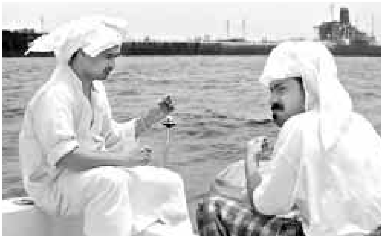
كوبيتان يصيدان الأسماك على شاطئ قبيلة نافلة نطق عراقية استولت عليها قوات التحالف في حرب الخليج.

بغداد - من حسن حافظ: اوردت وكالة الأنباء العراقية ان العراق اكد للامم المتحدة من جديد امس الثلاثاء انه لم يعد يقبل ان تظل العقوبات مفروضة، واتهم الولايات المتحدة والمفتشين الدوليين باختلاق «عداء» لاطالة امد العقوبات. واضافت الوكالة ان هذا التحذير العراقي وهو الاخير في سلسلة من التحذيرات التي وجهها الاسبوع الماضي في اعقاب الاجتماع لمجلس قيادة الثورة والقيادة القطرية لحزب البعث الاشتراكي الذي يرأسه الرئيس العراقي صدام حسين. واضاف البيان ان العراق لن يقبل استمرار الحظر الجائر المفروض عليه منذ ثمانينات اعوام ولن يقبل ان تتخلق في هذا الشعب العراقي وقرياته. واضافت وكالة الانباء العراقية ان المجلس الوطني يحمل «النظام الكويتي» المسؤولية عن عدم اعلان حصار 1037 عراقيا قفوا في المعتقلات. وقالت انهم مفقودون منذ ازمة الخليج عام 1990. واضافت وكالة الانباء العراقية ان المجلس الوطني يحذر من «النظام الكويتي» المسؤولية عن عدم اعلان حصار 1037 عراقيا قفوا في المعتقلات. وقالت انهم مفقودون منذ ازمة الخليج عام 1990. واضافت وكالة الانباء العراقية ان المجلس الوطني يحذر من «النظام الكويتي» المسؤولية عن عدم اعلان حصار 1037 عراقيا قفوا في المعتقلات.