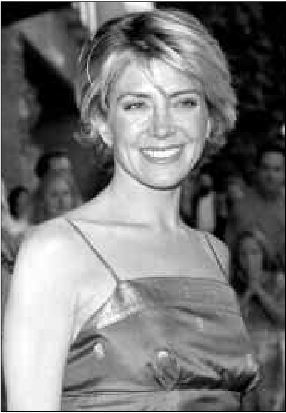
المطلة ناتاشا ريتشاردسون احدى بطلات الفيلم الفكاهي الرومانسي الجديد «معيدة الودين» شهدت حفل العرض الاول للفيلم في لوس انجليس امس الاول

وقال ترفايرتز ان المنطقة المحيطة بحيرة سيسانو كان يقطنها ما يتراوح بين 8000 و عشرة الاف مواطن قبل ان تضرب موجات الد الساحل في اعقاب زلزال.