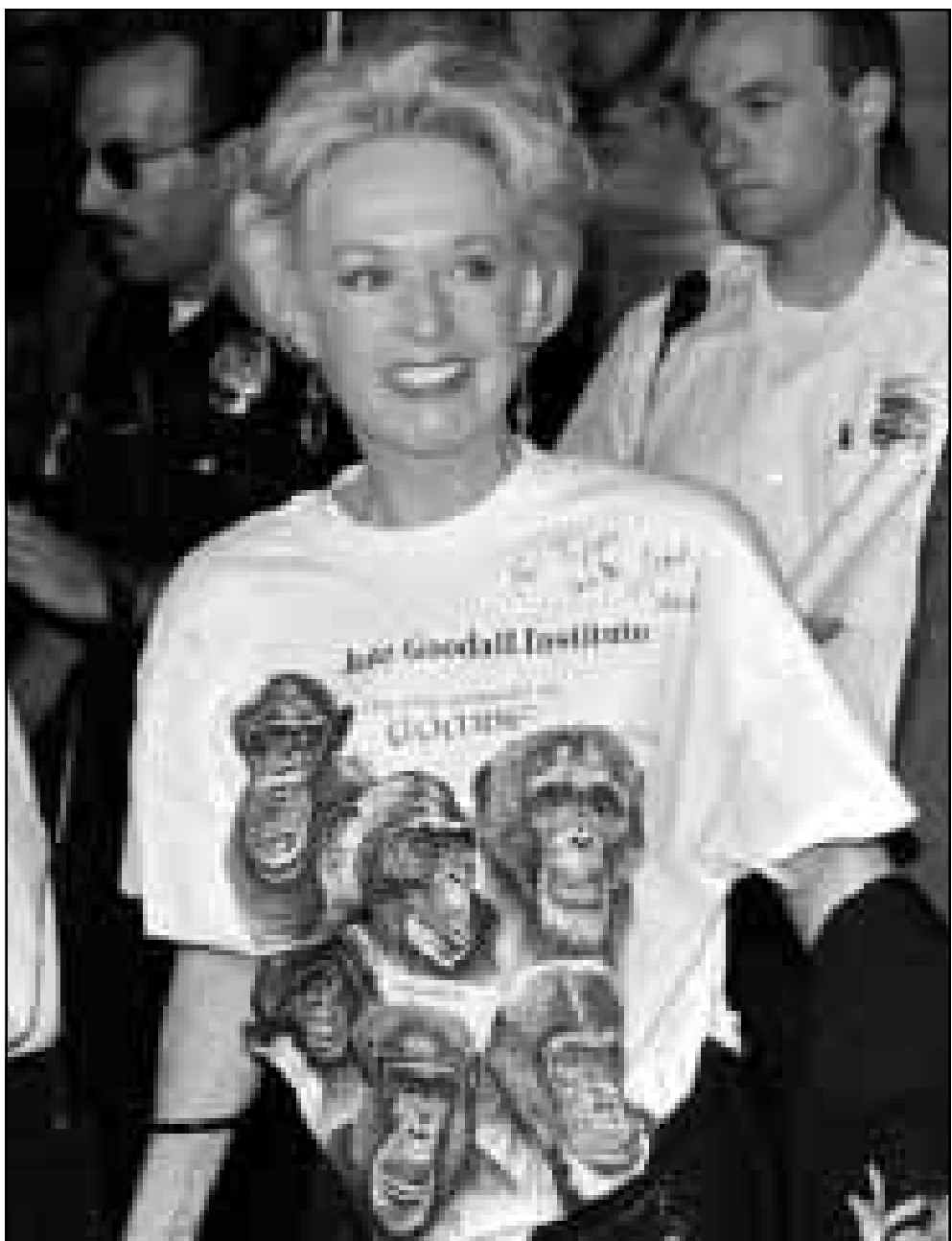
النجمة تيني مديون حضرت عرضاً خاصاً لفيلم الخيال العلمي «كوكب القردة» في بيفرلي هيلز بهوليوود بمناسبة عيد ميلادها الثلاثين. ويده اطلاق اشربة فيديو لها منه أولة جمع التذكارات

■ لوس أنجليس - أ. ب. أشارت مغامرة الرئيس الأمريكي بيل كلينتون السياسية والجنسية اهتمام هوليوود التي قررت البدء في تصوير فيلم بعنوان «متردية واشنطن» في مطلع العام المقبل كما ذكرت صحيفة «لوس أنجليس تايمز». يروي الفيلم الذي يقوم بإخراجه كلايد وير قصة متردية في البيت الأبيض كانت لها مغامرة عاطفية مع «شخصية سياسية مهمة». وتقوم بدور «مونيكا» ممثلة غير معروفة تدعى كاثرين جينيكيز سميت لقب الشخصية أنها تشبه مونيكا لوفينسكي التي هي حبيب. وكان الرئيس بيل كلينتون قد اعترف في خطاب تلغرافيزوني في 17 آب (أغسطس) الحالي بأنه أقام «علاقة غير لائقة» مع مونيكا لوفينسكي بعد أن سبق ونفى وجود أي علاقة جنسية بينه وبين هذه المتردية الشابة السابقة في البيت الأبيض.