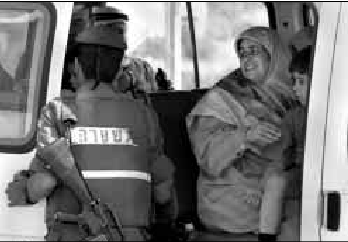
جندي اسرائيلي يتفقد هويات الفلسطينيين على حاجز الرام

ازمة عقيمة. ونكرت الاداعة الاسرائيلية الجمعة ان جهاز الامن الداخلي الاسرائيلي (الشين بيت) صحح نتنياهو بعدم السماح ببايئه في البناء في مستوطنة جبل ابو غنيم. رأس العمود مشيرا الى ان ذلك قد يفجر المزيد من اعمال العنف.