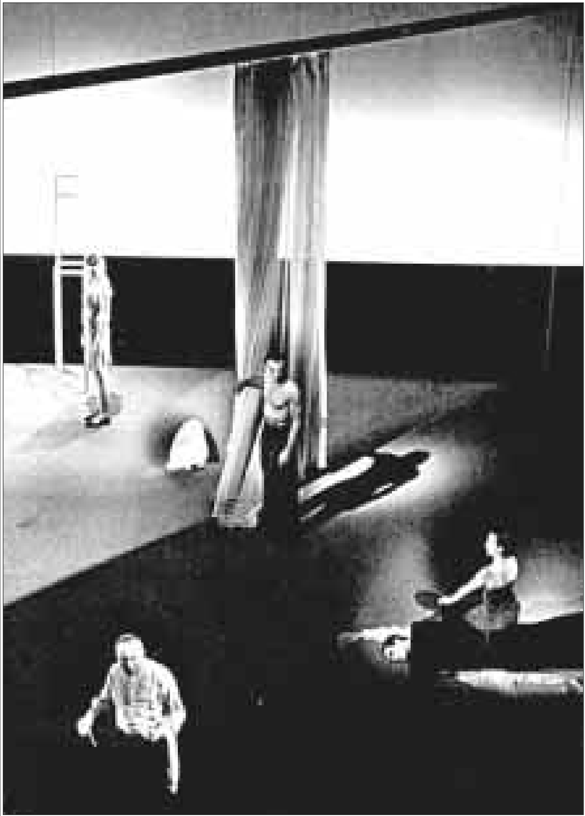
مشهد من مسرحية «كوارت» من تأليف هاينز ميلير واخراج روبرت ويلسون

2- العائدة والخفساء: نرى من خلال اللوحة التاسعة مادلين عائدة من الجهة الاخرى وهي تسلم موليير خفساء وكانها تدعوه او الاخرى تستضيفه للموت قصد يترجم ذلك كيفية نطق مادلين لحوارات المشهد الاول من مسرحية «النساء العالمت» وهي تخرج من فمها خفساء، في نهاية هذا الحوار الغريب تتغير طريقة اللفظ عند مادلين وتتخذ شكلا عسكيا، عندما تلقي كلمات المشهد بادئة بأخر الكلام منتهية عند بدايته، تقوم بفعل ذلك قبل ان تخرج من فمها الخفساء التي تضعها فوق كف موليير، ان ويلسون يدعو في هذا المشهد من خلال الخفساء الى العودة، انه يدعو الى الرجوع نحو منطقة البداية حيث ستأخذ الكلمات من جديد منطقها العادي، وان لوكرسي، مدة الفيلم 45 دقيقة.