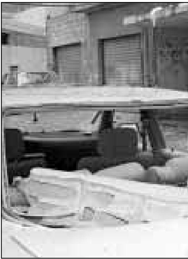
لبناني يتفقد سيارة أصيبت بقذيفة إسرائيلية

والجبهة الشعبية لتحرير فلسطين والتي ستكون عرضة لغارات جوية بهدف تدميرها.