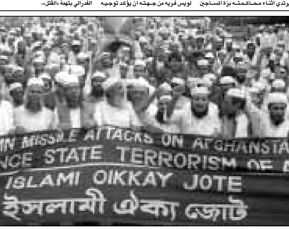
اسلاميون يتظاهرون في عاصمة بنغلادش احتجاجاً على الغارات الامريكية

وخلال مؤتمر صحافي عقده في واشنطن، رفض مدير أمن الفيدرالي لويس فريه من جهته ان يؤكد توجيه الاتهام رسمياً الى المتهم ثان يدعى محمد صادق هويدا ولكنه اوضح انه سيعلم عن الاعتراف الذي وافق عليه في المحكمة الاربعة والعشرين ساعة القادمة». وكانت وزيرة العدل الامريكية جانيت رينو اكدت ريثو ان محمد رشيد داوود العوالي المعروف ايضا باسم خالد سالم صالح بن راشد والذي كان على ما يبدو في السيارة التي كانت تحمل العجوبة والناسفة والتي استخدمت في الانفجار الذي استهدف في السابيع من اب (أغسطس) سفارة الولايات المتحدة في نيروبي عاصمة كينيا سيمثل امام القضاء الفدرالي بتهمة «القتل».