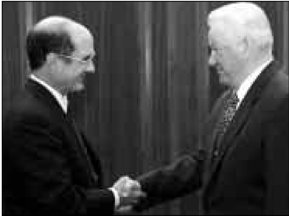
الرئيس الروسي يلتسن يصافح نائب وزيرة الخارجية الامريكية ستروب تالوت قبل اجتماعهما للجنة في الكرملين للتصديق للقمة الأمريكية - الروسية