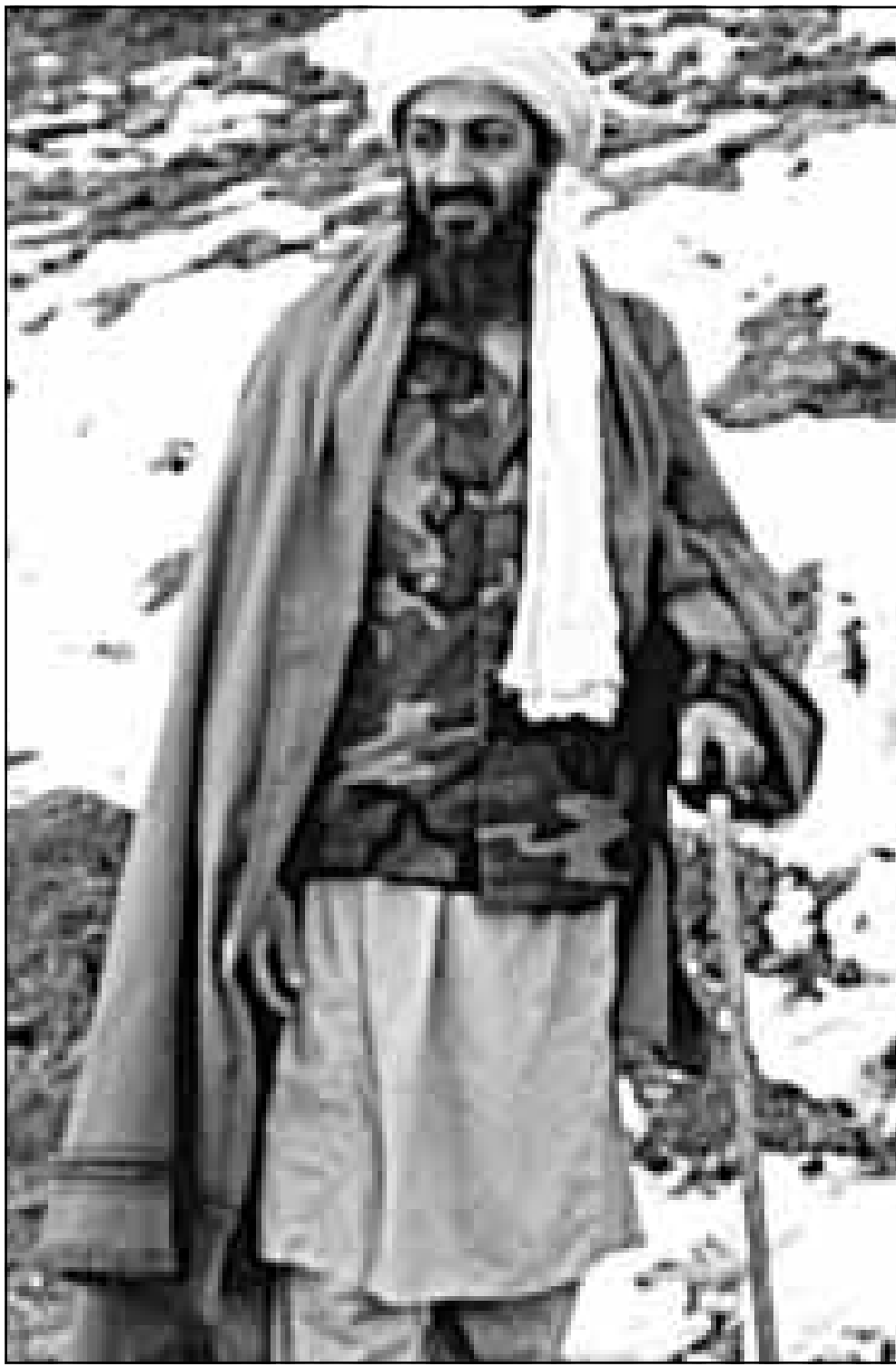
بن لادن في احد جبال افغانستان

الذي يشهده جنوب السودان» حيث تدور حرب اهلية منذ 1983.