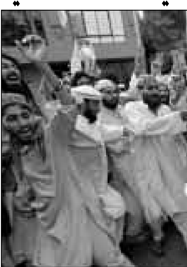
متظاهرون باكستانيون يحرقون العلم الامريكي في كراتشي الجمعة

■ واشنطن - «القدس العربي» من صلاح عواد: قال المثل الشخصي للرئيس الروسي بوريس يلتسن في مجلس النواب (الدوما) ان يلتسن عرض الخلفي عن بعض سلطاته الاساسية لرئيس وزرائه الجديد وللبرلمان الذي تسيطر عليه المعارضة. وقال الكسندر كوتكوف للمصاحفين يلتسن الذي نفي انه سيتخى مستعد لنح رئيس الوزراء سلطة اختيار اعضاء الحكومه واعطاء البرلمان كلمة اكبر في التعيينات الوزارية وانه ايضا مستعد لضمان عدم اقالة الحكومة لمدة عام. وعقب لقاء بين زعماء الاحزاب في الدوما مع فيكتور تشرنوميردين الذي عينه يلتسن هذا الاسبوع رئيسا للحكومة قبل كوتكوف ان «الرئيس يوافق على بدء العمل لتغيير القانون الاتحادي بشأن الحكومة التي ستتشبه عملية اكثر تفصيلا لتشكيل الحكومة وانشال المساهمة في هذه العملية لجلسي البرلمان». وكان الرئيس الروسي أكد حديث للتلفزيون الجمعة انه لن يستقيل من منصبه في اول رد علني على الشائعات المطالبة باستقالته الفورية. وقال يلتسن لشبكة التلفزيون العامة (رتي.ا) «اريد ان اقول لكم انني لن ارحل الى اي مكان ولن استقيل». مضيفا «ساقوم بعلمي على النحو الجرحي نهاية ولايتي الدستورية وفي عام الف سيخ الانتخابات رئيس جديد ولن اشارك في هذا الانتخاب».