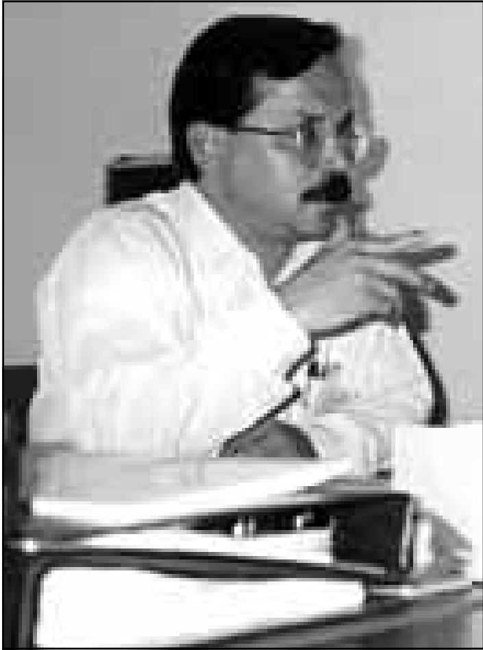
محمد حلمي الريشة (القدس العربي)

في حياتنا، بمعنى ان كثيرنا من الناس يولدون ويعيشون طويلا ويموتون دون ان يقرأوا سطرًا واحدًا من الشعر، هل هو الجهل العبي الذي حرم هؤلاء من لذات اكتشافهم ومعرفة الاشياء معرفة عميقة مختلفة؟ ام ان الشعر هو الذي يضفي على نفسه قيمة مزيفة؟