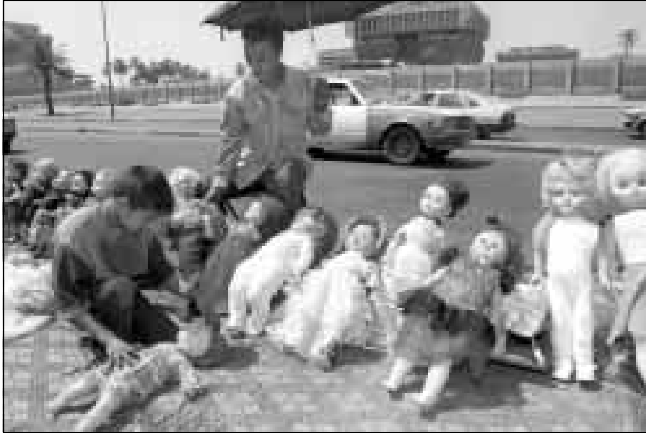
أب وطفله يبيعان لابل اعلم مستعملة في أحد شوارع بغداد (أف ب)

واعتبرت الصحيفة ان البحث عن سياسة جديدة التي بدأ بسبب حالة الحدود في الشتاء الماضي «هو مسألة مفهومة»، وعزت ذلك إلى وجود قلقه من المخلين فقط سواء داخل الحكومة الأمريكية أو خارجها ممن يشعرون بالتنازل بإمكانية تحقيق الأهداف الأمريكية عن طريق استخدام القوة. وأضافت الصحيفة ان تاييد العلماء لهذه السياسة هو في أدنى مستوياته. وقالت «واشنطن بوست» كغيرها من الصحف الأمريكية التي حطت بصمات الزايف فيها بالقطاعات التحريضية ضد العراق خلال الأسابيع الحالياته من ذلك الحين السياسة الجديدة تثير عدا من الأمم المتحدة دون شك فهل تستطيع الولايات الأمريكية ان تاييد استخدام القوة. وتعرف مجلة سيدبا صدام حسين بإعادة إنتاج أسلحة الدمار الشامل» فسجله في هذا الشأن غير مشجع». وتساعتل الصحيفة «لا يكون انتصار