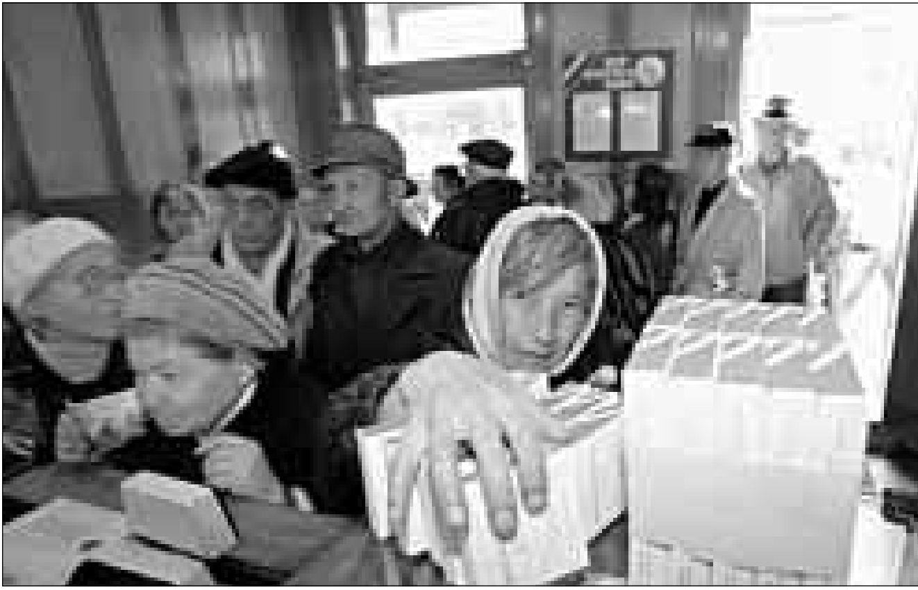
سيده روسية تشتري كمية كبيرة من السكان لتخزينها مع اشتداد الأزمة الاقتصادية في البلاد (اف ب)

بلا من «التوقف في منتصف الطريق»، واقر في الوقت نفسه بان الولايات المتحدة لا يمكن ان تسمح لنفسها بالتخلي كلياً عن عدوها السابق ابان الحرب الباردة، والاضطراب الذي اثاره الغموض السياسي في موسكو في وول ستريت يؤكّد ان مصير العلاقات مرتبط جزئيا، وخلص الى القول «شأننا اما ايننا علينا ان ننتي المستقبل معا». وسيقع كليتون و يلتسين اليوم الاربعاء اتفاقان في مجال نزع الاسلحة، احدهما يقضي بتبادل المعلومات بين الدول، الى ذلك اتفق البلدان عن خفض مخزون كل منهما «اطلاق الصواريخ العابرة في العالم اجمع والصواريخ التي تنطلق من الفضاء»، كما اوضح ويرت بيل المستشار الخاص للرئيس لشؤون الامن القومي الذي رآى في هذا الاتفاق «نتيجة رئيسية للقمة في مجال نزع السلاح». واضاف ان نظام الانذار المبكر الروسي لم يعد قاعلا، مؤكدا على وجوب تقياد ان تزعج روسيا كما اوشك ان تفعل في كانون الثاني (يناير) 1995 بين تجربة صاروخ عملي تروحي وبين هجوم صاروخي مما يحملها على الدرد، الى ذلك اتفق البلدان على خفض مخزون كل منهما من الباليستينوم العسكري بقدر خمسين طناً، واوضح غاري سامور المسؤول عن عدم انتشار الاسلحة النووية من مجلس الامن القومي الأمريكي ان ازالة كل من البلدين خمسين طناً من الباليستينوم العسكري الناجم عن تفكيك الصواريخ يلغي القدرة على انتاج «الف الاسلحة» النووية.