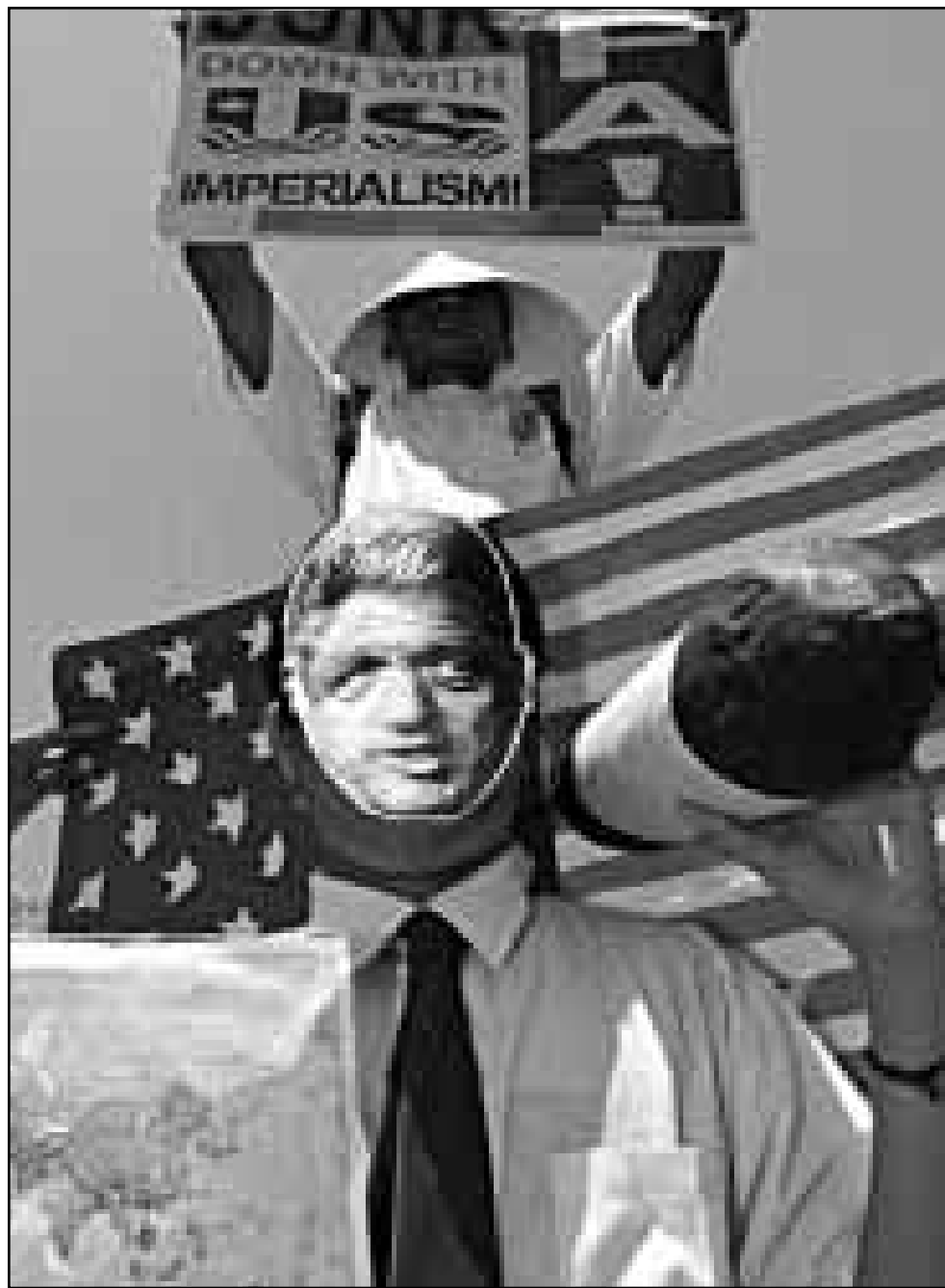
مظاهر يرفع لافتة تندد بالامبريالية الأمريكية في مانيلا أمس