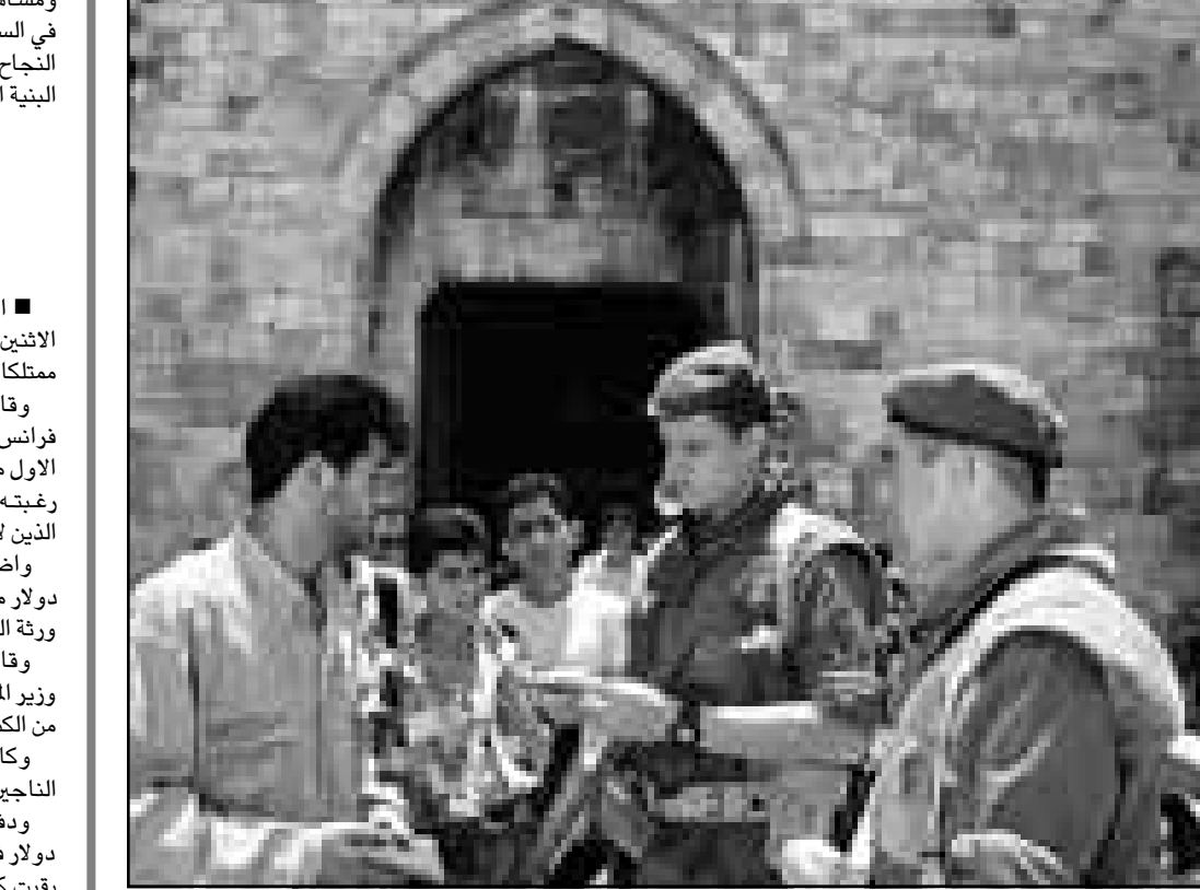
جنديان اسرائيليان يوقان شبانا فلسطينيين على باب العمارة في مدينة القدس

الاسلامية بشدة داعية البلدية الإسلامية إلى الرجوع عن اكدانيتها. غير ان احتكاك مع المسلمين لا يقتصر على المسجد الأقصى المبارك والحرم الابراهيمي الشريف إذ يتعدى ذلك إلى مسجد بلال بن رباح في مدخل بيت لحم الذي يسميه اليهود «قبة راحيل» وقبر النبي يوسف عليه السلام في مدينة نابلس. واستناداً إلى اتفاق أوسلو سمح لليهود بالوصول إلى سطحه بلال بن رباح على ان يتواجد جندي اسرائيلي واحد على مسجد الأقصى الذي يحفظه وقد مقابله له وأخر على الشارع الاسرائيلي. غير ان الحكومة الاسرائيلية اقتضت نصف الشارع الرئيسي المقابل للمسجد واقامت جدراً شاهقاً يحيط بالمسجد على حساب الشارع وحولته إلى كتحة عسكرية لمنع الفلسطينيين من الدخول