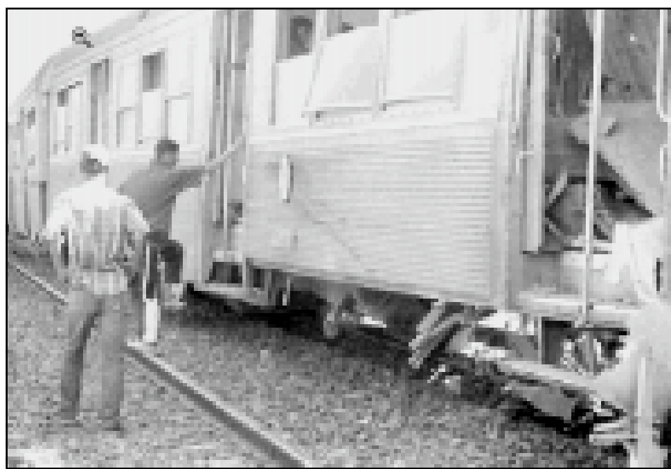
عربات قطار البلدية (الجزائر) الذي تعرض لاعتداء بقنبلة صباح يوم الأحد

هرسبرانج (فرنسا) - اف ب: ارتكب رجل جريمة رباعية في الساعة 22 بالتوقيت المحلي (20 غ م) من مساء يوم الأحد بسلاح ناري في مركز للمهاجرين في هرسبرانج (شرق فرنسا) ولاذ بالفرار كما أعلن مصدر في الشرطة. ويبدو ان رجلاً كمبودي الاصل يسكن في الغرفة المجاورة قتل المهاجرين الليبيين اربعة وهم ثلاثة رجال وامرأة كانوا في غرفة واحدة في المركز. وافادت الشهادات الاولى ان الشجار كان دافعا بين ساكني الغرفة الاول كمبودي والثاني من شمال افريقيا. وقد دعا التزليل الثاني في الغرفة الى النظر حول عدد من القضايا ذات الاهتمام المشترك وفي مقدمتها قضية لوكربي والهجوم الأمريكي على مصنع الاوبئة السوداني والاورضاع في جمهورية الكونغو الديمقراطية والنزاعات في منطقة القرن الافريقي. ودافع الجريمة.