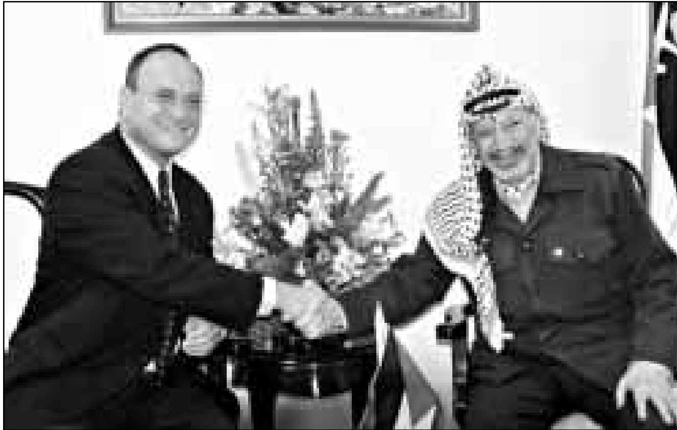
الرئيس الفلسطيني ياسر عرفات لدى استقباله رئيسة تل أبيب روني ميلو أمس في رام الله

حظا من الغارات العسكرية على السودان». وقال «سيجد روس لدى قدومه الى منطقتنا ضيقا وشكا بالرسالة الامريكية اذ حاول ان يحصر مهمته في تسويق