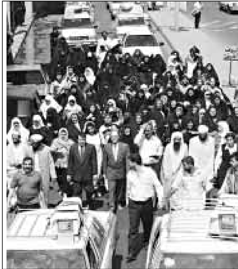
عراقيون يشيعون أطفالهم في بغداد امس

المتحدة وبريطانيا) يتذرعون ببغداد واهية وغير علمية تهدف الى عرقلة الموافقة على العقود الخاصة بالادوية والمستلزمات الطبية المهمة».