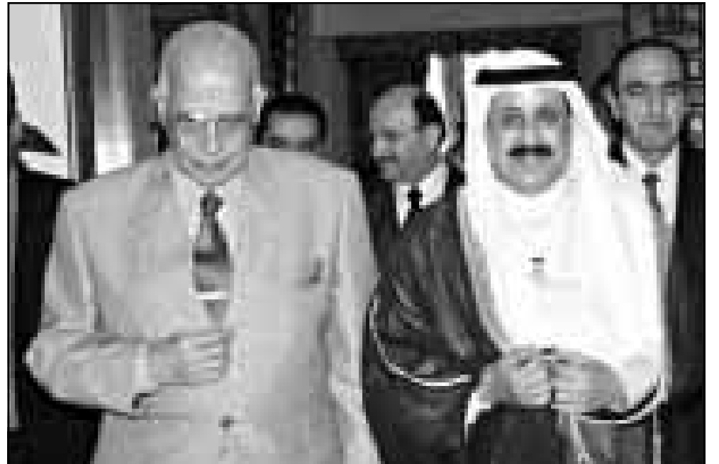
الامين العام للجامعة العربية عصمت عبد المجيد ووزير الدفاع الكويتي سالم الصباح في القاهرة امس

وتزعم الكويت ان العراق يحتجز قرابة 600 شخص اعلمهم من الكويتيين، وتقول ببغداد انها أطلقت سراح أكثر من ستة الاف كويتي واخرين بعد انتهاء حرب الخليج بقليل. وينفي العراق احتجاجاً ويضي قلائاً «لو سلمنا العراق جنث الاسرى، اذا كانوا ماتوا».