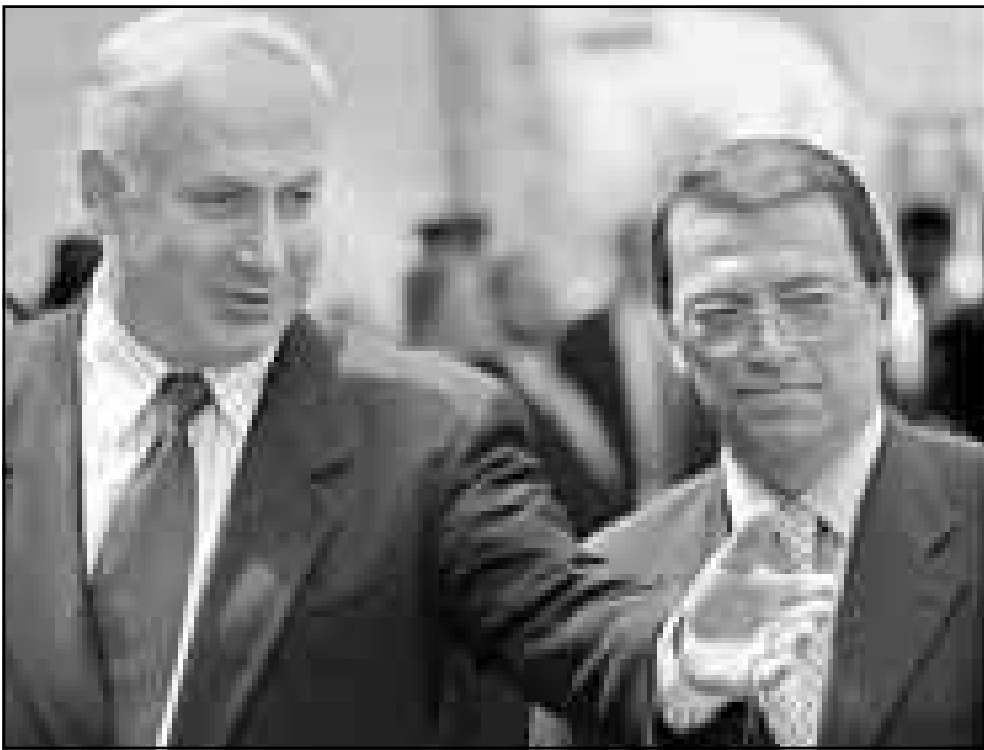
رئيس الوزراء الاسرائيلي يرحب بنظيره التركي امس لدى وصوله الى اسرائيل

القديس - اف ب- رويترز: وصل رئيس الوزراء التركي مسعود يلماز امس الاثنين الى اسرائيل قادما من الاردن والتقى فور وصوله الى القدس نظيره الاسرائيلي بنيامين نتنياهو. ولم تصدر اي معلومات عن مضمون المحادثات بين السؤولين. وفي حديث نشرته صحيفة (هليليت) التركية السبت الماضي اعلن نتنياهو انه يريد اقامة نظام امني اقليمي مع تركيا، مما دعا يلماز الى التأكيد قبل مغادرته عمان بان تعزيز التعاون العسكري بين بلاده واسرائيل لا يهدد العالم العربي. يذكر ان تركيا واسرائيل وقعتا في 1996 اتفاق تعاون عسكري اثار استياء الدول العربية وخصوصا مصر وسورية بالاضافة الى ايران التي رأت فيه تهديدا، وهو ما نفتته تركيا واسرائيل. ويتوقع ان يزور يلماز مدينة رام الله التي تضم معسكرات القوات التركية في القدس الغربية للقاء الرئيس الفلسطيني ياسر عرفات.