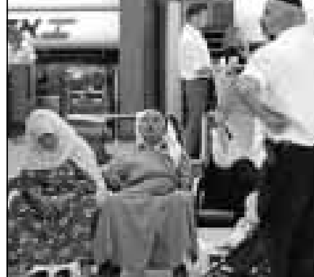
فلسطينيان ينتظران موعد طائرتهما في مطار قبل الاتفاق على انتهاء الاضراب امس

التي يقارب عدد سكانها مليون نسمة. وقال نتنياهو لاذاعة «دعو الدرسيين الى العودة لتقوا الى العمل لتتمكن الاطفال من الذهاب الى المدارس، فكل يوم يمر ويشكل خسارة اكبر»، وقال نتنياهو الذي وصف الاضراب بأنه «ضحية» ان الاتفاق نجح في حماية الاجور والاقتصاد. واضاف «عندما يسألوني عن الطرف الفائز..