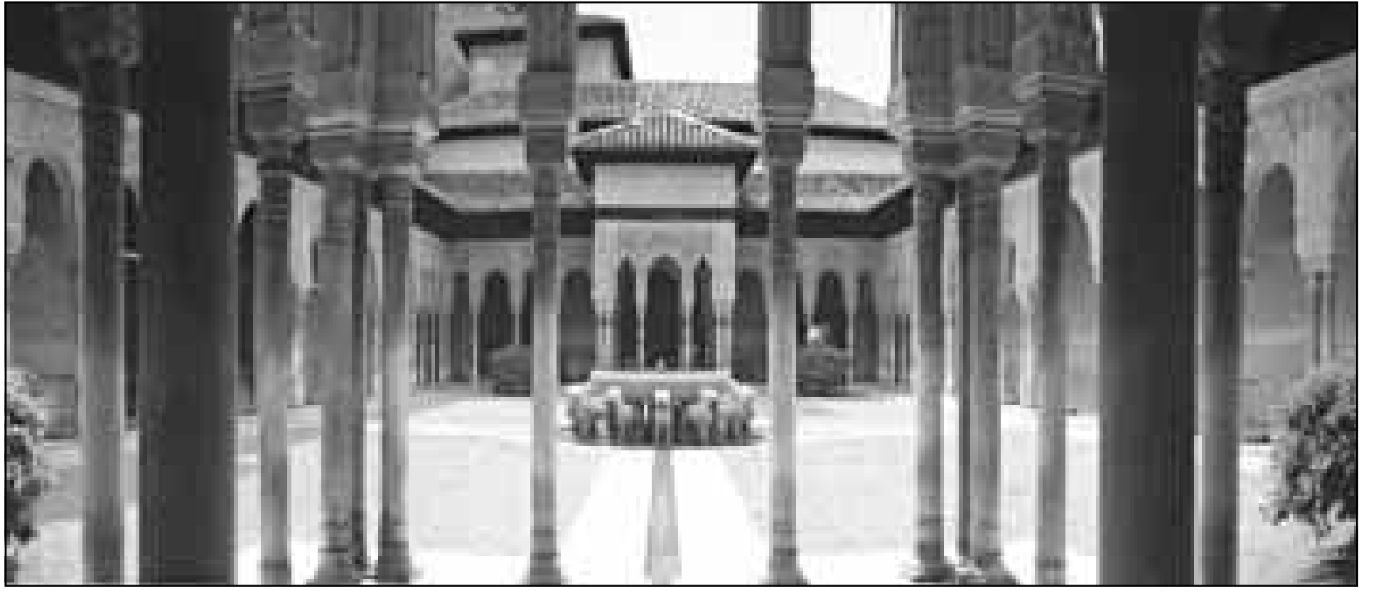
منظر ساحة السبخاء في قصر الحمراء (غرناطة)