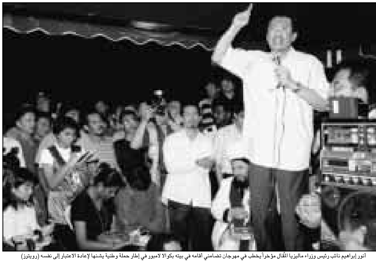
انور ابراهيم نائب رئيس وزراء ماليزيا المقل مؤخرا يخطف في مهرجان تضامني اقامه في بيته بكمالابامور في إطار حملة وطنية يشنها لإعادة الانتخاب إلى نفسه