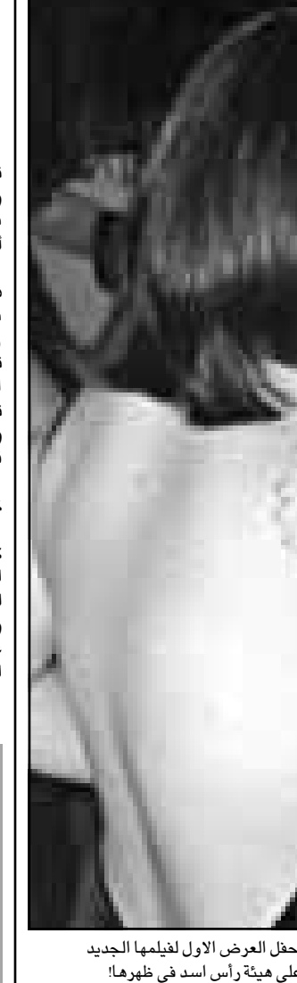
التجمة كريستيان ريتشي حضرت حفل العرض الأول لفيلمها الجديد في سانتا مونيكا ويظهر وشم على هيئة رأس أسد في ظهرها

نيويورك - رويترز: أظهرت دراسة أن تناول الحليب قليل الدسم واللبننة والجبين يقلل من احتمالات الإصابة بسرطان القولون أو الشرج الذي يقتل أكثر من 50 ألف أمريكي سنوياً. قال رئيس فريق البحث الدكتور بيتر هولت رئيس قسم أمراض المعدة والأمعاء بمركز سانت لوك الطبي بمستشفى روزفلت بنيويورك أنه يجب على الأطباء توصية مرضاهم بالقيام بخطوات لتقليل تناول أطعمة قليلة الدسم كثيرة الألياف وأيضاً منتجات الألبان والقيام بعمليات فحص منتظمة. قام بمؤويل الدراسة المجلس الوطني لمنتجات الألبان. كبيره محاولة لتقليل الإصابة بهذا السرطان وذلك أننا نحث الجميع على التأكد من أن البراز لا يحتوي على دم وفضع دوري للجزء الأسفل من القولون. الجميع رجلاً ونساء والقيام بهذه الخطوات كإجراء وقائي». قام الدكتور هولت وساعده بدراسة تأثير الألبان من تناول منتجات الألبان قليلة الدسم على 70 شخصاً يواجهون احتمال إصابتهم بسرطان القولون. تم تقسيم المجموعة إلى قسمين، قسم يتناول أطعمة عادية والقسم الآخر يتكثّر من تناول الحليب قليل الدسم واللبننة والجبين لتصل جرعة الكالسيوم للفرد إلى 1500 ملليغرام يومياً. وضعت المجموعتان تحت الملاحظة لمدة عام لاكتشاف أي تغيير على الخلايا التي تبطن القولون أو مؤشرات لسرطان القولون. قال هولت أن فريقه لاحظ تغييرات إيجابية في المجموعة التي تناولت جرعات منها انخفاض التغييرات غير الطبيعية التي تحدث بالخلايا. كما ساعدت هذه المنتجات على عودة خلايا تعرضت لتغييرات ربما تحولها إلى خلايا سرطانية إلى حالتها الطبيعية. ويقول الباحثون أن إحصائيات أظهرت أن 131 ألف شخص في الولايات المتحدة يصابون سنوياً بسرطان القولون أو الشرج وأن 56500 منهم سيמותون هذا العام.