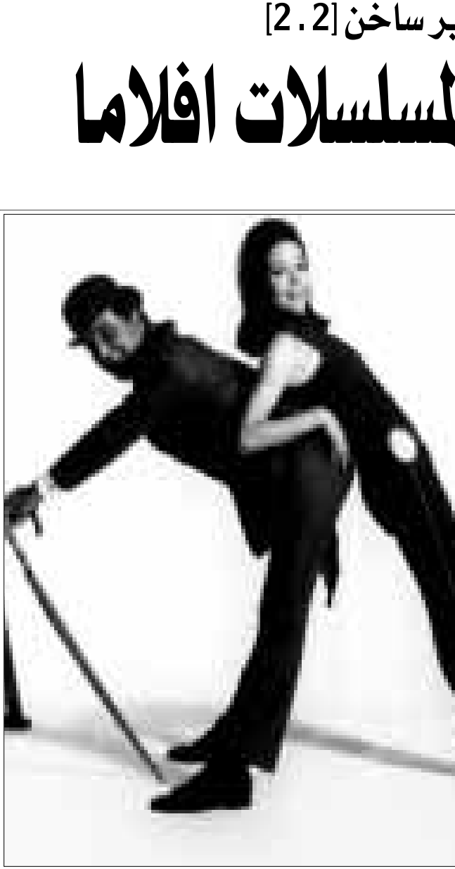
تمويل المسلسلات التلفزيونية في افلام

الخاصة التي ظهرت في اخر الفيلم ضمت 3500 اسم. وامام هذه الوليمة الدسمة من المؤثرات والروبوتات والسفن الفضائية الجوالية بين الجرات، من ذا الذي يبحث عن قصة او حبكة او حتى تمثيل من نوع، وحتى الآن لم يحقق الفيلم الإيرادات المتوقعة في الولايات المتحدة وان كنا لا نشك في انه سيحني اضعافا من التوزيع حول العالم، ومن تجارة التذاكر المتعلقة به، وتلك مسالة لا علاقة لها بالفن.