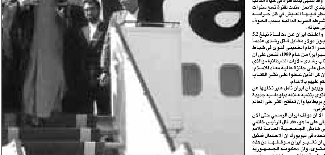
الرئيس الايراني محمد خاتمي لدى عودته الى طهران امس قادما من نيويورك

اتيوا - رويترز: قال مسؤولون بحفر السواحل اليوناني ان قاربا لبنانيا صغيرا عليه 167 مهاجرا عراقيا احتجز قبالة جزيرة كريت الجنوبية امس الاربعاء. وقال متحدث باسم حفر السواحل «كان المهاجرون وهم 56 رجلا و 31 سيدة و 8 طفلا من بينهم عدة رضع مكسدين كاسردين من ملى القارب الخشبي الذي يبلغ طوله 20 مترا». واضاف ان زوارق حفر السواحل احتجزت القارب بينما كان طاقمه المكون من ثلاثة لبنانيين يعد لانزال المهاجرين في خليج ناء بجزيرة كريت، وابتعد القارب من لبنان في 18 ايلول (سبتمبر). وقال المتحدث «معظمهم كان في حالة مأساوية وبخاصة الاطفال ونفقوا الى مستشفيات لتلقي اسعافات اولية». واضاف «لقدنا ايضا تقريراً من شاهد عيان بان سيدة حاملت تعرضت للاجهاض وان الجنين الي في البحر».