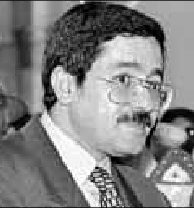
احمد اويحى رئيس وزراء الجزائر