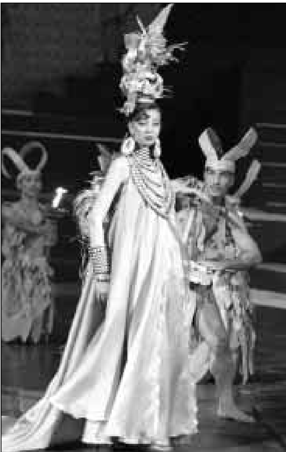
مشهد من عرض مسرحي في مهرجان بابل العراقي تظهر فيه بطلنة العرض في دور الية الجمال ششتار ضمن برنامج المهرجان الذي تشارك فيه فرق الموسيقى والغناء من 32 دولة