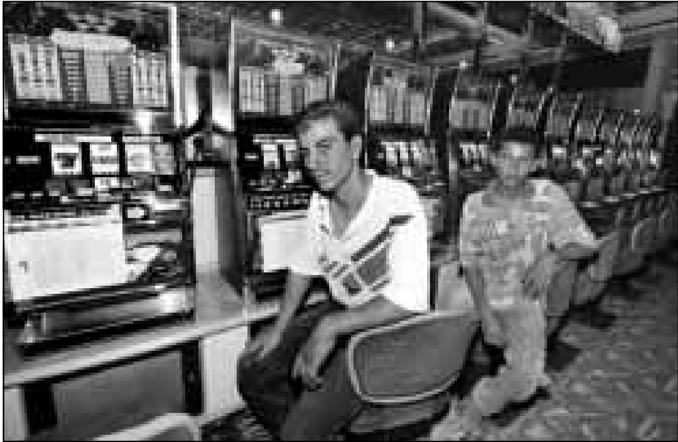
فتيان امام قمار قهارة ليلية في كازينو الواحة في أريحا

الدورات ليليا تصل احيانا الى ما فوق نصف الذرية ولكنها لا تقل عنها كثيرا. ويستشكل هذه الأرباح أحد مصادر الدخل للسلطة الفلسطينية، وذلك عن طريق الأول أنها تعجز أحد المساهمين وينسبة 30% والثاني عن طريق الضرائب التي تستجيبها من الأرباح، والتي استراوح بين 25% و 30%. وإذا كان الطريق الأول ستمت الاستفادة منه مباشرة فان الطريق الثاني ستمتدأ ثماره بعد ان تستعيد الشركة المساهمة التي تدبر الكازينو الاموال التي استثمرتها. حيث اعقبتا السلطة الفلسطينية مع دفع اي ضرائب حتى تسترجع أقر خسر دفعته، وهو الامر الذي سيستغرق عامين وفق ما قاله أحد مسؤولي الشركة.