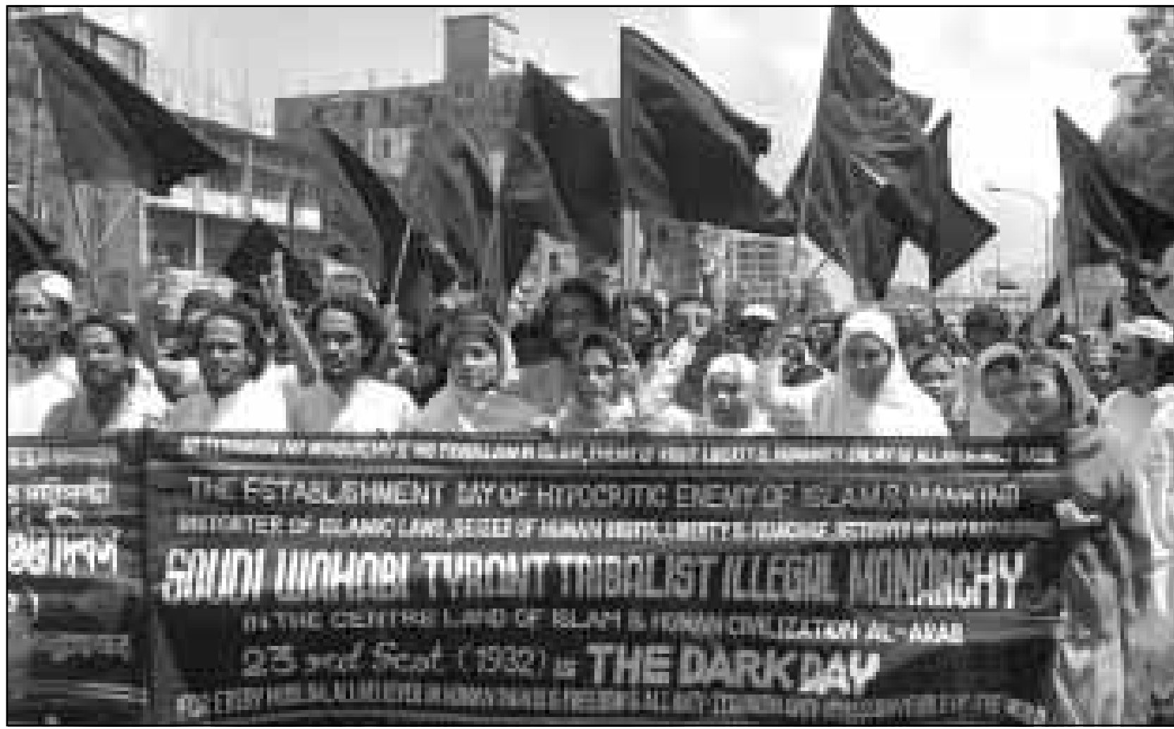
مظاهرة حركة اسلامية في بنغلادش تزداد تنافسا ضد الحكومة السعودية في مناسبة ذكرى انشاء المملكة

الرياض - ا ف ب: اعلن مصدر دبلوماسي في الرياض امس ان السعودية جمدت علاقاتها اسم مع حركة طالبان لانها مقتنعة بان عددا من المشتبه بتورطهم في اعتداء الظهران ضد الامريكيين عام 1996 يختبئون في افغانستان. وقال المصدر طالبا عدم الكشف عن اسمه ان السعوديين يعلمون من مصادر موثوقة ان عددا من المشتبه بتورطهم في انفجار الظهران موجودون في افغانستان تحت حماية اسامة بن لادن.