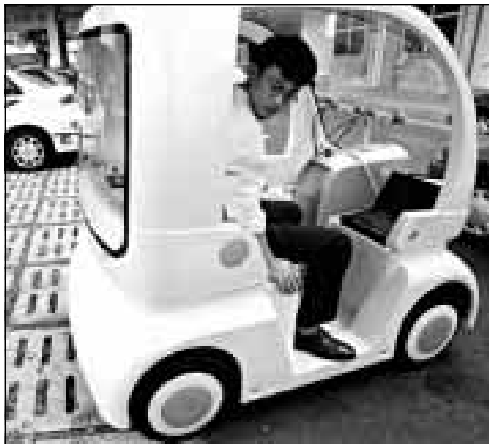
مهندس ابحاث صيني داخل نموذج تجريبي لسيارة كهربائية عرضت امس في سنغافورة بمكثها السير وحدها بموعة برنامج كمبيوتر حسب التعليمات الشفوية الموجبة لها. وقد طورت السيارة بموعة فرنسية من قبل باحثي جامعة سنغافورة لاجتاد التكنولوجيا

تعميل في الصين وتشيلي. وقال بساط ان بنك العربي هو أكبر بنك في الأردن على المعاملات في بورصة عمان. ووفقا لاحصائيات عام 1997 للبنك العربي 139 فرعاً رئيسياً في الدول العربية و19 فرعاً في أوروبا وآسيا والولايات المتحدة ومكاتب