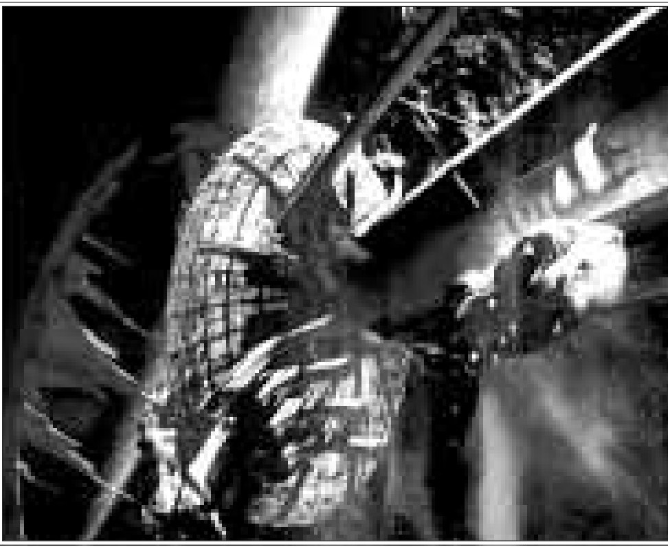
لقطة من فيلم "مفقود في الفضاء"

يفتقد على نحو فاج حفة ظل بطل المسلسل باريك ماتي، Mac Neel الذي جمع الال واقحة والطابع الانكليزي المائل، جاذبية جنسية يفتقد اليها وجه فايس الناعم الخالي من الحيوية المتدفقة ومن ناقل القول ان الكيمياء المشروعة بين بياتات وباريتك لا وجود لها بين فايس واما، حتى نحو كوبري (الذي ارتطبا اسمه اكثر من اي ممثل اخر جيسيمس بوند) فقد اداء متوسطا وبدا ضائعا في دور لم يخفق له.