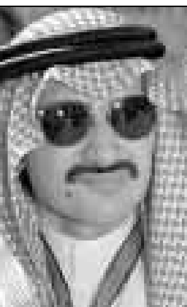
الوليد بن طلال

كما ستقدم الصفقة ليردوخ فرصة ذهبية لاجتاد موطى قدم له في السوق الألمانية، والذي ظل مغلقا