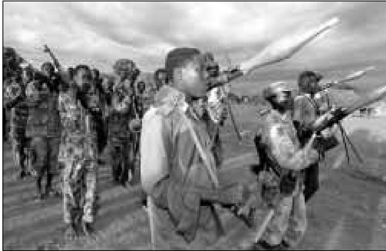
جنود تايعون للقوات الحكومية السودانية في الجنوب

ولم تسمح الوساطات المختلفة حتى الان ببدة مفاوضات بين الطرفين.