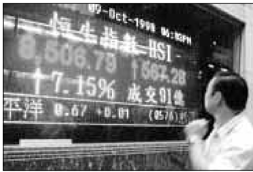
أحد المرات ينظر إلى لوحة التكترونية خارج بورصة هونغ كونغ و ي سجل مؤشرها ارتفاعاً هاماً عند غلق الجمعة

عوض الدولار بعض خسائره في التعاملات الأوروبية الجمعة ولكن وضعه كلاً من ظل متضرراً بشدة من انخفاضه الحاد أمام الين الخميس وهو ما اتضح في هبوط أسعار سندات الحكومة الأمريكية. وقال متعاملون أن أسعار السندات انخفضت في بريطانيا وألمانيا وسويسرا أيضاً. وارتفعت الأسهم في أوروبا ومعظمها في نطاق بين 2 و4,5 في المئة عن الأقبال على الشراء لتغلبية مراكز مدينة قبل عطلة نهاية الأسبوع من دعم الأسعار بعد أن عززتها المكاسب المتوسطة في بورصة نيويورك واستقرار الدولار. كما عزز التعاملات الأوروبية ارتفاع أسهم هونغ كونغ وعدم هبوط الاسهم اليابانية بقوة. وبعد أن تدنى الدولار إلى مستوى 111,45 ين في أوروبا أمس زاد خمسة بنات في ختام التعاملات الأوروبية وثلاثة فينكات فوق المستوى المتدني الذي بلغه أمام المارك الألماني الخميس. وارتفعت الاسهم الألمانية 2,9 في المئة في ختام التعاملات الإلكترونية مدعومة بصعود الدولار الذي بدأ