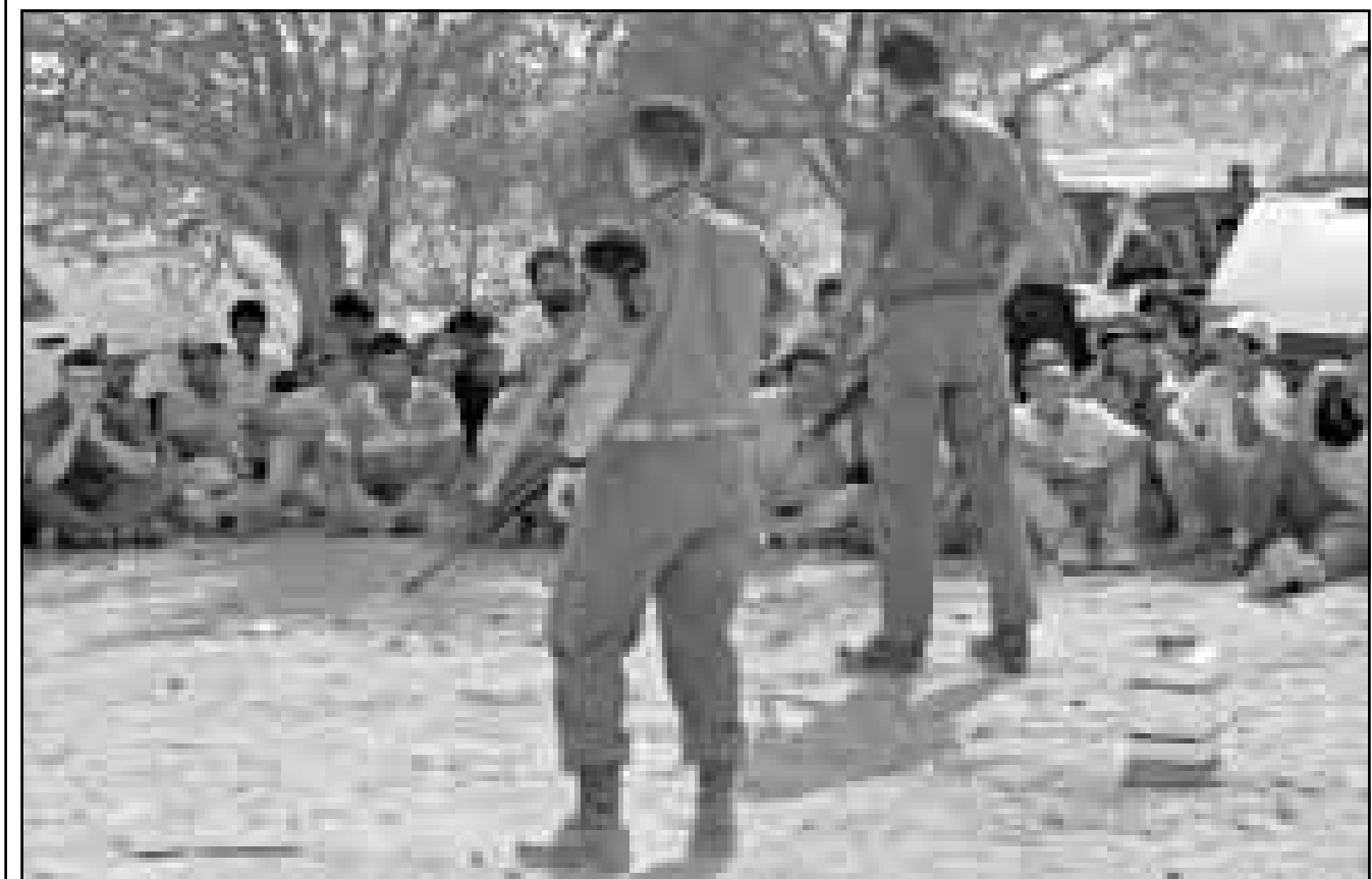
جنديان اسرائيليان يراقبان مجموعة من الفلسطينيين تم اعتقالهم الجمعة بعد طعن مجنونة اسرائيلية

وقال صائب عريقات كبير الفاعضين الفلسطينيين ان نتائجه بتعيينه شارون يبلغ العالم انه يلغي المرحلة النهائية وانه يختار طريق السلام وازالة صدام. لكن مسؤولا فلسطينيا بارزا قال في تصريحات غير رسمية ان الجنرال السابق صعب المراس ربما يكون عضو الحكومة الوحيد الذي يتصمق بنقوذ في اسرائيل بكفي لايام نسوية. وفي واشنطن قال جو لوكهارت المتحدث باسم البيت الابيض «هذه مسألة اسرائيلية داخلية». وأضاف «سنعمل عن قرب مع وزير الخارجية الجديد». ويشغل شارون (70 عاما) حاليا منصب وزير البنية التحتية الذي يستقمر فيه لثلاثة اشهر اخرى، لكن تقوده بتدعي منصبه حيث انه واحد من ثلاثة اعضاء في «مجلس الوزراء الصغرى». وشغل نتنهايو منصب وزير الخارجية منذ كانون الثاني (يناير) عندما استقال دافيد ليفني بسبب بده تحركات السلام وقضايا اجتماعية. وقال نتنهايو ان «الوزير شارون سيكون مسؤولا عن ادارة السياسة الخارجية الاسرائيلية بما في ذلك المفاوضات بشأن الوضع النهائي والطبع بالتنسيق معي».