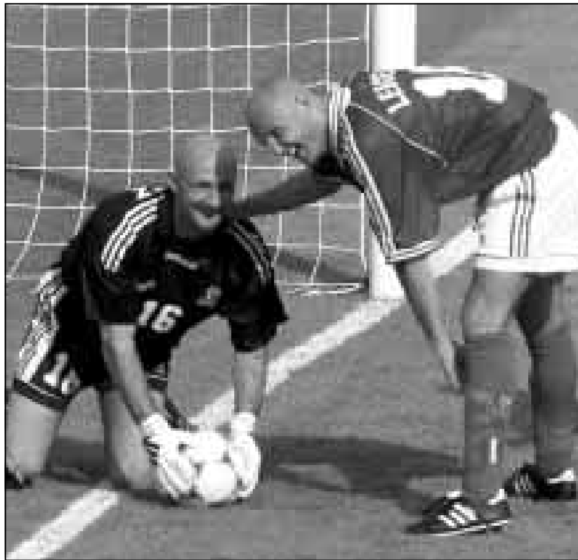
لقطة من إحدى مباريات منتخب فرنسا في كأس العالم