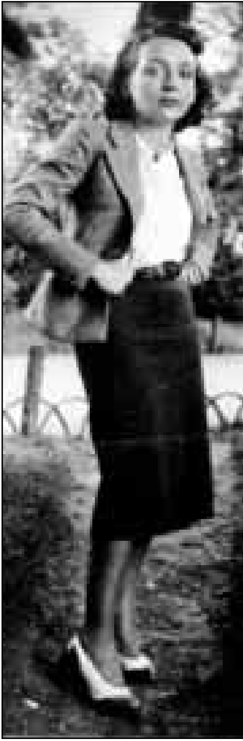
دوراس اثناء اعوام المقاومة 1943

ولا بد من الإشارة هنا الى ان الفيلم المستوحى من روايتها «هيروشيما جيبيتي» لاقى نجاحا ساحقا في فرنسا والعالم، ايضا، وهذا ادركت التجاعيد ام باجوانته الحميمية، بل ان مارغريت دوراس سطرت على السينما الفرنسية طيلة عامين محتاليين 1960 - 1961 بحيث ان معظم الافلام التي انتجت في تلك الفترة تأثرت بروح دوراس، بل واكثر من ذلك انها اثرت على ذاكرة