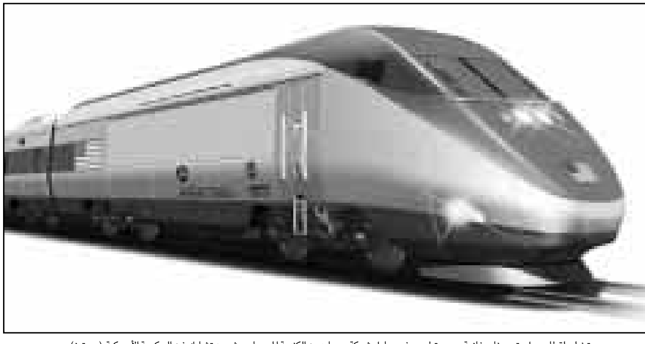
رسم تخيلي لقطار يعمل بتقنية غازية تجري تطويره في معامل شركة بومبارديه الكندية الحسب مشروع تشارك فيه الحكومة الأمريكية

حيث بلغ في مدينة غزة 568 ديناراً منها 203 ديناراً للطعام. وفي مناطق شمال القطاع بلغ معدل الانفاق 542 ديناراً منها 210 على الطعام، أما في الوسط فبلغ 493 ديناراً (174 ديناراً للطعام). وفي جنوب قطاع غزة لم يزد متوسط انفاق الاسرة شهرياً على 367 ديناراً منها 156 ديناراً للطعام. ويبلغ متوسط انفاق الاسرة شهرياً في الأراضي الفلسطينية على السكن 41 ديناراً، وعلى وسائل النقل والاتصالات 62 ديناراً. وتتفق الاسرة في مجالات أخرى مثل الهدايا والرسوم والضرائب والزيارات وغيرها 50 ديناراً شهرياً، بينما يبلغ معدل الانفاق على العناية الشخصية 12 ديناراً فقط وهو أقل من الانفاق على السبغ والسجائر الذي يبلغ متوسطه للأسرة 28 ديناراً. أما عن توزيع انفاق الاسرة الفلسطينية