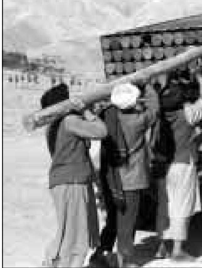
مجموعة من قوات طالبان يجيزون منصة صواريخ