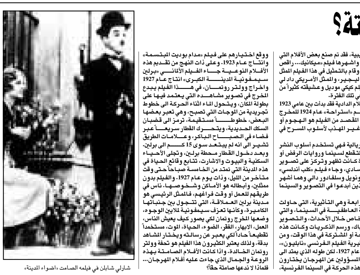
شارلي شابلن في فيلمه الصامت 'اضواء المدينة'

هل تتكثرون بفتح نادى ليلي، كما فعلت بعض ميلكات؟ أبدا، فانا لا أحب اجواء السرير، ولا أحب الكحول، ففور ان