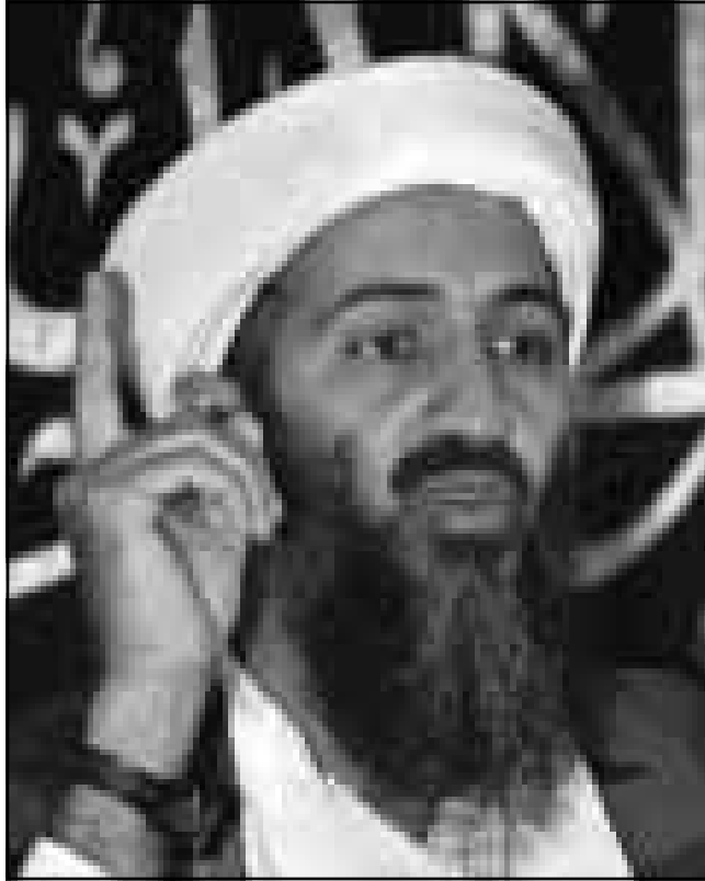
أسامة بن لادن

وأضاف «لقد طلبنا بشكل متكرر من طالبان كسما طلبنا من أولئك الذين يمكنهم تفويضا على طالبان أن توفق أفغانستان تقديم ملامن للإرهابيين. ولكن الوضع لم يتغير». مضيفا بأن