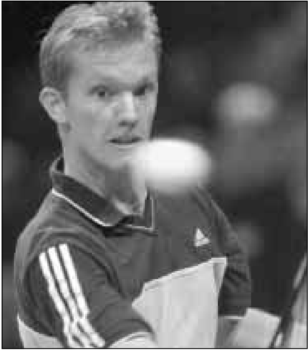
اللاعب السويدي توماس جوهانسون

■ فيلدرشتاد (المانيا) - روبرت: خرجت بطلة ويمبلدون التشيكية يانا نوفوتنا من بطولة فيلدرشتاد للتنس للسيدات بالمانيا بسبب اصابة في الظهر. واضطرت نوفوتنا للاعبية الثالثة على مستوى العالم الانسحاب من مبارياتها في الدور الثاني امام الأمريكية سيرينا وليامز رغم انها فازت بالجمعة الاولى 6/1 وخسرت الثانية 6/3 و كانت مقدمة 2/صفر في الثالثة وقت انسحابها. في جولة اخرى تاهلت المصنفة الرابعة في البطولة الفرنسية ارنستسا ساشينز فيكتور لوفور الثمانية بعد الفوز على الفرنسية ابيجلي موراسيمجو 3/6 و 3/6. وفازت النصف الخامسة الفرنسية تاتالي تويزيا على لاعبة روسيا البيضاء ناتاشا زيفريفا 6/3 و 3/6.