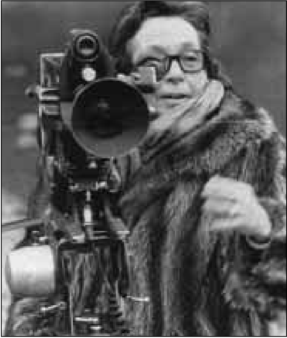
مارغريت دوراس السينمائية

ومن اجل انجاز هذه السيرة الحياتية سافرت لور أدلر الى وفون بيه، وسالها، حيث كتبت مازغريت دوراس وروايتها الشهيرة «العشيق» واكتشفت ان الديكور اللوصوف في روايتها هذه يشبه الى حد كبير ديكتورا India Song وانها لا يوجد في سايفون (مدرسة داخلية) وتبع كاتبة سيرة حياة مارغريت دوراس ان الروائية كانت تتخطع بخيالها بل وتبالغ حتى تخيلت امها تعمل عازقة بيانو في Eden Cinema الذي لميس العمل الروائي ثمره الخلية؟ بيدو ان لور أدلر فهمت الروائية على نحو اخر.