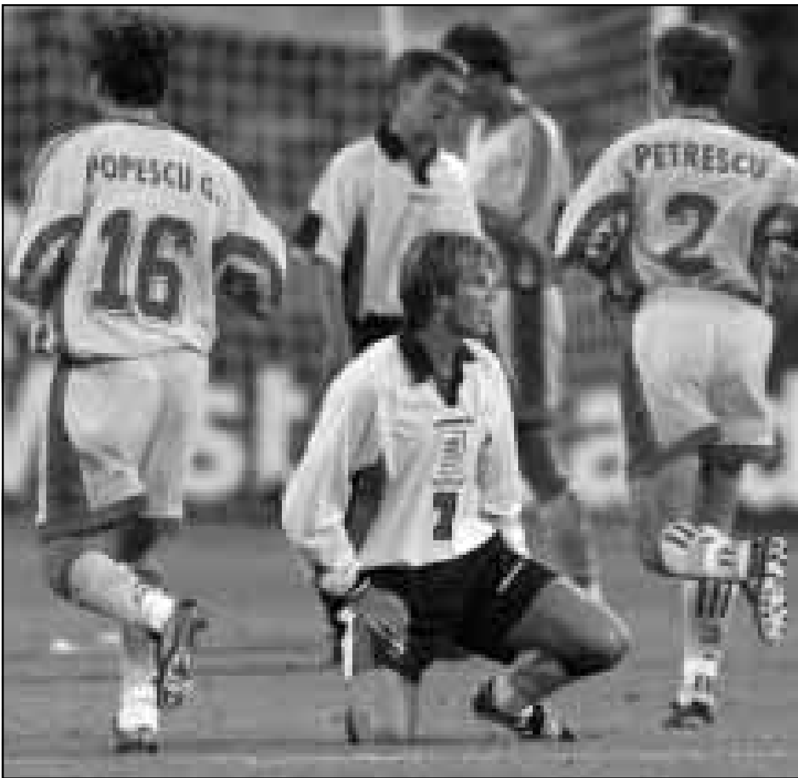
لقطة من إحدى مباريات منتخب انكلترا في كأس العالم