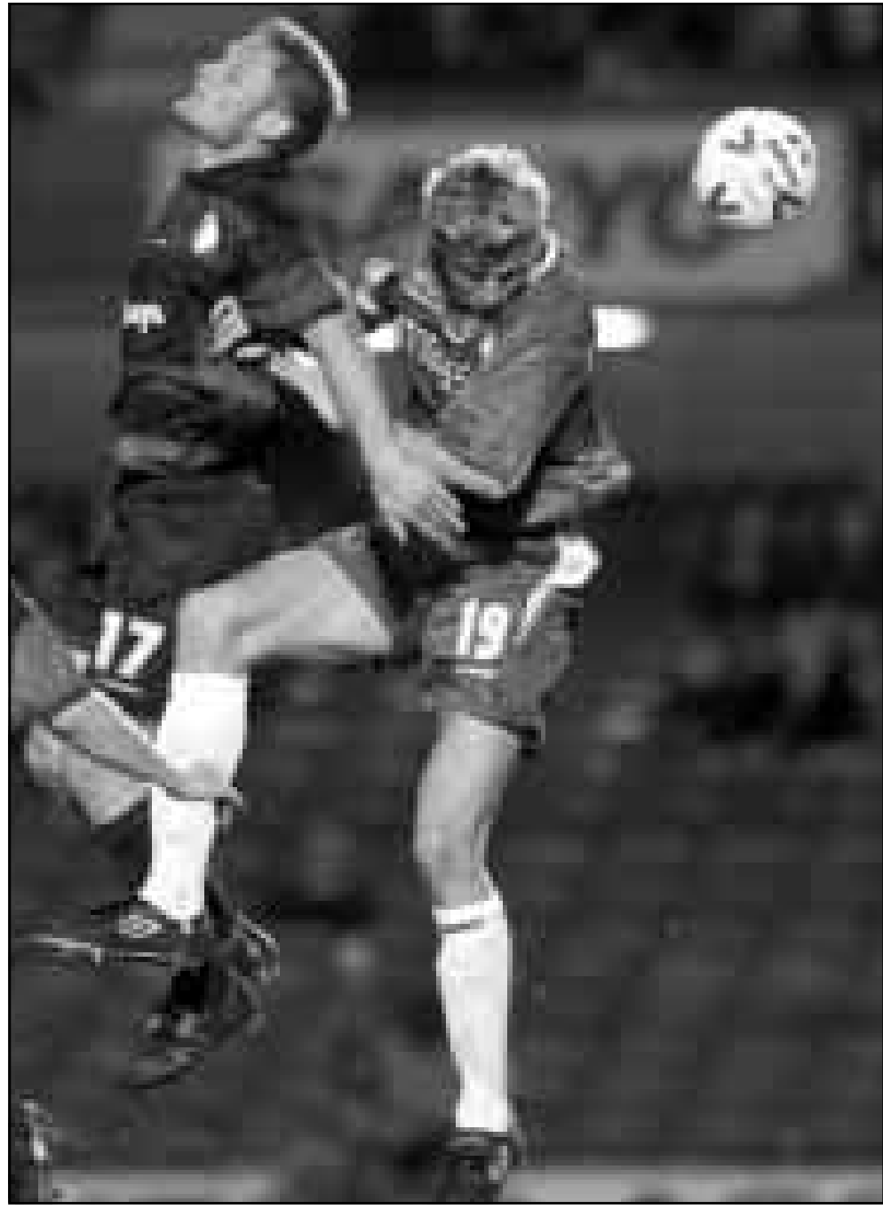
لاعب تشيلسي تو اندريه فلو (الى اليمين) في صراع على الكرة مع مايكل ميلو نيلسين (رويتز)

ويقول كول في هذا الصدد: «شراكتي مع بوردو رائعة وهي الافضل منذ ان بدأت مسيرتي الاحترافية».