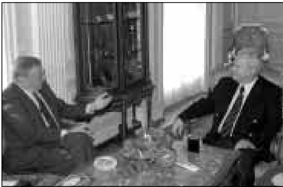
الرئيس اليوغوسلافي سلوبودان ميلوسيفيتش اثناء استقباله الجمعة في بلغراد رئيس بعثة المراقبين الدوليين الى كوسوفو ووليام وكور

استحقاق جديد قبل توجيه اي ضربة. 3- يلغي حلف الاطلسي «امر التفعيل» ويعيد العسكريين والطائرات والسفن الى تكتها والطائرات والمراةء. 4- يقرب الحلقة الاربعة على مهلة معلقة ل «امر التفعيل» اما بطريقة غير محددة. وحتى ينتقل العسكريون الى التحرك يصبح من الضروري حصولهم على موافقة جديدة. وخلال الاجتماع الخميس اعترف المجلس الدائم للحلف بان الرئيس ميلوسيفيتش قام بخطوات في الاتجاه الصحيح، لكن ما زال يتعين عليه القيام بمزيد منها، كما قال المسؤول في الحلف. وأضاف ان المشقة الكبرى هي كوسوفو التي تستخدم الامن الذي يمنع اللاجئين من العودة الى منازلهم، وعدم الاطلسي الاطلسي موعدا محدد لهذا الاستحقاق. ومن المقرر ان يعقد المجلس الدائم للحلف الاطلسي (سواء) اجتماعا بعد ظهر الثلاثاء المقبل في مقر الحلف لاتخاذ واحد من السيناريوهات الاربعة: 1- ينسحب العسكريون الى التحرك ويطلقون اوبلا من الموارخ على اهداف عسكرية صربية في صربيا. 2- يقصر الحلفاء مهمة جديدة مع