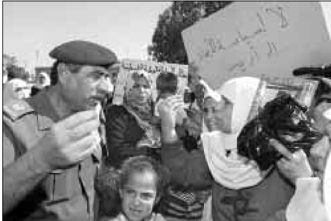
امراة فلسطينية تتجادل مع شرطى فلسطيني اثناء مظاهرة في اريحا تطالب بإطلاق المعتقلين