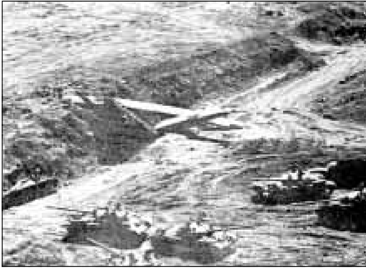
ديابات سورية على أحد المحاور العسكرية في الجولان