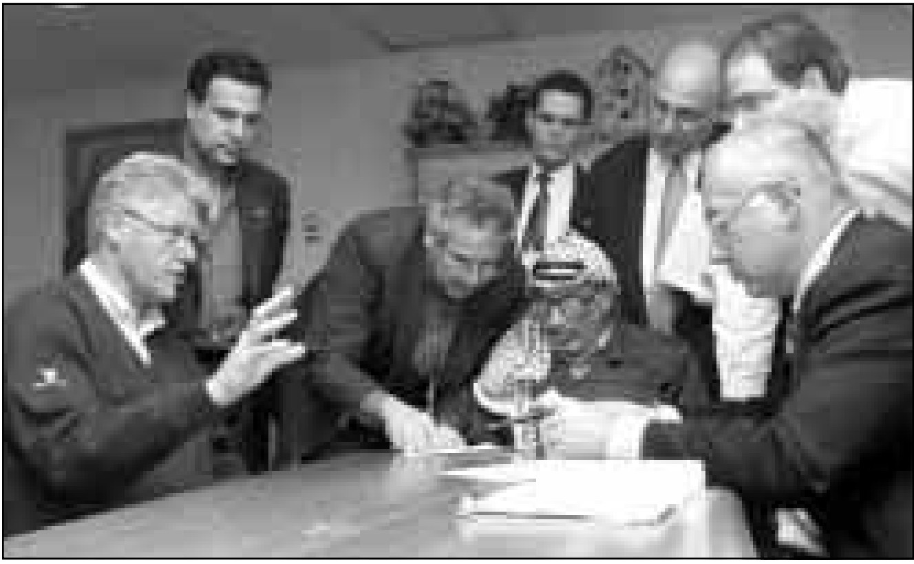
الرئيس الفلسطيني ياسر عرفات يتوسط نتيناهو وكلينتون أثناء قراءة اخيرة لاتفاق