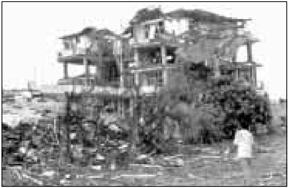
المصنع السوداني المدمر في الخرطوم