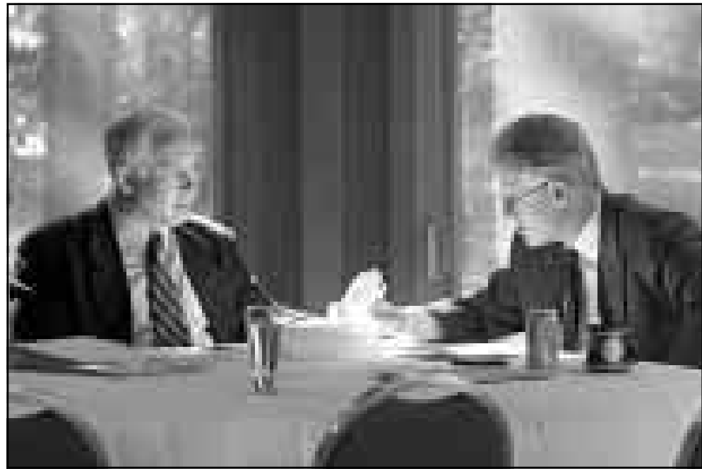
كليتوتون ونتنياهو اثناء مفاوضاتهما الخميس