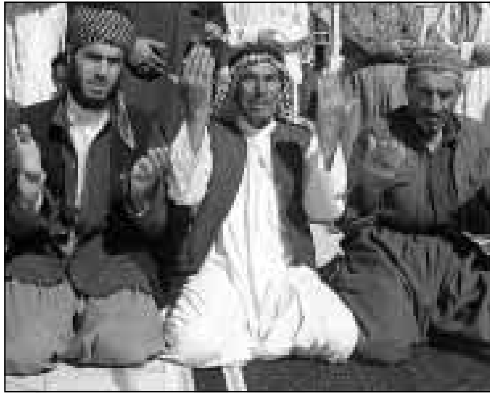
اكراد عراقيون يؤدون صلاة الجمعة في احد مساجد بغداد (رويترز)

■ باريس - اف ب: أعلنت فرنسا الجمعة انها ستحضر على ان تتم إعادة البحث الشاملة لكف نزع الاسلحة العراقية «بجدية وعدم انحياز وسرعة»، اذا تراجع العراق عن قراره بشأن عدم التعاون مع لجنة الامم المتحدة المكلفة نزع اسلحة الدمار الشامل في العراق. انتهى نزع الاسلحة فيصيح بالامكان رفع الحظر المفروض عليه. وأعلن مساعد الناطق باسم وزارة الخارجية الفرنسية فرانسوا ريفاسو خلال اجابته في احد الاسئلة «لقد لاحظنا ان السلطات العراقية تريد الحصول على ايضاحات بشأن إعادة البحث الشاملة». وأضاف «الا أننا نعتبر انه من مصلحة العراق الا ان أكثر من اي وقت مضى ان يرجئ في أقرب فرصة قراره بوقف التعاون مع لجنة الامم المتحدة الذي اتخذه في 5 آب (أغسطس) الماضي، حتى يصبح بالامكان القيام باعادة البحث الشاملة وفقا للقرار 1194». وأشار الى انه «بمجرد ان يطبق هذا القرار، ستحرص السلطات الفرنسية على ان تتم إعادة البحث الشاملة بجدية وعدم انحياز وسرعة بهدف احراز تقدم في ما يتعلق بتطبيق الفقرة الثانية والعشرين من القرار 687، التي تحدد شروط رفع الحظر». من جهة اخرى نفى الناطق المساعد باسم الخارجية الفرنسية فرانسوا ريفاسو عليه بوجود «اطباء فرنسيين في بغداد لمعالجة الرئيس العراقي صدام حسين، مشيرا الى ان ذنابهم لا يخضع لسلطة السلطات الفرنسية بل الى تأشيرة دخول» من مكتب رعاية المصالح العراقية في باريس. وتابع قوله «لا وجود لاجراءات خاصة