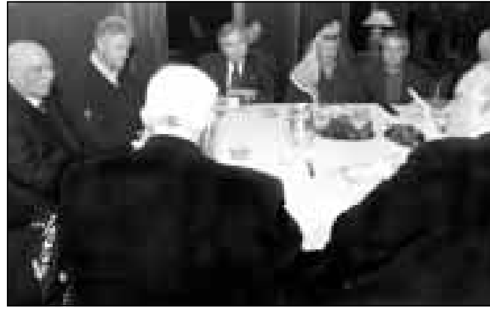
جلسة مفاوضات بحضور الملك حسين

بناء مرفا في غزة وترك ترتيب الخطوات العملية الى لجنة خاصة تقوم ببحث احكام وكات الحكومة الاسرائيلية ترفض العمل. والشركات الاخيرة في قمة واي بلانتيشن مجرد مصدر للبحث في موضوع المرفا.