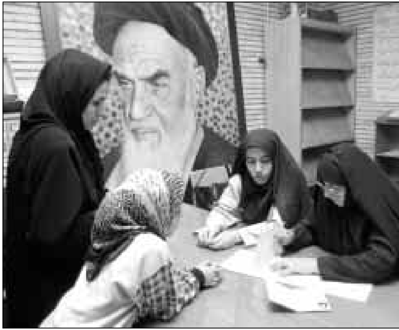
ايرانيين يبدون بصواتهم في الانتخابات الجمعة

مراقبين سياسيين يعتقدون ان عدد المشاركين لن يتعدى ثلث عدد الذين يحق لهم الانتخاب والذين يبلغ عددهم اكثر من 35 مليوناً، نظرا لعدم وجود علاقة مباشرة بين نتائج هذه الانتخابات والاحداث السياسية للمواطنين، الى جانب ان زيادة عدد مرشحي التيار المحافظ يجعلهم اقل حماسا للقبال على صناديق الاقتراع.