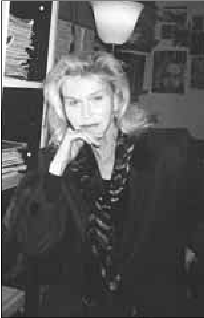
كليز غالوا

■ أجل... في كل عام اذهب إلى صحراء اريزونا... وارى العنابيين.