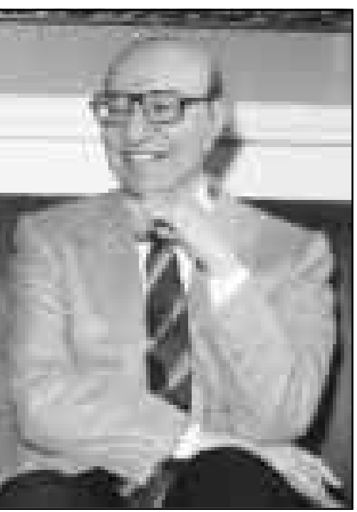
كمال الصباغ يتحدث مع محمد عبد الوهاب