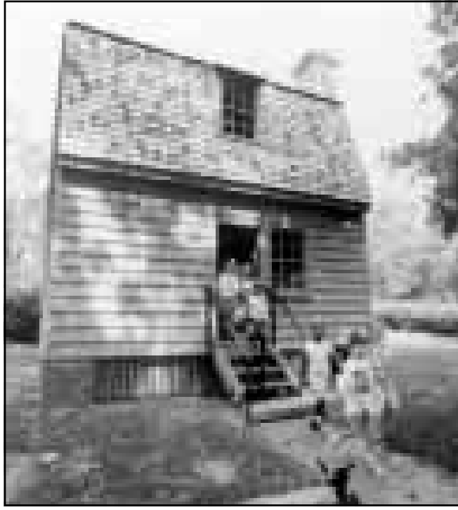
عدد من التلاميذ يزورون المنزل الصغير الذي عاش فيه الرئيس الأسبق اندرو جونسون في غرينفيل في ولاية تينيسي