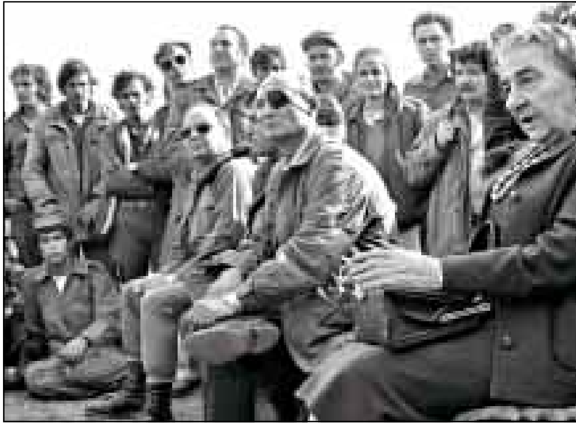
غولداماثير وموشيه دايان يلتقيان بوحدة عسكرية إسرائيلية على جبهة الجولان اثناء الحرب