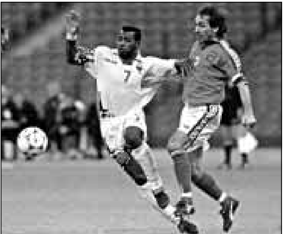
لقطة من إحدى مباريات الامارات