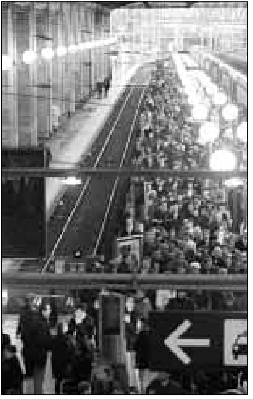
محطة الشمال في باريس مزدحمة بعثات الركاب لنصف القطارات الجمعة نتيجة اضطراب كاد يشل العاصمة الفرنسية

واشنطن - ف ب: اوردت مجلة «ساينس» في عددها الصادر الجمعة ان علماء امريكيين انهوا تحليلا احصائيا لدرجات الحرارة المسجلة في مختلف انحاء العالم يؤكد مسؤولية الانسان عن ارتفاع درجة الحرارة الارضية. وفي محاولة لتحديد اسباب الظاهرة لاجبار على حصر الخلاف الجوهري (ان سي ان آر) في بولدر (ولاية كولورادو) وملاؤه بمقارنة درجات الحرارة التي قيست في نصف الكرة الارضية خلال السنوات الـ 11 الاخيرة بدرجات حرارة مأخوذة من نمودجين احصائيين. واستنتج اصحاب الدراسة ان التباين في درجات الحرارة لا يمكن ان يكون مرده عوامل خارجية عن الدوران المناخي الطبيعي. وحاج في الدراسة ان تزايد قوة اشعة الشمس لا يمكن ان يكون وحده لسببوا عن ارتفاع متوسط درجات الحرارة