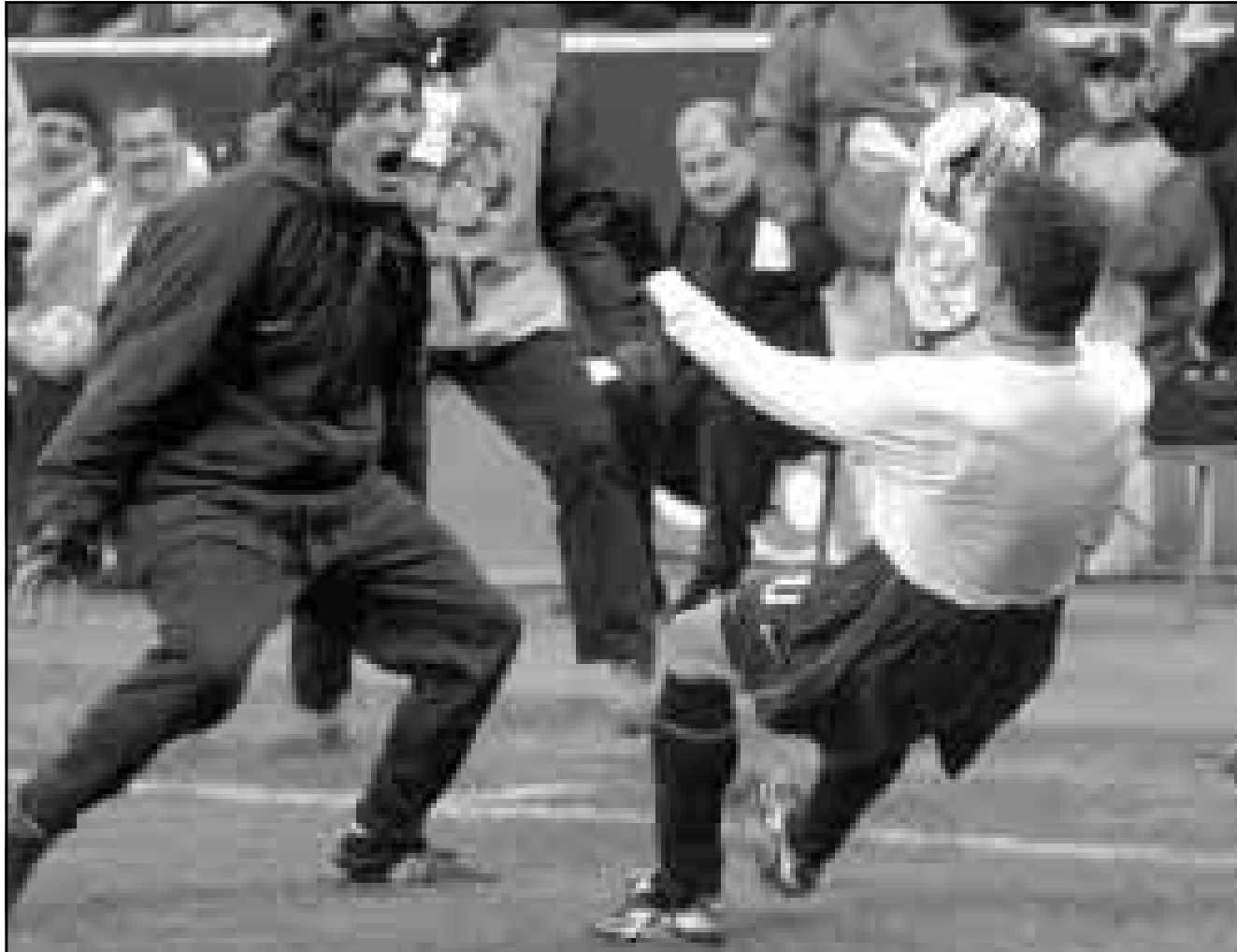
ايفان زامورانو لاعب انترميلان (الى اليسار) يحتفل مع زميله روبرتو باجيو (الى اليمين) بالهدف ضد ريال مدريد

الاحد: باريا - فيورنتينا بولونيا - يوفنتوس امبولي - سيتشذرا ميلان - ساليرينيتانا بارما - انتر ميلان