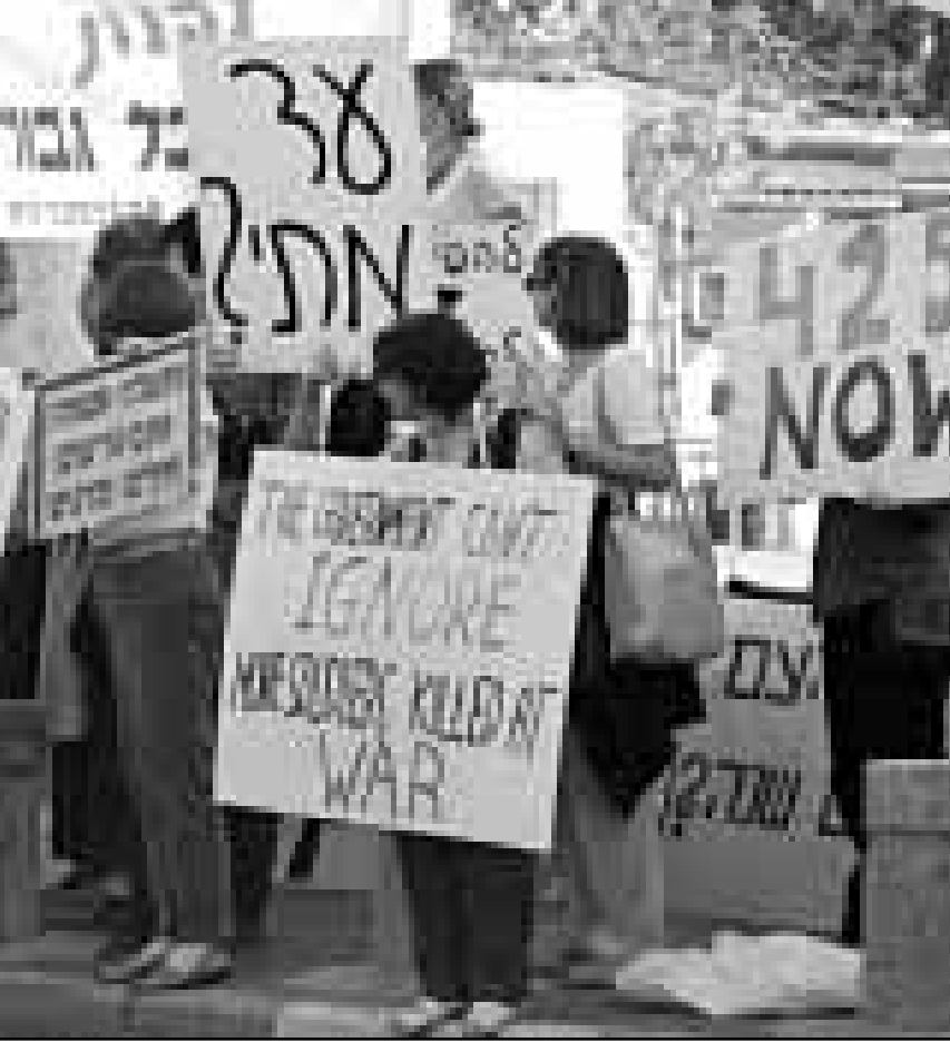
اسراييليون يتظاهرون للمطالبة بالانسحاب من جنوب لبنان

واثرت على مرورهما. واثرت على مرورهما. واثرت على مرورهما.