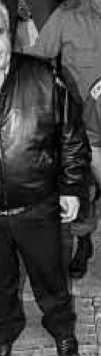
وزير الدفاع الاسراييلي اسحق مورديخي ورئيس ارکان الجيش شاولو موفاز يتفقان قاعدة عسكرية على الحدود مع لبنان

قوات الجيش الاسراييلي في جنوب لبنان ازداد هذا العام (1998) بنسبة الضعف مقارنة مع 651 هجوما سجلت طوال العام الماضي 1997 في القطاع الاوسط من المنطقة الامنية التي تحتلها اسرائيل في جنوب لبنان.