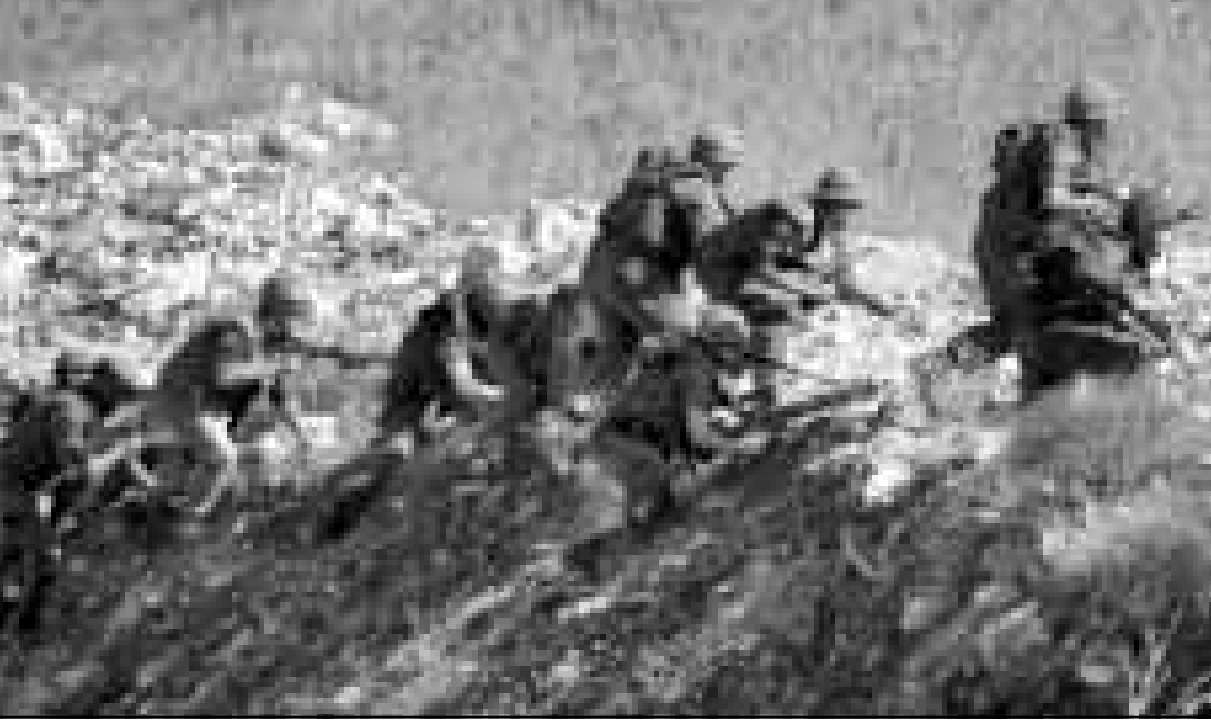
جنود اسرائيليون يعبرون الحدود اللبنانية أثناء تدريبات عسكرية ورتينية

وقال الجنرال في الاذاعة الرسمية «يجب الالغفد اعصابنا. فالشعب والجيش الاسرائيلين شهدا في الماضي اياما عصيبة ولا بد من ان نتخلى بضغط النفس ونظهر بظهير الاقوياء طاملا بيقينا في لبنان». الامن قائد الجيش الاسرائيلي اعتبر انه «لا يوجد حل معجزة في لبنان». وقالت مصادر دفاعية دولية ان الاسرائيليين يجنون انتصاهم حاليا في مواجهة وضع سياسي وعسكري وامني لا يجسدون عليه، وامام مجموعة من القرارات البالغة العصبية التي يتعين عليهم الاختيار بينها. فيما سرتب على قوائم العاملة في لبنان تحمل المزيد من الخسائر في انتظار وصول الحكومة الى السياسات والموافق الفعالة بالتخفيف من تلك الخسائر والحوول دون تزايدها». وقالت مصادر دفاعية دولية ان الاسرائيليين وجدون انفسهم حاليا في مواجهة وضع سياسي وعسكري وامني لا يجسدون عليه، وامام مجموعة من القرارات البالغة العصبية التي يتعين عليهم الاختيار بينها. فيما سرتب على قوائم العاملة في لبنان تحمل المزيد من الخسائر في انتظار وصول الحكومة الى السياسات والموافق الفعالة بالتخفيف من تلك الخسائر والحوول دون تزايدها». وقالت مصادر دفاعية دولية ان الاسرائيليين وجدون انفسهم حاليا في مواجهة وضع سياسي وعسكري وامني لا يجسدون عليه، وامام مجموعة من القرارات البالغة العصبية التي يتعين عليهم الاختيار بينها. فيما سرتب على قوائم العاملة في لبنان تحمل المزيد من الخسائر في انتظار وصول الحكومة الى السياسات والموافق الفعالة بالتخفيف من تلك الخسائر والحوول دون تزايدها».