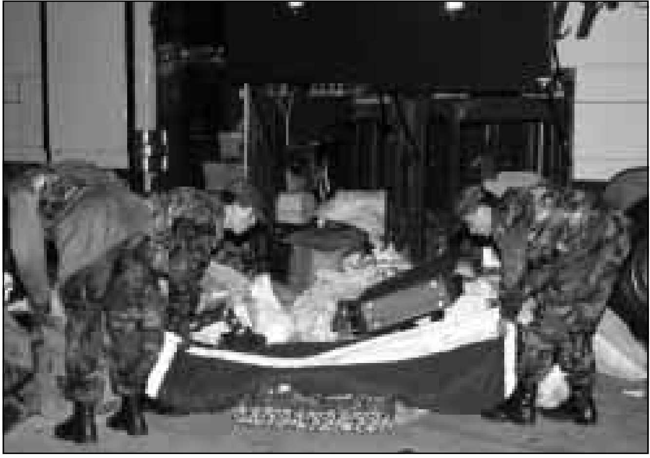
رجال امن اتراك يتفقدون امته ركاب حافلة الجمعة بينما كانت متوجهة من سيباس الى اسطنبول وادت الي مقتل اربعة اشخاص وجرح ششرين آخرين. وكانت الحافلة تقل 45 راكبا بعضهم اقرباء لاضياء في اتحاد الجمعيات والجموع الاسلامية. ولم تعلن اي جهة مسؤوليتها عن الاعتداء

■ انقره - رويترز - اف ب: قالت صحف الجمعة ان زعماء الاحزاب السياسية التركية رفضوا محاولة من الرئيس سليمان دميريل لتأجيل الانتخابات العامة المبكرة والتي من المقرر اجرائها العام المقبل سعيا الى تشكيل حكومة مستقرة. ويجري ديميريل محادثات مع الزعماء في محاولة لتشكيل ائتلاف يحل محل حكومة الاقلية التي يترأسها مسعود يلماظ الذي اسقط بسبب اتهامات بالفساد السلطة على رأس حكومة مؤقتة. وقالت صحيفة «حرية» اليومية ان الرئيس طلب من يلماظ خلال المحادثات التي جرت الخميس تأجيل الانتخابات من 18 نيسان (أبريل) عام 1999 ومحاولة تشكيل حكومة مستقرة. ونقلت الصحيفة عن يلماظ قوله «عازر تأجيل موعد الانتخابات، في حقيقة الامر فضل تقديمها». وقالت الصحيفة ان زعماء الاحزاب الاخرى ومن بينهم الزعيم الاسلامي رجائي طان ورئيسة الوزراء السابقة تانسو تشيلر قدما ردوا معاتلة. في غضون ذلك اعلن بولندا اجاويد نائب رئيس الوزراء التركي وزعيم حزب اليسار الديمقراطي الشريك في الائتلاف الحكومي، الخميس استعداد له لتولي منصب رئيس الوزراء. وقال اجاويد في ختام لقاء مع الرئيس التركي سليمان دميريل انه سيتولى هذه المهمة اذا عرضت عليه على ما ذكرت وكالة انباء «الاناضول». واضاف ان اجاويد لا «انتقلا حكوميا لا يخلف مشاكل لانظامنا السياسي يجب ان يضمن حزب الوطن الام (بزعمارة رئيس الوزراء التركي مسعود يلماظ الذي اسقطه البرلمان) وحزب الطريق القومي (زعامة رئيسة الوزراء السابقة تانسو تشيلر)». استولى المسؤولية الوكالة العليا، وسبق لجاويد (73 عاما) ان تولى