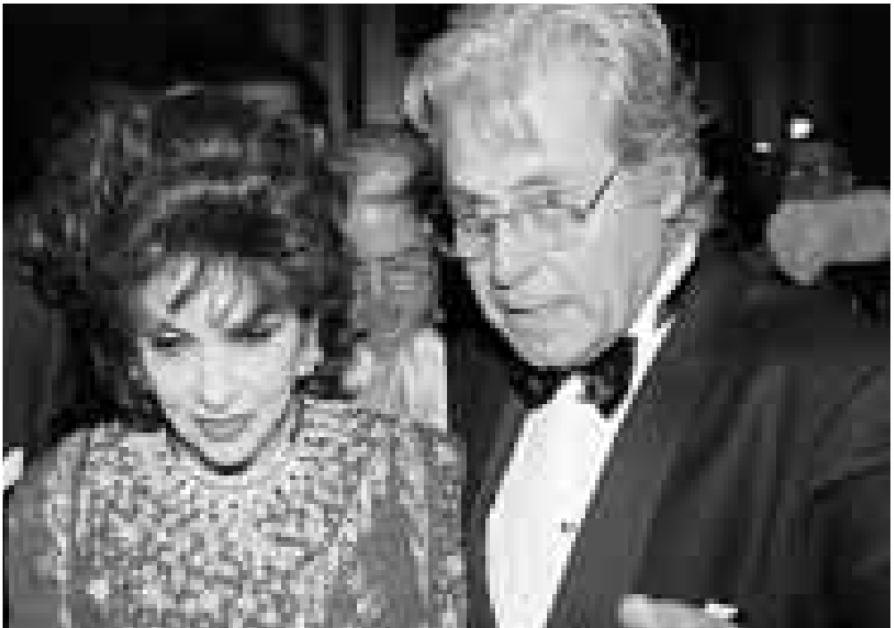
حسين فهمي وجينا لولو بريجيديا