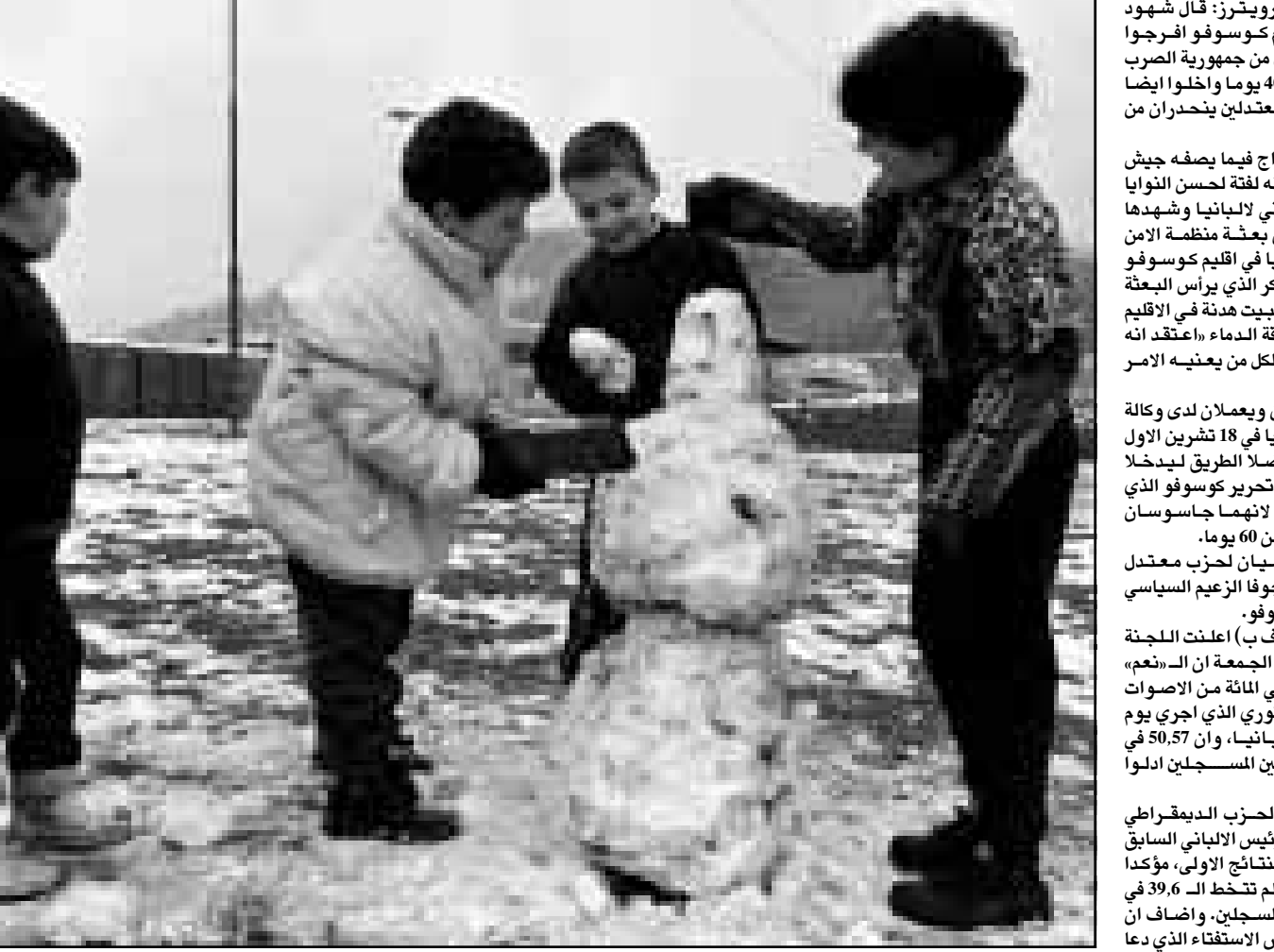
اطفال لاجئون من كوسوفو يلعون بالتلج في مخيم للاجئين حول سراييفو (ا ف ب)

■ دراجوبيلي - رويترز: قال شهود عيان ان ثوار اقليم كوسوفو الفرجوا الجمعة عن صحفين من جمهورية الصرب كانوا اختطفوا منذ 40 يوما واخذوا ايضا سبيلا سياسيين معدلين يندحران من اصل الباني. تمت عملية الافراج فيما يصغه جيش تحرير كوسوفو وانه لفقة لحسن النوايا عشية العيد الوطني لالبانيا وشيدها وليام وكر رئيس بعثة منظمة الامن والتعاون في اوروايا في اقليم كوسوفو المضطرب. وقال وكر الذي يرأس البعثة التي تسعى الى تشييد هدنة في الاقليم الذي تصف ب «رافة الدماء» انه يعتقد انه كان يوما طبيبا لكل من يعنيه الامر وكوسوفو». وقال الصحفيان ويعلمان لدى وكالة اتنوخ لانباء اخفيا في 18 تشرين الاول (اكتوبر) بعد ان ضل الطريق ليدخلا منطقة تابعة لجيش تحرير كوسوفو الذي اعلن انه اعتقلهما لانهما جاسوسان وحكم عليهما بالسجن 60 يوما. يترعه هم ابراهيم روجوفا الزعيم السياسي البارز في اقليم كوسوفو. وفي كيراتنا (اف ب) اعلنت اللجنة المركزية الانتخابية الجمعة ان «ندعم» حصلت على 93.5 في المائة من الاصوات في الاستفتاء الدستوري الذي اجري يوم الاحد الثاني في البانيا. وان 50,87 في المائة من الناخبين المسجلين ادلوا باصواتهم. وقد اعترض حزب الديقراطي المعارض بزعمارة الرئيس الباني السابق صالح بريشا على النتائج الاولى، مؤكدا ان نسبة المشاركة لم تتخط الـ 39,6 في المائة من الناخبين المسجلين. واضاف ان الشعب الباني رفض الاستفتاء الذي دعا الى مقاطعته.