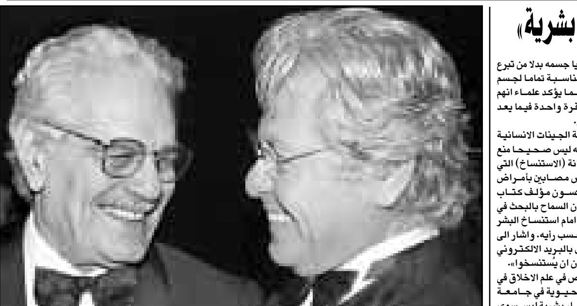
حسين فهيم رئيس المهجران يتبادل ابتساما مع عمر الشريف

قم بعملك بقناعة تامة ولا افسح صدق الفشل. تعاون مع الرفاق لتحصل على نتيجة افضل. لا تحاول اقتحام المخاطر، وتجنب المغامرات التي تفقدك احترام الآخرين، تصلك هدية غير منتظر. لحظات الضيق التي تمر بها ستزول سريعا وكان شيئا لم يكن. تجنب اتخاذ قرار قد تندم عليه لاحقا.