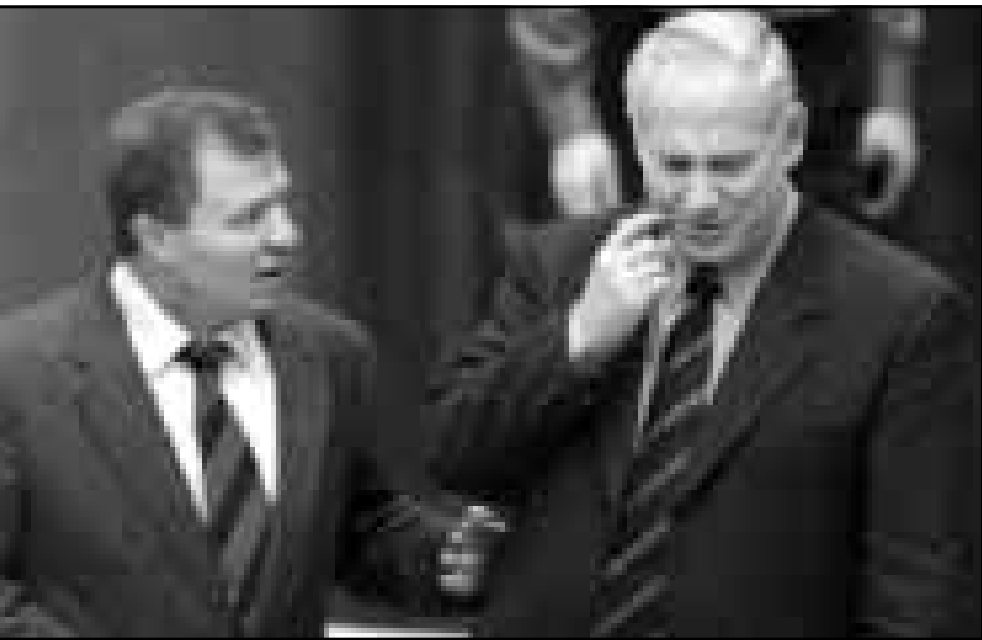
نتنهاو يتشاور مع احد اعضاء الكنيست حول لزمة الحكومة

المطرف بزعامة نتنهاو وعدد من نواب الكنيست انهم يريدون اسقاط الحكومة الاقتصادية يطغي على اي شيء اخر».