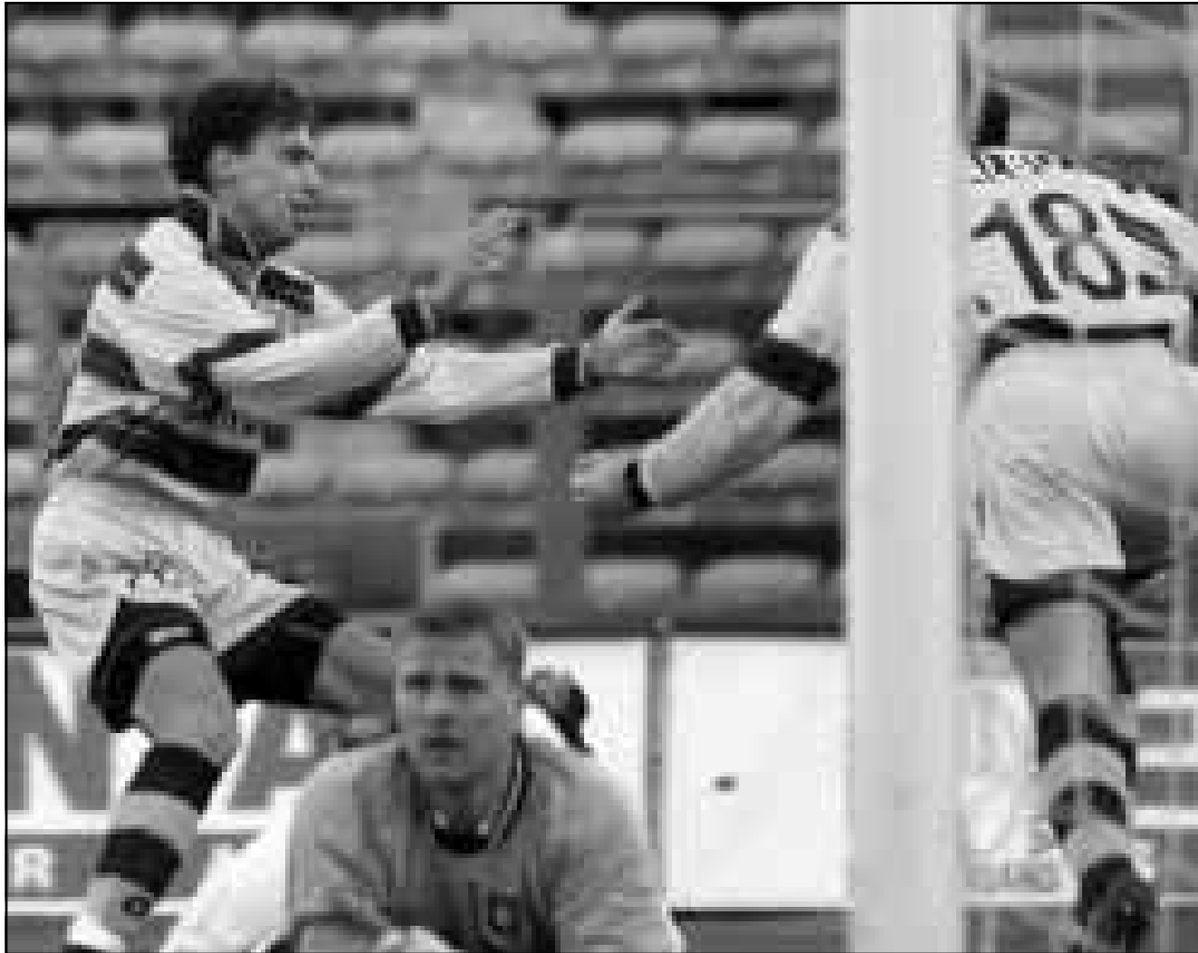
هداف بارما «أبل باليو» (الى اليمين) يعبر عن فرحة بتسديد هدفه في مرمى رينجرز