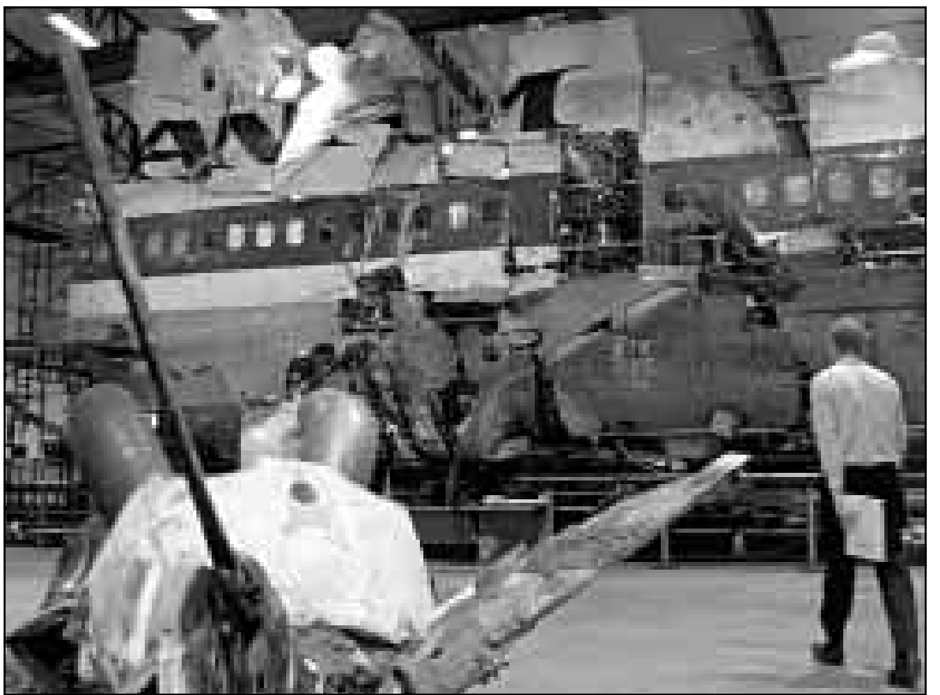
احد خبراء حوادث الطيران يعتقد بقايا طائرة «البانام» الامريكية التي انفجرت فوق لوكربي بحثا عن اذلة وتفاصيل اخرى

السابق واهم قبالن، وجرت العادة ان يتم انتخاب احد اعضاء القيادة القطرية للحزب لرئاسة المجلس الا انه لم يتضح حتى الان من سيكون الرئيس الجديد للمجلس. وحصل قبالن على اعلى نسبة من الاصوات في الانتخابات في دوائره الانتخابية بينما تراجع مركز قدورة في دائرته الانتخابية مما يجعل فرصة قبالن في رئاسة المجلس اكبر بالرغم من انه يتوقع ان يتم اعادة انتخاب قدورة لولاية جديدة. وتضمنت قائمة الجبهة لهذه الدورة التي تستمر اربع سنوات كما في الدورات السابقة 135 مرشحا لحزب البعث الذي يقوده الرئيس السوري حافظ الاسد و32 مرشحا للحزاب الستة الباقية، وتنافس