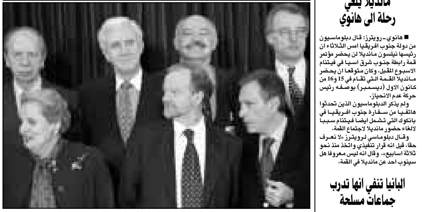
وزراء خارجية حلف «ناتو» لدى اجتماعهم امس ببروكسل

بالاتمئة اليها ولا يمكن ان تطور شعورا بالاتمئة اذا عشنا في المملكة المتحدة او في الصين. ونص مشروع القانون على ان يتحدث المهاجرون الجدد احدى اللغتين الرسميتين في كندا، الفرنسية والانكليزية. واقترحت الوزيرة ايضا صيغة جديدة ليمن الولاة الذي يقسم لكندا ورئيسها الملكة البيزابيت الثانية بدلا من الصيغة الحالية شديدة الملكية البريطانية. ونص مشروع القانون ايضا على ان يحصل الاطفال الذين تتبناهم عائلات كندية على الجنسية من دون ان تطبق عليهم اجراءات الهجرة المعمول بها في كندا.