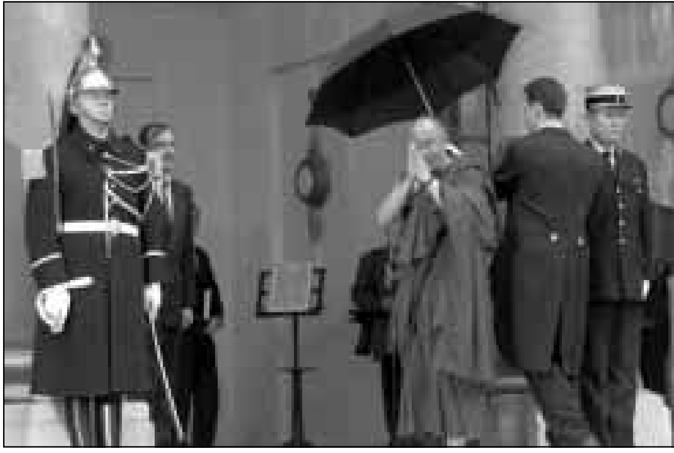
الزعيم الروحي للمتبت دالاي لاما يحيي الصحافيين بطريقته لدى وصوله الى الحدود الذي تخلمه على شرفه الرئيس شيراك امس بباريس

بالاتمئة اليها ولا يمكن ان تطور شعورا بالاتمئة اذا عشنا في المملكة المتحدة او في الصين.