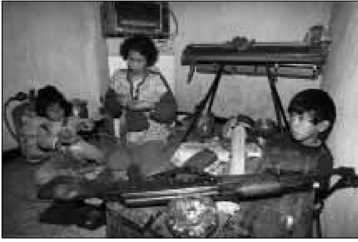
الحياة مستمرة بالنسبة لعائلة عيسة تذكرتها الحكومة الجزائرية ومنحتها بتدنية التواجه ويلات ارمها متوحش في ما يعرف بـ الجزائر العميقة، (رويتز)

■ الجزائر - رويتز: قالت صحيفة «الوطن» الجزائرية أمس الثلاثاء ان عمال اغانة استخرجوا 35 جثة من مقبرتين جماعيتين بالقرب من الجزائر العاصمة يعتقد انها لضحايا مذابح المتشددين الاسلاميين.