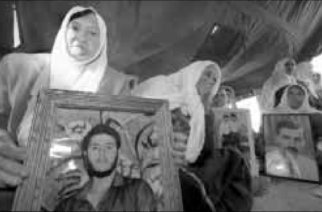
فلسطينيات يحملن صور ابنتاهن المعتقلتين أثناء اعتصام في مدينة بيت لحم امس

وعددت اللجنة الطلابية الدولية في مدينة نابلس امس الثلاثاء ان