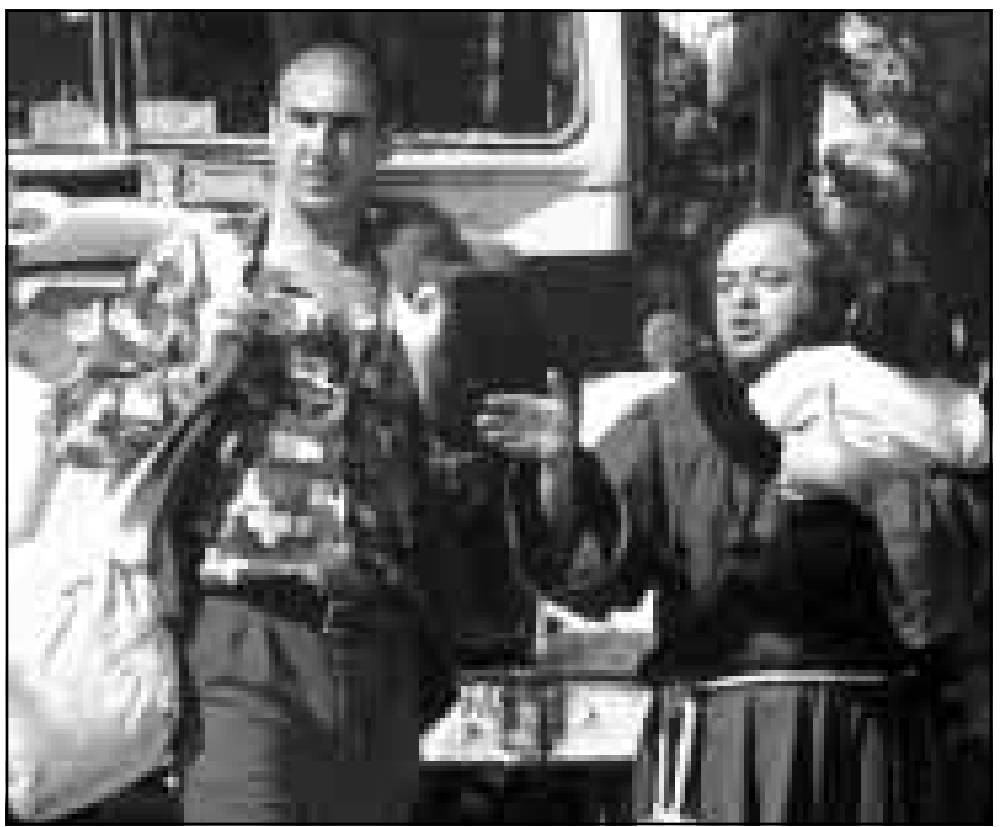
نجم الكرة الفرنسي ايريك كانتونا (الى اليسار) يشارك في بطولة فيلم جديد بعنوان «مكي» واللغة اخذت له خلال تصوير الفيلم في باريس امس الاول

نقطة. * وقع المهاجم الدولي البولندي بيوتر رايس عقدا مع هرثا برلين الالمانى حتى 30 حزيران (يونيو) 2002. وقد يلعب الجمعة المقبل مع هرثا برلين ضد هامبورغ ضمن الدوري الالمانى في حال اعطاء الاتحاد البولندي الضوء الاخضر. وقال مدرب الفريق الالمانى يورغن روبر «انه لاعب سريع وشهيته مفتوحة الى تسجيل الاهداف». * اختار الاتحاد الدولي للتاريخ والاحصائيات الايطاليان جاني ريفيرا وديتو زوف افضل لاعب وحارس مرمى للقرن الحالي على التوالي. وتقدم ريفيرا لاعب ميلان سابقا على مواطنه جوسيب ميازا، الذي كان ضمن المنتخب الايطالي بطل العالم عامي 1934 و1938، فيما تقدم زوف الحائز مع منتخب بلاده كأس العالم عام 1982 على جامبيرو كومي (148 نقطة مقابل 49). وحل والتر زيتغا ثالثا برصيد 18