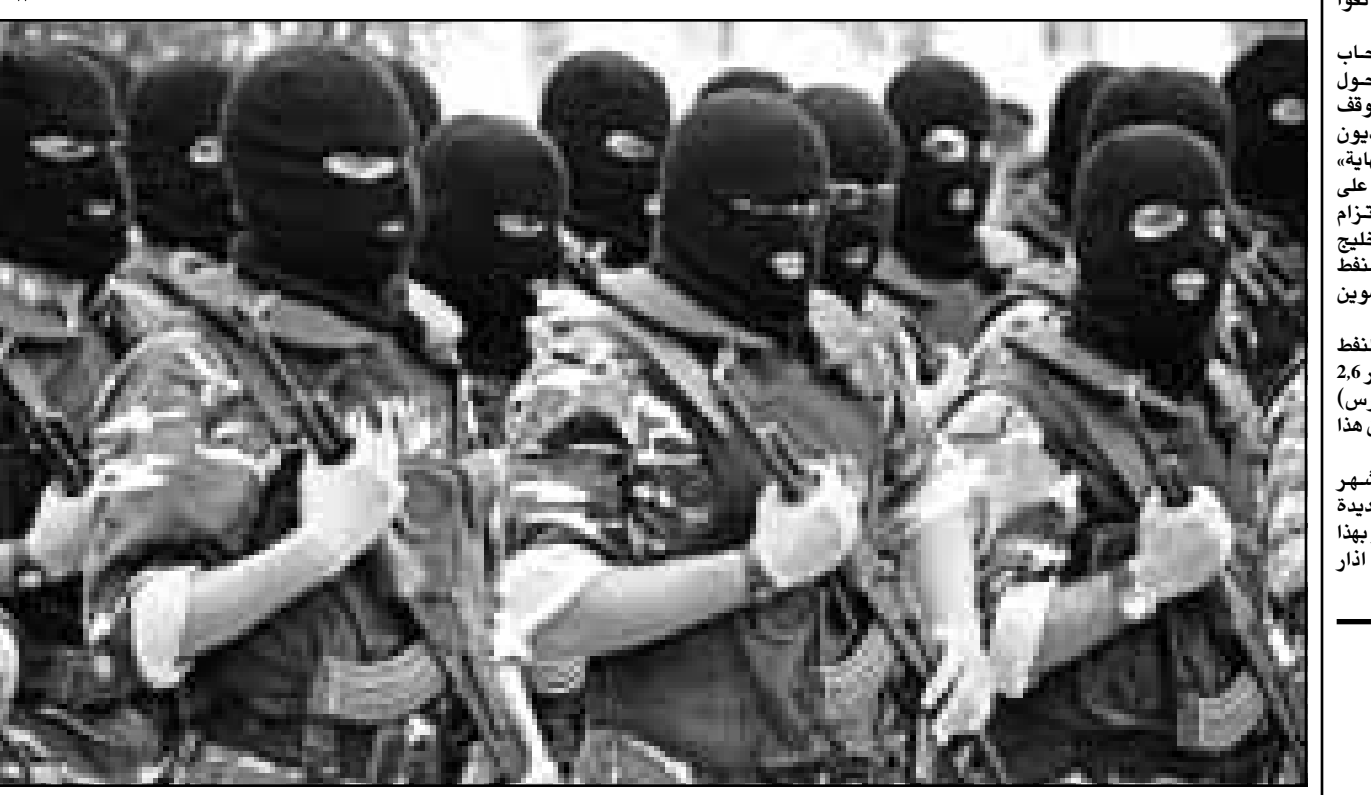
مجموعة من قوات الشرطة الفلسطينية المقتعة اثناء تدريبات في غزة على مكافحة الارهاب

الخطيرة والمتعددة ان تخلى عن ارض الأن». وأضاف «لا نستطيع القيام بذلك بسبب الانتهاكات التي تشهدها عليها اليوم، اسرائيل ملتزمة باسلام ومستعدة لواقعة عملية السلام، لكن ليس باي ثمن». وقد أكد ننتياهو انه ليس واقفاً من زيارة الرئيس الامريكي بيل كلينتون الى اسرائيل والاراضي الفلسطينية في الاسبوع المقبل تستمع بتحريك امري السلم، وقال ننتياهو ان زيارة كلينتون «قد تسعد، لكنها قد لا تسعد ايضا، وفي اي حال سرحبه به». وحط ثلاث مروحيات من البحرية الامريكية امس في مدينة بيت لحم الفلسطينية لأول مرة لتخصير وصول الرئيس الامريكي. وحطت المروحيات الامريكية التي كانت تصطحبها مروحيات الامريكية منذ انطلاقها من القدس امام مركز الشرطة في بيت ساحور في مدخل بيت لحم للتعرف على الارض من القعت في اتجاه غزة. ومن المتوقع ان يزور الرئيس الامريكي بيل كلينتون في القدس في الولايات المتحدة هذا العام لتأكيد في غزة مع قائد الاسرائيل كما انه سيقتل الاثنان الى ثلاثة من السلاطة ان الى بيت لحم حيث سيرزوا الاماكن المقدسة المسيحية. وفي بيت لحم سيصل كلينتون الى مدينة انقبت راسا على عقب بسبب ورشات البناء التي اقامها الفلسطينيون