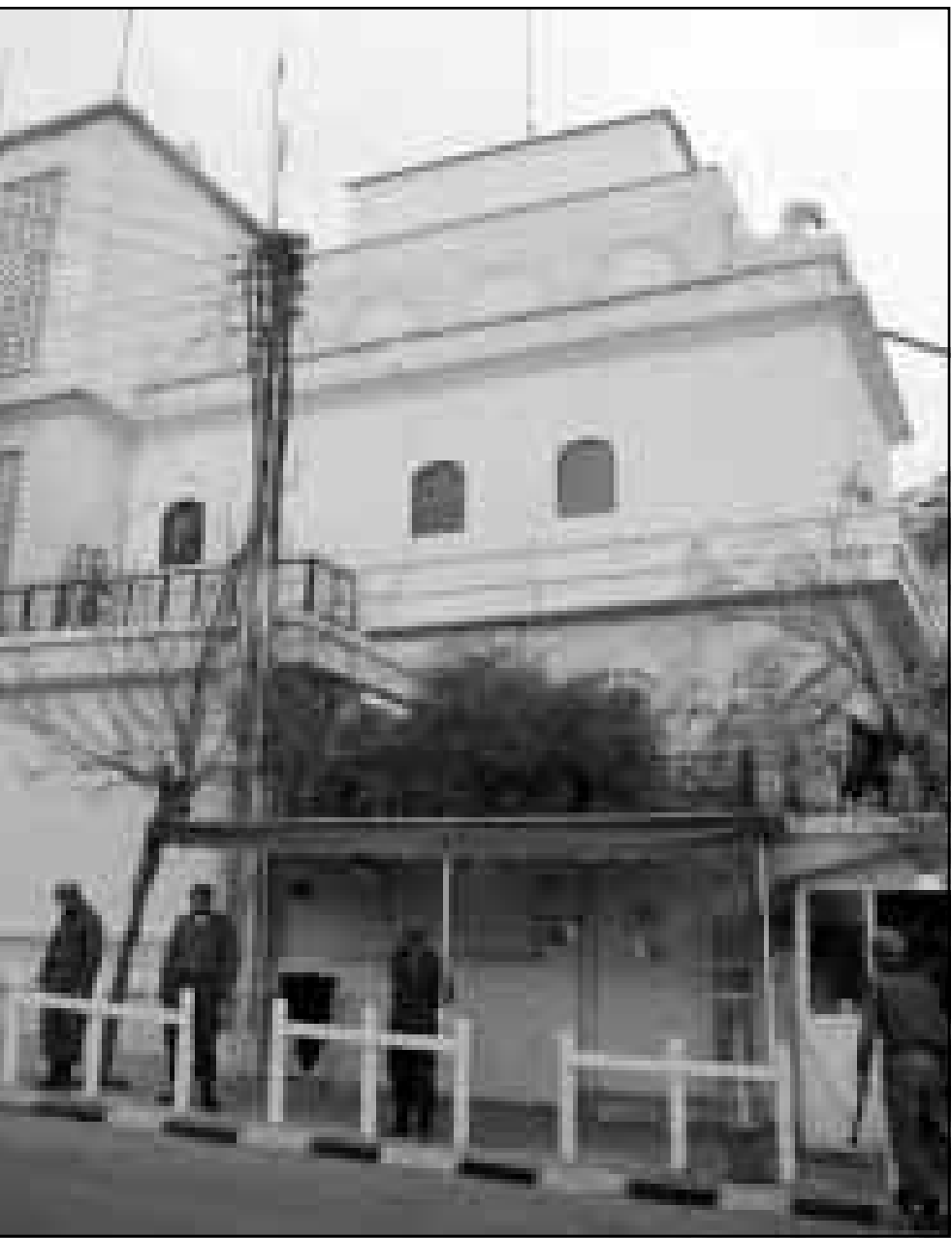
جنود سوريون يحرسون السفارة الأمريكية

وأفاد شهود عيان ان مباني السفارة الامريكية ومقر السفير الامريكي راين كروكر والمركز الثقافي الامريكي والجلس الثقافي البريطاني ومقر السفير البريطاني وضعت تحت حماية أمنية مشددة يشارك بها عشرات من رجال البوليس الزودين بالهراوات والتمسك بالقباب المهيبة في قطاع غزة دون ان يبلغ عن وقوع اصابات.