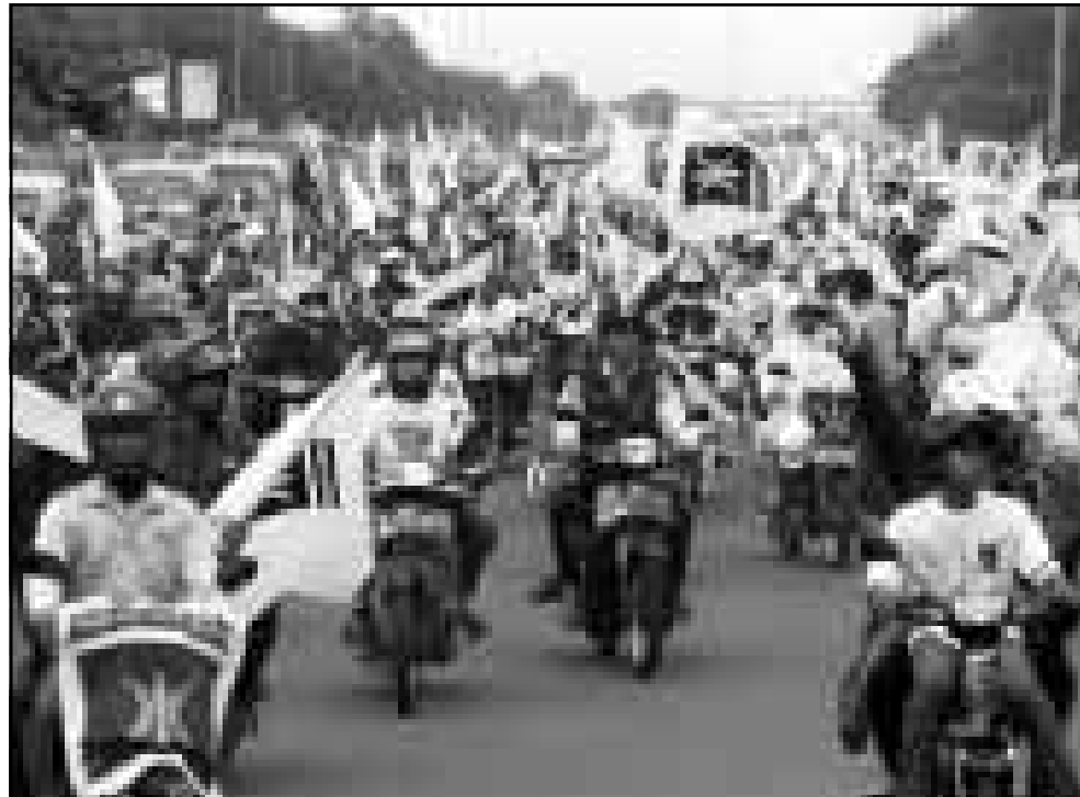
تظاهرة على البرجات نظمها أعضاء حزب «العدالة» الإسلامي في جاكرتا

واشنطن - رويترز: بينما كان مجلس النواب يصوت على بنود الإقالة، وانتهى الحديث في الوقت نفسه الذي انتهى فيه التصويت على البند الأول، وقد انتقل كلينتون إلى مكتب مجاور وبعد ذلك ابتغى وجيزة أعمله الأمين العام للبيت الأبيض جون بوريستا ومستشار آخر هو دوغلاس سوسنيك بنتيجة التصويت.