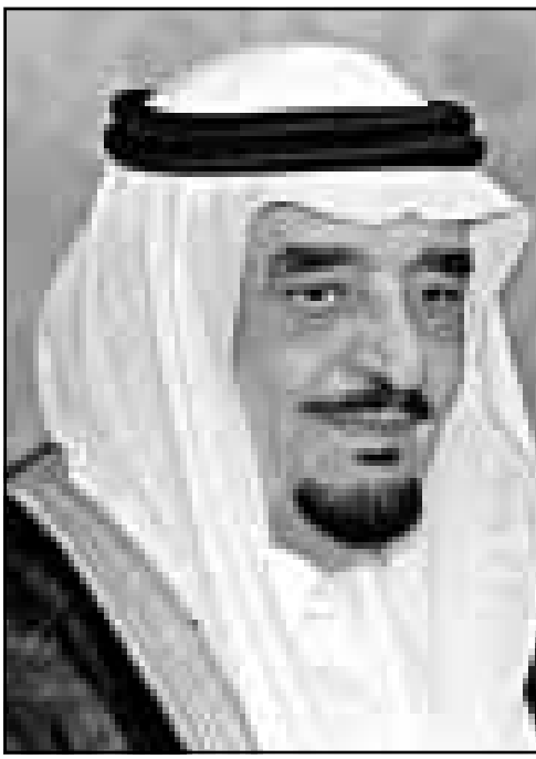
العامل السعودي الملك فهد بن عبد العزيز

وفي مقابل السياسات المالية الحكومية المتعثرة احياناً، كان القطاع الخاص يحقق نجاحات لا يستهان بها ويزيد