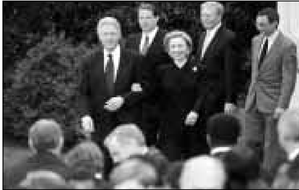
كلينتون وهيلاري يسيران جنباً إلى جنب أمام تجمع من النواب الديمقراطيين لالقاء كلمة حول تبنى مجلس النواب بنود اقالة الرئيس

واشنطن - أعلن الرئيس الديمقراطيون وطالبوه بالاستقالة، وحينئذ تدخل الديمقراطيون في مجلس الشيوخ المكثفون بمحاكمة الرئيس بيل كلينتون بعد تبنى مجلس النواب بقاؤه، قائلاً إنه مستعدون لمحاكمة الرئيس بكل انصاف. وأشار زعيم الأغلبية الجمهورية تريت لوت في بيان إلى أن أعضاء مجلس الشيوخ مستعدون للقيام بواجبهم الدستوري، وإن كل عضو من مجلس الشيوخ سيُقسم أنه سيحكم بعدل بحسب الدستور والقوانين. وقال لوت إن المحاكمة تتطلب «فترة زمنية» لتنظيمها، وأن «تحديد الموعد سيكون مرهونا لحشد كبير بالرئيس ومحاميه». وأشار إلى أن أجهزة حرس الشيوخ القضائية قد حضرت محضراً تاريخياً وقائمة القوانين التي تسير إجراءات الأقالمة، وكان أعضاء اللجنة القضائية في مجلس النواب الأمريكي، وعدهم ثلاثة عشر نائباً سيقومون بدور الادعاء خلال محاكمة كلينتون، أرسلوا بندي الأقالمة السبت إلى مجلس الشيوخ. وانتقل النواب الجمهوريون منيا على الإقدام من مجلس النواب إلى مجلس الشيوخ عابرين مبنى الكابيتول لتسليم وثائق القضية بشكل رسمي.