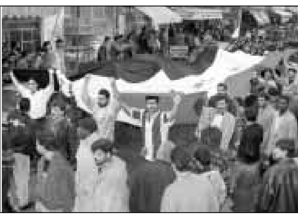
فلسطينيون من مخيم شاتيلا يرفعون العلم العراقي اثناء مظاهرة اسس احتجاجا على العدوان على بغداد

عرفات يرحب بوقف الغارات على العراق اسرائيل تعلن توزيع الاقنعة الواقية من الغازات على الموظفين الاجانب نتيهاؤ: نحن حليف افضل للولايات المتحدة من الفلسطينيين