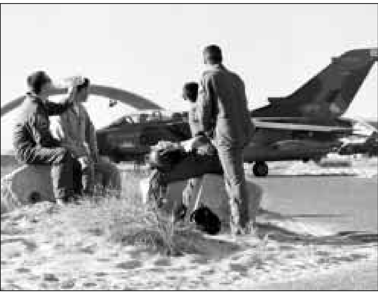
ضباط بريطانيون في قاعدة كويتية بعد انتهاء الغارات

واشنطن - «القدس العربي»: أعلن العديد من أعضاء الكونغرس الأمريكي عن تجميع النواب السود من معارضتهم العدوان الأمريكي البريطاني على العراق ونددوا بالرئيس الأمريكي بيل كلينتون لاتخاذ قرار العدوان على العراق دون استشارة الكونغرس أو محاولة إيجاد إجماع في الراي داخل مجلس الأمن أولاً. وكان أعضاء تجمع النواب السود من بين أقوى اللوبيين لكلينتون في فضيحته الجنسية مع مونكا لويسكي، وقال العديد منهم أنهم سيواصلون تأييد الرئيس كلينتون في وجهه ضد إجراءات عزله التي من المتوقع أن يقرها مجلس النواب الأمريكي، وفي النهاية غلب العقل الأمريكي، والانتخابات الأخريتان كاشتا برابطتين في البيت الأبيض، وقال العقيد سلاح الجو الأمريكي، سنيف البيروسي للصحافيين عبر الهاتف في مقر وزارة الدفاع الأمريكية (البيتاغون) من سلطنة عمان حيث كان عاد بعد الغارة التي شنها على بغداد، أن هذه المرة الأولى التي تلقى فيها العقيلة بقبائليها على أهداف للعقد وانا أقولها، وتبلغ قوته القنبلة الواحدة 226 كغوقرية، وكما أن الطائرون تحمل أيضا 30 قنبلة 500 رطل، وقابل ويلبورسي خلال لقائه تفاسيل عن نوع وحمق القنابل التي أسقطتها طائرته على ما وصفه بأنه «مجمع عسكري ضخم قرب بغداد»، وقال إن المهمة التي قامت بها القاذفة بي-1 بي تكصف أهداف في العراق.