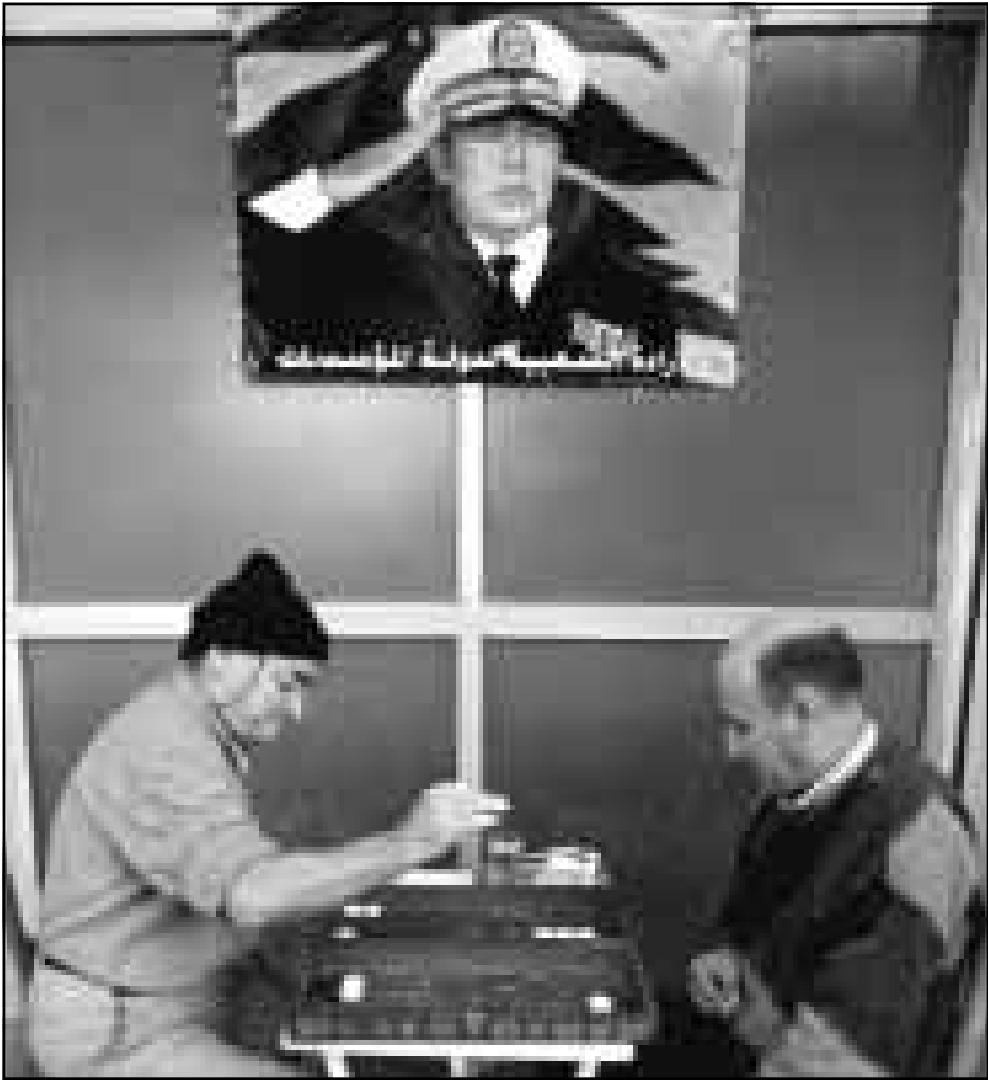
لبنانيان يلعبان طرلة الزهر في مقهى علقت على جداره صورة الرئيس اللبناني

المعينين من خارج ملاك وزارة الخارجية (بين السفراء السفير جوني عبدو الذي عينه رئيس الحكومة رفيق الحريري سفيرا ملحقا برئيس الحكومة الامر الذي اعتبر خرقا للقانون وسفيرا لبناني في واشنطن محمد شطح القرب من الرئيس الحريري ايضا) وفي القرارات المالية «قرر مجلس الوزراء اعادة النظر في موازنة كل وزارة وتفصيل الجباية والتشديد في جباية فواتير الكهرباء والتعميم على المؤسسات العامة التشديد في تطبيق الدوام الرسمي واعادة العمل باجهزة ضبط الدوام في كل ادارة ومؤسسات ومعالجة مجلس الوزراء مواضيع ادارية لتفعيل الانتاجية وضبط العمل والوكالة الوطنية للاعلام والتلفزيون لبنان». وفي التعيينات الادارية والامينية قرر مجلس الوزراء تعيين الدكتور ميشال ثابت رئيسا للوزراء العائلي وفتوح هيدومس رئيسا لهيئة التقنيش المركزي ومنذر الخطيب ونيسا لمجلس الخدمة المدنية وفي التعيينات العسكرية والامينية العميد ميشال سليمان قائدا للجيش (العسيدر سليمان هو من بلدة عسيت في قضاء جبيل من مواليد 1948 ودخل الى السلك العسكري عام 67 وكان رئيسا لفرع المخابرات في منطقة جبل لبنان عام 90 وامينا لاركان في قيادة الجيش عام 91 وقائدا للواء المشاة السادس اعتبارا من العام 96 وهو حائز على اجازة في العلوم السياسية والادارية).