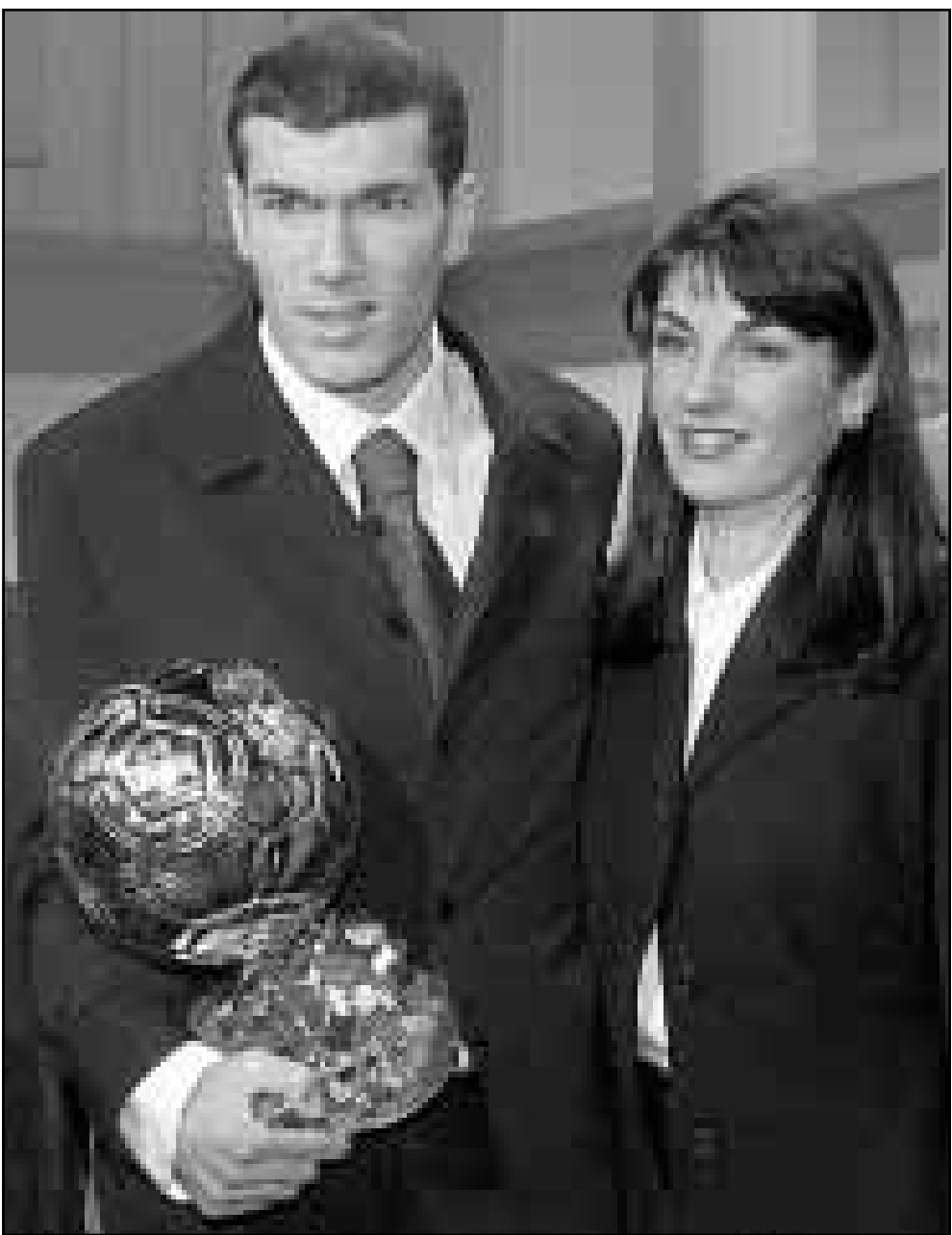
نجم المنتخب الفرنسي لكرة القدم، الجزائري الاصل، زين الدين زيدان يحمل «الكرة الذهبية» التي توجه احسن لاعب في اوروبا لسنة 1998 وتظهر الى جانبه زوجته فيرون، وكان زيدان اختير ايضا كأفضل شخصية رياضية لهذا العام.