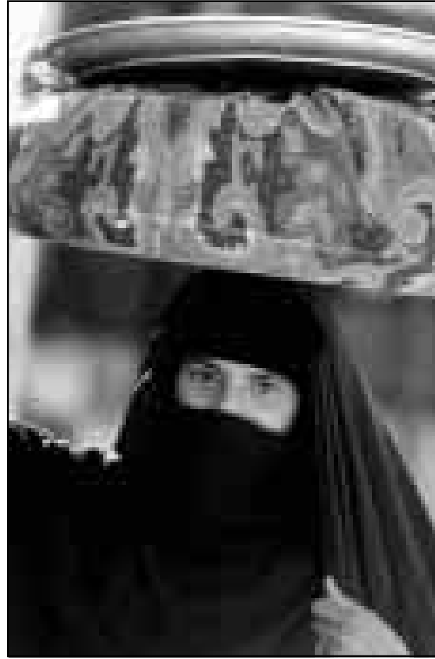
سيدة عراقية تحمل بعض الطعام في مدينة البصرة

واكدت بغداد ان الطائرات الأمريكية ألقت منشورات معادية لنظام العراقي فوق جنوب العراق اثناء عملية «ثعلب