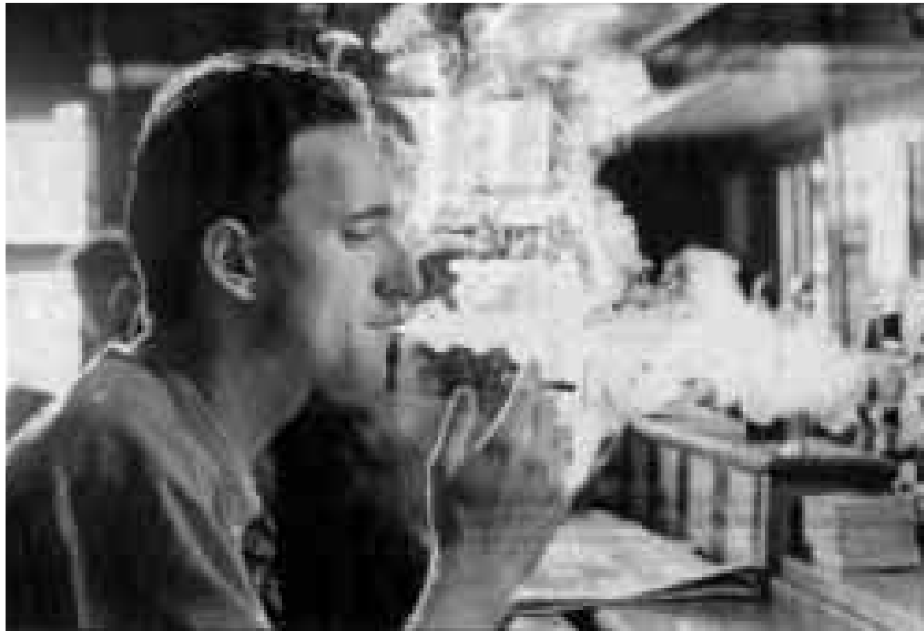
لندن - «القدس العربي»:

وفرت شركة كانتاب البريطانية للصناعات الدوائية اسم الاثنى املا للمدخنين ومدمني الكوكايين الراغبين في الاقلاع عن التدخين وتعاطي المخدر المكلف في توفير عقار يساعد على تحقيق رغبتهم. فقد اشترت الشركة البريطانية المتخصصة في تطوير عقارات جديدة لشركة اميونولوجيك الامريكى للتكنولوجيا البيولوجية عقارين جديدين ما زالوا خاضعين للاختبارات احدهما للمساعدة على الاقلاع عن التدخين والاخر لمساعدة مدمني الكوكايين على التخلص من هذه العادة. ومقابل حصول الشركة البريطانية على العقارين الجديدين ستتملك الشركة الامريكى 6% من اسهم كانتاب.