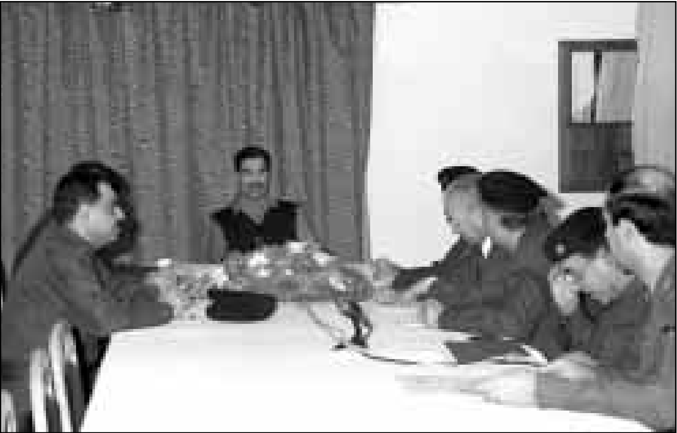
بغداد - اف ب: ذكرت وكالة الانباء العراقية امس ان الرئيس العراقي صدام حسين ترأس اجتماعا لقيادة العراقية. ولم توضح الوكالة ما جرى بحثه في الاجتماع المشترك الذي ضم اعضاء مجلس قيادة الثورة وقيادة حزب البعث الحاكم. وهذا هو الاجتماع الاول للقيادة العراقية بعد اعلان الولايات المتحدة وبريطانيا انتهاء عملية «ثعلب الصحراء» ليل السبت الاحد بعد حوالي سبعين ساعة من الغارات الجوية والصاروخية. واكتفت وكالة الانباء العراقية بالاشارة الى ان رئيس المجلس الوطني العراقي سعدون حمادي ووزير الخارجية محمد سعيد الصحف شاركوا في الاجتماع.

واتفجر عدد من هذه الصواريخ في العاصمة، لكن امس الاثنين، اي بعد يوم تقريبا من الهجوم الاخير، لم يصاب الا القليل من آثار الخراب في المناطق التي نقل اليها الصحافيون في زيارة منظمة او التي سمح لهم