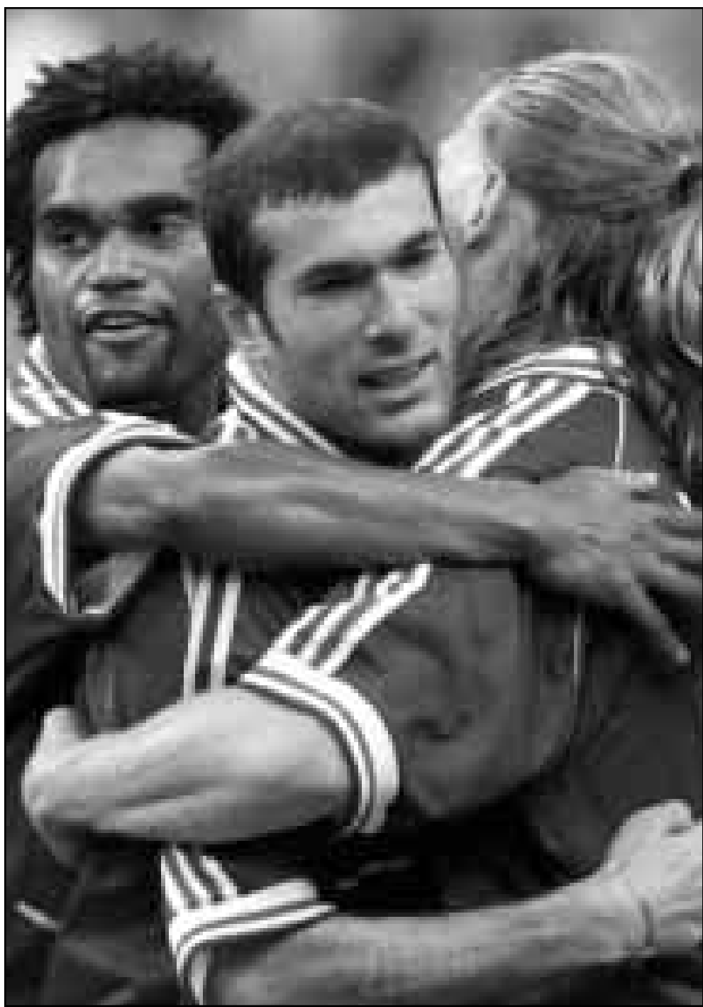
زيدان (وسط) يتلقى تهاني من زميله ايمانويل بيتيت (يمين) وكاريمو بعد تسجيله احد الاهداف في نهائي كأس العالم