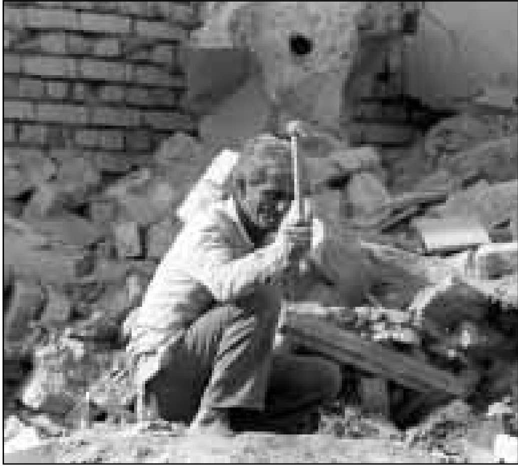
عراقي يحد من محتويات منزله الممر بين الانقاض