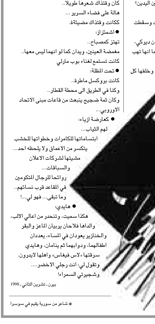
يا له ثائية... اي قمر انتحر غفلة على هاتين اليدين؟ ● بالبراء: كنا هناك ذات يوم، حيث طفت سبع مرات وسقطت سبع مرات.. ومت في ليلة.. سبع مرات.

ثم عدنا الى الشام، الى بيت صديقي لقمان ديركي، قتييب، حين هبت من ذلك الباب، هبت كما انها تهب من بقايا الروم القداماء... تقف، تستند على عمود الرخام الغامض، وخلفها كل ذلك التاريخ الطعيب. ● بالابيض والاسود: لي وحدة هذه الصورة، اعطيها بجرام الروح، ثم