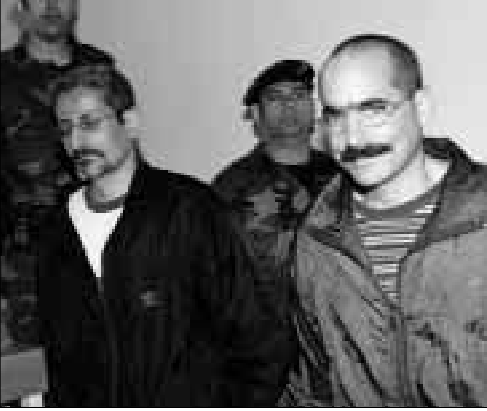
العميلان الاسرائيليان لدى دخولهما قاعة المحكمة في لارتكا امس

رام الله - من واء عمرو: ندد سياسة فلسطينيون امس بالضربات الجوية الامريكية والبريطانية على العراق وقالوا ان الرئيس الامريكي بيل كلينتون قد اخرجهم بشن هذه الغارات. وكان كلينتون امر بشن غارات على العراق لعدم تعاونه مع مفتشي الاسلحة التابعين للامم المتحدة بعد يوم فقط من عودته الى واشنطن من زيارة تاريخية للمناطق التي تختمت بالحكم الذاتي الفلسطيني. وقال بيان صدر عقب ختام جلسة خاصة للمجلس التشريعي الفلسطيني بشأن العراق ان المجلس يندد بقوة وبرفض «العقدوان» الامريكي والبريطاني على العراق ويطلب بان يرفع المجتمع الدولي فورا العقوبات المفروضة على العراق. وكانت الهجمات التي تعرض لها