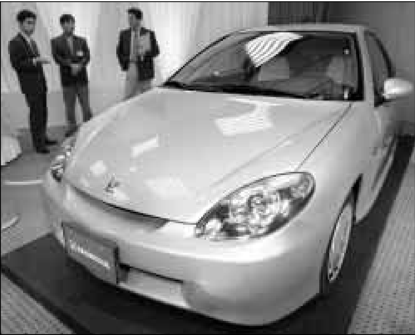
نموذج لسيارة ذات محرك بدار البنزين والكهرباء من انتاج هوندا اليابانية كشف للصحافيين امس في طوكيو. وتستهلك هذه السيارة التي صنع ميكها من الالومنيوم الخفيف لترا واحدا من البنزين لقطع 30 كيلومترا مما يجعلها من اكفا السيارات في العالم في الاستخدام الامثل للوقود. ولم تكشف الشركة عن السعر المتوقع للسيارة الجديدة او موعد طرحها في السوق

وتبلغ احتياطيها الغاز في ايران 21 تريليون متر مكعب وهي ثاني اكبر احتياطيها في العالم بعد روسيا.