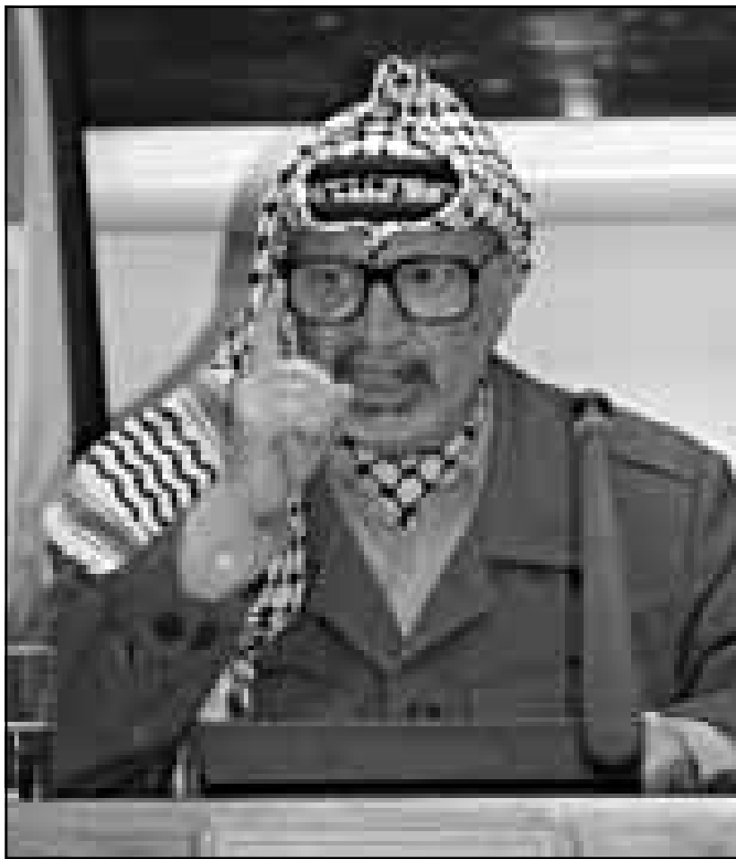
داني روبنشتاين (هأرتس) 1998/12/21

وعلى هذه الخلفية بدأ عرفات قبل نحو عام التلويح بموعدا الرباع من ايار (مايو) 1999، وحققت ننتياهو وباقي الناظرين بلسان ننتياهو ردوا بغضب لم تفعل سوى ان تساعد عرفات في تحويل الموضوع الى ورقة مساومة. فلو تجاهل الناظرين الاسرائيليون ذلك او قالوا لعرفات ان لا تقبلوا ولا تعنياً وبوسعك ان تعلن عما تريد. ولكن من المحتمل ان يتوقف عرفات عندها عن الانشغال بذلك والبحث عن أوراق مساومة اخرى، وهو ملزم بايجاد أوراق كهذه لانه في ميزان القوى في المفاوضات فان كل