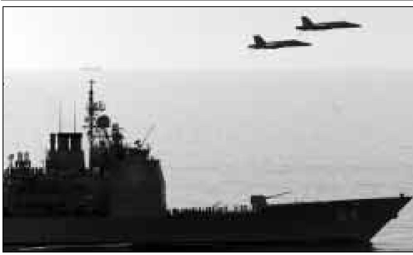
طائرات من طراز (اف 18) فوق سفينة حربية امريكية في الخليج

صنعا - «القدس العربي» - من خالد الحمادي: تواصلت الاحتجاجات في اليمن ضد العدوان الامريكى - البريطاني على العراق لليوم الرابع على التوالي حيث توسعت دائرة الاحتجاجات لتشمل بالإضافة الى صنعا محافظات عدن وتعز وحجة. وتوسعند الاحزاب السياسية والفعاليات الجماهيرية اليمنية لعقد مهرجان خطابي جماهيري كبير يوم غد الاربعة اطلق عليه (مهرجان الاصطفاف الجماهيري مع العراق ضد العدوان الامريكى) البريطاني تتوسجا للفعاليات الاحتجاجية التي نظمتها الاحزاب اليمنية في مختلف المناطق اليمنية. وتوحدت الاحزاب السياسية اليمنية في السلطة والمعارضة لاول مرة حول قضية العراق ونجحت في تنفيذ العديد من السيريات الاحتجاجية والمهرجانات الجماهيرية في مختلف المحافظات اليمنية بمباركة الدولة التي بنت جميع وسائلها الاعلامية لاول مرة السيريات الاحتجاجية التي تمت في العديد من المناطق وكانت حاضرة بقوة في هذه الفعاليات.