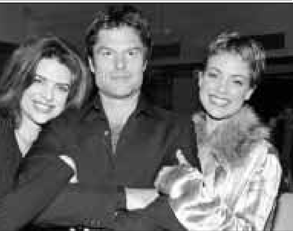
النجمة جنيفر غرانت (الى اليمين) ابنة الممثل الأمريكي الشهير الراحل غاري غرانت، ظهرت مع النجم هاري هالان وزوجته الممثلة ليا رينا (الى اليسار) بمناسبة المشاركة في مسلسل كوميدي جديد بعنوان «نجوم السينما».

■ اسلام اباد-اف ب: نكرت وكالة «اي بي بي» للانباء نقلا عن منظمة «سايكل» غير الحكومية ان 69 طفلا على الاقل قتلوا في باكستان خلال العام 1998 بعدما تعرضوا لاعتداءات جنسية. واوضحت المنظمة ذاتها ان 848 طفلا تعرضوا لاعتداءات جنسية في العام الماضي في باكستان. وارتكب الاعتداءات الجنسية هذه 1601 رجلا بينهم 1216 رجلا كانوا من اقارب الضحايا. وجاء في احصاءات هذه المنظمة التي تعتمد على معلومات نشرت في الصحف المحلية ان 55% من الضحايا كانوا من الصبيان. والاطفال بين سن العاشرة والخامسة عشرة هم الاكثر عرضة لهذه الاعتداءات لكن المنظمة غير الحكومية احصت ايضا بين الضحايا اكثر من عشرين طفلا دون سن الخامسة.