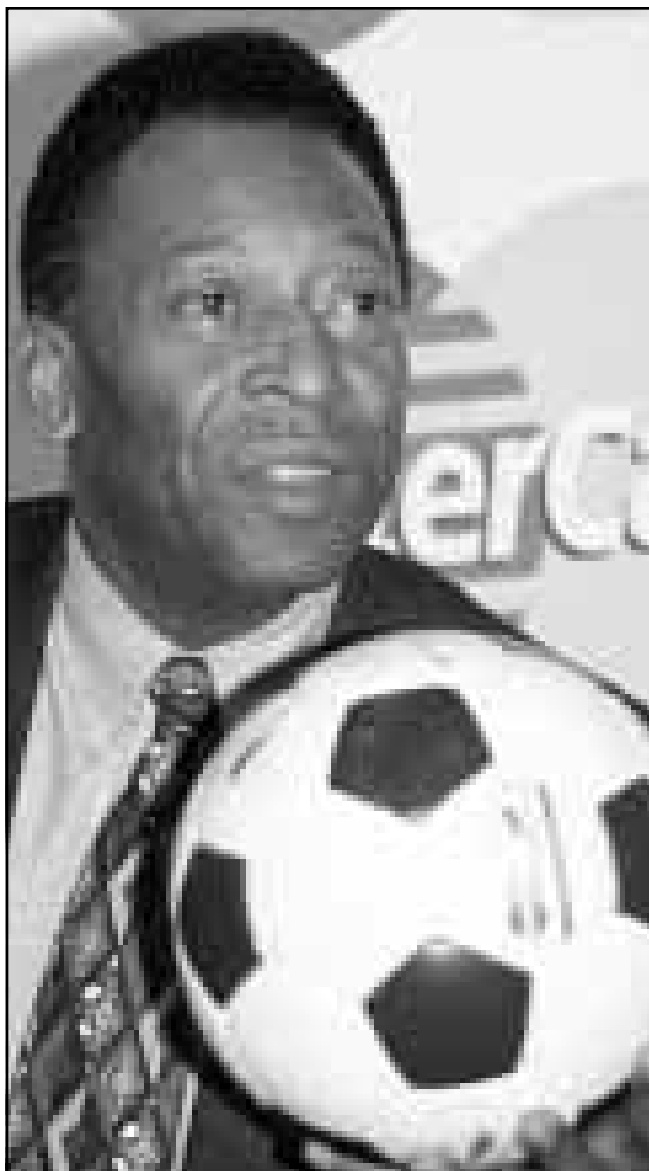
وزير الرياضة البرازيلية بيليه عقد مؤتمرا صحافيا في طوكيو بعد اعلان اسمه كأعظم رياضي في العالم