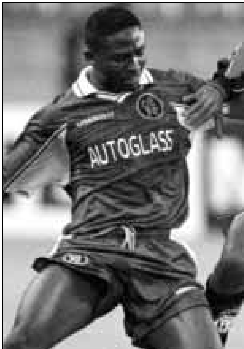
لاعب تشلسي سيلستين بابايارو