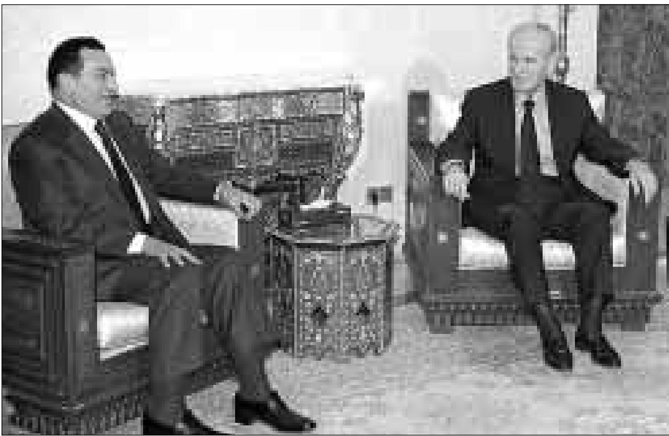
الرئيسان المصري والسوري لدى اجتماعهما في دمشق الجمعة