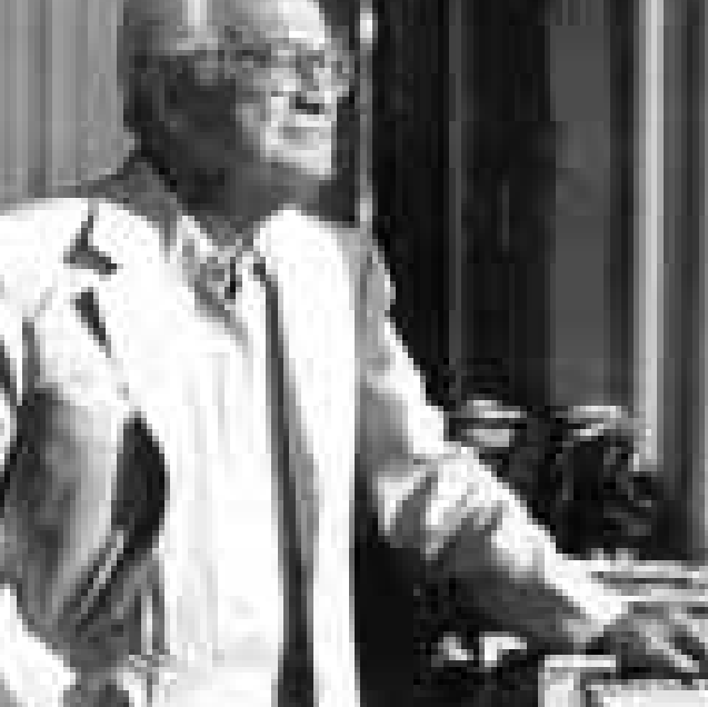
دي لورنتيس (79 سنة) في مكتبته في نيويورك

المخرج دينو دي لورنتيس لا يزال يعمل رغم اقترابه من الثمانين الواقعية الجديدة في ايطاليا كانت بسبب الفقر!