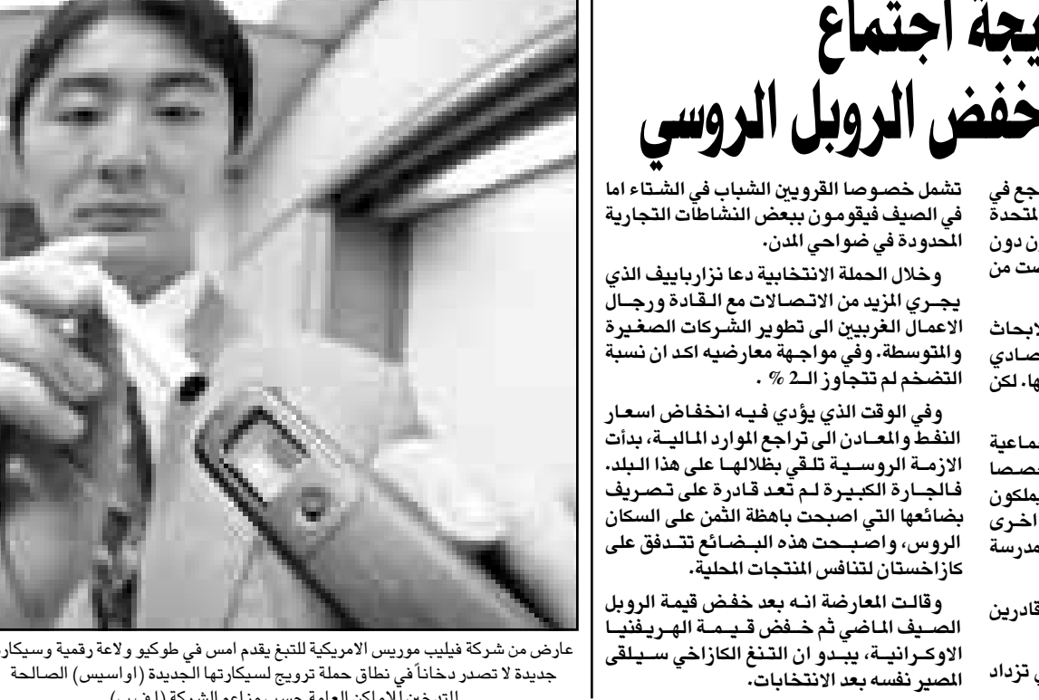
عارض من شركة فيليب موريس الامريكية للتبغ يقدم امس في طوكيو ولاعة رقمية وسيكارة جديدة لا تصدر دخانا في نطاق حملة ترويج لسيكارتها الجديدة (اوسيس) الصالحة للتدخين لاماكن العامة حسب مزاعم الشركة