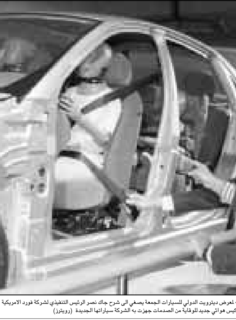
الرئيس كلبنتون خلال زيارته لعرض ديترويت الدولي للسيارات الجمعة يصغي الى شرح جاك نصر الرئيس التنفيذي لشركة فورد الأمريكية عن كيبس هوائي جديد للولاية من الصدمات جهزت به الشركة سيارتها الجديدة

وتونس - رويترز: قالت وكالة الزراعة ومصائد الاسماك الياباني شويتشي ناكاجاوا بدأ الجمعة محادثات مع المسؤولين المغربي لدعم التعاون في قطاع صيد الاسماك. وسيجتزم الوزير مع المسؤولين المغربي الدعم المالي الذي تقدمه اليابان لبناء قرية تقليدية لصيادي الاسماك في صافي التي تقع على الساحل المغربي على الحضيض الاطلسي. وبناء ميثاء مزود بتجهيزات لصيد الاسماك قيمتها 80 مليون درهم (8.6 مليون دولار). ويبلغت عائدات صادرات الاسماك المغربية أكثر من 696 مليون دولار في عام 1997 وكانت اليابان خامس أكبر سوق للمغرب وتأمين أكبر مورد.