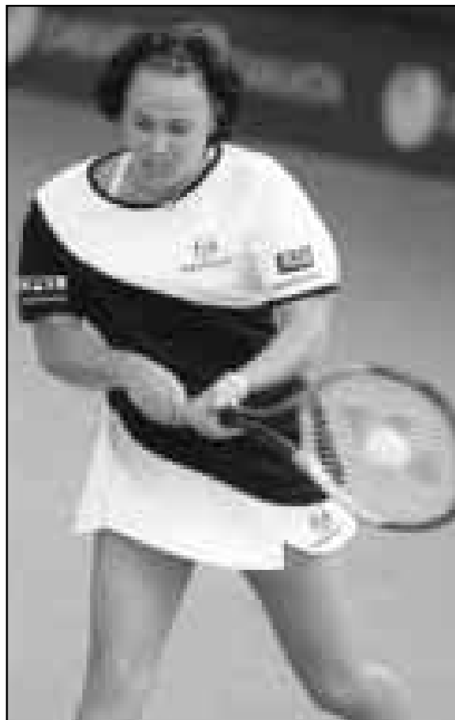
مارتينغا مينغيس (أ ف ب)