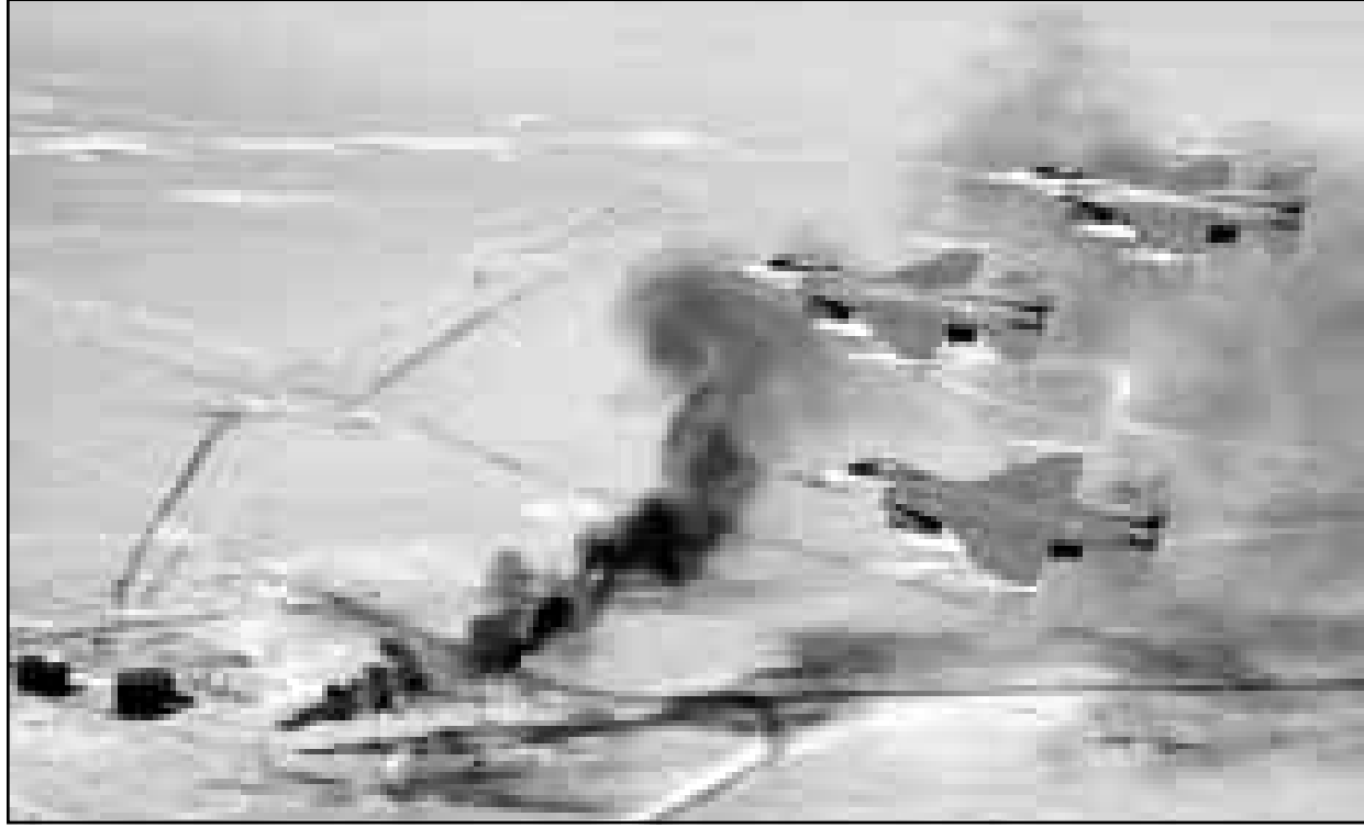
طائرات امريكية في طلعات تدريبية فوق ابار النفط الكويتية، وقد واسلت واشنطن اسم ضرب قواعد عراقية في منطقة الحظر الجوي

واكد روين ان «بحث اي قرار يمكن اتخاذه في المستقبل لوقف عمائد للرئيس (بيل كلينتون)». من جهة اخرى تعززم الولايات المتحدة تقديم مقترحات جديدة الى مجلس الامن برفع موعدها سقف مبيعات النفط العراقية يوما محددا للمكبة التي يسمح بيعها، وذلك لكي يتم تغطية مشروعات العراق من الاحتياجات الانسانية.