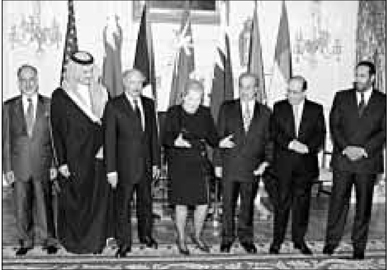
وزراء دول مجلس التعاون الخليجي وبينهم وزيرة الخارجية الامريكية ماديلين اولبرايت اثناء زيارتهم الاخيرة لواشنطن

يقول دبلوماسيون انه اذا توقفت اللجنة الخاصة التابعة للامم المتحدة المختصة بتسليح العراق عن العمل ستصبح ملفاتها كنزاً من الاسرار التي قد تخرج بشدة العديد من الدول. ولكن محتويات هذه الملفات تظل محاطة بإجراءات امن مشددة والامم المتحدة على عكس العديد من الحكومات ليس لديها سياسة كشف وثائقها السرية بعد فترة زمنية معينة. ورغم ان اللجنة الخاصة تعرضت لانتقادات شديدة في الفترة الاخيرة بسبب مزاعم من تعاونها مع وكالات مخابرات امريكية وفي حين اقترحت فرنسا تشكيل ما سمته لجنة مراقبة جديدة فان اي هيئة تخلفها قد تثرى ملفات.