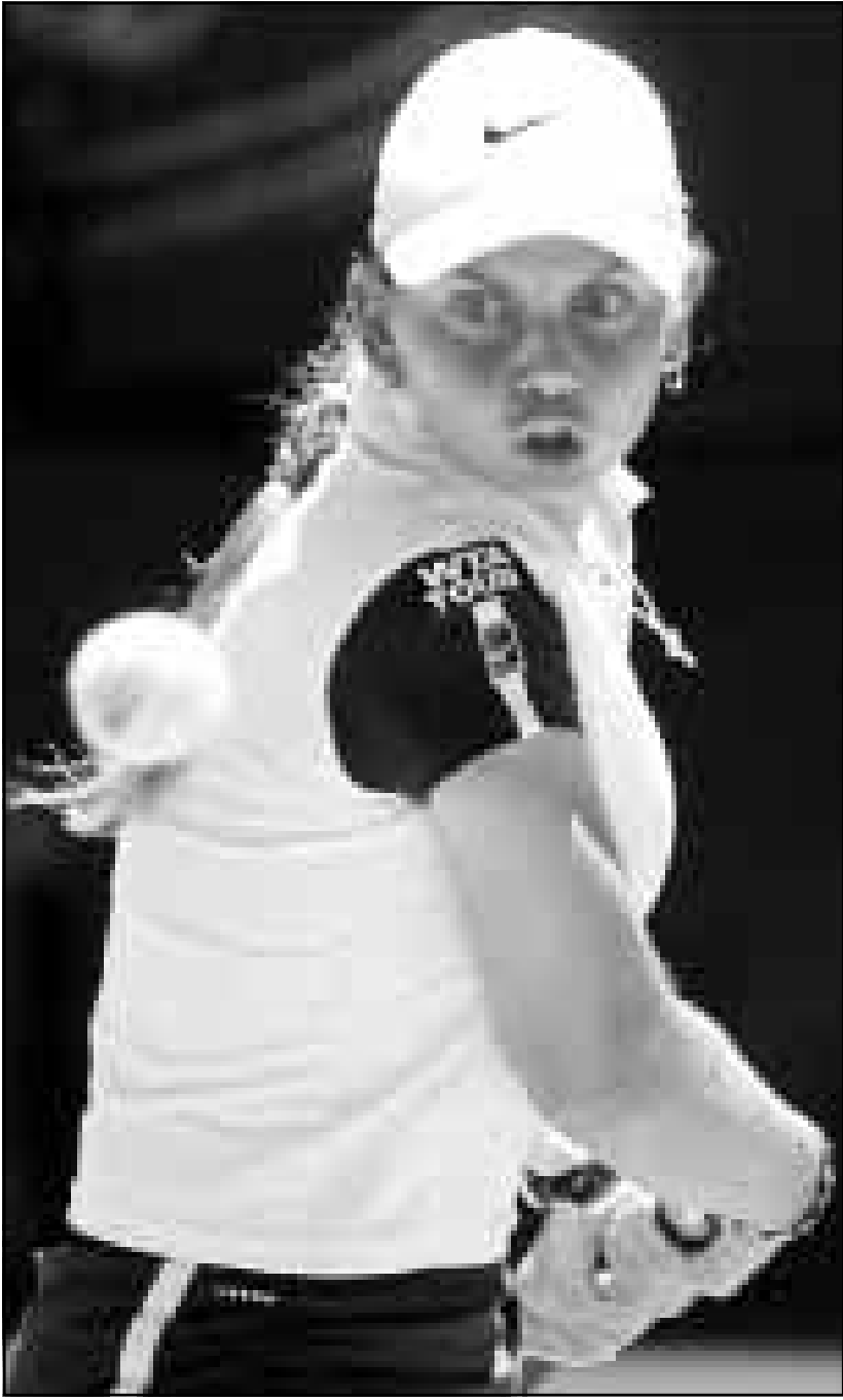
الاعية الاسترالية جيلينا دوكي (رويتز)