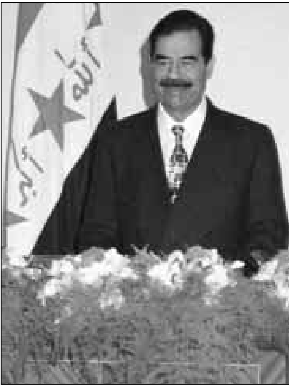
الرئيس العراقي اثناء الفاء عطائه

بغداد - أ ف ب: اجمعت الصحف العراقية امس الأحد على التأكيد بان العراق خرج «منتصراً» من المواجه مع الولايات المتحدة لا تزال متواصلة منذ حرب الخليج. وقالت صحيفة «الثورة» الناطقة باسم حزب البعث الحاكم في الذكرى الثامنة لانذاع حرب الخليج «ان حقيقة الحقائق التي برزت وتأكدت بعد ثماني سنوات من الصراع هي ان العراق هو الذي انتصر في المنازلة وان الولايات المتحدة خسرتها». واضافت «ان كل مرافعات امريكا واليهامها الخبيثة باءت بالفشل والسران». من جهتها أكدت صحيفة «بايل» التي يشرف عليها عدى صدام حسين النجل الأكبر للرئيس العراقي «ان السنوات الماضية قد اثبتت فشل وخيبة هؤلاء الامريكان برغم استخدامهم ابضع السياسات واكثرها وحشية ودهاء وكرا»، وقالت صحيفة «القاسية» «فشل المعتدون وانحدروا وانتصر العراق وشعبه الذي واجه الهزيمة العدوانية التدميرية الشرسة». اما صحيفة «الجمهورية» فقد دعت الولايات المتحدة الى اعادة النظر بسياساتها ازاء بغداد، مؤكدة ان العراق «مصمم من غير تراجع على الجهاد الأكبر لرفع الحصار ولجم الشر واحقاق الحق». واضافت «الجمهورية» ان «على امريكا الطاغية ان لا تتوهم بانها قادرة على النيل من العراق». وتاتي الذكرى الفخرية لحرب الخليج التي وضعت حدا لسبعة اشهر من الاحتلال العراقي للكويت بعد شهر من تعرض العراق لغارات امريكية بريطانية. ولا يزال التوتر العسكري مستمرا منذ ذلك الحين ان بدأ العراق تنفيذ قرار بالانصي للطلبات الغربية في منطقتي الحظر الجوي اللتين فرضتا عليه في الشمال والجنوب عامي 1991 و1992.