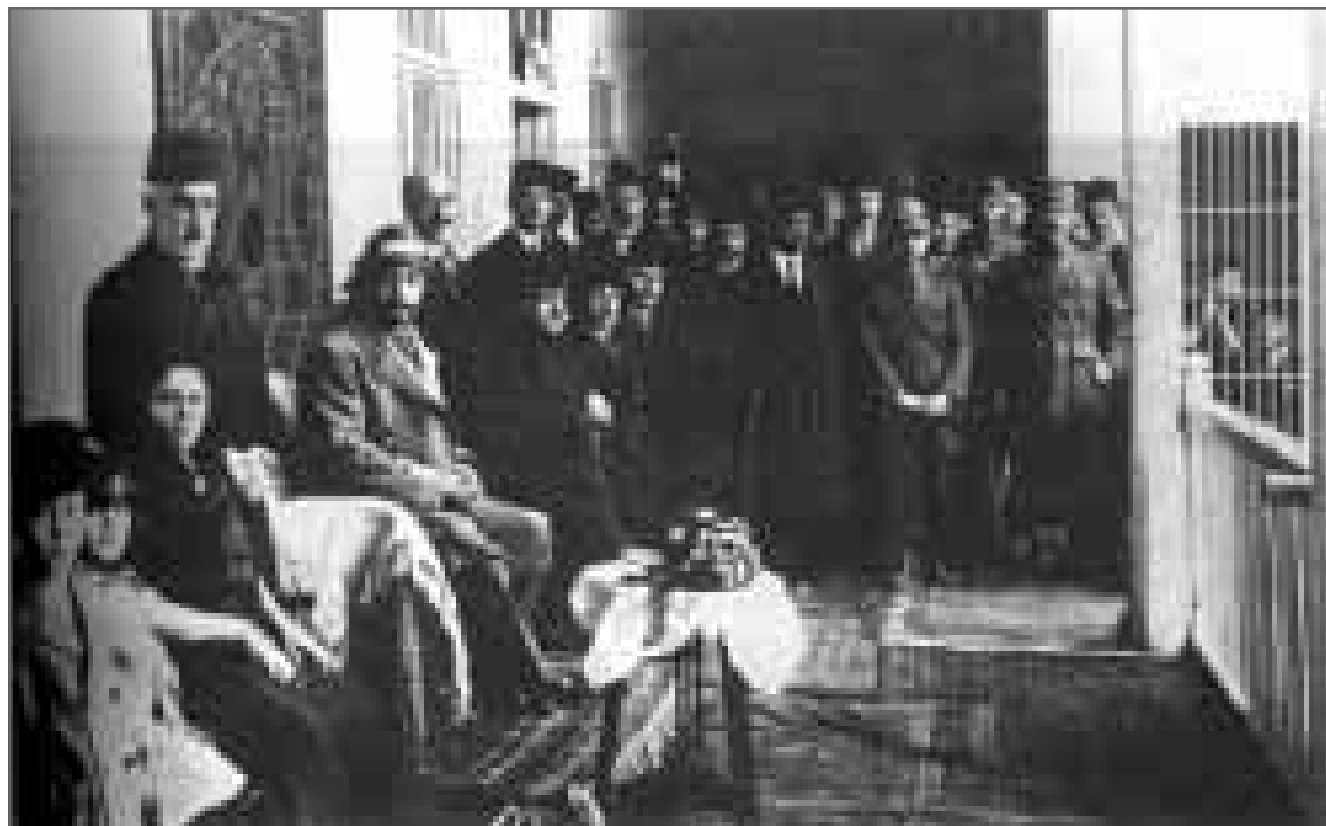
الملك فيصل الأول في أثناء زيارته لمدرسة لورا خضوري