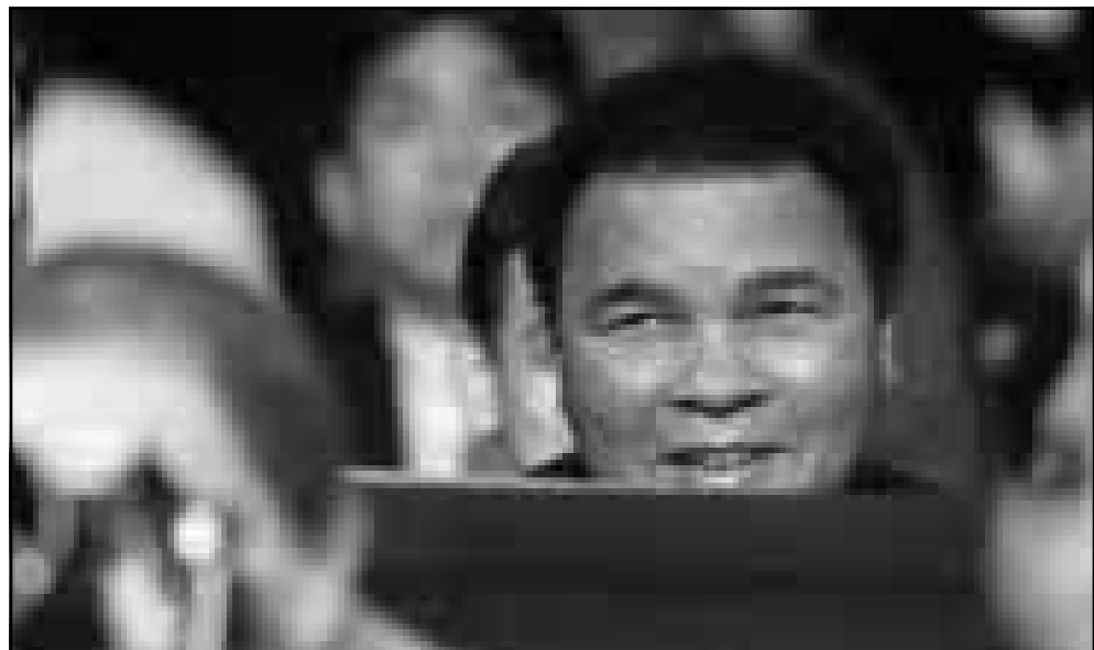
حضر المباراة أسطورة الملاكمة كلاي

لكنه هزمني بكلمة مباشرة، لقد فاجاني، في حين حقق تايسون فوزه الـ 46 منها 40 بالضربة القاضية مقابل 3 هزائم. وكان تايسون يخوض مباراته الاولى منذ سحبته منه رخصة مزاولة اللعبة اثر عضه مواطنه ايفاندر هوليفيلد بطل العالم حسب تصنيف الجمعية العالمية والاتحاد الدولي في اذنيه الاثنين خلال المباراة الثانية بينهما في 28 حزيران/يونيو 97. وكانت لجنة الملاكمة في ولاية نيفادا قررت السماح لتايسون بالعودة الى الحلبة في 19 الحالي. وقال تايسون بعد تحقيقه الفوز الـ 46 له «هذا الفوز هو لمن لم يتسقاوا بي»، وتساءل «ما عساهم يقولون الآن؟ لأن تايسون قد عاد ولا احد يستطيع ايقافه»، ومن المحتمل ان يلعب تايسون مباراته الثانية في اواخر نيسان/أبريل (ابريل) المقبل ضد الألماني اكسيل شولس قبل أن يخوض مباراة من أجل انتزاع اللقب. وقال تايسون «اني بحاجة الى خوض بعض المباريات حتى اكون في قمة مستواي، لا اريد التسرع». وعلى الحلبة ذاتها، احتفظ الملاكم المكسيكي روبرتو غارسيا بلقبه بطلا للعالم في وزن فوق الريشة (تصنيف الاحتراف الدولي) بفوزه على البورتوريكي جون مولينا بالنقاط في مباراة من 12 جولة. وكان غارسيا يدافع عن لقبه للمرة الثانية من آذار (مارس) الماضي، وحقق فوزه الـ 32 منها 24 بالضربة القاضية، في حين مني مولينا بخسارته السادسة في 51 مباراة.