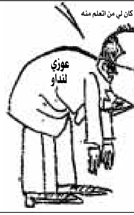
حسن بالطبع فقد كان لي من تعلم منه