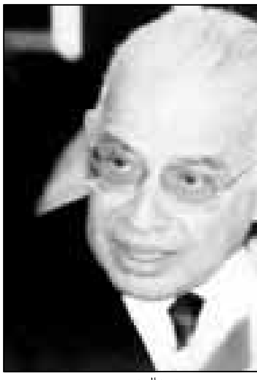
عمست عبد المجيد

■ القاهرة - أ ف ب: أكد الامين العام للجامعة العربية عمست عبد المجيد الأحد ان الاجتماع الوزاري المقرر عقده في 24 من الجاري سيتمحور حول سبل رفع الحظر عن العراق. وقال عبد المجيد خلال مؤتمر صحفي اثر استقباله وزير الخارجية المصري عمرو موسى «شك محادثات جادة وصادقة في الجامعة العربية للوصول الى حل دبلوماسي للمشكلة العراقية اهمها رفع الحصار عن الشعب العراقي الشقيق وهو هدف نسعى الى تحقيقه في الاجتماع التشاوري يوم الأحد القادم». وقال عبد المجيد ان القضية العراقية ستكون الموضوع الاول على جدول اعمال الاجتماع، مشيراً في الوقت نفسه الى ان «الهمة صعبة ولا يمكن انكارها وهناك نيات ورغبة لدى مصر وبعض الدول العربية للقيام بدور تنسيقي لضمان نجاح الاجتماع». ورداً على سؤال حول ما اذا كان الاجتماع التشاوري سيحدد مصير القمة الخارجية مصر والسعودية واليمن وعمان وسورية في مصر اخيراً. وقال «هذه الاجتماعات تضم عدداً من الوزراء العرب للتشاور والتنسيق وكافة التاج التي ترتبت عليها لتقت الى جميع وزراء الخارجية العرب». وكرر موسى ما اكده الخميني لسمعي قائلاً ان «التشاور والحالي لا يصح تسميته بالتأمر او المشاورة ولا لتصبح الامور مطلوبة في العنى والمبدأ». وقال ان «مفسر العراق لاية اجتماعات