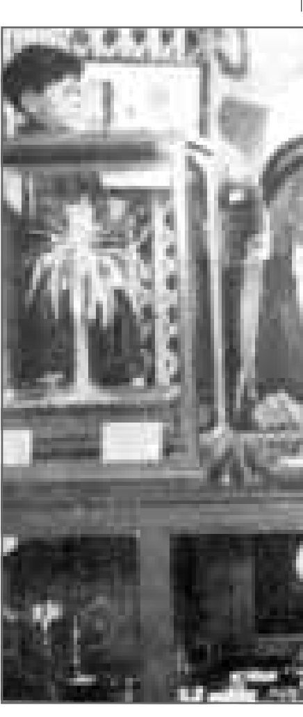
صاح صابلي عام 1945

وقد تعرض شاعر العرب الأول في هذا العصر محمد مهدي الجواهري إلى حملة تنكيل وشهيرة لأنه لم يكن يحمل ورقة تثبت انتماءه «العثماني» وحاربه أمثال ساطع الحصري عندما أريد تعيينه مدرس ثانوية، لكن الملك فيصل الأول تحدى الموجة العنصرية فأخشار الجواهري ضمن موظفي البلاط الملكي بالرات، يقول الجواهري في الجزء الأول من مذكراته «عاشرت عام 1988، في إشارته إلى وقائع اضطهاده التعسفي في العشرينات: «طفت بكل البلدان العربية وسألت في بلدان عديدة أخرى عما إذا كان يوجد في أي مجتمع نظير لقل هذه الغضبية» إن يكون أهل البلد بعد اختصار الأحتلال الاجنبي، اجانب في التسمية إذا لم يثبت تنمعه جنسية الاجنبي المختل «أي العثمانية» فلم أجده، ولا اعتقد أن هناك من يقدر أن يرد على ويورد مثلاً لذلك في كل ما وجدته قبل، وهذا وأنا في غير شباهي في النجف، وتوسع فيه بعد ذلك، ان من يولد «بمجرد الولادة» في امركا فهو على حق من أن يرشح نفسه لرئاسة الجمهورية، وأكر على هذه الكلمة - رئاسة الجمهورية، اما وأنا في براغ ولا