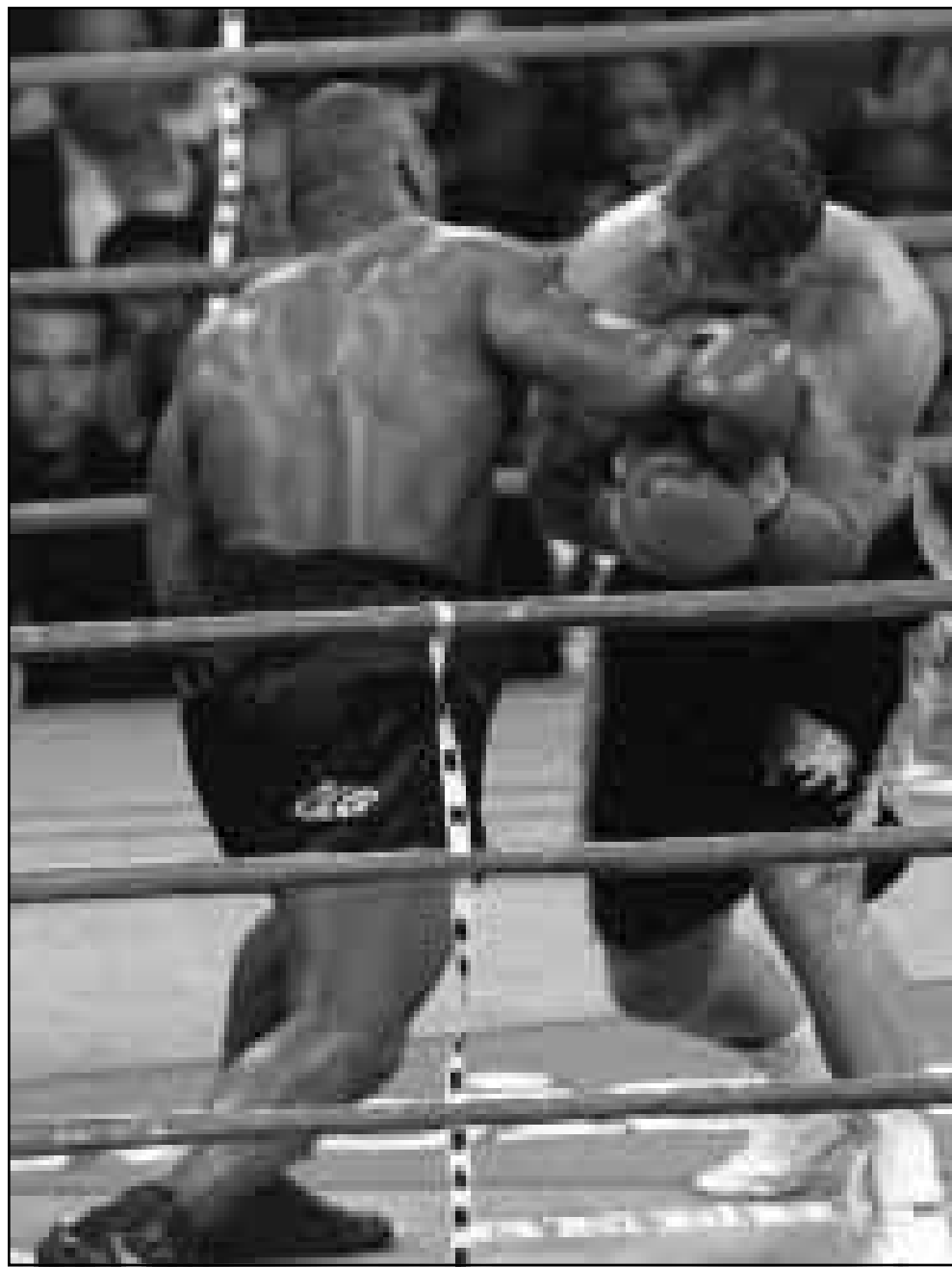
التحام بين تايسون وبوتا خلال المباراة (رويترز)