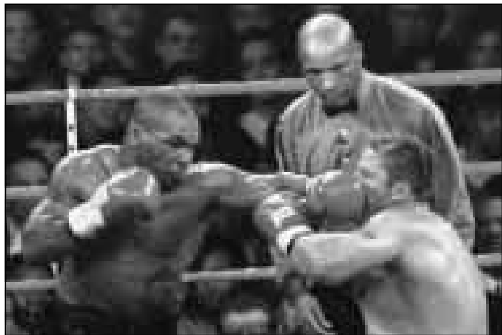
لكمة قوية من يسرى تايسون في وجه منافسه بينما تستعد بعناء لضربة اخرى

■ لاس فيغاس (الولايات المتحدة) - اف ب: حقق بطل العالم السابق في الملاكمة للوزن الثقيل الأمريكي مايك تايسون عودة طاقرة بتغلبه على الجنوب افريقي فرنسيسو بوتا (30 عاماً) بالضربة القاضية في الجولة الخامسة من المباراة التي أقيمت السبت في لاس فيغاس (نيفادا). واطاح تايسون بخصمه ارضاً في الجولة الخامسة من المباراة التي كانت مقررة من 10 جولات بعد ان وجه له ضربة مباشرة الى الوجه ليجد العبد العكسي قبل ثانية واحدة من انتهاء الجولة. وبرغم فوز تايسون بالضربة القاضية فإنه عانى الامرين خلال الجولات الاربع الاولى، وكان بعيداً كل البعد عن مستواه الذي اظهره في السابق وجعل خصومه يحسبون له ألف حساب. وكان على تايسون انتظار بداية الجولة الخامسة التي وجه فيها مجموعة من اللكمات من بينها اللكمة المباشرة القوية التي اسقطت بوتا على الحلبة. وتميزت بداية المباراة بحبطة وحذر كبيرين من الملاكمين اللذين تبادلوا اللكمات حتى نهاية الجولة الاولى إذ أن حكم المباراة فشل في تفريقهما بفرده حين تدخل مربيهما. واستأنف الملاكمين اللعب في الجولة الثانية وكانت اشتباكاتهما كثيرة كلت تايسون نقطة جزاء، في حين بدأ بوتا رزينا واكتفى بالدفاع عن وجهه لأتارة اعصاب تايسون. وقال بوتا، الذي مني بخسارته الثانية مقابل فوز 39 منها 24 بالضربة القاضية، "لقد كنت في طريقى الى الفوز