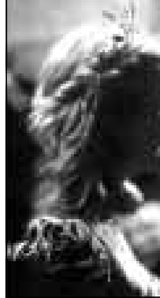
غوينت بالترو وجوزف فينس في فيلم «شكسبير عاشقا»

كن مصنوعات من اعتلاء خشبية المسرح في العهد الاليزابيثي. ويكشف وليام شكسبير الخدعة وتنشأ بينهما علاقة غرامية.