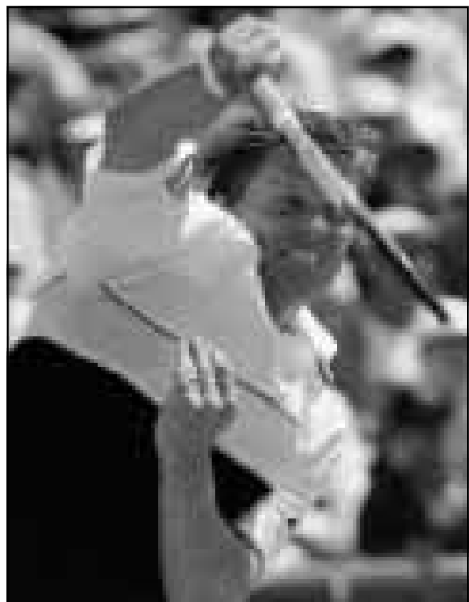
السويدي توماس اكستيسمي