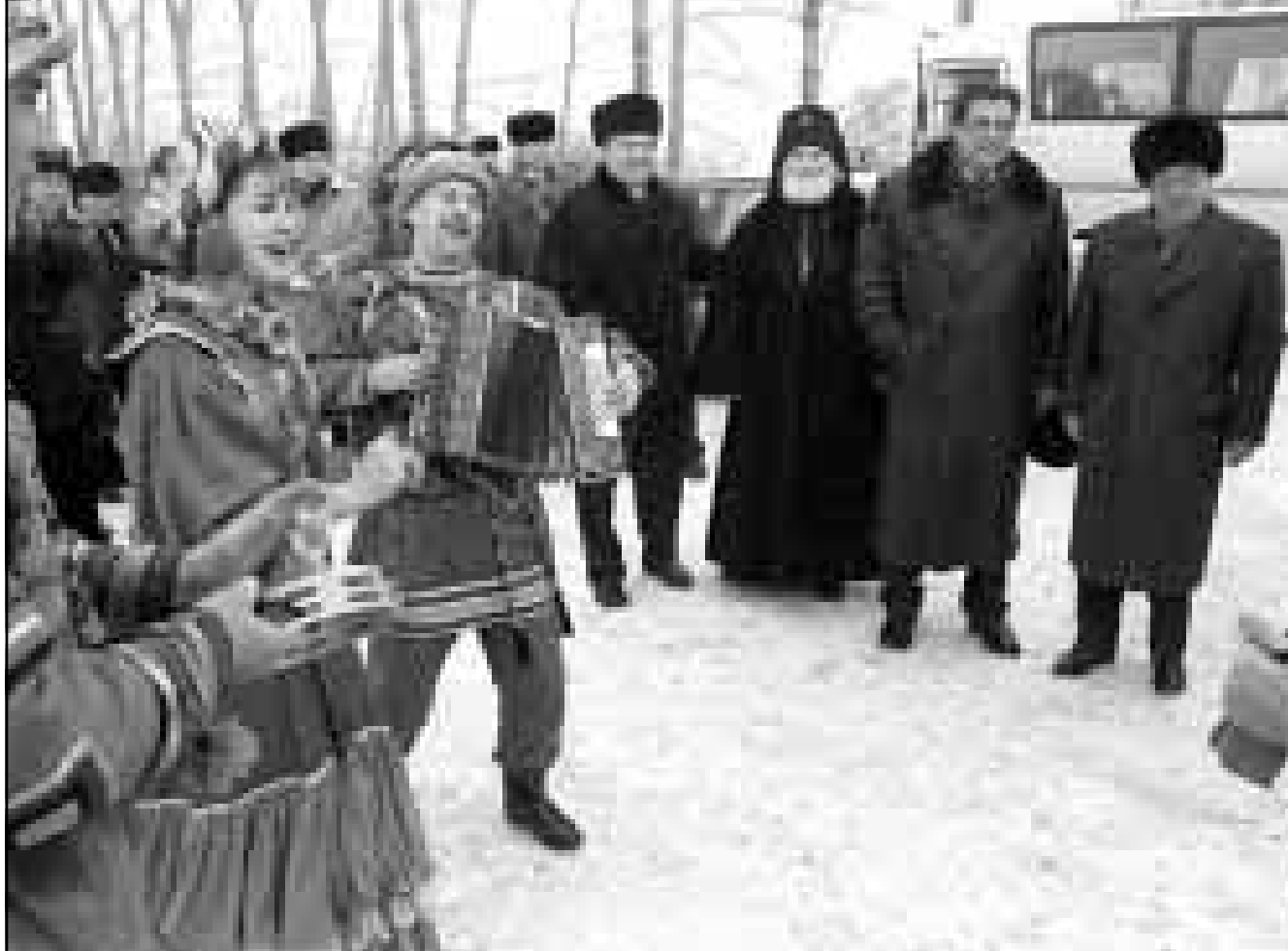
بريماكوف (الاول من اليمين) والى جانبه حاكم منطقة امان تولىيف يستقبل امس املوسوفى التقليدية لدى زيارتهما معجما لصناعة المعادن في غرب سيبيريا

وشهدت جلسة الاحد تداول ما قيمته 4,6 مليون دينار (15 مليون دولار) من الاسهم بزيادة 1,24 مليون دينار عن قيمة تعاملات السبت.