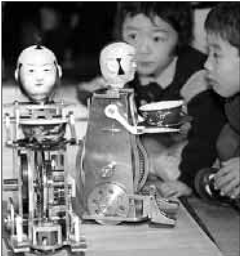
تلميذان يابانيتان ينظران الى جهاز ريويت يقدمان فنجانين الشاي من تصميم طلاب الكلية الفنية التابعة لشركة نيسان لصنع السيارات عرضاً أمس في معرض بمدينة يوكوهاما شارك فيه 86 فريقاً من المصممين الشباب

ويعتبر هذا التصريح دعوة مباشرة الى النواب البرازيليين للموافقة على خطة تعديل الميزانية باقتطاعات تبلغ 23 مليار دولار. وهذا الاجراء من الشروط التي وضعت لنج مساعدته دولية تبلغ 41.5 مليار دولار الى البرازيل، اقترت في تشرين الثاني (نوفمبر) الماضي، واكد رئيسا مجلسي الشيوخ والنواب في البرازيل انه سيتم التصويت على بنود الميزانية قبل نهاية الشهر الجاري. وكان صندوق النقد الدولي قد