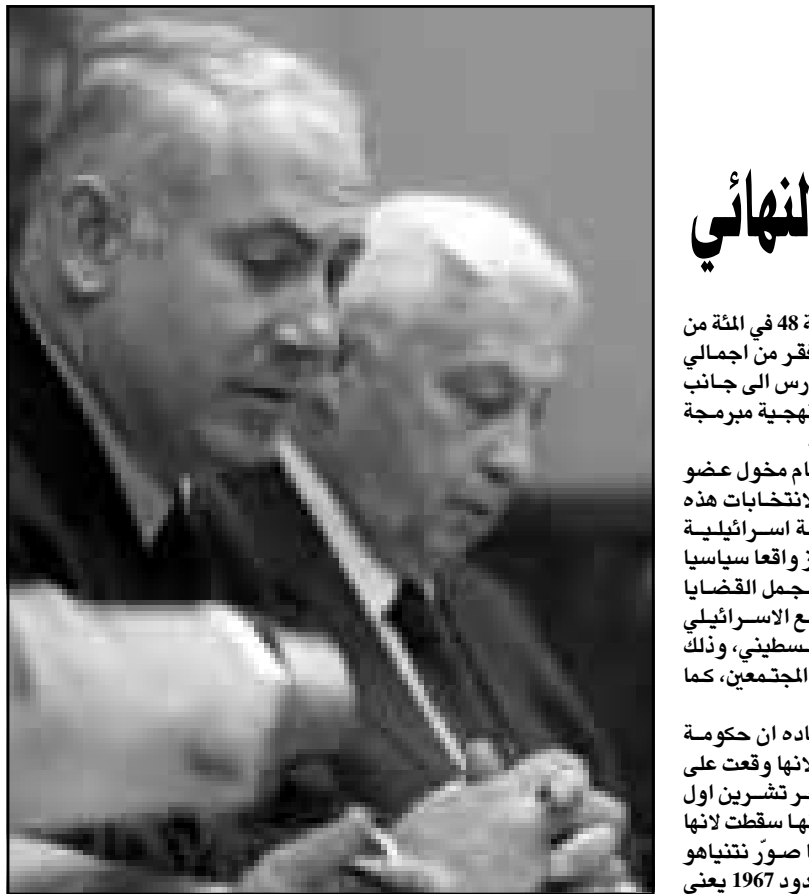
نتنياهو وشارون في الاجتماع الحكومي الأحد