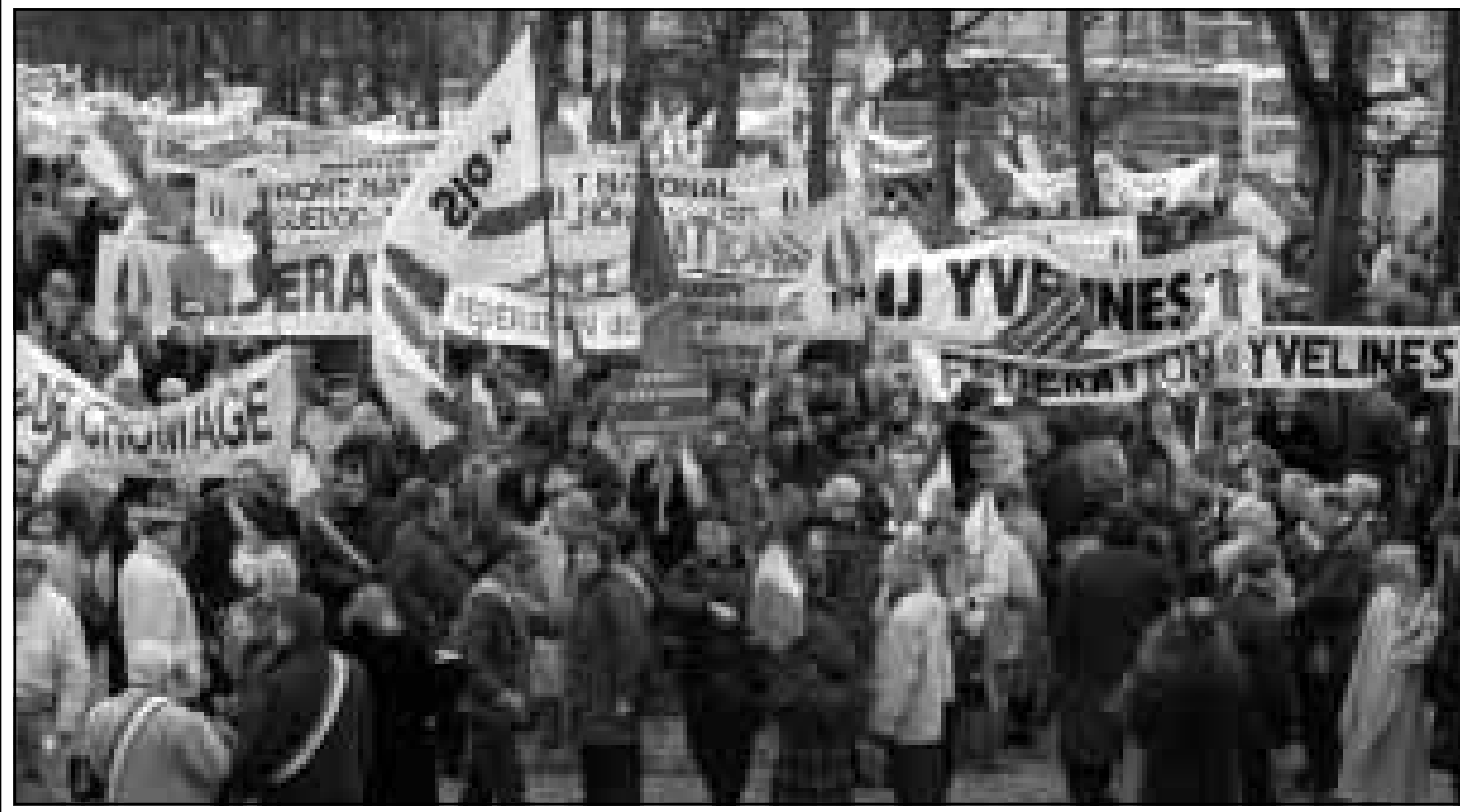
انصار الجبهة القومية الفرنسية المنطرفة تظاهروا امس بشوارع فيرساي احتجاجا على التحاق بلادهم باتفاقية استرداد التي وقعتهما 11 دولة اوروبية (اف ب)

■ عمان - اف ب: اعلنت الحكومة الأردنية الأحد «حالة الجفاف»، في ضوء شح الامطار في موسم الشتاء الحالي ووضعت سلسلة من الاجراءات بهدف مساندة المزارعين ومربي الماشية وتأمين مياه الشرب لنحو 4.5 ملايين نسمة. وتذكرت الحكومة في بيان اصدرته الأحد ان المملكة التي تعاني من شح مزمن في المياه، «تتعرض خلال الموسم الحالي لغتية طويلة من الجفاف حيث بلغت نسبة هطولها حتى منتصف الشهر الجاري 13 في المئة من المعدل التراكمي العام، مقارنة مع 55 في المئة» في مثل هذا الوقت من السنة. واوضح البيان، الذي صدر عقب جلسة مطولة لمجلس الوزراء، ان الاردن سيتخذ اجراءات «للتخفيف من الآثار السلبية» لانحساب المطر في ما يتعلق بالزراعة والثروة الحيوانية. وتتمثل الاجراءات في حفر آبار مياه جوفية جديدة وربط آبار القطع الخاص بشبكات توزيع مياه الشرب بمقابل تعويض مقبول وفتح الحميات الرعية أمام الماشية وتأمين قروض بدون فوائد للمزارعين بقيمة 16,5 مليون دولار. وفي الاردن خمسة سدود كبيرة بسعة اجمالية تبلغ 106 ملايين متر مكعب، وتفيد تقديرات الخبراء ان نقص المياه في 2005 امس 70 في المئة من اللثة من احتياجات البلاد.