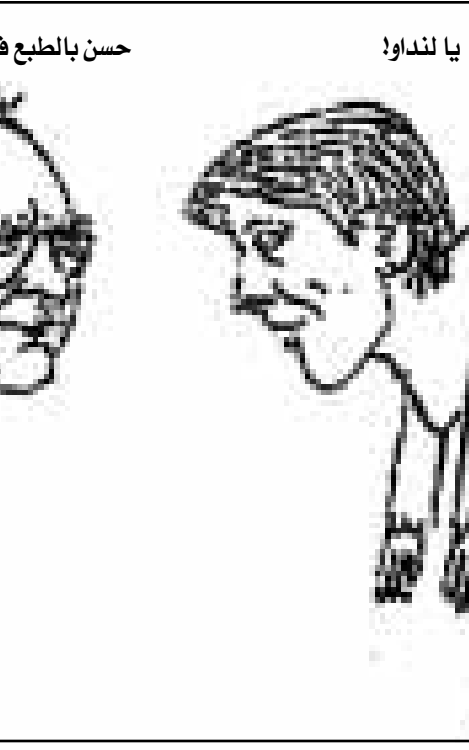
انثيت حسنا لن نداوا!