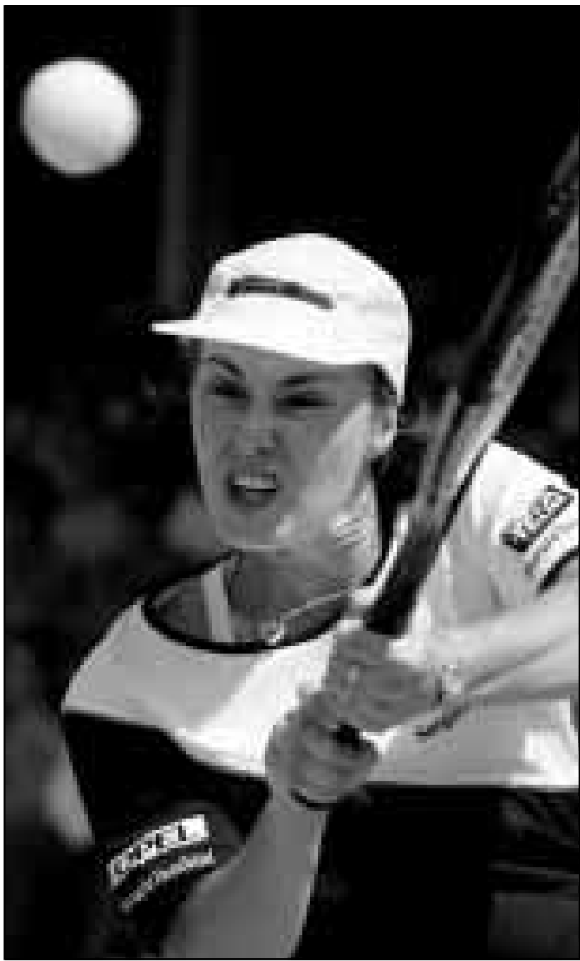
مارتينيا هينغيز