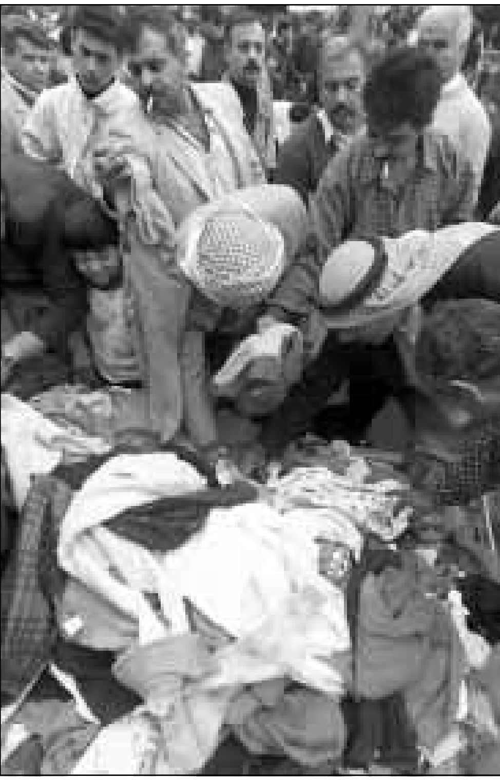
عراقيون يشترتون الملابس عشية عيد الفطر في بغداد

واشنطن - «القدس العربي»: دكرت مصادر امريكية مطلعة ان وزيرة الخارجية امريكية مادلين اولبرايت ستزور المغرب في اواخر شهر كانون الثاني (يناير) الجاري ضمن جولتها المقررة في المنطقة والتي تبدأ يوم السادس والعشرين من الشهر الجاري عقب انتهاء زيارتها لموسكو وتزور خلالها السعودية ومصر والكويت التي تستهدف اجراء اتصالات مع زعماء هذه الدول لتخفيف سقف التوقعات بشأن ما يمكن قبوله امريكي من مطالب واقتراح عربية حياح العراق. وتقول هذه المصادر ان اولبرايت في زيارتها للمغرب سوف تتلقى مع المعالج المغربي الملك الحسن الثاني ورئيس الحكومة ووزير الخارجية حيث ستبحث معهم في جانب موضوع العراق وموضوع الصحراء الغربية وخاصة في اعقاب التقرير «السليبي» الذي قدمه وزير الخارجية امريكي الاسبق جيمس بيكر المبعوث الشخصي للادام العام للامم المتحدة كوفي اناح حول عملية الاستفتاء في الصحراء الغربية، غير ان هذه المصادر لم تقدم المزيد من التفاصيل حول ذلك التقرير. وتشير هذه المصادر الى ان زيارة اولبرايت الى المغرب تعكس ايضا ائزازح الحكومة امريكية من مواقف الشعب المغربي المناصرة للعراق وعدم ايتياح الشعبي والرسمي لاستراتيجية ومخططات الولايات المتحدة التي تؤدي عمليا الى تمزيق العراق وتوقيضه.