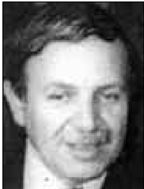
عبد العزيز بوتفليقة، انطلق مرشح «الاجماع» وسينتهي رجل تفرقة وسط كل الاحزاب التي اتمت به