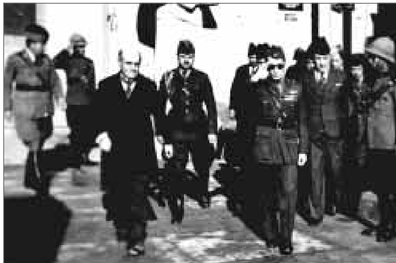
الملك غازي أثناء افتتاحه المتحف العراقي وجانبه وزير التعليم ساطع الحصري

وقد بلغ مجموع تلامذتها 6018 تلميذاً من الذكور، ومدرستا لوره خضوري ونوع للإناث وتحتويان على 1893 تلميذة، فيكون مجموع التلاميذ في المدارس التي تديرها اللجنة المخصصة 7911 منهم 3406 يدهون أجورا (أي 44 ٪) منهم - وقد بلغت في السنة المذكورة 36 ٪ (5766) ديناراً أي 32 ٪ من ميزانية المدارس والبناني 4505 تلميذ (أي 56 ٪) مهون عن الأجرة المدرسية، أما عدد المعلمات والمعلمين فقد بلغ عن سنة 1934 - 1935 (180) معلماً ومعلمة، وللطائفة عدا المدارس المشار إليها مدارس ومؤسسات تهذيبية وكتاتيب خصوصية للذكور والإناث يبلغ عدد تلامذتها 1845 وتلميذاتها 1669، فلو أضفنا هذان العديان إلى مجموع تلامذة مدارس الطائفة يكون المجموع 11435 منهم 8763 تلميذاً و3562 لتلميذة. وقد أخذ عدد الطلاب بالازدياد، كلما تخصصت المدارس المتوسطة والعادية الأهلية اليهودية وخصوصاً منذ العام 1944 - 1945، ولكن عدد الطلاب تقلص بعد هجرة اليهود في العام 1950 - 1951، كما أغلقت معظم المدارس اليهودية أبوابها نتيجة لقلّة عدد الطلاب.