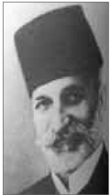
مناجيم دانيال زعيم الطائفة الاسرائيلية