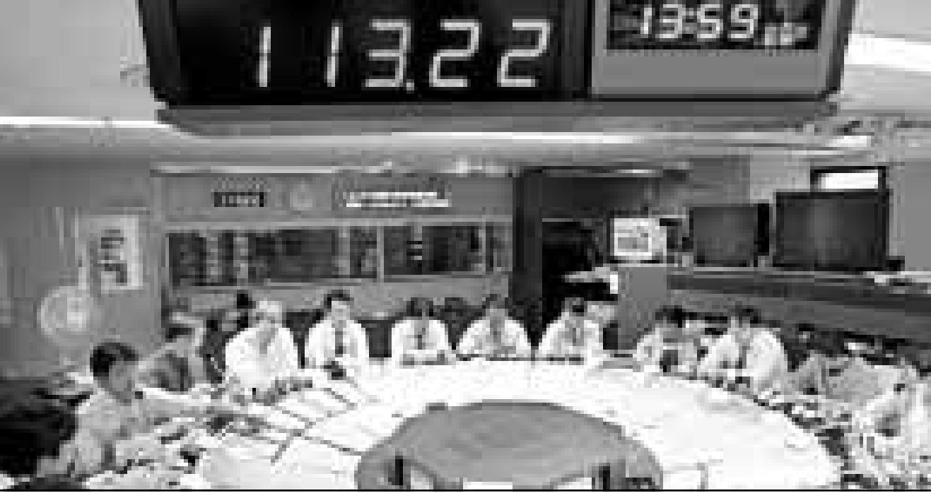
قاعة معاملات العملة في بورصة طوكيو حيث هبط سعر الين الياباني امام اسهم الدولار

ويضا جرمي هوكينز كبير الاقتصاديين في بنك ارميف لاندى انخفاض اليورو الى ادنى مستوياته في اسواق الامم المتحدة». وقال غسبر دانيسوي في بنك اى. بي. ان امره وانه بالفعل استمر انما شاهدناه خلال الاسابيع الماضية عندما زاد الطلب على الدولار بسبب النمو القوي في الولايات المتحدة مقارنة بنمو اوروبي اضعف. ورغم ابقاء البنك المركزي الاوروبي على اسعار الفائدة دون تغيير في الالاتح الاسبوع الماضي عند مستوى 3 بالمئة فان التوقعات تتزايد بخفض الفائدة في المستقبل القريب. ويتناقص ذلك تماما مع دلائل حديثة على نمو مزدهر في الولايات المتحدة وما