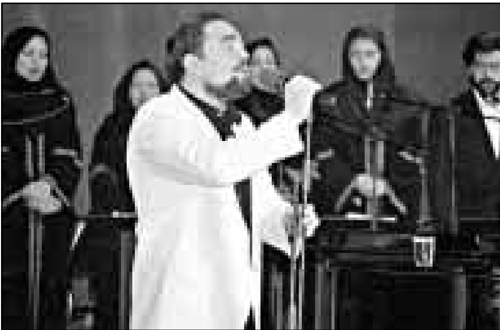
مطرب ايراني يحيي فخلا في طهران في الذكرى العشرين للثورة الاسلامية

■ طهران - اف ب: قال وزير الخارجية الايراني كمال خرازي امس ان طهران ولندن ستعيدان العلاقات الدبلوماسية كاملة بينهما بعد تسوية مسائل بروتوكولية. واوضح خرازي في مؤتمر صحفي «سيعلن ذلك ما ان يكمل كل الطرفي تسوية المسائل البروتوكولية». وازداد الوزير ان تبادل السفراء سيكون الخطوة الاولى في اتجاه تطبيع العلاقات بشكل كامل بين بلاده وبريطانيا.