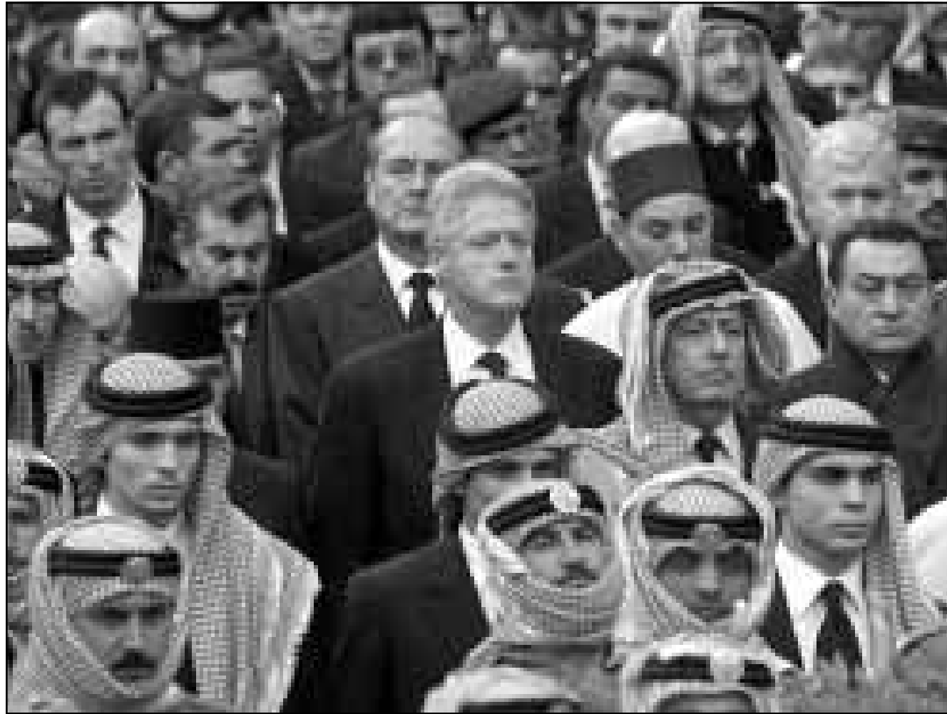
الرؤساء بيل كلينتون و جاك شيراك وحسني مبارك وسط الجموع التي شاركت في تشييع جثمان العاهل الاردني الملك حسين امس (ب)