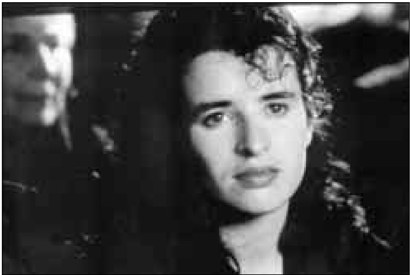
من اليسار كيلي واين بانن في فيلم waking ned devine

يكون مات ولتلك حي تترق وسوف تذهب الي السجن. محور الفيلم هو حتما العلاقة بين جاك و مايكل. والمخالف بانن وكيلي.. وهما من الممثلين المخضرمين.. يستحقان الثناء لارتقاؤهما في الفيلم من مستوى الاعمال هذا النوع. عمل بانن الطويل والمميز في ميدان الفن قلته الي مسرح بيروني والي الغربي في لندن والسينما، حيث كان فيلم Hope and Glory من افضل افلامه. غير ان لم يسبق لخبه الايرلندي ان يبرز افضل مما نشاهده له في دور لغايتي. وخاصة عندما يقوم سيارته عاريا -دون سبب واضح- في شوارع القرية.