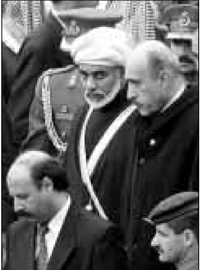
السلطان قابوس يشارك بتشيع جثمان الملك حسين