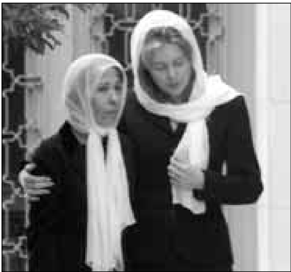
الملكة نور والاميرة بسمة

الملك الراحل، كانت تحمل لقب الملكة «الوادة» وهي الملكة الراحلة زين، واذا قرر الملك عبد الله منح زوجته الحالية لقب الملكة، فسكون اصغر ملكة في العالم - 27 عاماً - علماً بان الكثير من التحليلات السياسية الغضائية سلطت الاضواء على الاميرة رانيا العبد الله بصفتها «ملكة المستقبل»، وتم تحديداً لتسليط الاضواء على جذورها الفلسطينية باعتبارها من العوامل التي تساند الوحدة الوطنية، وتساهل عملية السلام في المستقبل، وبعض الاوساط الفلسطينية في عمان والضفة الغربية احتفلت فعلياً بقرار تعيين عبد الله بن حسين ولياً للعهد قبل اسبوعين، على اعتبار ان ملكة المستقبل ستكون من اصل فلسطيني، والملكة نور بطبيعة الحال، والدة ملكة المستقبل اذا جازت التسمية، وهو الامير حمزة بن الحسين، الذي عين ولياً للعهد يوم امس الاول فقط، وحسب بعض المصادر والعلومات فان وصايا الملك حسين قبل رحيله تضمنت بقا احتفاظ زوجته نور بلقب الملكة، وهذا يؤكد مصادر مطلعة لـ «القدس العربي» ان التوجه داخل الاسرة المالكة يقضي باحتفاظ الملكة نور بلقبها كملكة للاردن، والرئيس الامريكي بيل كلينتون في رسالة التحفيز التي وجهها لاردنيين ارسالها للملكة نور، وخاطبها بصفتها ملكة الاردن، معبراً عن فرحه بان تكون ملكة هذا البلد الصديق من اصل امريكي، والرئيس الفرنسي جاك شيراك خاطب الشعب الاردني معزياً من خلال رسالة وجهها للملكة نور تحديداً، ودستورياً، لا يوجد ما يمنع وجود ثلاث ملكات في آن واحد، وعليه يستطيع الملك الحالي، عبد الله بن الحسين، ان يمنح لقب الملكة لزوجته الحالية، الاميرة رانيا، وولده الاميرة منى، التي حضرت الى عمان للبقاء الى جانب ولده الملك، بعد ان كانت مقيمة في بريطانيا.