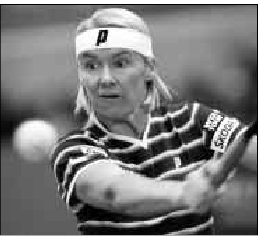
التشيكية جانا نوفوتنا

المصفون العشرة الاوائل: 1- الامريكي بيت سامبراس 3744 نقطة 2- الاسباني اليكس كوريخا 3530 3- الروسي يفغيني كافيلنيكوف 3350 4- الاسترالي باتريك راقت 3264 5- الاسباني كارلوس موييا 3178 6- التشيلي مارتشيلو ريوس 2969 7- الامريكي اندريه اغاسي 2845 8- البريطاني تيم هنمان 2608 9- الهولندي ريتشارد كرايتشك 2537 10- البريطاني غريغ روسيدسكي 2469