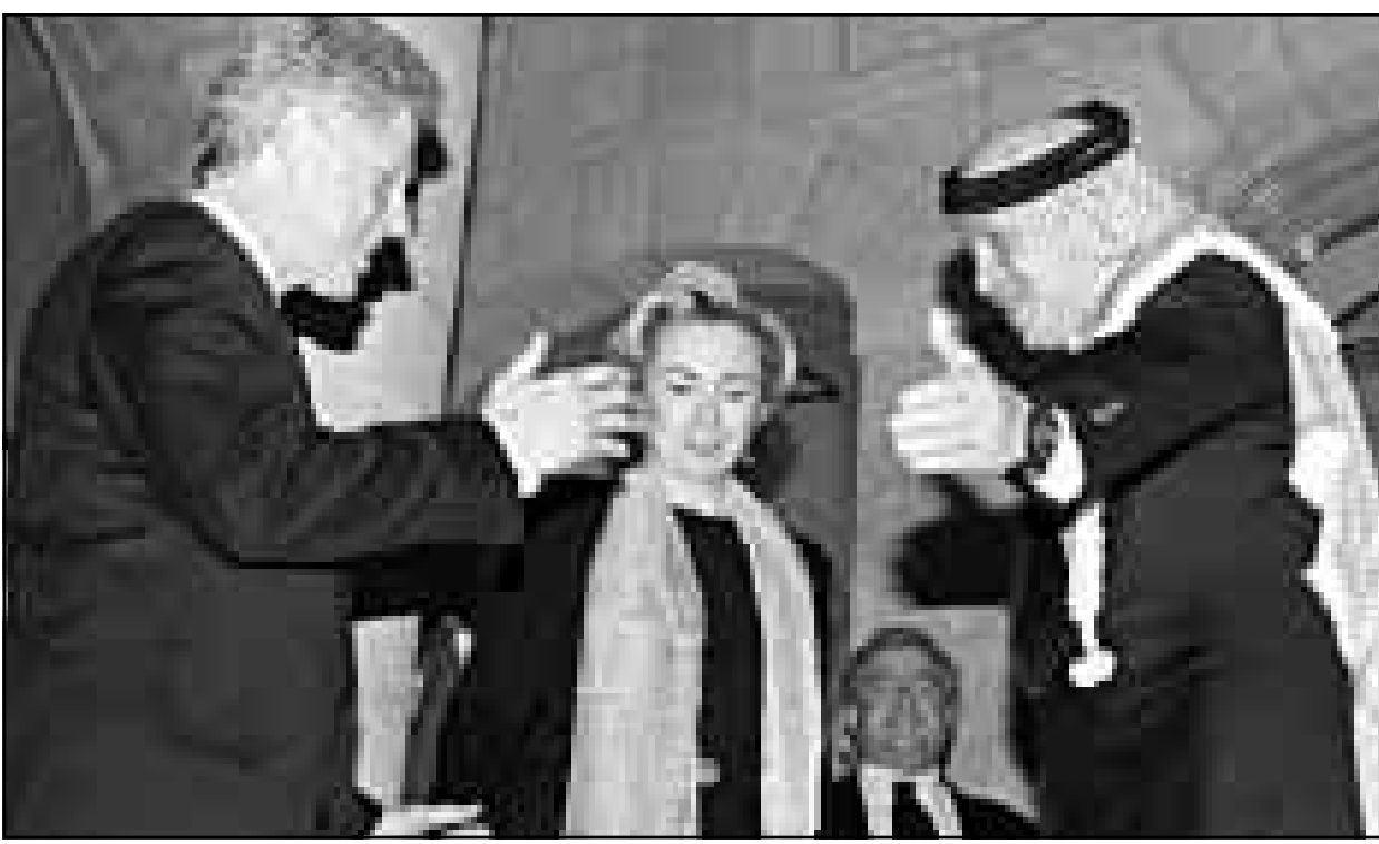
الملك عبد الله يرحب بالرئيس الأمريكي كلينتون وزوجته هيلاري