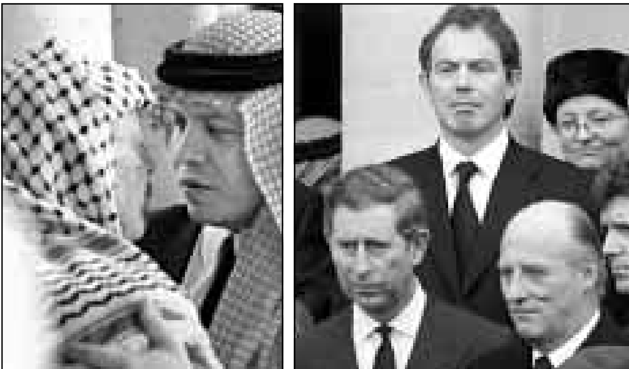
الرئيس عرفات يعزي الملك عبد الله