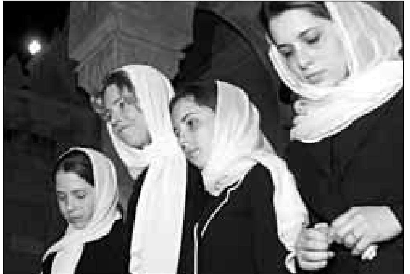
الملكة نور تغادر قصر السلام مع ابنتها الاميرة راية (يسار)، الاميرة ايمان، والى اليمين الاميرة هيا ابنة الملك حسين من الملكة علياء