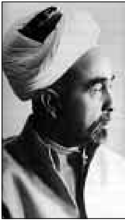
الملك عبد الله الاول

التوتر والمنافسة مع الوطنية الفلسطينية، وعلى ما يبدو ايضا الحلف الطويل مع اسرائيل.