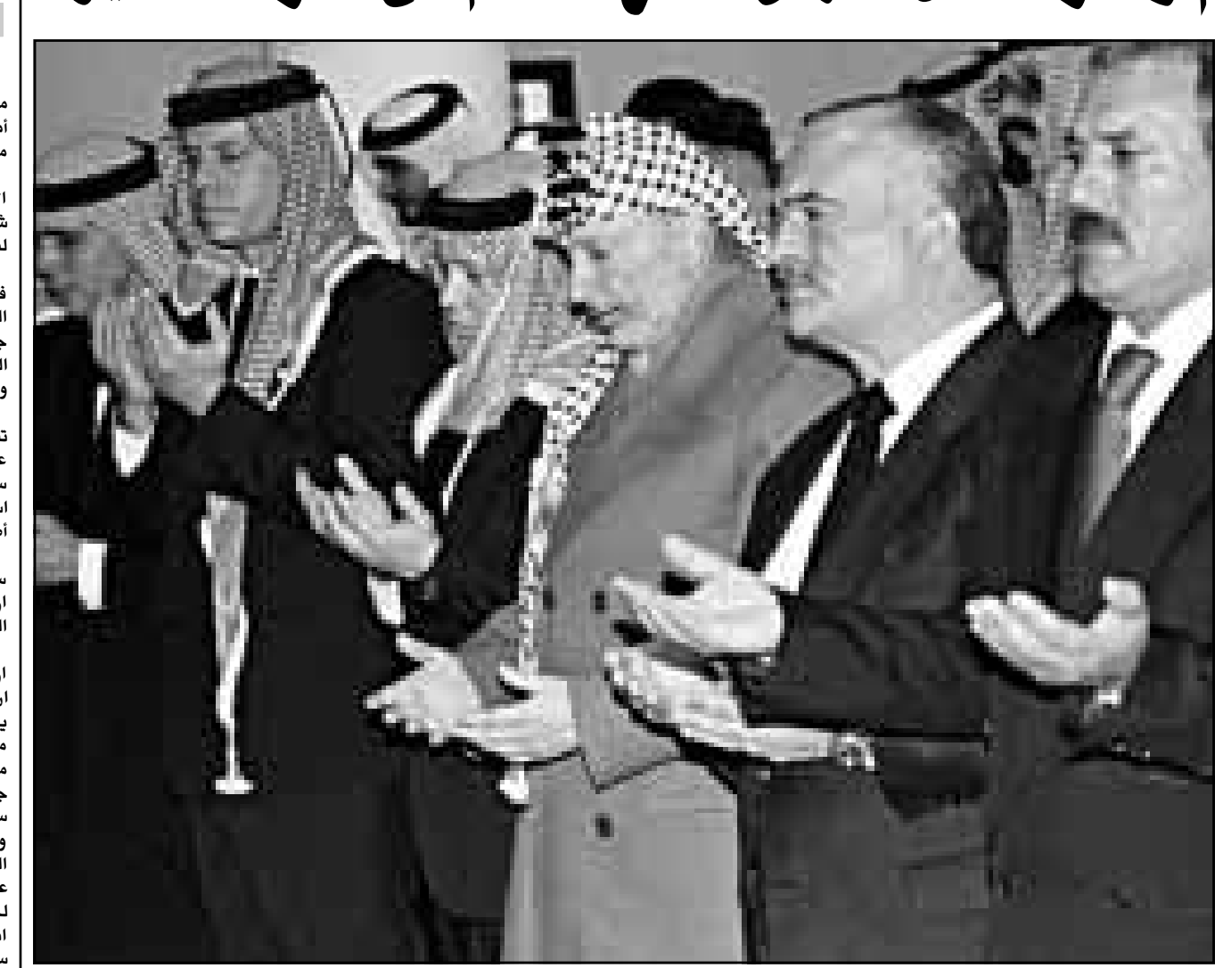
الرئيس على عبد الله صالح والامير حسن والرئيس عرفات والملك عبد الله والاميران فيصل وحزمة يتلون القرآن على روح الملك الراحل

وقال جيبوتي «ثباته عن اندونيسيا حكومة وشعباً وبالاصالة عن نفسي اود ان اقدم عميق تعازي في وفاة جلالة الملك حسين». وتابع «ان المجتمع الدولي سيدكر دوماً الملك حسين