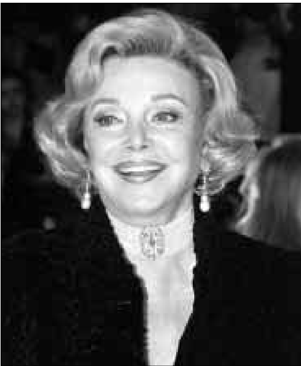
بربارا سيناترا الرملة فرانك سيناترا كانت ضيفة حفل توزيع جوائز الكوميديا الامريكية ليلة امس الاول في لوس انجلس

اقتصدية وسياسية واضحة». و اضاف ياسين ان ندوة ايعاض المعتدلين غير مؤهلين ليشكلوا بدليا للنظم الحالية. فالطرف الاول يرفض التطور والتقدم في حين يحاول الطرف الثاني تجميل طروحاته لتأسيس حكومة يسيطر عليها رجال الدين. وتطرق الباحث التونسي كمال عمران الى «التجديد في الفكر الاسلامي المعاصر» فأكد ان «التحديث يبدأ من الداخل على مستوى العلوم الشرعية كالعلوم القرآنية والحديث والفقه و علم الكلام ومن الخارج عن طريق الدراسات والابحاث التي تستخدم نتائج العلوم الانسانية لفهم علاقة الظاهرة الدينية بالحياة الاجتماعية والفكرية للإنسان».