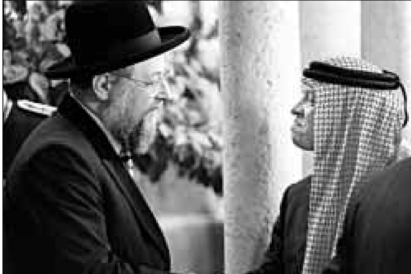
الملك عبد الله يصافح الحاكم الاسرائيلي الذي شارك براسم التشييع