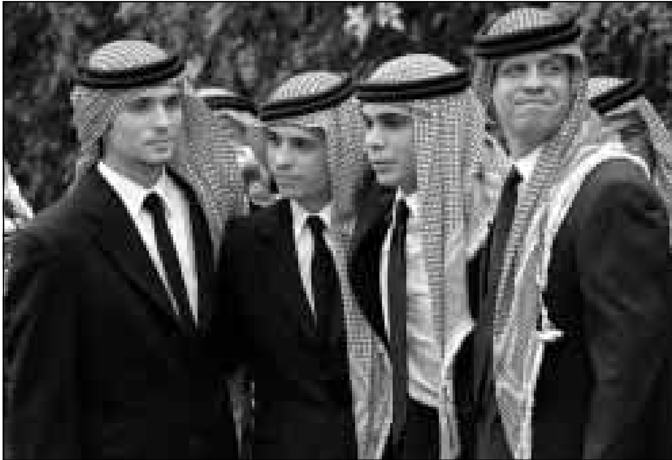
ابناء الملك حسين من اليسار الى اليمين: الامير هاشم، الامير حمزة، الامير علي والامير فيصل