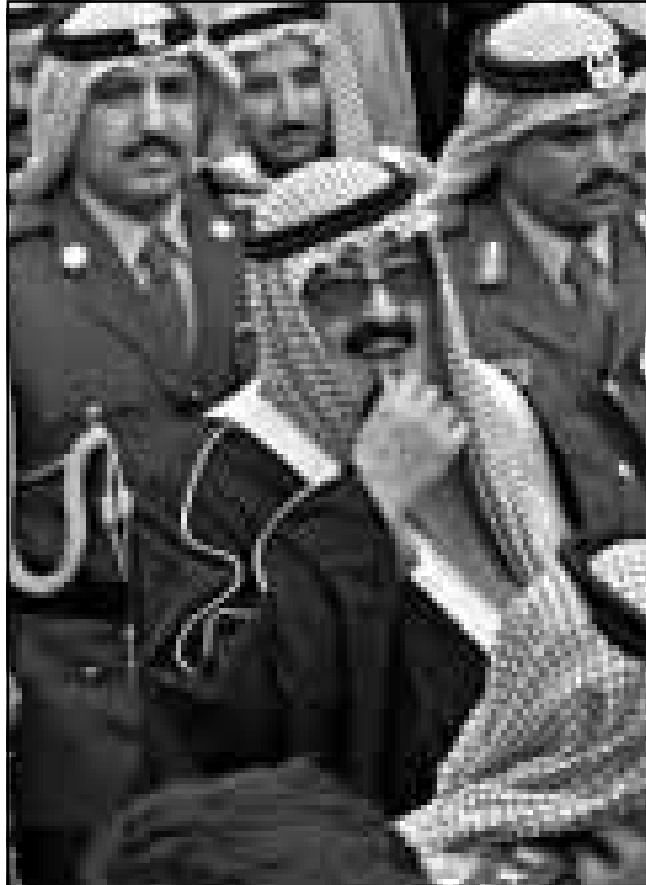
الامير عبد الله ولي عهد السعودية يشارك بتشيع جنازة الملك حسين

■ عمان - رويترز: الامير حمزة ولي عهد الاردن الجديد هو الابن الرابع والمفضل للملك حسين. دفع به ابوه الى الاضواء واعاد للسلطة مقلما الملك عبد الله مؤسس المملكة الاردنية الهاشمية مع قيده العاهل الراحل. كثيرا ما كان حمزة (18 سنة) يقف بجوار والده وهو يستقبل الزعماء الاجانب. وتلقى الامير حمزة تعليمه وعاش في الخارج لكن الامير الشاب وهو الابن الاكبر لزوجته الملك حسين الراحلة المتة نور الامريكية المولد يقاد يكون غير معروف لعدد كبير من الاردنيين. وفي سنواته الاخيرة نجح الملك حسين اكثر من مرة انه يرغب ان يتبع الامير حمزة الطويل القوام الاسود الشعر خطاه. وقال مسؤول بارز بالدبوان الملكي مشيرا الى تعلق العاهل الراحل بحمزة الذي كان بجواره اثناء علاجه من السرطان في الولايات المتحدة في العام الماضي لمدة ستة اشهر «كان الملك حسين يرى في حمزة امتدادا لنفسه». وبعد ان نجح الملك حسين في الشهر الماضي شقيقه الامير حسين من ولاية العهد واختار ولده عبد الله ليملا النصب الامير حمزة في عهد الثالث في اسبوعين. وفي خطاب ترقية الامير حسين من ولاية العهد اشاد العاهل الراحل بالامير بقوة عن سياسة ابيه.