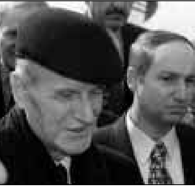
الرئيس السوري حافظ الأسد أثناء مشاركته في جنازة الملك حسين

التركيبة - الاسرائيلية في المتوسط في كانون الثاني (يناير) 1998. اما الحدود بين البلدين، فكانت دائما مجالاً لثارة التوتّر، إذ اتهمت دمشق في الثمانينات الاردن بتسهيل تسلل الاخوان المسلمين الى سورية لتفكيك اعتداءات، في حين كانت عمان تلوم جارتها لتسهيل تسلل العناصر الفلسطينية المتطرفة في دمشق لتنفيذ عمليات في الاردن، واعتقال دبلوماسيين اردنيين في الخارج. وخلال قمة حزيران (يونيو) 1996 في القاهرة، التحصّل الرجلان بتدخل من الرئيس المصري حسني مبارك، لكن ذلك لم يسفر عن تحسين العلاقات بينهما. وكانت آخر مكالمة بين الأسد والحسين في 19 كانون الثاني (يناير) الماضي، عندما اتصل الأسد بالملك ليهنئه بعودته سالماً بعد ستة اشهر من العلاج في الولايات المتحدة.