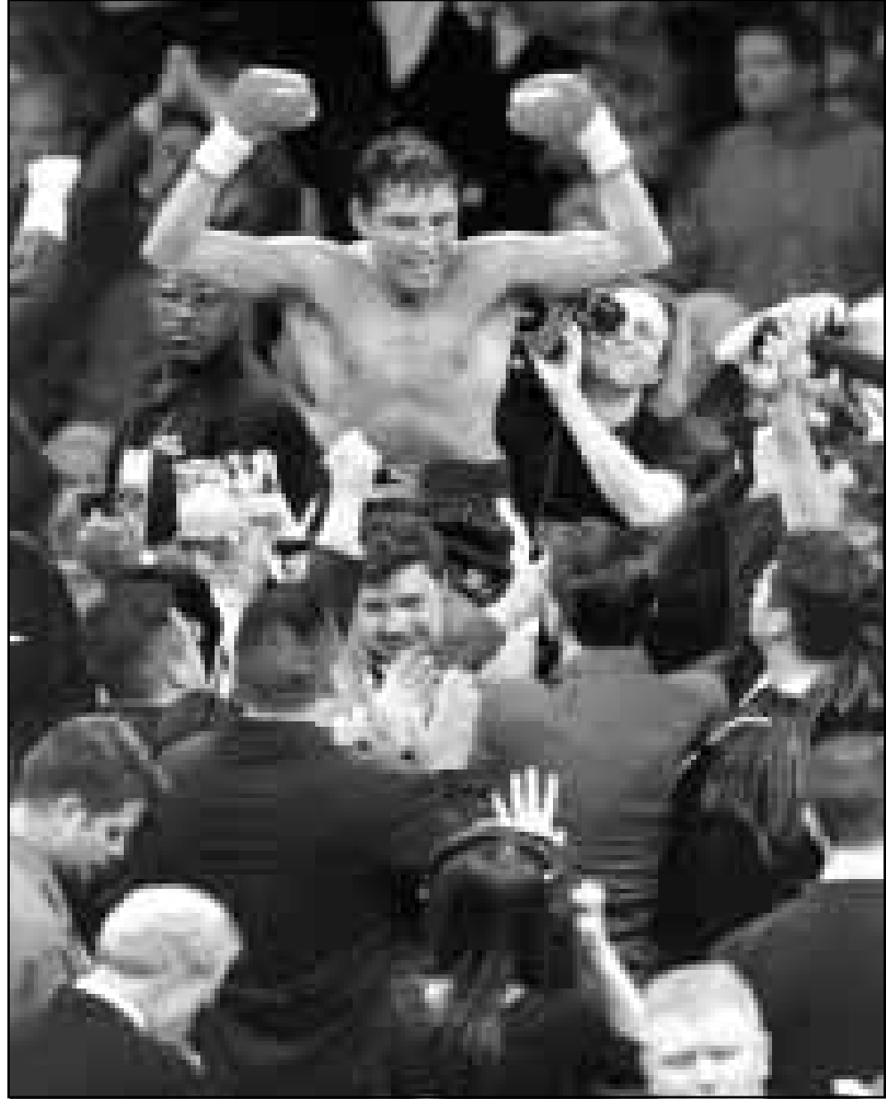
الملاكم (اوسكار ديلا هويا، فائز).

في لاس فيجاس (نيفادا) احتفظ الملاكم المكسيكي ايريك موراليس بلقب مجلس الملاكمة العالمي لوزن فوق الديك بعد ان هزم متحديه ريكان انجيل شاكون في المباراة التي اقيمت بينهما على اللقب. وجاء فوز موراليس على شاكون بالضربة القاضية في الجولة الثانية من المباراة التي اقيمت في لاس فيجاس بولاية نيفادا. وسقط شاكون على حبال الحلبة نتيجة ثلاث ضربات متلاحقة وجهها موراليس الي وجهه بعد مرور دقيقة واحدة و 5 ثانية من الجولة الثانية ولم يتمكن من النهوض الا بعد انتهاء العد. وهذا هو الدفاع الخامس لموراليس عن اللقب الذي فاز