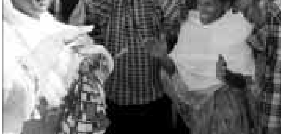
اريتريون يحتفلون باسقاط طائرة اثيوبية في اسمر امس

ولم يتوافر صباح امس اي تأكيد لهذه الحوادث الجديدة من مصدر مستقل. ومشاركة الطيران الاثيوبي في المعارك التي اقرت به اثيوبيا بشكل انتهاكا جديدا من قبل اديس ابابا للاتفاق وقف استخدام الطائرات المقاتلة الموقع بين الطرفين في 14 حزيران