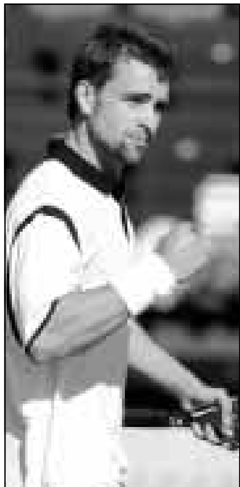
اللاتفي نيكولاس كيبير.