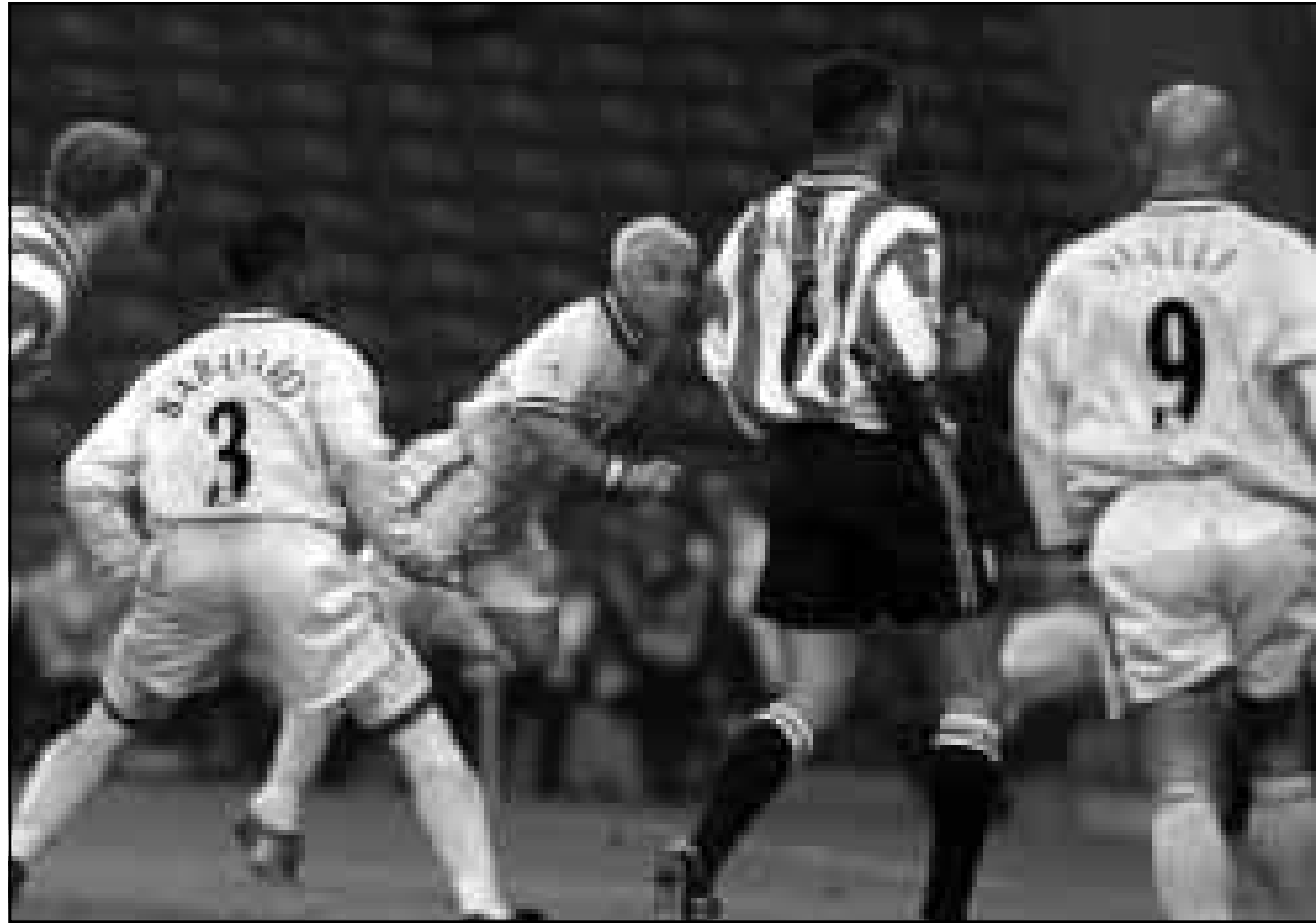
نجم تشيلسي اللاعب الإيطالي روبرتو دنمايتو (الثالث الى اليسار) سدد هدفا برأسه في مرمى شيفيلد وينزداي.