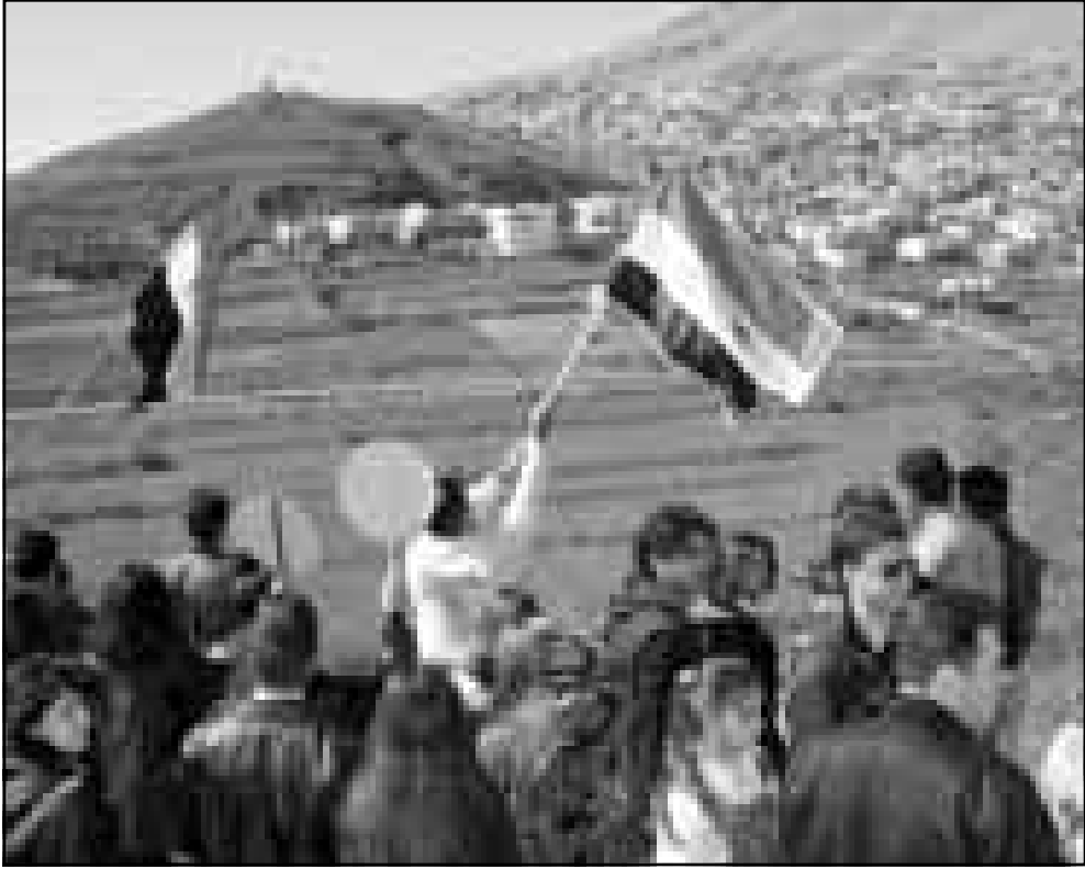
شباب سوريون يلوحون بالعلم السوري لجيرانهم في قرية مجدل شمس في هضبة الجولان المحتلة

السورية ورددت الشعارات الداعية الى اعادة الهضبة الى السيادة السورية فيما نظمت حلقات دبكة للاحتفاء باعادة تجديد الولاية الرئاسية للرئيس السوري حافظ الاسد. وكما هي عادة اللقاء خلال سنوات الاحتلال الماضية فقد تبادل سكان الهضبة في المنطقة المحتلة اطراف الحديث عبر مكبرات الصوت مع قارئهم في سورية فيما جدد قادة عرب في الهضبة عبر كلمات لهم في المهرجان الحاشد رفضهم للاحتلال الاسرائيلي الاسرائيلية على سكانها في وقت أكدوا فيه هويتهم السورية بتلاوتهم بقرينة تهنئة الي الرئيس السوري حافظ الاسد بمناسبة تجديده وولايته الرئاسية. وقد شل الاضراب الهضبة حيث امتنع العمال عن التوجه الى اماكن عملهم ولم يصل الطلاب الي مقاعدهم الدراسية في وقت اغلقت محال تجارية ابوابها وهو ما اعتبره السكان تجديدا للولاء لجمهورية سورية العربية. ونظم السكان في منطقة جبيلية تفصل الجزء المحتل من الهضبة عن سورية مهرجانا حاشدا رفعت خلاله الاعلام السورية المحتلة.