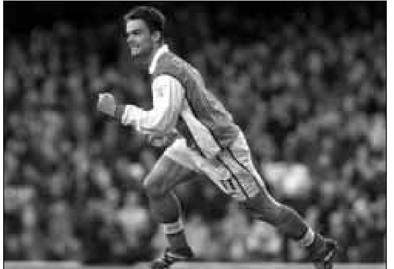
مارك أوفير مارس لاعب ارسنال يحي الجمهور سعيدا بعد تسديده الهدف الختلف عليه في مرمى شيفيلد يونايتد (رويتز).