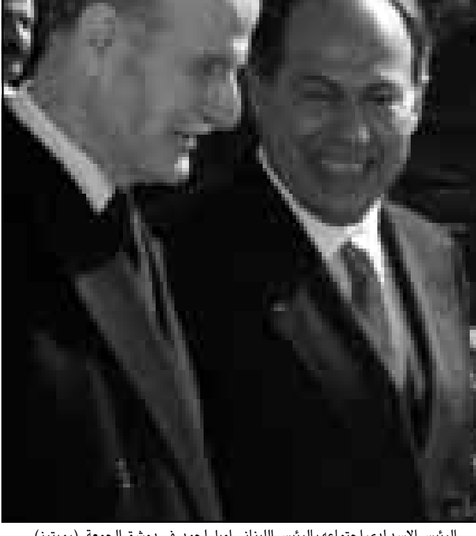
الرئيس الاسد لدى اجتماعه بالرئيس اللبناني اميل لحود في دمشق الجمعة