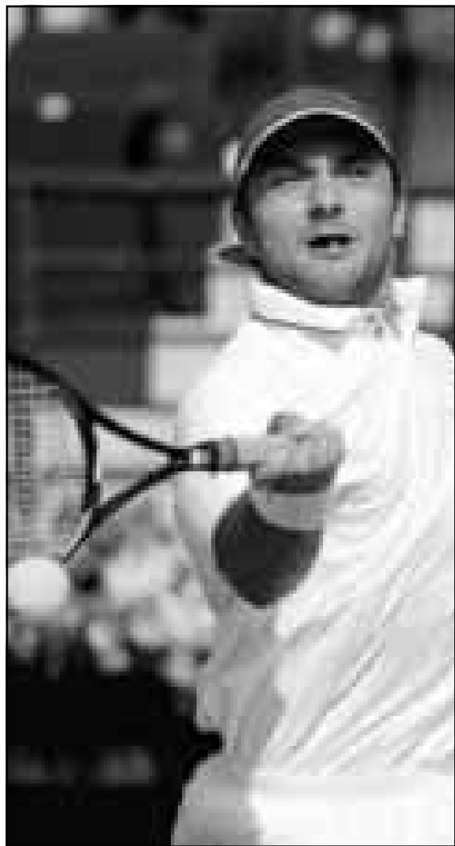
الاسترالي اندرو ايلي (رويترز).

سان بطرسبرج (روسيا) - رويترز: تاهل السويسري مارك روسيه للمباراة النهائية في بطولة سان بطرسبرج المفتوحة للتنس للرجال في روسيا بعد الفوز على الروسي مارات سافين. ففي الدور قبل النهائي للبطولة فاز روسيه المصنف الثاني في البطولة على سافين المصنف الرابع 3/6 و 6/3 و 2/6. وفي المباراة النهائية للبطولة امس الاحد التقى روسيه مع الالمانى غير المصنف ديفيد بريونسي الذي فجر مفاجأة وهزم المصنف الاول في البطولة الهولندي يان سيميرينك 4/6 و 2/6 في الدور قبل النهائي.