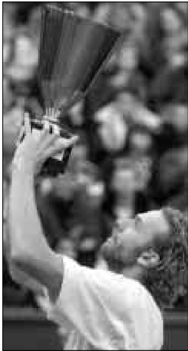
مارك روسيه يحمل الكأس.