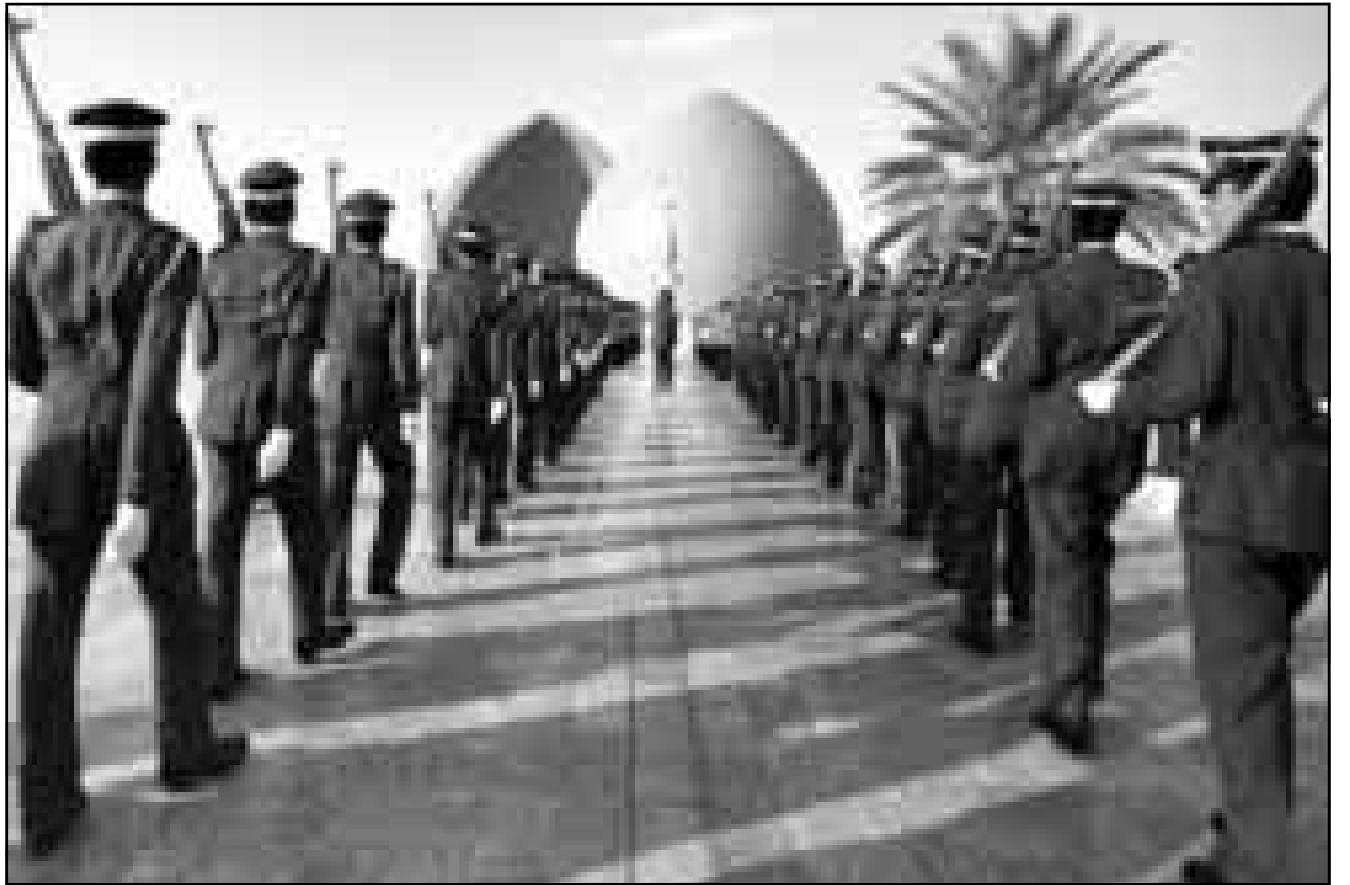
جنود عراقيون امام نصب تذكاري لضحايا القصف الامريكي للمجا العمومية في بغداد امس

وكانت الصحيفة نفسها قد حذرت يوم الجمعة الماضي من ان «الاعتداءات الامريكية، يمكن ان تجر المنطقة نحو دفعة جديدة من الصراعات الدامية». وقال الدبلوماسي نفسه «ان العراقيين يريدون ان يقولوا للعالم انهم في طريقهم الى استعادة سيادتهم». و اضاف «انهم يقولون ان مناطق الحظر الجوي اقيمت خارج قرارات مجلس الامن وان السلطة المركزية لا تستطيع ان تسيطر على العراق». وقم في الجوب». ونسبه هذا الدبلوماسي الى ان «دبلوماسيه عدة في بغداد يتساءلون عن دور مجلس الامن في هذا المسألة». وقد اكد وزير الخارجية الروسي ايغور ايفانوف يوم الجمعة الماضي ان الغارات الامريكية تولد «قلقاً متزايداً» في موسكو. ويتعسف اصرار العراق على اسقاط منطقتي الحظر الجوي ايضاً في ارادة النظام العراقي التي اثبات انه لا يزال يمسك بعقبات الدفاع عن البلاد. وقال الدبلوماسي الغربي ان «الحكومة