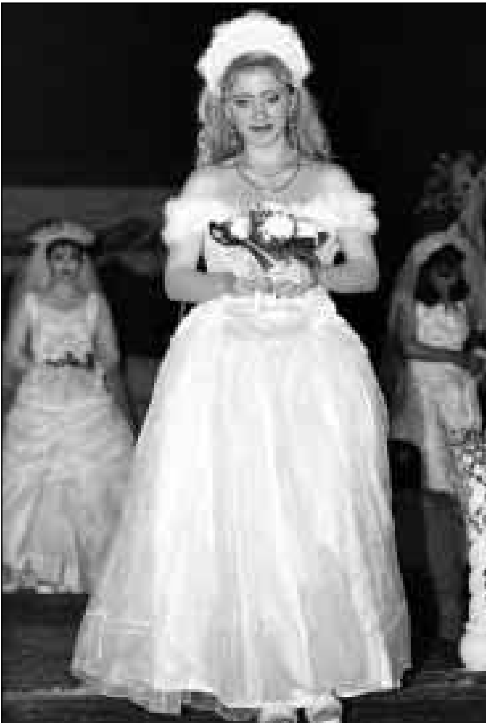
عارضة ازياء عراقية قدمت هذا الزي في بغداد مع متبركات مصمم عراقي ضمن عرض اقيم وسط الاجواء العوانية الامريكية ضد الشعب العراقي

بالرباط مع مديري المؤسسات الاعلامية التابعة لوزارة المناقشة ما يتعلق بالاتصال والاعلام في مشروع المخطط الخماسي للحكومة المغربية.