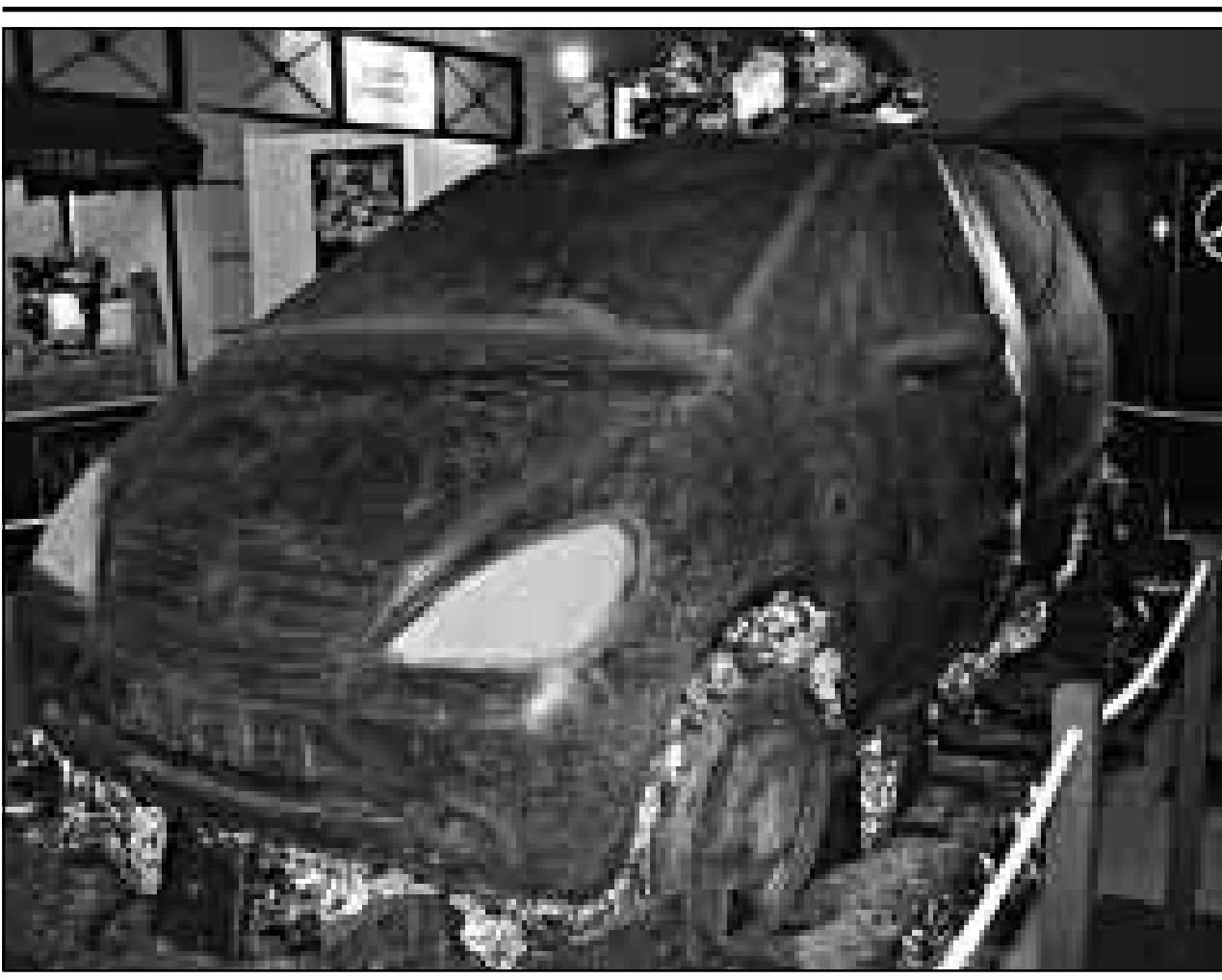
نموذج بالحجم الطبيعي لسيارة مرسيدس الصغيرة الجديدة اى كلاس مصنوع من الشوكولاته يعرض حاليا في معرض خاص بالشوكولاته في العاصمة الليبية بروكسل