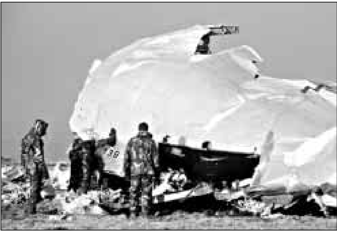
صورة من الأرشفة لثلاث انفجار الطائرة الأمريكية فوق لوكربي قبل أكثر من عشر سنوات

وقالت منظمة الأمم المتحدة للتربية والعلوم والثقافة (اليونسكو) التي رعت اجتماع اللجنة برئاسة مديرها العام فيديريكو مايور أن ما قد يصل إلى 30 ألفاً من حملة درجة الدكتوراه الأفارقة يعيشون خارج القارة. وأشارت إلى أن الطلبة الأفارقة يشاركون في أفريقيا بصورة متزايدة بحثاً عن فرص العمل في الخارج، كما أن بعض أو مهندسين اثنين يتم تدريبهم في الخارج يرفضون العودة إلى وطنهم.