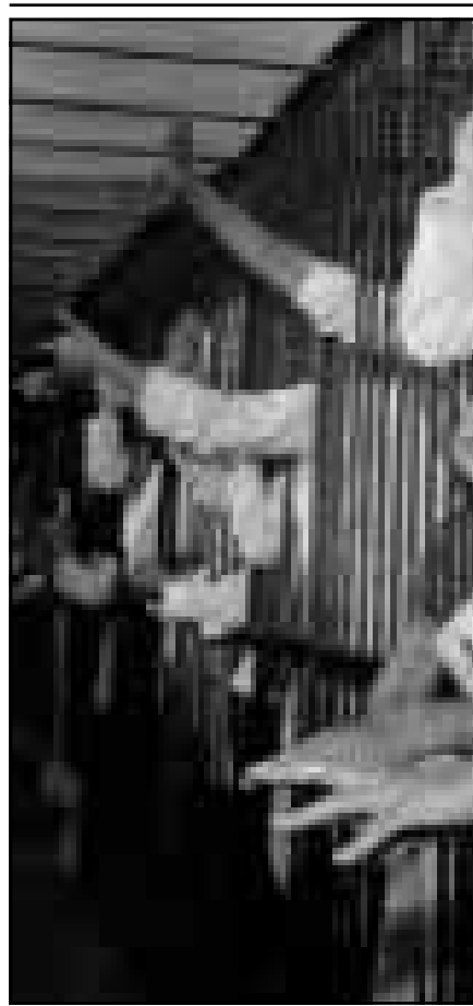
التمهيون اثناء مؤلهم امام المحكمة في القاهرة امس

الخرطوم سائقي «الرقشا» باضافة قطرات من زيت المحرك الى البنزين الذي يستخدمونه قوداً للرقشا» للمساعدة في مرونة المحرك وبقائه بارداً. ولم تكن «الرقشا» وحدها آخر مظاهر العشق الهندي-السوداني في الشارع العام، فقد اقبل السودانيون بشدة على اقتناء مركبات هندية من طراز «تاتا» التي تتسع لـ 150 ركاباً، وقد اطلق عليها في الخرطوم «الدفار» الذي قضى تماماً على الزحام الذي كانت تشهده مواقف الحافلات العمومية في العاصمة المنتهمة. وهكذا فإن «الدفار» الهندي يكاد يرق المسار الاخير في نغش عربة الاجرة ذات اللون الاصفر التي كانت ذات يوم مصدر دخل محترم في الخرطوم. ويقول مالكو «التاتا» الهندية في السودان ان رخص اسعارها بالمقارنة مع الحافلات الاوروبية واليابانية يعد اهم اسباب الاقبال على اقتنائها. واخيراً، فان شباب العاصمة السودانية من الجنسين يقبلون بشدة على ارتياد دور السينما التي تركت استيراد الافلام المصرية والغربية لتتقصر على افلام الهندية.