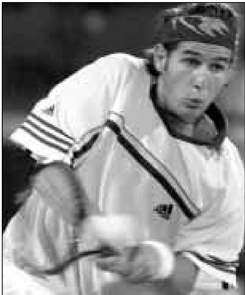
الفرنسي جيروم جولارد.