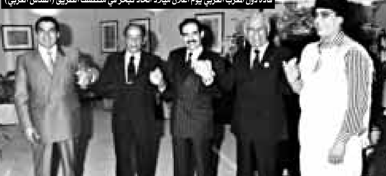
قادة دول المغرب العربي يوم اعلان ميلاد اتحاد تجر في منتصف الطريق

وفي مجال الامن الغذائي، توجه الجهد المغاربي نحو تنسيق السياسات الفلاحية وتطوير التعاون في هذا