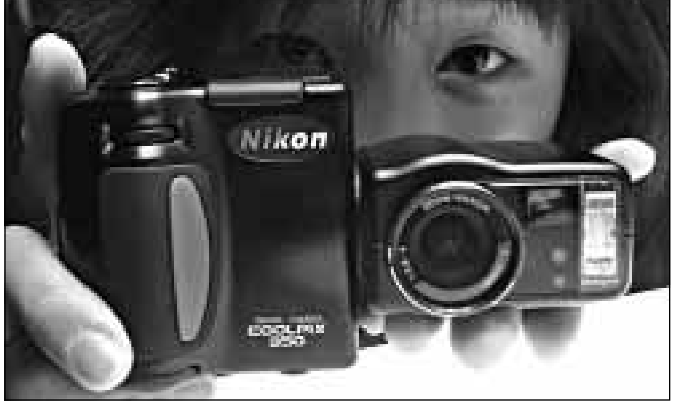
مستخدمة في شركة نيكون اليابانية تعرضت أمس في طوكيو كاميرا رقمية جديدة تتسم بصورها بدرجة عالية من التحديد بفضل تزيدها بعدسة يتراوح مداها البؤري بين 21 و 71 ملليمتر، ولا يتجاوز وزن الكاميرا التي صنع جسمها من الماغنيزيوم 350 غرام، ويبدأ تسويقها في الخامس والعشرين من الشهر المقبل بسعر 1100 دولار

وتعارض المنظمة بشدة التركيز على الانتاج على حساب البيئة وجمالها، ولذا فهي تفضل بمنتجاتها في بعض مناطق العالم الثالث، حيث تدعم مزارع