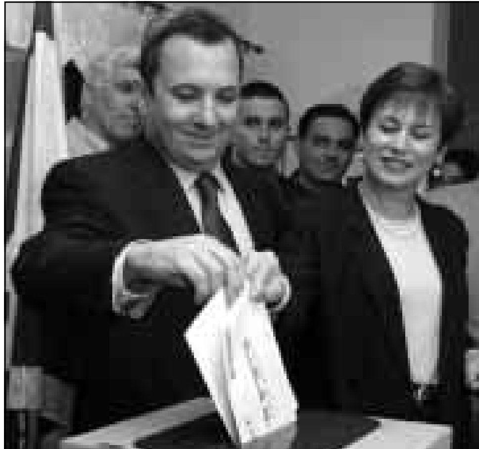
باراك وزوجته ناعرا يشاركان في الاقتراع على رئاسة حزب العمل الاسرائيلي المعارض امس الاثني

حساب ترسيم مقام يدفن فيه أحد رجالات الدين اليهود المتشددين في منطقة الجليل الاعلى شمال اسرائيل وذلك تلبية لطلب احزاب التدينين المتزمتين، ووافقت الحكومة كذلك على طلب وزير السياحة الاسرائيلي تصفوير سباحي من الدرجة «أ» (شمال اسرائيل) منذ ان كمناطق تصفوير سباحي من الدرجة «أ» في سلم الاولويات القومي، وكانت الوازنة العامة للدولة للعام الحالي 1999 والتي صادق عليها الكنيست (البرهان) الاسرائيلي مطلع الشهر الجاري قد تضمنت اعمدات إضافية لطلب احزاب التدينين المتزمتين واليمين المتطرف بلغت قيمتها أكثر من نصف مليار شيكل، وذلك في نطاق سياسة الاقتصاد الانتخابي التي اطلق العنان لها رئيس الوزراء بنيامين نتنياهو، كما يصفها المراقبون الاسرائيليون.