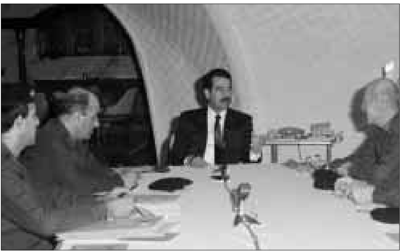
الرئيس العراقي صدام حسين مجتمعاً ببنائيه عزة ابراهيم وطه ياسين رمضان في بغداد امس

وحذر البيان المسؤولين في السعودية والكويت قائلا «انهم يظنون ان في حرب عدوانية بغية ليس لشعب نجد والحجاز وليس لشعب الكويت مسلحة فيها» من خلال السماح للطائرات الامريكية والبريطانية باستخدام ارض بلديهما. ورأى المتحدث الكويتي ان تهديدات الرئيس العراقي «تمثل العدوان العربي للعراق على الكويت عام 1990 (...)» وتضمن تهديدا مباشرا وخطيرا لامن وسيادة دولة الكويت. وكان مسؤولون عسكريون اكوا في واشنطن امس ان مقاتلات امريكية نفذت ضربات جوية في منطقة حظر الطيران بجنوب العراق كما هاجمت وسائل دفاع جوي عراقية في شمال العراق امس الاثنين. ولم يعلق مسؤولون امريكيون على تقارير اوردها بغداد تشير الى وقوع اصابات بين العراقيين من جراء هذه الضربات في منطقة حظر الطيران بجنوب البلاد. وقالت الفلنانت كولوئيل جودي سيسنر المتحدثة باسم القيادة المركزية الامريكية «وجها ضربات في منطقة حظر الطيران الجنوبية ردا على استفزاز عراقي». ولم تذكر المتحدثة تفاصيل اخرى. وقال المتحدث ان خمسة اشخاص قتلوا وجرح 22 اخرون عندما هاجمت طائرات غربية اهدافا مدنية وعسكرية في جنوب العراق.