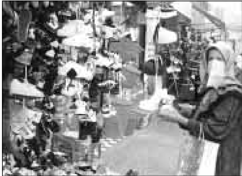
جزائرية مدعوة، بكيفية ابناء وبنات بلدها، الى شد الحزام اكثر بسبب الضائقة الاقتصادية التي تهدد بلادها