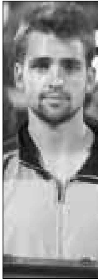
اللاعب الألماني نيكولاس كيرف