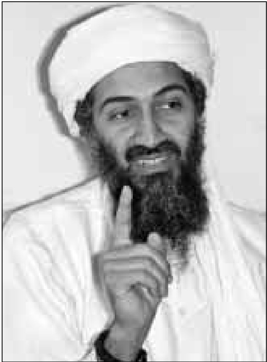
اسماء بن لادن (القدس العربي)

■ ثريوبي - علي موسى عبدي: تخوف عدد من الخبراء من ان يؤدي تفاقم النزاع الحدودي بين اثيوبيا واريتريا الى زعزعة الاستقرار الحادي دول القرن الافريقي. وكان مجلس الامن الدولي حذر في قرار اصدره في 29 كانون الثاني (يناير) الماضي قبل اسبوع من استئناف المعارك الواسعة الحلق بين الدولتين الجارتين من ان الحرب يمكن ان يكون لها تأثير مدمر على المنطقة بكاملها. واقادت نشرة اعلامية اقليمية تابعة للامم المتحدة مؤخرا ان كلاً من الطرفين يقوم بانشاء حركات تمرد وتسليحها وفي بعض الاحيان من خلال الفصائل الصومالية. وتعتبر الامم المتحدة ان دعم اسمره واديس ابابا لحركات التمرد هذه يتراوح بين اجراء اتصالات بسيطة غير رسمية، وبين تقديم الدعم العسكري المباشر. ونقلت النشرة عن محللين اقليميين لم تكشف عن اسمائهم ان اريتريا تحاول إعادة تفعيل حركة اوروو المعارضة في اثيوبيا، وكانت جبهة تحرير اوروو اعلمت في شباط (فبراير) انها ستزعم الغناما في جنوب اثيوبيا حيث تقابل الحكومة الاثيوبية ايريتريا. واضافت النشرة ان هناك اذاعة للمعارضة تبث بلغة الاورومو عبر محطات ارسال اريتيرية، في وقت تبث فيه اذاعة صوت السلام والديموقراطية في اريتريا المعارضة للسلطة في اسمره انطلاقاً من