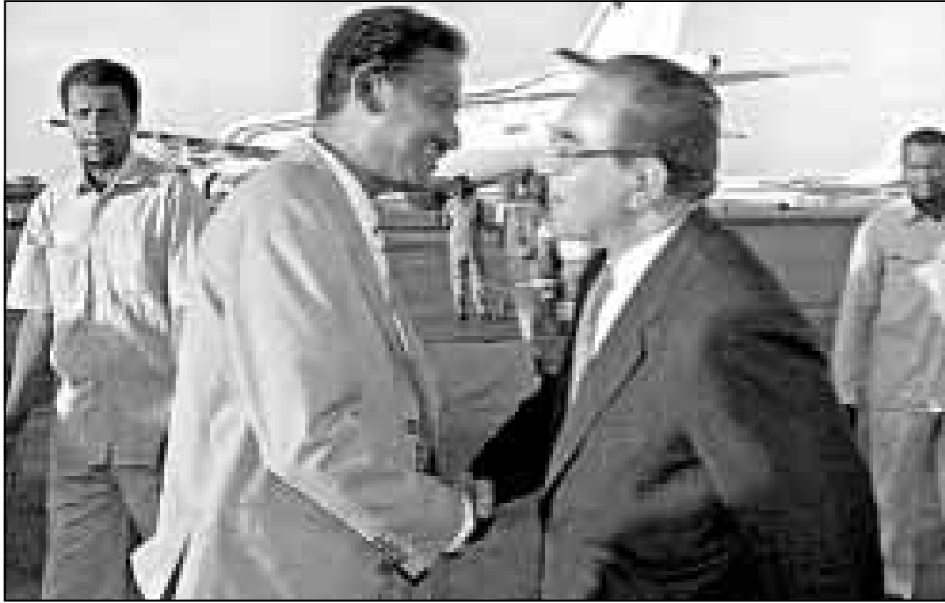
وزير الخارجية العراقي سعيد الصحاف لدى وصوله مطار الخرطوم امس حيث كان في استقباله نظيره السوداني مصطفى عثمان اسماعيل

■ اديس - اف ب: اعربت اثيوبيا عن أسفها لاعتماد مجلس الامن الدولي نظام «الكيل بمكالمين» في القرار الذي تبناه الاربعة الماضي ويبدو انها في اثار (مايو) 1998 في منطقة يادامي شمال غرب اراضيها. وراي البيان ان «القرار 1227 هو تعويض عن التعدي الخطير الذي قامت به اريتريا». واضافت وزارة الخارجية الاثيوبية ان هذا القرار يهدف بالواقع الى «تشجيع المعتدي على ابقاء تصليبه والاستمرار في اجهاض جهود منظمة الوحدة الافريقية». وبعدما كررت التزامها بخطة السلام التي اقترحتها منظمة الوحدة الافريقية اعتربت اثيوبيا انه ليس من الممكن تبديل، هذه الاقتراحات وحذرت من ان مثل هذه الخطوة ستكون «خدمة سيئة للسلام». وتابع البيان ان «القرار 1227 الذي تم تبنيه» ويضمن فقرات تنفي على دولة ضحية اعتداء القيام بتطبيق حقوقها في الدفاع عن النفس، غريب وغير عادل». وتابع بيان وزارة الخارجية الاثيوبية ان «اثيوبيا كانت ضحية اعتداء وتملك حق اللجوء