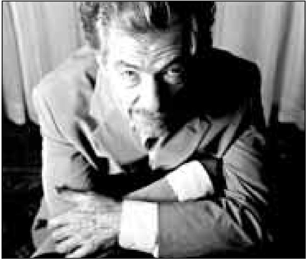
الممثل ايان ماكيلن في صورة التقطت له في نيويورك في الخريف الماضي

ويقول الممثل: «انني اجد نفس متجافا، كما احببت رضا خوري واذا بها تعرض، حظي ليس جميلا مع الممثلات، انما اشكر الله لان الممثلة شمال الاشرق عادت منذ فترة الى لبنان. هل تحلو الساحة من ممثلات شبيهات في امكاناتهن؟ الفرصة الحالية مختلفة، في الماضي اثبتوا قدرتهم من خلال شاشة واحدة وانتاج كثيف. تحقيق الشهرة الان اصعب صعبا نظرا لكثرة الممثلين والانتاج والمطبات ايضا. واذا غاب احدكم لفترة ينساها الجمهور. هل يؤدي هذا الامر الى احباط؟ بالعكس اسر بالممثلات الجدييات وبالانتاج الوفير واعتبره دليل عافية. في هذه الاجواء علينا ان نجاهد لاثبات ذاتنا لان في الساحة الكثير سوانا، كما علينا ان ننتقف وندرس باستمرار. ماذا تقولين عن مهنتك؟ انها مهنة صعبة للغاية حتى وان كنا على فراش المرض يفترض ان نذهب الى التصوير في الاسبوع الماضي تصلب عقبي بشكل لافت فعدلت الكتاب كميل سلامة في النص ليبدو مرضي من ضمن العمل وذلك في حلقة من مسلسل «نبال البيت»، في مهنة اخرى ينتهي الامر بتقرير طبي.