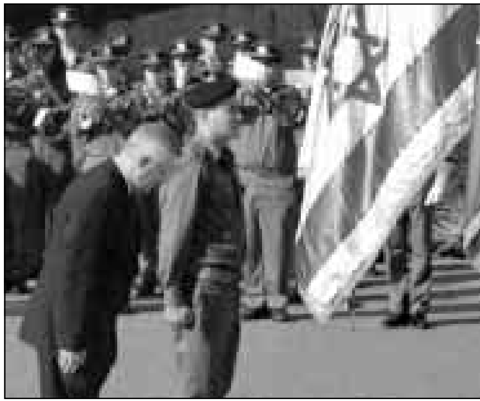
وزير الدفاع الكرواتي باهاو ميليفاتش يحيي أمام العلم الإسرائيلي أثناء زيارته تل ابيب أمس

القدس-رويترز: قال مصدر لوزارة الدفاع الاسرائيلية أمس الاثنين ان وزير الدفاع الاسرائيلي والكرواتي وقعوا صفقة تطور اسرائيل بموجبها مقاتلات كرواتية من طراز ميغ 21. واضاف المصدر الذي رفض ذكر اسمه لرويترز ان وزير الدفاع الاسرائيلي موشيه ارئيزر قد الصفقة خلال اجتماع مع نظيره الكرواتي باهاو ميليفاتش الذي يزور اسرائيل حاليا. وقال راديو اسرائيل ان صفقة تطوير المقاتلات قيمتها مئة مليون دولار، ورفضت وزارة الدفاع الاسرائيلية التعليق.