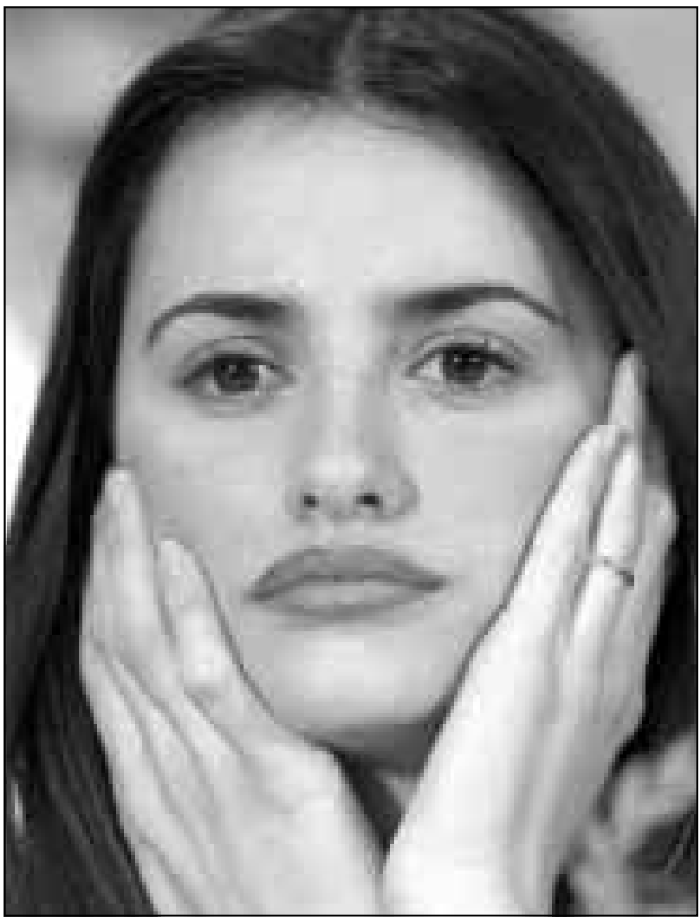
النجمة الاسبانية بيثالوب كروز عقدت مؤتمرا صحافيا في برلين خلال انعقاد مهرجان برلين السينمائي الدولي امس بعد عرض فيلمها خلال المهرجان وواحد الافلام المرشحة لجائزة الدب الذهبي.

البركان الذي يقع على المحيط الهادي على بعد نحو 690 كيلومترا من العاصمة مكسيكو سيتي العلماء عندما بدأ في قذف الحمم في تشرين الثاني (نوفمبر) بعد عقود من هدونه النسبي.