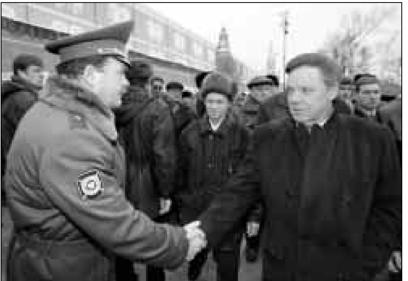
قائد الجيوش السوفييتية (سابقا) في افغانستان بوريس غريغوف (يمين) يصافح احرافه في الذكرى العاشرة لانسحاب من الحرب التي كلفت كثيرا

وطلب من مراكز الابحاث الايرانية «مواكبة التقدم في التكنولوجيا والعلومية».