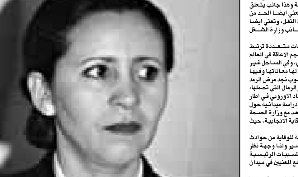
نزهة الشقروني (القدس العربي)