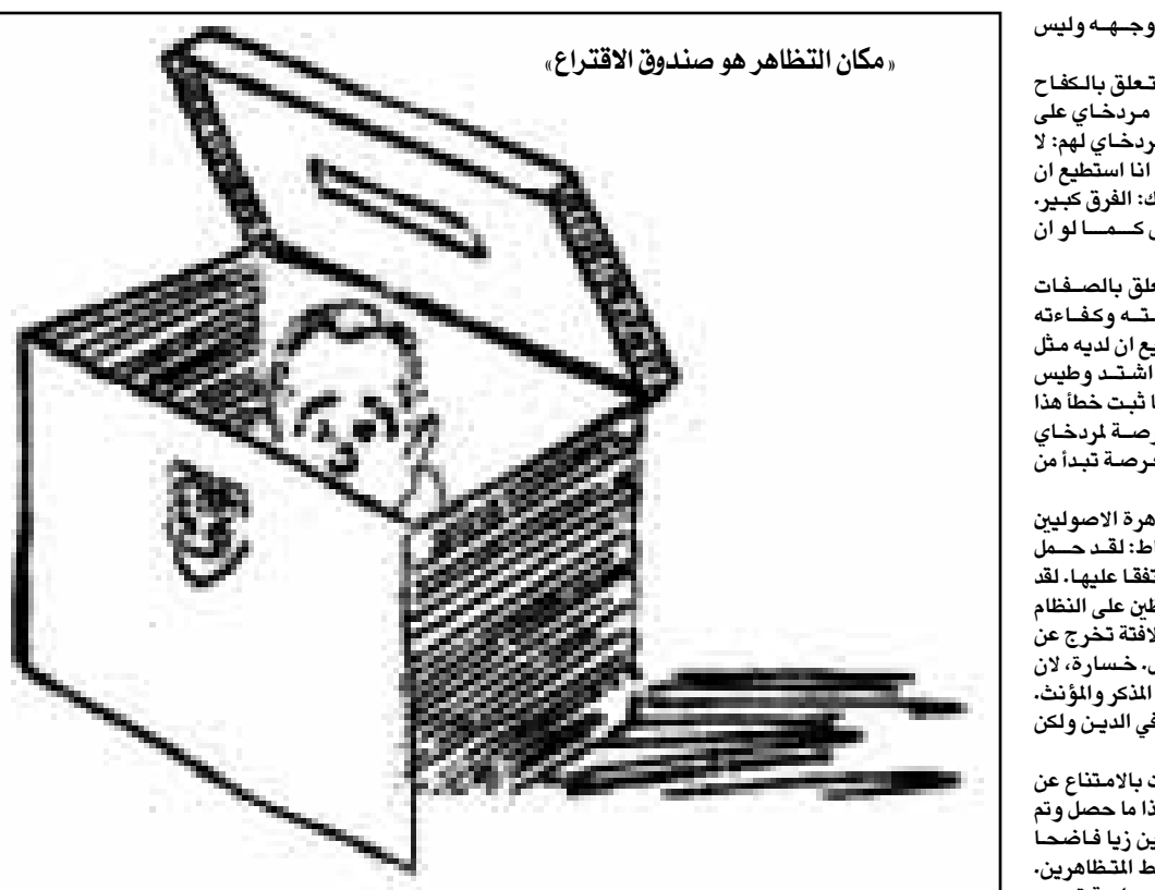
مكان التظاهر هو صندوق الاقتراع، (يديעות)

مظاهرة اصولية، الاغنية نفس الاغنية، غير ان الدولة ليست نفس الدولة ويطالب الاصوليون بدولة تستند في قوانينها الى الدين بدون محكمة عليا ومع تعليمات دينية تعلق على اقساؤون وضعي والعلمانيون يقولون انهم لن يسمحوا بتحويل