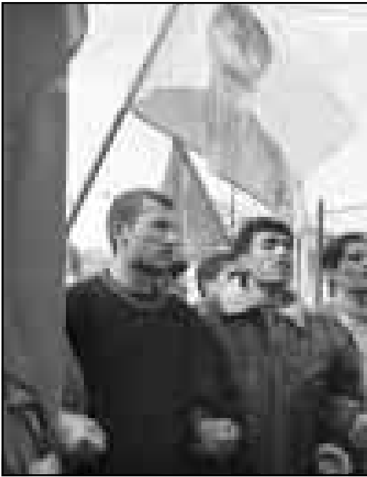
جانب من مظاهرة لمؤيدي حزب العمال الكروستاني في اثينا

وقال الاعلام التركي ان اوجلان موجود في روسيا فيما تنفي موسكو وجوده على اراضيها. وانتقد اوجلان اليونان وروسيا لعدم موافقتها على منحه اللجوء ودعا انصاره في ايطاليا الى مواصلة المساعي لتأمين «مطالبه الملحة بالامن والسكن». وفي اثينا قالت الشرطة اليونانية ان لاجئا كرويا نقل المستشفى مصابا بجروح بالغة بعد ان رش جسده بالبنزين واشعل فيه النار خلال تظاهرة جرت أمس الاثنين أمام مقر البرلمان اليوناني في اثينا تاييدا لرئيس المتمردين الكروا، وافاد المتحدث باسم المستشفى ان حياة المصاب «ليست في خطر». وقد حاول اثنان من المظاهرين اطفاء الحريق ونقل احدهما ايضا الى المستشفى اثر اصابته بصدمة عصبية. وقد اشعل المظاهر الذي لم يحدد عمره النار في ثيابه بعد ان رش عليها البنزين في وقت كانت الشرطة تسعى الى تفريق المظاهرين الذي قهر عددهم بنحو خمسين. وكان المظاهرون تجمعوا قبيل الظهر أمام احد مداخل البرلمان في وسط اثينا تاييدا لطلب اللجوء السياسي الذي قال اوجلان انه قدمه الى اليونان.