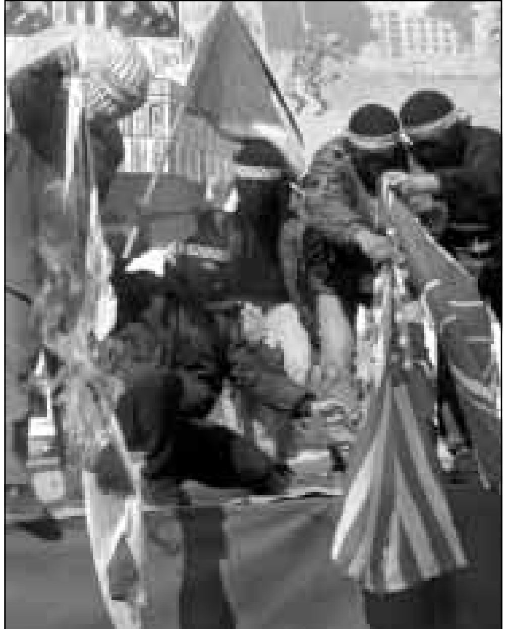
مليونون فلسطينيون يجرعون اعلام الاسرائيلية والأمريكية والبريطانية خلال التظاهرة التي جرت امس في جامعة النجاح الوطنية في نابلس

القدس - ق ب: صادقت الحكومة الاسرائيلية في نطاق سياسة «الاقتصاد الانتخابي» التي يتبعها رئيس الوزراء الاسرائيلي بنيامين نتنياهو على منح امتيازات اضافية لبعض القطاعات تزيد قيمتها عن 100 مليون شيكل. وذكرت مصادر وزارة المالية التي اعترضت مغلها على هذه الانفاسات الانتخابية «السخية» للحكومة ان القرار الذي صدق عليه الأحد يقضي بتحويل مبلغ 86 مليون شيكل لحساب قطاع الزراعة، من بينها 50 مليوناً ستنفق على شكل استثمارات حكومية اضافية في الزراعة، و36 مليون شيكل ستوزع كتعويضات للمزارع الاسرائيليين عن اضرار لحقت بهم في موسم عام 1998 الماضي. كما اقرت الحكومة صرف مبلغ يزيد عن 20 مليون شيكل