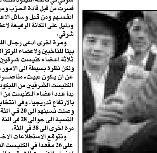
متظاهرون اصوليون امام المحكمة العليا

القرب بين الحاخام من فيزنتين وس، يهازم، ومن ناحية القيم المشتركة فان الفرق بين الفرنتسين والبلجيك بل القيم الفرنتسين والان هاشمي بالقياض الى الفرق بين اهارون باراك والحاخام لاو والذين هما كلامهما من اولئك الكارثة.