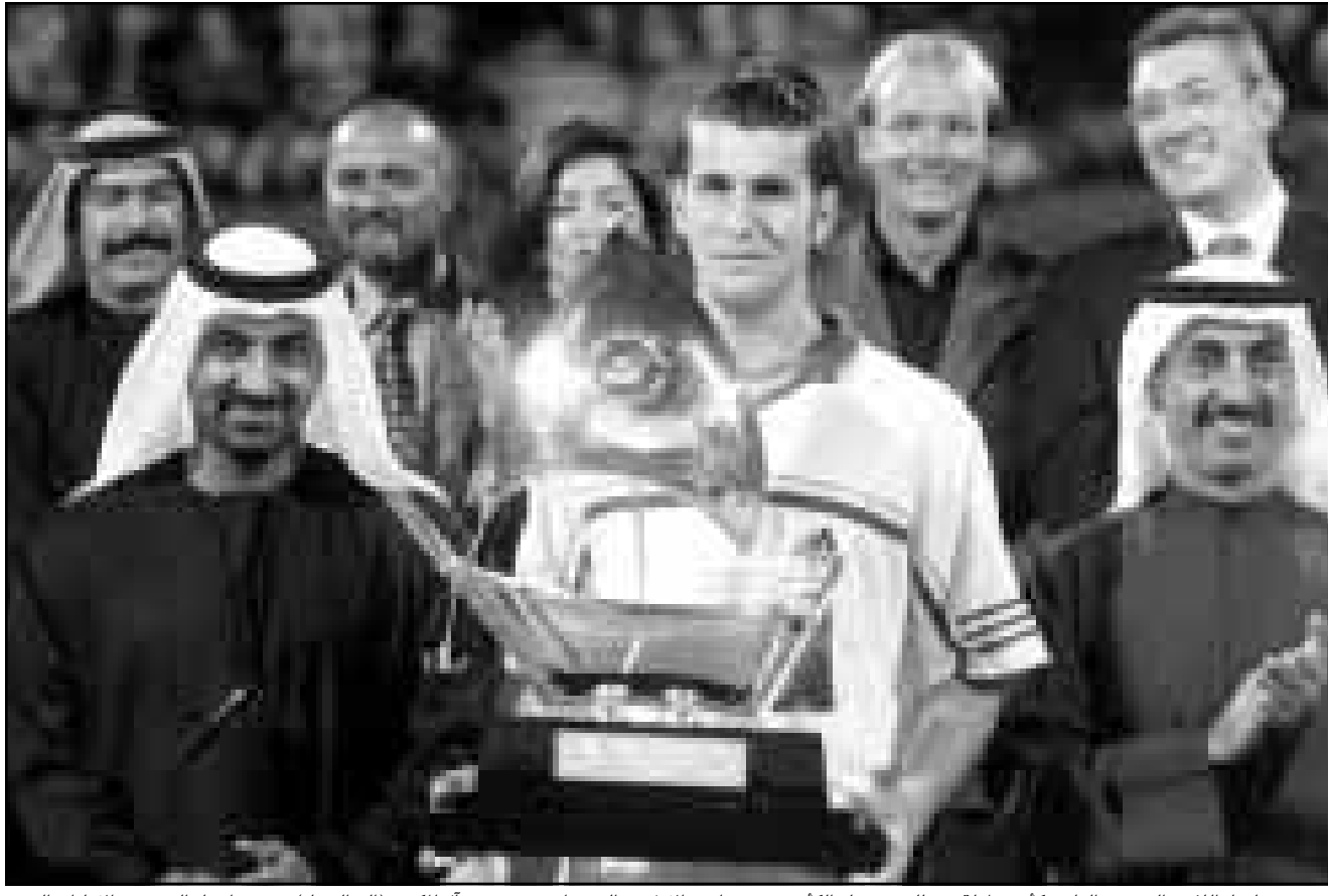
جيمور جولمار اللاعب الفرنسي الفائز بكأس بطولة دبي للتنس تسلّم الكأس في دبي أمس الأول من الشيخ أحمد بن سعيد آل مكتوم (إلى اليسار) ورئيس اتحاد التنس في الإمارات الشيخ حشر آل مكتوم (إلى اليمين).