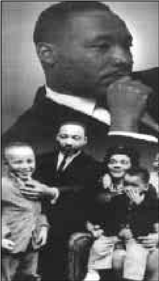
صورة لمارتن لوثر كينغ وعائلته