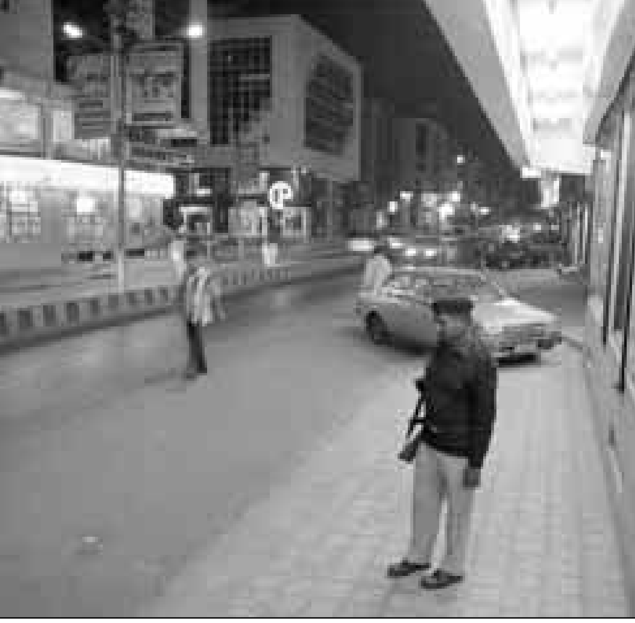
شرطي باكستاني في شارع ززمة بكراتشي الذي يخلو مبكرا بسبب اعمال العنف التي تشهدها باكستان بين الفينة والاخرى

واضاف الرئيس الاندونيسي بالقد اصرت الامريان تتسحب جميع القوات نحو الغرب وقال لي وارنتو ان ذلك امر جيد» وهي المرة الاولى التي تؤكد فيها تحركات القوات والعصيان المدني.