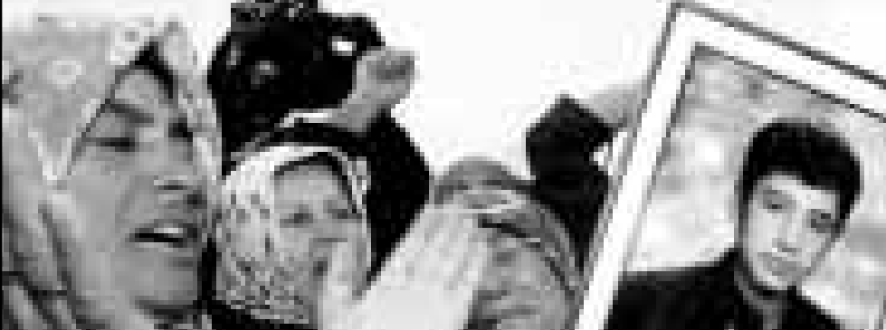
سيادات تركيات يرفعن صور ضحايا اعداء حزب العمال الكردستاني في تظاهرة لهم في انقرة أمس

بيروت - رويترز: نفت جماعة حزب الله المدعومة من ايران التي احتجز رهينة في بيروت قبل 14 عاماً، وقالت الجماعة في بيان ان مزاعم خطفها اندرسون عارية عن الصحة. واضافت ان وصف حزب الله بأنه تنظيم ارهابي هو تضليل، واقام اندرسون الاثنين دعوى مطالب فيها ايران بتعويض قدره 100 مليون دولار متما اياها برعاية عملية خطفه في عام 1985. وجاء في الدعوى ان خاطفيه هم حزب الله الذي اتهمته حكومات غربية باحتجاز رهائن اجانب خلال الحرب الاهلية التي استمرت بين عامي 1975 و1991 في لبنان. وتتهم الدعوى ايران ووزارة المعلومات والامن الايرانية وتطالب بتعويض قدره 100 مليون دولار بالاضافة الى غرامة لم تحدد. واحتجز اندرسون لفترة اطول من أي رهينة امريكي اخر وظل معصوب العينين مكبل بالاسلح معظم فترة احتجازه الى ان اطلق سراحه في كانون الاول (ديسمبر) عام 1991.