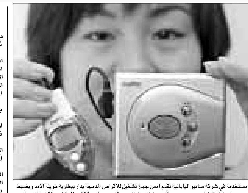
مستخدمة في شركة سانوي اليابانية تقدم امس جهاز تشغيل للاقراص المدمجة يدار ببطارية طويلة الامد ويضبط مسار طريق التشغيل عن بعد، وسيبدأ تسويق الجهاز الجديد في سباسب 2000 دولار الشهر المقبل (اق ب)

الرباط - رويترز: قالت ادارة الاحصاءات الحكومية ان من المتوقع ان ينمو الناتج المحلي الاجمالي للمغرب بنسبة ثلاثة في المئة هذا العام مقارنة مع 6,3 في المئة العام الماضي. واضافت الادارة في احدث نشراتها أمس الأربعاء انه استنادا الى متوسط الانتاج الزراعي هذا العام فان الناتج المحلي الاجمالي للمغرب من المتوقع ان ينمو بمعدل ثلاثة في المئة. ويشغل القطاع الزراعي نحو 20 في المئة من الناتج المحلي الاجمالي ويعمل به نحو نصف قوة العمل في البلاد البالغ قوامها عشرة ملايين عامل. وأشارت تقديرات الى ان الناتج المحلي الاجمالي للمغرب بلغ 37,3 مليار دولار في عام 1998. وقالت الادارة التي وضعت توقعاتها استنادا الى ارقام اولية ان معدل البطالة من المتوقع ان ينخفض الى 2,5 في المئة في نهاية عام 1999 من 2,7 في المئة في نهاية 1998. واضافت ان مؤشر أسعار المستهلكين تراجع بنسبة 0,8 في المئة في كانون الثاني (يناير) و0,2 في المئة في شباط (فبراير). وتوقعت ايضا ان تهبط نسبة العجز التجاري الى 28 في المئة من 31,1 في المئة وان يبلغ نسبة عجز ميزان المعاملات الجارية واحدا في المئة من الناتج المحلي الاجمالي بلا تغير تقريبا من عام 1998.