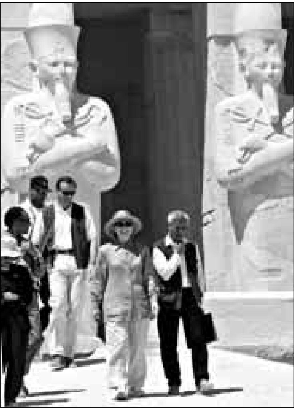
السيدة الامريكية الاولى اثناء زيارتها لعبد حشيشبورت في الاقصر امس