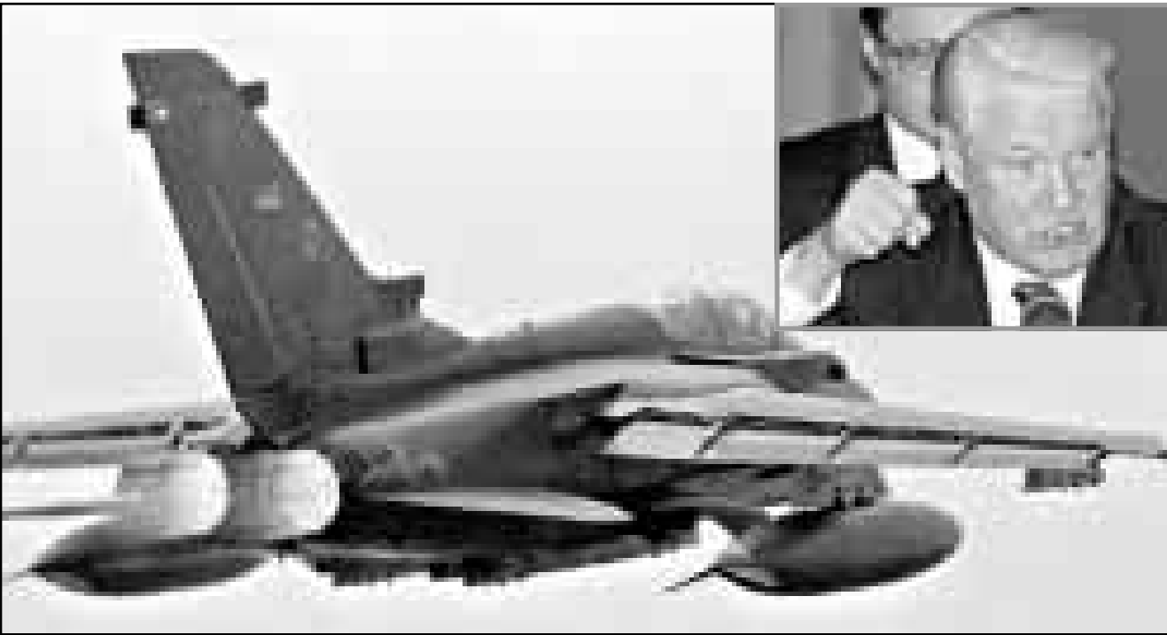
طائرة بريطانية من طراز تورنادو تطلع من قاعدة لحلف الاطلسي في ايطاليا للمشاركة في الغارات ضد الصرب