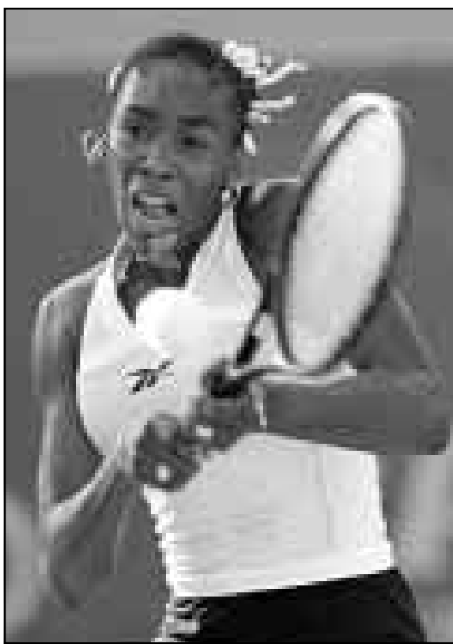
فيونوس وليامز

و جاء كلام الدشني خلال مؤتمر صحفي عقدته الاتحاد العربي للفروسية في دمشق على هامش دورة الوفاء الدولية الخامسة التي ترافقت مع اقامة ثلاث دورات