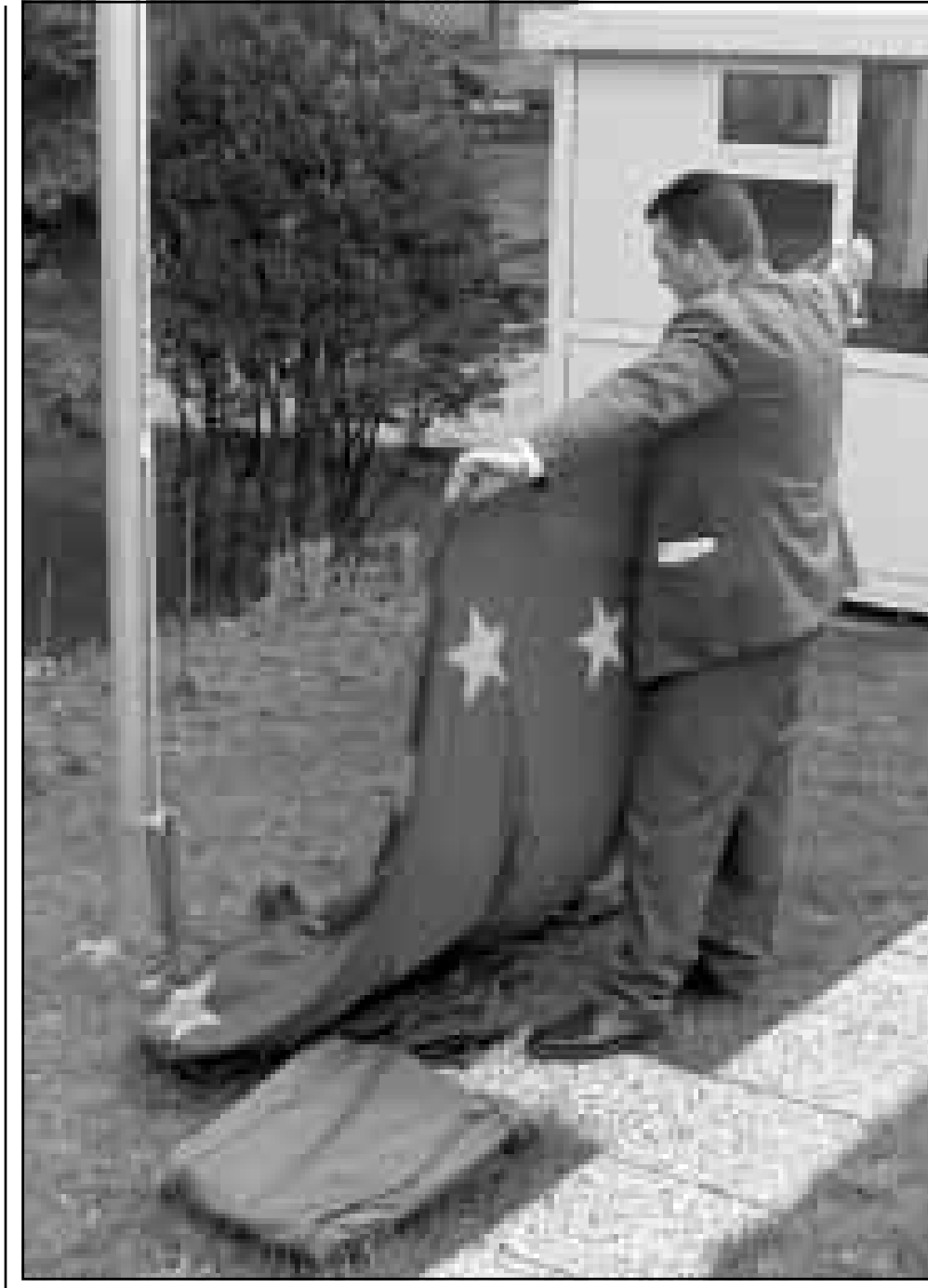
موظف بالسفارة النمساوية في بلغراد في آخر لحظات قبل مغادرتها نحو بلاده

■ موسكو - اف ب: استنكرت روسيا امس القصف الجوي الذي مارسته طائرات حلف شمال الاطلسي على اهداف صربية في يوغوسلافيا. وكان وزير الخارجية الروسي ايجور ايفانوف صرح امس الاربعاء ان العاملين في السفارة الروسية في بلغراد لن يتم اجلاؤهم وسيعملون حسب نظامهم العادي، حسبما ذكرت وكالة «ايتار تاس». ونقلت الوكالة عن المتحدث باسم الوزارة فلاديمير رحمانين «نظرا لخطورة الوضع في يوغوسلافيا والوضع النفسي للموظفين الدبلوماسيين (...) تقرر اجلاء الامهات واطفالهن امس الاربعاء من بلغراد الى بودابست». واضاف ان «العاملين الاخرين في السفارة وزوجاتهم سواصلن العمل في العاصمة اليوغوسلافية». كما دعا ايفانوف بلغراد الى «ضبط النفس» ازاء الانفصاليين الالبان في كوسوفو الذين «يتسبون» بالمعارك من اجل اعطاء حلف شمال الاطلسي حججا للقيام بتدخل عسكري. وقال ايفانوف في مقابلة مع «ان تي في» محطة التلفزيون الروسية الخاصة «ليس مستغربا الا ان الارهابيين والانفصاليين في كوسوفو يتسبون بالاشتباكات لاعطاء الحلف الاطلسي ذريعة للضرب بحجة السعي الى تجنب كارثة انسانية». واضاف ايفانوف ان على سلطات بلغراد «التحلي بضبط النفس» واتخاذ تدابير لا يمكن ترجمتها بانها عدوان على سكان كوسوفو. واضاف «اذا قررت بلغراد على الفور توقيع الوثائق السياسية فان من شأن ذلك المساهمة في ازالة التوتر» مضيفا ان النقطة الثانية المهمة اليوم هي «الوقف الفوري للعنف في كوسوفو».