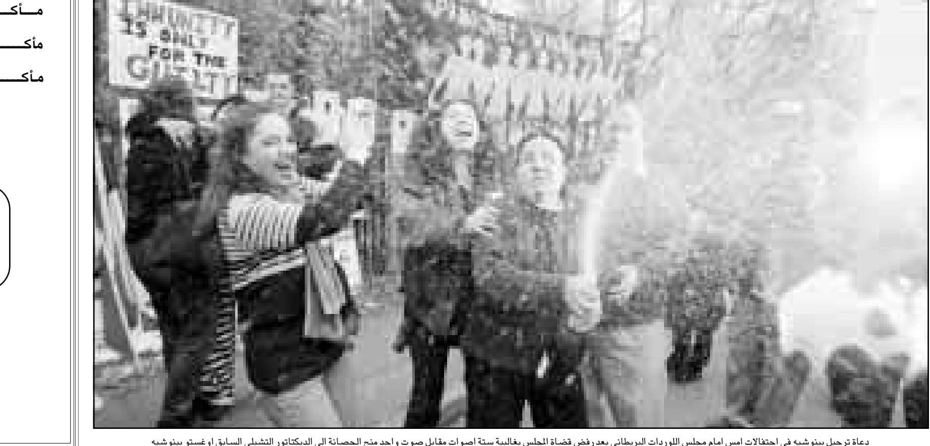
دعاة تحيل بنوشيه في احتفالات امس امام مجلس اللوردات البريطاني بعد رفض قضاة المجلس بغالبية ستة اصوات منح الحصانة الى الدكتاتور التشيلي السابق أوغستو بينوشيه

برلين - اف ب: اعلن المستشار الألماني غيرهارد شرودر ان رئيس مجلس الوزراء الايطالي السابق رومانو برودي عين امس الأربعاء في برلين رئيساً مقبلاً للمفوضية الأوروبية بدلا من رئيسها الحالي جاك سانتير (لوكسمبورغ). وقال شرودر ان برودي «رجل يتمتع بخبرة كبيرة تتناسب تماما مع التطلعات الأوروبية، لا سيما بفضل «التزامه المؤيد لاصلاحات». واضاف ان «البرلمان الاوروبي سيختب هذا التعيين على الارجح خلال الدورة التي يعقدها في ابريل، بين 12 و 16 من الشهر المذكور». واعتبر المستشار الألماني من جهة اخرى ان هناك «فرصة كبيرة في التوصل الى اتفاق على اصلاح تمويل