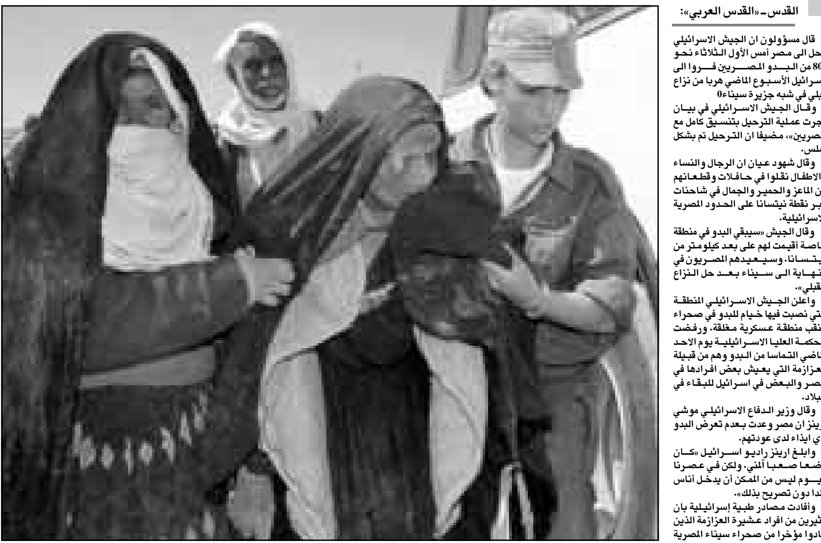
مجندة اسرائيلية ترافق مجموعة من البدو المصريين الى الحالة التي اقلتهم الى مصر امس الاول

الغربية، وبعد أن دمرت السلطات الاسرائيلية 418 قرية فلسطينية تدميرا تاما ومسحتها عن وجه الارض مع قيام الدولة اليهودية. فبعد حرب عام 1948 اطلق الاسرائيليون النار على الفلاحين الذين عادوا لقطف شمار قراهم، وطردت آلاف الاسرائيلية 4 آلاف شخص من عشيرة العزازمة في الثاني من ايلول (سبتمبر) عام 1950، ونفذت السلطات الاسرائيلية عملية طرد جماعي أخرى بعد تسعة ايام فقط، في 11 ايلول (سبتمبر) عام 1950، لتفقد تقارير الخارجية الاسرائيلية المصادر في الخمسينيات، بان كل ابيي طردت 17 ألف بدوي الى سيناء والفضة