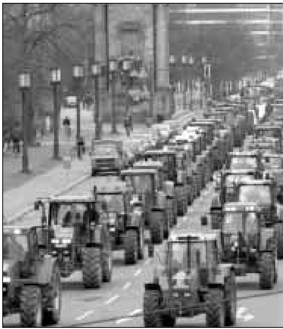
جانب من مئات الجرار التي شارك اصحابها باحتجاج على السياسة الزراعية للاتحاد الاوروبي نظم أمس في برلين حيث بدأ رؤساء دوله فتمتعه

شحن بالطائرة الى كافة انحاء العالم خدمة سريعة ممتازة - اسعار رخيصة - تسهيلات في الدفع - تخليص شهادات المنشأ وتغليف البضائع وربطها بالاحزمة القوية انجاز جميع المعاملات الرسمية. خابروا لنقل بضاعتكم من منازلكم هاتف: 071-3735017 - 071-3731034 فاكس: 071-3701760