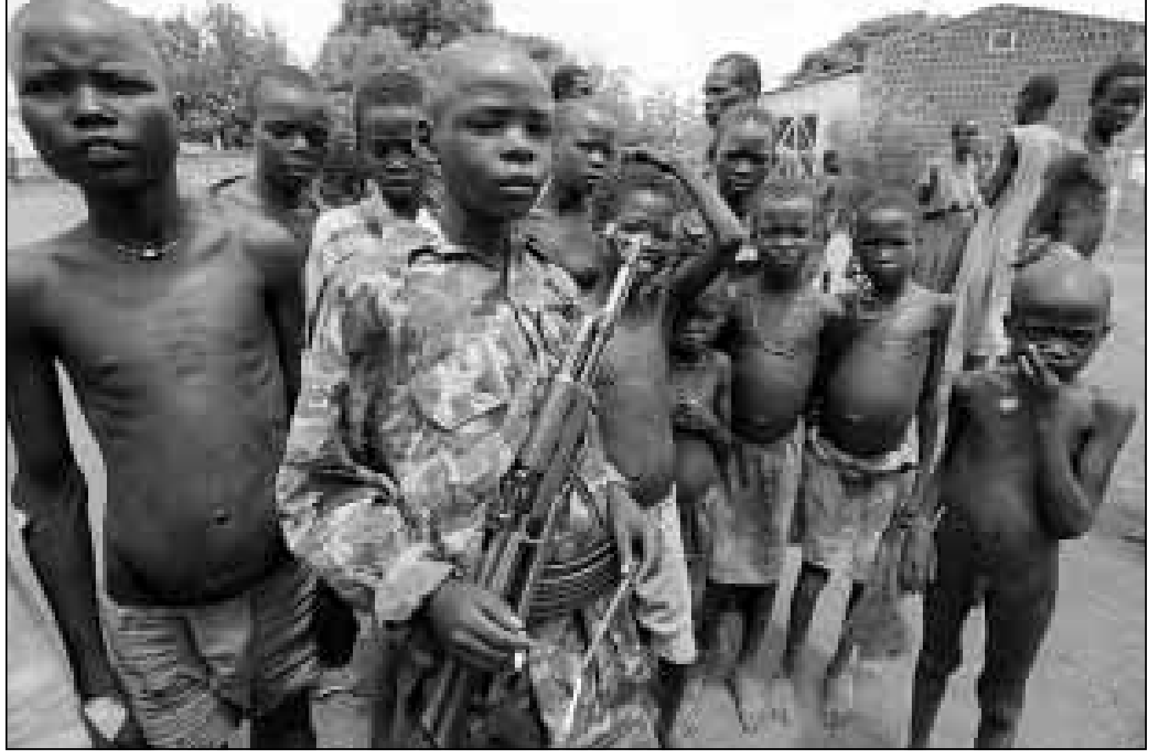
المقاتل سودانيون ضمن قوات التمرديين في الجنوب