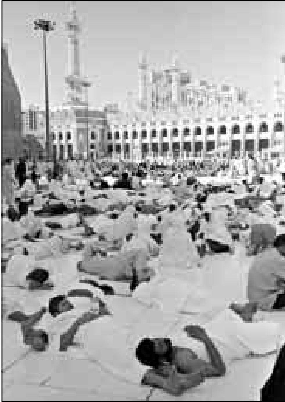
حجاج بيت الله الحرام اثناء استراحة في الحرم المكي الشريف