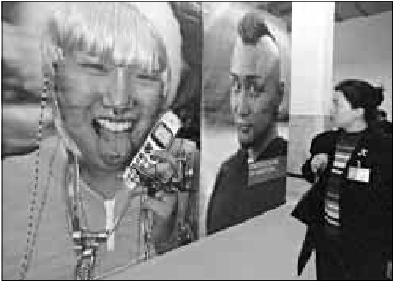
صور جدارية لشباب آسيا وقد تأثر بمعطيات الغرب الحديثة اثار انتباه هذه الفتاة الصينية عندما طالعتهما في معرض اقيم في العاصمة بكين