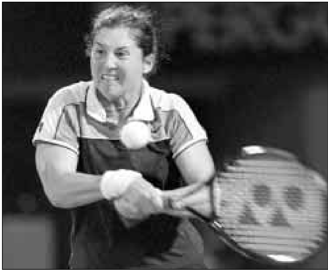
مونيك سيلي