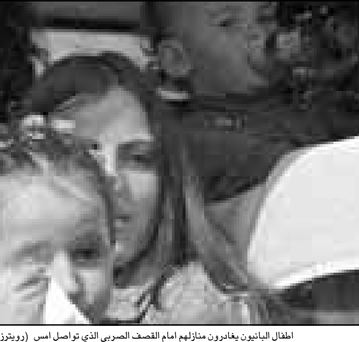
اطفال البانينون يغانرون منازلهم امام القصف الصربي الذي تواصل امس

وقال فلاديمير لوشين في بيان له امس، ان روسيا ستدعم اجراءات الحلف ضد الصرب في يوغوسلافيا، لكنه حذر من توسيع نطاق العمليات العسكرية الى مناطق اخرى في يوغوسلافيا. وقال فلاديمير لوشين في بيان له امس، ان روسيا ستدعم اجراءات الحلف ضد الصرب في يوغوسلافيا، لكنه حذر من توسيع نطاق العمليات العسكرية الى مناطق اخرى في يوغوسلافيا.