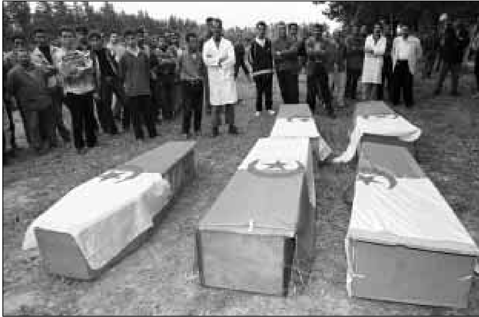
جزائريون يشيعون ضحايا المنحة التي وقعت ليل الثلاثاء الأربعاء ببلدة عمروسة قرب البلدية

الانتخابية داعية كل المرشحين الى منافسة سياسية سليمة، وحثت المرشحين السبعة على تقادي استعمال اللغات الاجنبية او تقديم برنامج غير البرنامج الذي تم ايداعه لدى مصالح الوزارة، التي جانبت عدم خرق الترتيبات القانونية في مجال التجمعات والنظارات. ومُنع على المرشحين استعمال