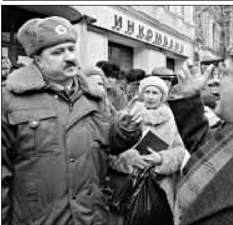
مستثمرون في مصرف انيكوم بنك الروسي المنهار خلال مظاهرة امام مقره في موسكو أمس طالبوا خلالها باستعادة اموالهم