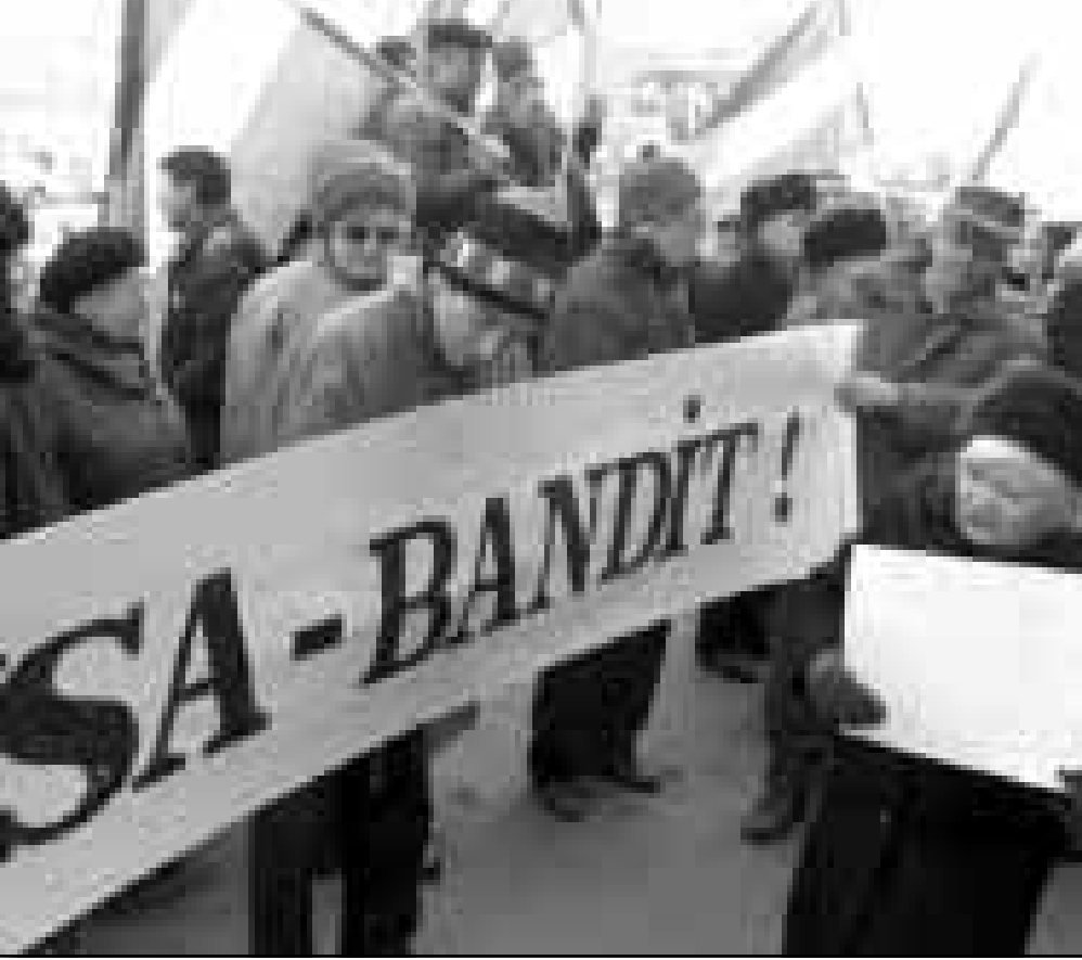
مواطنون روس تطهروا امس شوارع موسكو احتجاجاً على المواقف الغربية المتشددة ازاء بلغراد