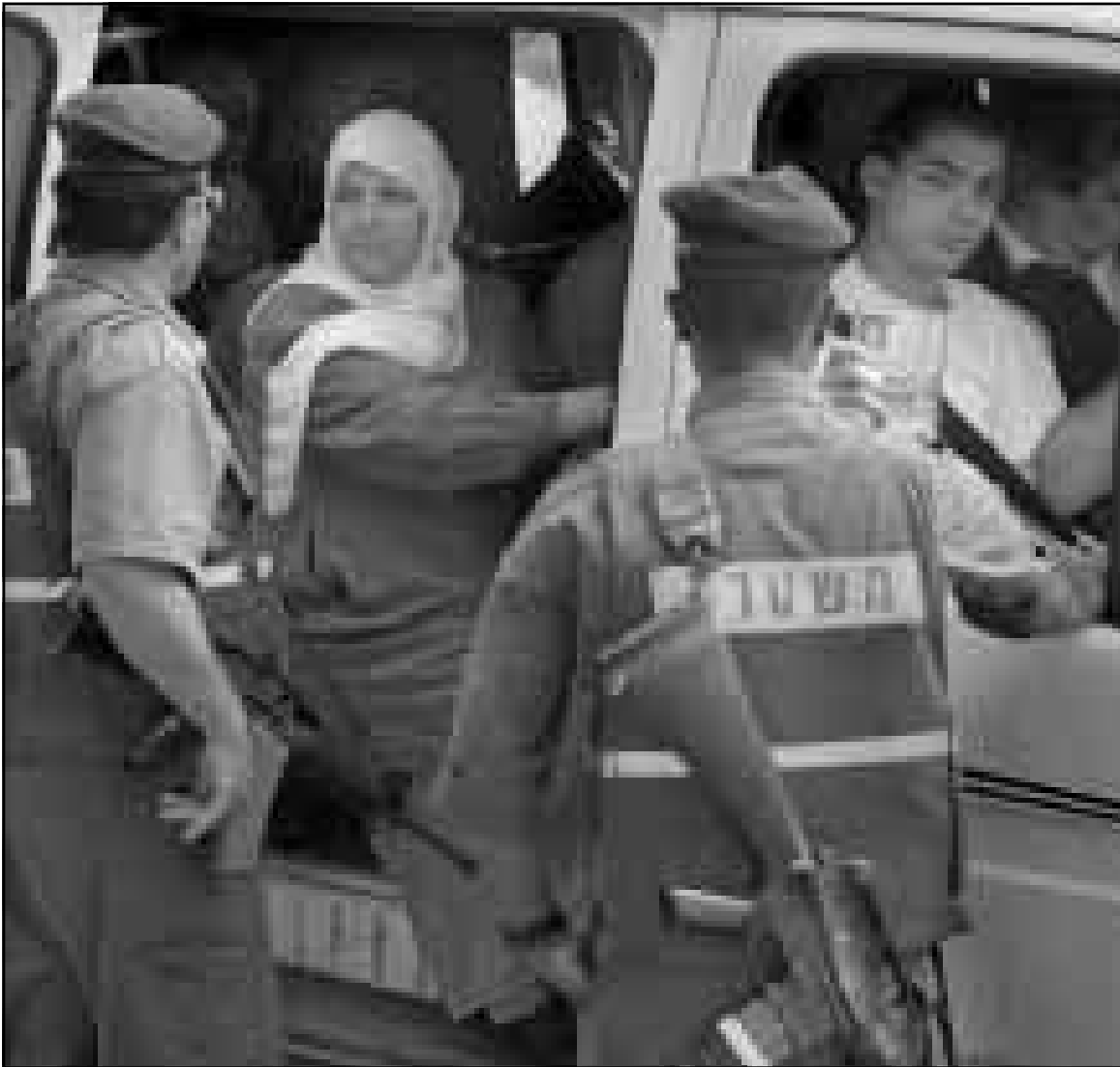
جنود اسرائيليين يبدقون في هويات فلسطينيين عند نقطة تفتيش في القدس

القدس - غزة - اف ب - ق. ب: وقف الاسرائيليون أمس الثلاثاء دقيقتي صمت ودوت صفارات الانذار في ذكرى عشرين الف جندي قتلوا في حروبها ضد الدول العربية.