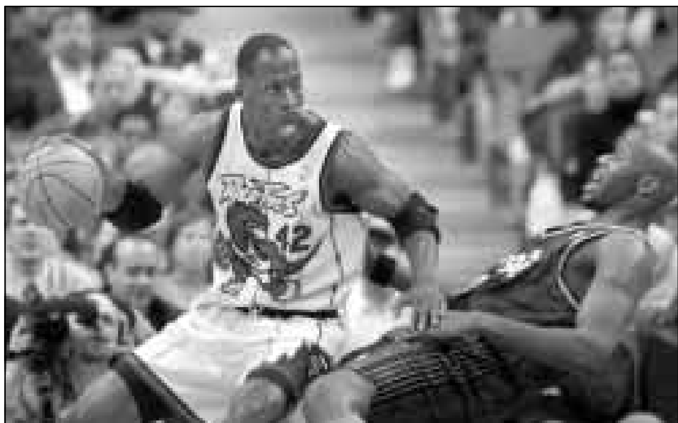
كليفين ويليس لاعب تورونتو رابترز يتغدى بالكرة في المباراة مع فريق اورلاندو ماجيكتس.

كليفلاند كافاليرز - ميامي هيت 94/87 نيوجيرزي نتس - تشارلوت هورنتس 120/113 بوسطن سلتيكس - انديانا بيسرز 120/104 هيوستن روكيتس - سونيكتس 113/120 لوس انجليس كليبرز - ستايت ووريزر