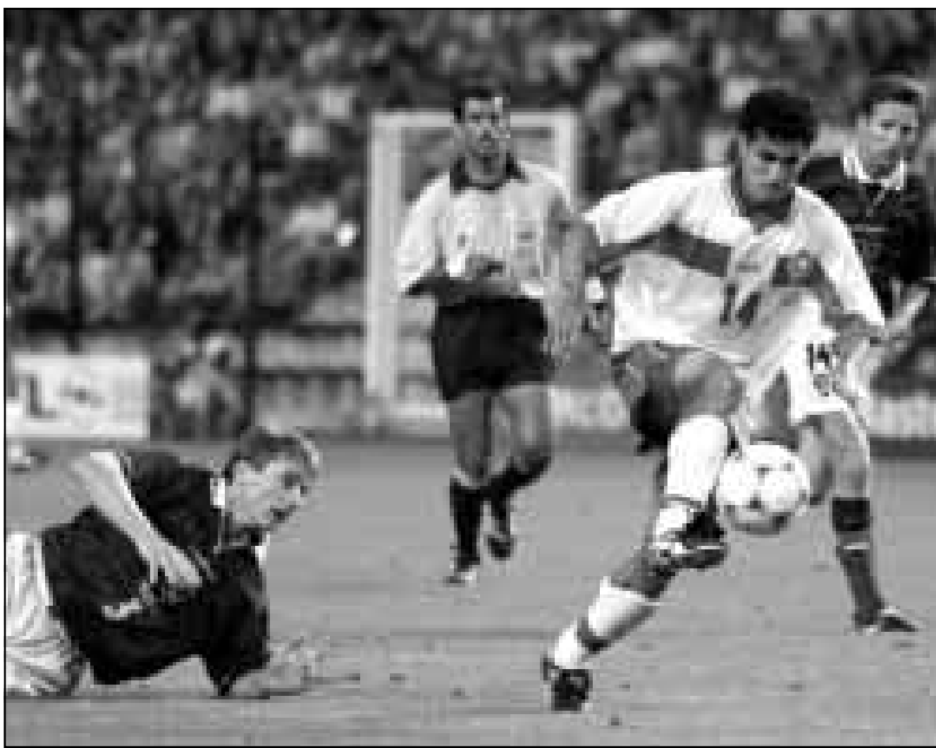
صورة من الاشراف ل مباراة كرة قدم بين منتخبين المغرب واسكتلندا

■ جوهانسبرغ - من مارك جليسون: قال مسؤولون أمس الاربعاء ان جنوب افريقيا ستوجه الدعوة للدول الافريقية الاربع الاخرى التي تسعى لاستضافة نهائيات كأس العالم لكرة القدم لعام 2006 للاجتماع في جوهانسبرغ ومناقشة امكانية تقديم عرض موحد.