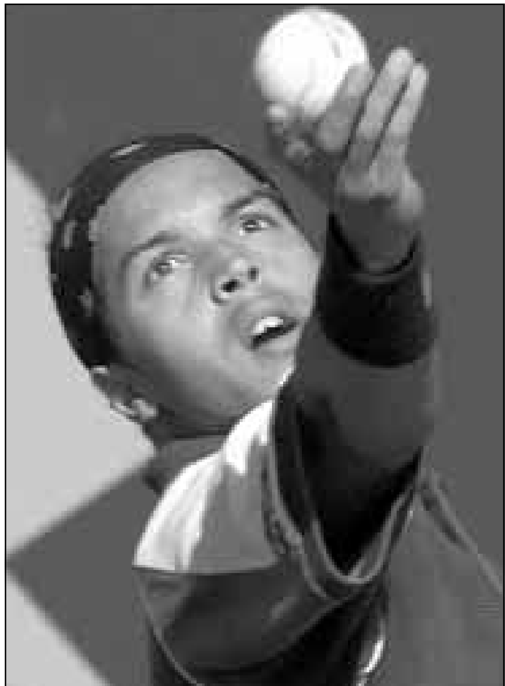
البطل المغربي هشام ارازي.