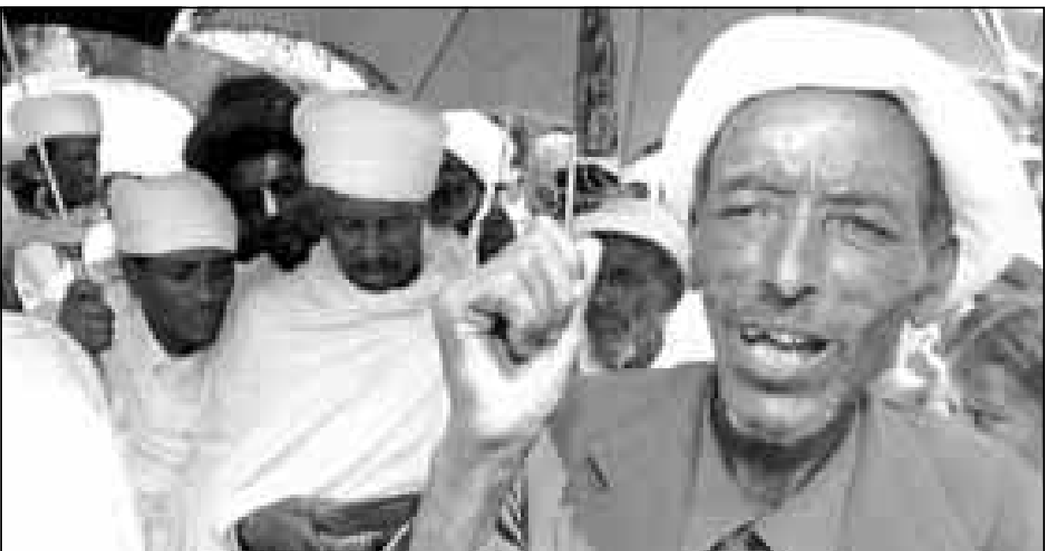
مجموعة من يهود الغلاشا يتظاهرون احتجاجا على العنصرية ضد