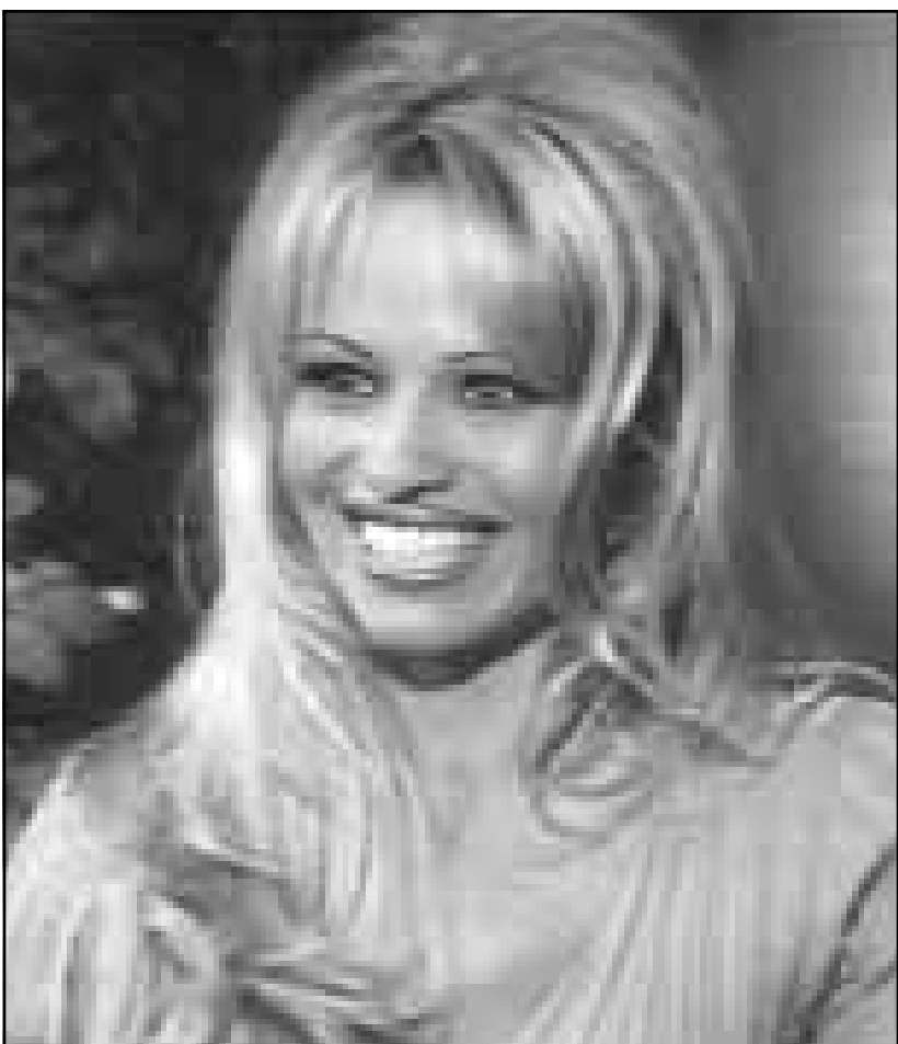
النجمة الأمريكية بامبلا أندرسون ظهرت في البرنامج الدولي «انترنايمينت تونايت» وسلت عن جراحة اجرتها اخیرا في صدرها