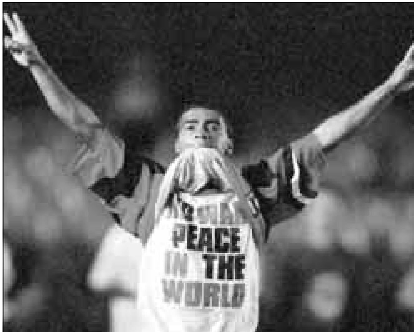
دورمايو لاعب الكرة البرازيلي الشهير يشارك في الحملة من أجل السلام في العالم قميص (تي شيرت) يطالب بوقف الحرب.