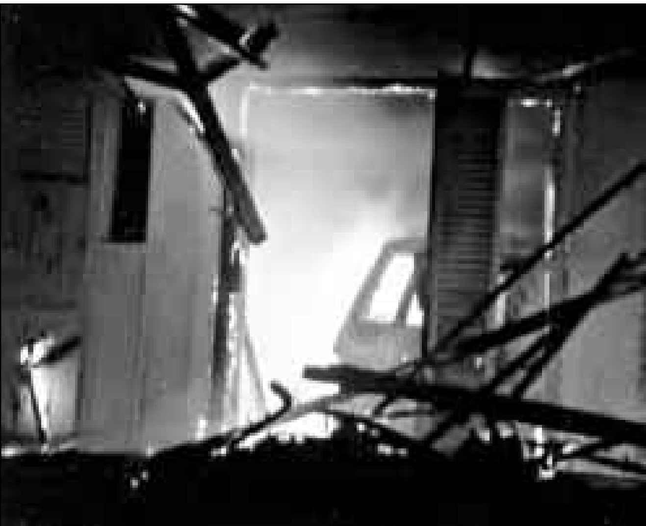
النيران مشتعلة داخل الكنيسة في اندونيسيا التي تعاني من تزايد في اعمال العنف الطائفية