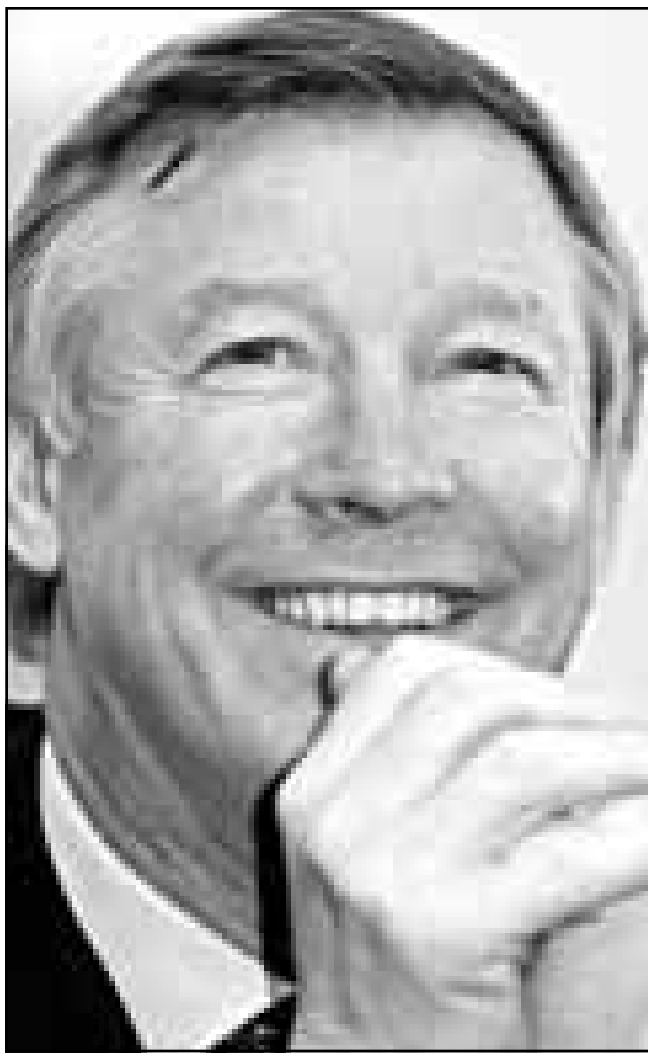
الان فيرغسون مدير نادي مانشستر يونايتد عقد مؤتمر صحافيا قبل المباراة مع يوفنتوس قبل نهائي الكأس الأوروبية.