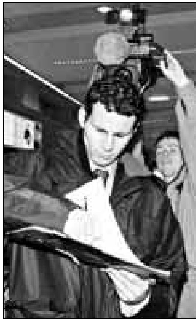
رايان غيغز لاعب مانشستر يونايتد يوقع اوتو غراف احد مشجعي الفريق.