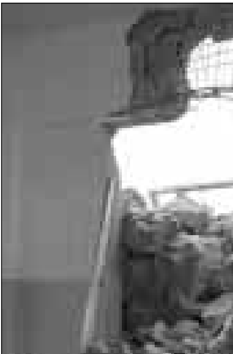
ملاب لبنانيون يتلقون تعليمهم في فصل دراسي دمرت قذيفة اسرائيلية جزءا منه