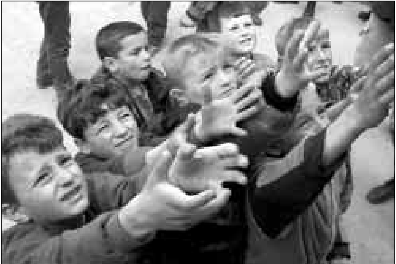
اطفال من لاجئي كوسوفو يمدون أياديهم على أمل الحصول على أرغفة الخبز في مخيم كوكيس في البانيا

الدفاع الدني المحلية قوله ان منازل في الشوارع قرب محطة قطارات «كريفني كرس» لحقت بها اضرار شديدة.