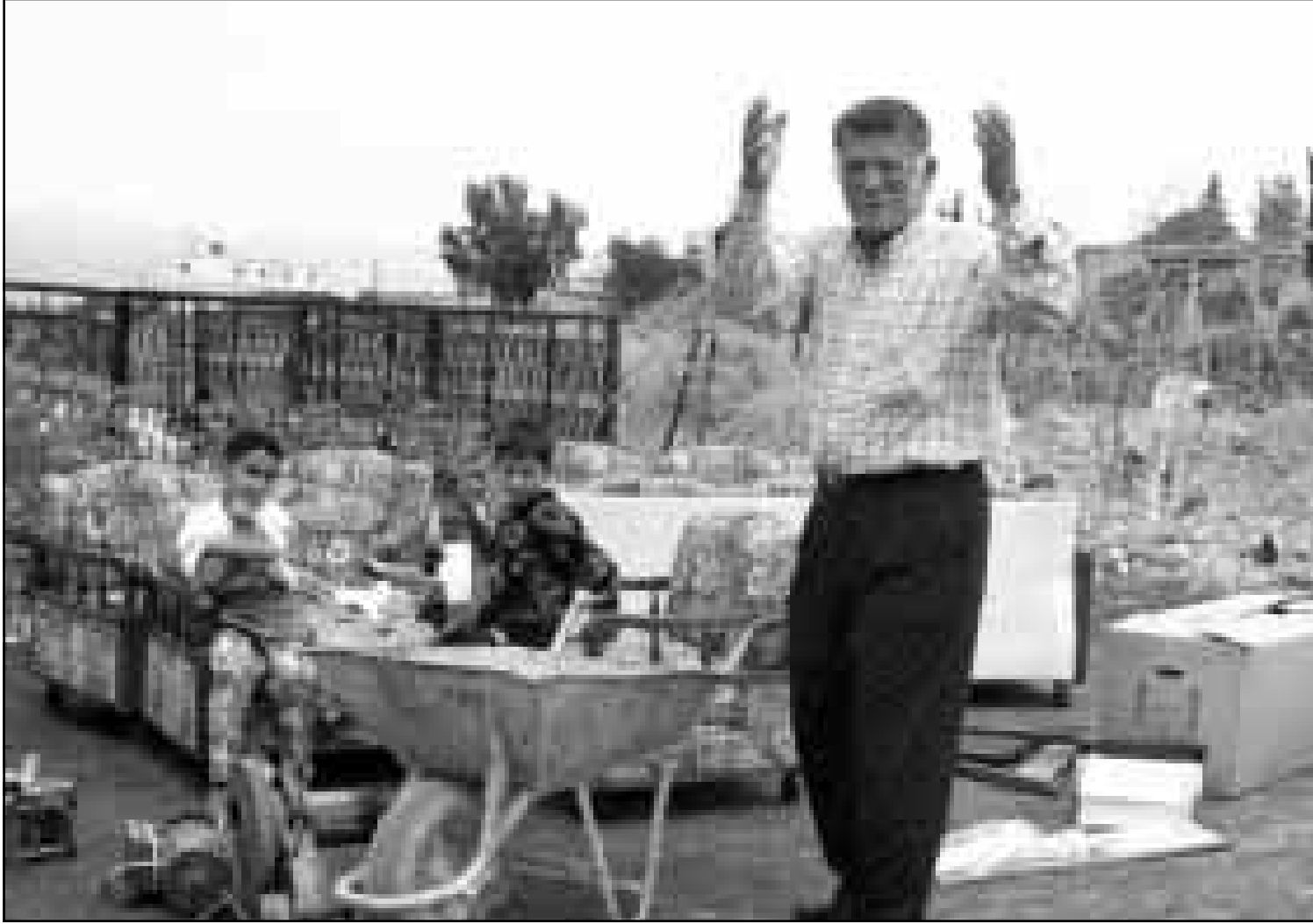
مواطن لبناني ومطلبه يظنونه خارج منزلهم استعداداً للرحيل عن بلدة ارنون

لتصريحات ممثل لبنان في اللجنة الذي اكد ان بلاده مستعدة لاتخاذ تدابير اضافية من اجل تحسين الوضع ميدانيا، ولا تلك اللجنة سوى صلاحية تسجيل وإدانة انتهاكات محتملة لتدابير 1996 التي تنص على عدم التعرض للمدنيين من جانبي الحدود الاسرائيلية.. اللبنانية، وعلى عدم القيام بهجمات ضد المناطق المأهولة أو انطلاقاً منها.