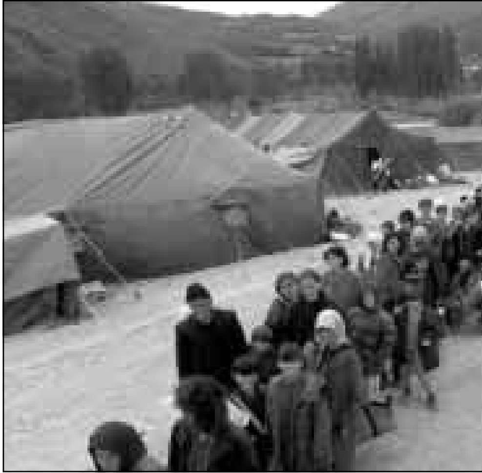
لاجئون البان يصطفون لركوب حافلات في مخيم على الحدود بين يوغسلافيا ومقدونيا

■ لندن-رويترز: قال التلفزيون الالبياني انه تم اكتشاف عدد من المقابر الجماعية في اقليم كوسوفو الصربي تحوي جثث ضحايا القوات الصربية ومعظمهم من صغار السن. وقالت التلفزيون في بث التقطته هيئة الاذاعة البريطانية «بي بي سي» ان ثوار جيش تحرير كوسوفو عثروا على اكثر من 50 جثة لابان قتلوا في الاسابيع الماضية. ومازال 34 منهم غير معروف في الهوية ولم يدفون بعد بسبب وجود عدد كبير من القوات الصربية في المناطق التي عثر عليهم فيها. وكان اصغر الضحايا طفلاً عمره 12 عاماً قتل على طريق في قرية ريزالي وكان اكبر الضحايا عمره 76 عاماً. وقال التلفزيون انه عثر ايضا على جثث فيها 100 جثة في ريزالي. وفي تقرير منفصل قال التلفزيون ان الشرطة الصربية دفنت 70 جثة في جبانة قرية زوست يوم الاحد.