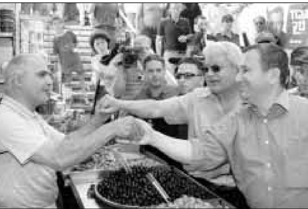
تل ابيب - من داني غور ايه: