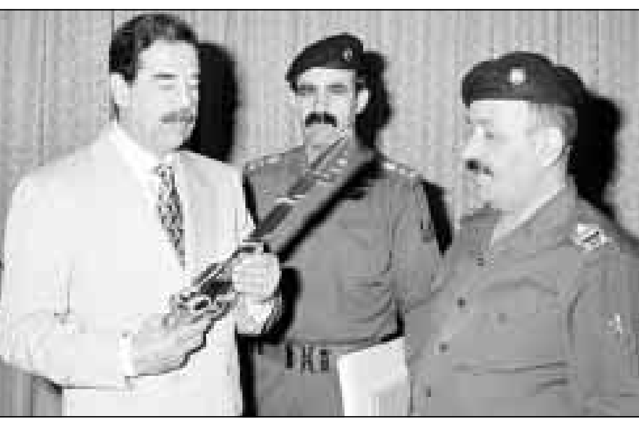
الرئيس العراقي صدام حسين يتسلم مفتاح مدينة «صدامية الثرثار» من نائبه طه ياسين رمضان

المركزية الأمريكية (سي ايه) بتدريب 300 ضابط عسكري عراقي سابق على استخدام الاسلحة المتقدمة لتدابيات وعلى الشيفرات والاتصالات، وسيقوم هؤلاء بتدريب الف آخرين، وسيقوم هؤلاء الفنيون بالتسلل برا وبحرا وجوا (داخل العراق) وسيتمنون على قاعدة جوية لاستخدامها مركز استخبارات للجو العراقيين، وسيقدم الامريكيون غطاء جوي، وفي وقت قريب سيستولون حكومة مؤتة، وقال مسؤول امريكي كبير