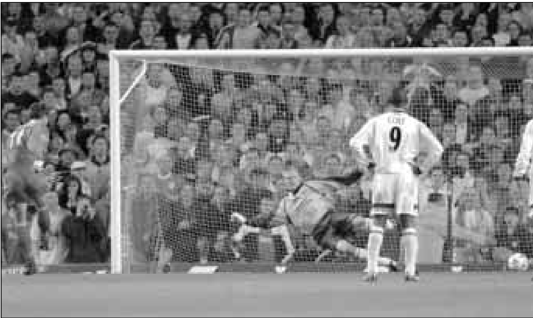
بيتر شميك حارس مرمى مانشستر يونايتد (في الوسط) فشل في حماية مرماه من قذيفة لاعب ليفربول 'جيمي ريدناب' من خط الجزاء