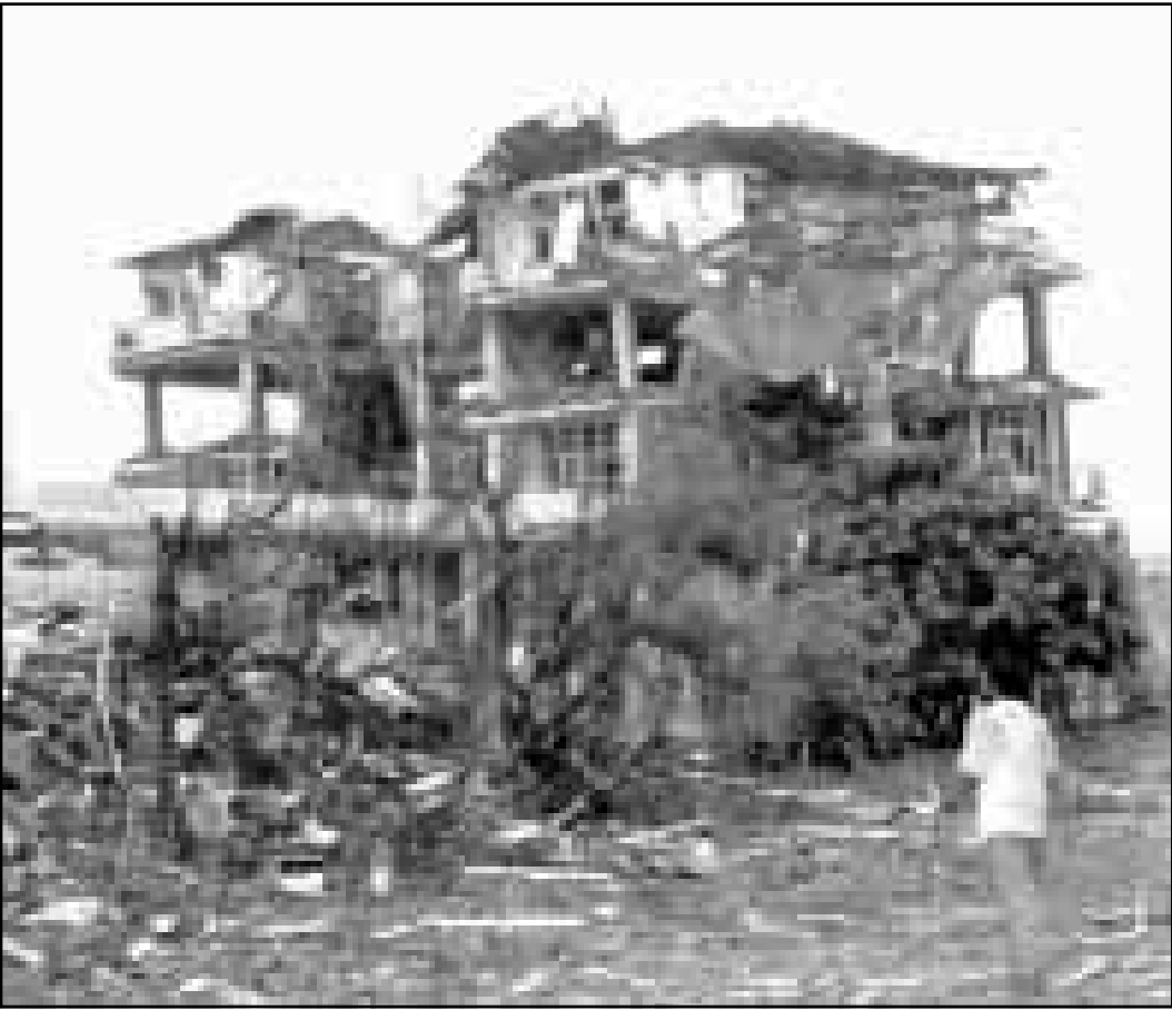
صورة من الارشيف لانقاص مصنع الشفاء