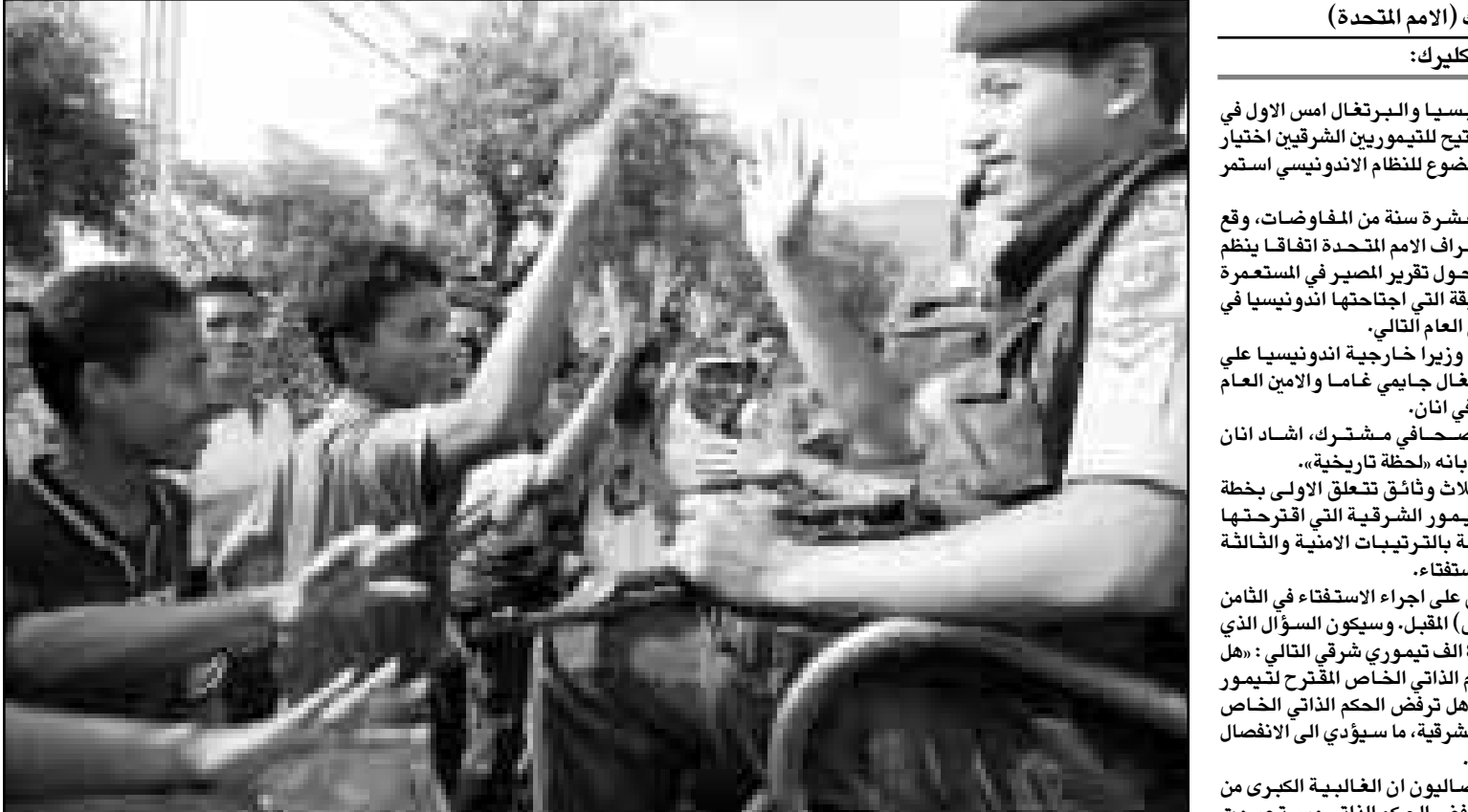
طلب من تيمور الشرقية يتبادلون النهائي مع رجال الشرطة الاندونيسيين بعد التوقيع على الاتفاق في الامم المتحدة

لأحة مطالب الامنية ومنها الاشراف اللغوري على الميليشيات، على ان ترفع بشكل مذكره الى لثبونة وجاكرتا. ودعا اثنان جميع الاطراف الى الامتناع عن القيام باي اعمال عنف والى التعاون التام مع الامم المتحدة التي لا تستطيع ان توصل عملية السلام الى نهايتها الا في مناخ من الهدوء والامتناع، كما قال. وبالإضافة الى الـ 300 شرطي، ستضم بعثة الامم المتحدة 900 موظف مدني تقريبا من المقرر ان تصل قطعهم يوم الاثنين في تيمور الشرقية. ونص الاتفاق على ان تكلف بعثة الامم المتحدة تنظيم الاستفتاء الذي سيكون «مباشرا وسريا واما». وطالبت استراليا امس الخميس بانهاء قرار