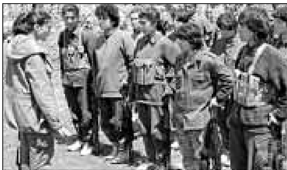
مقاتلات ومقاتون اكراد مصممون على الاستمرار في مقاتلة الحكومة التركية

والمقبض على زعيم حزب العمال الكردستاني عبد الله اوجلان في الخامس عشر من شباط (فبراير) في نهر يوبي ونقلت الى تركيا حيث يحتفظ في جزيرة ايرالي في بحر مرمره واستبدت محاكمته في 31 من الشهر الجاري.