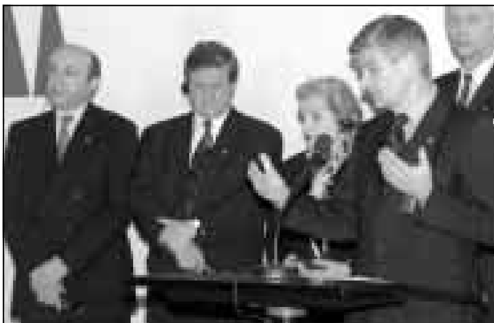
وزير الخارجية الألماني يوشكا فيشر خلال المؤتمر الصحفي الذي عقده في بون أمس

■ بون-اف ب: فيما يلي النص الذي اعتمده وزراء خارجية مجموعة الثماني في بون أمس الخميس: «ان المبادئ العامة التالية يجب ان تعتمد وتطبق لحل أزمة كوسوفو: - وقت فوري يمكن التحقق منه لاعداد العنف والقمع في كوسوفو. - انسحاب القوات العسكرية والشرطة والقوات شبه النظامية من كوسوفو. - نشر وجود دولي مدني فعال تدعمه وتقره الامم المتحدة، قادر على ضمان التوصل الى الاهداف المشتركة. - قيام ادارة انتقالية في كوسوفو يقرها مجلس الامن