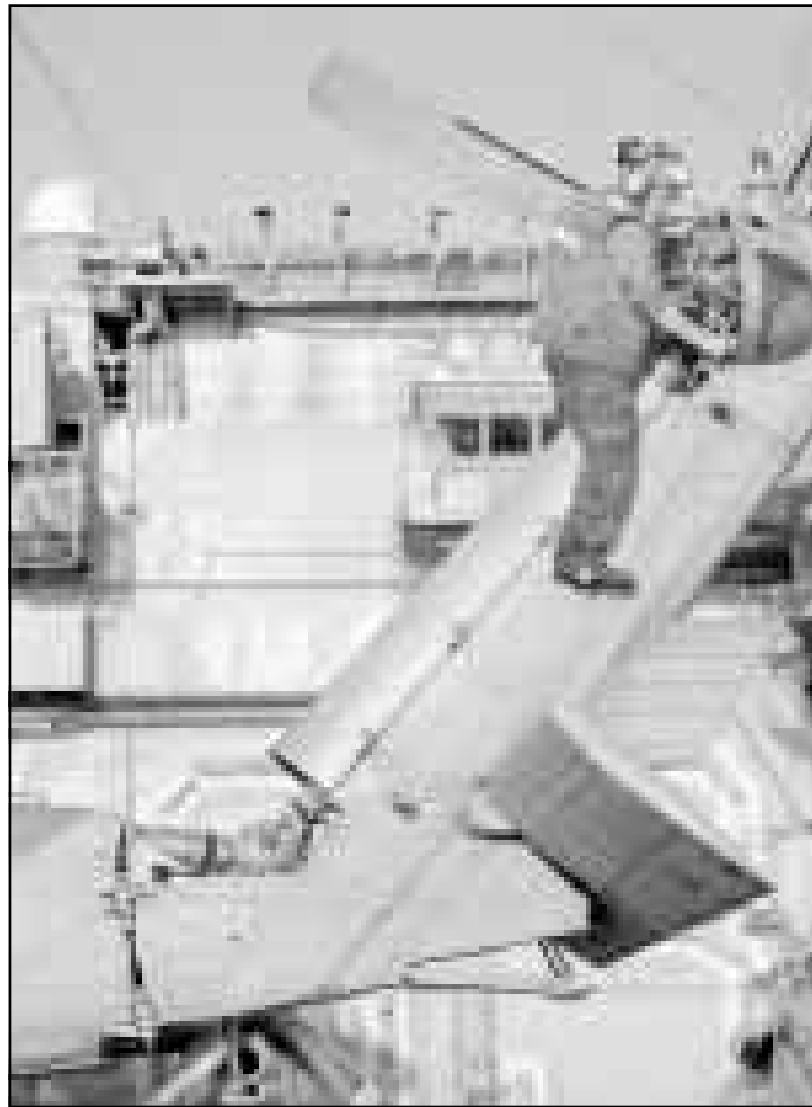
مهندس يقوم بخصص وميانه نيل ملارة ميلوكويت من طراز (سي هوك) المضادة للعواصات العاملة على سطح حاملة الطائرات الأمريكية كيتي هوك

الكويت - من لوك فيليبس: قال محللون لوكالة فرانس برس اس الخمسين ان حل مجلس الامة الكويتي ادى الى تحسين صورة النواب الذين كانوا اعضاء فيه واغربوا عن اعتقادهم بان معظمهم سيتخون مجددا في الانتخابات التشريعية المبكرة المقبلة. وقال المحلل السياسي شلآن العيسى «ان حل المجلس اخرج الحكومة بحسن صورة النواب الذين اصبحوا ابطالا». وتوقع العيسى ان تستمر الازمة السياسية في الكويت بعد انتخاب مجلس امة جديد في الثالث من تموز (يوليو) المقبل. وقد حل امير الكويت الشيخ جابر الاحمد الصباح مساء الثلاثاء الماضي مجلس الامة بحجة عدم تعاون النواب مع الحكومة. واكد العيسى «ان معظم النواب سيعاد انتخبهم بفضل شعبيتهم والازمة ستواصل». وتابع قائلا انه «اذا مرتت الحكومة قوانين لزيادة شعبيتها» خلال الفترة التي تسبق الانتخابات بمبتغان ان تشهد تغييرات محدودة». وقال احمد بشارة مسؤول الحركة الوطنية الديموقراطية وهي تجمع جديد يامل في الفوز ببعض القاعد في مجلس الامة المقبل انه يتوقع ان تكون المعركة الانتخابية مستحمة لكن من دون تغييرات كبيرة خصوصا في عدد النواب الاسلاميين. يشار الى ان الاسلاميين فازوا في انتخابات تشرين الاول (اكتوبر) الماضية بـ16 مقعدا من 50 مقابل 30 مقعدا للنواب المؤيديين للحكومة واربعه فقط للميريين. واضاف بشارة «اننا لا نتوقع تغييرات جذرية وحل المجلس وورقة قوية في ايدي النواب الحاليين». وفي حين بدأ نواب مجلس الامة المنحل بمغادرة مكاتبهم بدأت تقريبا خيم عبر البلاد يتوقع ان تستخدم كمكانات في الحملة