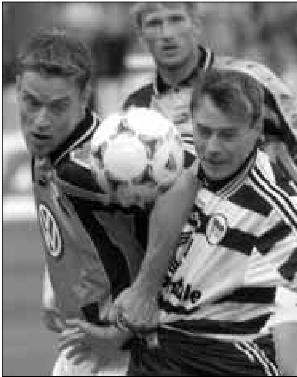
لقطة مثيرة من مباراة 'ميرانابرين' ولفسبرغ في الدوري الالمانى

وتوريتشيلي وكويس (اوليفيرا) واورزو وروي كوستا - باتيستوتا وادموندو.