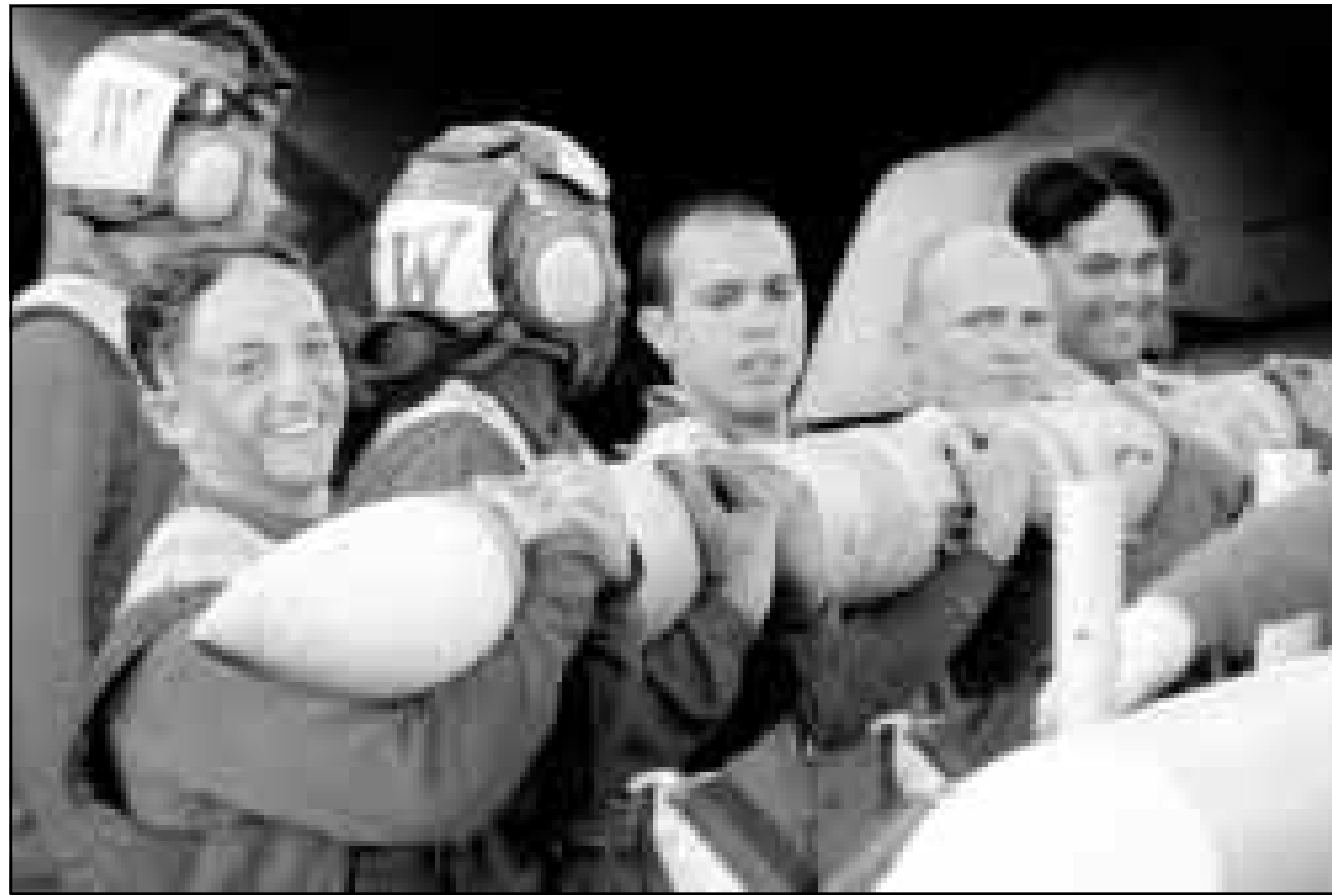
بحارة من حاملة الطائرات الأمريكية كيتي هوك يحملون صاروخ جو جو متوسط المدى من طراز (إيم 7) في صورة تذكارية

متقلق. فإذا شعر أن السبيل الوحيد لوقف حملة جوية مستمرة ضده هو السماح لمقتني الأسلحة بالعودة إلى العراق أو وقف مهاجمته لطائرات الحلفاء في مناطق الخطر الجوي فمن المؤكد أنه سيرضخ لذلك، والعالم الرئيسي هو اقتاعه بان الولايات المتحدة وحلفاءها جابون في وقت قهقهم. وقال الكاتبان في مقالهما أن حكومة الرئيس الأمريكي بيل كلينتون وحلفاءها لم يخشوا على أية حال مواجهة الرئيس صدام حسين بهذه العظيمة، والان بدلا من انتزاح الرئيس لنش غارات جوية مستمرة لحماية المصالح القومية الأمريكية في الخليج العربي فإن الولايات المتحدة شنت مثل هذه الغارات للدفاع عن أهداف إنسانية في البلقان مع توفر فرصة ضئيلة للتلاج.