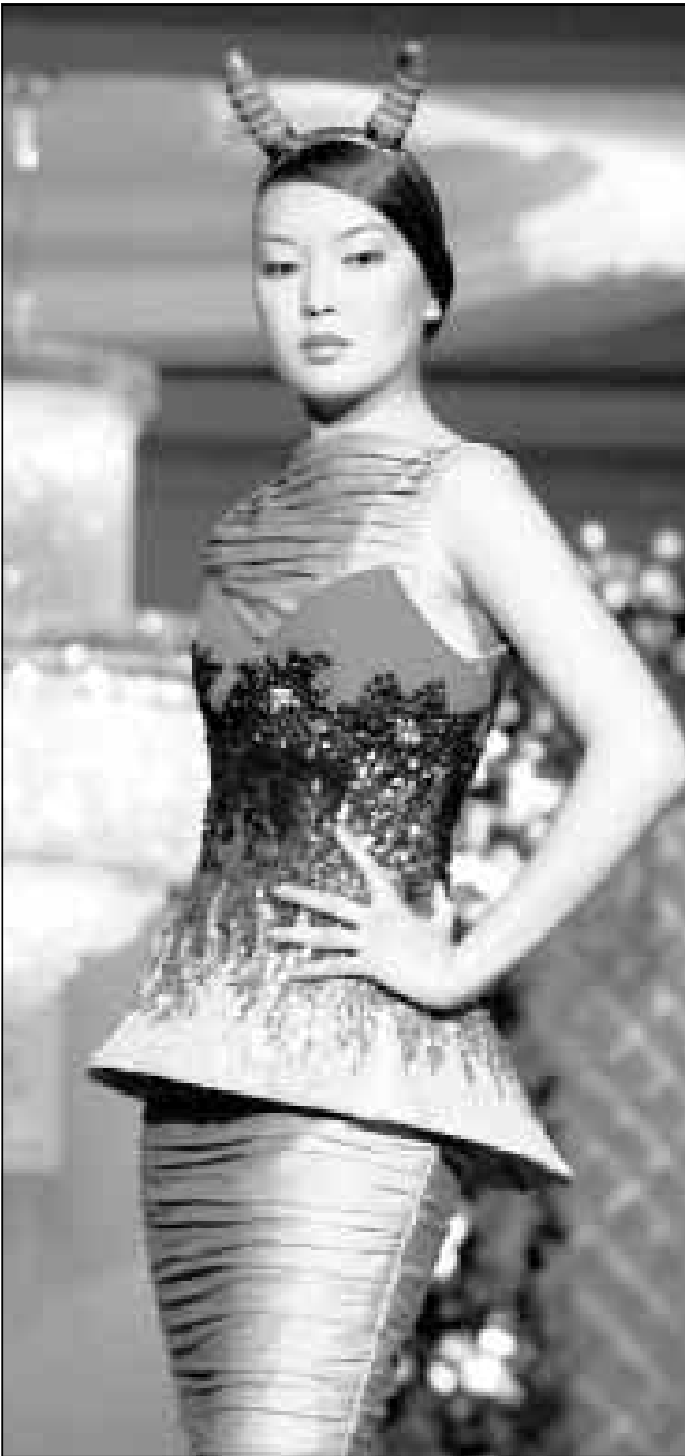
تصميم مبتكر قدمه مصمم الازياء الكازاخستاني، اوراي نوركايفيا في عرض اقيم امس الاول في العاصمة المانبا

ونجحت وزارة الصحة الصينية في تسجيل العديد من الادوية العشبية في دولة الامارات ليتم تداولها وتوزيعها على المرض. ويؤكد الدكتور جاو ان مركز الرحمة يعترم القيام بفحص المرض في الامارات من خلال الاستشارة عن بعد مع اخصائي الاعشاب المعروفين في الصين ويعمل في هذا المركز اخصائي الاعشاب مشهور في الصين خبرته في هذا المجال تزيد عن 40 عاما كما يقول ان انه متخصص في الاستشارات باستخدام المواد العشبية والمعالجة بالاعشاب ويقول «تتمنى ان ننقل خبرتنا الى اصديقاتنا في الخليج والعالم العربي من اجل الرعاية الصحية». وعن فاعلية العلاج العشبي يقول متسائلا: هل سمعتم عن شخص توفي لتناوله ادوية مستخرجة من الاعشاب؟