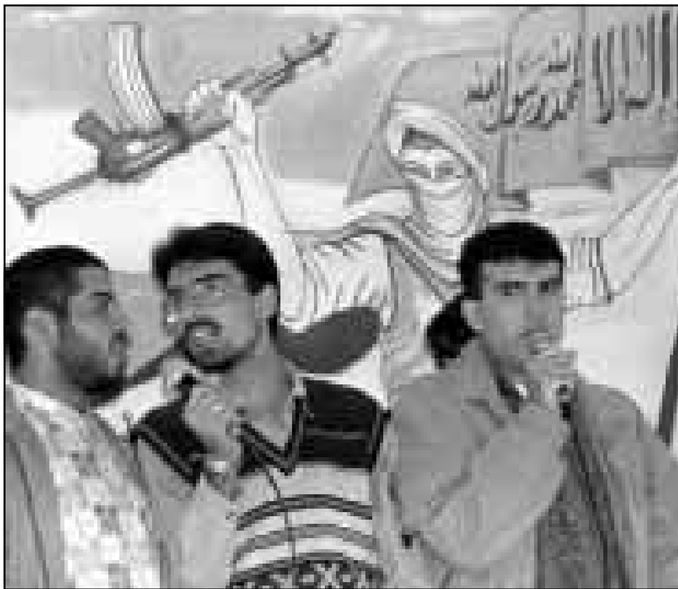
شباب حماس اثناء احد المظاهرات الحركية