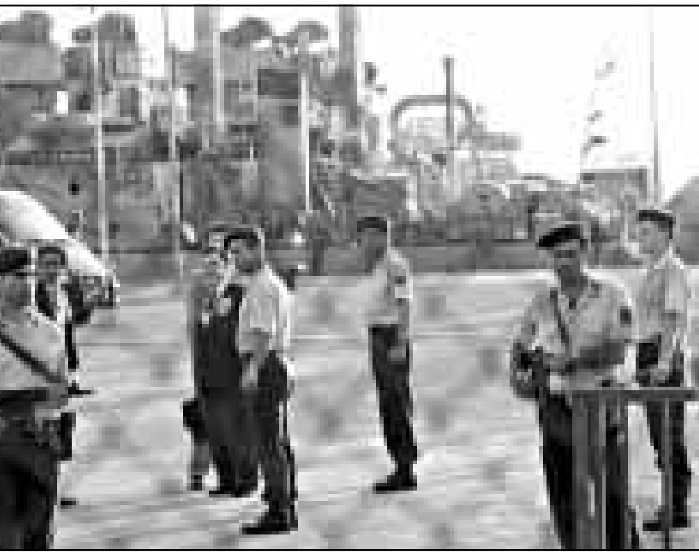
قوات امن تركية ترافق مناطق قريبة من موقع محاكمة اوجلان

وجردت قاوقجي في وقت لاحق من جنسيتها التركية وتحقق السلطات البرلمانية معها تمهيدا لفصلها من البرلمان.