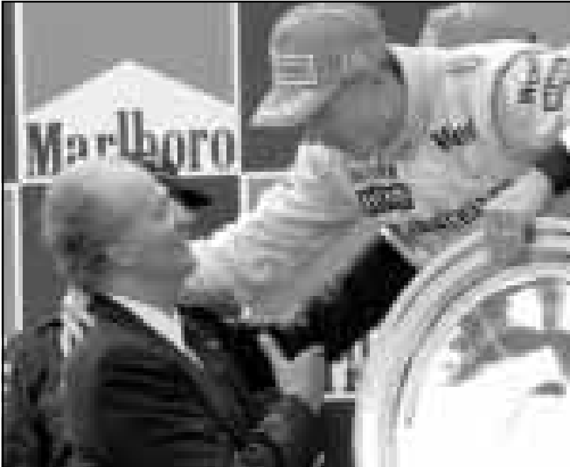
ميكهاكين بطل سباق السيارات (إلى اليمين) يتلقى تهنئة لحة خوان كارلوس ملك إسبانيا بعد فوزه في سباق الجائزة الكبرى في برشلونة

الجزائر - أ ف ب: توج مولودية الجزائر متصدرة مجموعة الوسط الغربي بطلا للدوري الجزائري في كرة القدم إثر تغلبه على شبيبة القبائل متصدرة مجموعة الوسط الشرقي 1-صفر بعد التمديد أثر انتهاء الوقت الأصلي من المباراة النهائية بالتعادل السلبي. وسجل الهدف حميد رحمنوني في الدقيقة 118. وكان المولودية أحرز اللقب للمرة الأخيرة في 1979.