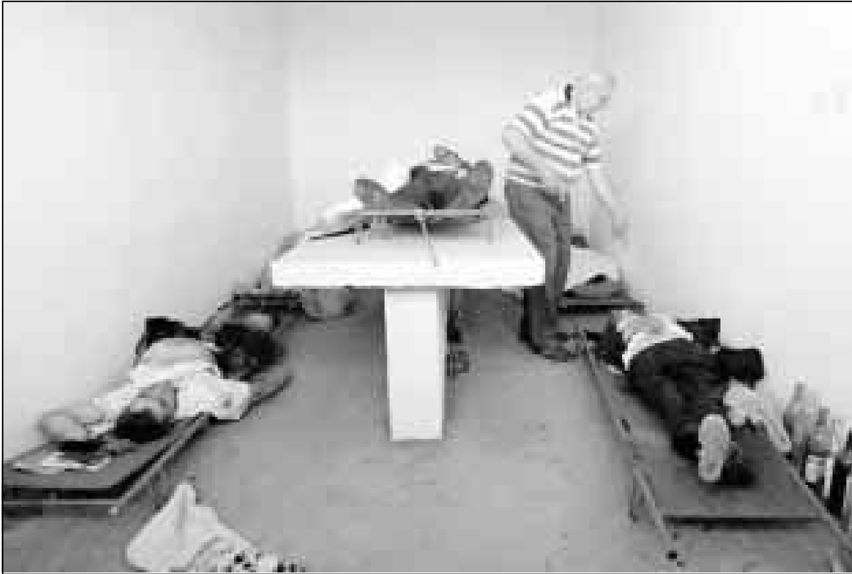
رجل يوغسلافي يقف بجانب جثث قتلى جسر فارغارين (160 كلم إلى جنوب بلغراد) الذي تعرض لقصف الأطلسي الأحد الذي قتل 11 قتيلا و40 جريحا (اف ب)