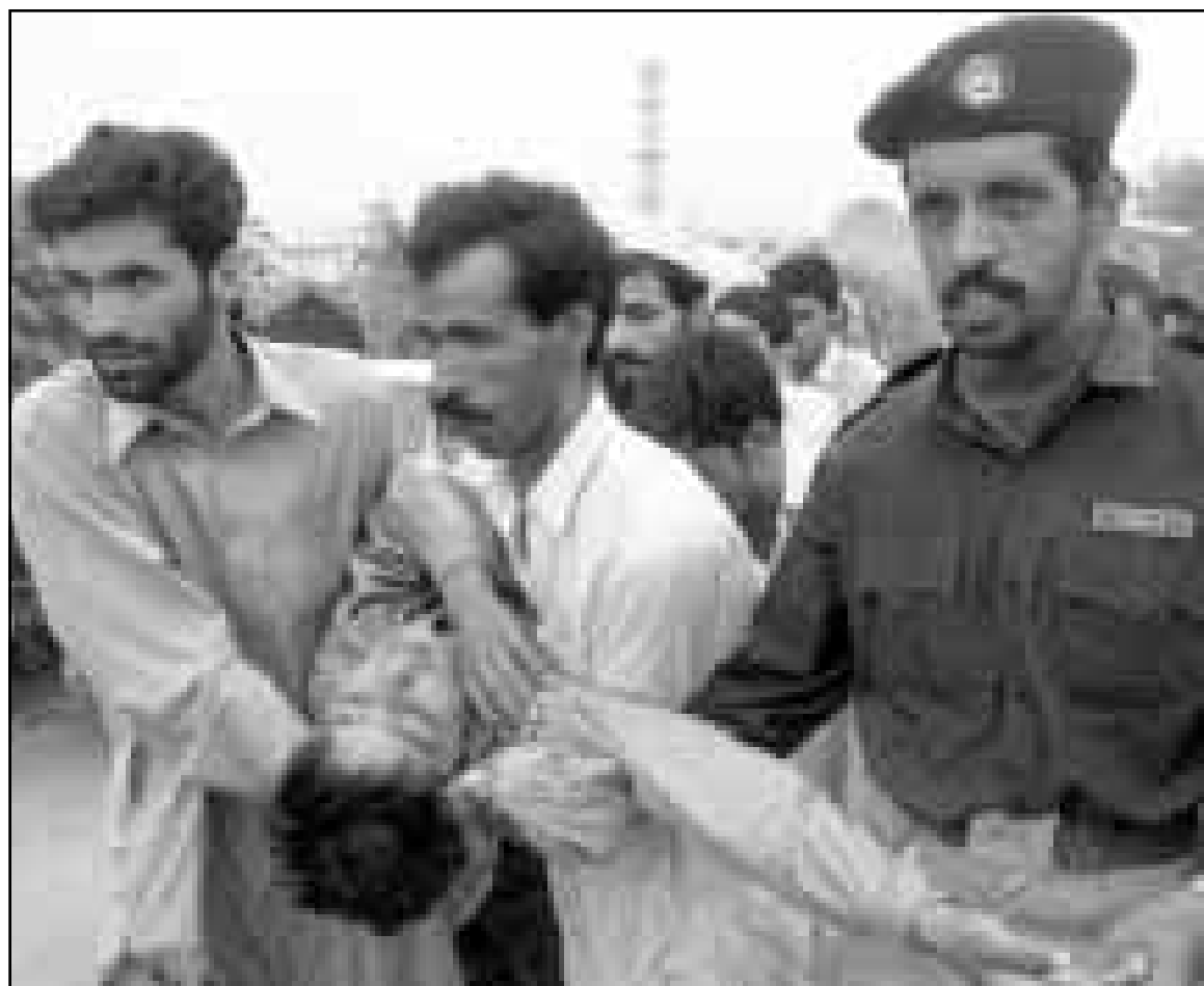
مسلمون يصلون على عدد من ضحايا القصف الهندي في كشمير، وإلى اليسار أحد المسلمين وقد أصيب بالانفجار