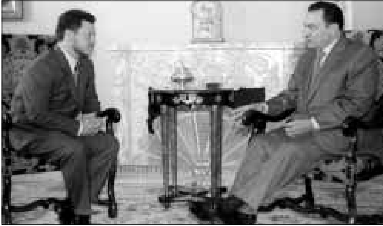
الرئيس مبارك والملك عبدالله لدى اجتماعهما أمس بالقاهرة (رويترز)

القاهرة - رويترز: قال مسؤولون ان الرئيس المصري حسني مبارك اجرى المزيد من المحادثات أمس الاثنين مع الملك عبد الله عاهل الاردن حول سبل تشييط جهود السلام في الشرق الاوسط بعد الانتخابات الاسرائيلية.