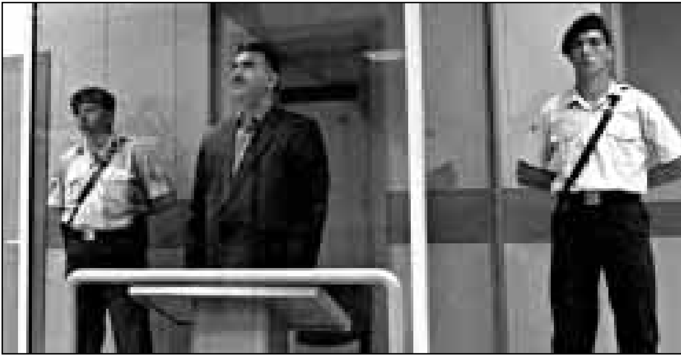
عبد الله اوجلان يقف داخل قفص زجاجي في اول جلسة محاكمته في جزيرة ايمرالي امس (رويترز)