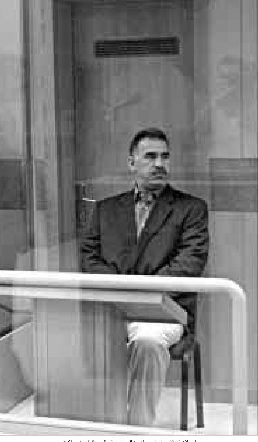
اوجلان في قفص زجاجي واق من الرصاص في اليوم الاول من محاكمته

وقالت صحيفة «اليوم» ان نحو 15 مسلحا اختبأوا على جانبي طريق بالقرب من قرية في منطقة عين وسارة على بعد 150 كيلومترا جنوب الجزائر الليلة قبل الماضية وامطروا قناطر من حراس القرى بنيران الاسلحة الالية. ولا تعلن