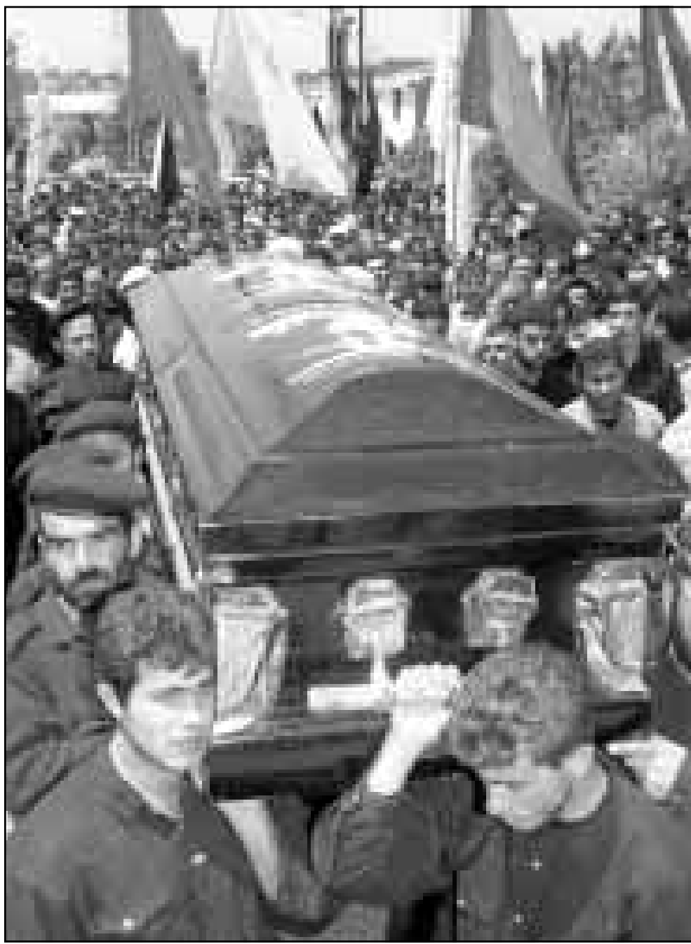
عناصر من حزب الله يشركون في جنازة شهيد في قرية تفحة في جنوب لبنان أمس (اف ب)

وقال جوكسل انه منذ تشكيل قوة الامم المتحدة بليتان عام 1978 قتل 226 من أفرادها 40 منهم ايرلنديون. وقوة الامم المتحدة المؤقتة بليتان 4500 جندي من تسع دول هي فيجي ونيوزيلندا والهند وبنلندا والنيجال وغانا وفرنسا وفنلندا وايطاليا.