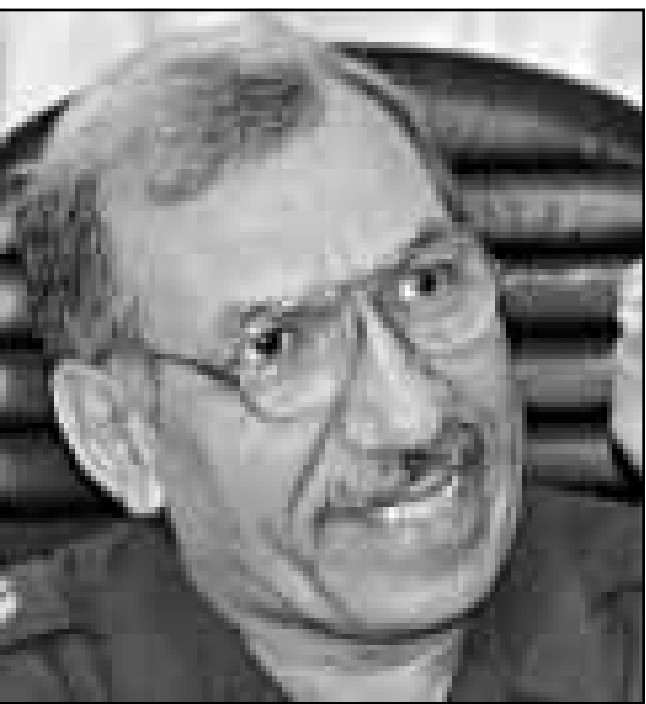
وزير النفط العراقي عامر محمد رشيد يتحدث في مؤتمر صحفي أمس