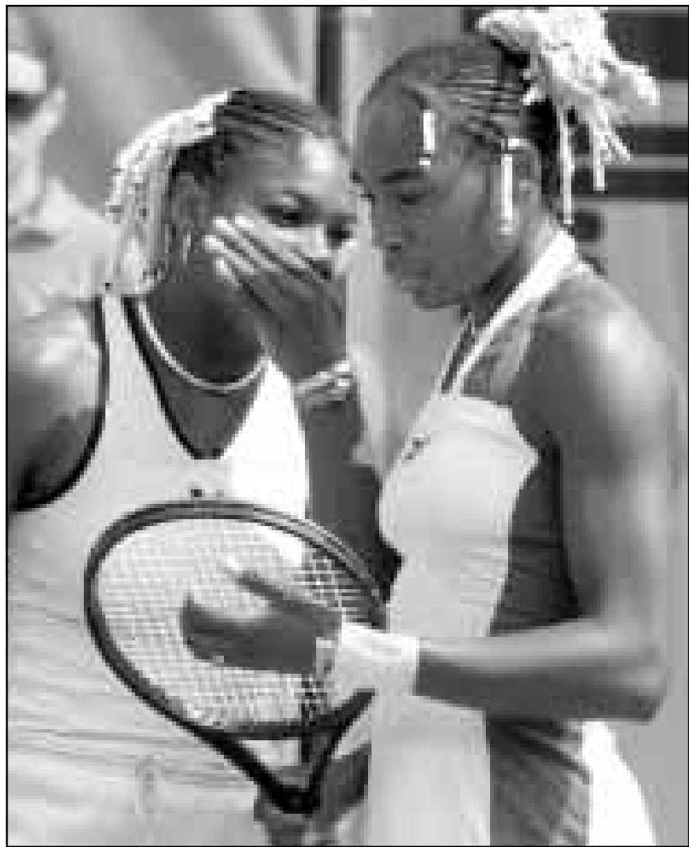
الاعتناء الأمريكيان الشقيقان سوبينا وليامز (إلى اليسار) وفينوس تهاامسان خلال المباراة الزوجية ضد البرازيلية فانيسا ميغا واللائية إيليا فاغنز