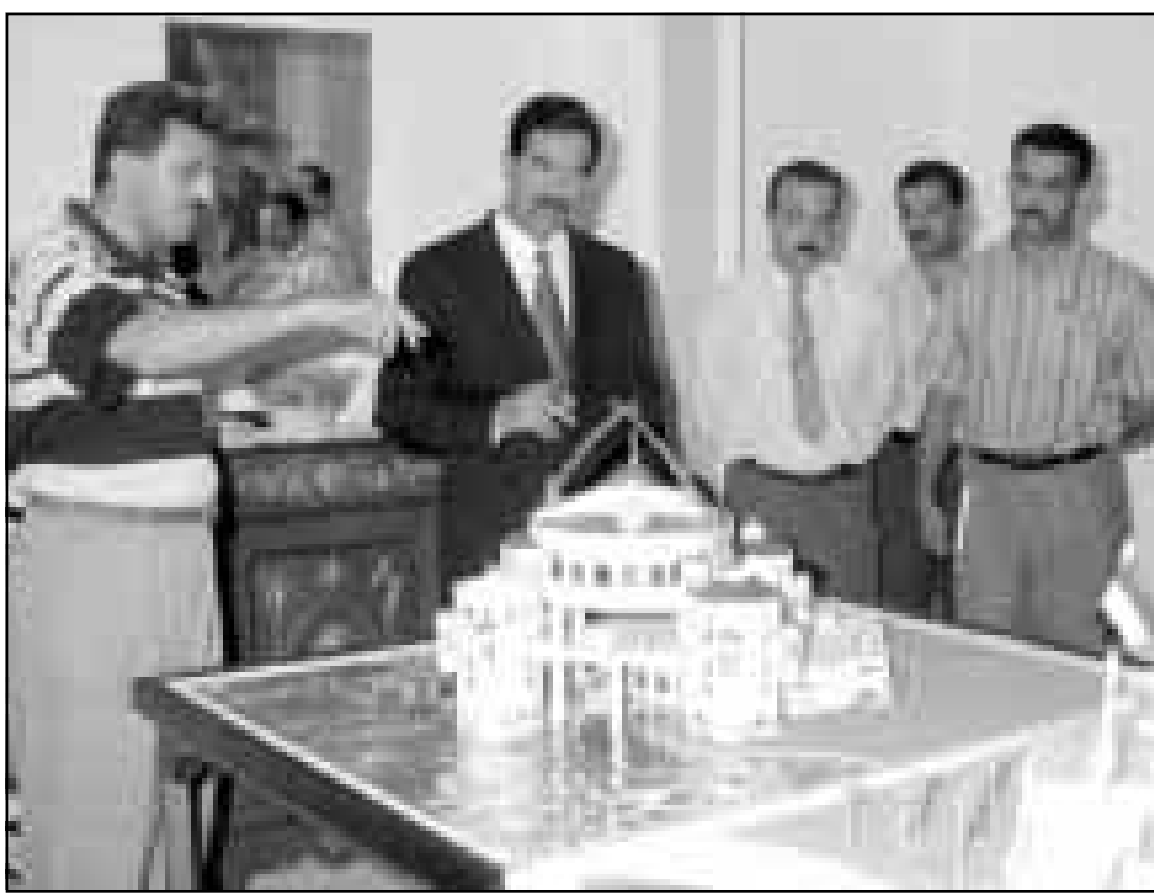
الرئيس العراقي صدام حسين يبيدي ملاحظاته حول اصلاح قصر النصر في بغداد امس

في عيد صعيد آخر فان بغداد التي دأبت على اصدار البيانات الرسمية بخصوص التحركات الدبلوماسية الامريكية المعتادية