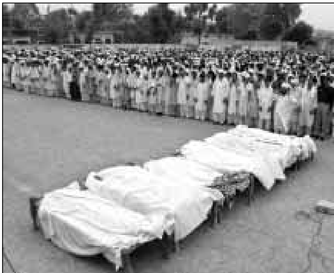
نيودلهي - من سامبيت موهانتني:

شنت الهند هجمات امس الاثنين لليوم السادس على التوالي على «متمسكين» إلى الجانب الهندي من خط وقف إطلاق النار مع باكستان في كشمير. وقصفت المقاتلات الهندية وطائرات الهليكوبتر مواقع جبلية ودفعت بمزيد من القوات البرية لتعزيز هجوم دلهي في منطقة كشمير المقسمة حيث تسيطر الهند على ثلثها وتسيطر باكستان على الثلث الآخر. وقال اتال بيهاري فاجبايي رئيس وزراء الهند امس الاثنين ان الهند تواجه في كشمير موقفا شديدا بالحرب وهجومها في باكستان تستهدف تغيير خط وقف إطلاق النار في الاقليم المتنازع عليه. لكن حكومتها قبلت في الوقت نفسه عرضا من اسلام اباد لايفسد وزير خارجيتها سرتاج عزيز لاجراء محادثات في نيودلهي تستهدف نزع فتيل ازمة بين الجارتين النوويتين منذ نحو ثلاثة عقود. وقال فاجبايي لوفد من رجال الاعمال استقبالهم في مقره الرسمي «في الوقت الراهن الامة تواجه موقفا على خط الحرب. هذا ليس مجرد تسلل بل هجوم (من باكستان) يستهدف تغيير حدودنا».