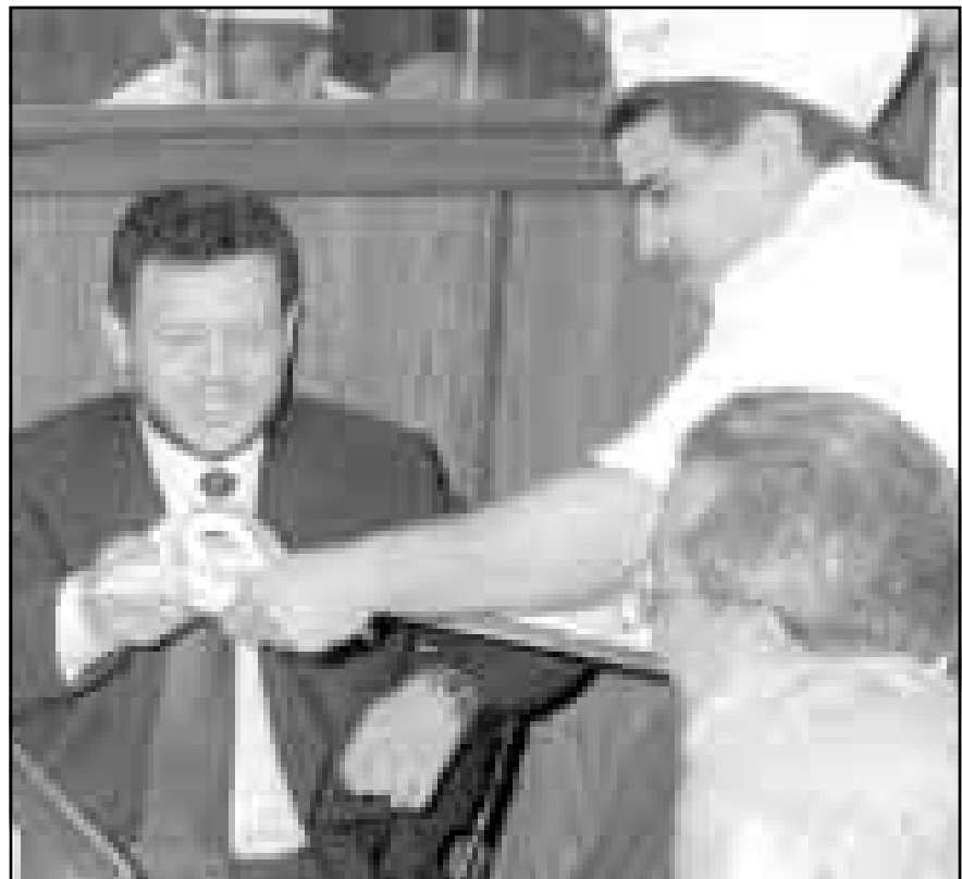
الملك عبد الله اثناء زيارته لدمشق