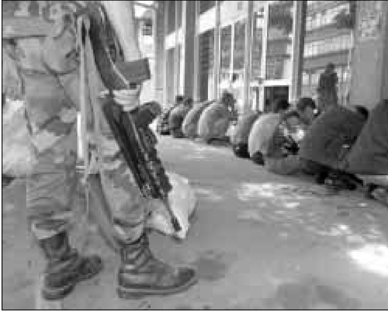
القوة الفرنسية في كوسوفو تعقل مجموعة من الصوص في أحد شوارع ميتروبيتشا. وكانت أعمال النهب اندلعت بعد مغادرة الجيش والمواطنين الصرب للمدينة الواقعة شمال غرب كوسوفو

■ بريشتينا (يوغوسلافيا) - اف ب: رفع سيرغيو فيبيرا دي ميللو الممثل الخاص للامم المتحدة بالقوات المسلحة التي علم المنظمة الدولية على مبنى الذي كان مقرًا عامًا للجيش اليوغوسلافي في بريشتينا (كبرى مدن كوسوفو).