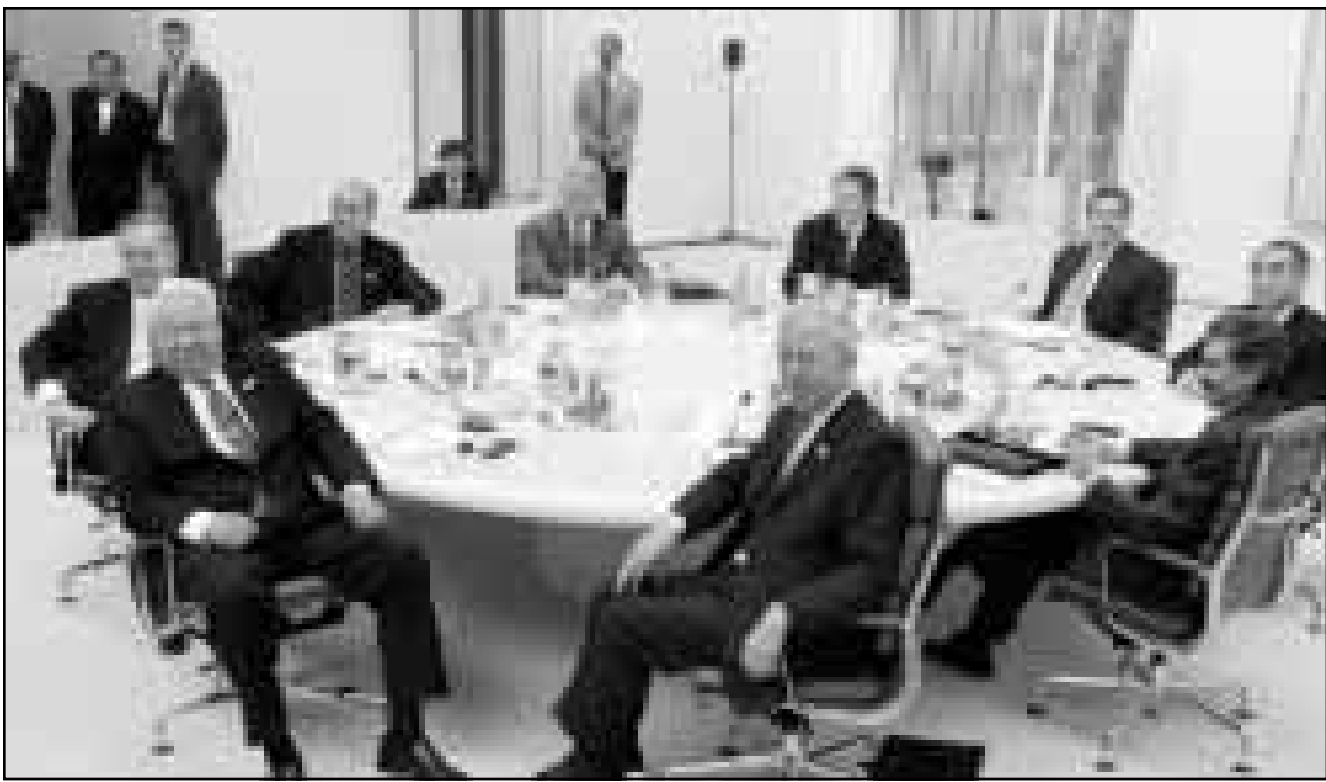
رئيس المفوضية الأوروبية (المركز من الامام) يجلس الى طاولة القمة في يومها الاخير امس

وهل تحقق مبادرة كولونيا أهدافها التي افتتقرت لها مبادرة الدول الفقيرة المثقلة بالديون.. يقول المدافعون عن تقديم مساعدات الذين حضروا قمة كولونيا ان الجديد في مبادرة كولونيا هو ان الحكومات الغنية تقبل الان الاسراع بعملية تخفيف الديون لكي تتمكن الدول الفقيرة اذا سحقت لها الفرصة من توفير المزيد من المال على الصحة والتعليم.