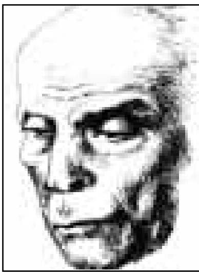
علي الراعي (القدس العربي)

لم يشأ المجلس الاعلى للثقافة ان يأتي احتفاله بتأبين الكاتب والناقد الراحل د. علي الراعي (1921 - 1999) على طريقة انكروا محاسن موتاكم، والاقتصار على كلمات الديرج التي اعتادت عليها مثل هذه الاحتفالات، بل جاءت الندوة التي عقدها الاسبوع الماضي المجلس الاعلى للثقافة بالتعاون مع المركز القومي للمسرح والموسيقى بمكتبة القاهرة الكبرى، بمبادرة المدرس العلمي، وبيان شريف تربي الحرس القديم للثقافة في مصر في هذه المرحلة. وتبني د. علي الراعي بين اقران جيله بتعدد اللوايح وغازرة اعماله رغم قسوة كتبه، واستطاع بقدرته الخلب على العوايق الكثيرة التي اعترضت مسيرته، وان يخلف وراءه انجازات عديدة في المجالات التي تولي مسؤوليتها، واتطرق في هذا كله من ايمانه بالعدل الاجتماعي والديمقراطية في آن. كتب د. علي الراعي في نقد المسرح والرواية والقصة القصيرة، وعمل في الجامعة، وفي الصحافة، وراس مؤسسة المسرح في ازمي مرحلها السنوات الاخيرة من عمره، منبرا حرا، ونورا يصير به اعمال المبدعين الشباب، الذين مد اليهم يد، واخذ بادبائهم الحديث، ودافع عن الكتابة الجديدة، بلا موعظة النقاد العواجز، وبلا احتكار الحقيقة على قبل اجيال الكبار، وكان في هذا كله - كما يقدر الازاعي على خليل - كالأواحد الصحيح مستقيما كالنافذ.