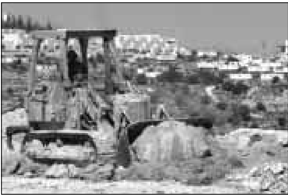
جرافات اسرائيلية تعمل في مستوطنة ارييل في منقطة نابلس

■ القدس-ف ب: قالت صحيفة (هارتس) امس الاحد ان السلطات الإسرائيلية اعطت الضوء الاخضر لبناء الف وحدة سكنية خلال الستين المقبلين في مستوطنة ارييل بالضفة الغربية. وتذكرت الصحيفة نقلا عن احد المتقدين، اكيفا اولزاي، ان الاستعدادات تجري لبناء الف وحدة سكنية في مرحلة ثانية في هذه المستوطنة التي تقع جنوب مدينة نابلس الخاضعة للسلطة الفلسطينية. وتضم المستوطنة حاليا وهي احدي اكبر المستوطنات في الضفة الغربية اربعة الاف وحدة سكنية. واستنادا إلى المتعهد نفسه فان اي منزل جديد لم يبن في المستوطنة منذ خمس سنوات (الامر الذي ادى إلى طلب كبير خصوصا من الأزواج الجدد في إسرائيل الذين يبحثون عن مسكن جديد بسعر مناسب». وقالت الصحيفة ان مسكنا من اربع غرف في المستوطنة يكلف 100 الف دولار وهو اقل بكثير من مسكن مماثل في أنحاء إسرائيل. كما ان المشرى يستفيد ايضا من مساعدات حكومية على شكل هبات وقروض (بفوائد منخفضة جدا) تصل إلى 62 في المئة من قيمة المسكن. وكان رئيس الوزراء المنتخب ايهود باراك احد ان الدولة تتواصل تقديم الخدمات الضرورية للمستوطنات، وافصا اي تفويلا لاسيخيان في برنامج حكومته الجديد. يشار إلى ان المستوطنين ومنذ توقيع اتفاق ارييل بلانديشن في تشرين الاول (اكتوبر) الماضي قاموا بتشجيع من حكومة بنيايين تتهياها باحتلال مواقع جديدة خارج مستوطناتهم، وحاووا فرض امر واقع جديد قبل مفاوضات الحل النهائي بيناسان وضع الأراضي الفلسطينية. واشترط الفلسطينيون في الاتوة الاخيرة وقف عمل الاسيخيان من اجل استئناف محادثات السلام التوقفة منذ ثلاث سنوات.