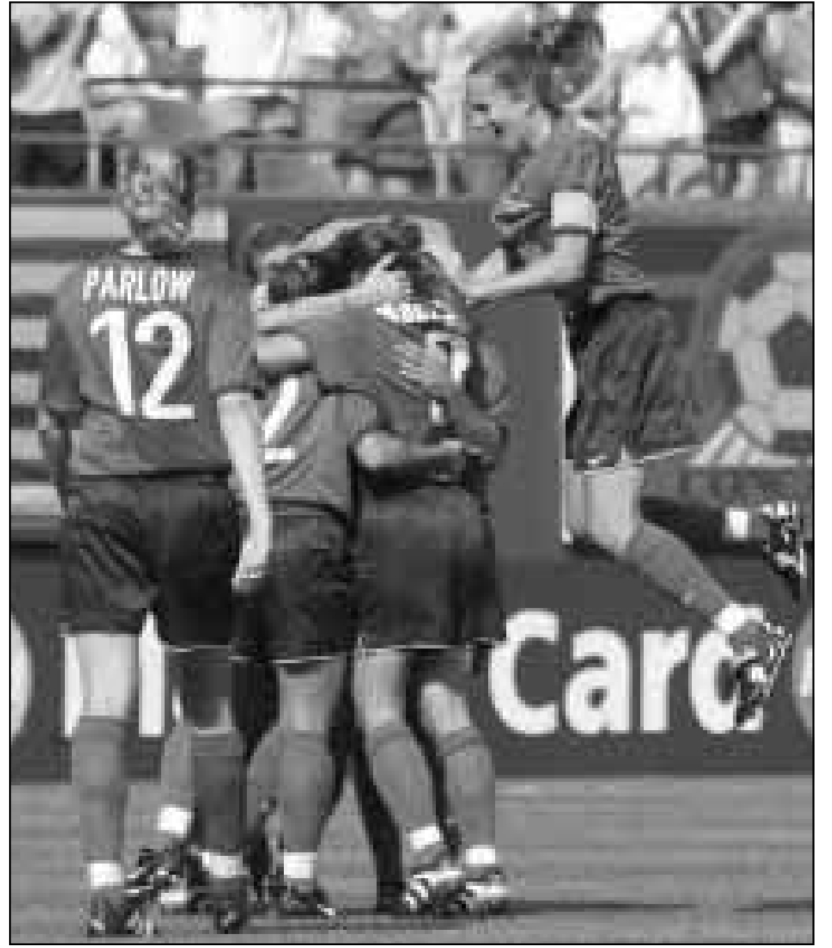
المنتخب الامريكى وفرحة التهديد