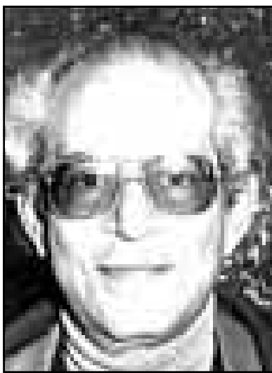
سعد ارض (القدس العربي)

ويروي ان مسرحية مصرع كليوباترا لا يغلب فيها الشعر على الجانب المسرحي، وبخاصة ان شوقي قد انتفع بما انتفع به شكسبير من اصول تاريخية اقتبسها من المعارف اليونانية. ويضيف اننا في تنوعنا للمسرحية الشعرية لا ينبغي ان ننظر الى المسرح الشعري انه مجرد تعبير عن الحوار، ولكن من الممكن ان يكون النص الشعري في ذاته متعفا في تلقي المسرحية، كتلكي الشاهد ومعانيها الصراخ.