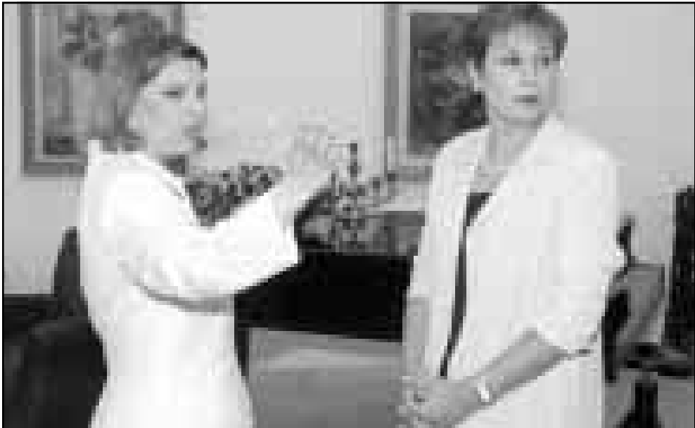
زوجة باراك (يمين) تظفر على بيت رئيس وزراء اسرائيل الذي سيتنقلون للعيش فيه بعد مغادرته تتهياها وزوجته (ف ب)