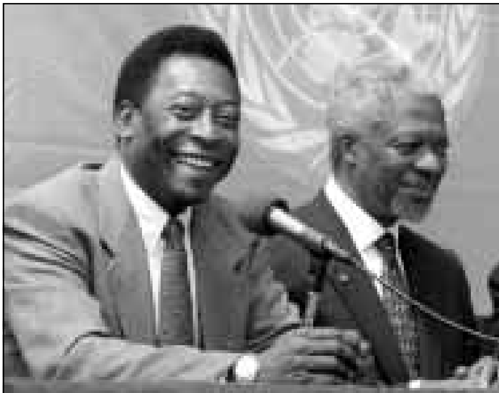
اسطورة الكرة بيليه حضر مؤتمرا صحافيا مع الامين العام للأمم المتحدة كوفي امان في مقر الهيئة لتنسيق التعاون بين الهيئة الدولية والفيغا

وقال اللاعب الايطالي «قضيت وقتا طويلا مع اثلتيكو واود ان انهي فترتي هنا والكأس في يدي».