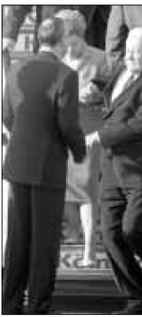
الرئيس الروسي بوريس يلتسن لدى هبوطه من الطائرة مستندا الى ذراع زوجته نانينا في مطار كولونيا بألمانيا حيث شارك في اجتماع قمة الدول الثماني أمس

وقال «اتفاقية الاستقرار لا بد ان تنجح». وتهدف الاتفاقية الى ضمان الاستقرار السياسي والاقتصادي في البلقان في اعقاب الهجمات الجوية التي شنها حلف شمال الاطلسي على مدى 11 اسبوعا على يوغوسلافيا والى ربط المنطقة بأوروبا الغربية.