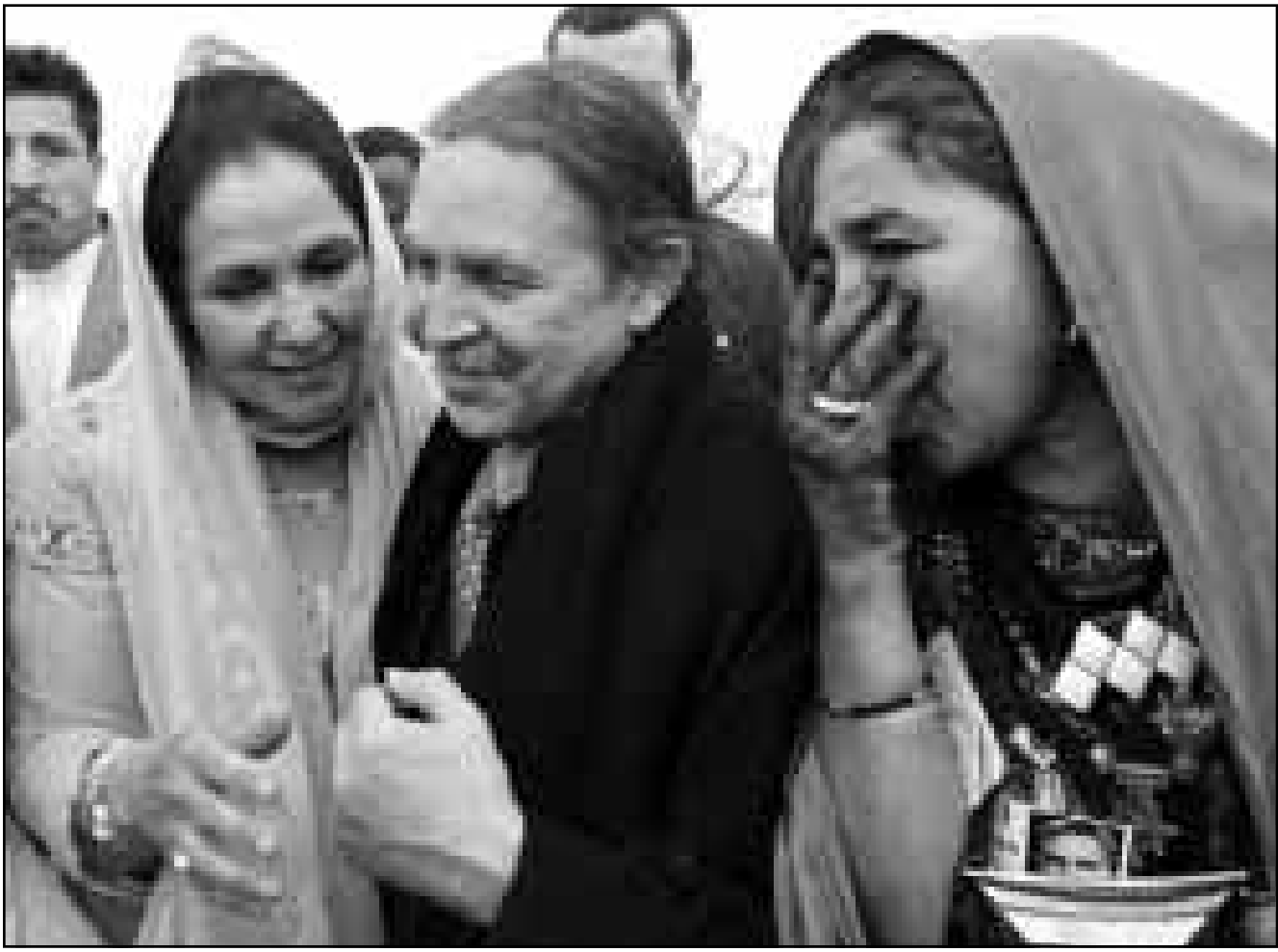
سيدتان جزائريتان يهتنان بوتفليقة لدى انتخابه رئيسا للبلاد في الخامس عشر من نيسان (أبريل) الماضي