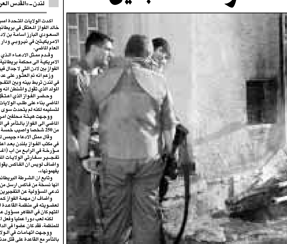
جنود اسراييليون يتفحصون اثار قصف الكاتيبوشا على مستعمرة كريات شمونا

القري في جنوب لبنان خلال الامم الماضية. وأضاف: «حتى الآن عمدت اسرائيل إلى ضبط النفس ولكن التحريض المستمر الذي يمارسه حزب الله لا يمكن ان يبقى دون اى رد على حد قوله. وقال الجيش الاسرائيلي انه امر المقيمين قرب الحدود بالتوجه الى المخابى. وقال شهود عيان بعض السكان تدافعوا على المخابى بينما توجه اخرون وجاء القصف الاسرائيلي بعد سقوط صواريخ على الجليل كان حزب الله قد أطلقها ردا على قصف اسرائيل لعدد من