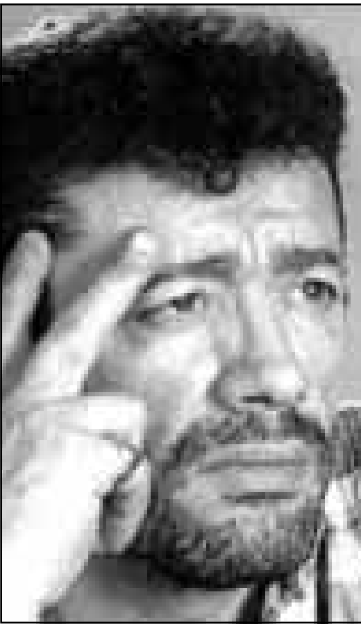
المطرب الغتال مطوب الواس

والتي بدأت قبل 14 عاما. وتعلن السلطات التركية هذه الأرقام باستمرار لكنها لا تشير مطلقا الى عدد الضحايا الاكبر