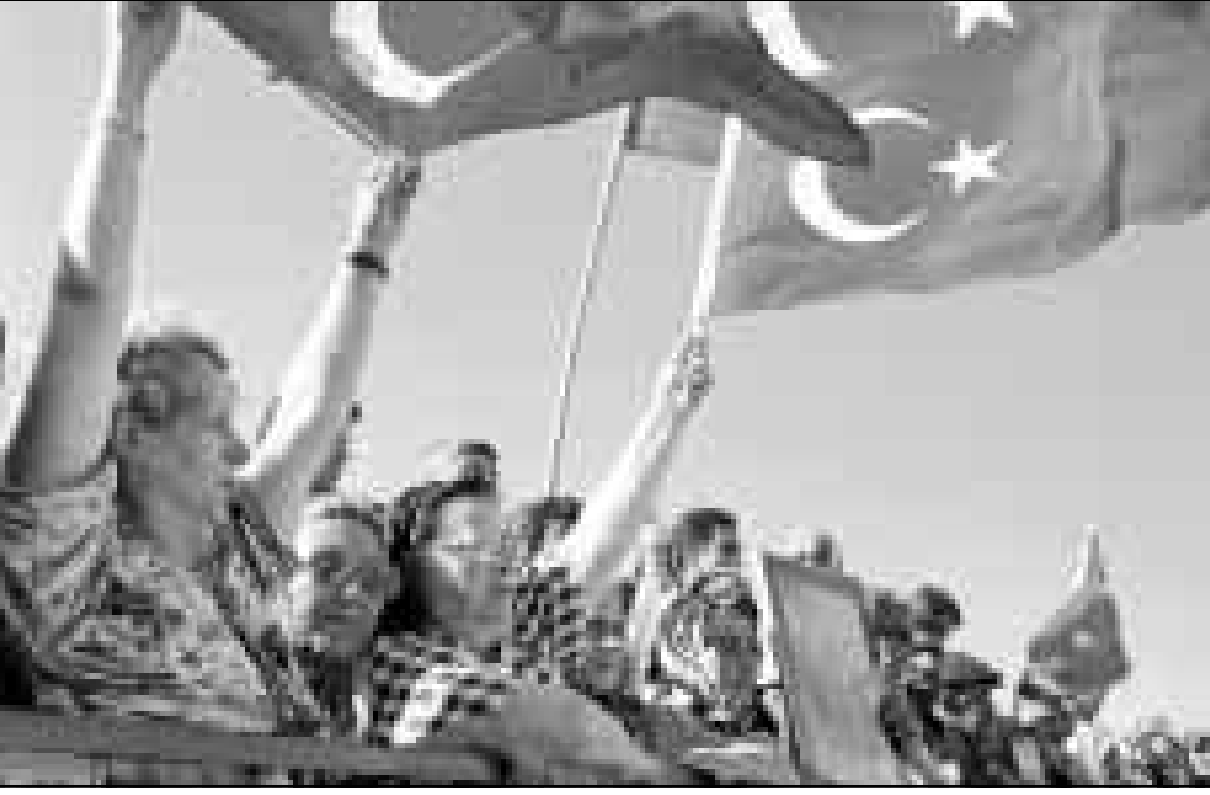
افراد عائلات تركية فقدت اقارب لها في مواجهات مع حزب العمال الكردستاني تستغل انقراضه مسيهم وعواطفهم لتاجيهم ضد اوجلان والاكراك