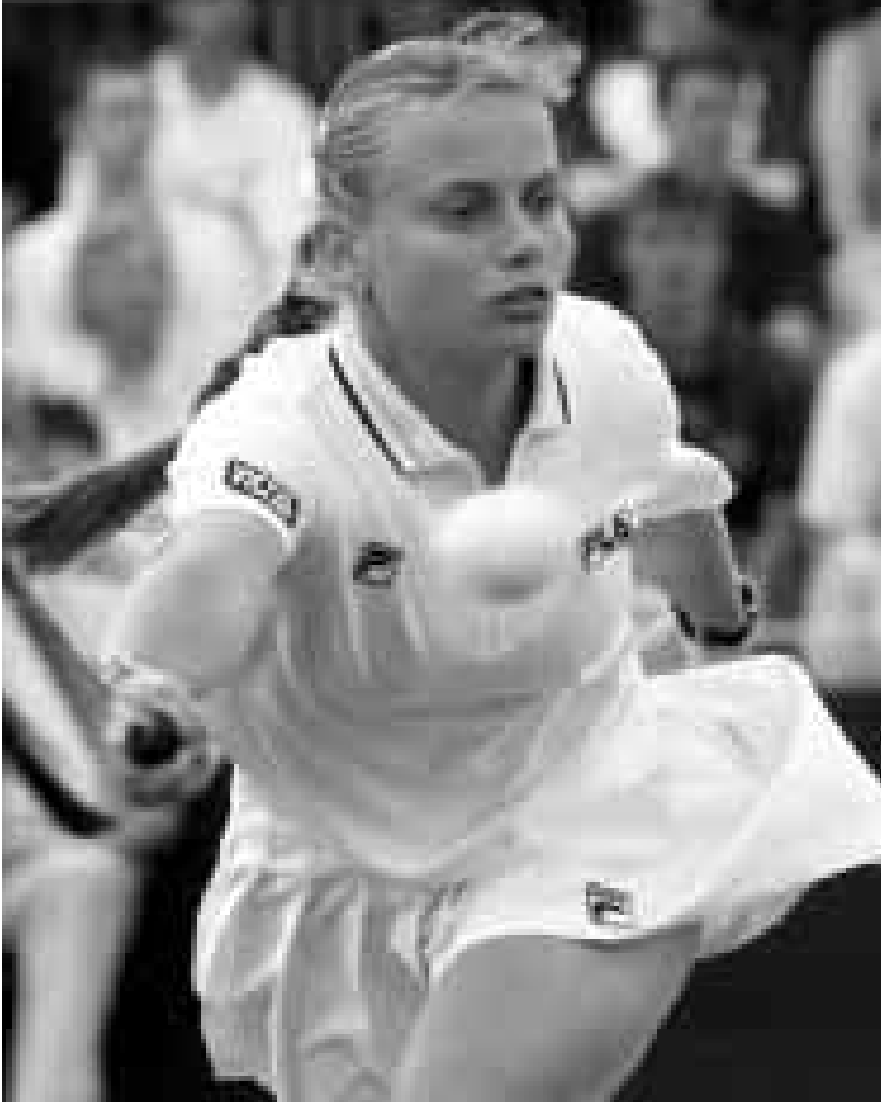
الاسترالية جيلينا دوكيك