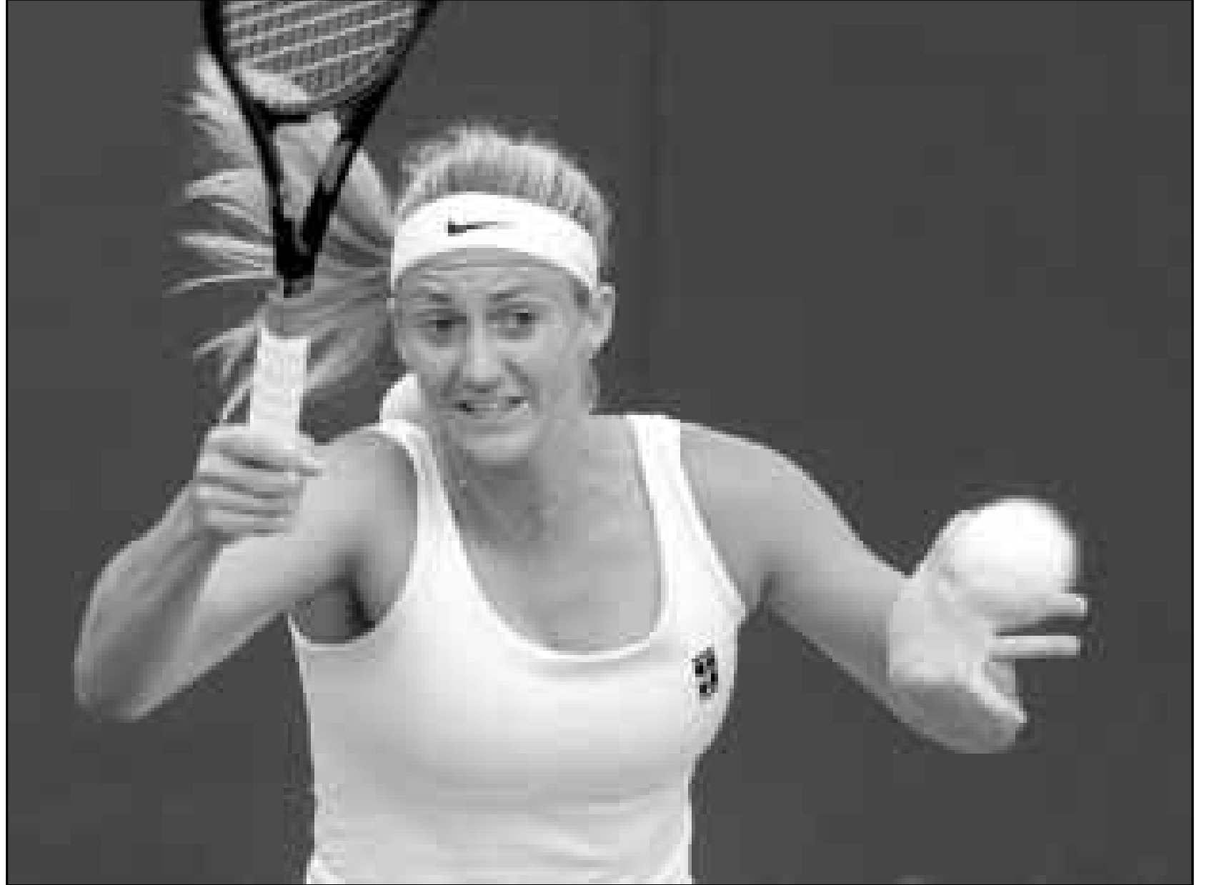
اللاعب الفرنسية ماري بيرس