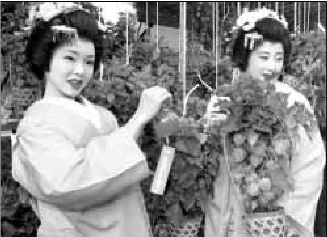
مهرجان صيني في اليابان.. تتشارك فيه هاتان اليابانيتان الغائتان من بنات الجيشا ويبدأ اليوم في طوكيو

■ واشنطن- رويترز: قال باحثون ان ضعف الكروموسومات عند بعض الناس يجعلهم معرضون للاصابة بالسرطان واكدوا ان هذا الضعف جيني في الاساس وان هذا يمكن ان يفسر سبب انتشار امراض السرطان بين افراد أسر بعينها. وقال بريكهويز بين ورملاؤه في مستشفى جامعة فري في امستردام انهم رصدوا هذا الخلل الكروموسومي في نحو 15 في المئة من الحالات التي درسوها. وخلص الفريق في الدراسة التي نشرت في مجلة المعهد القومي للسرطان ان هذا الضعف جيني. وتفسيرها جينيا، وهذا يعني انه اذا كان الشخص عرضة للاصابة بضرار في الحمض النووي (دين ان. ايه) او الشفرة الوراثية فمن الممكن ان يتركز ذلك في اسر بعينها. ودرس الفريق 135 شخصا تربطهم علاقات اسرية اصيبوا بسرطان في الراس والعنق. ويتنشر هذا النوع من السرطان بين المدخنين ويعتبر مثالا جيدا على كيف يمكن ان تنتسب