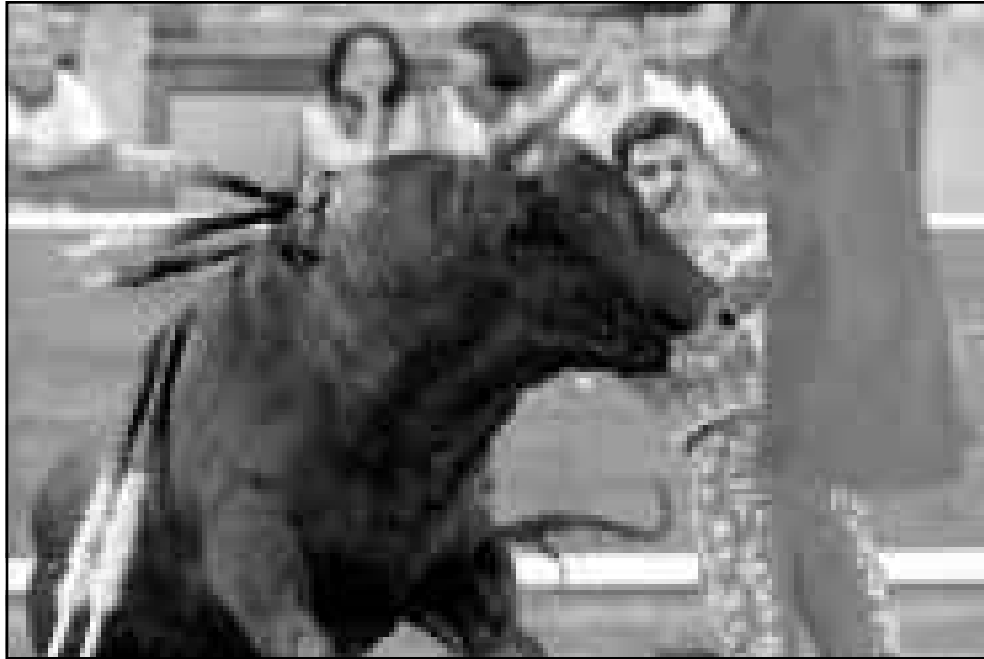
مشهد من مباراة لصناعة النيران خلال المهرجان السنوي «سان فيرمين» في باميلونا باسبانيا

واضاف رائد الفضاء ان «المرحلة الاقسي ستكون بين لحظة