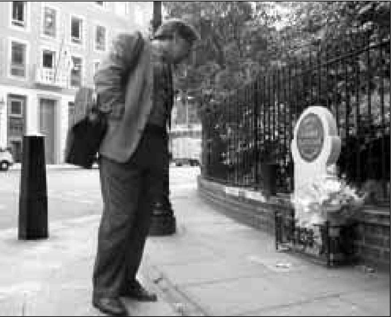
بريطاني يتأمل نصبا تذكاري وضع في المكان الذي قتل فيه الشرطة فليتشر بلندن سنة 1984