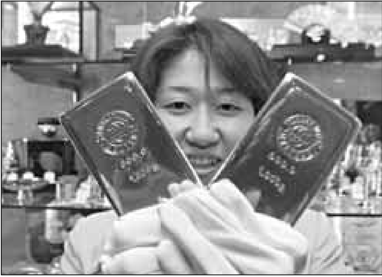
مستخدمة في متجر للمجوهرات في ملوكيو تعرض امس سبيكتي ذهب