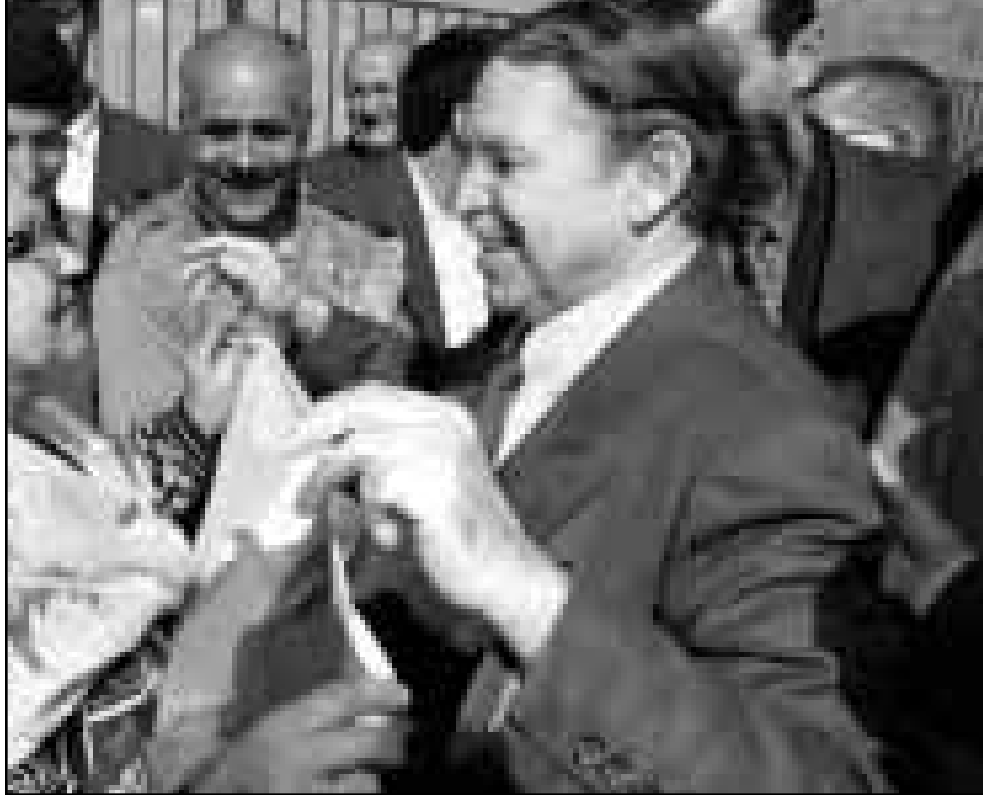
بوتفليقة في الحملة الانتخابية التي وعد فيها الجزائريين بالسلام والاستقرار

وكانت تونس وقعت في اوتوا في ديسمبر عام 1997 للماهدة الدولية لحظر اللغام المضادة للانفراد ودعت الى تدمير المخزونات القائمة. وصدقت تونس على المعاهدة في الثاني من نوفمبر عام 1998.