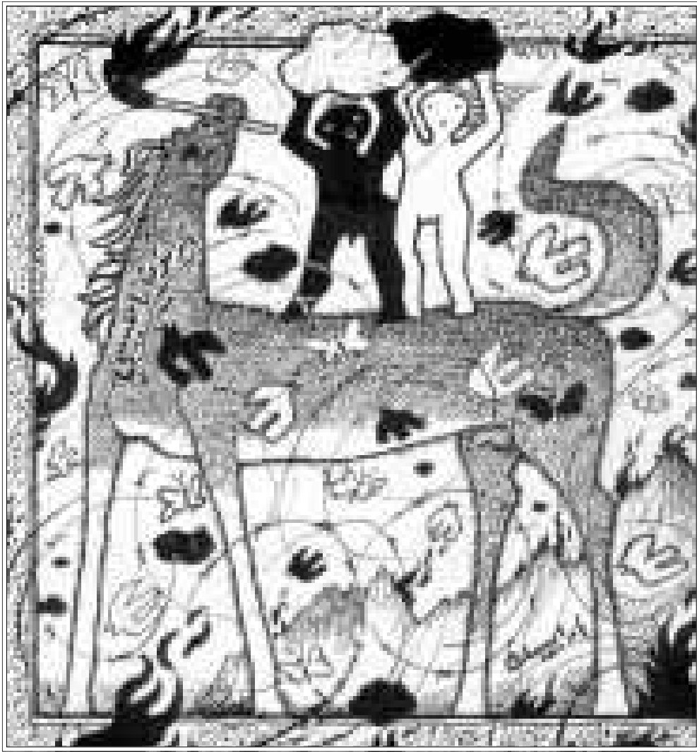
أحد أعمال الفنان

■ الفنان خزيمة علواني كيف تبني لوحتك؟ أبدا تأسيس اللوحة تجريديا، مثل امرئ يطالع في فنان، ضربات الفرشاة أو البقع اللونية أو الهارموني هي التي توحي بالأشكال التي تتطور، يبدأ توارد الخواطر وتبدأ أشكال تفرص من خلال الأشكال التجريدية، وتبدأ الصراعات بين الأشكال نفسها، والصراع أخيرا هو الوصول إلى التوازن إلى الصفر إلى المطلق. ■ بناء اللوحة مثل بناء الكون بكل صراعاته بهدف الوصول إلى التوازن حتى لو كانت النتيجة للوصول إلى التوازن الدراما. ماذا عن الخاص العام في صراعاتك التشكيلية وأقصى هنا الموضوع؟ أنا انتقل من الخاص إلى العام، أنا جزء من هذا الصراع، قمة الفن هي الحرية، والفنان دائم البحث عن الحرية، الحرية والفن متلازمان، قد تكون خفية، وقد يبحر، لكنه يقول ما يريد بشكل مباشر أو غير مباشر، قد يكون الوضع الذي يعيشه نفسه على خصوصية شخصي، والحرية لا تتجزأ، لتفرض أي حر وجاري ليس حرا، أو إنسان في أقاصي الدنيا ليس حرا عندما أنا لست حرا، وهذا ما اشتغل عليه في لوحاتي التي اعتقد أنها تحكي الهم الإنساني العام. ■ هل يقرود الموضوع خزيمة علواني؟ بأزهار بلخص مثل فان كوخ وقد يتحول الموضوع ويبدأ ويبدأ من شخصي إلى شمولي فيه الكثير من الرمزية، وأنا من يخطف الموضوع. ■ على سبيل الرموز من أين يسقي خزيمة علواني رموزه وهي كثيرة في تشكيلك؟ رموزي مني، وليس من رمز شبيه بأخر في اللوحات، فسوتها حيناً، وحيناً لها لينة الحرير. هل لنا أن نتوقف عند هذا الموضوع؟ ■ الخط هو أساس الفن، قوة الفنان بقوة خطه، ويطلع الفنان