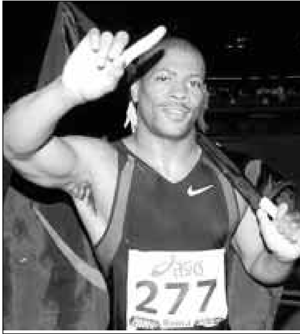
العلاء الامريكي موريس غرين