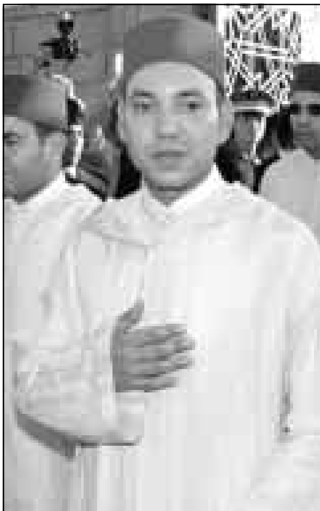
العاهل المغربي الجديد محمد السادس