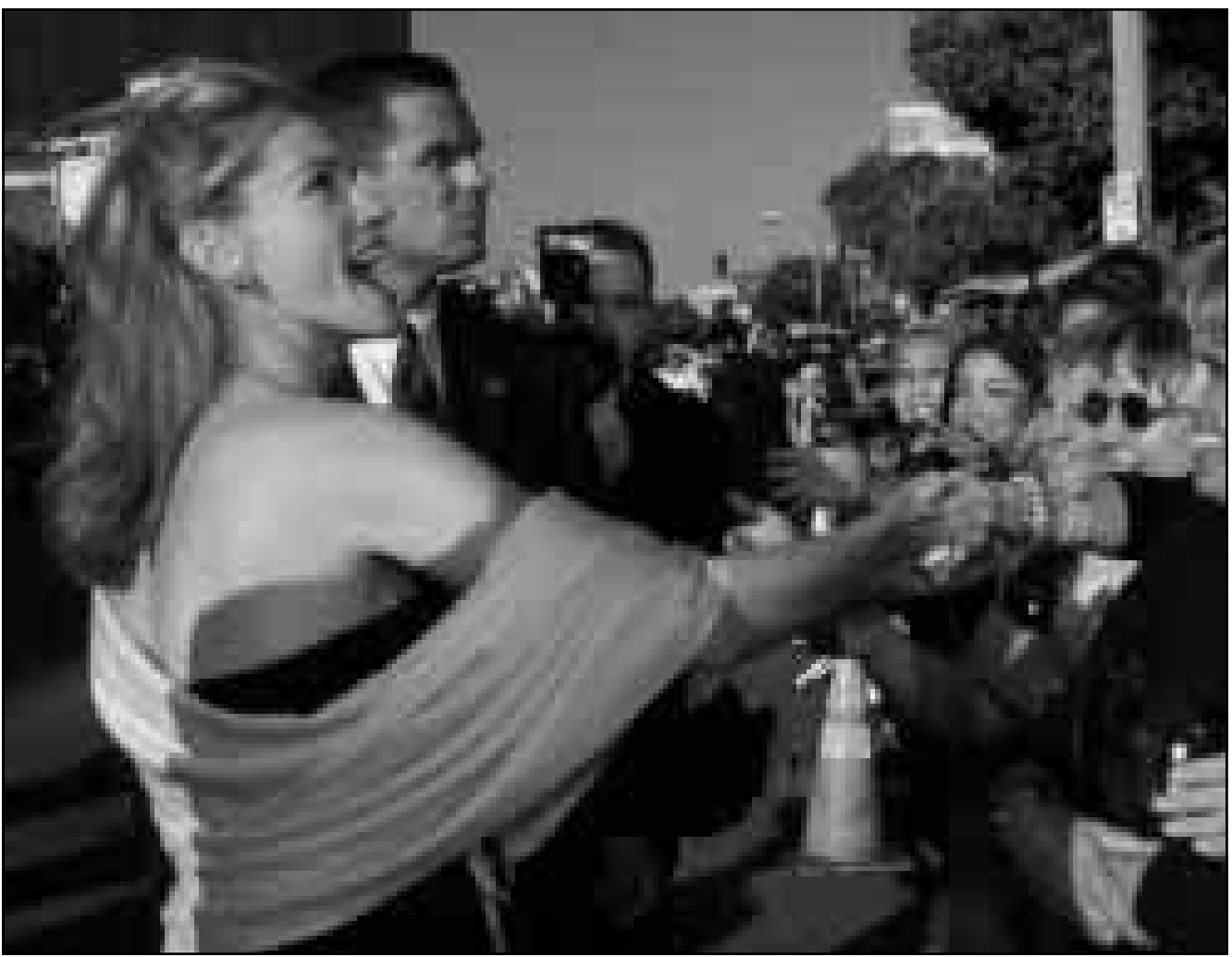
النجمة جوليا روبرتس (الى اليسار) تحيي الجمهور لدى حضورها حفل العرض الاول لفيلمها الجديد «العروس الهاربة»، في لوس انجليس امس

ويطلق الحفل بمعزوفة موسيقية لاحدى روائع الفنان الراحل عبداللطيف حافظ «فاتت جنبنا» ادتها الفرقة للمصاحبة لعمر دياب.