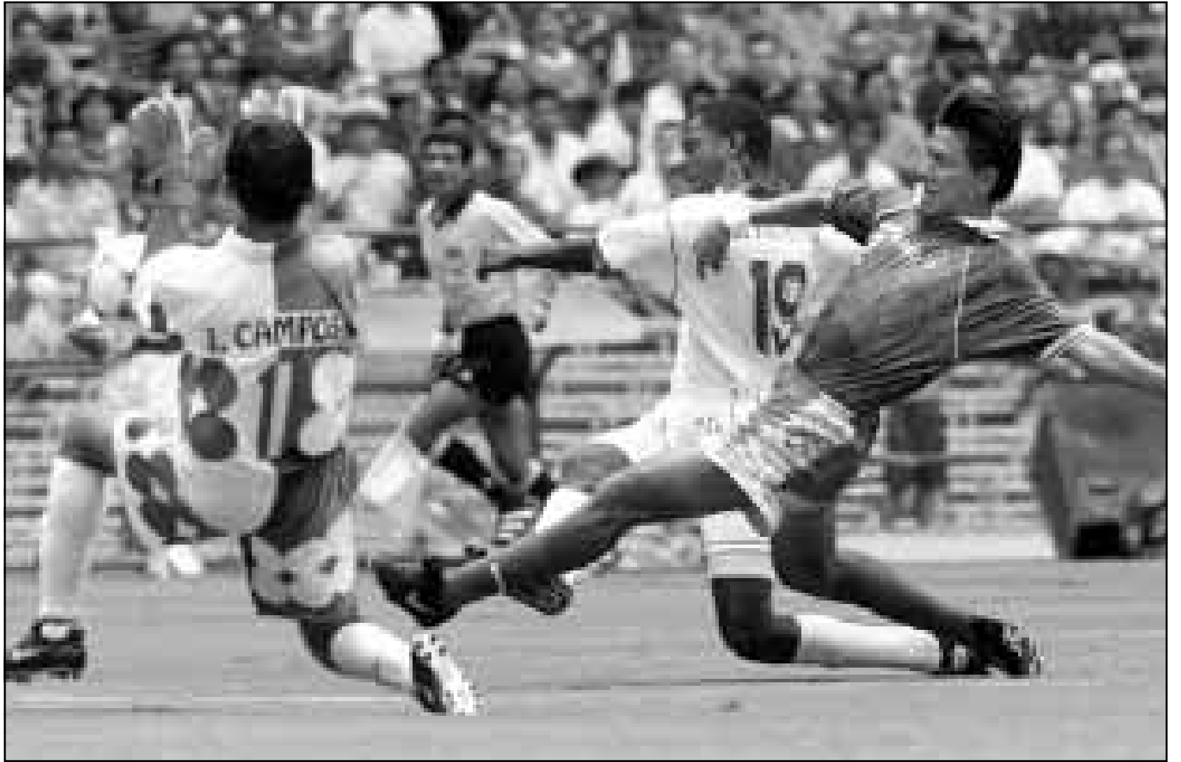
حزمة فالته لاعب السعودية (اليمين) في هجمة كروية تصدى له فيها عدد من لاعبي المكسيك

وكان رافتسر جمع 2018 نقطة العام الماضي، وتبدو مهمته في الدفاع عليها جد صعبة هذا الموسم بالإضافة الى انه قرر عدم المشاركة في دورة لوس انجليس، التي في حال بلغ سامبراس موارثها النهائية سيستعيد المركز الاول. يذكر ان سامبراس صنف ثانيا في دورة لوس انجليس التي انطلقت امس الاثنين خلف مواطنه اغاسي. ويستعد رافتسر حاليا في برمودا، وهو سيدافع عن لقبه في دورة مونتريال الكندية ابتداء من 2 آب (اغسطس) المقبل قبل ان يشارك في بطولة الولايات المتحدة