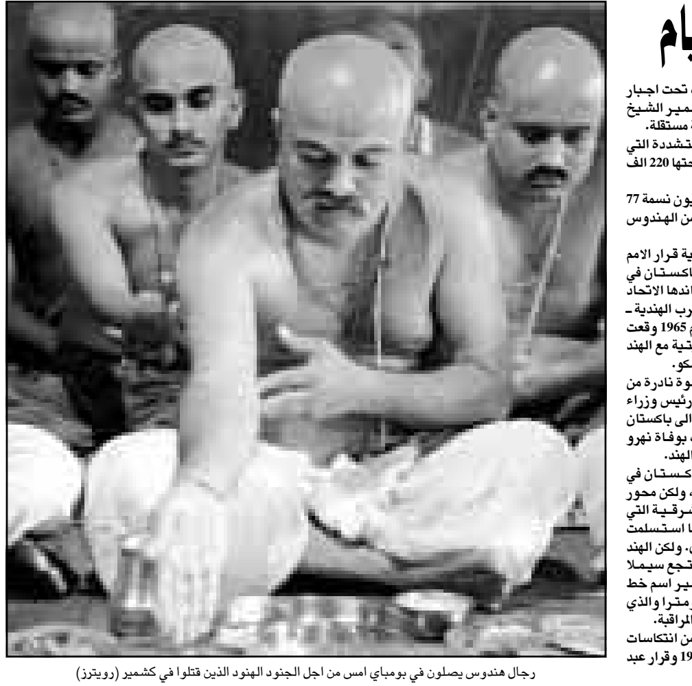
رجال هندوس يصلون في بومباي امس من اجل الجنود الهنود الذين قتلوا في كشمير

من جهته طالب رئيس الوزراء الباكستاني نواز شريف، الذي يواجه انتقادات شديدة في بلاده من الاحزاب المعارضة والدينية بعد الاتفاق على سحب المقاتلين، الاحد الماضي الهند بيده مفاوضات مع باكستان بدون شروط مسبقة. وقد اوقع النزاع في كشمير 24 الف قتيل منذ 1989. وكانت مسألة كشمير سبب الحروب بين الهند التي خاضها البلدان منذ التقسيم والاستقلال في 1947. ويرجع النزاع في كشمير الى قرار اتخذ عام 1947. فبعدما قرر حاكم المملكة القديمة في كشمير الانضمام الى الهند عام 1947 نشر بذور النزاع الذي جعل منطقة الهيمالايا احد اكثر مناطق العالم توترا. وبعد شهرين من تقسيم الهند البريطانية الى دولتين مستقلتين هما الهند وباكستان قرر آخر حاكم كشمير المراهجا هاري سينغ الانضمام للهند العلمانية لتندلع اول حرب بين الهند وباكستان. وبعد اكثر من 50 عاما ما زالت نزوان الاسلحة تنطلق يوميا تقريبا عبر خط الرقابة الذي يقسم بين الجزء الواقع تحت سيطرة الهند من كشمير والجزء الواقع تحت سيطرة باكستان بالرغم من اتفاق في تموز (يوليو) لتخفيف صراع استمر شهرين في كشمير بعد انهاء منذ نحو 30 عاما، اثار القتال الاخير المخاوف من إمكانية اندلاع نزاع نووي في شبه القارة الهندية ان تتمتع كل من الهند وباكستان بمقدرة نووية. وبدأت الهند هجوما بريدا وجويا ضخما في ايار (مايو) لطر من وصفهم بمتسللين تساندتهم باكستان وسيطروا على مناطق بالجزء الواقع تحت سيطرتها عند خط الرقابة. ودارت حربان من بين الحروب الثلاث التي اندلعت بين الهند وباكستان منذ الاستقلال عن بريطانيا حول كشمير. وولاية جامو وكشمير كثيرا ما توصف «الجمعة على الارض» لجمال وديانها وبحيراتنا وجبالها وكانت اكبر ومن بين اكثر الولايات في الهند البريطانية انغاسا في السياسة.