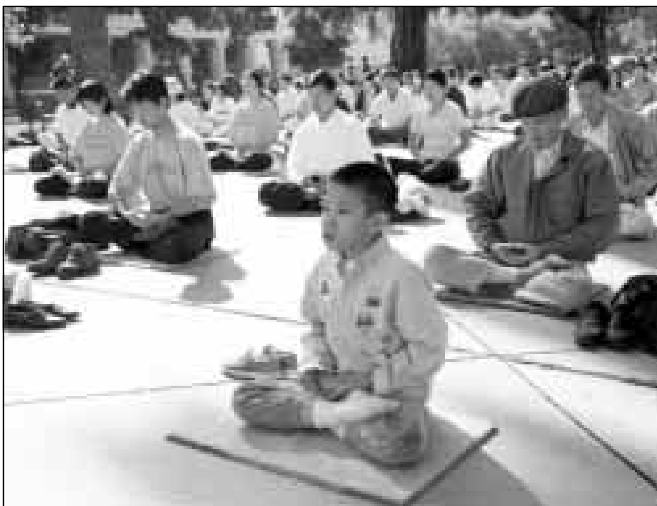
اتباع «فالونغونغ»، يعارضون شعارات معتقدتهم في كاليفورنيا

حاصر عشرة آلاف من اتباعها ملعين آخرين في بكين من المعتقلين منذ مساء الأحد. لكن مصير اتباع الطائفة عند خروجهم من الملعب بقي مجهولاً. وقال احد رجال الشرطة في بكين لوكالة «فرانس برس» انه تم على الأرجح توقيف لـ 50 الف شخص لكنهم لم يوضوا قيد الاعتقال». وأضاف انه «في الصين يجوز التوقيف لفترة 15 يوما من دون الاعتقال رسمياً». وتابع «انه حتى الآن جرى حظر فالونغونغ بشكل جيد، لكن لا يزال من المبكر الإعلان عن ذلك، وعلينا ان نبقي متيقظين لمعرفة كيف سيتطور الوضع». وكانت هذه الطائفة التي تستوحي من البوذية وتمزج في تعاليمها بين التعاليم الجسدية والروحية قامت باختيار قوة مذهلة في 25 نيسان (ابريل) الماضي حين