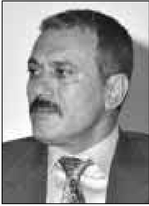
الرئيس علي عبدالله صالح

وفي آذار (مارس) الماضي قام وزير الخارجية السعودي الأمير سعود الفيصل بزيارة خاطفة إلى صنعاء في مسعى لتحريك المفاوضات، ذلك توجه المسؤول السعودي المكلف ملف الحدود مع اليمن ووزير الدفاع سلطان بن عبد العزيز بدوره مساء الأحد إلى ماربيا بعد أن مثل المعالج السعودي الملك فهد في مراسم جنازة المعالج الغربي الملك الحسن الثاني، كما أوردت وكالة الأنباء السعودية.