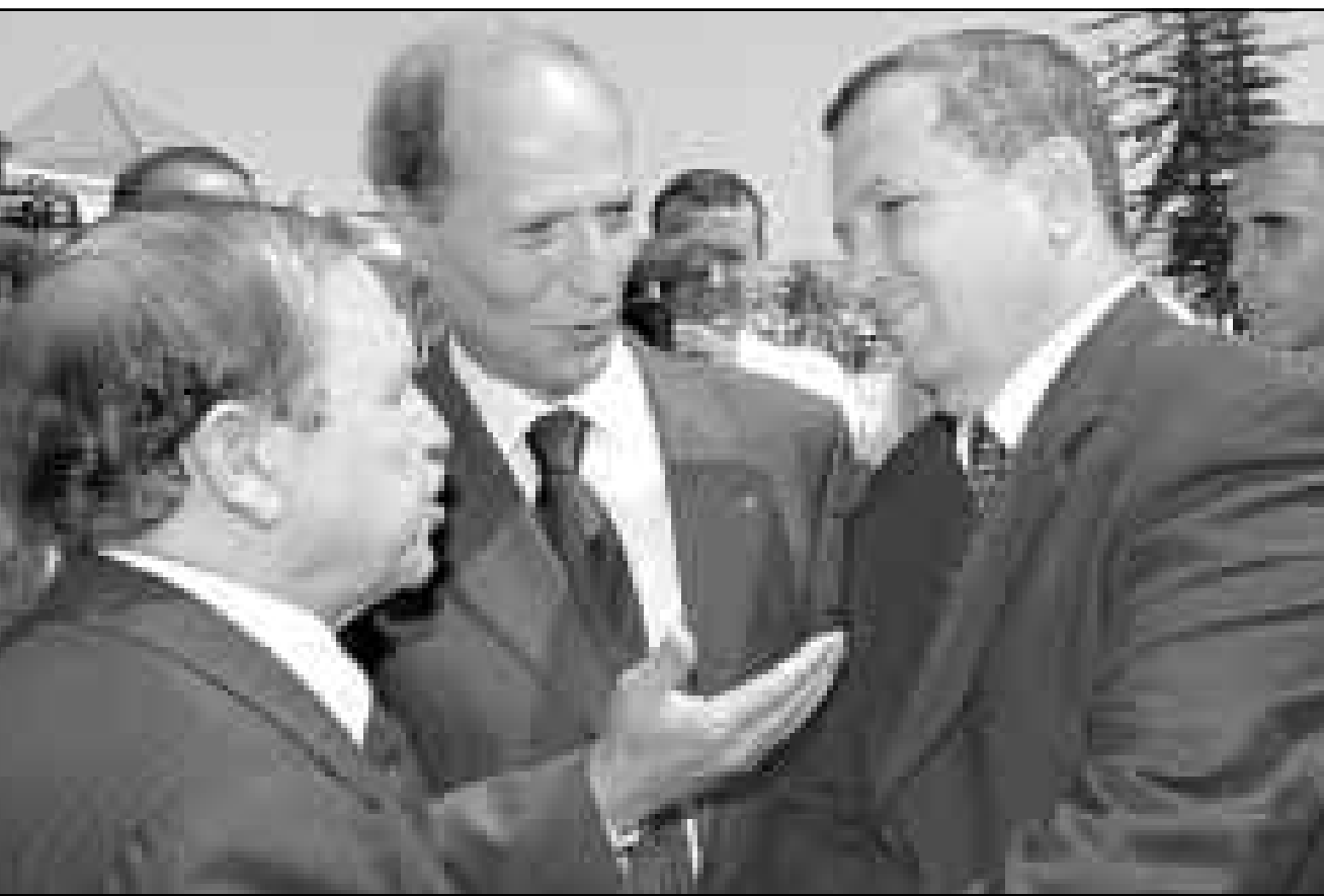
الرئيس الجزائري عبد العزيز بوتفليقة يتحدث مع رئيس الوزراء الإسرائيلي إيهود باراك أثناء مشاركتهما بتشييع جنازة العامل المغربي الحسن الثاني

عمان «القدس العربي» من بسام بدارين: دمشق - من عصام حمزة: