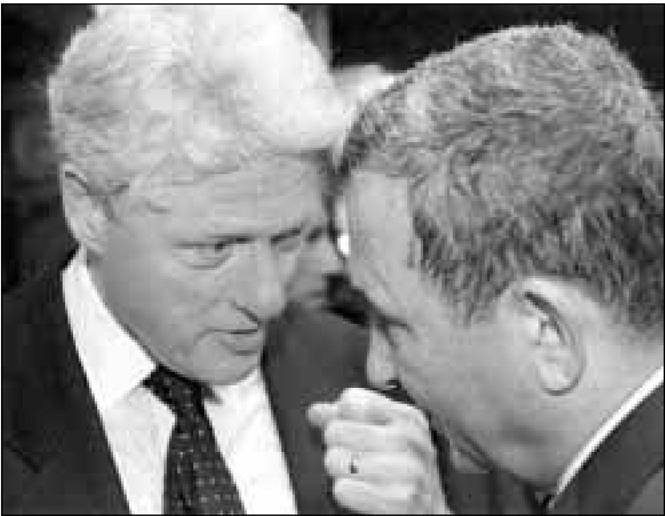
كلينتون يتحدث مع باراك على هامش جنازة الملك الحسن الثاني امس الاول

خلال لقاء بينهما على فحوى حديث مولد في العودا الى ماددة المفاوضات السابغة مع الرئيس الاسد. ونقلته الصحيفة عن مصادر في حاشية الملك خوان كارلوس قولها ان الرئيس الاسد اكد رغبة سورية في العودة الى المفاوضات مع اسرايل في اسرع وقت ممكن. وكانت مصادر اسرائيلية وسورية قد اشارت مؤخرا الى حدوث تقارب في وجهات نظر الجانبين، الامر الذي قد