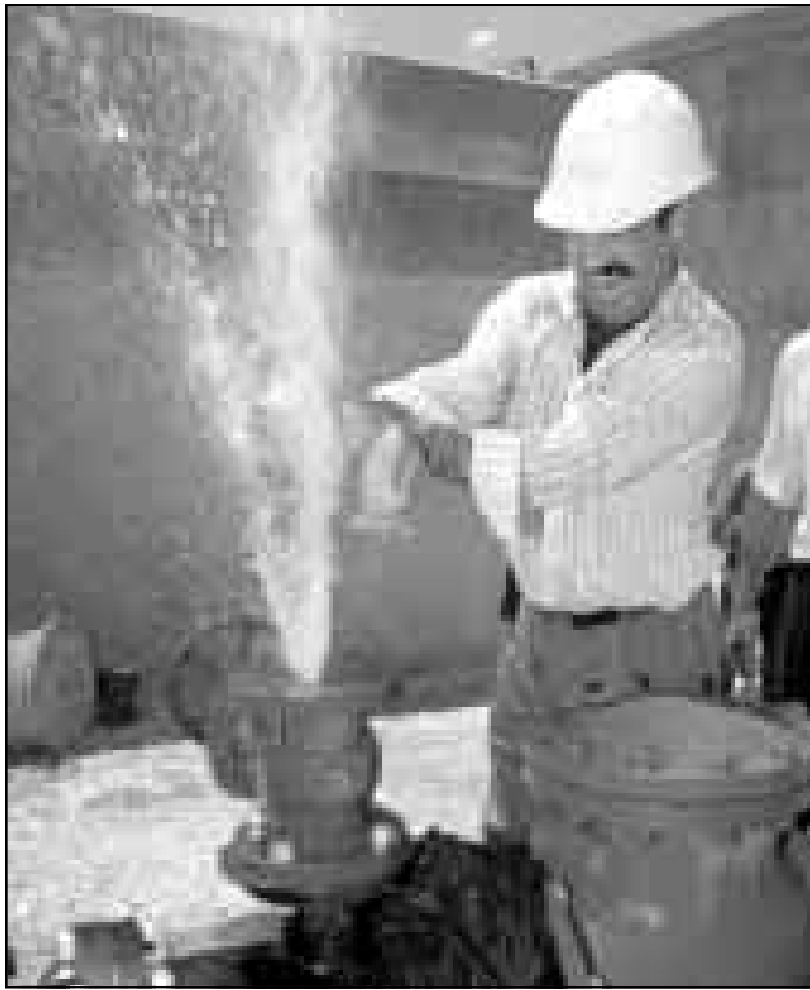
فني فلسطيني يمتح مع اول تدفق للماء من البئر الجديدة