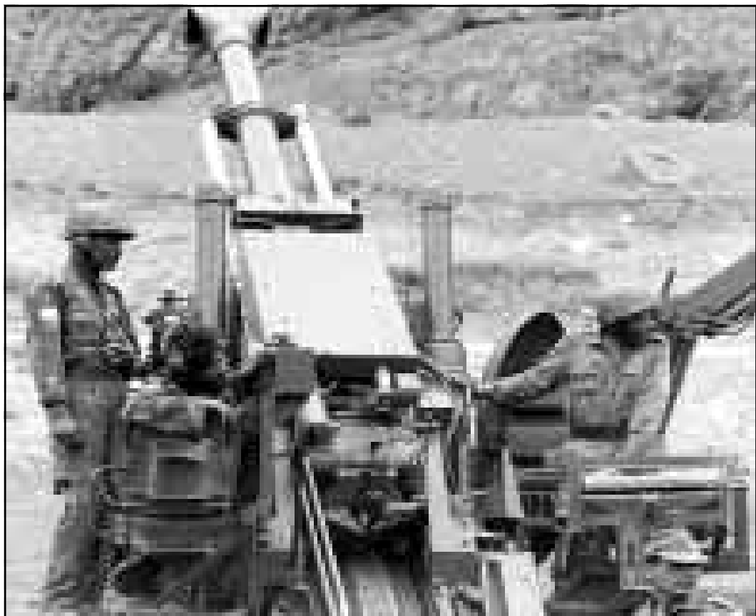
جنود هنود يقصفون مواقع المقاتلين الكشميريين اثناء الاشتباكات بين الطرفين في الشهر الماضي

الباكستانية» ملائم لاسرائيل بسبب مساحتها الصغيرة وهو ليس ملائماً لبلد كبير مثل الهند. في جهاز الدفاع اعتقدوا ان الصناعات الامنية الاسرائيلية تواجه مستقبلاً كبيراً في الهند. احدى الافكار المطروحة كانت تحسين اسطول الخمسة طائر 21 القديمة التي يملكها سلاح الجو الهندي، اسرائيل اقترحت تزويد طائرات الميغ باجهزة تحكم غربية، الهند تردت بين الحين والآخر للمشروع للروس ام لاسرائيل الاغراء كان كبيراً الصناعات العسكرية الاسرائيلية طورت غرفة قيادة حديثة من الافضل في العالم ويمكن نقلها الى طائرة ميغ 21، بالإضافة لذلك كان للعرض الاسرائيلي امتياز آخر، اسرائيل لم تملئ شروطها على الهند التي يقيد حرية حركة جيشها ولكن الصفقة اعطيت للروس في آخر المطاف والسبب يعود بالاساس للدين المالي الكبير الذي تدنيه به الهند وروسيا.