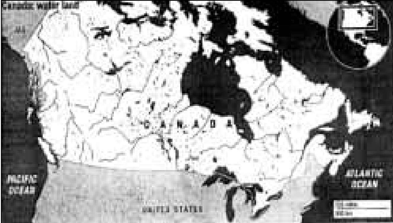
خارطة لكندا تظهر عليها بحيراتها الكبيرة وانهارها (باللون الاسود)

شبيهه موقف الحكومة المركزية لانهم يخشون من ان المزارع ولاية ما بموقف مختلف يمكن ان يؤدي الى تشجيع الولايات الاخرى على اتخاذ نفس الموقف، وبالتالي فان الحكومة المركزية تصعب حل او قوة في هذا الخصوص.