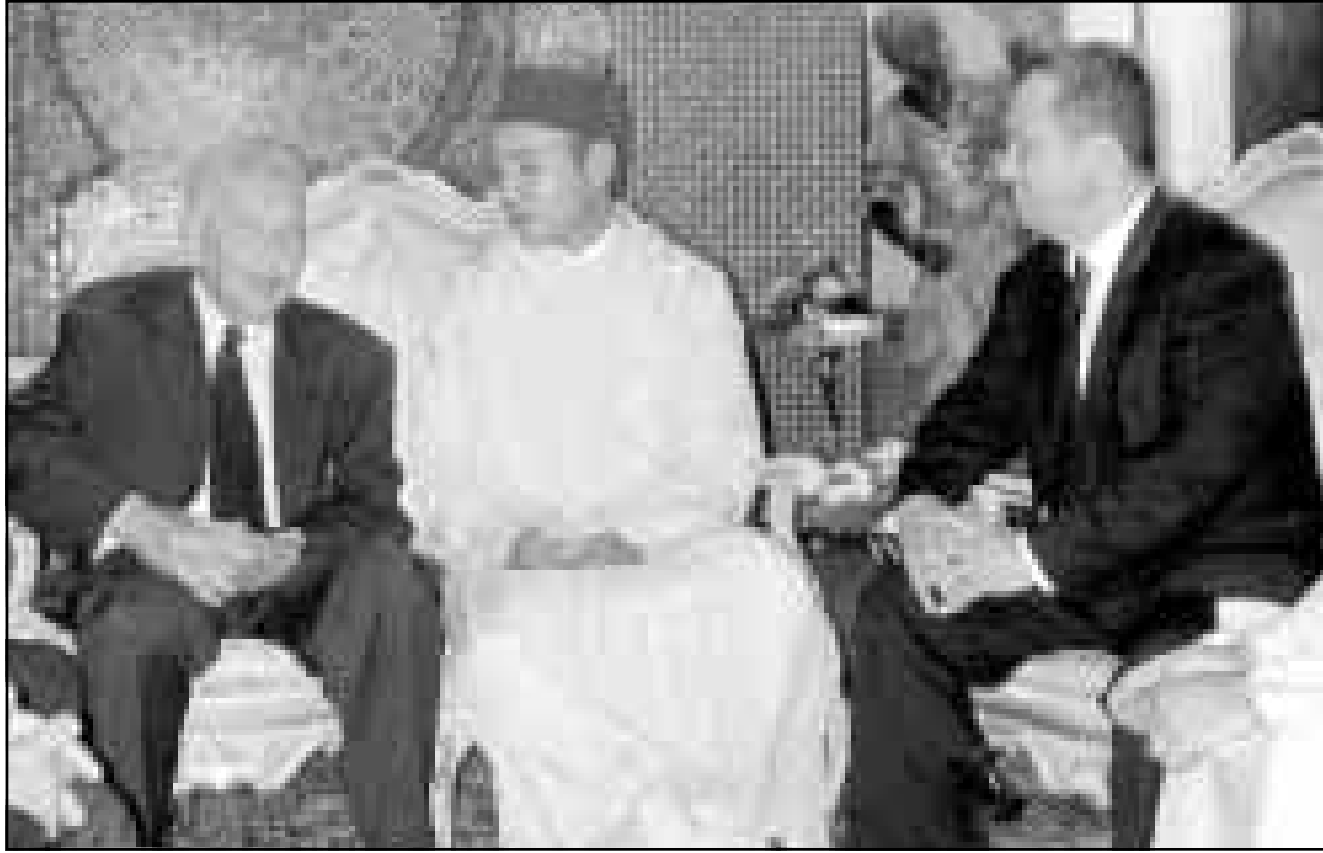
الملك محمد السادس مستقبلاً الرئيس الإسرائيلي عيزر وايزمن ورئيس الوزراء اليهود براك يوم الأحد بالرباط

لقاؤه مع براك صدم رأياً عاماً تربي على نبل اسرائيل