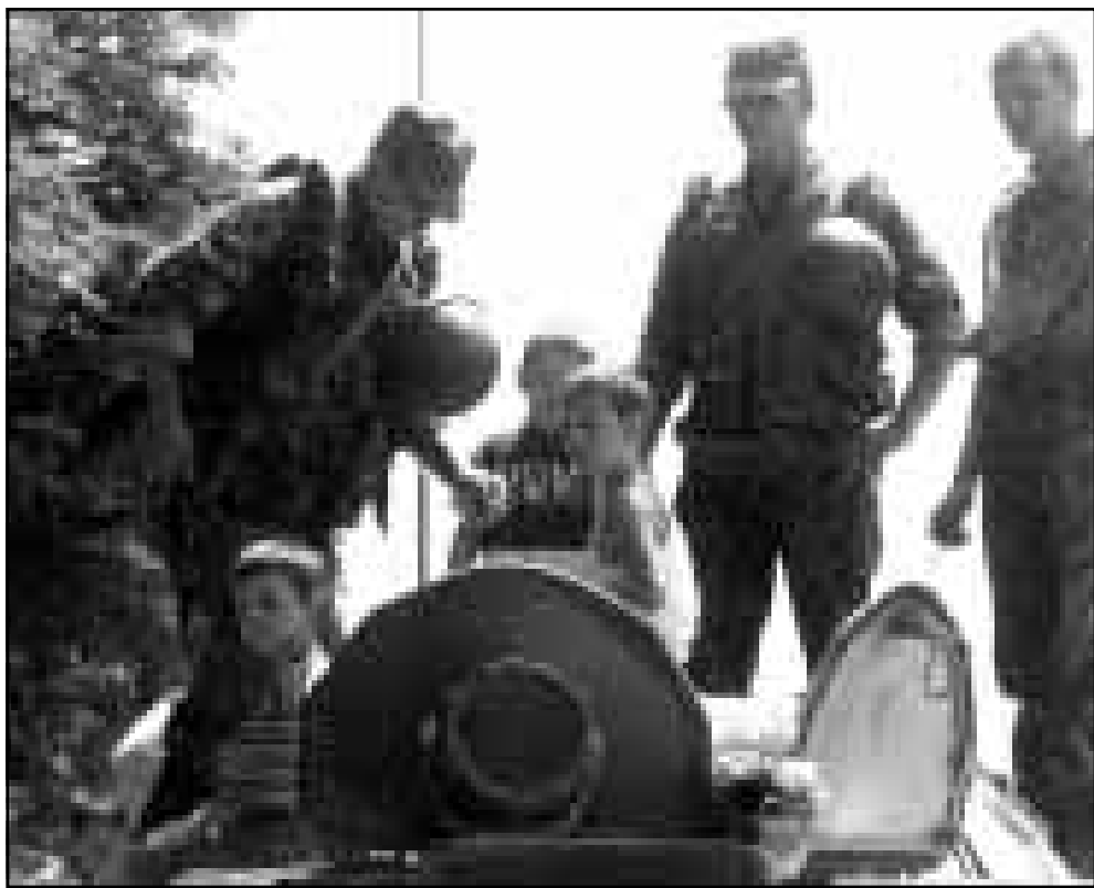
اطفال صرب من كوسوفو يلعبون مع جنود روس

خمس سنوات، تعتبر بلغراد تهديدا لها. ففي الصرب للمصافة المحلية قال وزير الخارجية ماتي غرانيتش اخيرا عن «ميثاق الاستقرار جاء ردا على عدم الاستقرار الذي تعتبر بلغراد نقطة انطلاق».