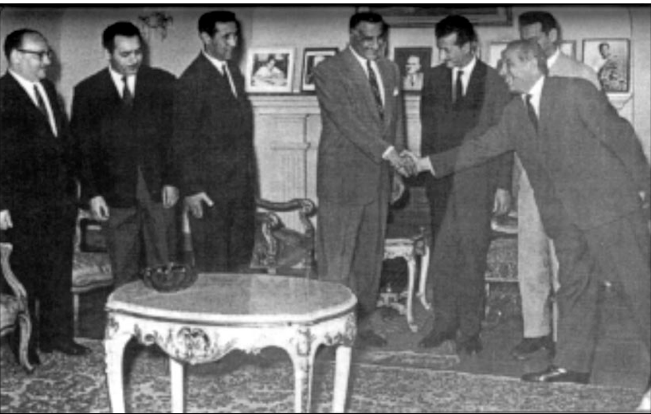
من اليمين الى اليسار: محمد خيضر وحسين آيت احمد ورايح بيطاط وجمال عبد الناصر واحمد بن بله وفتحى الذيب

1- التصثيل النيابي بنسبة مساوية لنسبة تمثيل اوروبا في الجزائر. 2- الاعفاء الفعالي والكامل للقوانين والاجراءات الاستثنائية والحكام القمعية والجنائية والرقابية الادارية، والعودة الى العمل بقانون الحق العام. 3- نفس الواجبات والحقوق التي للفرنسيين فيما يخص المدنية العسكرية. 4- حق الجزائريين المسلمين (الاهالي) في تقلد كافة المناصب المدنية والعسكرية دون تمييز، وغير الاستحقاق والتكافؤ الشخصية. 5- تطبيق قانون اجبارية التعليم تطبيقا كاملا على الجزائريين المسلمين (الاهالي) مع حرية التعليم. 6- حرية الصحافة والاعلام. 7- تطبيق مبدأ فصل الدين عن الدولة على الدين الاسلامي. 8- لغو العام. 9- تطبيق القوانين الاجتماعية والعمالية على السكان (الاهالي). 10) الحرية المطلقة للمحامل الجزائريين (الاهالي) من جميع العنصر في السفر الى فرنسا وكان توقيع الرسالة: الامير خالد من المنفى.