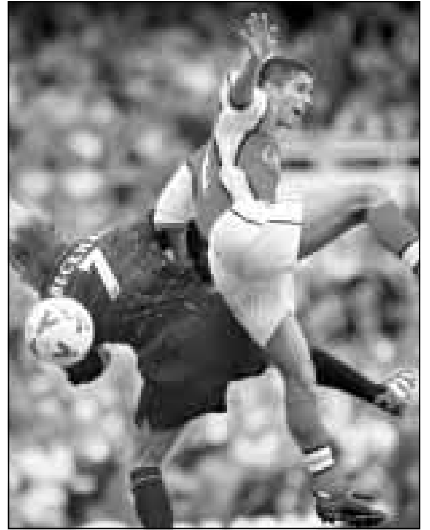
سليفتو لاعب ارسنال (يمين) في منافسة على الكرة مع لاعب يونايتد ديفيد بيكهام