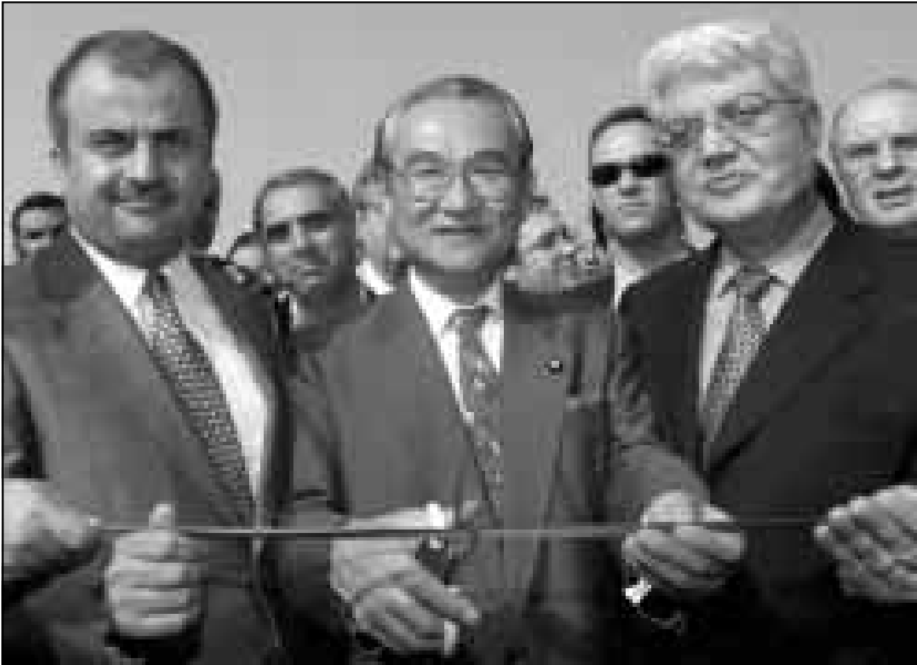
رئيس الوفد البرلماني الياباني كوكي شوما يتوسط وزير الخارجية الإسرائيلي ديفيد ليفي (يسار) ووزير الخارجية الأردني عبد الإله الخطيب اثناء افتتاح جسر الشيخ حسين

■ جسر الشيخ حسين (الحدود الأردنية الإسرائيلية) - أ. ف. ب. دعا وزير خارجية اسرائيل ديفيد ليفي أمس الاثنين لبنان الى الدخول في سلام مع اسرائيل، وذلك لدى مشاركته في افتتاح جسر الشيخ حسين الواقع على الحدود المشتركة بين البلدين.