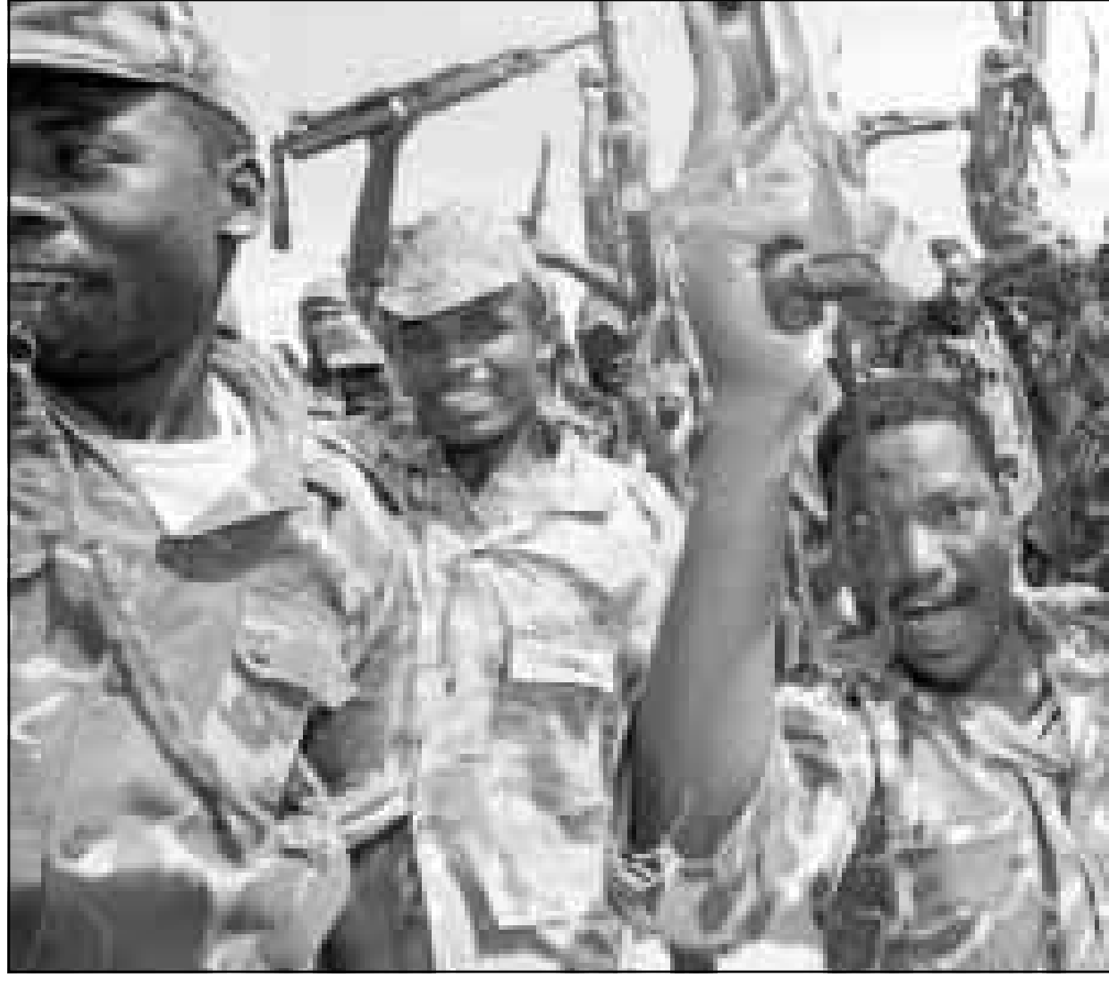
مقاتلون تابعون لحركة التمرد في جنوب السودان

وكان المهدي والعقباني، القريبان بالمصاهرة، قد التقيا في العاصمة اريتريّة أسمرة التي زارها وزير الاعلام السوداني خلال انعقاد