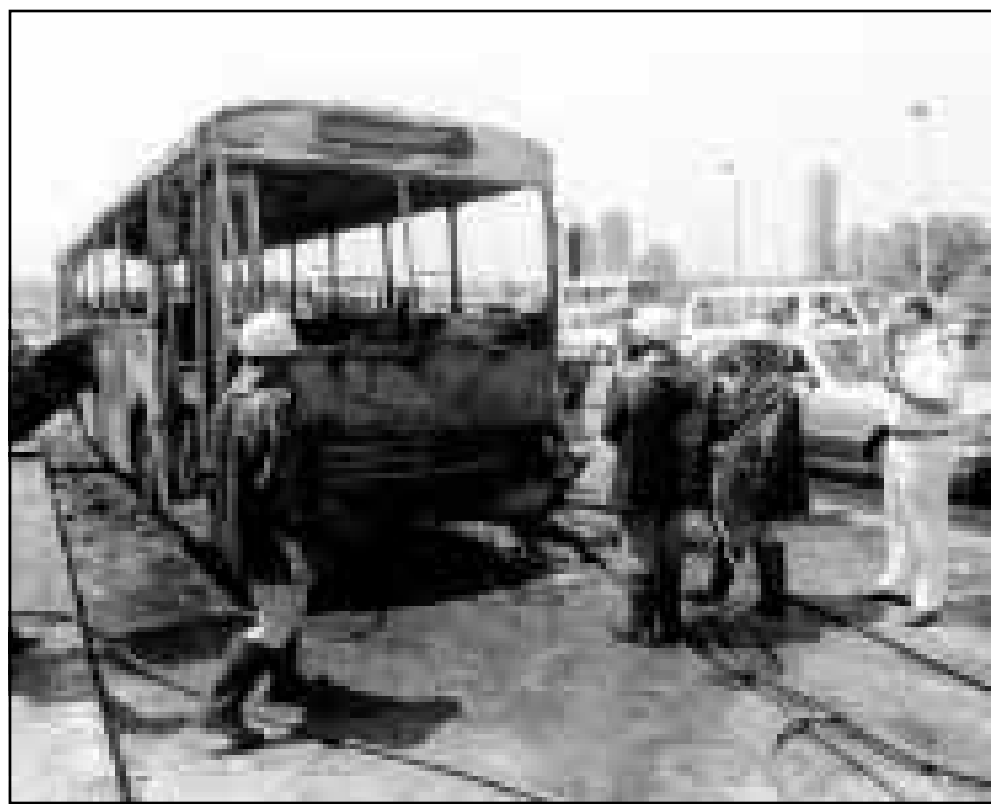
باص في وسط القاهرة اشتعلت فيه النيران بسبب الطقس شديد الحرارة حسب التقارير الاولى عن الحادث

وقال ان عدد من العلماء الاجانب والمؤسسات