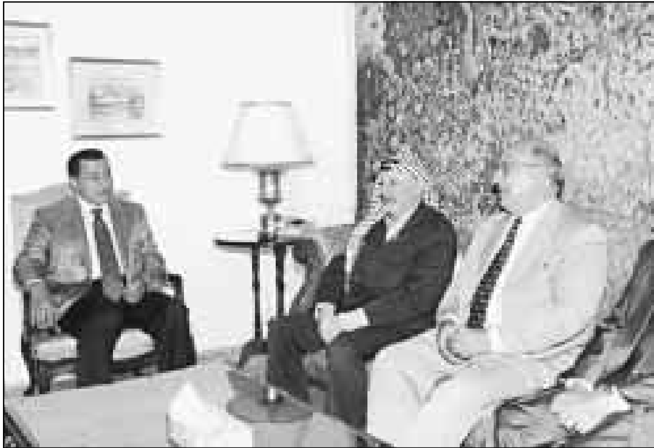
الرئيس مبارك لدى لقائه بالرئيس عرفات ونبيل شعث بالاسكندرية امس الاول

وامس الاول بان الفلسطينيين متمسكون بتطبيق اتفاق واي ريفر كاملا بحلول 30 تشرين الثاني (نوفمبر) بينما تسعى اسرائيل الى تأخير هذا الموعد الى 15 كانون الثاني (يناير). وارجات اولبرايت زيارة كانت مقررة وطالب باراك من واشنطن عقب فوزه في الانتخابات لتقليص دور الوسيط الذي لعبته في عملية السلام خلال فترة رئاسته ننتهايو للحكومة الاسرائيلية (مايو). وقال دبلوماسي غربي ان الفلسطينيين ياملون في مساندة اولبرايت في التوصل الى اتفاق.