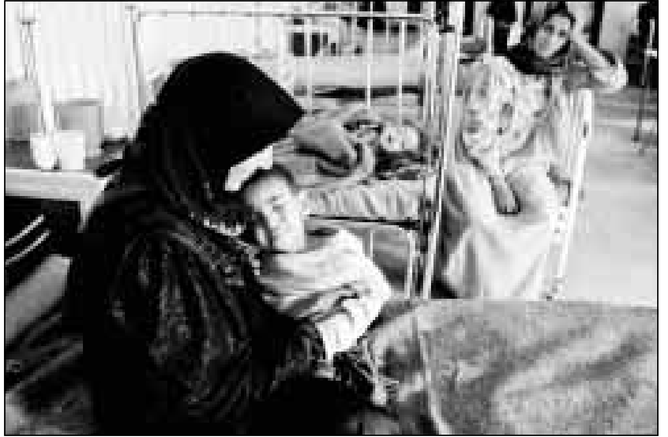
سيدة عراقية مع طفلها في مستشفى بغداد

المسؤولين والمفتشين في هيئة الامم المتحدة، ورغم ما قدمه العراق من تعاون وصدق في التعامل الا ان الولايات المتحدة الامريكية لا تزال تصر على تدمير شعب العراق باطفاله ونسائه وشيوخه، وذلك من خلال استمرار الحصار الجائر المفروض عليه، والذي دخل عامه العاشر، ومن خلال الضربات والغارات الامريكية والبريطانية الكثيفة غير المبررة، والتي تسقط المزيد من الضحايا الأبرياء.