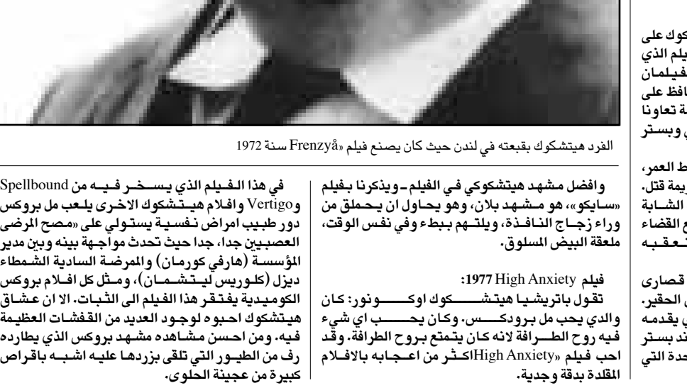
الفرد هيتشكوك بقبعة في لندن حيث كان يصنع فيلم «Frenzy» سنة 1972