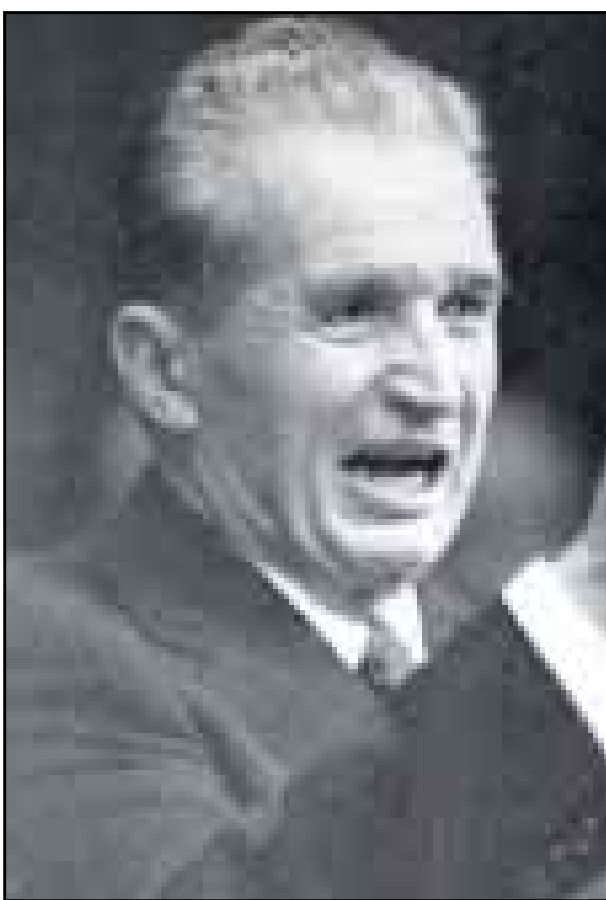
ليو نيد بريجنيف