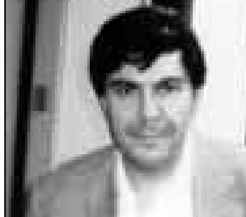
البروفيسور جاك سابير

واعترفت هذه المؤسسة في دراسة نشرت هذا الشهر ان «اسرائيل اصابت بمهية لانطلاق اقتصادية بعد انتخاب ايهود باراك ويفترض ان يبلغ معدل البطالة 3,4 % العام المقبل لاسيما بفضل مناخ سياسي أكثر استقرارا في الشرق الاوسط».