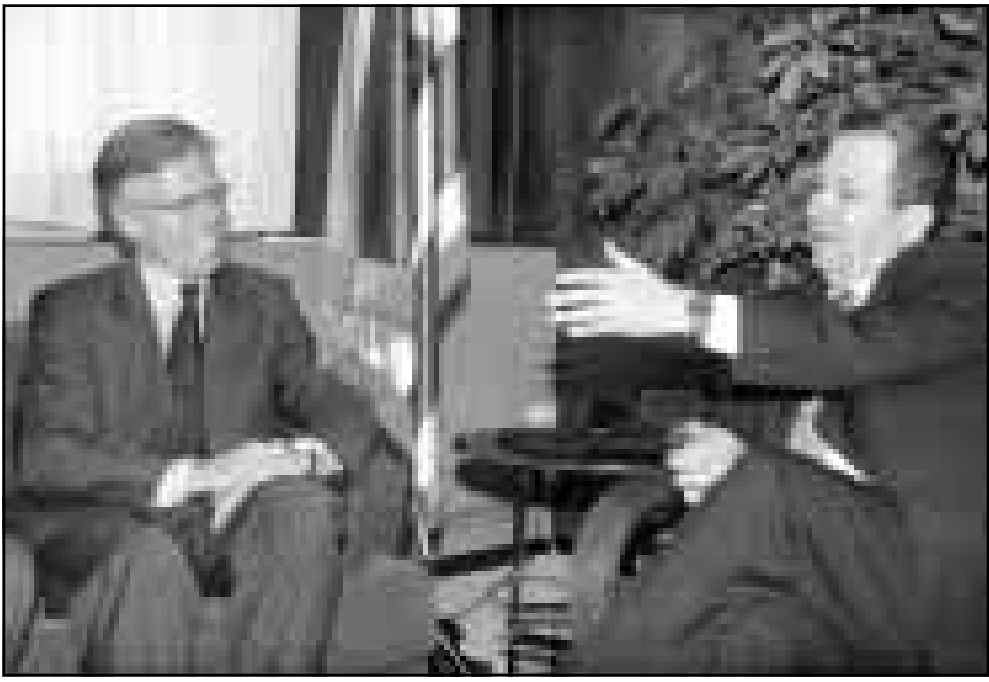
رئيس الوزراء الاسرائيلي لدى لقائه بوزير الخارجية النرويجي