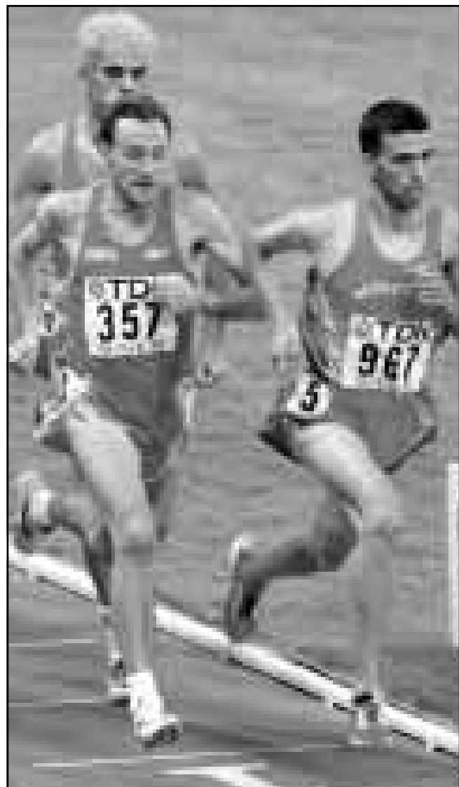
العلاء المغربي هشام الكروج (يمين) يتقدم سباق الـ 1500م