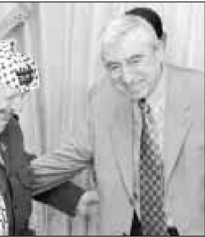
عرفات وحواتمة لدى لقائهما امس

ويتوقع ان يشارك في الاجتماع حزب الشعب الفلسطيني وجبهة النضال الشعبي الفلسطيني وجبهة التحرير العربية. وقال عضو اللجنة المركزية لحركة فتح هاني الحسن ان الجهود قائمة لاتحاد حماس بالمشاركة في اجتماع رام الله.