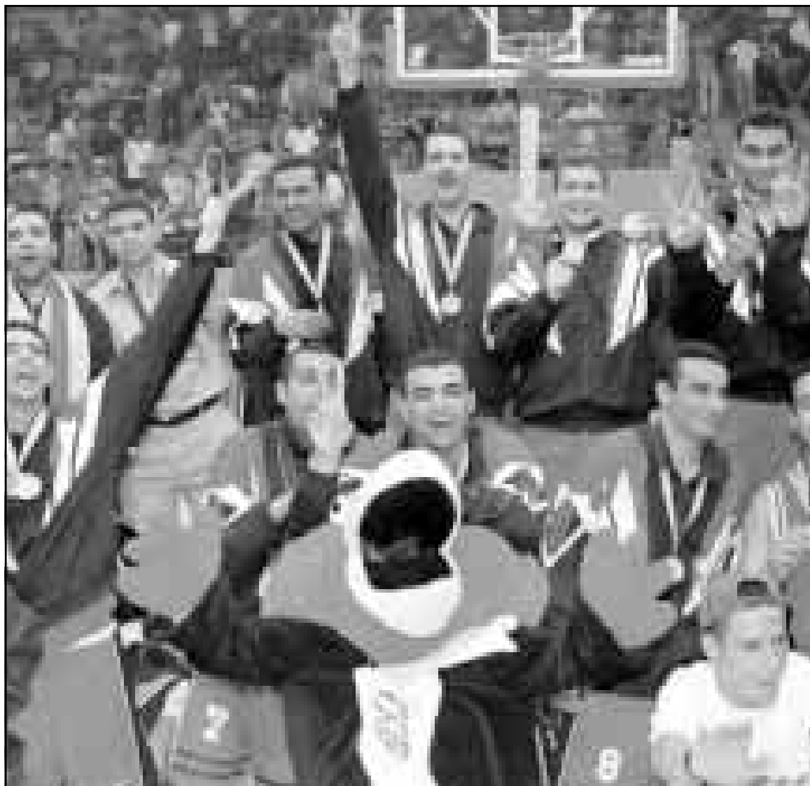
فريق كرة السلة المصري يحيي الجمهور بعد فوزه بالميدالية الذهبية