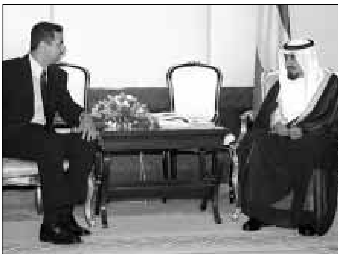
امير الكويت الشيخ جابر الاحمد الصباح استقبله بشار الاسد أمس

جبر التي تطالب مقابل الإفراج عن الرهائن بأن تدفع لها الدولة تعويضات عن السيول التي اجتاحت المنطقة التي تسكنها القبيلة في العام 1996 مما أدى إلى انجراف التربة. وقد تعهدت السلطات آنذاك بمحتمر أربعة جرارات زراعية لكنها لم تدف بالتزامها، بحسب هذه المصادر. وكان الفرنسيان أمضيا عطلة نهاية الاسبوع لدى أفراد من قبيلة الأشرف تلبية لدعوة من هؤلاء. وقد خطف خلال عودتها إلى صنعاء عندما كانا برفقة أحد أفراد قبيلة الأشرف. وقد أطلق الخاطفون سراح المرافق بعد بعض ساعات وقام هذا الأخير بإبلاغ الشرطة بعملية الخطف على الفور. وأشارت مصادر قبيلة إلى ان الخاطفين اعتقدوا أنهم خطفوا الملحق التجاري الفرنسي في صنعاء وزوجته، لكن أمهم خاب. وقد درجت قبائل يمنية على خطف السياح الأجانب للضغط على السلطات. وإعادة ما تنتهي عمليات الخطف هذه بشكل سلمي. لكن في نهاية كانون الأول (ديسمبر) الماضي اختطفت عناصر إسلامية 16 سائحا غربيا قتل أربعة منهم (ثلاثة بريطانيين واسترالي) خلال الهجوم الذي شنته قوات الأمن لاطلاق سراحهم.