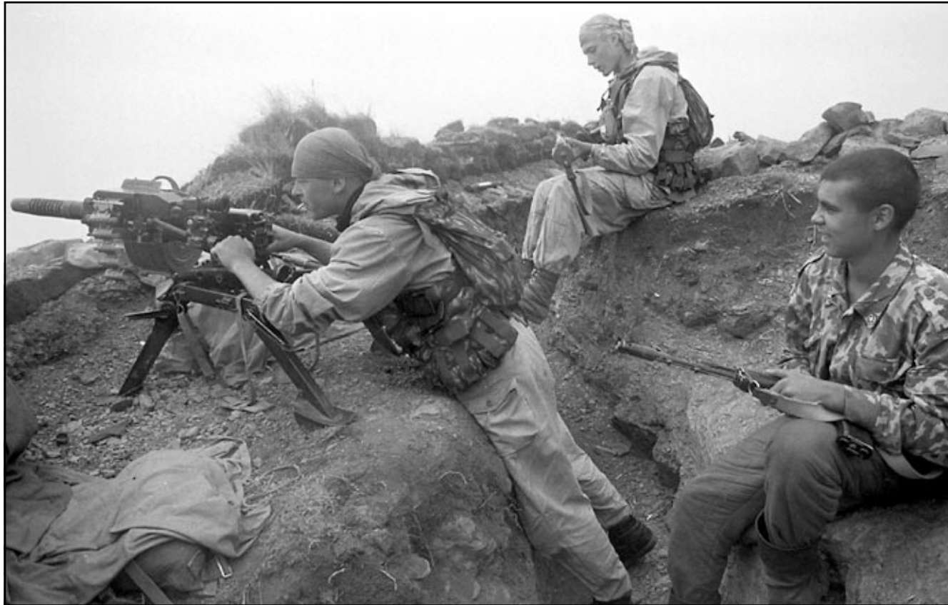
موسكو - غروزي - اف ب - رويترز: توقع مسؤول داغستاني كبير أمس الاثنين حصول تحول قريب في النزاع بين المقاتلين الاسلاميين والقوات الروسية.

وقال محمديف رئيس مجلس الدولة في جمهورية داغستان التابعة للاتحاد الروسي في ختام لقاء مع الرئيس الروسي بوريس يلتسين في موسكو ان الوحدات العسكرية التابعة لوزارة الداخلية والدفاع «شنن حاليا عمليات مكثفة في داغستان، ومن المؤكد ان تحول سيحصل خلال فترة قريبة».