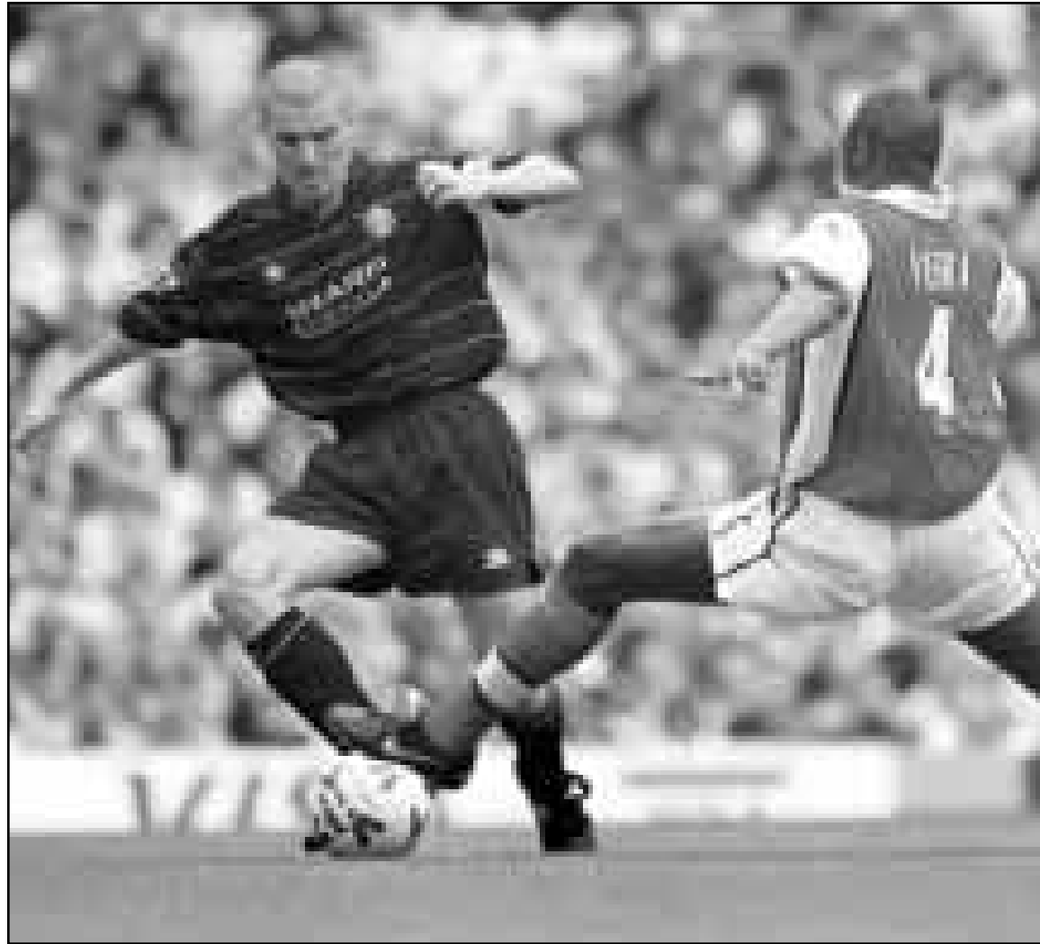
كابتن مانشستر يونايتد روي كين (يسار) يتنافس على الكرة مع لاعب ارسنال باتريك فييرا