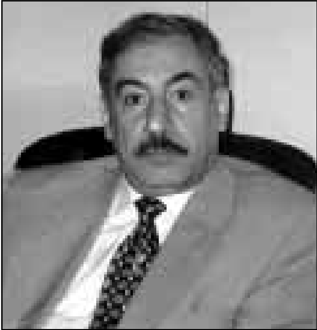
حميد سعيد (القدس العربي)