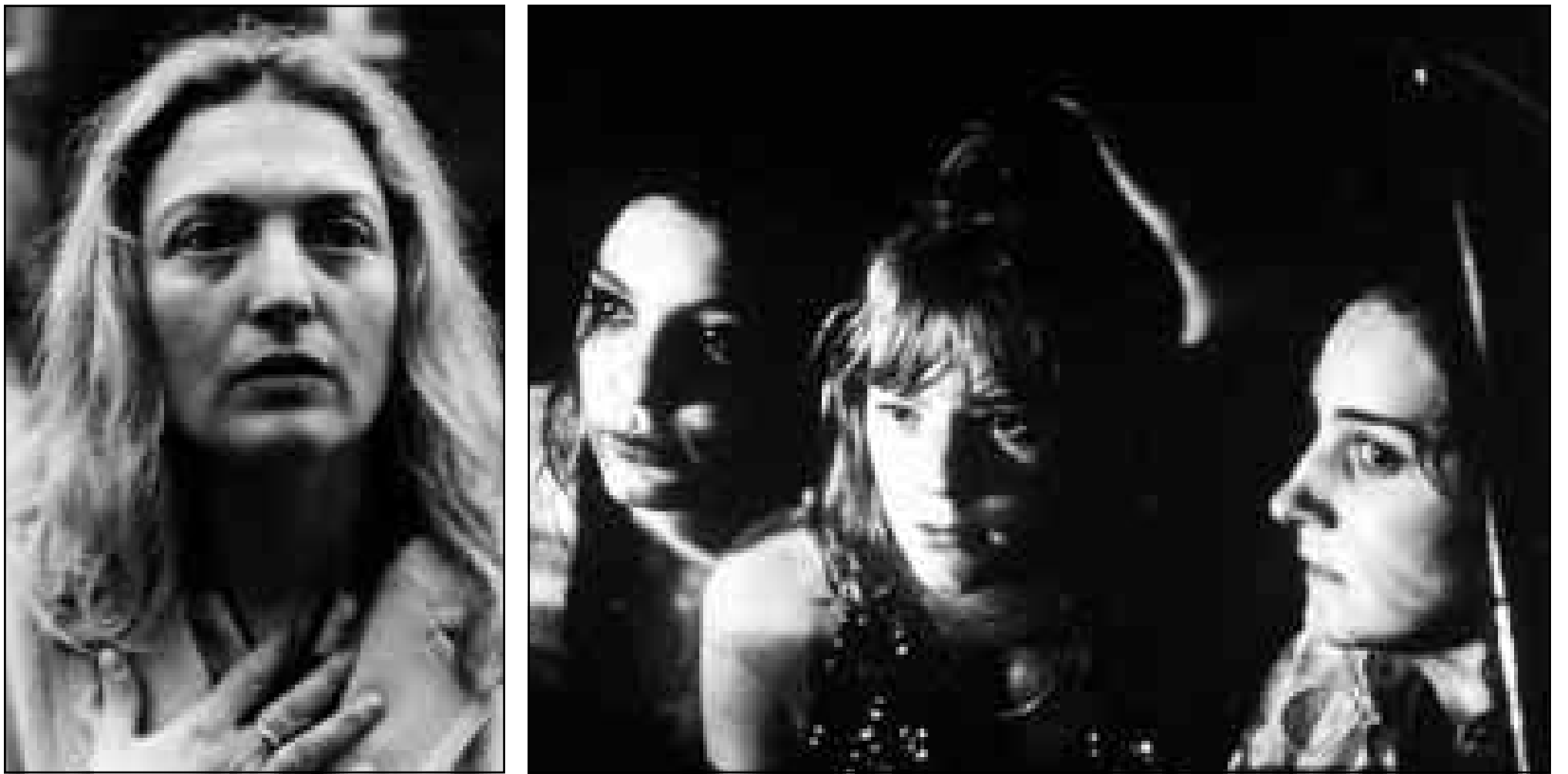
لقطة من فيلم «انا لا تخيفني الحياة»