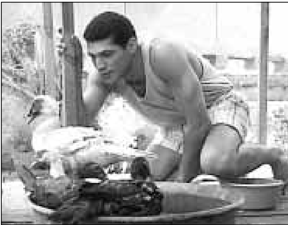
لقطة من فيلم «المدينة»

فمنذ 1996، لم تعد «المسابقة الرسمية» حكرا على الاعمال الأولى والثانية، «السينما الشبابية»، ولكنها تستقبل