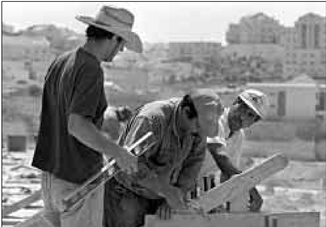
عمال فلسطينيون يعملون في إحدى المستوطنات الاسرائيلية

فرع البناء، مثل الكهرباء ومكيفات الهواء، والتجارة، والهندسة، ويعمل 140 ألف عمال اسرائيلي في هذه المجالات. والعمال الاجانب في قطاع البناء، مثل الكهرباء ومكيفات الهواء، والتجارة، والهندسة، ويعمل 140 ألف عمال اسرائيلي في هذه المجالات التي يخصص للاسرائيليين في مجالات العمل