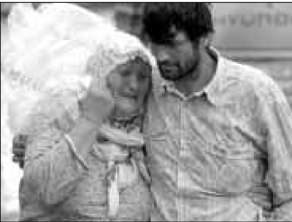
شاب تركي يواسي والدته التي فقدت اقربا لها في الزلزال