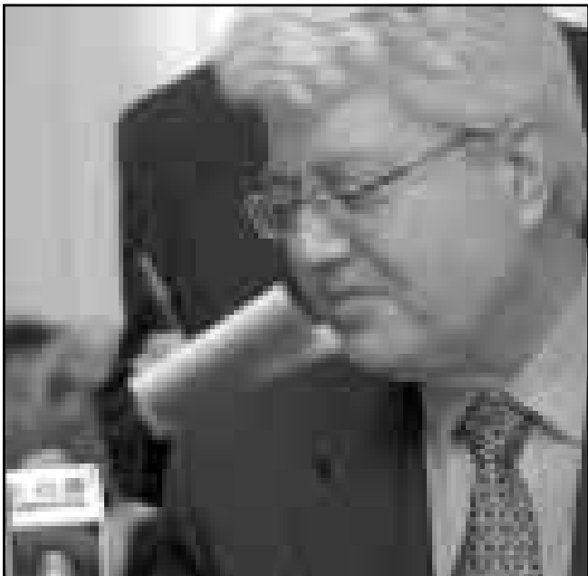
وزير الخارجية الاسرائيلي ديفيد ليفي ينظر الى ميكروفون عليه شعار (ال بي سي) اللبناني أثناء مؤتمر صحافي مشترك في عمان لدى افتتاح جسر الشيخ حسين

وكانت الشرطة اللبنانية قد أعلنت أن الطيران الاسرائيلي اغار مرتين مساء أمس الاول على وديان تقع خارج المنطقة التي تحتلها اسرائيل في جنوب لبنان بعد الهجومين اللذين نفذهما حزب الله الاسرائيلي الشيعي من دون الإشارة الى وقوع ضحايا. وأطلقت مقاتلات اسرائيلية حوالي الساعة 21.00 بالتوقيت المحلي (18.00 ت.ع) ثلاثة صواريخ جو - أرض على واد بين ريفين والشعبية، وهما قريتان تقعان بمحاذاة القطاع الغربي للمنطقة المحتلة. وأوضح المصدر نفسه أنه بعد عشر دقائق على ذلك انطلقت الطائرات الاسرائيلية ثلاثة صواريخ أخرى على الوديان نفسها. ومن جهة أخرى اعتبرت اللجنة الدولية لمراقبة وقف إطلاق النار في جنوب لبنان أمس الاول أن اسرائيل انتهكت ترتيبات تفاهم نيسان 1996 عبر اصابة مدنيين لبنانيين بجروح والحاق اضرار بالبنية التحتية، وهما قريتان تقعان بمحاذاة القطاع الغربي للمنطقة المحتلة. وأوضح المصدر نفسه أنه بعد عشر دقائق على ذلك انطلقت الطائرات الاسرائيلية ثلاثة صواريخ أخرى على الوديان نفسها. ومن جهة أخرى اعتبرت اللجنة الدولية لمراقبة وقف إطلاق النار في جنوب لبنان أمس الاول أن اسرائيل انتهكت ترتيبات تفاهم نيسان 1996 عبر اصابة مدنيين لبنانيين بجروح والحاق اضرار بالبنية التحتية، وهما قريتان تقعان بمحاذاة القطاع الغربي للمنطقة المحتلة. وأوضح المصدر نفسه أنه بعد عشر دقائق على ذلك انطلقت الطائرات الاسرائيلية ثلاثة صواريخ أخرى على الوديان نفسها.