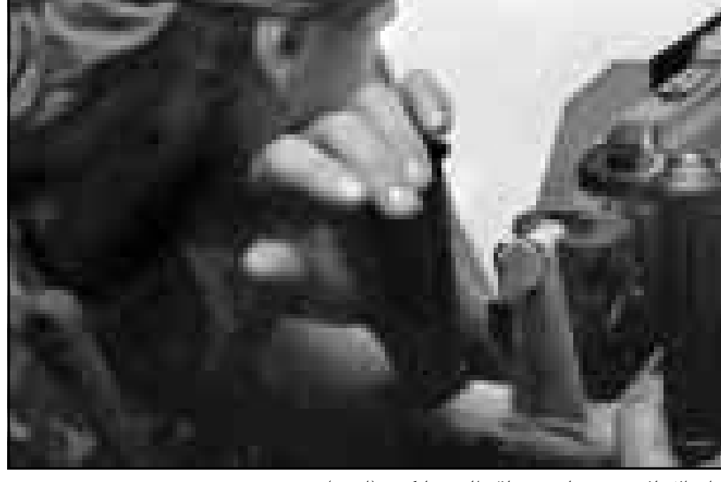
جندي روسي يراقب مواقع الاسلاميين في بولتخ من خلال طائرة هليكوبتر