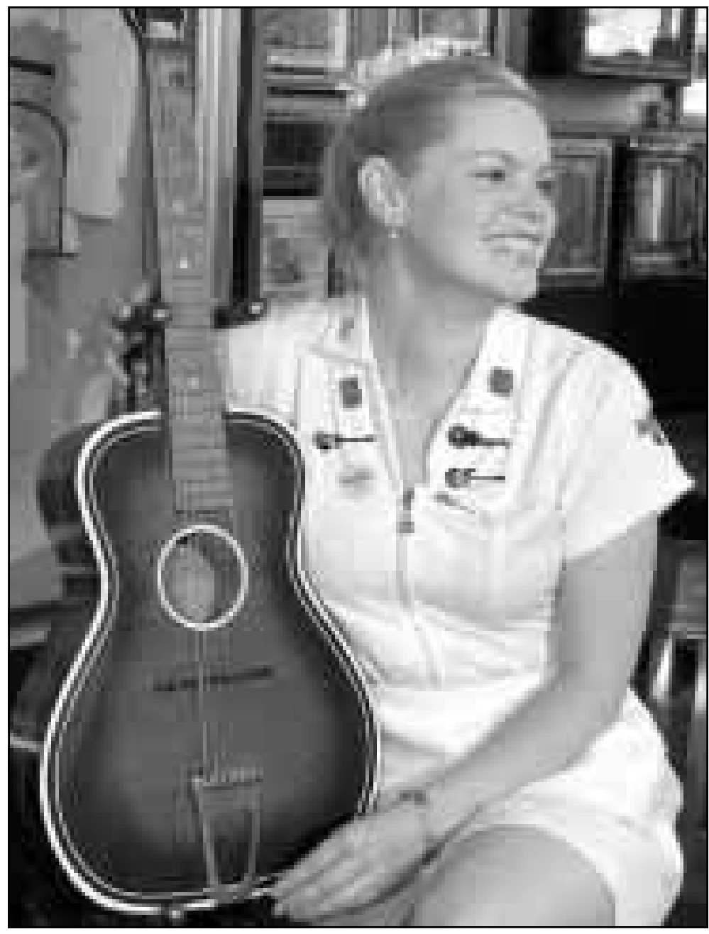
آلة الجيتار التي اشتهرت مع صاحبها الغني والمؤلف البريطاني الراحل جون لينون نجم فريق البيتلز الشهيرة عرضت للبيع في المزاد العلني في مقهى ومطعم هارول لندن امس

واضافت ان احد المعتقلين اعترف بتهرب 272 كيلوغرام من الهيروين وائف كيلوغرام من الافيون.