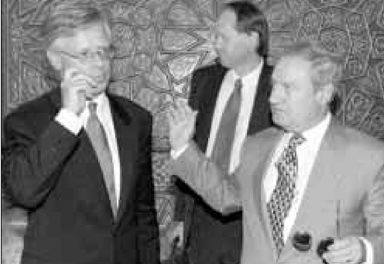
وزير الخارجية السوري فاروق الشرع لدى استقباله نظيره النرويجي امس

واكد فولبيك انه «مفتائل لانتي لمست ودية وتصميم من الجانب الاسرائيلي» للتوصل الى سلام مع سورية عربيا عن