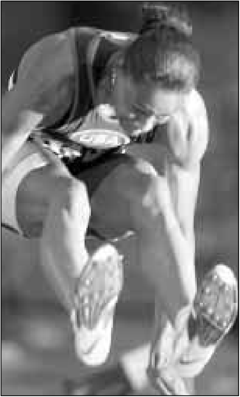
العداءة الأمريكية ماريون جونز