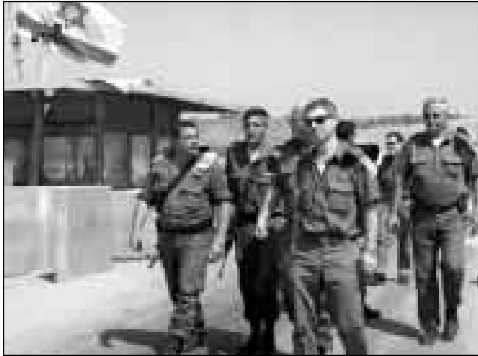
مسؤولون اسرائيليون يتفقدون حاجز ترقوميا قرب الخليل تمهيدا لافتتاح الممر الأمن