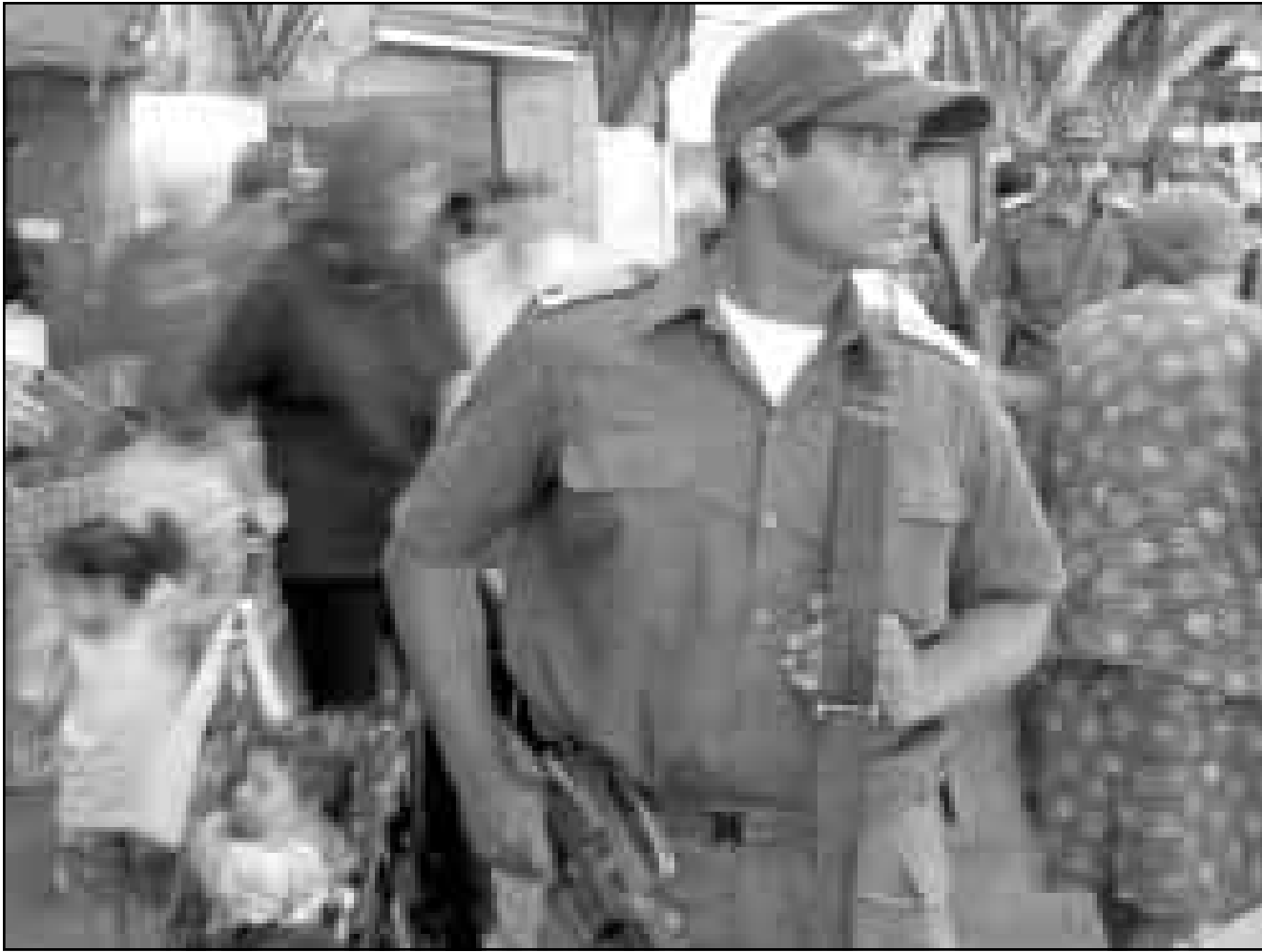
شرطي اسرائيلي يتجول في سوق الخضرة في القدس الغربية في حلة الاستنفار التي أعلنتها اسرائيل امس

يهود فيلك «نحن نقدر ان هناك دافعا للشرطة من جهتها كل ما يلزم للحلولة واستعدادا لتنفيذ هجمات، ولذلك يجب مواصلة اليقظة والجهود واستعمل