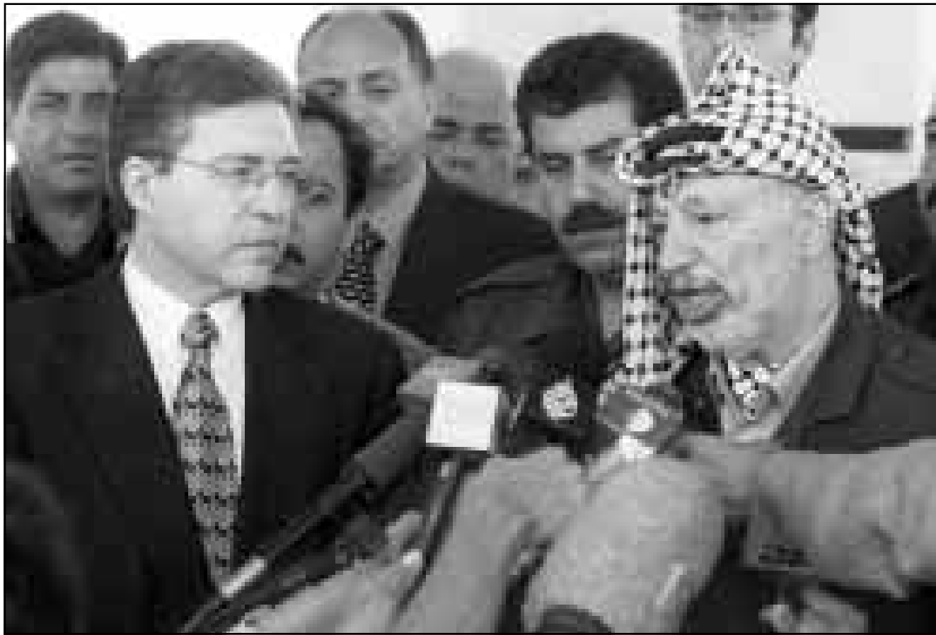
الرئيس الفلسطيني ياسر عرفات ووزير العدل الاسرائيلي يوسي بيلين يتحدثان للصحافيين بعد اجتماعهما امس في غزة

وتابع المصدر «كما دعمتهم رسائل التعليمات بعد الاستمرار في تنفيذ العمليات بعد التوصل الى اتفاق وذلك لتعطل تنفيذ». وشددت على ضرورة التنفيذ لان ذلك مهم بشكل ملح لتصير مكتب التنسيق «مكتوب». وعن نتائج الاجتماع قال وزير العدل الفلسطيني فرح ابو مدين للإذاعة العبرية «بعد طول لقطاع لاتخاذ هذه القانونية، وبعد هذه الةة الطويلة، عقد اجتماع جيد جدا مع السيد يوسي بيلين والجانب الاسرائيلي»، وقال ان اهمية اللجنة القانونية تنبع من انها تتعالج يوميا المشكلات اليومية لتلا الطرفين.