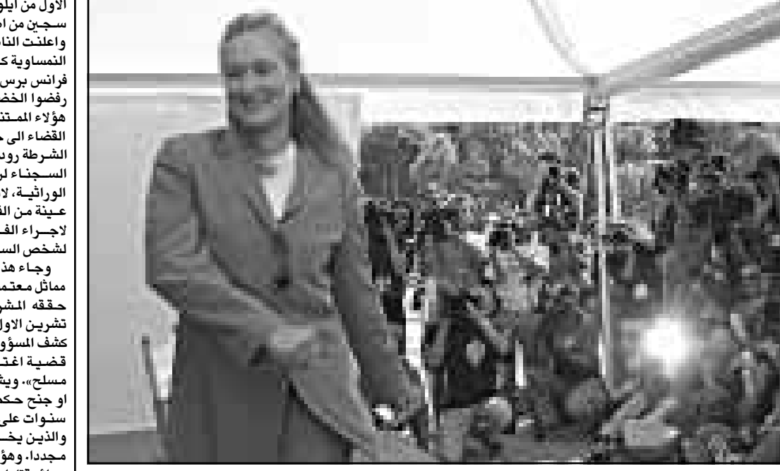
نجمة السينما ميريل ستريب حاضرتها المصورون خلال حضورها مهرجان فينيسيا السينمائي امس

البنديقية - من ابيجيل ليفين: هل تزهت في الجنود؟! وتجولت في ميدان القديس مرقس، وزرت قصر الوجة، اذا شعيت من هذه الروائع فهل لك من زيارة لجانج عكر بعروس البحر ومرتع الرومانسية. وبينما تنساب مشرات من زوارق الجنود السوداء الالمة بين القنوات الراققة تحقل منظمة السلام الاخضر في قوارب رمادية باهنة سياحا في «جولة سامة» الى مجمع بورنو مارغيرا الصناعي على مسافة اربعة كيلومترات فقط من ميدان القديس مرقس. تقول هذه المنظمة البيئية ان الالف الاطنان من النفايات السامة تصب سنويا في البحيرة وتلوث نظاما بيئيا مشا تعيش فيه كائنات بحرية مثل الحمار الذي ينتمي به الطراف على أطباق سيجانتي (مكرونة) بلتيمها السياح. قال لوكا كاردان من السلام الاخضر مشفيرا الى مدامن وبراميل وابراج كهربية وروافع في بورنو مارغيرا حيث مصافي النفط ومصانع البلاستيك، انها لفضيحة وجود صناعات بتروكيماوية في بيئة البحيرة الهشة. صورة قبيحة بعد ما تكون عن الوجه الجميل التي تظهر به البندقية في مهرجان السينما الدولي الشهير. يلعب كاردان دور مرشد سياحي بينما يتزلق القارب على مياه لرجة نحو اكبر مجمع للبترولوكيماويات بشمال ايطاليا، على الجانب الايمن منقذ نفايات لصفاء نطق وعلى اليسار كومة من خردة مستعملة حيث تم اكتشاف نفاث مشعة قبل اربع سنوات حسبما تقول منظمة السلام الاخضر. قال كاردان ان مواقع كثيرة غير مرئية ولكن يمكن رؤية