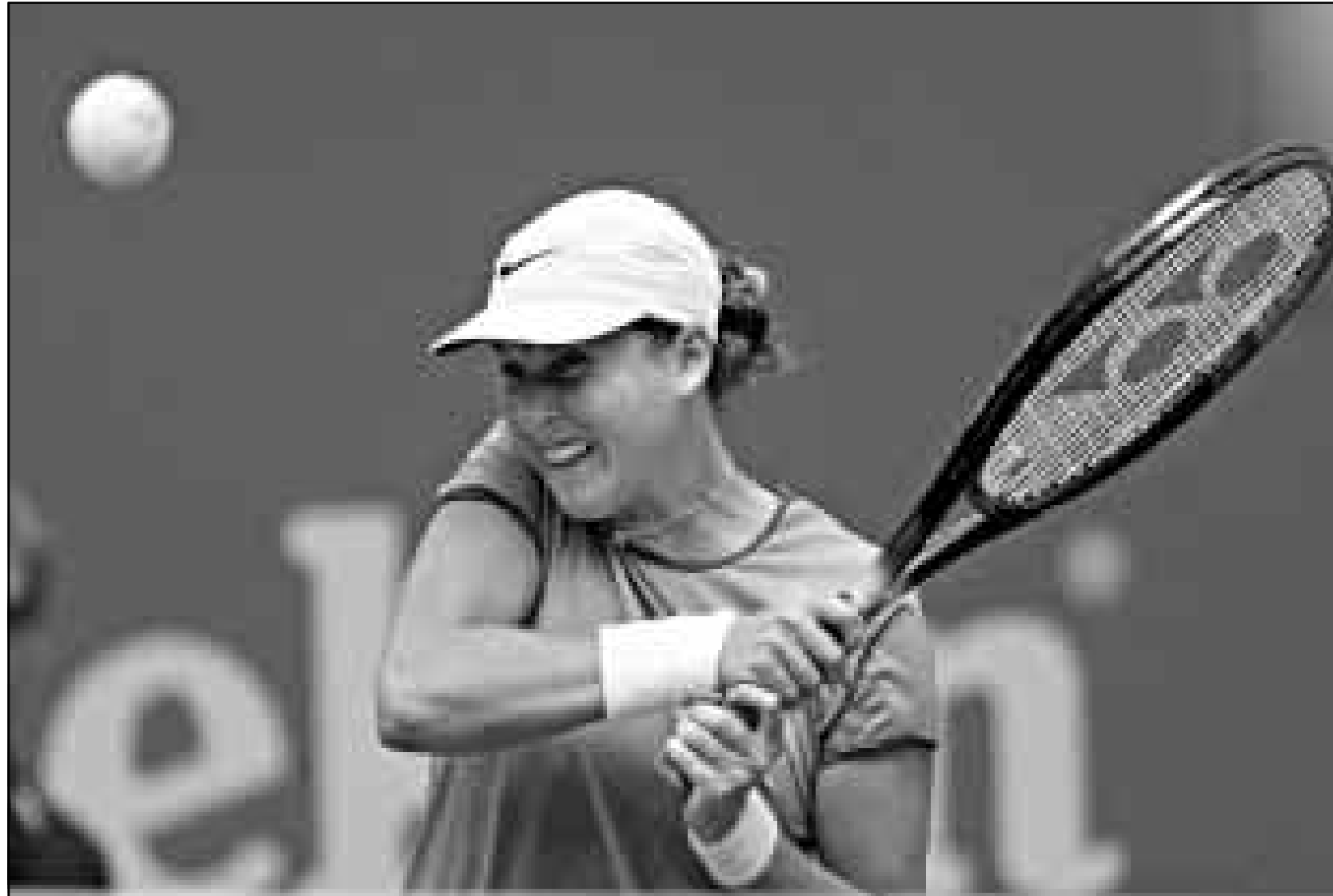
مونيكا سيليش (أف ب)