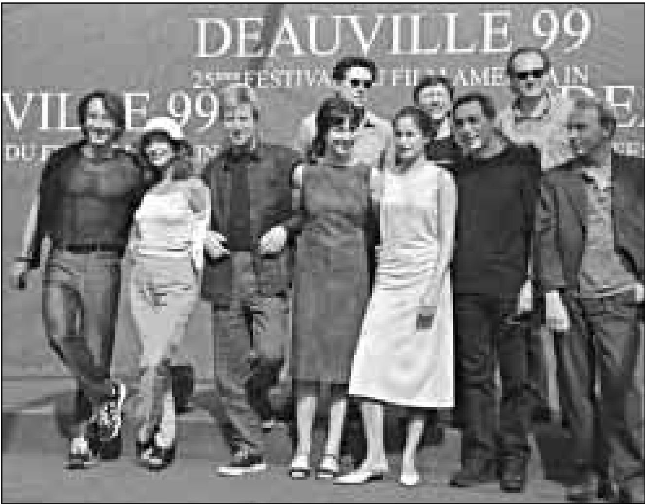
اعضاء لجنة التحكيم في مهرجان دوفيل السينمائي الدولي الخامس والعشرين التقطت لهم هذه الصورة امس قبل بدء اعمال المهرجان وتضمن نخبة من نجوم السينما والتقاد من فرنسا وأمريكا

واضاف المتحدث انه تم اخطار الجهات الامنية المختصة لنقل هذه الذخائر الى مكان امن. وخلال الثورة العربية الكبرى ضد الحكم العثماني التي اطلقها الشريف حسين، الجد الاكبر للعائلة الهاشمية المالكة، اكتسبت الطفيلة اهمية كبيرة من كونها الموقع الوحيد الذي شهد معركة لقات الثورة بقيادة لورانس العرب.