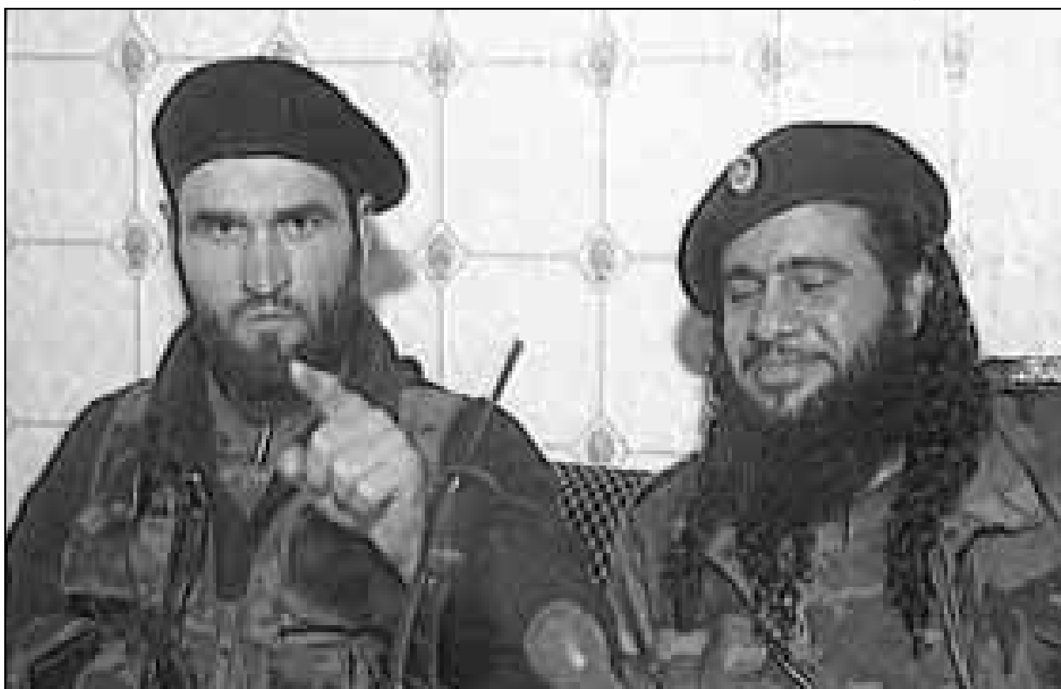
قائد القوات الإسلامية خطاب الارمني (يمين) وزعيم المجهدين الشيشانيين شمائل ياسيف يتحدثان لتلفزيون رويترز (رويتز)