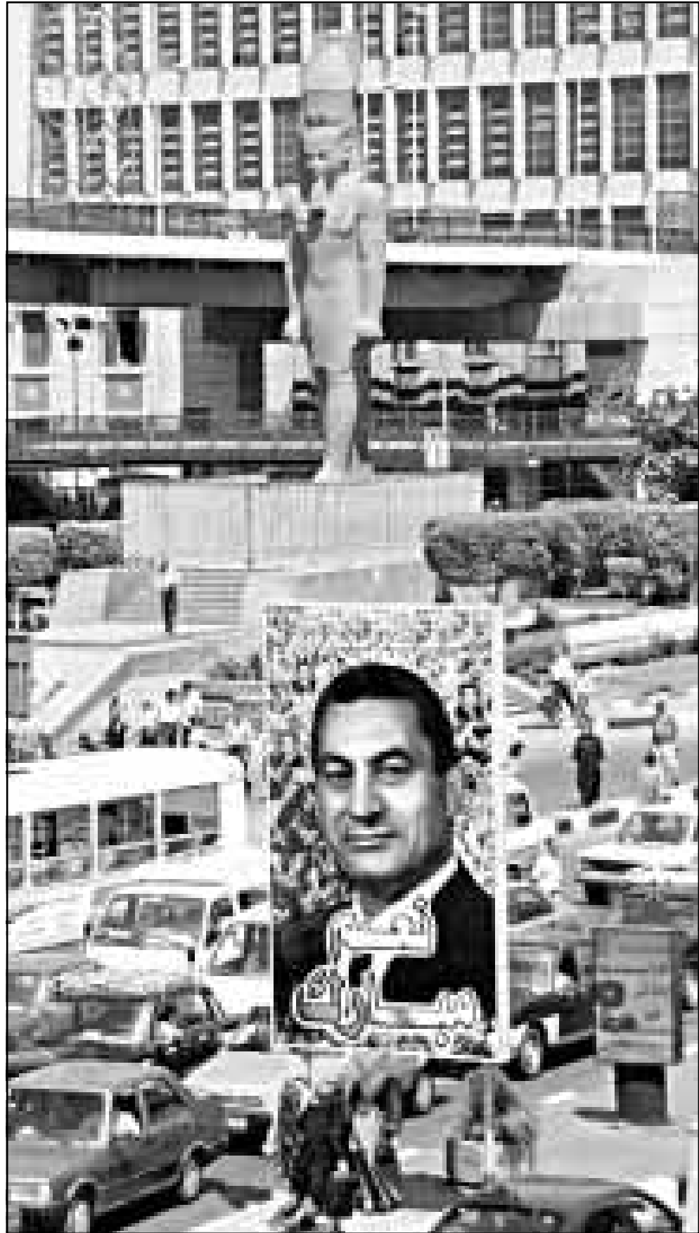
لافتة في ميدان رمسيس بوسط العاصمة المصرية تزيّد فترة رئاسية رابعة لمبارك

■ نيقوسيا - اف ب: تلقى الرئيس المصري حسني مبارك أمس الاثنين عدّة اتصالات من قادة عرب واجانب للاطمئنان على صحته بعد اصابتة بجرح طفيف في يده اثر هجوم تعرض له في بورسعيد (شمال مصر). فقد افادت وكالة الانباء السورية ان الرئيس السوري حافظ الأسد اتصل هاتفياً بالرئيس المصري بعد ظهر اليوم «لاطمئناناً متمنياً له الصحة والعافية ولحصر دوام التقدم والازدهار». ودكرت مصادر فلسطينية مسؤولة ان الرئيس الفلسطيني ياسر عرفات اتصل مساء الاسبوع الماضي بالرئيس المصري، وقالت وكالة الانباء الفلسطينية (وفا) ان اعتقاده في ان التجمع المعارض لن يستطیع التحلي عن قرنق بسبب نقله العسكري والسياسي في المعارضة مشيراً إلى أن موافقة المعارضة السودانية على تنسيق المبادرة مع منبر الإقادة هي موافقة على تدويل المشكل السوداني، لكن على السيد القيادي الاتحادي المعارض في الداخل قال إن تنسيق المبادرة الليبية المصرية المشتركة مع منبر الإقادة أمر وارد في إعلان طرابلس الذي وافقت عليه الحكومة، وأضاف أنه من غير المنطقي أن تحل القضية السودانية في إطار شمالي شمالي دون أن تستوعب قضية جنوب السودان والتي يستوجب معالجتها في إطار حل القضية السودانية برمتها، وأضاف بأن التجمع المعارض وضع مبدأ الدمج في إعلان طرابلس لإضفاء الشمولية نحو الحل السياسي المرتقب في السودان مشيراً إلى أن الدكتور جون قرنق جزء من التجمع المعارض الذي لن يقبل حل إلا بموافقة كافة أطرافه.