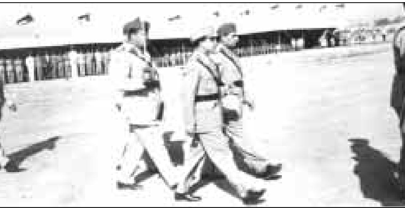
الملك فيصل الثاني مع حرسه

بدأت الجلسة الاولى من المفاوضات كالعادة بمجمات ومقدمات وحكايات ودية قبل الدخول في صلب الموضوع الذي آثاره رئيس الوفد التركي عدنان مندريس، أي موضوع عقد الميثاق في ضوء ما جرى في أنقرة، وما جرى في القاهرة. قال مندريس: