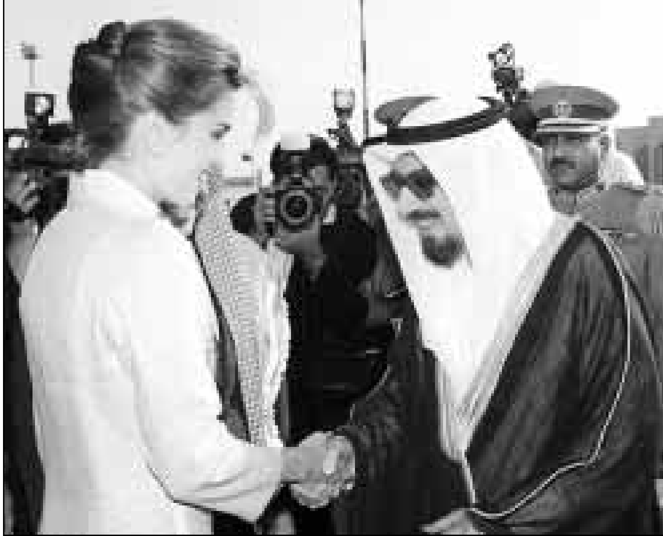
امير الكويت الشيخ جابر الاحمد الصباح يستقبل الملكة رانيا لدى وصولها مع العاهل الاردني الملك عبدالله الثاني الى الاردن امس

ورقة مهمة، فقد اصغر قبل ايام فقط على عقد دورة الحسين الرياضية العربية بحضور العراق، متجاهلا التهديدات الكويتية، وموقفه انتج ازمة داخلية في العائلة الحاكمة هناك، انتهت باستقالة والد الرياضة الكويتية الشيخ احمد الفهد الاحمد، ووضع نظرية «دول الضد» على محك التجربة.