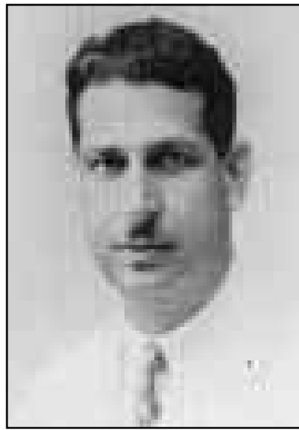
أحمد مختار البايان

(سبتمبر) 1954، واستُقبل بحفاوة بالغة ظهرت في تعليقات الصحف المصرية. فقد كتبت صحيفة «الأخبار» على سبيل المثال لا الحصر مقالاً جاء فيه: إن السيد نوري السعيد من المجاهدين القدماء في سبيل القضايا والأمان العربية... وإن ما يتمتع به في البلاد العربية من سمعة فذة عن قدرته وكنايته وإدراكه لحقائق المسائل، وحسن تصرفه، ومحاولته التوفيق بين التيارات دون تحمس أجوف، أو إندفاع لا يستند على معرفة وثيقة، كل ذلك رصيد عظيم له، وللحادثات التي يجريها في القاهرة، ولكل محادثات أجزاها، أو ينوي أن يجريها في سائر العواصم العربية، تنتظر ليلي ياسين حسين الأمير، دور نوري السعيد في حلف بغداد وأثره في العلاقات العراقية-العربية، رسالة دكتوراه غير منشورة، كلية الآداب/ جامعة البصرة، 1992، ص 191.