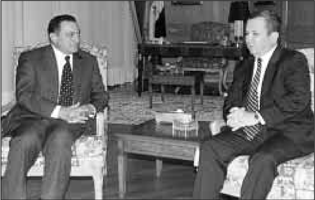
مبارك وباراك اثناء التقاءهما في شرم الشيخ السبت

تخشى من الاندماج في صفقة صربية كلامية للوطن وتساءل: هل غير محتمل كان موجودا في عالم آخر مغاير للفلسطينيين في الدول العربية هذا الوضع الان مغايرا للفلسطينيين في الدول العربية هذا اذا لم يتحدث عن باقي العالم ما زالوا لا يجتنب ولا يريدون حقوقا متساوية هناك والشرائح العليا في تلك الدول لا تريد منحها حقوقا كاملة.