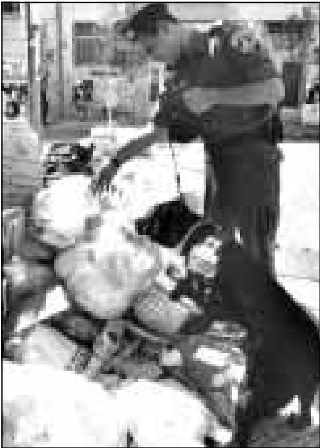
جندي اسرائيلي يخلص موقع نفايات في القدس تحسبا لانفجارات جديدة (ا ف ب)

قرار تنفيذ عملية باي ثمن كما يبدو عبر عن نفسه بعمليات لا تدمر عن خبرة واحد. في الوقت الذي جرت فيه المفاوضات حول تنفيذ اتفاق واي، وطالما كانت ثمة امكانية لان تنتهي بلا وبلاسلات فقد بات واضح ان تاما ان هدف التسوية الدائمة هو اقامة دولة فلسطينية الى جانب دولة اسرائيل وهناك امل محوول ان تقوم هذه الدولة بعد عام. ان سياسة عرفات مجدية، بيضاء ولكن بتبقيات. والمبناه الجديد وفتح الامر الايمن سيخضع للانجاز في الحياة اليومية.