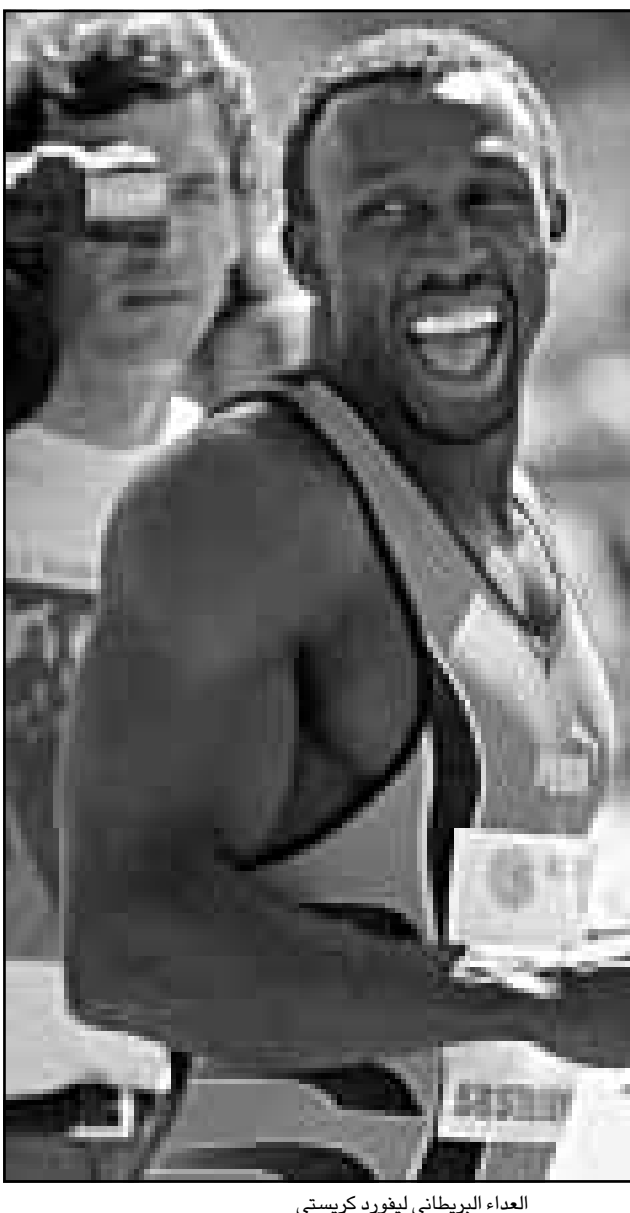
الهداف البريطاني ليغورد كريستي

لندن - رويترز: قالت المجموعة الاعلامية الاسكتلندية امس انها قررت استثمار ثمانية ملايين جنيه استرليني (2.86 مليون دولار) في نادي هارتس في اتفاق قد يجعلها تمتلك في النهاية 37.4 في المئة من النادي الاسكتلندي. وقال النادي انه سينفق معظم المبلغ على النهوض بمستوى فريق كرة القدم وتطوير الناشئين وتحسين الاستاد. وقد أعلن هارتس انه حقق ارباحا قبل الضريبة بلغت 222 الف جنيه استرليني في السنة المنتهية في 31 تموز (يوليو) بعد ان مني بخسارة بلغت 1.94 مليون جنيه في السنة السابقة.