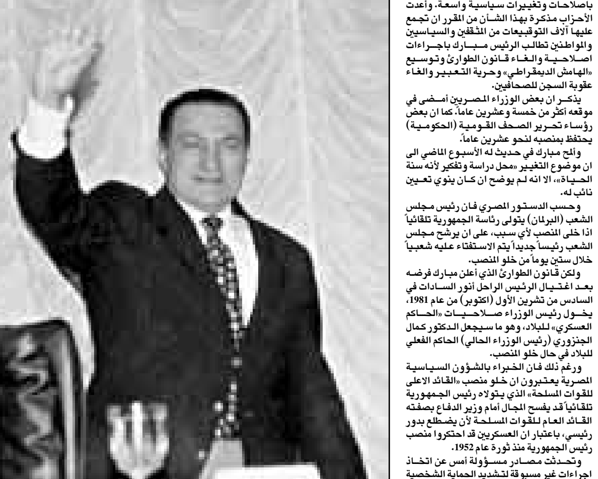
الرئيس حسني مبارك أثناء حضوره مؤتمراً شعبياً في بورسعيد بعد تعرضه لمحاولة الاغتيال امس (رويترز)

باصلاحات وتغييرات سياسية واسعة، وأعدت الأحزاب مذكرة بهذا الشأن من المقرر ان تجمع عليها آلاف التوقيعات من المثقفين والسياسيين والمواطنين طالب الرئيس مبارك باجراءات اصلاحية والغاء قانون الطوارئ وتوسيع «الهامش الديمقراطي، وحرية التعبير والغاء عقوبة السجن للصحافيين. يذكر ان بعض الوزراء المصريين امضى في رؤساء تحرير الصحف القومية (الحكومية) موقع أكثر من خمسة وعشرين عاماً، كما ان بعض الشعب رئيساً جديداً يتم الاستفتاء عليه شعبياً خلال سنتين يوماً من خلو المنصب. ولكن قانون الطوارئ الذي أعلن مبارك فوزه بعد اغتيال الرئيس الراحل أنور السادات في السادس من تشرين الاول (أكتوبر) من عام 1981، يظل رئيس الوزراء صلاححيات - الحاكم العسكري، للبلاد، وهو ما سيجعل الدكتور كمال الجيزوري (رئيس الوزراء الحالي) الحاكم الفعلي للبلاد في حال خلو المنصب. ورغم ذلك فإن الخبراء بالشؤون السياسية المصرية يعتبرون ان خلو منصب القائد الاعلى للقوات المسلحة، الذي يتولاه رئيس الجمهورية تلقائياً قد يفرض المجال امام وزير الدفاع بصفته القائد العام للقوات المسلحة لأن يظل على منصبه، باعتبار ان العسكريين قد احتكروا منصب رئيس الجمهورية منذ ثورة عام 1952. وتحدثت مصادر مسؤوله عن امس عن اتخاذ اجراءات اصلاحية لتقليد الحماية الشخصية المنددة اصلاً للرئيس مبارك.