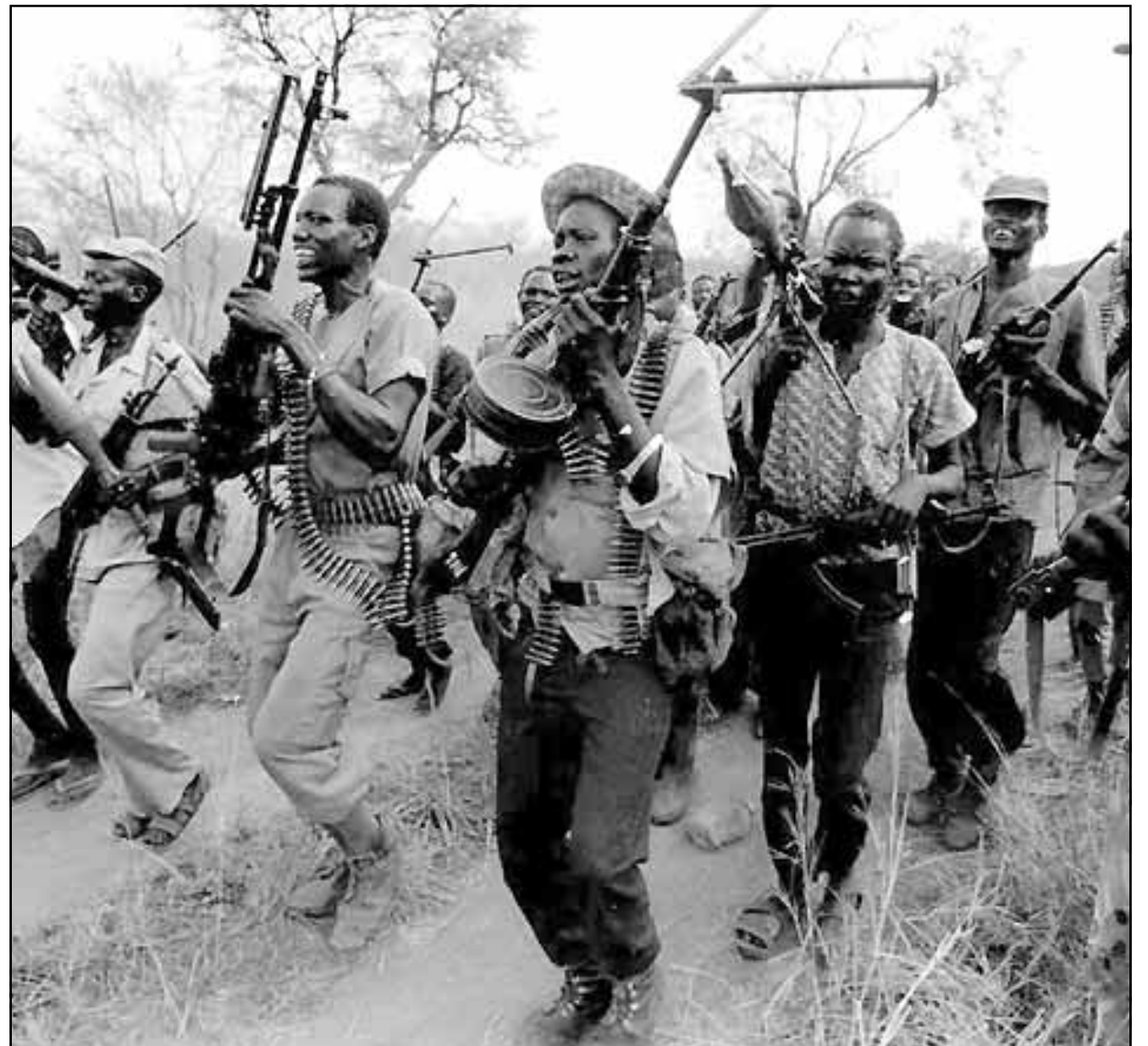
جنود تابعون لحركة التمرد في جنوب السودان

وقد سبق ان تلقى مبارك اتصالات من رئيس الوزراء الاسرائيلي يهود باراك ومن الرئيس الاسرائيلي عيزر وايزن اللذين اعربا له عن التهنية بنجاحته وعن تمنياتهما له بالشفاء العاجل. كما اتصل به المعامل الاردني عبد الله الثاني «لاطمئناناً على صحته اثر حادث الاعتداء الالتهام الذي تعرض له امس». واضافت وكالة الانباء الاردنية ان مبارك اعرب للمعامل الاردني عن «عميق شكره وتقديره على هذه المبادرة الاخوية الكريمة». وكان بيان رسمي صدر في القاهرة اعلن عن اصابة مبارك بجرح سطحي في يده عندما هاجمه رجل باله حادة اليوم اثناء مرور موكبه بشوارع بورسعيد (شمال شرق مصر) خلال زيارة كان يقوم بها للمدينة. واكدت وزارة الداخلية المصرية ان الشخص الذي هاجم مبارك «لا علاقة له باي تنظيمات اسلامية».