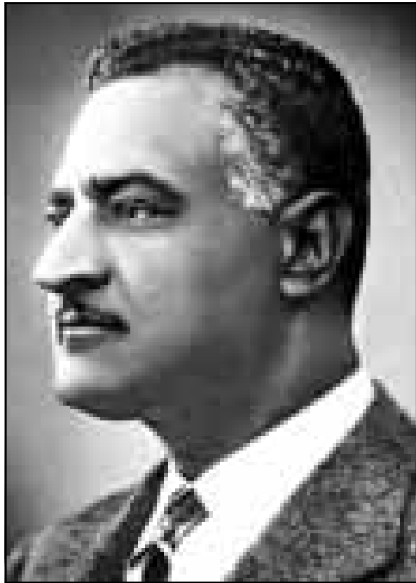
جمال عبد الناصر

عدنان مندريس قال في اجتماعه مع نوري السعيد: لم نأت لبغداد من أجل الولائم ولست حامل كمشكول كما يفعل ذلك الدراويش، جئت لنتباحث والا بأي وجه سوف أقابل الشعب التركي إذا عدت من غير نتيجة