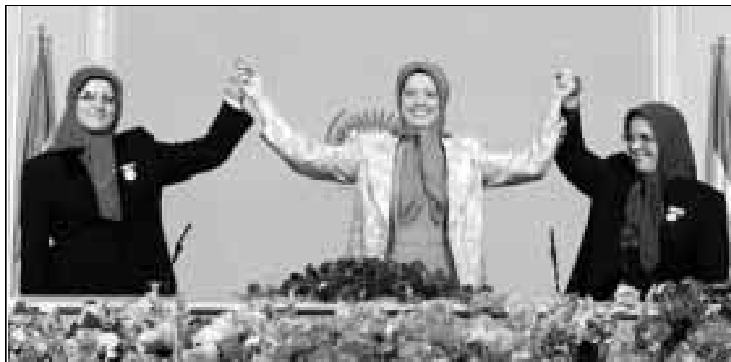
رئيسة المعارضة الإيرانية مريم رجوي بين اثنتين من مساعديها اثناء اجتماع للمنظمة امس

الاردني معه، الان. والعكس بطبيعة الحال صحيح، فاذا كان لدى الامريكية مرحليا اجنحة جديدة، تخص العراق، ومارسوا ضغوطا اخرى على عمان، فان زيارة الكويت، التي بدأت اليوم، قد تشهد تطورا في الاتجاه السياسي المضاد لصدام حسين، من قبل الحكم الاردني، لكن الشرط الموضوعي الوحيد لانجاز ذلك، هو اغلاق ملف الاوضاع الاقتصادية، التي يحتملها العاهل