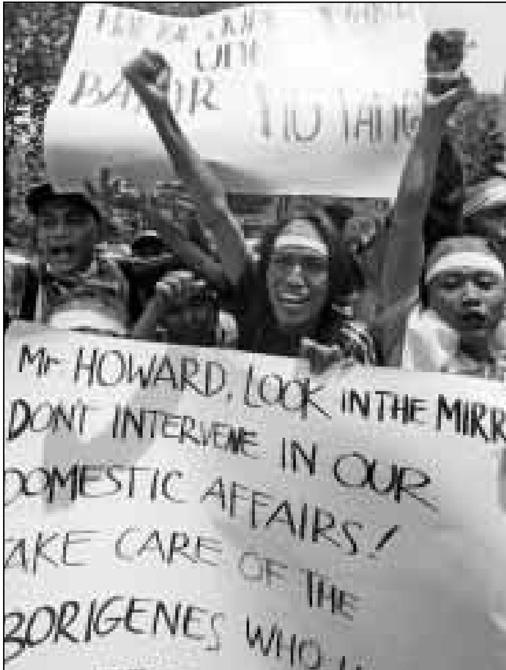
متظاهرون اندونيسيون يرفعون شعارات مناهضة لاستراليا امام سفارتها في جاكرتا أمس