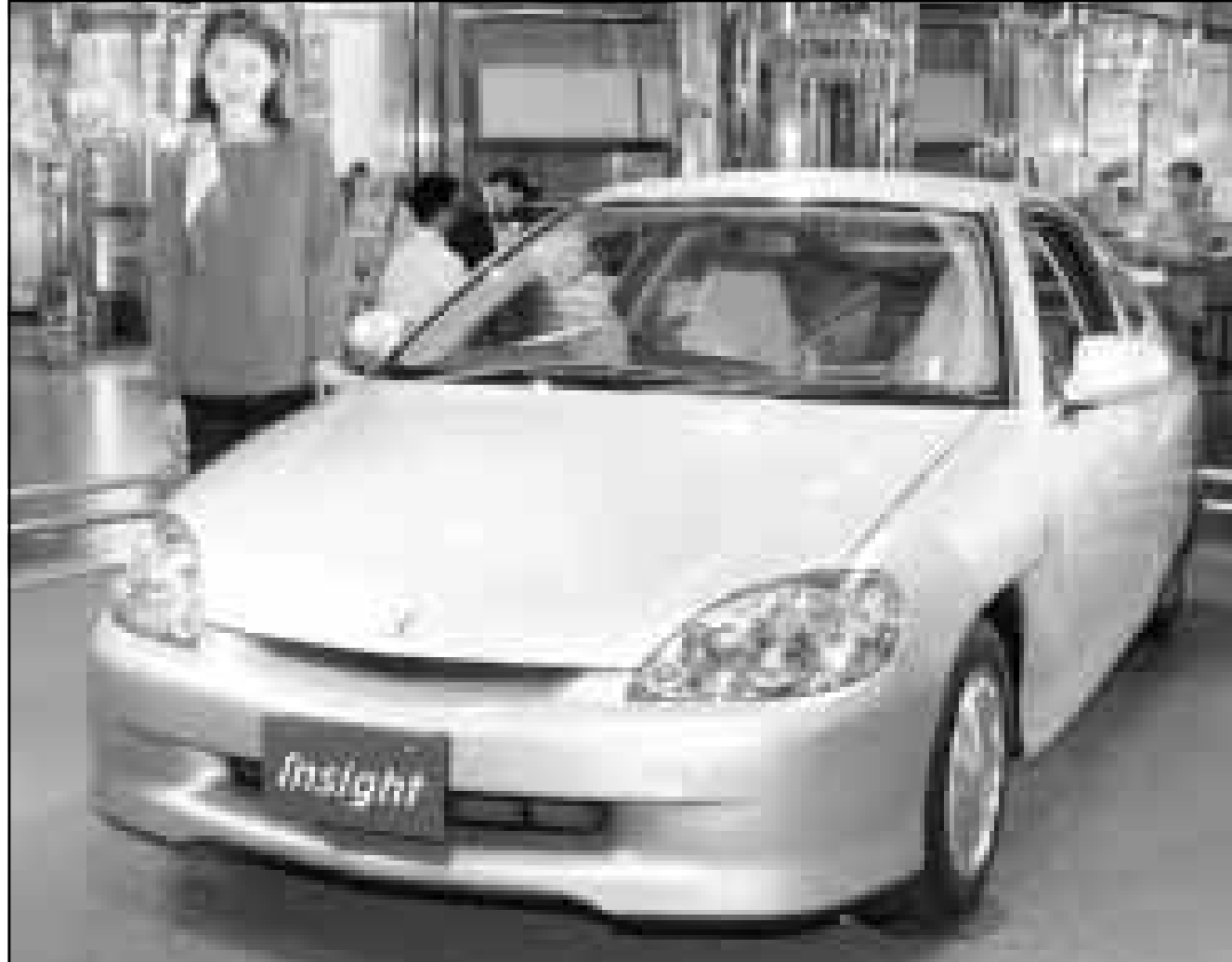
مستخدمة بشركة هوندا اليابانية تقدم اسم في طوكيو سيارة جديدة تحمل اسم (الناسيت) يعتقد انها مكافئة مركبة من نوعها في العالم في مجال استخدام الوقود بفضل بيئتها المصنوع من الالومنيوم ولكن محركها (سعة لتر) يعمل بالبنزين والبطارية. وتقول هوندا انها تستهلك لقطع 35 كلم وسيتم تسويقها في مطلع تشرين ثاني (نوفمبر) القادم بسعر يساوي 19 ألف دولار (ب ا ب)

واضاف لقمان عقب وصوله الى بالي لحضور مؤتمر نفطي في وقت لاحق من هذا الاسبوع ان من اجتماع فيينا بعد اسبوعين.