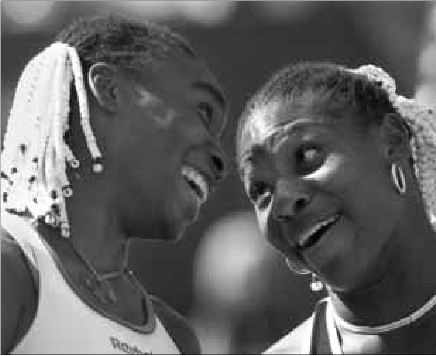
فيونس (الى اليسار) وسيرينا وليامز (رويترز)