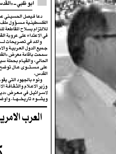
الملك عبدالله والرئيس لحود يرفقان تدريبات عسكرية في لبنان

وقد غادر العاهل الاردني بيروت ظهر امس الثلاثاء في ختام زيارة رسمية استغرقت 24 ساعة في الاولى لعاهل اردني منذ 34 عاما. وكان وزير الخارجية الاردني قد قال امس الاول ان بلاده متفائلة بانه سيتم استئناف مفاوضات السلام المتجمدة بين اسرائيل وكل من لبنان وسورية في المستقبل القريب. واضاف في مقابلة مع رويترز على هامش اول زيارة رسمية يقوم بها العاهل الاردني الملك عبد الله الى لبنان ان جهودا كبيرة تجري لاستئناف المفاوضات ولا يعتقد ان هناك فرصة اكبر الا ان من اجل العمل للاحلال السلام. وقال الدفاع الرئيسي لشقاول الاردن هو توقيع اتفاق واي 2 بين الفلسطينيين واسرائيل الاسبوع الماضي وانتخاب رئيس الوزراء الاسرائيلي الجديد بيهود باراك. وقال الخليل ان الامير قام بهذه المبادرة «بعيد ان اهاب بسمسومه عدد من الشخصيات الفلسطينية والعربية للتدخّل من اجل وقف العرش». واوضح اللبناني ان امينسرا «بدي كل تجاوب، ومؤكد ان شركة ديزني، تعني بالاستثمارات الترفيحية وتجنّب السياسية، وانه «يريد تجنب الخوض في مسألة القدس التي تم تحمس والى سيتم بحث موضوعها في مفاوضات المرحلة النهائية من المفاوضات بين الفلسطينيين والاسرائيليين». وكانت جامعة الدول العربية هدت امس الاول باتخاذ اجراءات ضد شركة التي تبرعت في مجال تعرضت هذه الاخيرة لوضع القدس من خلال السماح بمشارطة اسرائيل في معرضها في فلوريدا بجناح يحمل عنوان «القدس عاصمة اسرائيل». وتشكلت اللجنة لاجراء الامم المتحدة الاضطلاع اللازمة مع وزير ديزني لضمان عدم استغلال اسرائيل للمعرض في اجراءات الشوق الاوسط.