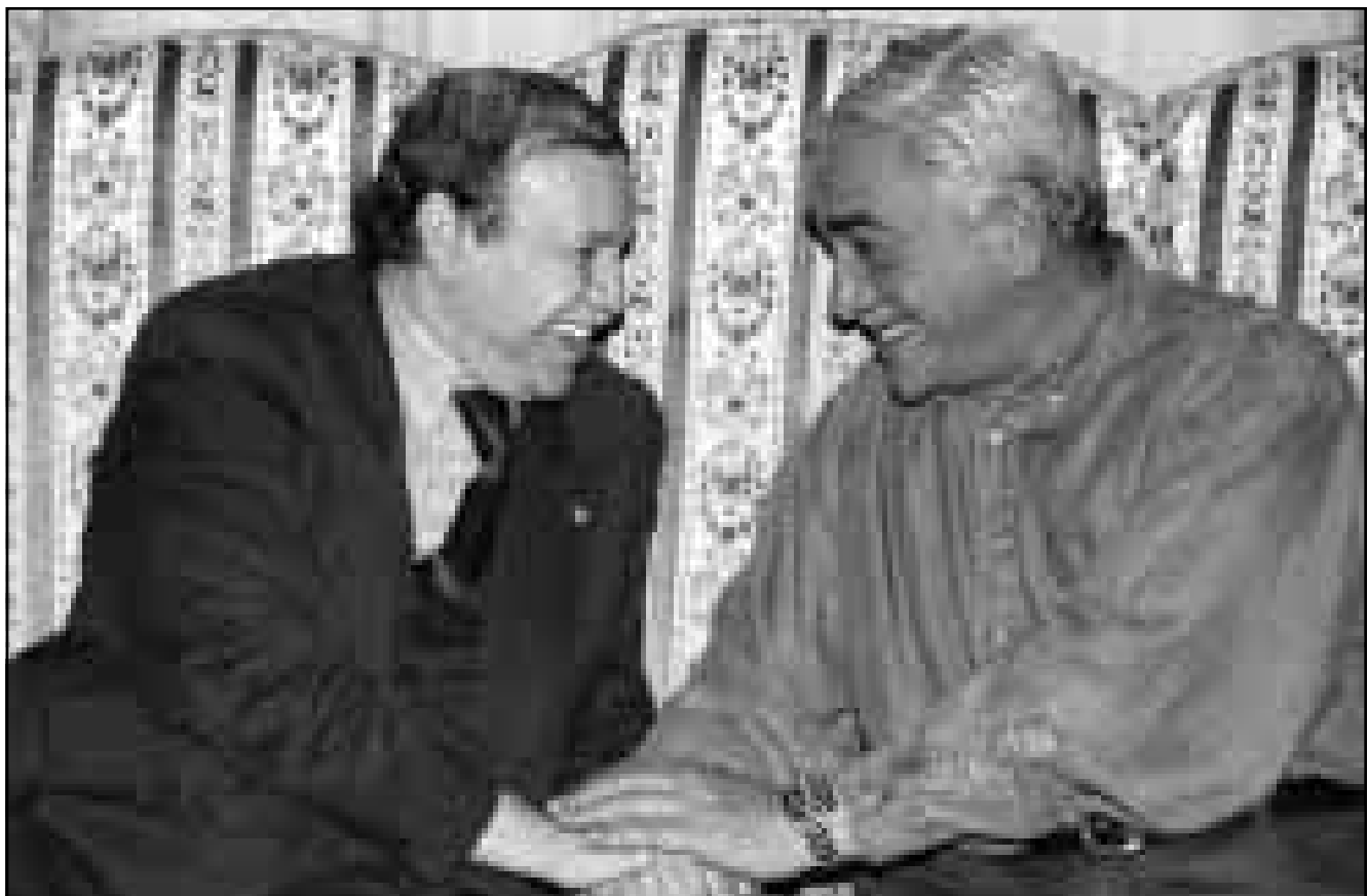
بوتفليقة والرئيس السابق اليمين زروال في لقاء جمعهما بمناسبة زيارة أمس الأولى في مدينة باتنة بسقوط رأس الثاني