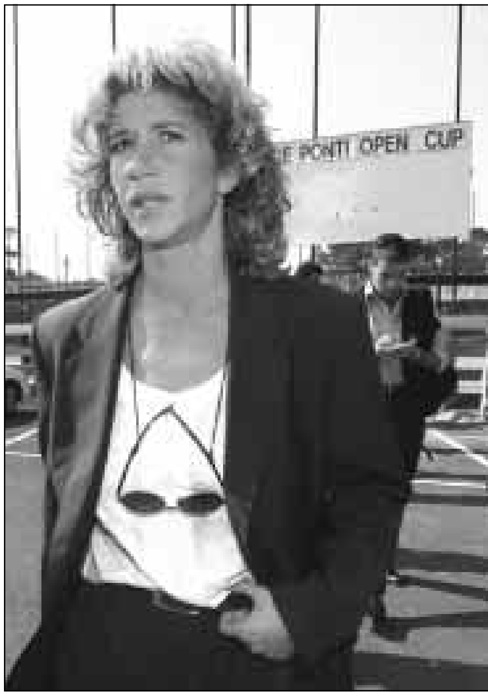
كارولينا ماراس