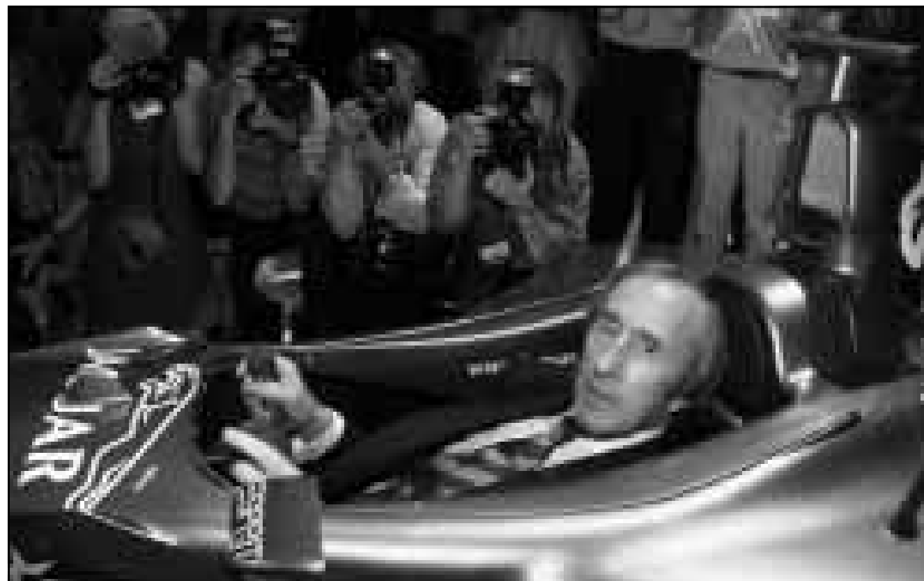
جاك ستياورت بطل العالم السابق لثلاث دورات في سيارة «جاغوار» الجديدة

سباقات مهمة.. وكانت شركة جاغوار لصناعة السيارات ذكرت في بيان وقت سابق من امس انها ستدخل سباقات الفئة الاولى منذ العام المقبل. وقالت جاغوار انها ستحل محل فريق ستياورت/فورد منذ اول سباق وهو سباق استراليا في مليون الذي يقام في اذار (مارس) المقبل ضمن بطولات الجائزة الكبرى. وقال بيان جاغوار «تحتفظ جاغوار بتاريخ عريق مهم في السباقات الرياضية».