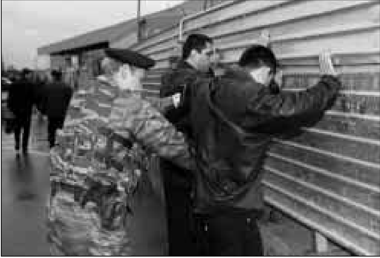
شروطي روسي يفحص مواطنين ضمن الحملة الأمنية التي عززتها روسيا في ضوء التفجيرات الأخيرة