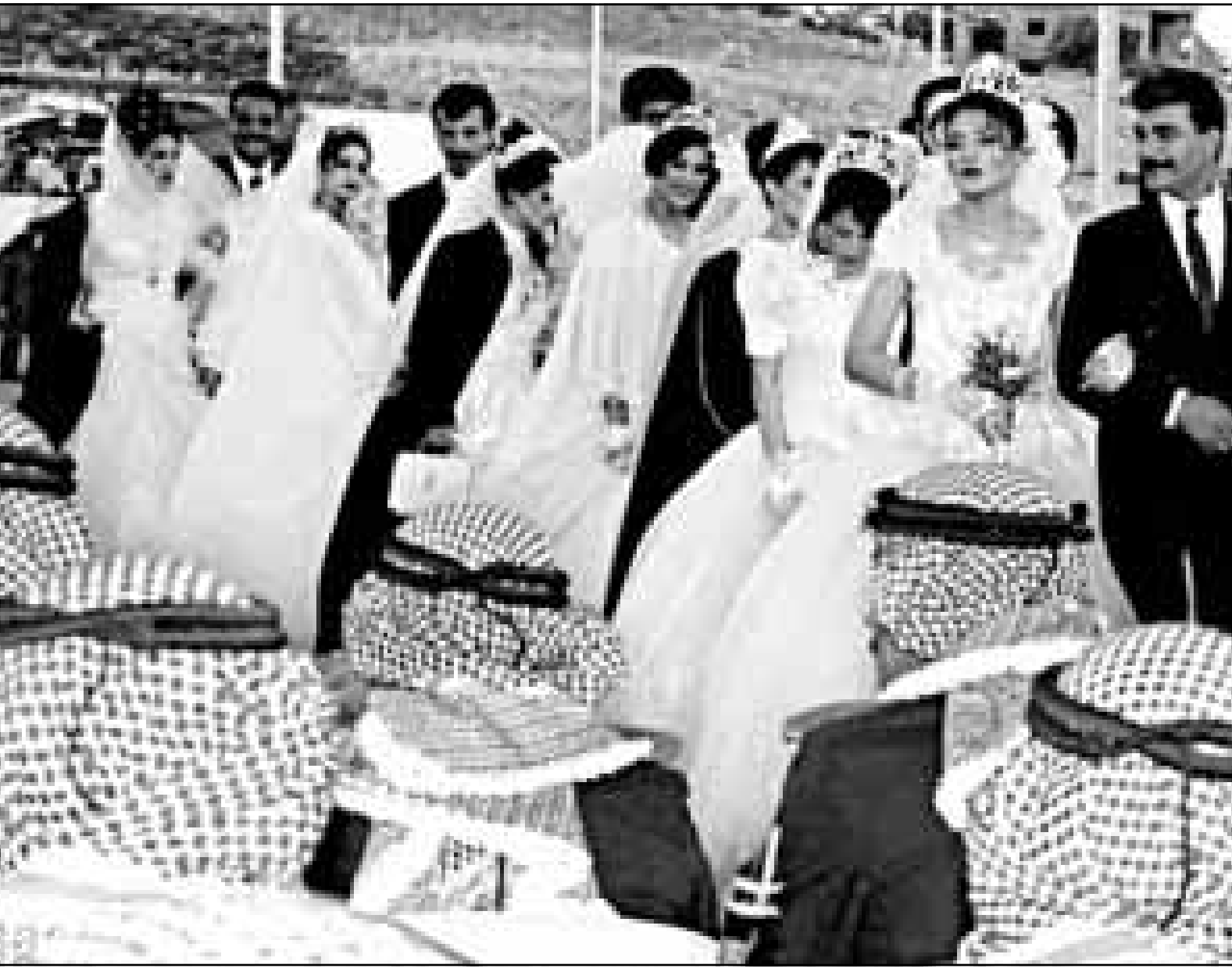
مشهد لعدد من السيدات اللواتي تحضر عليها القيادات الإسلامية في المملكة (روبيرت)

لكن رأي قادة التيار الإسلامي في المقابل مختلف تماماً، فالشيخ الكيلاني استنكر بشدة تنظيم هذه المسابقة، وتعددهم بمحاربتها، واصفا إياها بأنها تحطم المعايير الدينية، والأخلاقية للمجتمع، ووصف الكيلاني، المشاركات بالمسابقة بانهن منسلخات عن دينهن وترات أمتهن، وقال: المشاركات يستحقن لعنة الله وملائكته، والشهد مشير للاشمئزاز، فكيف تعرض مفاتن بناتنا