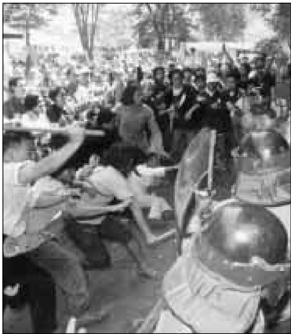
طلاب اندونيسيون في اشتباك مع الشرطة

سيما الجزرة التي حسدت الاف الشيعة الهزارة خلال الاستيلاء في 9 ارب (اغسطس) 1998 على مزار الشريف «عاصمة» المعارضة في شمال البلاد (ما بين 5 الى 8 الاف شخص حسب التقديرات الدولية). وقال الملا رباني في هذا الخصوص ان «المعلومات حول المجازر التي ارتكبتها طالبان غير صحيحة». وكانت الامم المتحدة اتهمت ايضا طالبان في الشهر الماضي باعتماد سياسة الارض المحروقة، خلال هجومها على سهل شمالى شمال كابول ضد قوات القائد احمد شاه مسعود المعارض الذي يقايل ضد سيطرة الحركة بشكل كامل على البلاد. وقد انتقدت المنظمة الخاصة للأمم المتحدة وازنكا كوماواسامى الأحد الماضي الفصل المنهجي الذي يمارس ضد النساء في افغانستان، وقالت بعد زيارة قامت بها الى البلاد، لقد لاحظنا انتهاكات منقطعة للوضع في الغرب باستثناء وضع المرأة». واكد ان «الصيبة ايضا كانوا محرومين من التعليم، اتنا نريد عودتهم الى المدرسة وستضع برنامجا وتربويا للجنسين معا مع منهج دراسي واحد». وقد تعرضت حركة طالبان التي تطبق الشريعة الاسلامية منذ تسلمها السلطة عام 1996 الى انتقادات شديدة في أنحاء العالم خصوصا لجهة منع المرأة من العمل والاقبال مدارس البنات، وكان اخر الانتقادات ما