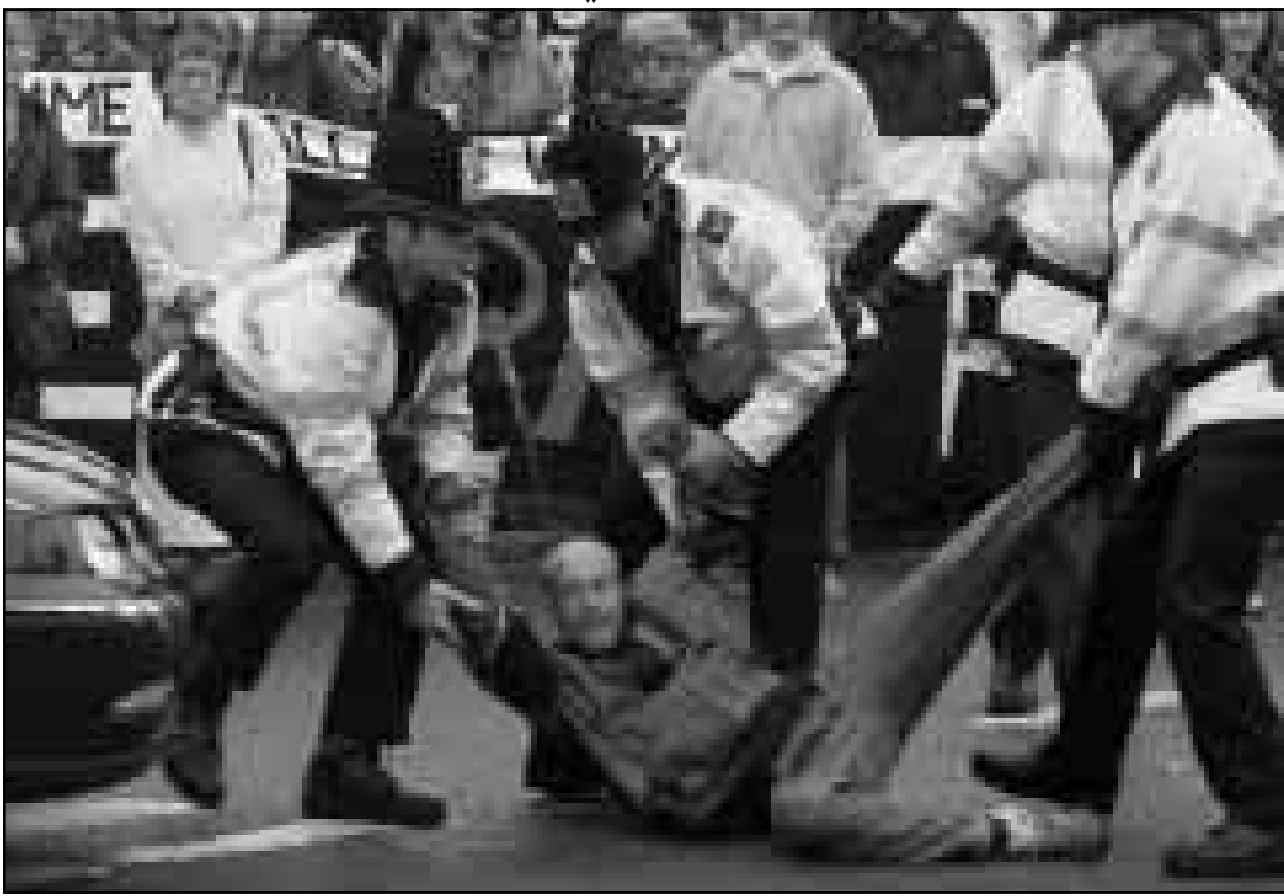
رجال شرطة بريطانيون يفرون مظالمين ضد تجارة الاسلحة لتجمعوا أمس امام مبنى لوزارة الدفاع في مقاطعة ساري قرب لندن