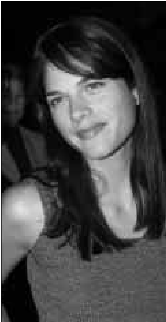
الجمعة «سالما بلان» حضرت حفل العرض الأول لفيلم «بلو ستريك» في لوس انجليس امس (رويترز)

■ ميامي - اف ب: تقدم الاعصار فلويد نحو القوة المدمرة الهائلة نحو ساحل البهاما الشرقي وفلوريدا حيث بدأ الاف الأشخاص في إخلاء مساكنهم القريبة من الساحل. وقد ضرب الاعصار جزيرة سان سلفادور مصحوبا برياح تزيد سرعتها على 250 كيلومترا في الساعة وامطار غزيرة. وكان مركزه يبعد 55 كلم عن الجزيرة عند الساعة 20,00 غ 22 حسب اجهزة الرصد الجوي الأمريكية. وفي فلوريدا، دفع حجم الخطر بحاكم الولاية جورج بوش الابن الى اعلان حال الطوارئ. في حين امر رئيس بلدية منطقة ميامي - نيد بالاخلاء 270 ألف منزل ساحلي يهددها الرصد الاعصار. وحذر مدير المكتب الوطني الأمريكي للاعاصير جيري جارييل «انها كارثة حقيقية. تتحضر. من اذ لم يغير الاعصار وجهته، فقد يضربنا جميعا». و اضاف «انه اعصار هائل، شيء اسوأ من انثروا» الذي تسبب في موت 40 شخصاً وخلف اضرارا بملايين الدولارات في 1992.