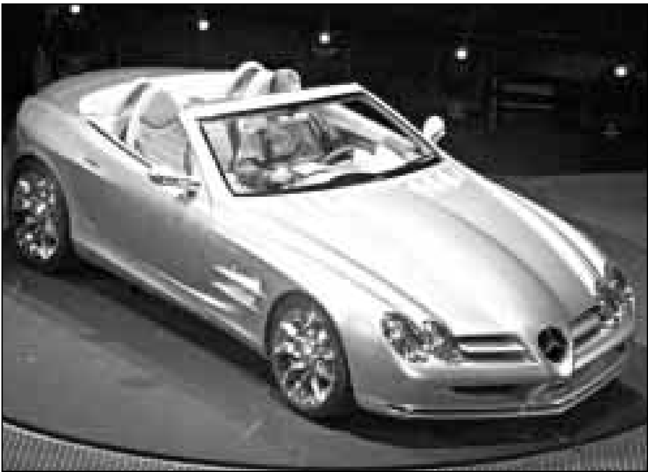
نموذج تجريبي لسيارة مرسيدس SLR جديدة تماما لدى تقديمها امس في مؤتمر صحافي على هامش معرض فرانكفورت لدولي للسيارات (رويترز)

وقال «لا يمكننا ان نظل خارج منظمة تضم 140 عضوا. علينا ان نكيف انفسنا مع قواعد التجارة العالمية ما دامت لا تضر اقتصادنا».