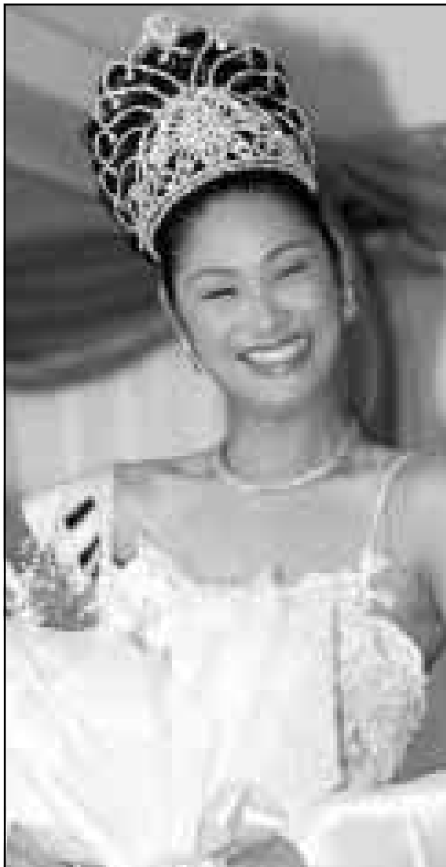
«باريسا يورينغرامو نغ» ملكة جمال الكون عادت الى بانكوك عاصمة بلالها تايلند بعد فوزها باللقب في مسابقة اجريت بالولايات المتحدة

● رواية «النخيل الملكي» للكاتب محمود عبد السلام العمري جرت مناقشتها مساء الاثنين الماضي في الورشة الابداعية بشرق القاهرة.