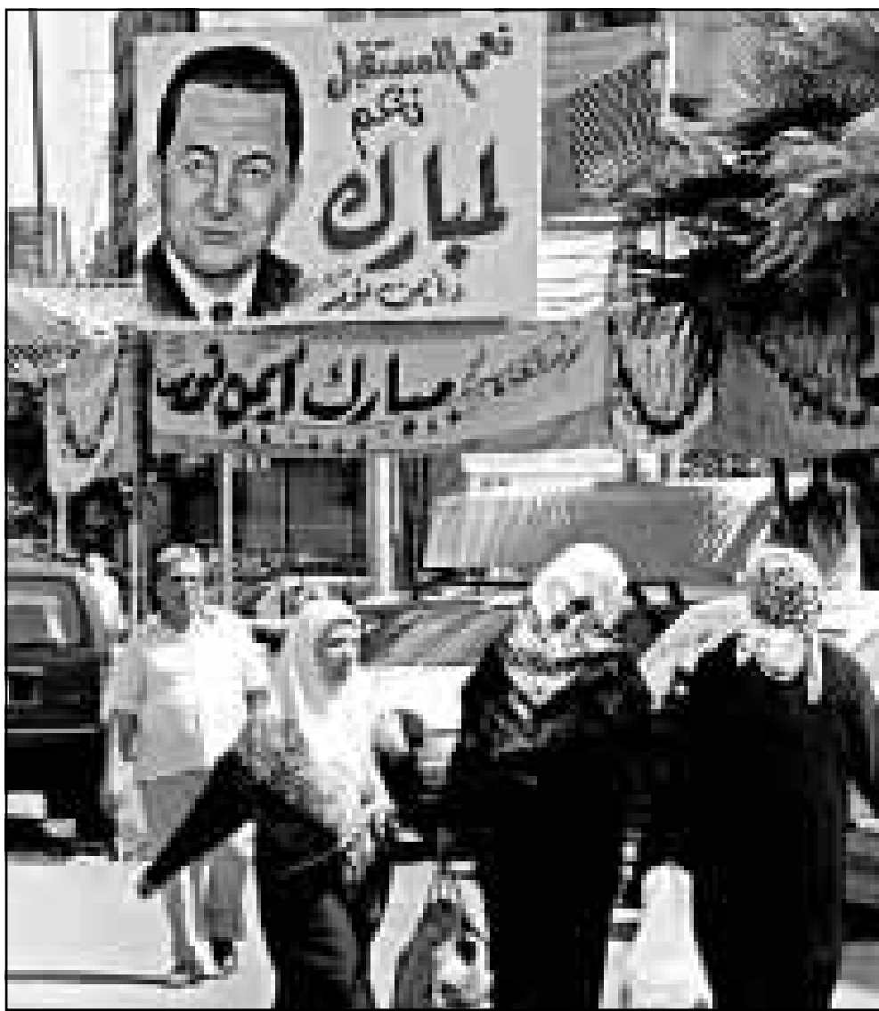
مصريون يسبون امام باغيات تآيد للرئيس مبارك التي علق في شوارع القاهرة لتأييد اعادة انتخابه

امن الدولة القبض على 12 طالباً من طلاب جامعة القاهرة بتهمة احياء تنظيم جماعة الاخوان المسلمين، وتم عرضهم على نيابة امن الدولة بتاريخ 1999/8/26 التي امرت بالقاء سجين 5 منهم، وحبس السبعة الاخرين 15 يوما على ذمة التحقيقات، وادعوا سجن مزرعة طرة بتهمة الانضمام الى جماعة استست على خلاف القانون، وحيارة كتب ومنشورات تحوي فكر الجماعة والترويج لهذا الفكر ومحاولة نشره، والقبوض عليهم هم: ساهع عبد الحميد البوقي، احمد سعد الزملون، سمير متولي الطباوي، حاتم محمد ثابت، ايهاب محمد طابيل، معاذ الحمدي اسماعيل، علي محمد ليلية، هذا بالاضافة الى الثور عبد الفتاح (لم يقبض عليه) وبتاريخ 1999/9/8 تم عرضهم على النيابة التي قررت تجديدهم حبسهم 30 يوما. كما القت مباحث أمن الدولة القبض على ثلاثة اخرين من طلاب جامعة عين شمس بتاريخ 1999/9/4 وتم عرضهم على النيابة للتمم السابقة نفسها، وقد امرت النيابة بحبسهم 15 يوما على ذمة التحقيقات.