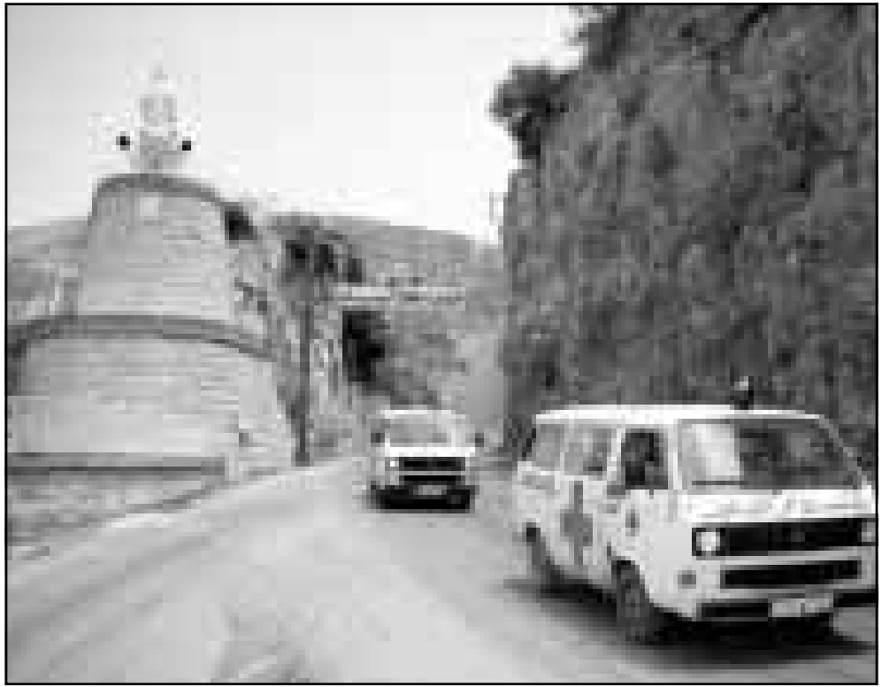
مدخل مدينة جزين