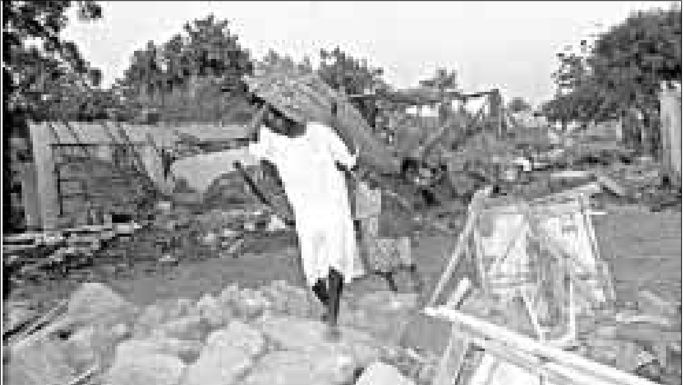
سودانيون يتولون بين مخلفات الفيضان الذي اجتاحت منطقة دنقلا في الشمال