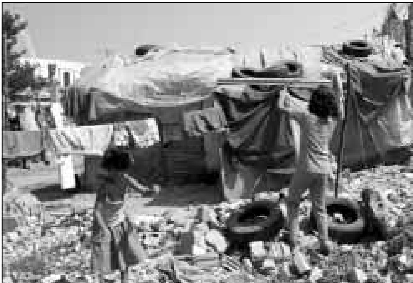
معلقان فلسطينيان لعقائ الغسيل امام خيمتهما في مخيم شاتيلا في جنوب لبنان (ا ف ب)