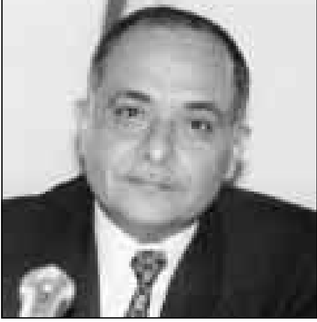
نجيب قحطان الشعبي