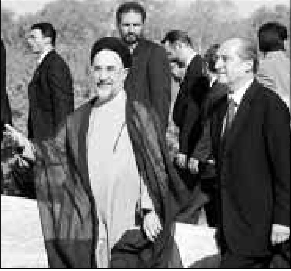
الرئيس خاتمي لدى استقباله نظيره النمساوي في طهران امس