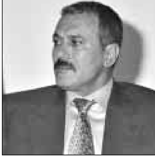
الرئيس علي عبدالله صالح