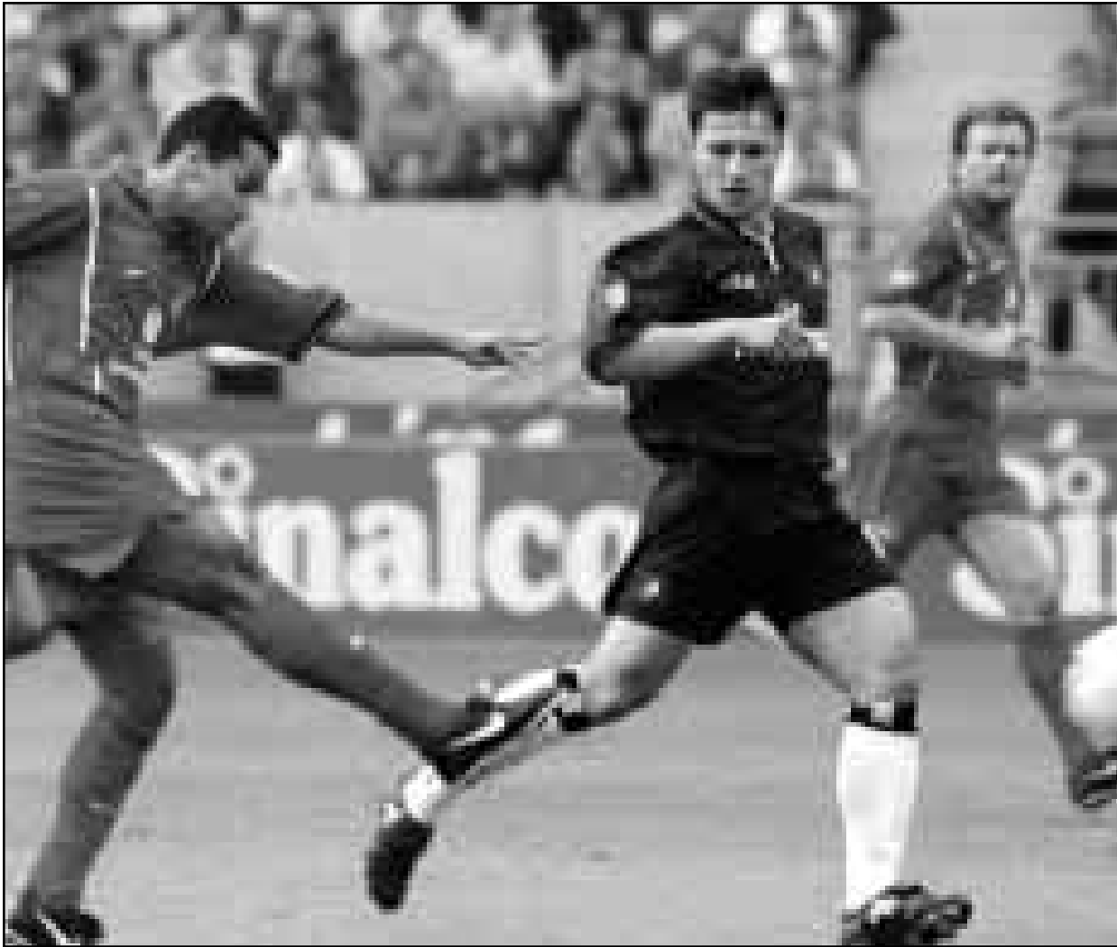
راينيو لاعب كايزرسلاوترن (الى اليسار) يحاول الفوز بالكرة