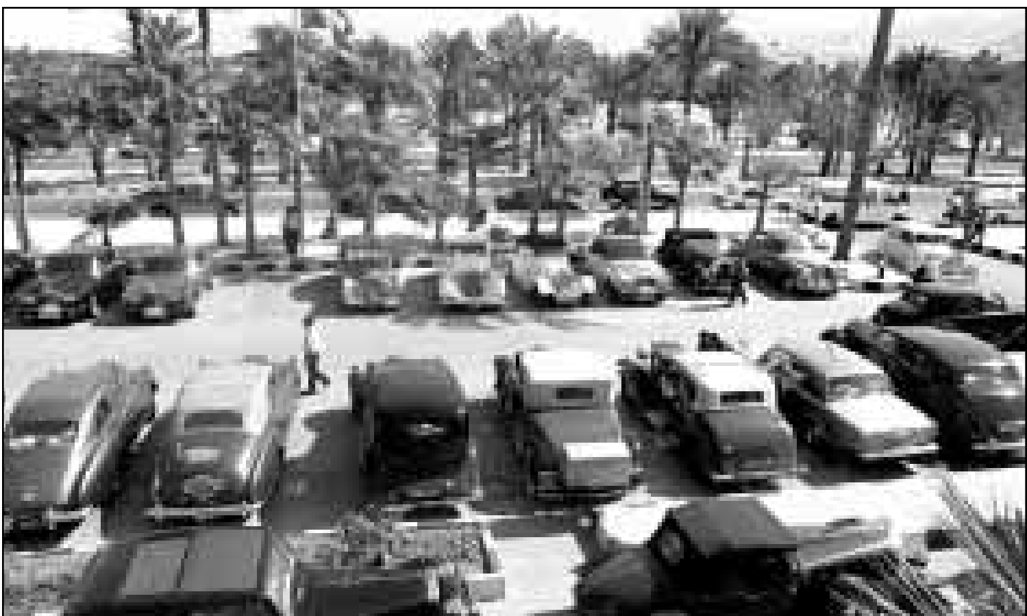
منظر عام لعدد من سيارات الرولز رويس في باحة فندق العبقية حيث بدأت أمس مسيرتها (اف ب)