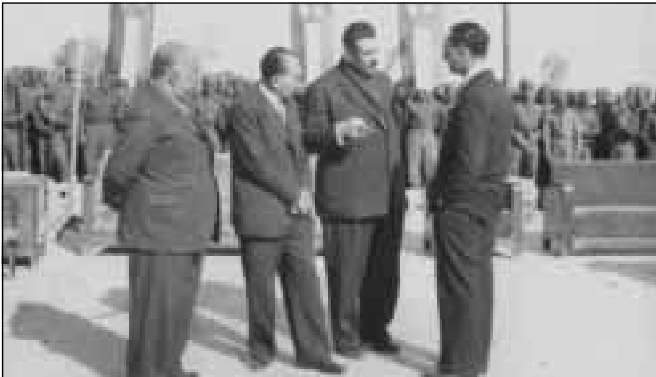
أحمد مختار بابان وتحسين قدره وفخري الطبقجي مع الامير عبد الآله

وهذه الاجراءات قد اتخذت بطروف استثنائية، استناداً لاحكام القانون، في وقت كانت الاحكام العرفية معلنة خشية من قيامهم باعمال تخل بالأمن، كانت تتخذ عادة عندما لا تكون هناك افعال جرمية واضحة قد تم ارتكابها، وتلكى هذه الاجراءات بالبداهة بمجرد زوال موجباتها، وقد زالت فعلا بعد استقرار الاحوال كما ذكر المؤلف بكتابه، كما وعلنت الحكومة انذاك الغاء الاحكام العرفية، لذلك فمجرد المحاولة للافراج عن (المعتقلين والمبعدين كما سماهم المؤلف خطأ) حتى لو صححت فلا يمكن ربطها مع التحريض على المظاهرات الجوهلة وكتابة العرائض التي لم يدون نصوصها، بل هي محاولات انسانية تتفق مع روح العدل، ومن دواعي اسفني ان اقول ان خطأ المؤلف في هذا الصدد كان فاضحاً.