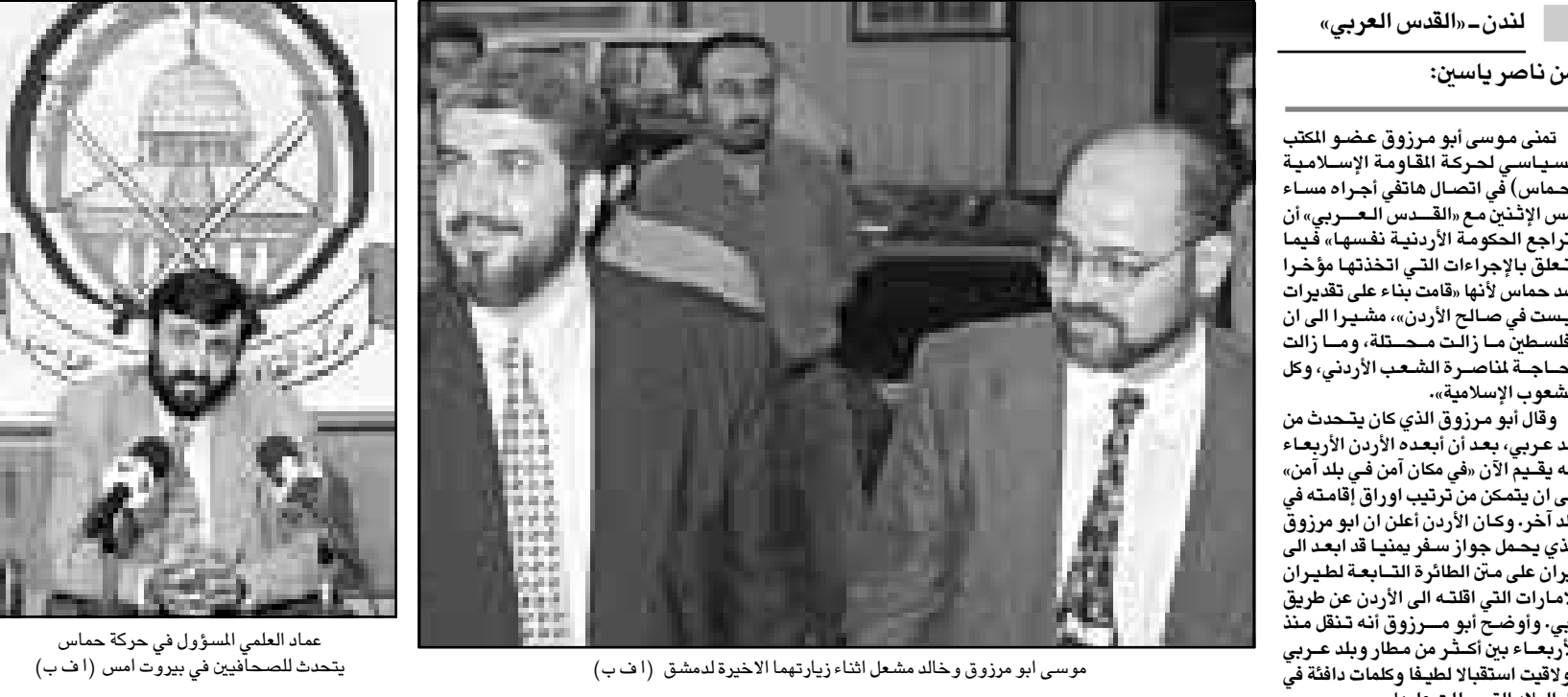
موسى ابو مرزوق وخالد مشعل اثناء زيارتهما الاخيرة لدمشق

عمان بموجب مذكرة جلب صادرة بحقهم، وقال هذا دليل على عدم وجود اساس قانوني لمذكرات الجلب، وان القضية برمتها سياسية، ولا يمكن ان الاعتقال وليس الإبعاد، ولو كنت مخالفا لماذا لم يتم محاسنتي؟ وردا على سؤال حول الوثائق التي صادرتها السلطات الأردنية من مكتب الحركة في عمان قال ابو مرزوق: هذه الوثائق ليست سرية، وتتداولها الحركة فيما بين عناصرها المحيط الاعلامي الذي تتعامل معه فيما يتعلق بعملها السياسي والاعلامي في الساحة الأردنية، وطيلة الفترة الماضية حصلت أجهزة الامن الأردنية على الكثير من الوثائق والأوراق والعلومات الخاصة بحماس، لكن مثل اي عمل آخر فإن هذه المعلومات تصبح قديمة بعد كل مرحلة من