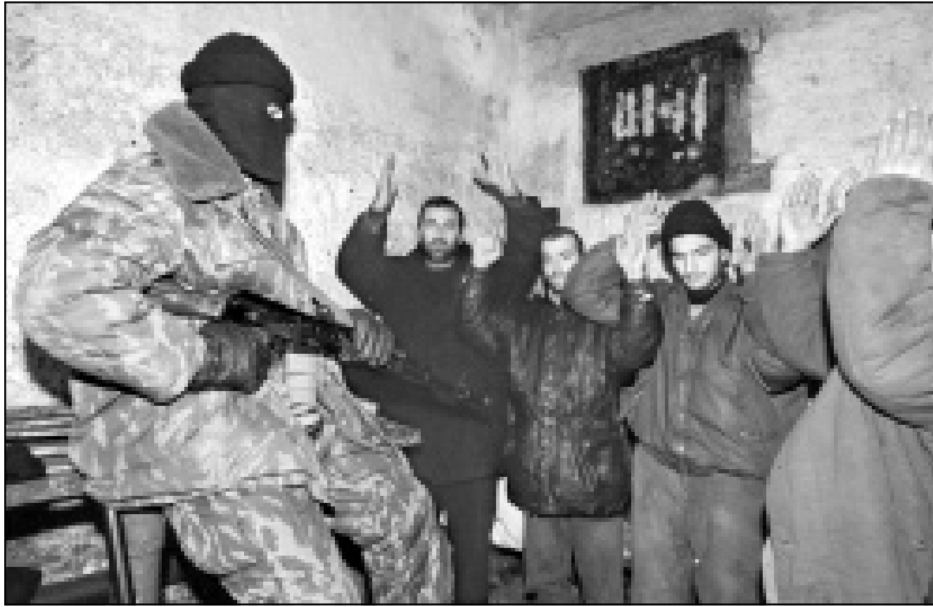
جندي روسي يجتاز معتقلين من الشيشان في قاعدة عسكرية روسية

■ موسكو - كراتشي - أف ب - رويترز: ذكرت شبكة «أن تي في» التلفزيونية الخاصة الجمعة أن الرئيس الشيشاني اصلاص مسخادوف أعلن بدء حرب الانصار في جميع أنحاء جمهورية الشيشان، في القوقاز الشمالي الروسي. وقال مسخادوف ان المقاتلين الشيشان يعتزمون شن حرب انصار في الجبال والسهول وفي كل قرية في الجمهورية. وأضاف مسخادوف الذي لا تعترف موسكو بوضعيته ان الشيشانيين الدركوا ان الحملة الروسية لا علاقة لها بمكافحة اللصوصية او الارهاب بل في حرب ضد الشعب الشيشاني. وكان المقاتلون الشيشان شنوا في الحرب (1994 - 1996) حرب كমান ومناوشات ضد «الاحتل الروسي، مما اتاح لهم استعادة عدة بلدات.