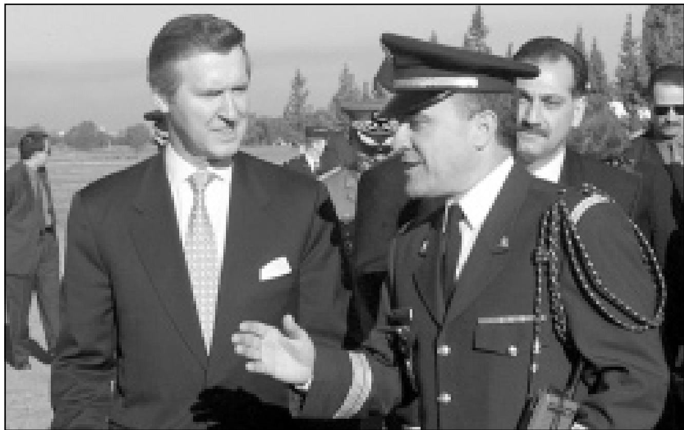
العقيد محمد بن علي يتحدث إلى وليام كوهين أثناء مرافقته إلى القاعدة العسكرية، المارة، بمراكش جنوب المغرب