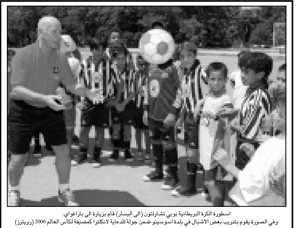
اسطورة الكرة البريطانية بوبي تشارلتون (الى اليسار) قام بزيارة اباراغواي. وفي الصورة يقوم بتدريب بعض الاشبال في بلدة اوسونيو ضمن جولة للدعاية لانكلترا كمضيعة لكأس العالم 2006

يسعى نيوكاسل الى الثامن مانشستر يونايتد عندما يستضيفه على ملعب سانت جيمس بارك ذلك لان الاخير هزمه الموسم الماضي في نهائي كأس انكلترا 2-صفر، وسحقه نيوكاسل السابق اندي كول. بيد ان نيوكاسل لم يخسر على ارضه منذ ان استلم تدريبه «العجوز» بوبي رويسون في تشرين الاول (اكتوبر) الماضي وانتقله من المركز الاخيرة الى وسط الترتيب.