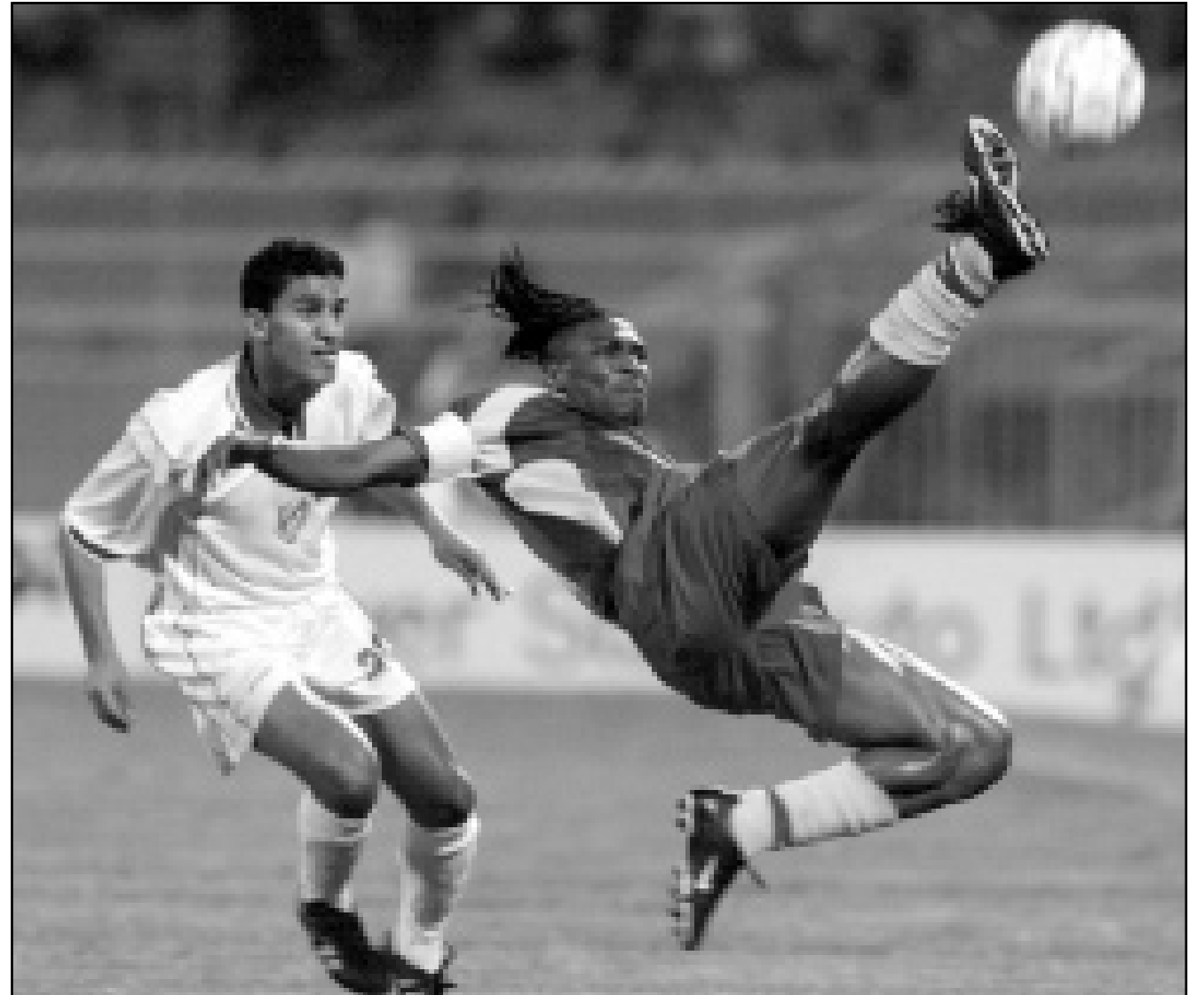
قذرة مثيرة في الهواء للاغراء بالكرة قام بها لاعب منتخب الكامبيرون ريجوبيرت سونغ