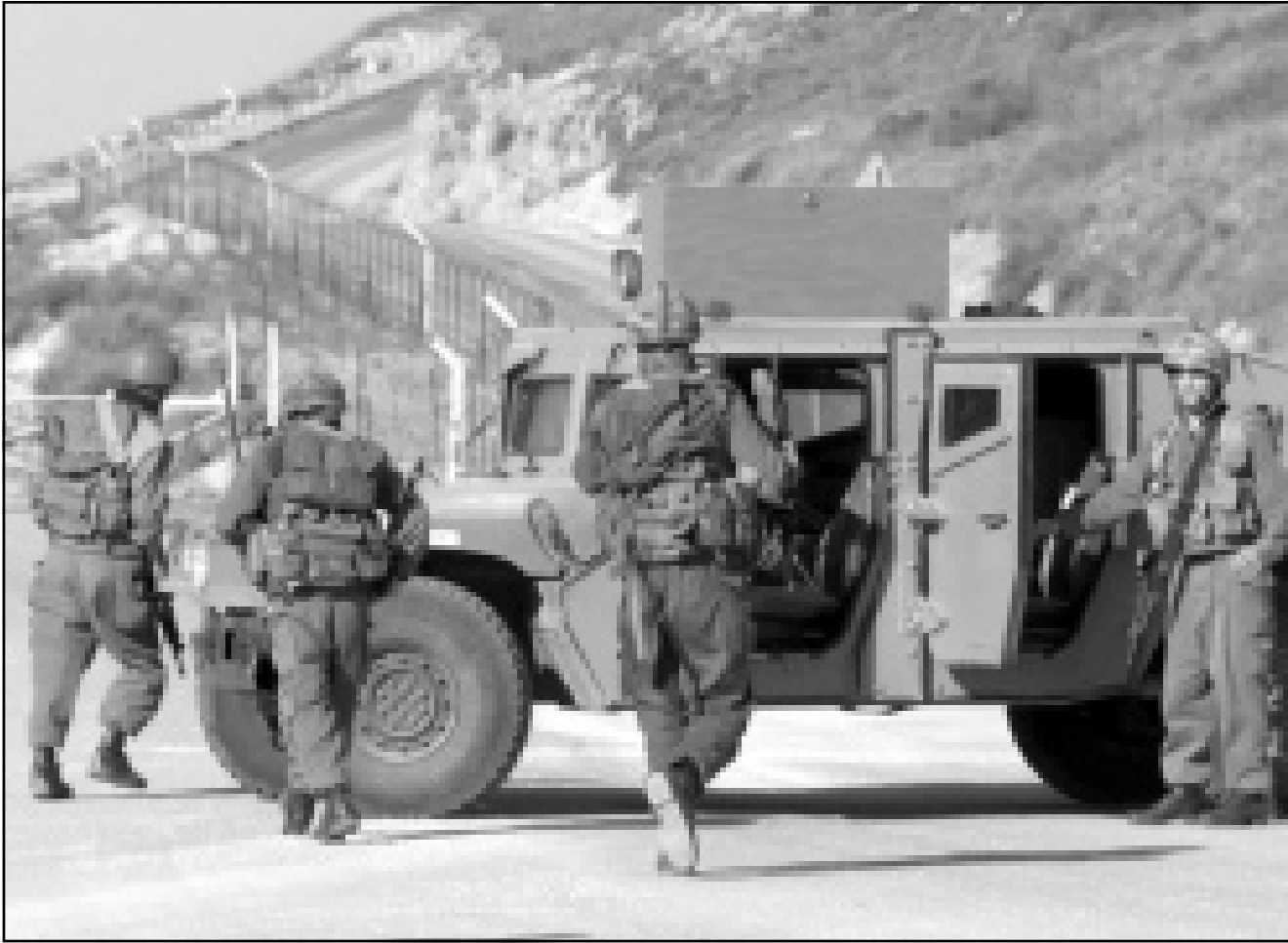
جنود اسراييليون يتوجهون الى الحزام الاممي لمساعدة الجرحى بعد عملية لحزب الله

الاسرائيلي وميليشيا جيش لبنان الجنوبي التابعة له. وقد أكد حزب الله في بيانه ان العملية التي نفذها اسم «تاتي» في اطار الهجمات المتلاحقة لجيش العدو ودلالة على عجزه الكامل امام ياس مجاهدينا. وقد نجح حزب الله منذ 25 كانون الثاني (يناير) بقتل سبعة جنود اسراييليين سقط اخرهم الجمعة وباصابة 15 آخرين بجروح في عمليات داخل المنطقة التي تحتلها الدولة العبرية وذلك في مقابل 13 قتيلا طوال العام 1999.