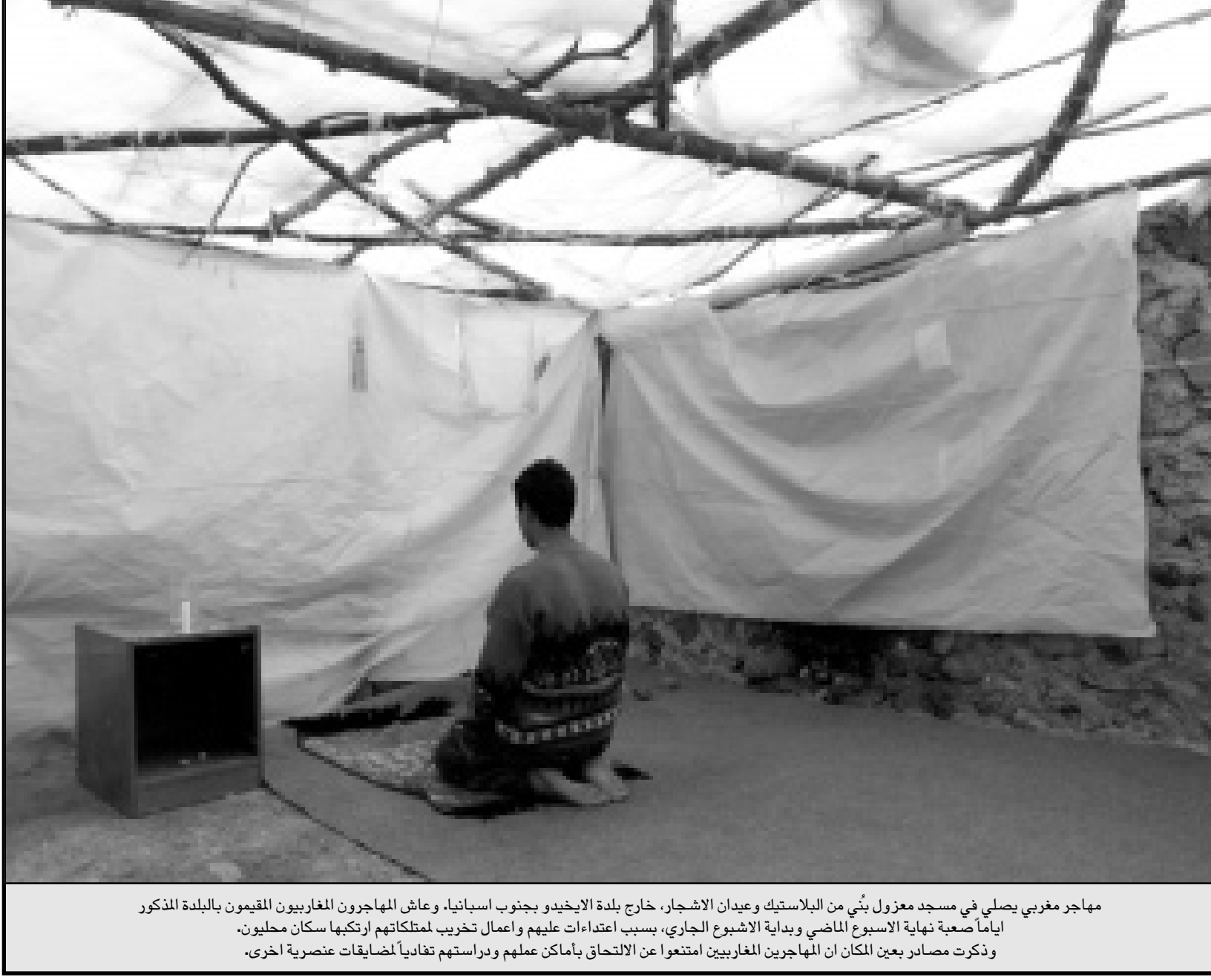
مهاجر مغربي يصلي في مسجد معزول بُني من البلاستيك وعيدان الأشجار، خارج بلدة الايخيدو بجنوب اسبانيا، وعاش المهاجرون المغاربة المقيمون بالبلدة المذكور أياما صعبة نهاية الأسبوع الماضي وبداية الأسبوع الجاري، بسبب اعتداءات عليهم وأعمال تخريب لممتلكاتهم ارتكبتها سكان محليون. وتكررت مصادر بعين المكان ان المهاجرين المغاربة امتنعوا عن الالتحاق بأماكن عملهم ودرستهم نقابا لضباقت عنصرية أخرى.

باريس - اف ب: افاد مصدر قضائي يوم الجمعة ان عمليات البحث عن رفات المعارض المغربي المهدي بن بركة التي استمرت طيلة بعد ظهر امس الخميس في غابة غارين بمنطقة كوركورون بالقرب من باريس لم تفض الى نتيجية وتقرر وقفها. وشملت عمليات البحث التي قام بها رجال درك باريس بناء على اناثة قضائية من القاضي جان - باتيست بارلو، حوالي عشرين مترا مربعا في