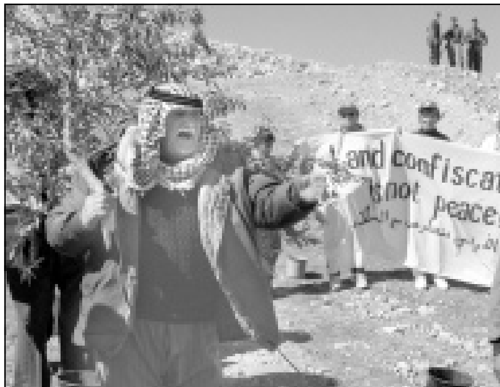
ناشط اسرائيلي يحتج على مصادرة اسرائيل لاراضي في الخليل

مساعدة المستوطنين بمصادرة اراضي الفلسطينيين، باعمالها في اغلب الحالات اراضي حكومية، وتفرق المتظاهرون من دون وقوع اي حادث. ويحتل المستوطنون اليهود خمس مساحة الخليل، وهو جزء من المدينة لا يزال تحت الادارة العسكرية الإسرائيلية، في حين انتقل باقي المدينة الى سيطرة السلطة الوطنية الفلسطينية برئاسة ياسر عرفات في 1997.