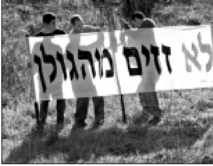
مستوطنون اسرائيليون يهتفون بالارض لافتة كتب عليها «ان نخرج من الجولان»