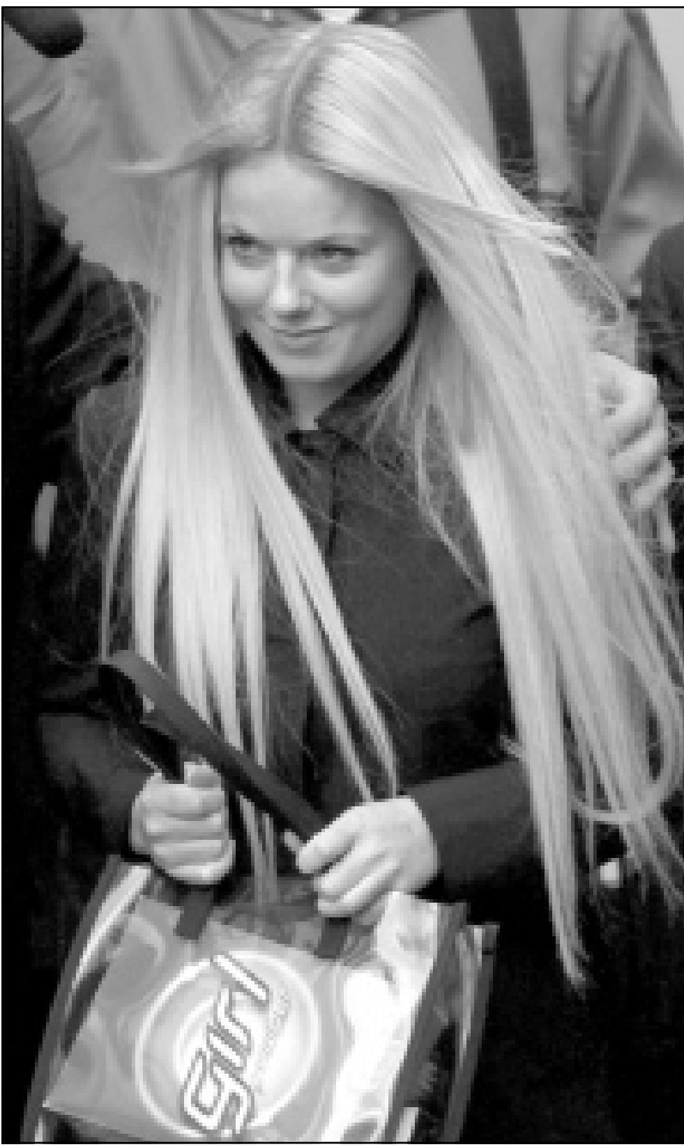
مغنية البوب البريطانية عضو فريق «سبايس جيرلز» السابقة جيري هالويل شهدت أمام المحكمة العليا في لندن الجمعة في قضية اقامتها إحدى الشركات الإيطالية ضد فريقها السابق

ويقول مسؤولون أن أكثر من 3200 مغربي يلقون حتفهم في حوادث الطرق كل عام، وأن نحو 40 ألفا آخرين يصابون بإصابات خطيرة، على الرغم من حملة توعية عامة على مستوى البلاد لتقليل ضحايا الحوادث.