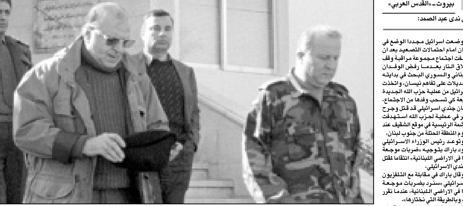
الجنرال اللبناني ببيير ماتا (يمين) والسوري عدنان بيلول لدى خروجهما من اجتماع مجموعة تفاهم نيسان الجمعة

«العمل الجيد أكبر». وقال روبين «بالتأكيد ان سورية لها نقوذ لدى حزب الله، ابغتناهم أنهم يحتاجون لممارسة هذا النقوذ وعند هذه النقطة فسالدليل واضح، أنهم يحتاجون لممارسة هذا النقوذ بصورة اكثر فعالية»، واعتبر وزير الخارجية الاسرائيلي ديفيد ليفي في رسالة الى الامم المتحدة نشرت الجمعة ان سورية ستكون مسؤولة عن توقف محادثات السلام في حال لم تضع حدا «لاعتداءات» حزب الله على اسرائيل. واعلنت مصادر امنية في جنوب لبنان ان حزب الله لم يهجم بعد على الضفة الغربية المحتلة، التي تحتلها اسرائيل في جنوب لبنان بعد ساعات من هجومين في هذه المنطقة. الشيوخ ان حزب الله «عدو للسلام»، و«اضافت أنهم لا يريدون ان تفضي عملية السلام هذه الى الامام قدام وهم يعطلونها». وقال جيمس روبين المتحدث باسم وزارة الخارجية الامريكية «مكتنا فقط تفسير هذا التصرف (عملية قتل الجندي الاسرائيلي) على انه محاولة متعمدة من حزب الله لتقويض فرص السلام بالمنطقة. ان تصرف حزب الله شنيع في اطار التزام اسرائيل المنكر بالانسحاب من جنوب لبنان بحلول منتصف هذا العام»، وقالت الابراريت انها تحدثت الى وزير الخارجية السوري فاروق الشرع وطلب منه كبح حزب الله، واعربت عن اعتقادها بان السوريين «يجاولون لكن اعتقد أنهم يحتاجون