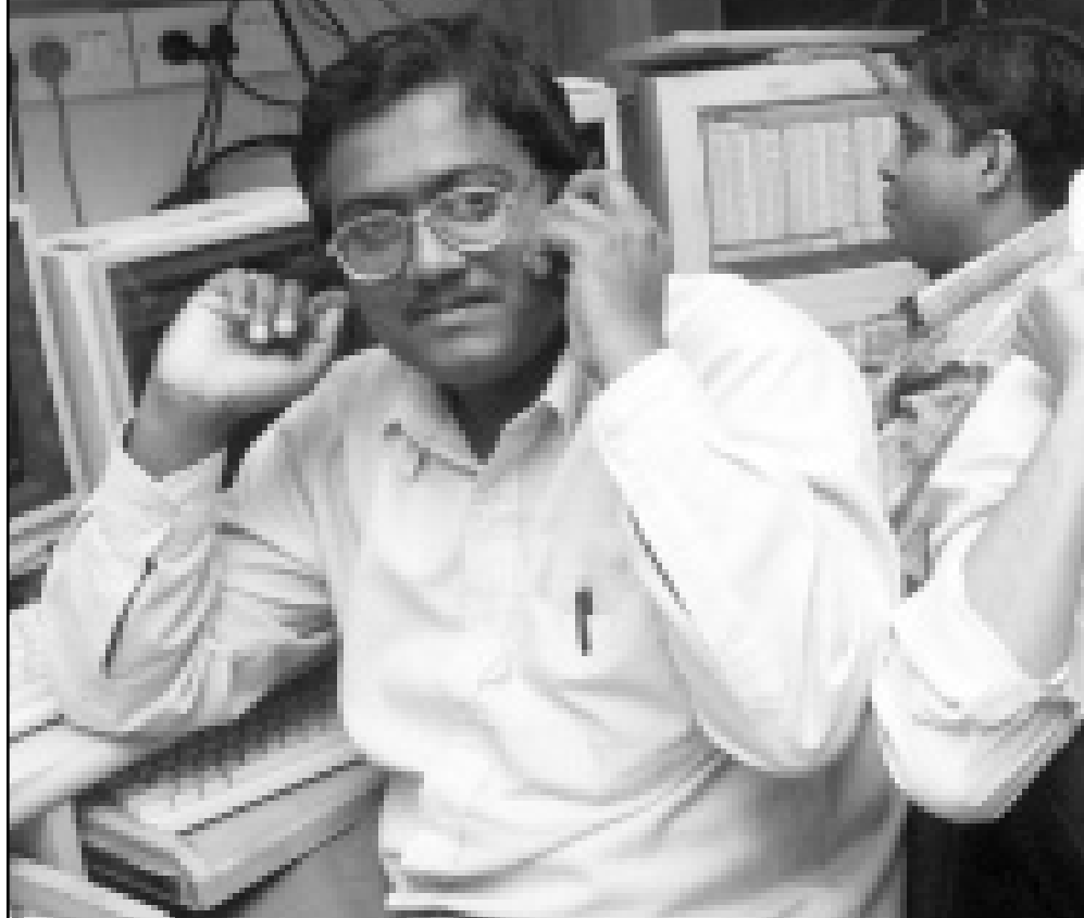
متعاملان في بورصة بومباي حيث واصلت الاسهم الهندية صعودها لليوم الرابع على التوالي الجمعة ليصل مجموع ارتفاع مؤشرها الى 12 في المئة خلال اسبوع (رويتز)