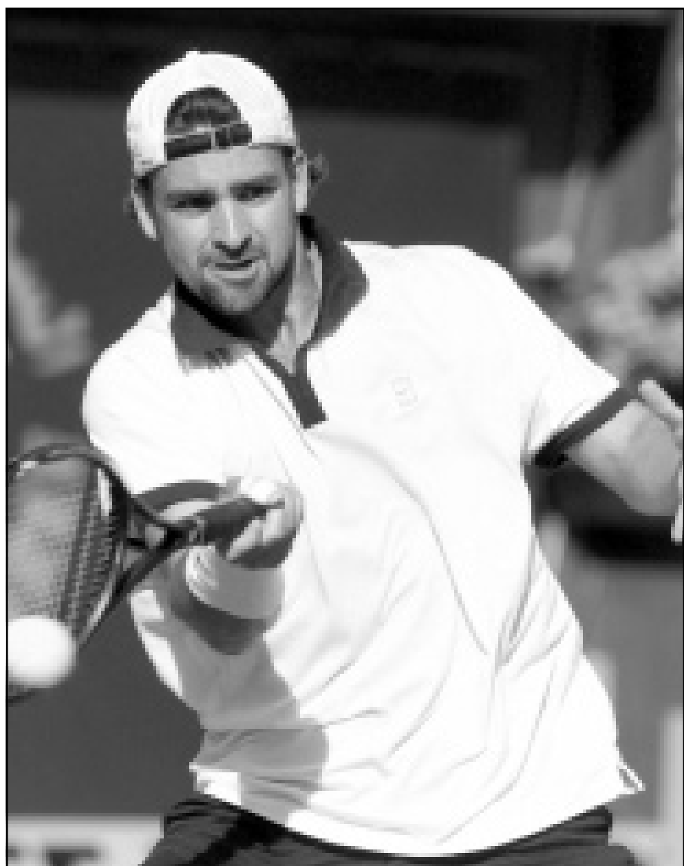
اللاعب الألماني نيكولاس كيبير

باريس - أف ب: تاهلت الروسية آنا كورنيكوفا المصنفة الرابعة الى الدور ربع النهائي من دورة فرنسا الدولية لكرة المضرب بفوزها على اللوكسمبورغية أن كريمر 6-7 (2-7) و6-2.