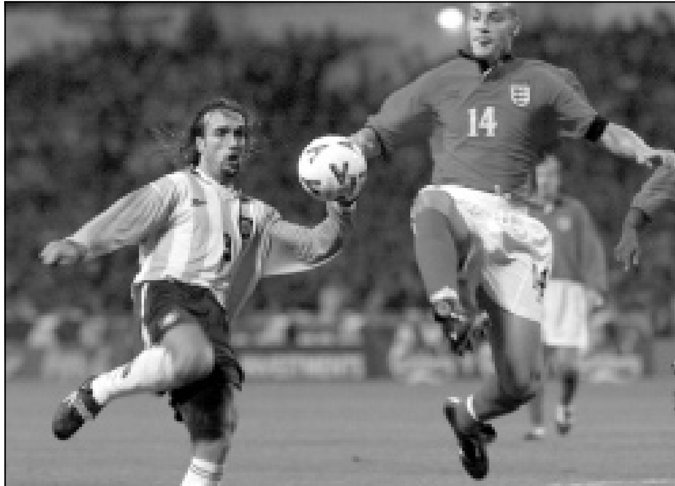
رونالدينو لاعب Flamengo (الى اليمين) في صراع على الكرة مع لاعبي الاجتيني غابرييل باتيستوتا

رئيس نادي غريميو بورتو الغريزي البرازيلي خوسيه البرتو غرييرو أنه لن يتخلى عن نجم فريقه ومنتخب بلاده لكرة القدم رونالدينيو غاونشو قبل نهاية عقده في شباط (فبراير) 2001، وأضاف غرييرو أن النادي سيحاول تمديد عقد رونالدينيو لمدة ثلاث أو أربع سنوات أخرى، مؤكداً ان ليدز يونايتد الانكليزي تقدم «بعرض لشراء اللاعب بيد أن المفاوضات بيننا وبينهم باءت بالفشل». وكان ليدز تقدم بعرض لضم رونالدينيو مقابل 80 مليون دولار. من جهته أوضح رونالدينيو انه يريد احترام عقده مع غريميو الذي ينتهي عام 2001، «وايجاد حل يرضي النادي». وكانت الصحف البرازيلية أعلنت الاسبوع الماضي ان برشلونة الاسباني مهتم بالتعاقد مع رونالدينيو وارسل نجمه السابق خوسيه مارييا باكيرو الى البرازيل لتابعة اللاعب خلال تصفيات اولمبياد سيدني حيث تألق وتوج هدافا لها برصيد 9 اهداف في سبع مباريات. وتكررت الصحف ان برشلونة مستعد لعرض مبلغ مقداره 60 مليون دولار لتعاقد مع رونالدينيو. وفي لندن تعادلت انكلترا والارجنتينا صفر-صفر في مباراة كرة القدم الدولية الودية التي اقيمت على ملعب ويمبلي في لندن امام 76 الف متفرج. ووقف المتفرجون واللاعبون دقيقة