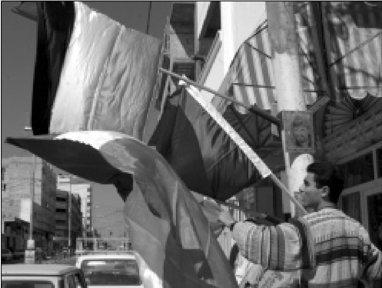
فلسطيني يحمل الاعلام الفلسطينية والفرنسية تمهيدا لزيارة رئيس الوزراء الفرنسي ليونيل جوسبان

الشيخ المبرمة في الخامس من ايلول (سبتمبر) ولكن عرفات رفض الموقع التي قررت الدولة العبرية الانسحاب منها من جانب واحد لانها لا تشمل أي