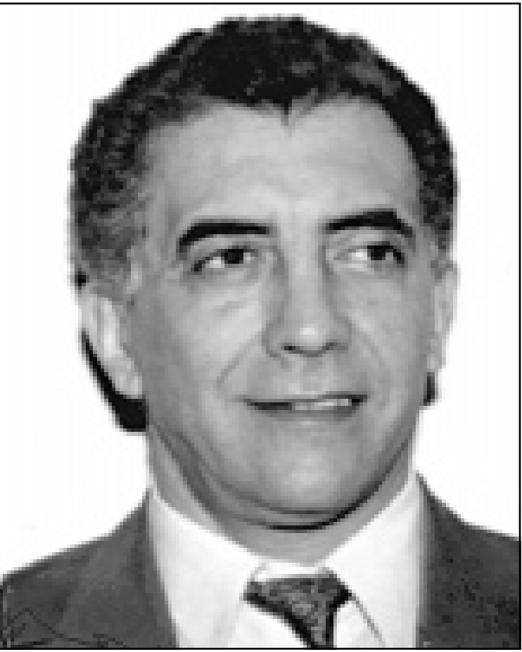
خالد بن اسماعين

زيارته، وهو لذلك فضل صيغة «الفتح» هذه. وقد علمنا أن بعض الأسر تستقبل عائلات يهودية بمقابل مالي، كما أن هناك مطربين وعائلات جزائرية تربطها علاقات مبنية على مصالح مادية واقتصادية مع اليهود في فرنسا. وهم يزورونهم كل عام هناك لذات السبب.