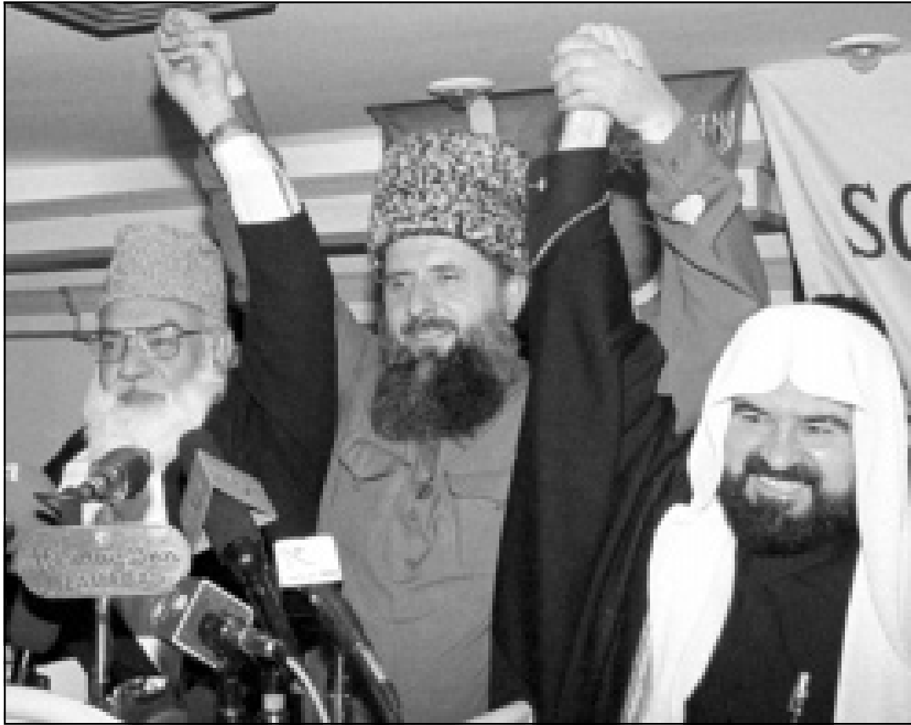
الرئيس الشيشاني السابق سليم خان فيديرياف (وسط) يمسك بيدي قائد حسين احمد زعيم الجماعة الإسلامية في باكستان (يسار) والدكتور محيي الدين رئيس الرابطة الكردية الإسلامية كرمز للضمضان في ندوة حول الشيشان عقدت في اسلام اباد أمس الأول

اعتبرت صحيفة «ميزاقيسيميا غازيتا» القوية اصلا من الكرملين، انه «من المحتمل ان يكون الفريق المكلف لتجميع صورة بوتين وراء هذا السيناريو» الذي قد يكون رئيس الدولة نفسه يجهل واضعيه، وكان بوتين نفسه قد تطرق في التاسع من شباط (فبراير) الى «التهديدات الازهاية» ضدّه خلال شرحه لاحد المواطنين الغاضبين سبب اطلاق عدد كبير من الشوارج لذي مروور موكبه في موسكو.