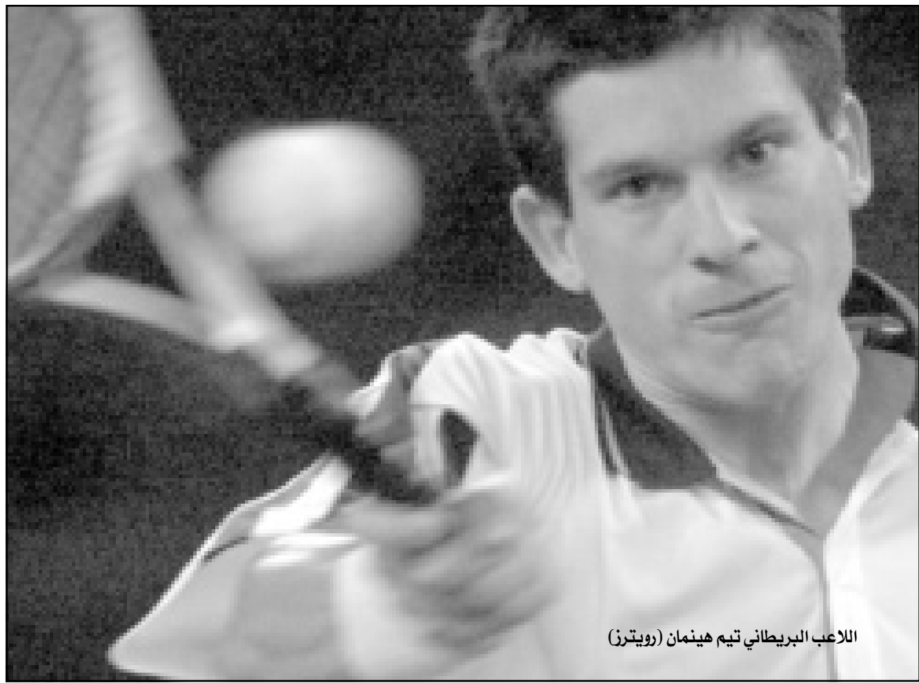
اللاعب البريطاني تيم هينمان