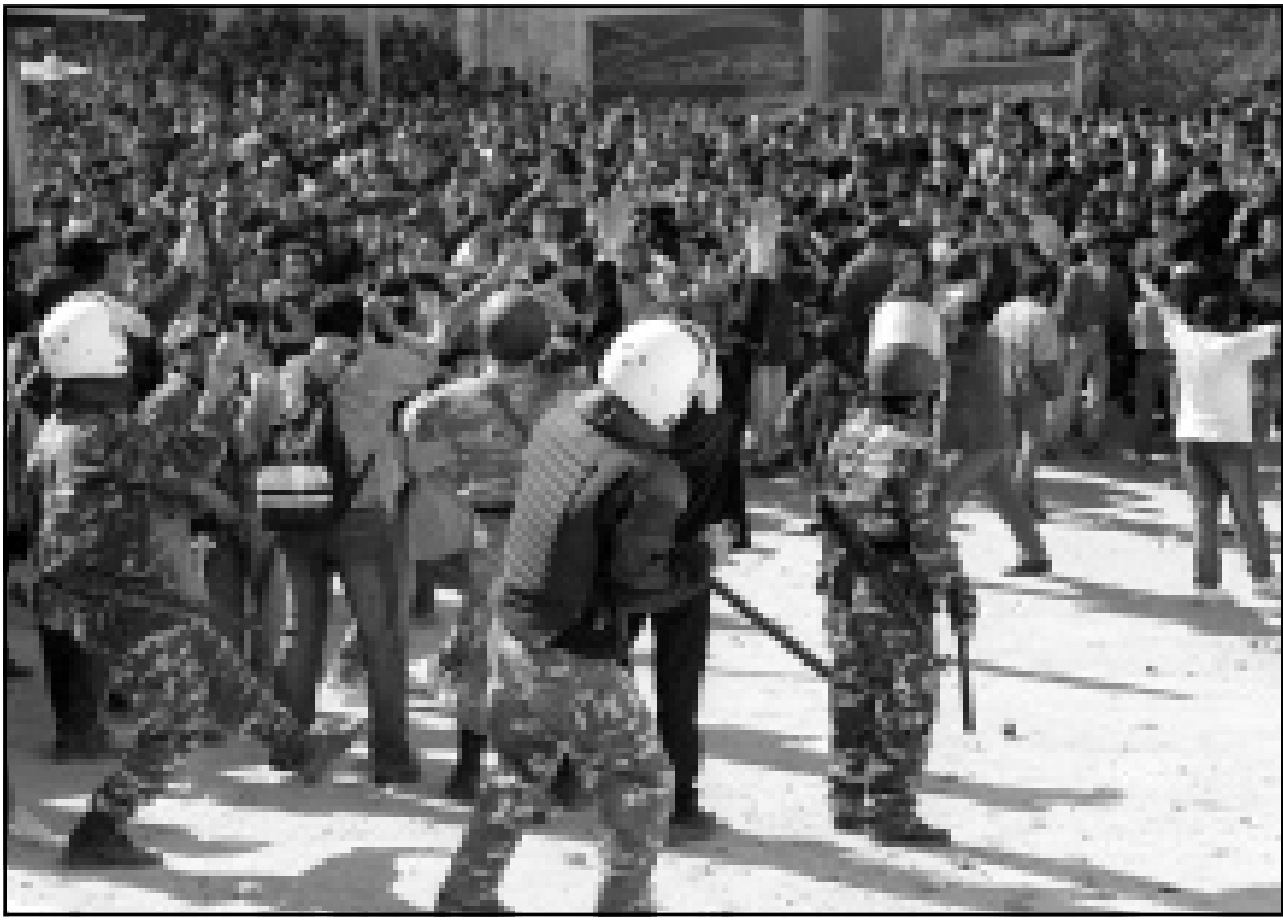
الشرطة الفلسطينية تتناول ابعاد مظاهرات فلسطينيين في مدينة الخليل الثلاثاء الماضي

وهو تحول الاجهزة الامنية لهدف مخالفي القوانين، ومنهم اولئك الذين يتهمون بسرقة السيارات من اسرائيل ونقلها الى اراضي السلطة الفلسطينية، والذين اتاحهم الشرطة الفلسطينية داخل اراضيها تنفيذًا لاتفاقيات مبرمة مع الاسرائيليين. ونجحت الشرطة كثيرا في ارجاع مئات السيارات المسروقة الى اسرائيل في اطار التعاون الامني المشترك. محولو السيارات من اسرائيل الى الاراضي الفلسطينية يواجهون صعوبات كبيرة حيث اصبح تمرير السيارات صعبا نظرا لوجود حواجز عسكرية مكثفة تفصل بين الاراضي الفلسطينية واسرائيل اضافة الى اجهزة الانذار في هذه السيارات. واجهزة تدل على مكان وجود السيارة. هؤلاء لا يعتبرون انفسهم لصوصا نظرا للاوضاع الاقتصادية الصعبة الناجمة عن الاغلاق الاسرائيلي وعدم توفر اماكن عمل في اراضي السلطة مما يسبب في القيام بسرقة السيارات.