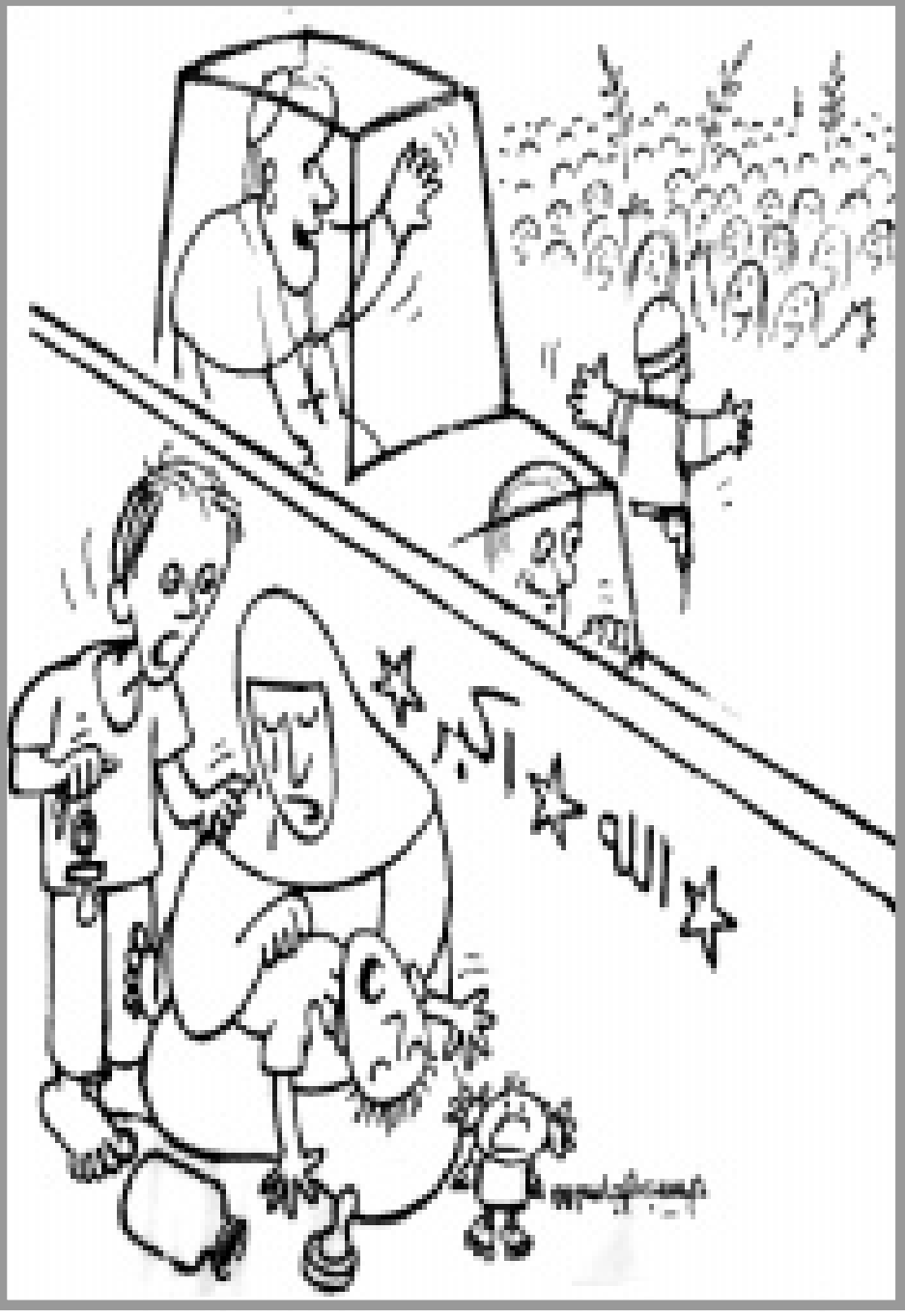
الأمين العام لمنظمة أوبك، كليمون أوفد وزير طاقته بيل ريتشاردسون إلى منطقة الخليج في جولة هدفها «إقناع» قادتها بوجهة النظر الأمريكية هذه، وقيادة التحرك لخفض الأسعار، وعزز مهمته بإطلاق تهديدات باستخدام الاحتياط النفطي الاستراتيجي لإغراق الأسواق بكميات كبيرة إضافية من النفط، في خطوة ابتزازية تتعارض تماماً مع كل القيم الأمريكية التي تتحدث عن اقتصاد السوق، والمنافسة الحرة.

وكان من الطبيعي أن تتزعزع المملكة العربية السعودية المعسكر المطالب بزيادة الإنتاج في اجتماع اليوم، لأنها لا تستطيع أن ترفض طلباً «استراتيجياً» للولايات المتحدة، وما ينطبق عليها ينطبق على دولة أخرى، مثل الكويت التي ما زالت تدين بالجميل للجيوش الأمريكية في تحريرها وإخراج القوات العراقية منها.