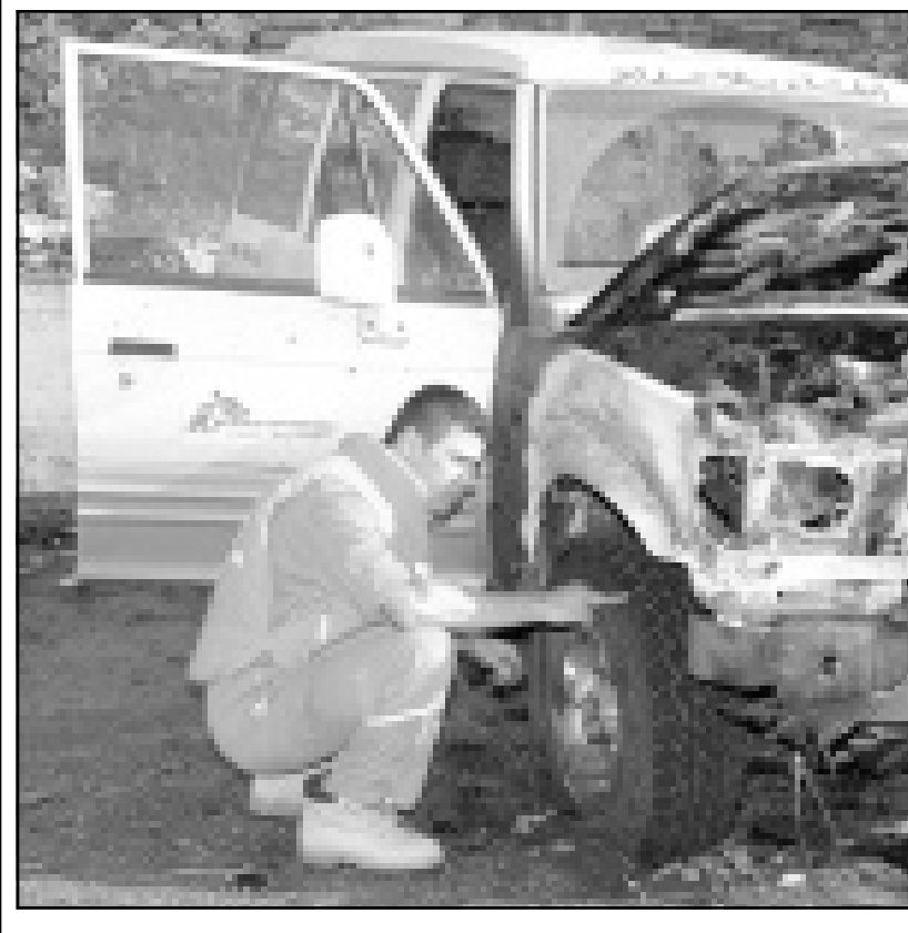
عمالان في الصليب الاحمر يتفقدان سيارة تابعة لمنظمة «اطباء بلا حدود» اصيبت بصاروخ اسرائيلي امس