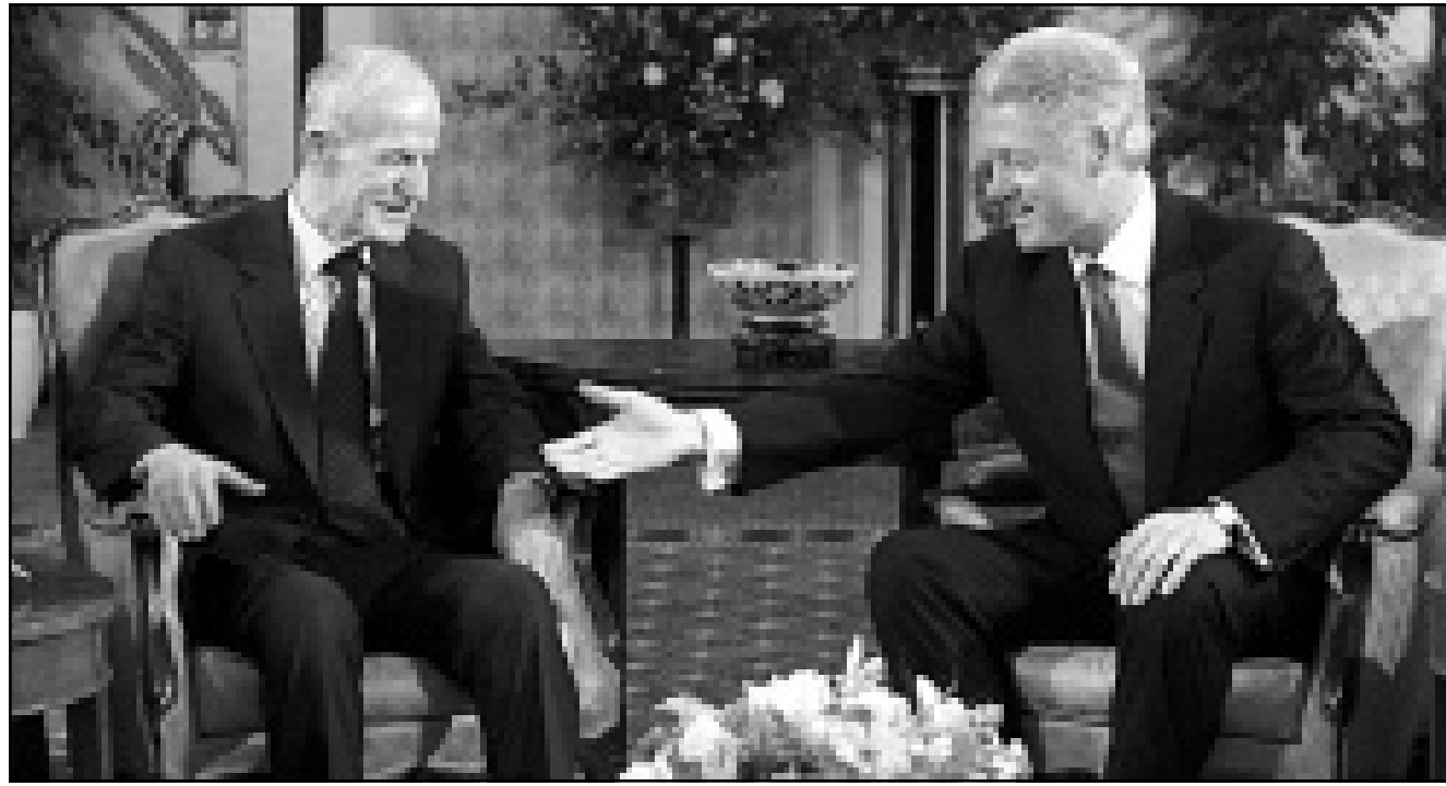
الرئيس كلينتون يمد يده لمصافحة الرئيس الاسد في جنيف امس

وتخشى الأجهزة الأمنية الإسرائيلية من تكرار تجربة عام 1973 عندما فاجت الجنود بداخلها، وتختلف القنابل النيوترونية عن نظيرتها النووية بكمية الإشعاع التي تحتوي عليه، ولم تحدث اضطرابا كثيرة حتى يدفق في ضوء عملية تسوية ل حل يكون كافيا، وتقول ان ذلك لن يحول دون وصول الجيش السوري للحدود مع اسرائيل في غضون 12 ساعة.