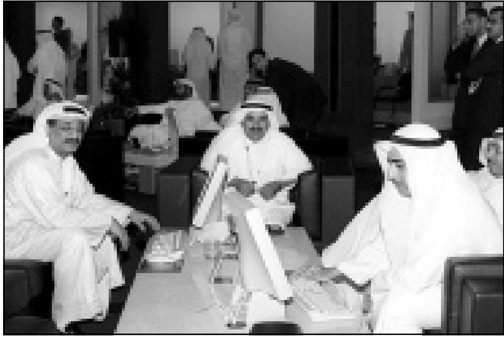
مستثمرون اماراتيون امس اجتمعوا لاجل افتتاح بورصة دبي امس

واضاف بوتشينى انه رغم تحقق بعض التقدم فيما يتعلق بقضية التمويل المالي فلا تزال هناك مشكلات، ودعا لجولة جديدة من المحادثات غير الرسمية لصياغة معاهدة دولية تكفل استخدام الملوثات العضوية المستدمية، وتابع «نعتقد اننا ما زلنا في اطار الجدول الزمني واتنا سنكون قادرين على التوصل الى قرار بحلول نهاية تفويضنا.