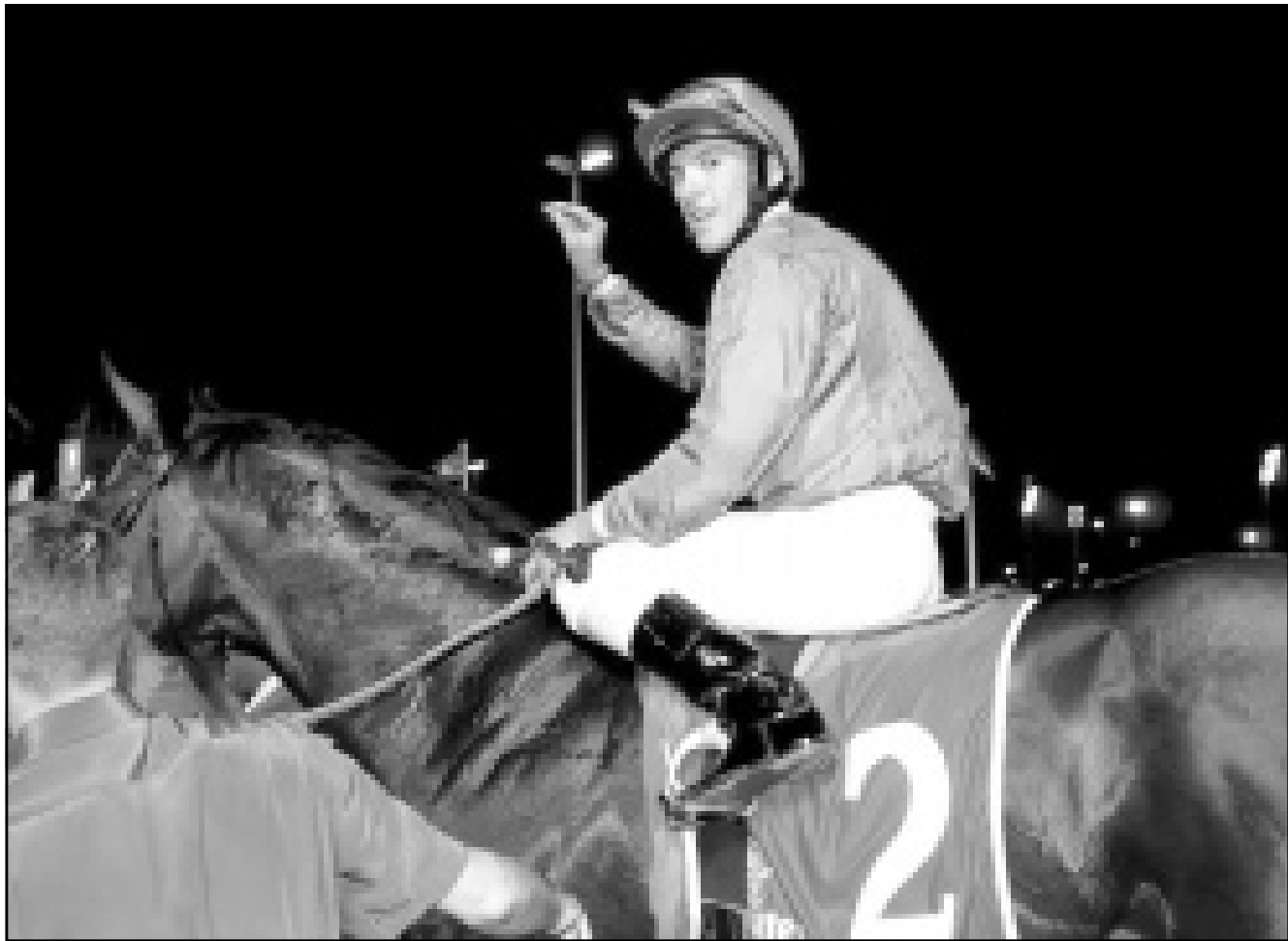
الفارس فرانكي ديتوري الفائز بالسباق

وقال الشيخ محمد معربا عن سعادته بفوز جواده ان الجواد حقق فوزا كبيرا وان المجال اصبح مفتوحا امامه للمشاركة في سباقات مثل سباق دربي كنتاكي.