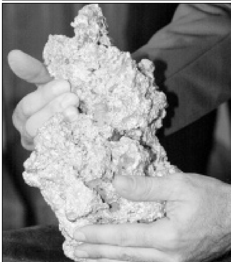
ثاني أكبر كتلة من الذهب الخالص تكتشف في العالم لدى عرضها امس الأحد في بيرث باستراليا