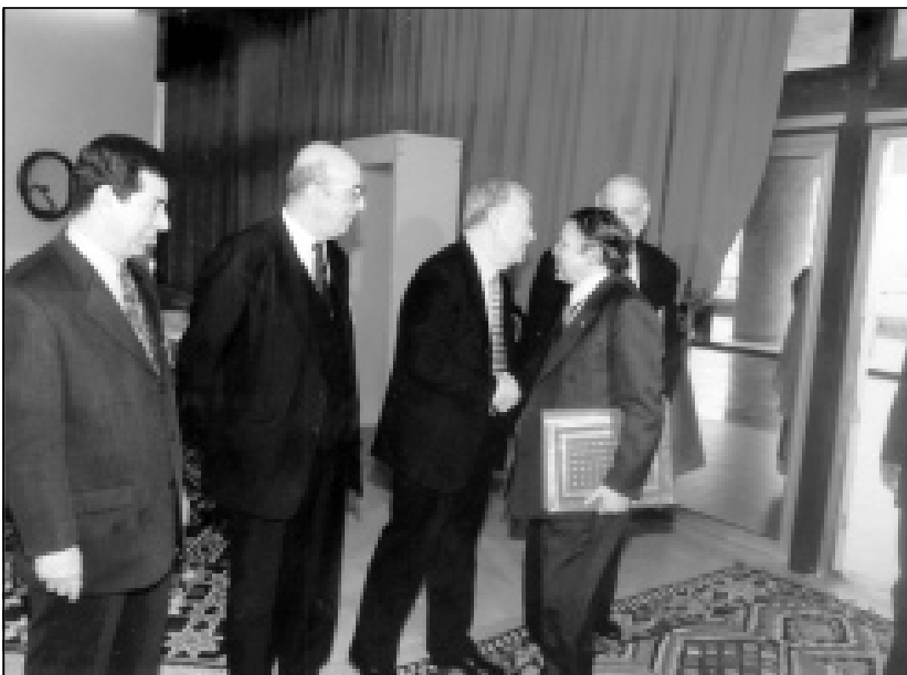
الدكتور خير الدين حسبيب يعانق الرئيس بوقليلة الذي لقي كلمة في ختام المؤتمر