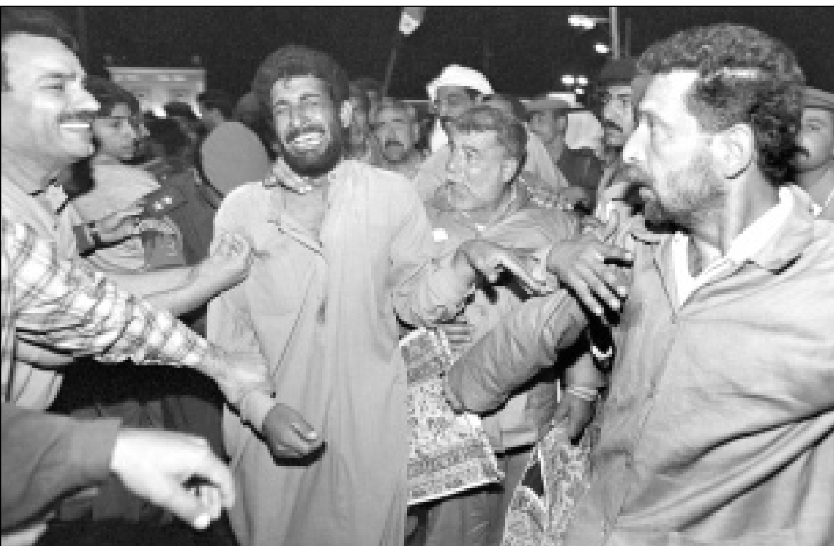
اسرى عراقيون واقاربهم في مركز على الحدود العراقية الإيرانية بعد سنوات طويلة من الغياب

واضاف «نحن نطبق شريعة يؤمن بها الف ومثا مليون نسمة على وجه الارض... لذلك هي حملة ظالة والمملكة طالما ان شعبنا مقتنع بهذه المسيرة لا علينا من قول الآخرين».