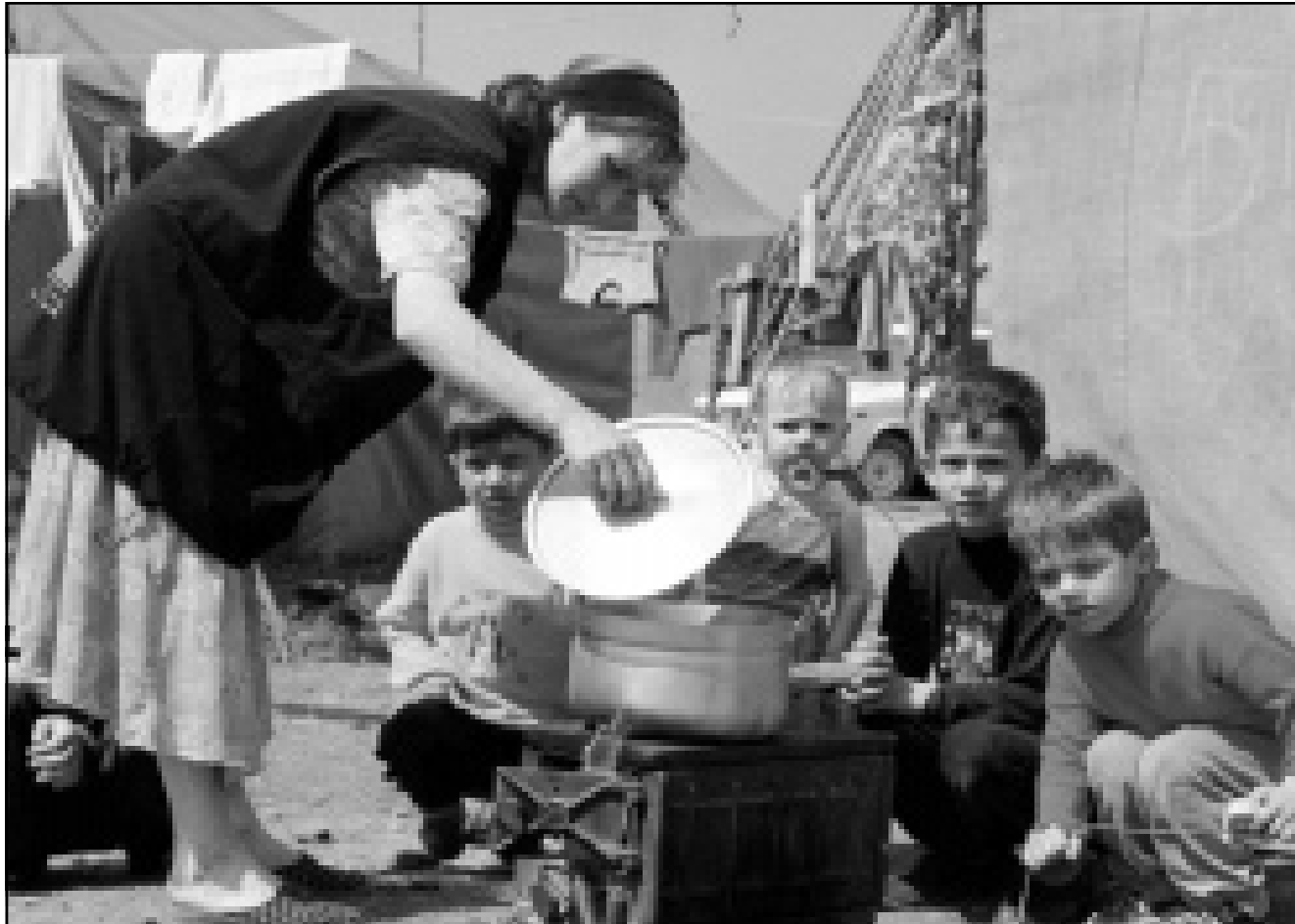
سيدة شيشانية تحضر الطعام لأطفالها في مخيم سيوتنيك للاجئين في انغوشيا

■ موسكو - برلين - رويترز - اف ب: واصلت روسيا قصف المقاتلين في جبال الشيشان، ونددت في الوقت نفسه بالتوبيخات التي وجهتها لها مجلس أوروبا.