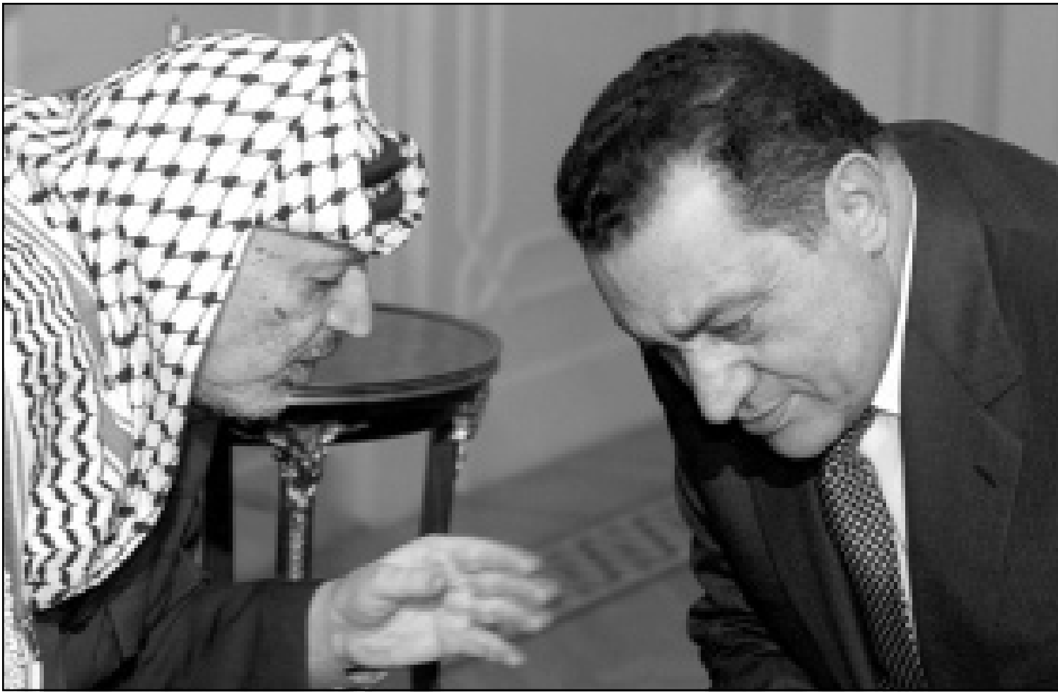
الرئيس المصري حسني مبارك يستمع إلى الرئيس الفلسطيني ياسر عرفات لدى اجتماعهما أمس في القاهرة