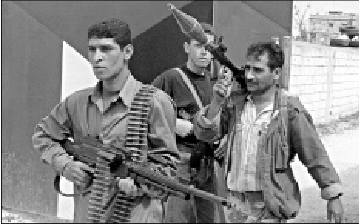
مقاتلون فلسطينيون يحملون اسلحتهم في مخيم عين الحلوة في لبنان (ا ف ب)

صاروخ كاتيوشا في قريتها الواقعة على الحدود اللبنانية- الاسرائيلية. كقصفت مدفعيتنا المواقع الاسرائيلية على الحدود في بركة ريشا ونقاط العبور في الرميث والدواوير. وأكد حزب الله انه سيواصل الدفاع عن المدنيين في كل مرة يتعرضون فيها للعوان». واثام مصدر عسكري اسرائيلي «ان صواريخ كاتيوشا سقطت في شمال اسرائيل عند الحدود مع لبنان، ولم تسفر عن سقوط ضحايا». واعلن جيش لبنان الجنوبي التابع لاسرائيل ان طفلة لبنانية اصيبت بجروح لدى انفجار