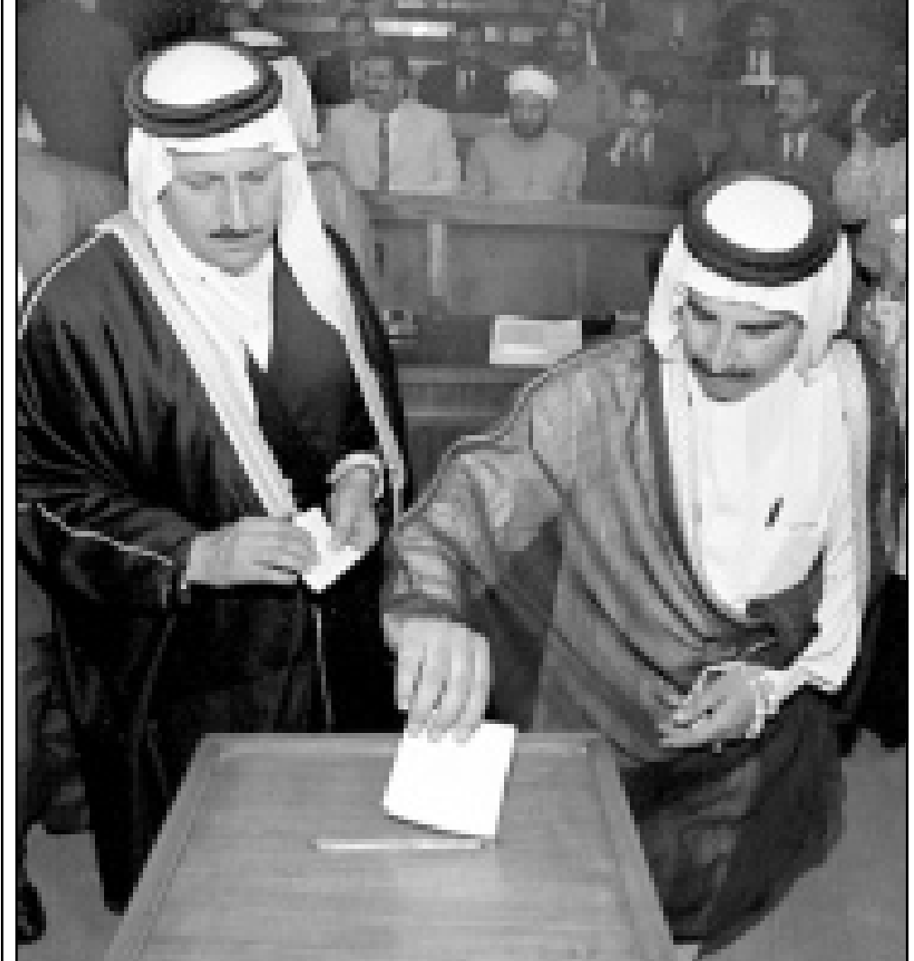
نائبان عراقيان بصوتاً في الانتخابات الداخلية لاختيار رئيس البرلمان