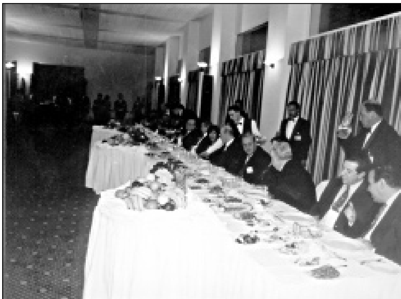
لقطة من الاجتماع