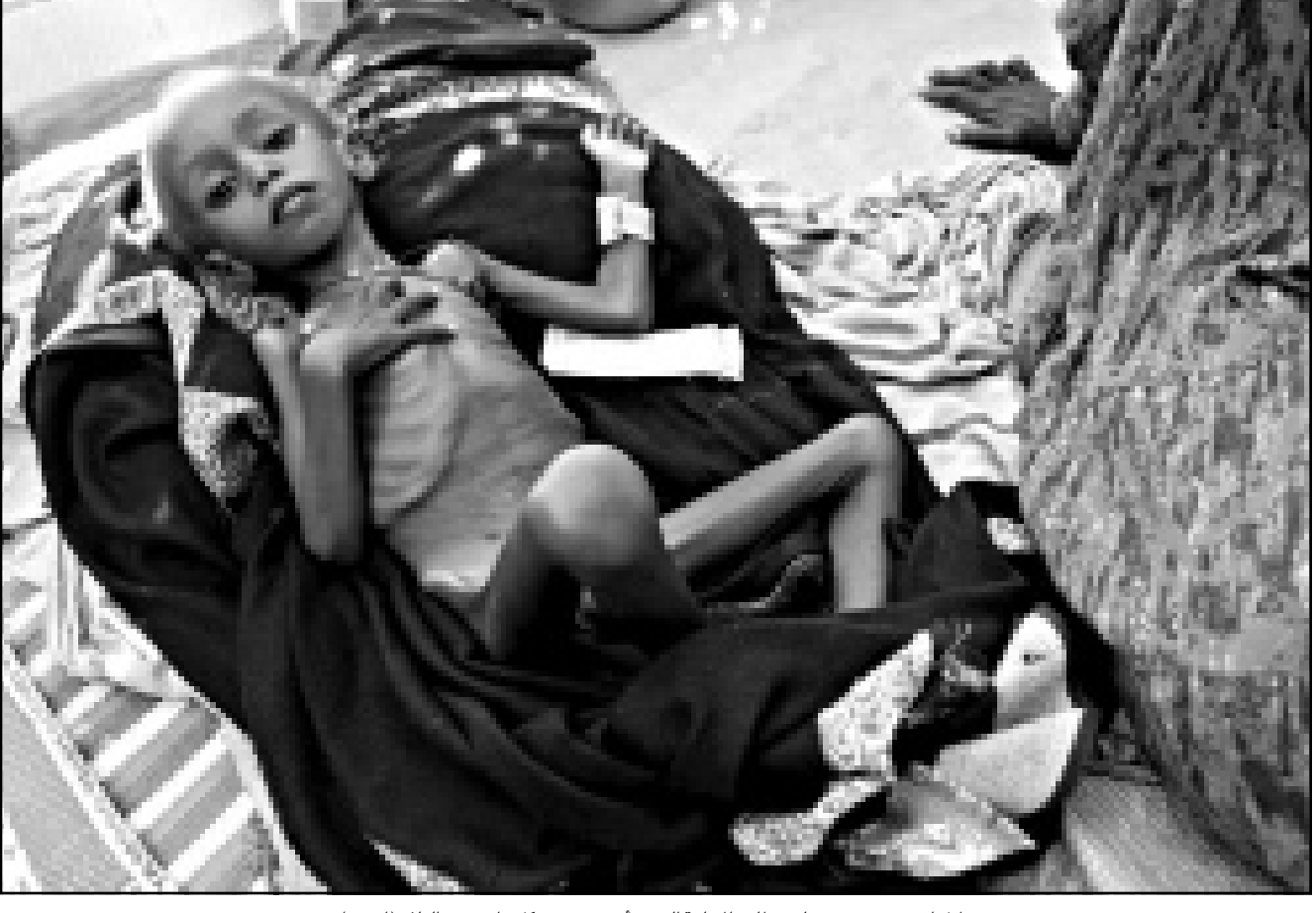
طفل اثيوبي وقد بدت عليه مظاهر الجاعة التي بدأت تنتشر بشكل واسع في البلاد