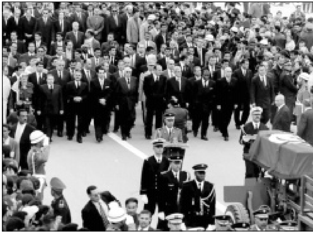
رؤساء يسيرون خلف جثمان الرئيس بورقيبة. ويبدو الحبيب بورقيبة الابن متوسطا جاك شيرك والرئيس بن علي (ف ب)

■ بغداد - تونس - وكالات: ذكرت وكالة الأنباء العراقية ان نائب رئيس الجمهورية العراقي طه ياسين رمضان غادر بغداد امس الأحد متوجها الى تونس ممثلا عن الرئيس العراقي صدام حسين لتقديم التعازي في وفاة الرئيس التونسي السابق الحبيب بورقيبة الذي توفي الخميس. ونقلت الوكالة عن رمضان قوله انه «سيقدم تعازي الرئيس العراقي صدام حسين وحكومة وشعب العراق الى الرئيس التونسي زين العابدين بن علي بوفاة المرحوم الحبيب بورقيبة». وكان نحو 30 شخصية اجنبية من بينها الرئيس الفرنسي جاك شيرك والرئيس الجزائري عبد العزيز بوتفليقة واليمني علي عبد الله صالح شاركت في تشييع الحبيب بورقيبة الذي ووري الثرى يوم السبت في المنستير (وسط شرق). وخرج الاف التونسيين الى تونس العاصمة والمنستير للاقاء نظرة اخيرة على جثمان الفقيد، ولحضور مراسم التشييع عن بعد، وسط اجراءات أمنية مشددة، ولوحظ حضور مكثف للنساء والفتيات، بعضهم لا يذكرن عهد بورقيبة جيدا، لكنهن يعرفن انه «محرر نساء تونس». وضريح بورقيبة الذي توفي عن عمر يناهز 97 عاما واسع شديد قبل اكثر من 20 عاما، وهو مطعم بالرخام الاسباني والايطالي، وللضريح باب برونزي ضخم نقش عليه «الجناح الأكبر محرر النساء ومؤسس تونس الحديثة».