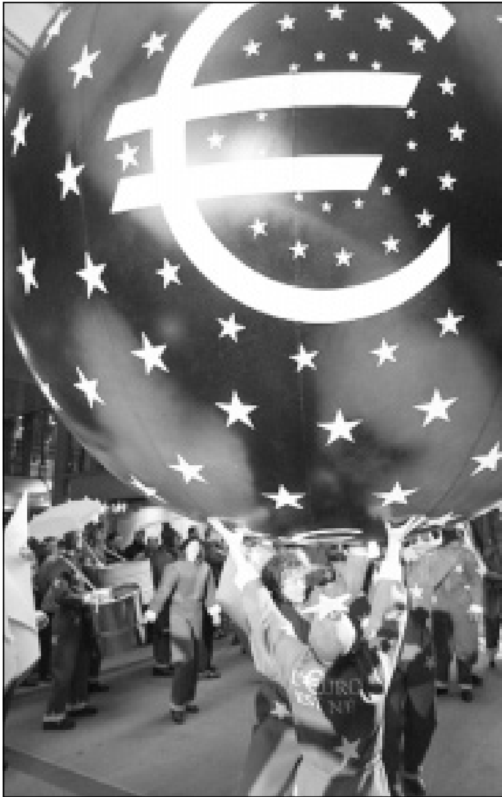
من المظاهر الاحتفالية التي راقت اطلاق اليورو في مطلع 1999