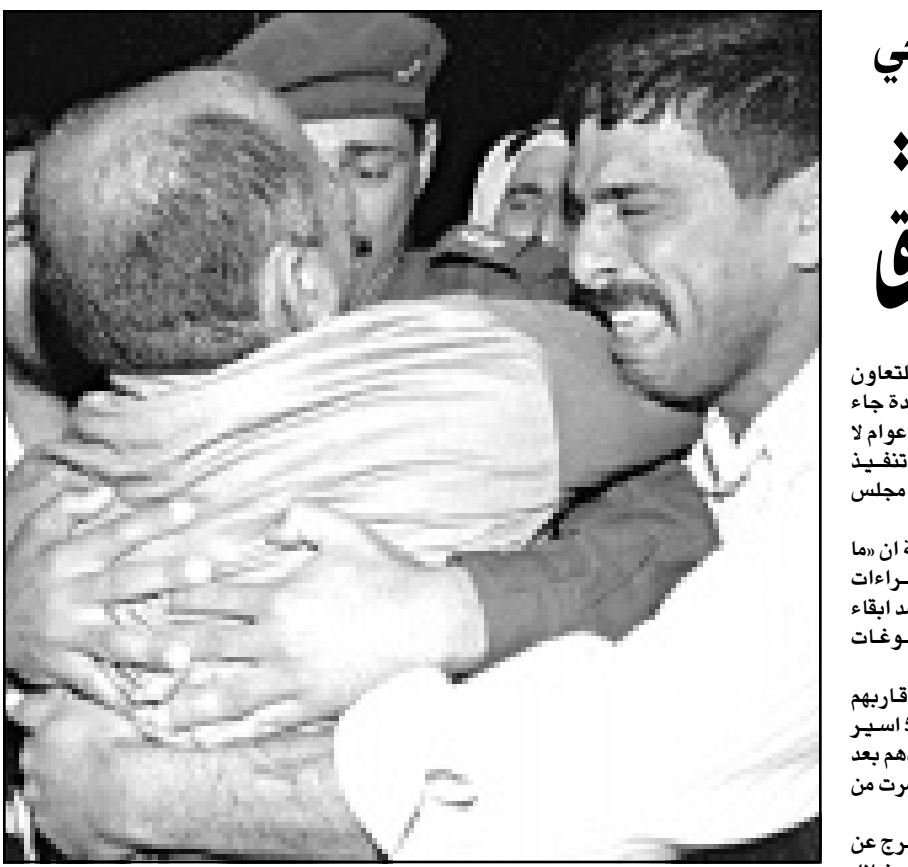
اسرى عراقيون يحتضنون اقاربهم اثر عودتهم من ايران بعد ان قضاوا 12 عاماً في السجون هناك

واضاف البيان «ردا على استهداف العدو الاسرائيلي لمخيماتنا في بركة ريشا ونقاط العبور في الرميث والدواوير. وأكد حزب الله انه سيواصل الدفاع عن المدنيين في كل مرة يتعرضون فيها للعوان». واثام مصدر عسكري اسرائيلي «ان صواريخ كاتيوشا سقطت في شمال اسرائيل عند الحدود مع لبنان، ولم تسفر عن سقوط ضحايا». واعلن جيش لبنان الجنوبي التابع لاسرائيل ان طفلة لبنانية اصيبت بجروح لدى انفجار