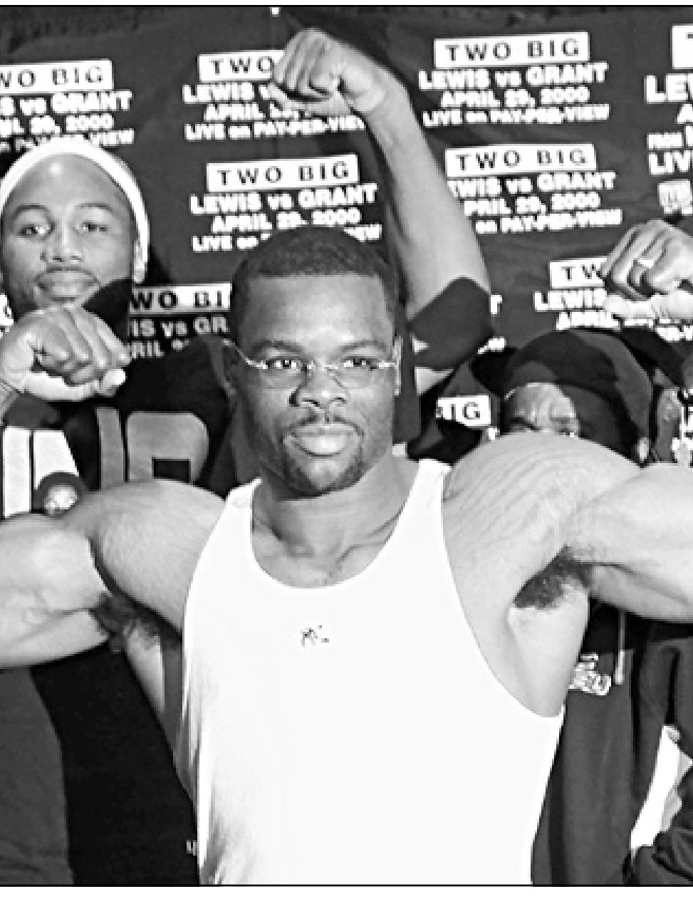
الملك الأمريكي للوزن الثقيل مايكل جرانت يستعد للالقاء بطل العالم لينوكس لويس في ماديسون سكواير غاردنز (نيويورك) السبت (أ ف ب)

■ جنيف - رويترز: برأ الاتحاد الاوروبي لكرة القدم هاري كيويول مهاجم ليدز يونايثد الانكليزي من اتهامه بضغط بدمه على جورج بوييسكو لاعب غلطة سراي التركي في مباراة العودة بالفوز قبل النهائي لكأس الاتحاد الاوروبي الماضي. لكن الاتحاد قال الجمعة ان البطاقة الحمراء التي حصل عليها الاسترالي كيويول بعد اشتباكه في الشوط الاول مع بوييسكو ستظل عقوبتها سارية. ومن ناحية اخرى قال الاتحاد انه لن يعاقب ليدز يونايثد بعد ضايقة خافان شكور لاعب غلطة سراي بقطعة عملة معدنية القيت عليه من الجماهير. وانتهت مباراة العودة التي اقيمت باستان ليدز بالتعادل 2/2 ليفوز الفريق التركي في مجموع المباراتين 2/4 ويصعد الى المباراة النهائية التي يلتقي فيها مع ارسنال الانكليزي.