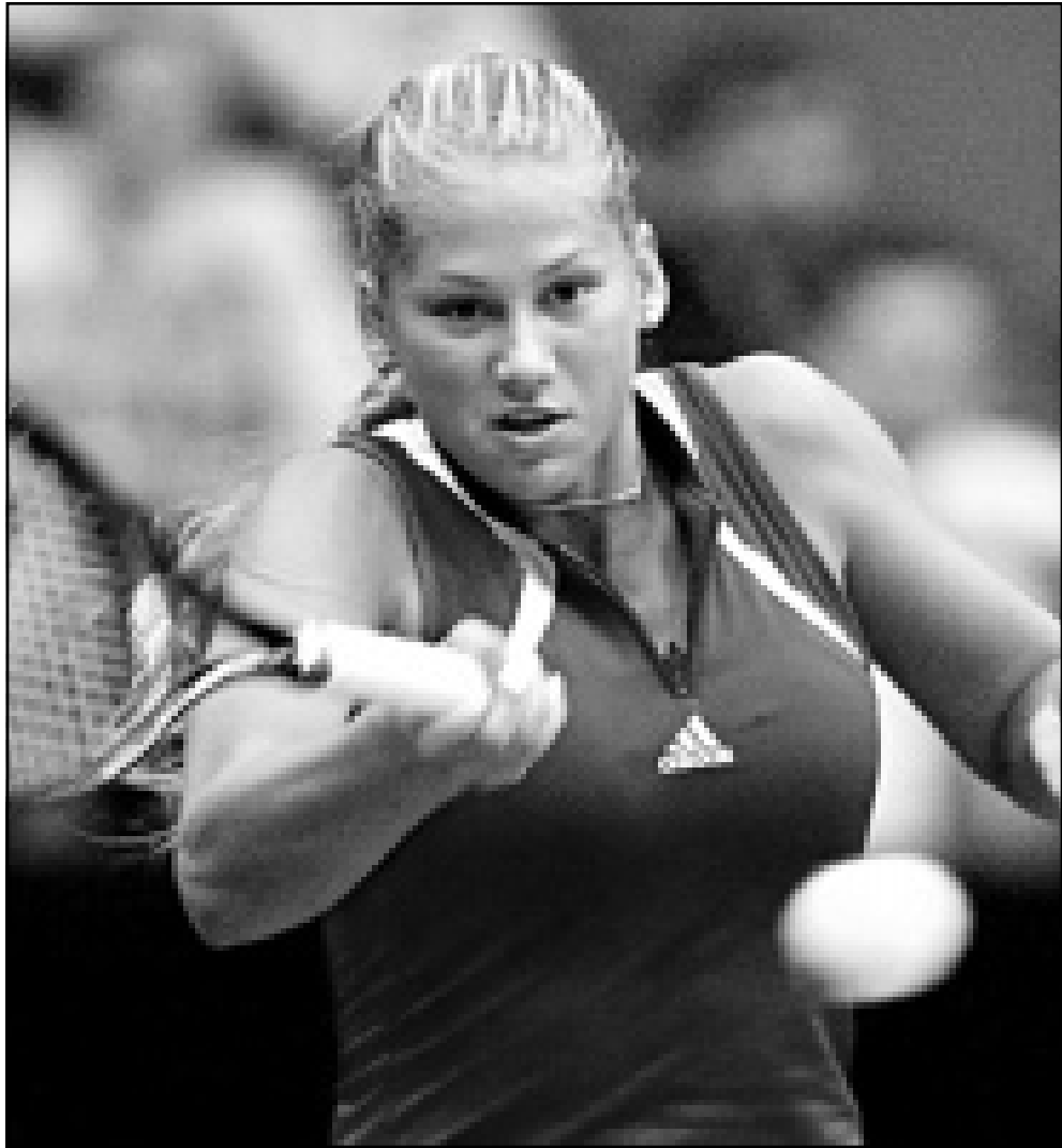
اللاعبة الروسية انا كورنيكوفا