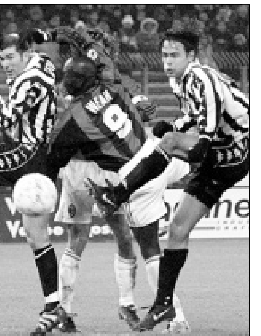
لقطة من إحدى مباريات يوفنتوس الايطالي ويظهر في الصورة زين الدين زيدان

■ نيقوسيا - أ ف ب: تستأثر مباراة سلتا فيغو الثاني عشر ودييورتيفو كورونا المتصدر بالاضواء ضمن المرحلة الخامسة والثلاثين من بطولة اسبانيا الاحد. ويتوجب على دييورتيفو كورونا الفوز للاحتفاظ بفارق النقاط الخمس التي تفصله عن برشلونة حامل اللقب، وبالتالي باماله في احراز لقب الدوري للمرة الاولى في تاريخه. ويملك دييورتيفو كورونا 64 نقطة مقابل 59 لبرشلونة قبل اربع مراحل من نهاية الدوري. ويقول لاعب برشلونة الدولي الهولندي رونالد دي بوير: «أذا فاز دييورتيفو على سلتا فيغو فسان كل شيء سينتهي، اما في حال خسارته، فيسكون هناك كلام آخر». ويحل برشلونة ضيفا على اتلتيكو مدريد السبت في مباراة صعبة خصوصا ان اصحاب الارض يسعون الى الخروج من المركز الاخير وقفاي النزول الى الدرجة الثانية. وكانت اخر رحلة لبرشلونة الى ملعب «فيستني كالدريون» غير موفقة لانه مني بخسارة مثله صفر-3 ضمن نهاب الدور نصف النهائي لمباراة كأس اسبانيا. وتبدو الفرصة مواتية امام سرقسطة الثالث (58) لانتزاع المركز الثاني من برشلونة في حال