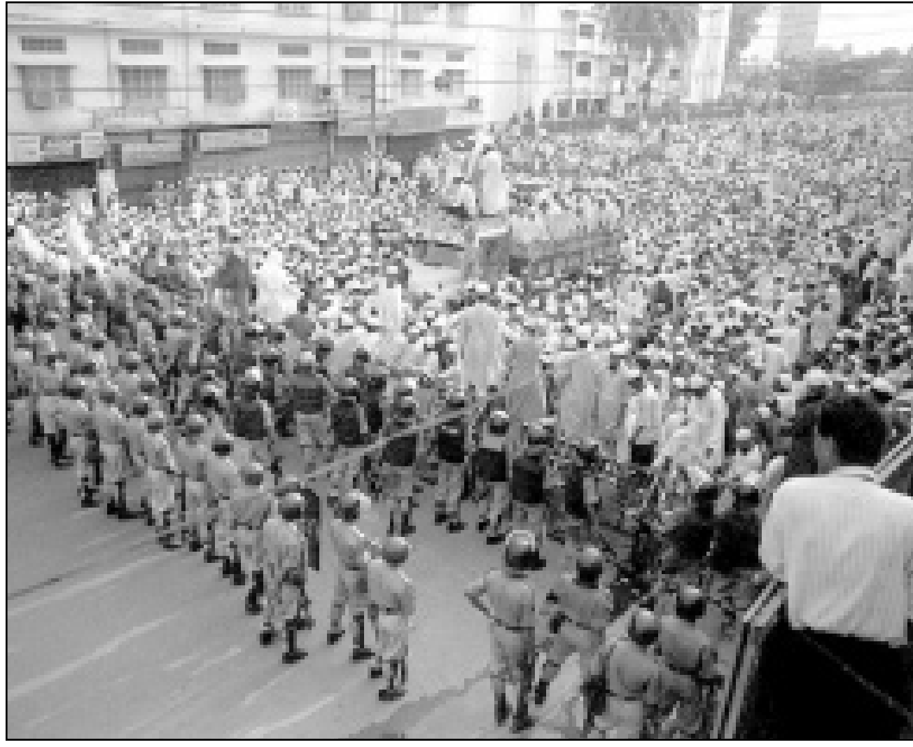
شرطة التدخل البنغالية تصد مسيرة قام بها اسلاميون الجمعة في العاصمة دكار تضامناً مع امام محلي يخوض صراعاً مع امام ينافسه بنفس المدينة