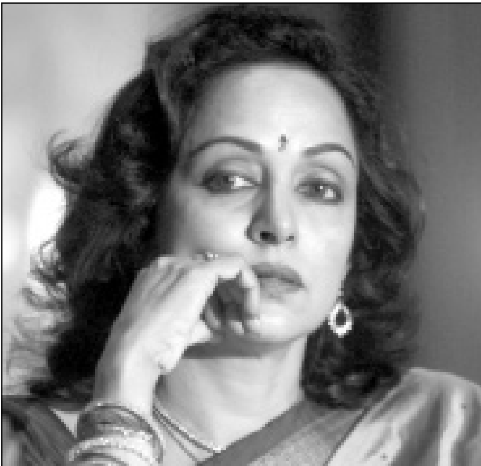
النجمة الهندية الشهيرة هيماماليني أسست متوقفاً على شبكة الانترنت لتقديم نصائح للنساء حول الموضة والتجميل وتربية الأطفال

وقال مسؤول محلي أنه تم انتشال 31 جثة، صباح الجمعة، متوقفاً ارتفاع حصيلة الحوادث.