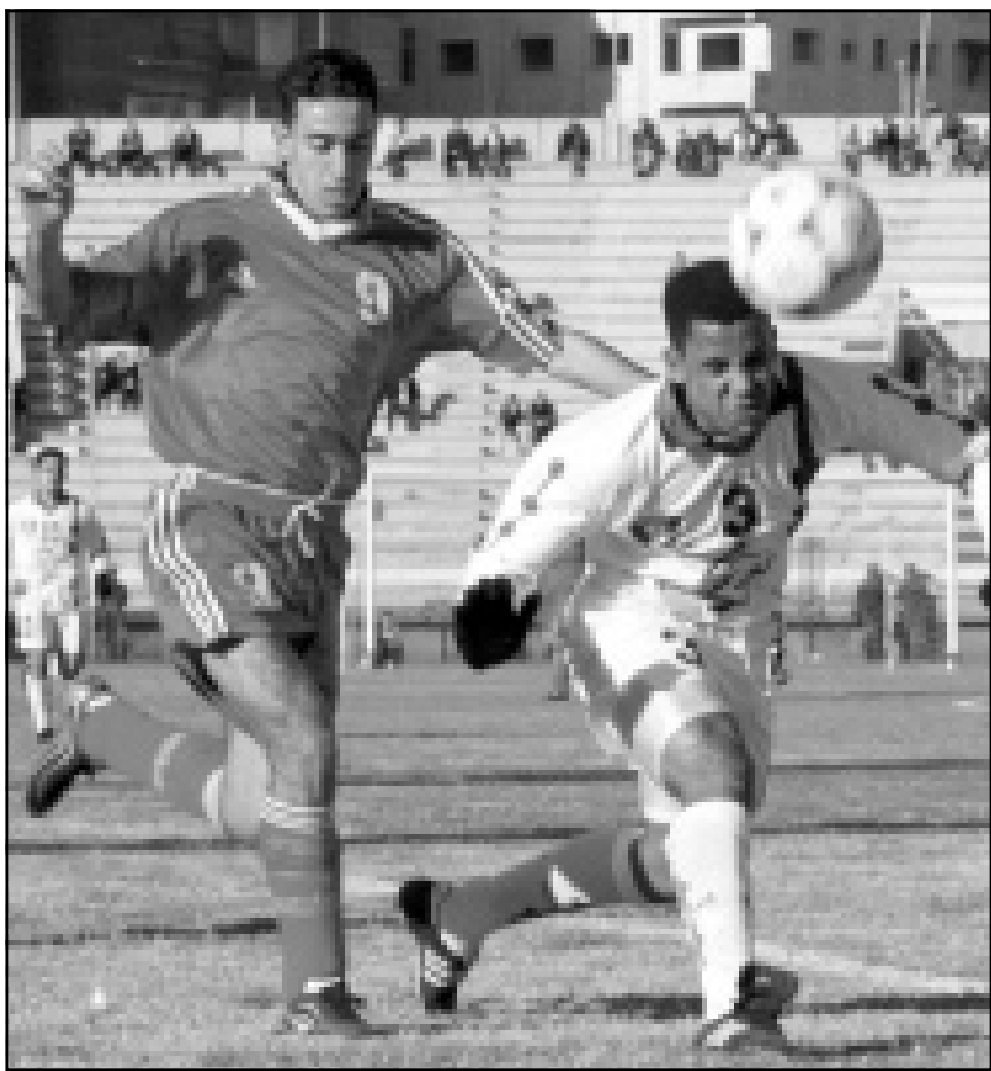
فريق الاتحاد السعودي في إحدى مبارياته (صورة من الأرشيف)