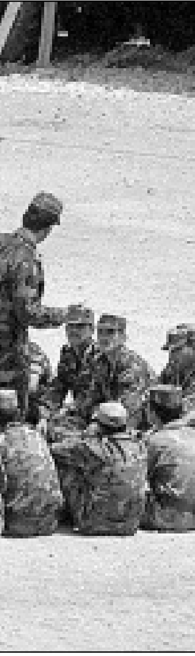
ضابط سوري يشرح للجنود السوريين في بيروت كيفية استخدام صاروخ مضاد للدبابات يوجه سلكيا الجمعة