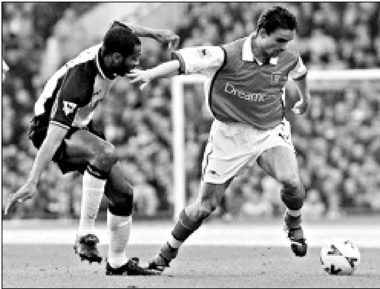
مارك اوفرماس لاعب ارسنال (الى اليمين) ينفذ بالكرة

لندن - اف ب: اعلن مدرب ليدز يونايتد ديفيد اوليري عن رغبته في التعاقد مع مهاجم منتخب ايران وسبق لدائي (189 م و 86 كلغ) المولود في 21 اذار/مارس عام 1969 في اربيل، ان لعب في صفوف اندية استقلال اربيل و تاكسيبراني وتجدات وبيروزي الايرانية والسد القطري وارمينيا بيلغيدك وبايرن ميونخ الالمانية. وقد توج بطلا لايران مرتين مع بيروزي عامي 1994 و 95 واحرز كأس ايران مرتين عامي 94 و 95، ايضا، وطلا لمانيا مع بايرن ميونخ عام 1999.