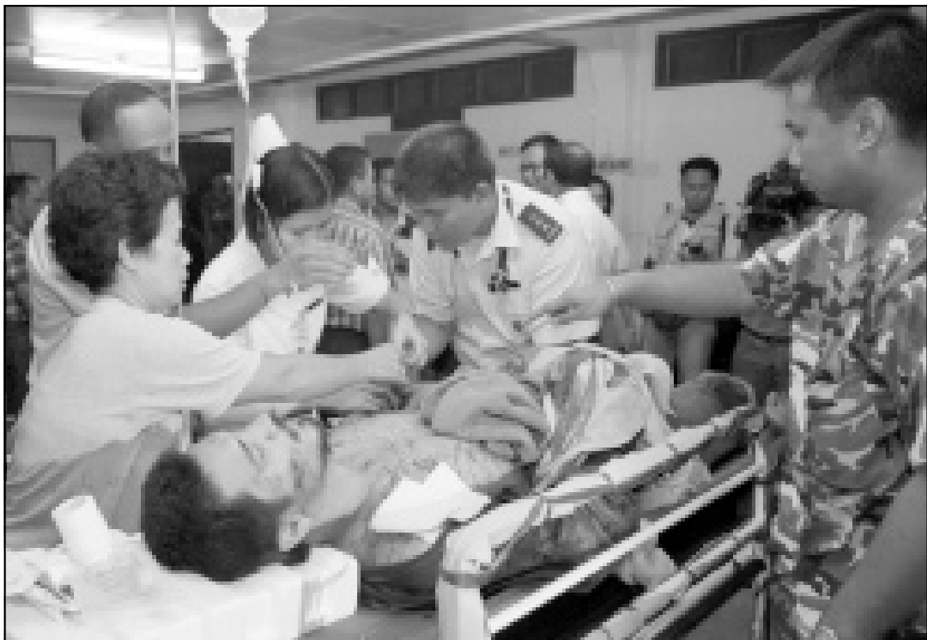
اطباء فلبينيون يعالجون احد الرهائن المصابين

التمزامة تقريبا هزت وسط مدينة جنرال سانتوس التي تقطنها اقلية مسيحية والواقعة على بعد 200 كيلومتر جنوب كوتاباتو. واكدوا تقارير شهود عيان بمقتل اربعة افراد واصابة نحو 30 آخرين. وذكرت محطة اذاعية في وقت سابق ان 15 فردا قتلوا.