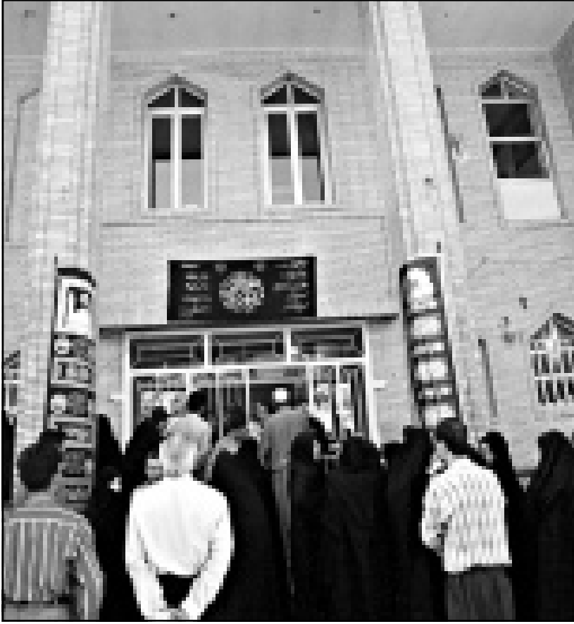
مبنى المحكمة الثورية في شيراز