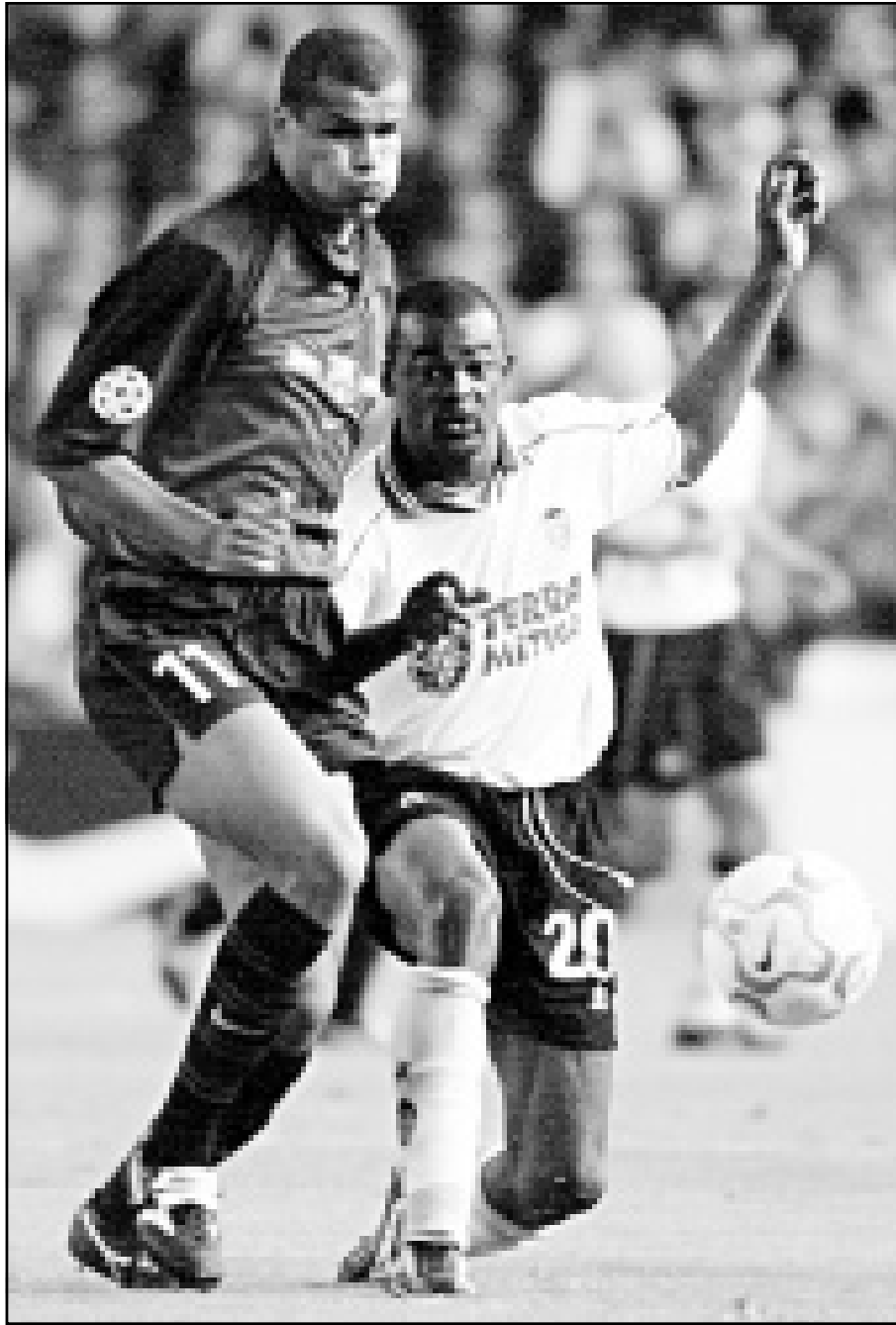
ديغالدو لاعب برشلونة (الى اليسار) يحاول الفوز بالكرة