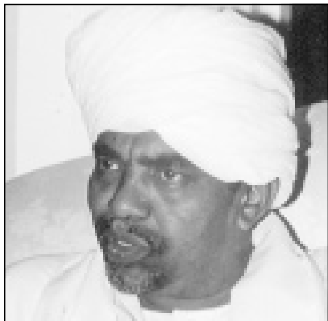
الرئيس عمر البشير

الخرطوم - «القدس العربي» - من كمال حسن بخيت: