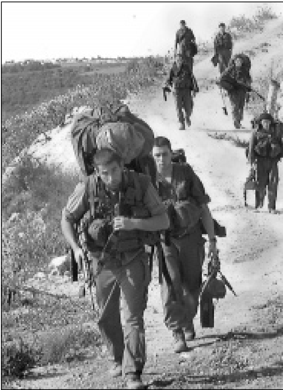
تدريبات عسكرية لجنود الاحتلال الاسرائيلي قرب الحدود مع لبنان