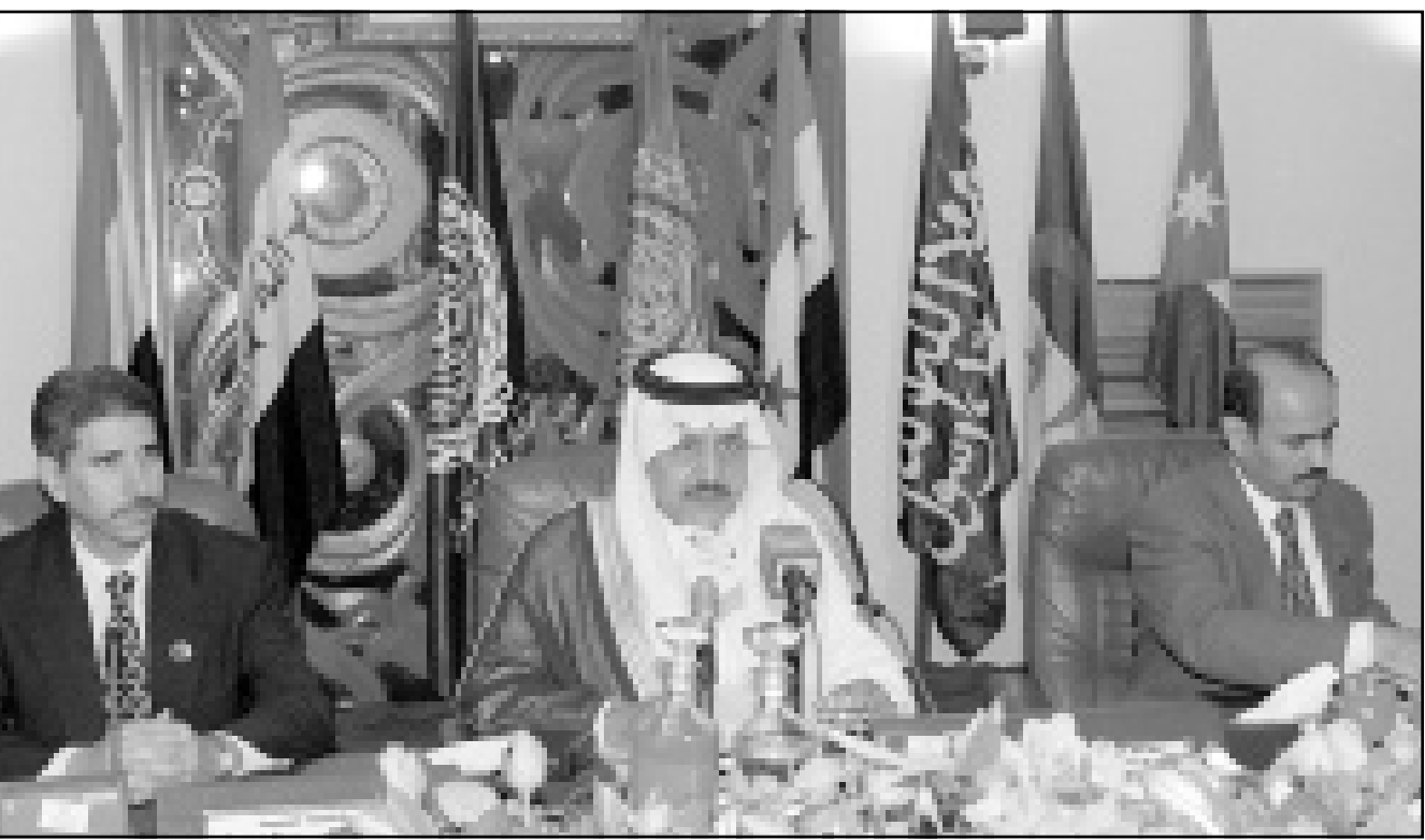
وزير الداخلية السعودي الامير نايف بن عبد العزيز يتوسط امين عام مجلس وزراء الداخلية والعدل العرب الدكتور احمد بن سالم (الى اليمين) ووزير العدل العراقي الدكتور شبيب المالكي اثناء افتتاح اجتماع المجلس في تونس امس