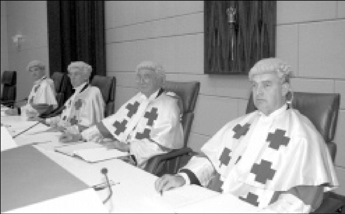
القضاة الاسكتلنديون في الجلسة الافتتاحية من المحاكمة