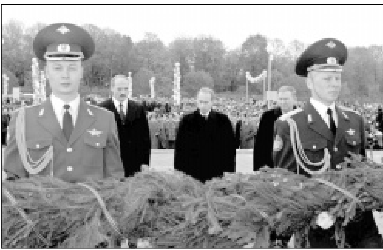
بوتين يتوسط رئيس بيلوروسيا الكسندر لوكاشنكو (يسار) والاوكراني ليوينيد كوشما اثناء مراسم وضع ورود على نصب تذكاري في مدينة بروخروفكا جنوب موسكو

موسكو - اف ب: نقلت وكالة انترفاكس عن نائب رئيس الوزراء الروسي ميخائيل كاسيانوف قوله ان الاتصال بين الحكومة الروسية الجديدة ستشكل قبل نهاية الشهر الجاري (مايو الحالي). وقال كاسيانوف الذي يريج توليه رئاسة الوزراء ان «جميع الشروط متوفرة لذلك». وأوضح كاسيانوف ان الرئيس فلاديمير بوتين الذي سيؤدي اليمين الدستورية الاحد المقبل سيواصل مشاورته المكثفة بهدف تشكيل الفريق الحكومي الجديد. ويمارس كاسيانوف عمليا دور رئيس الوزراء منذ انتخاب بوتين رئيسا في 26 اذار (مارس). وقال للصحافيين «هناك اقتراحات عديدة حول تشكيل