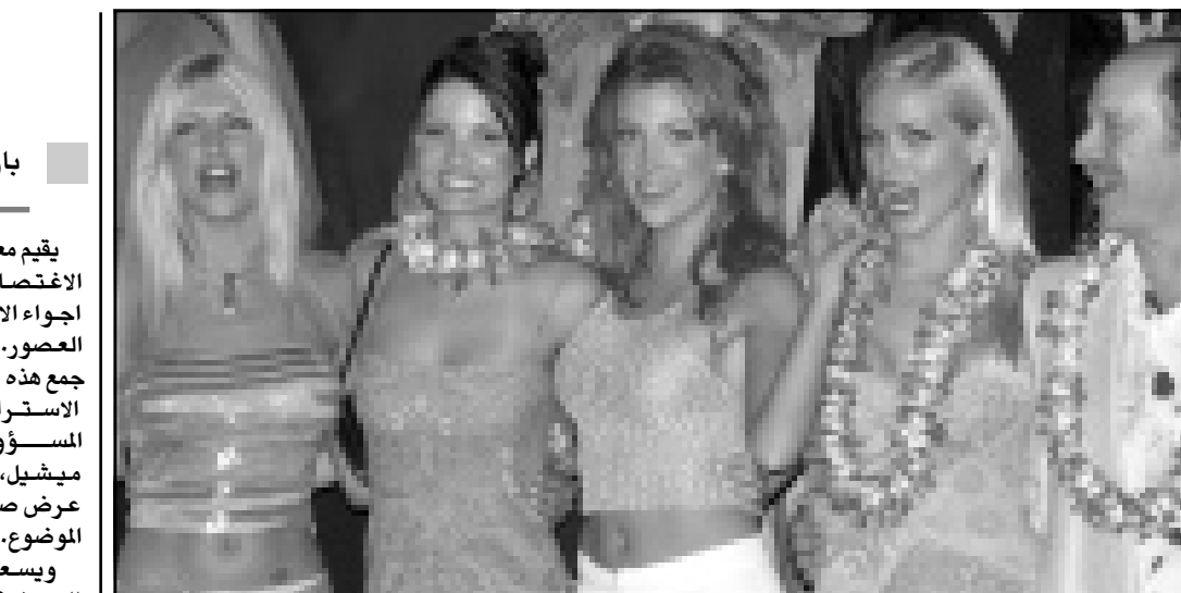
نجمات المسلسل التلفزيوني الأمريكي الشهير «باي- انش» - مراقبة الخليج - في صور تجمعهن خلال احتفال بمناسبة مرور 10 سنوات على انطلاقه، اقيم في سانت مونيكا

باريس - «القدس العربي»: يقدم معرض اللوفر متحفا غريبا من نوعه تحت عنوان «فن الاغتصاب»، وهو عبارة عن تخطيطات ورسومات تنقل اجواء الاغتصاب الجنسي كما صورده الفنانون عبر العصور، والمعرض بأكمله انضم تحت مفهوم كبير جمع هذه التخطيطات والرسومات وهو: «الامتلاك والتدمير- الاستراتيجيات الجنسية في الفن الغربي»، المسؤول عن هذا المعرض في متحف اللوفر هو ريجيس ميشيل، والذي لا يمتلك سوى تحقيق طموح واحد، وهو عرض صور يسعى من خلالها تغيير نظرتنا حول هذا الموضوع. ويسعى المعرض لا الى تحقيق نوع من الايروسية ولا بورونوغرافية بل لتقديم الجنس باعتباره مسرحا للاوعي.. ويؤكد المسؤول عن هذا المعرض: ان الفن الغربي لا