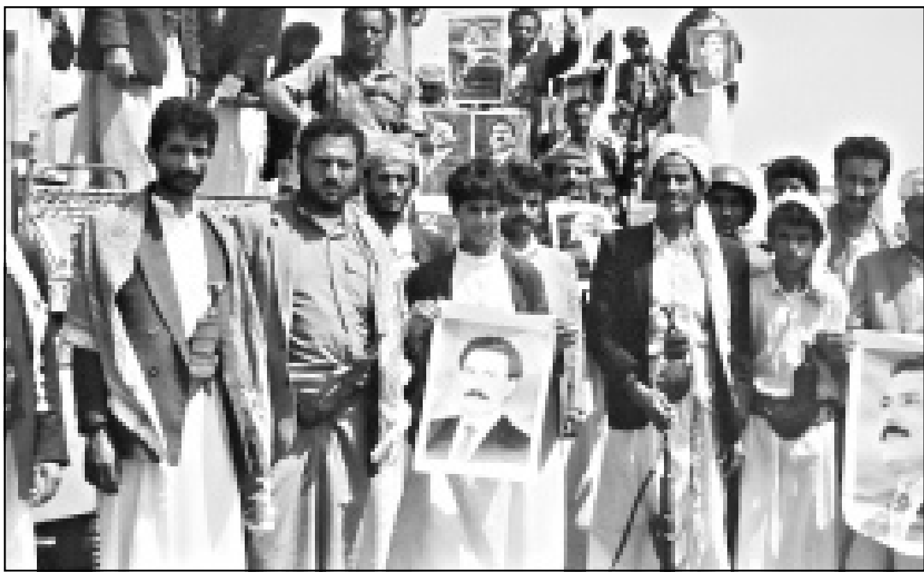
يمتدحون برفق صوراً للرئيس علي عبد الله صالح أثناء احتفالات بعيد الوحدة

ويعتقد بعض المراقبين أنه في إطار هذا الحملة الأمنية تم عقد هدنة مع الخاطفين لإيقاف عملياتهم (الاختطافية) خلال فترة الاحتفالات حتى لا يشغل العالم بعملية الاختطاف عن فرحة الاحتفالات بعيد الوحدة اليمنية. وذكرت صحيفة يمنية أن مهربي الخمر إلى المدن الرئيسية وبالذات إلى العاصمة صنعاء تضرروا كثيراً من هذه الإجراءات الأمنية المشددة وقالت أن صنعاء تعاني منذ أكثر من أسبوعين من شحة في بيع الخمر ما أدى إلى ارتفاع أسعارها وأن مدمني شربها ستكون فرحتهم بهذه المناسبة (غالية الثمن). وذكر مصدر رسمي لـ «القدس العربي» أن أكثر من 10 من الرؤساء والقادة العرب أكدوا حضورهم لهذه الاحتفالات وأن بقية الدول أكدت مشاركتها بوفود رفيعة المستوى بالإضافة إلى تأكيد حضور وفود من الدول الإسلامية وبعض الدول الأجنبية. وذكر أن جهود الاستعدادات لاستقبال هذا الاحتفال ولضيوفا الكبار حولت العاصمة والمدن اليمنية الرئيسية إلى ورش عمل كبرى امتصت معظم البطالة من العمالة الفاضلة والفنيين والمهنيين حيث خلت الشوارع الرئيسية منهم منذ أسابيع لانشغال أغلبهم بإعادة تأهيل الخدمات والجوانب الظاهرية للمدن من النظافة وإنارة الشوارع وطلاء المباني والمحلات التجارية ورصف الطرق وممرات العبور وإعادة تزيين المدن وغيرها. مؤكد أن هذه الجهود والتريبات الأمنية سوف تستمر إلى ما بعد هذه الاحتفالات حتى يستفاد من هذه التجربة لخلق مناخ دائم من الأمن والنظام والمظهر المتميز للمدن اليمنية وخلق نوع من