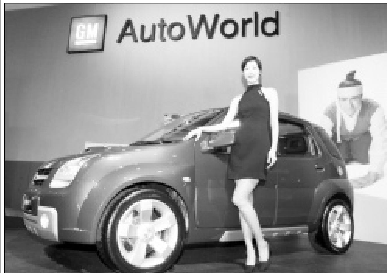
عارضة تقدم امس في معرض السيارات السنوية في العاصمة الكورية سول نموذجاً تجريبياً لسيارة شيفروليه (راي جي إم) التي تنتجها شركة جنرال موتورز والتي تدرس جدوا شراءها شركة دايو موتور الكورية المتعرة

لم يعودوا بحاجة لمراجعة السفارة الاسترالية وقصلياتها في الامارات لغرض الحصول على تأشيرة دخول. وتم الاعلان عن هذه الخدمة الجديدة خلال مؤتمر صحافي عقد امس على هامش المعرض. وتظهر احداث الاحصاءات ان المواطنين الاماراتيين يشكلون ثمانين في المئة من اجمالي السياح الذين يخرجون من دولة الامارات لزيارة استراليا، اما الباقيون فهم سفارو ترانزيت (مرور عابر). وكانت وزارة الخارجية الامريكية سمحت خلال الشهر الماضي لمكاتب السياحة والسفر في الامارات بقبول طلبات التأشيرة لدخول الولايات المتحدة بالنسبة لاماراتيين. يذكر ان شركة داناتا تأسست عام 1995 من قبل حكومة دبي لتقديم خدمات المناولة الارضية في مطار دبي الدولي. ويعمل بها حاليا اكثر من خمسة الاف موظف. وتدير داناتا حاليا مبنى الشيخ راشد في