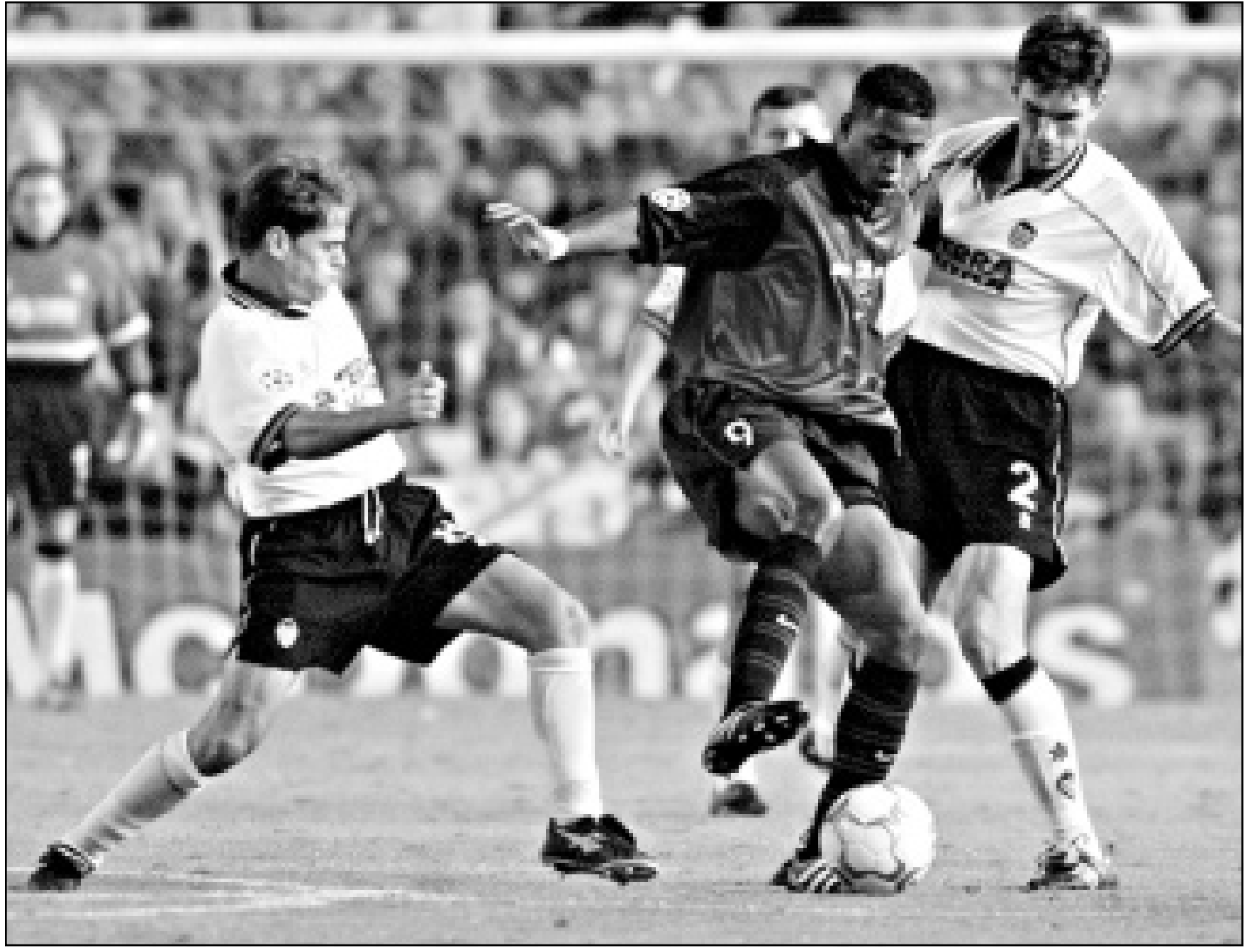
صراع الكرة بين لاعبي بلنسية ماروييسو بيرغرينو (الى اليمين) وخافيير فارينوس (الى اليسار) ولاعب برشلونة باتريك كليوفيرت (في الوسط) (رويترز)