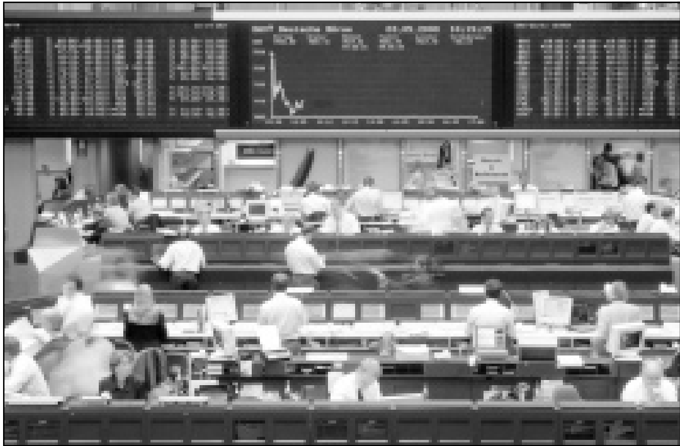
قاعة المعاملات في بورصة فرانكفوت

لندن - من جوناثان ستاندرنغ: انخفضت العملة الأوروبية الموحدة (اليورو) إلى مستوى قياسي جديد مقابل الدولار أمس الأربعاء فيما تخطت مؤشرات الاسهم في منطقة اليورو عن جزء كبير من مكاسب أمس الاول بعد تراجع الاسواق الامريكية. ونزل اليورو دون 0,90 دولار لأول مرة ليقفل نحو 23 بلانكة مع مستواه حين اطلق في كانون الثاني (يناير) عام 1999 فيما يراهن المستثمرون على ان اداء الاقتصاد الامريكي سيكون افضل من منطقة اليورو. وقادت اسهم التكنولوجيا